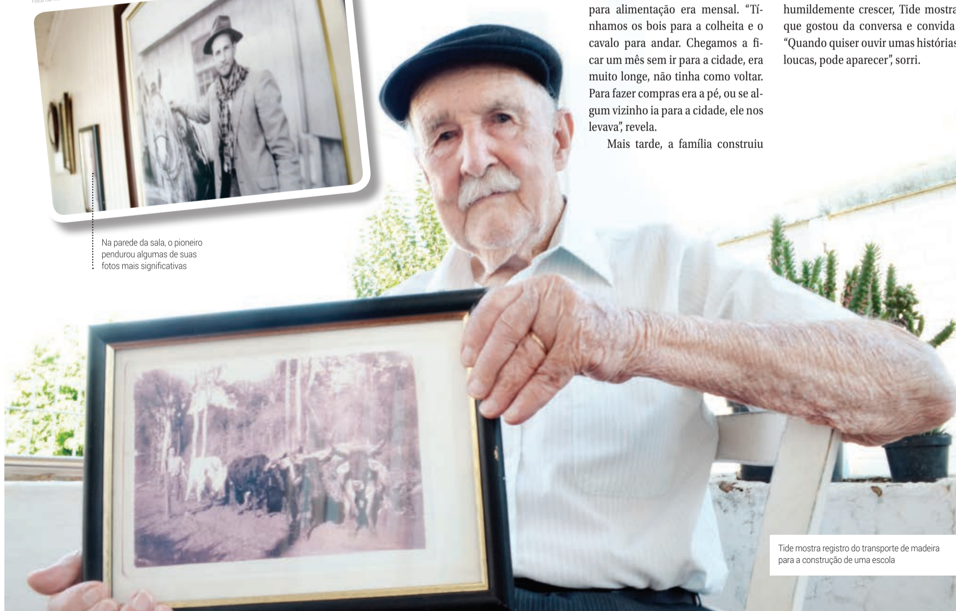
Tide mostra registro do transporte de madeira para a construção de uma escola