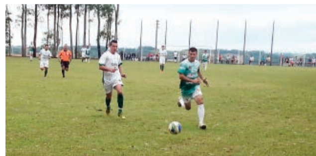
Pérola (de branco) goleou o Grêmio Guarujá por 4 a 1 e assumiu a liderança

1 no sub-18 e 4 a 1 no adulto. Na cidade de Itapiranga, pelo adulto, Cometa e Grêmio Tunense empataram sem gols. Em São João do Oeste, em uma partida com 8 gols, São José e Harmonia empataram em 4 a 4. Em Descanso, pelo adulto, Ouro Verde e Aliança de Paraíso empataram em 1 a 1. Já em São José do Cedro, pela categoria sub-18, o Ipiranga venceu o Guarani por 3 a 0 e, no adulto houve empate em 2 a 2.