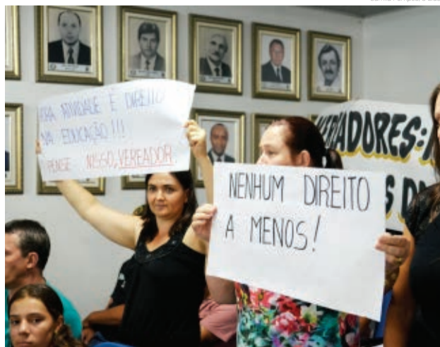
Professores fizeram apelo pela rejeição, mas projeto foi aprovado por maioria de votos