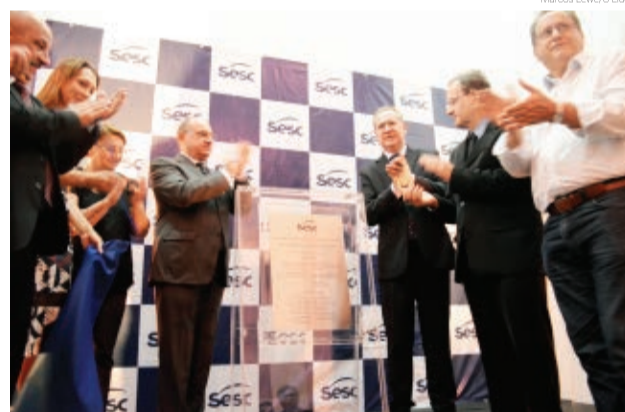
Solenidade contou com participação de lideranças locais e regionais

O Estúdio de Pilates, a Nutrição Clínica e a Escola de