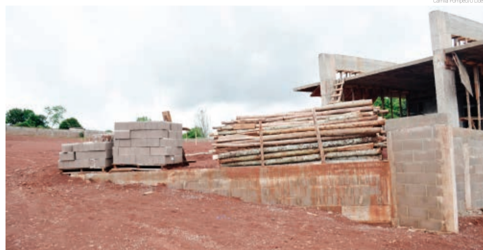
Cemitério é uma reivindicação antiga da comunidade