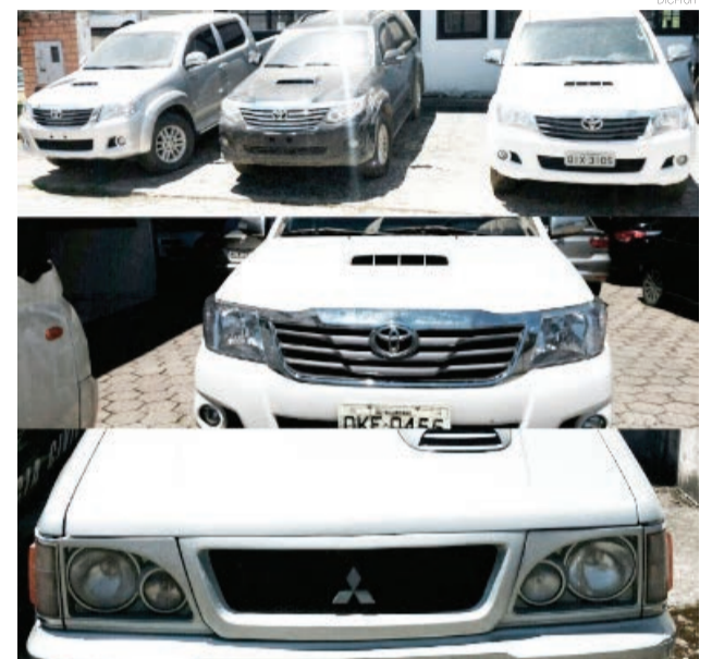
Segundo a investigação, o proprietário da empresa miguel-oestina havia encomendado 20 caminhonetes e já havia recebido sete

dado 20 caminhonetes e já havia recebido sete, as quais foram desmontadas na própria empresa. As peças estariam sendo comercializadas na cidade. A empresa permanece fechada até a análise das peças existentes no local. O mesmo empresário já havia sido preso na Operação Copacabana, desencadeada pela DIC de São Miguel do Oeste em julho de 2011. Na época, a operação desarticulou uma quadrilha especializada em fraudes contra seguradoras, receptação, sonegação fiscal e adulteração de veículos automotores.