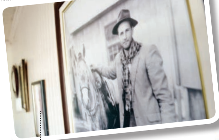
Na parede da sala, o pioneiro pendurou algumas de suas fotos mais significativas