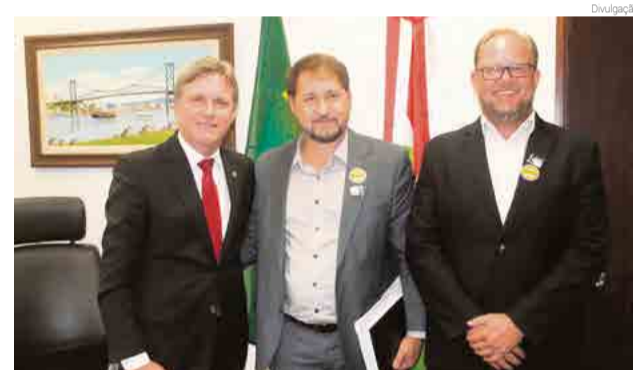
Lideranças visitaram o gabinete do senador Dário Berger

De acordo com Post, o modelo político no país precisa ser revisto. “É nos municípios que são gerados os impostos e, no entanto, é preciso se deslocar até Brasília para interceder por recursos. Por isso é importante buscar novas formas para otimizar tempo e dar um respaldo mais rápido à comunidade”, diz.