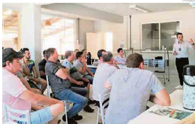
Principal objetivo do encontro foi reforçar alguns conhecimentos sobre o concreto

Segundo ele, o principal objetivo foi reforçar alguns conhecimentos sobre o concreto e alertar acerca das responsabilidades que envolvem uma empresa de serviços de concretagem.