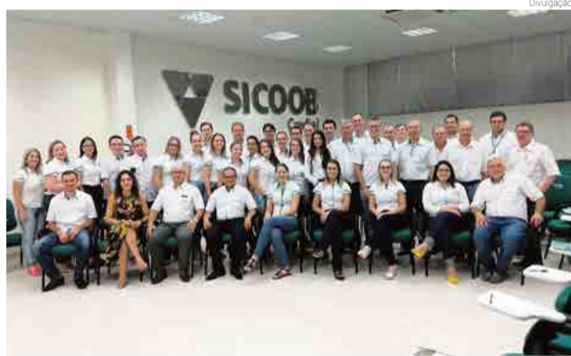
Colaboradores participam de especialização