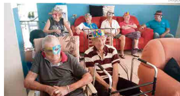
Festa teve a visita de familiares e amigos dos pacientes

Além de parentes, costumam visitar os idosos antigos vizinhos e amigos. “Essa data mensal é sempre de muita espera e felicidade entre eles. Nosso Carnaval então teve mais pessoas que o normal, já que abrangeamos o público”, afirma.