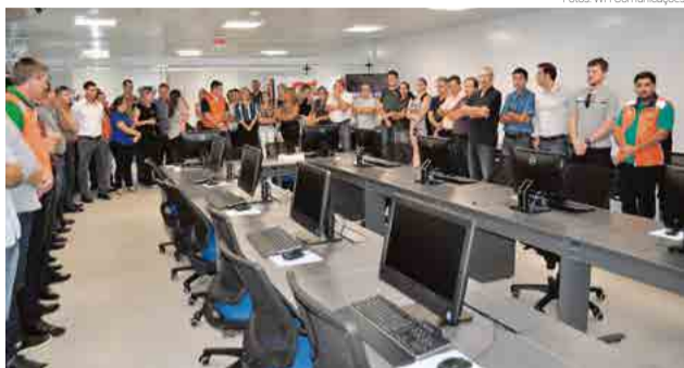
Lideranças regionais e estaduais marcaram presença no ato oficial

O Cigerd de São Miguel do Oeste vai atender os outros 18 municípios abrangidos pela Associação dos Municípios do Extremo-Oeste de Santa Catarina (Ameosc). Em Maravilha o Centro vai atender outros 16 municípios. Em entrevista à reportagem do Grupo WH Comunicações,