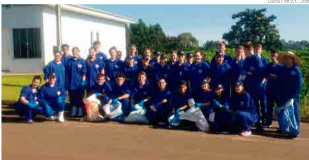
Ação foi desenvolvida por mais de 30 funcionários

Os 1.600 funcionários da Aurora Alimentos de Maravilha foram agraciados com palestra sobre a prevenção, doenças e epidemias ocasionadas pelo Aedes aegypti , mosquito transmissor da dengue, zika vírus, chikungunya e a febre amarela. A qualificação foi realizada pela equipe da sala de situação da prefeitura, que também mostrou aos coordenadores os cuidados com a limpeza em terrenos e ambientes internos.