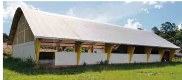
Quadra foi construída no Bairro Progresso, próximo ao batalhão da Polícia Militar

O governo municipal não detalhou o que deve ser feito nesta etapa, mas garantiu que são pequenas adequações na estrutura. Os custos desta vez serão bancados com recursos próprios do município. Durante a construção da quadra coberta foram usados apenas valores repassados pelo governo federal, de aproximadamente R$ 500 mil.