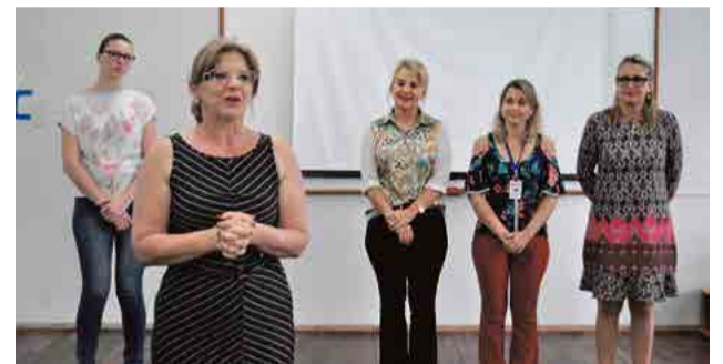
Lideranças prestigiaram a aula inaugural

No módulo 1, 36 novos alunos iniciaram sua trajetória e permanecem pelo período de um ano e seis meses tendo aulas semanais em diversas áreas de conhecimento, especialmente as mais usadas no dia a dia. A aula inaugural iniciou com fala de lideranças, representando o governo municipal de Maravilha e Tigrinhos, e da Unoesc, seguida de apresentações culturais. Em seguida cada turma foi para sua sala, acompanhados dos professores. Os alunos da 1ª fase