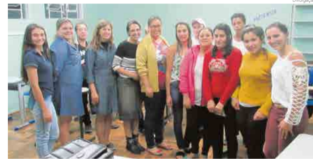
Equipe gestora divulgou os trabalhos realizados

O objetivo do encontro foi unir esforços para divulgar a Educação de Jovens e Adultos (Eja) no município e arredores. A equipe também conversou com os professores e alunos, esclarecendo dúvidas referentes à modalidade de ensino.