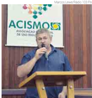
Moss assume o comando da entidade pela terceira vez

Os associados discutiram e julgaram o relatório e contas do Conselho Diretor e o parecer do Conselho Consultivo. Logo de-