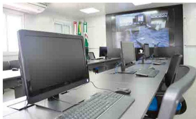
Em São Miguel do Oeste foram investidos cerca de R$ 850 mil

“Estamos fazendo o mapeamento de risco de todo o Estado, inclusive do Extremo-Oeste, fazendo com que os municípios se tornem seguros com as informações repassadas pela Defesa Civil, através dos canais de comunicação, e com a consciência do cidadão. São novas culturas que estamos implementando e o Centro Regional vai ser o multiplicador disso”, finaliza Moratelli.