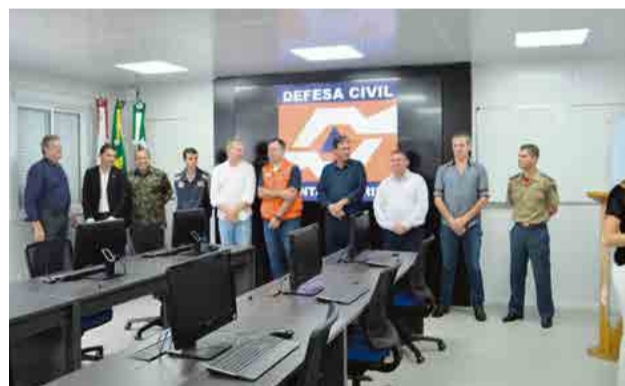
Espaço disponibiliza tecnologia para tomar decisões em momento de crise