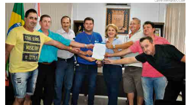
Ordem de serviço foi assinada no gabinete da prefeita