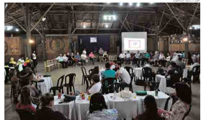
Patrocinadores foram agraciados com jantar e fandango na noite do lançamento

Após apresentações na campeira e artística, os melhores serão premiados com dinheiro e troféus.