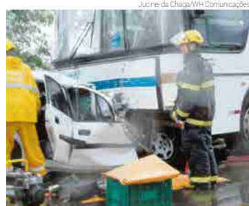
Motorista e um passageiro do ônibus sofreram ferimentos leves e foram socorridos

O motorista do Corsa Classic ficou preso às ferragens e morreu no local do acidente. Já o motorista e um passageiro do ônibus sofreram ferimentos leves e foram encaminhados para atendimento médico no Hospital Regional Terezinha Gaio Basso em São Miguel do Oeste. Cho- via forte no momento da colisão.