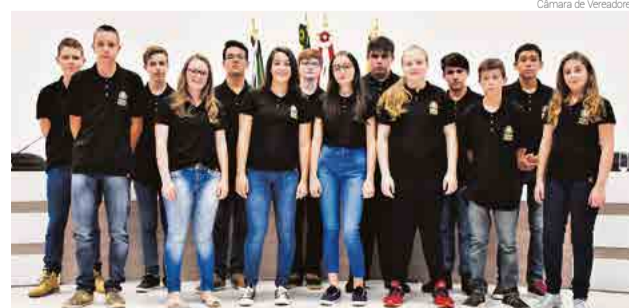
Jovens ficarão à frente do cargo de vereador mirim pelo período de dois anos