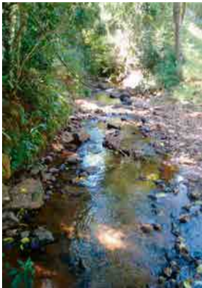
Conforme a Casan, o nível do Rio Camboim está muito baixo

“É uma situação complicada. O rio está passando uma dificuldade grande nesse momento, temos consideração porque é um manancial antigo que sempre abasteceu a cidade. Perdemos quase 30 litros de capacidade então é claro que tivemos problemas no abastecimento, mas chamamos a res-