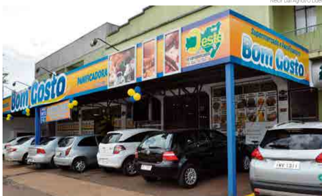
Estabelecimento oferece supermercado e panificadora com variadas opções

Com a integração na Rede Oeste, o Mercado e Panificado-