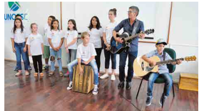
Apresentações culturais fizeram parte da programação

permaneceram no auditório, para palestra.