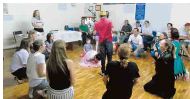
Apresentação encenada encantou a todos

Dando continuidade ao encontro, foi feita prestação de contas, seguida de estudo e discussão dos assuntos escolhidos para tal.