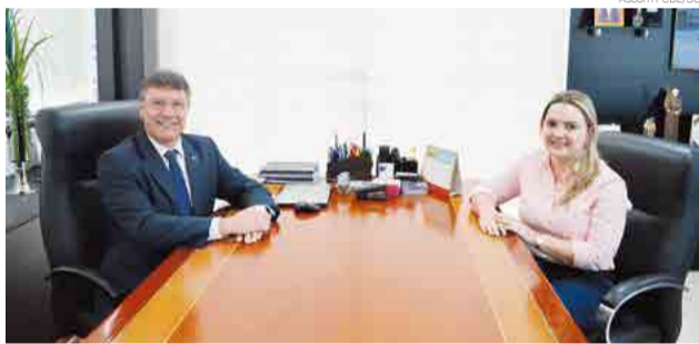
Reunião foi promovida em Florianópolis

A presidente da CDL de Maravilha destaca ainda que com o apoio da FCDL a entidade está reavaliando ações e readequando processos, o que colabora para o crescimento. "Com este apoio a entidade está saudável e tem se reinventado, trazendo inovação aos seus associados", comenta.