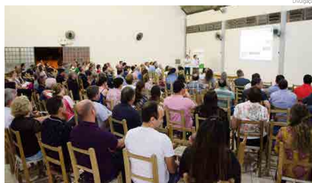
Assembleias contam com ampla participação dos associados

Caibi: 5 de março Saudades: 13 de março Maravilha: 14 de março Pinhalzinho: 3 de abril Palmitos: 4 de abril Cunha Porã: 16 de abril