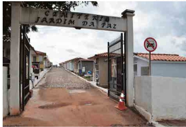
Portões permanecem abertos apenas no período diurno