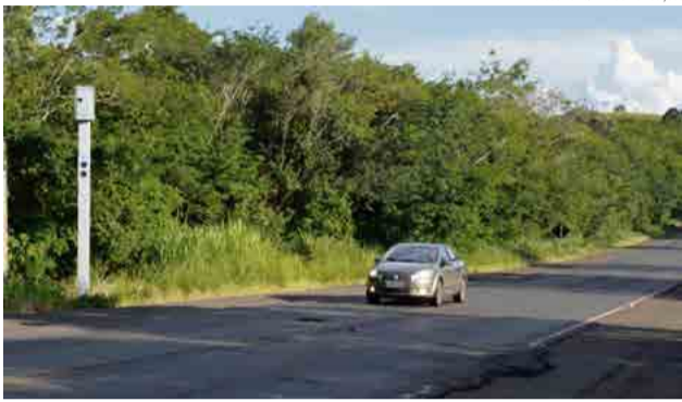
Equipamentos ficam na altura da Linha Santo Exedito, entre São Miguel do Oeste e Maravilha

“Os controladores estão sendo recolocados nos pontos já previstos. O contrato foi prorrogado por um prazo de seis meses em caráter emergencial. A obrigação da empresa contratada, assim que ocorre uma ação de vandalis-