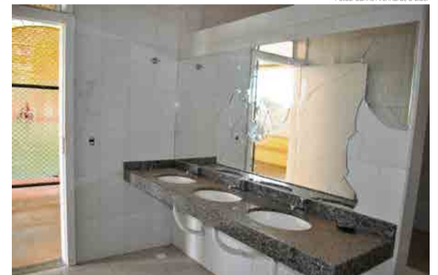
Espelho foi quebrado em um dos banheiros

A estrutura também já foi alvo de vândalos, que quebraram o espelho em um banheiro e depredaram portas no local. Entre as adequações solicitadas pelo fiscal do FNDE, também constam estes consertos na estrutura depredada.