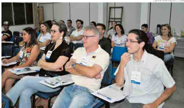
Primeira capacitação para empresários foi realizada no último dia 22

Um dos objetivos é fomentar o empreendedorismo no comércio, indústria, e também dentro das escolas. De Oliveira destaca que o projeto é dividido em 14 áreas e também trabalha internamente (na prefeitura) algumas questões como desburocratização, fomento de Microempreendedores Individuais (MEIs), funcionamento da Sala do Empreendedor, planejamento estratégico municipal, entre outros. No início deste ano teve a capacitação de 25 professores, por meio do Jovens Empreendedores Primeiros Passos (Jepp), que agora pas-