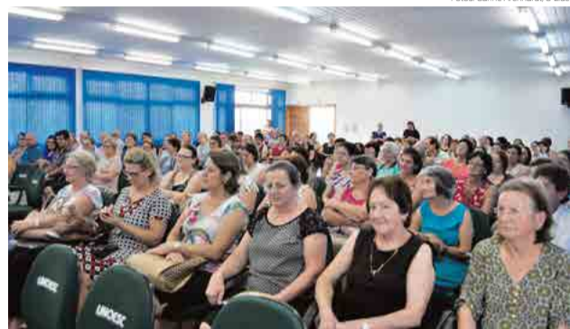
Alunos da terceira idade começaram o ano letivo

Conforme a professora Izoldi Pinheiro, o módulo 2 é uma novidade em 2018 e atende um pedido dos alunos que se formaram, mas queriam continuar estudan-