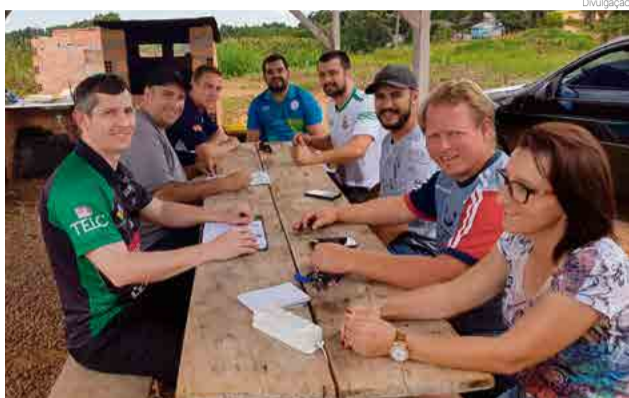
Última etapa do Circuito Oeste ocorre em Maravilha, no mês de novembro

O encontro reuniu representantes de Maravilha, Pínhazinho, São Miguel do Oeste, Chapecó e Xanxerê, sendo realizado na residência