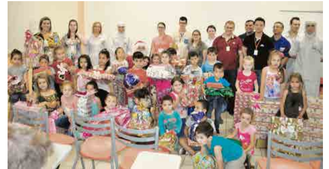
Crianças receberam doces e brinquedos