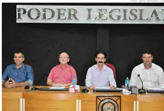
Nova Mesa Diretora assume a partir de janeiro