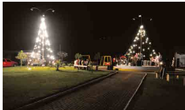
Praça está em clima de Natal