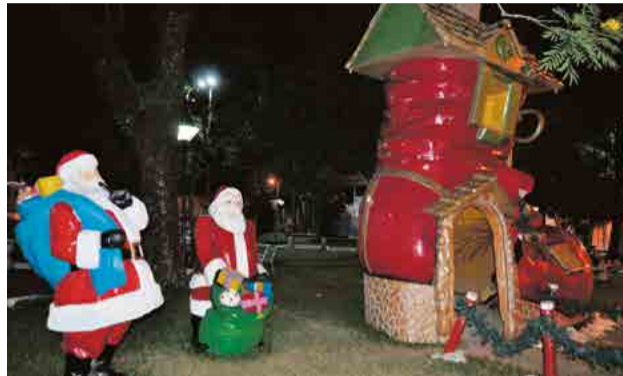
Imagem do Papai Noel e sua bota também fazem parte da decoração

Foram instaladas 12.5 mil lâmpadas led e 12,5 mil metros de fio no túnel iluminado que cobre parte das avenidas Araucária, Sul Brasil e Sete de Setembro. A decoração da cidade é também composta por mais sete mil metros de mangueiras LED, dois mil metros de piscas, além de 48 estrelas nos cantos, praças e rótulas. Todo o custo foi pago pelo município, neste ano sem parceria com entidades.