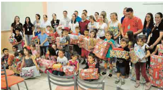
Padrinhos posaram para a foto com os apadrinhados