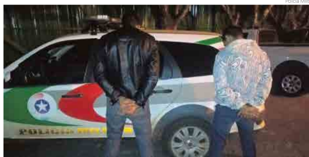
Homens foram presos enquanto circulavam pela cidade de Iraceminha

Segundo a polícia, eles estavam com uma motocicleta, com licenciamento atrasado desde 2013. A dupla também não tinha documentos pessoais. A ocorrência teve auxílio da Polícia Militar de Maravilha.