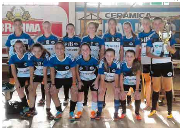
Após três vitórias, trouxeram para a Cidade das Crianças o prêmio principal

lhenses conquistaram três vitórias e, com isso, o troféu de melhores do certame. Os resultados foram 6 x 0 contra Santa Helena, 5 x 0 contra Princesa e 5 x 1 contra Escolinha da Chapecoense.