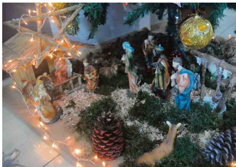
Presépio representa o nascimento de Jesus

levaram presentes para o Filho de Deus e hoje os cristãos devem continuar a se presentear nesta data e sempre lembrar que o grande presente para todos nós é o nascimento de Jesus.