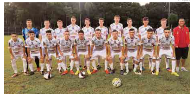
Grupo participou de jogos em Pinhalzinho, Maravilha e São Lourenço do Oeste

Nos jogos de quarta-feira (20), em São Lourenço do Oeste, os resultados foram duas vitórias. No primeiro jogo o CRM ganhou da equipe da casa por 2 x 0 e na segunda partida 2 x 1 contra Ajap de Pinhalzinho.