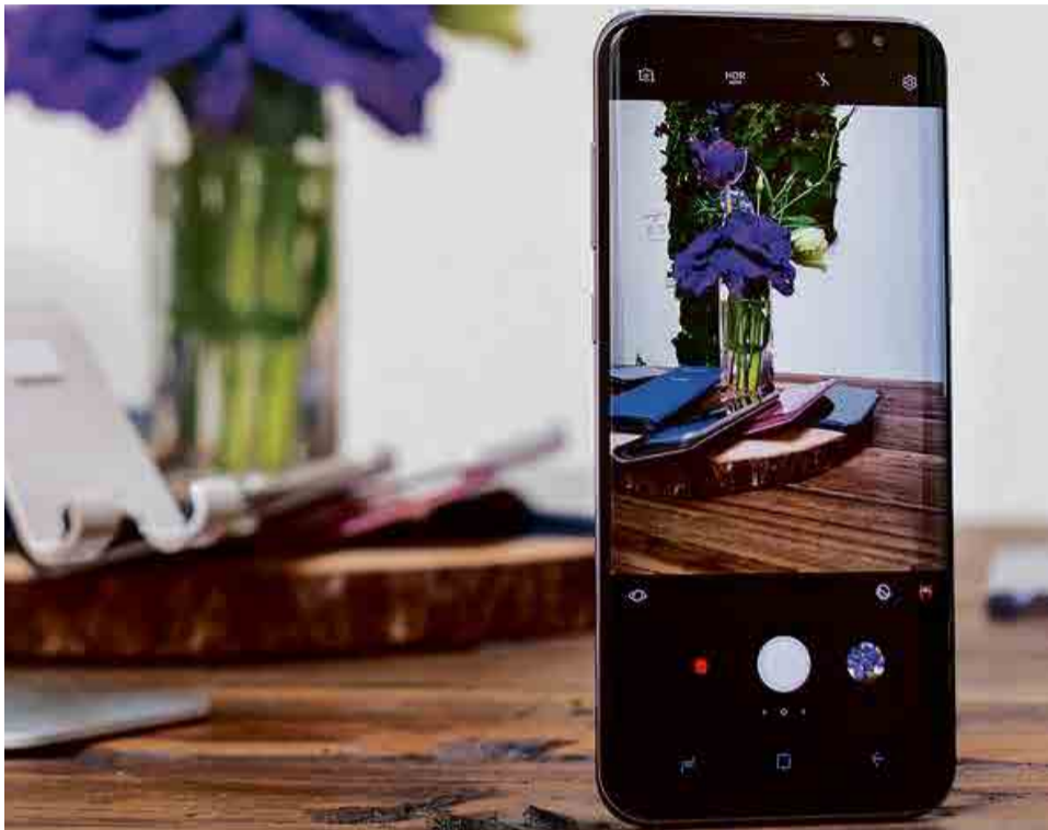
Samsung Galaxy S8 é o primeiro na lista dos melhores

“Com o seu ótimo processador Qualcomm Snapdragon 625 de 2.0GHz, somado aos seus 3GB de RAM, ele roda qualquer app mais pesado ou jogo atual sem dificuldades. Além disso, suas câmeras entregam excelentes resultados graças ao sensor Sony aplicado no smartphone, suas lentes com boa abertura e itens importantes para a hora do click, como a estabilização óptica”, finaliza.