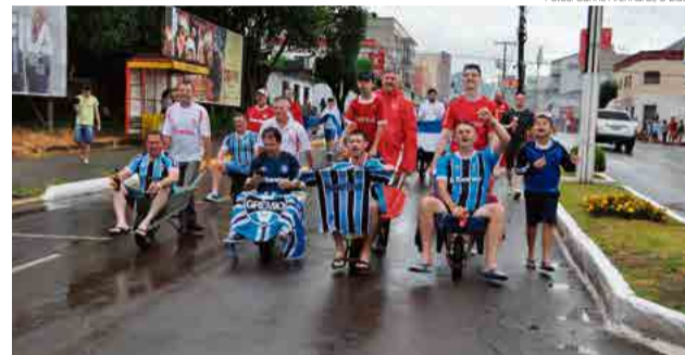
Caminhada pelo centro da cidade