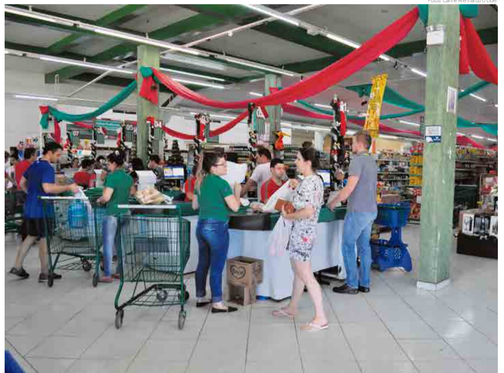
Movimento no comércio local se intensificou nesta semana