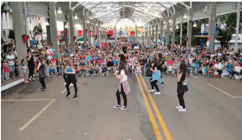
Público expressivo acompanhou a programação

Ainda durante a noite teve a Festa do P pastel e do Chopp, promovida pelo Lions Clube Maravilha Oeste. O público degustou pastéis de carne, frango, queijo e chocolate. Os valores arrecadados serão revertidos à Campanha da Visão, manutenção do quarto 39 do Hospital São José, no projeto de camas hospitalares, além de outras ações mantidas pelo clube.