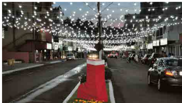
Mais de 12 mil lâmpadas foram colocadas no túnel