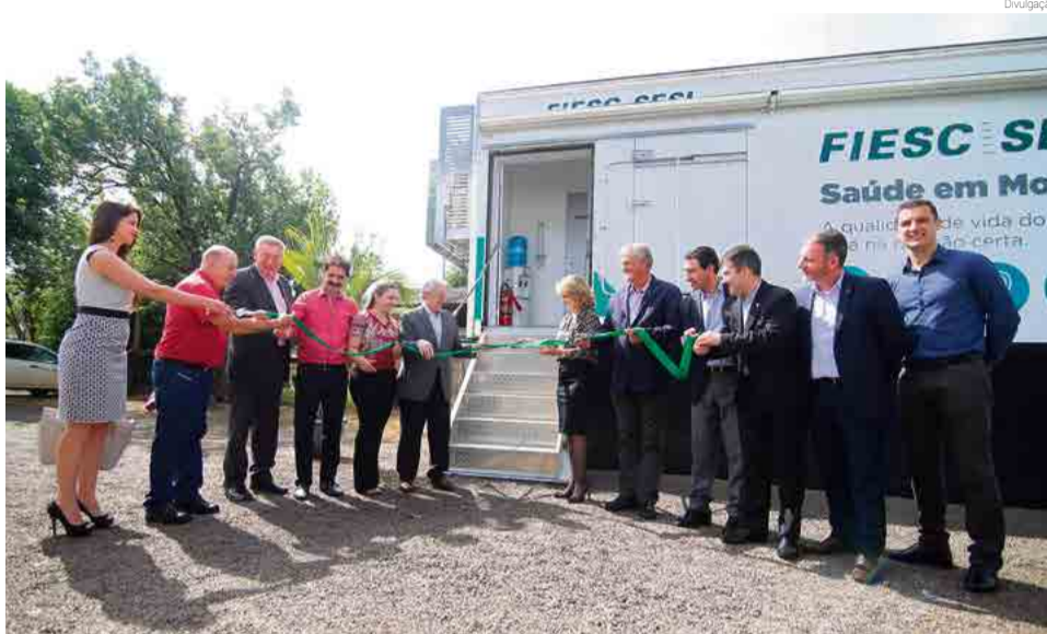
Evento ocorreu na manhã de segunda-feira (18)

A unidade móvel de saúde ocupacional está instalada junto ao Senai. A estrutura tem investimento de R$ 700 mil e oferece serviços de odontologia e saúde e segurança no trabalho, com avaliações ambientais, exames médicos ocupacionais, audiometria, procedimentos como eletrocardiograma, espirometria e eletroencefalograma,