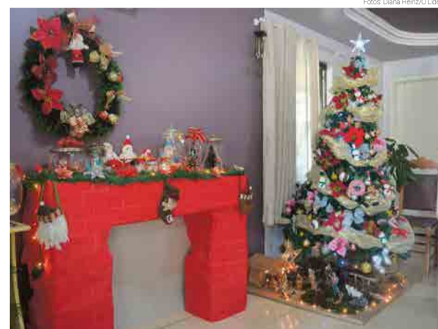
Árvore de Natal representa a vida, e as luzes, o Cristo Jesus

Ainda mais importante que trabalhar a simbologia é se preparar espiritualmente, buscar estar na presença de Deus e seguindo seus mandamentos. No dia 24 - véspera de Natal - a ceia representa a importância de comemorar a data em família. O mesmo deve ser seguido no dia 25, assim como dedicar um momento para conversar sobre o verdadeiro sentido da data e ler um trecho bíblico que conta a história do nascimento do Salvador. O pastor diz que a igreja incentiva os fiéis