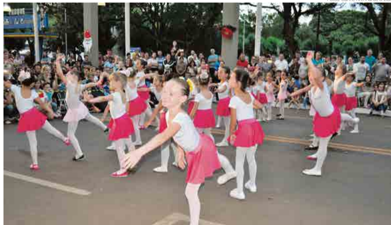
Apresentação de balé esteve na programação cultural