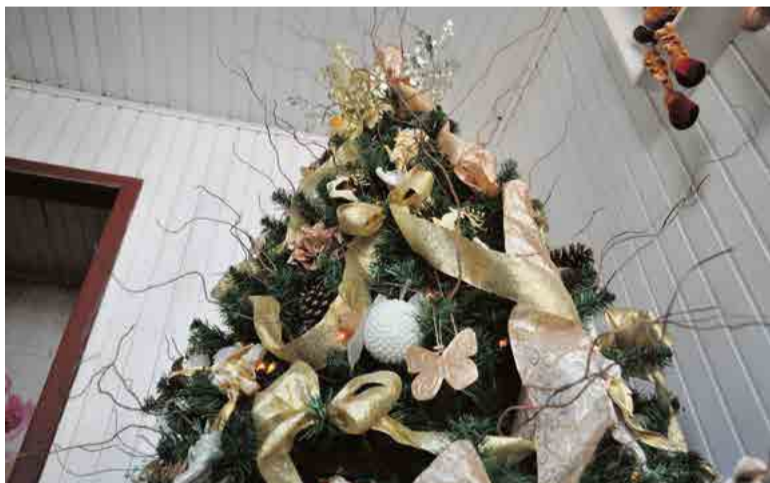
Cômodos internos estão decorados