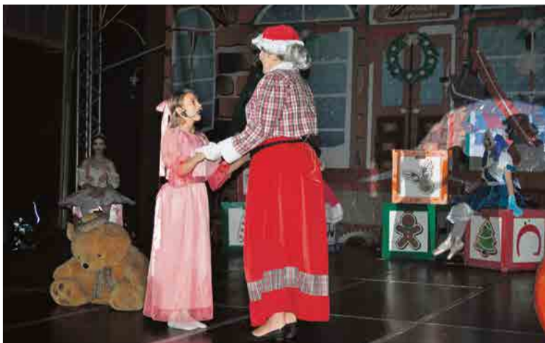
Show com o grupo Circo e Palco