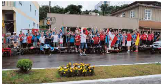
No final, colorados e gremistas confraternizaram