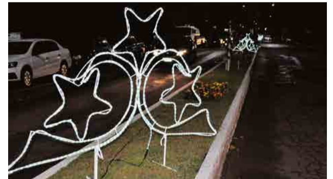
Ruas e avenidas receberam 48 estrelas de Natal