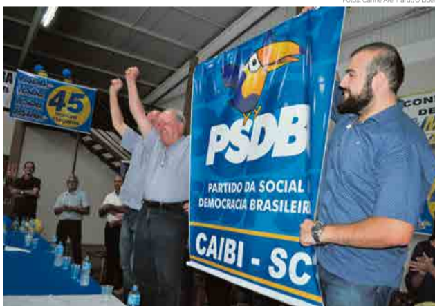
Deputado foi homenageado durante o evento