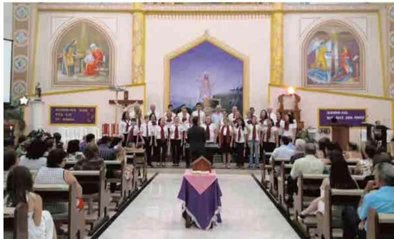
Coral Cidade das Crianças também se apresentou na Igreja Matriz na noite de sábado