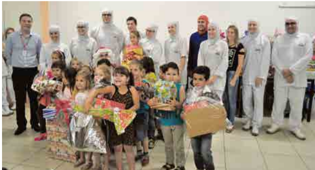
Primeiro grupo que recebeu os presentes