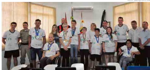
Medalhas foram entregues pelas lideranças que participaram do ato