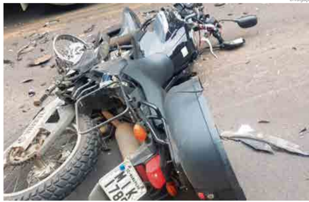
Marvilhense estava em uma motocicleta seguindo para Chapecó na hora do acidente

A mãe do policial e o padrasto residem em Maravilha. Ele também possui um irmão, agente penitenciário, no Rio