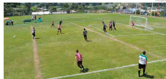
Quarta rodada será disputada no próximo mês

Real Madrid 2 x 3 Sertãozinho Juniors Sertãozinho 10 x 1 Bar do Juce Boca Juniors 1 x 0 Os Titãs Tchareminga 0 x 1 Largados Metal Nobre/Projeto Educativo 3 x 1 Atlético de Madrid Juniors Ticaratica 3 x 4 Paracuibes