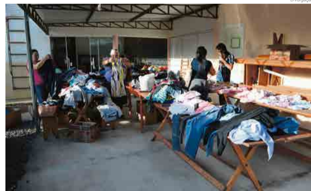
Peças foram disponibilizadas aos munícipes

havia grande quantidade de roupas e calçados para doação. Com o intuito de ajudar o próximo, as peças que ainda ficaram na Secretaria serão doadas para instituições beneficentes em Maravilha.