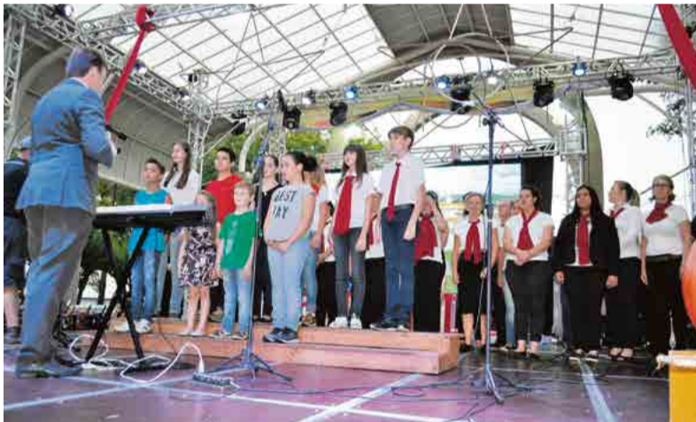
Coral Cidade das Crianças fez duas apresentações no evento