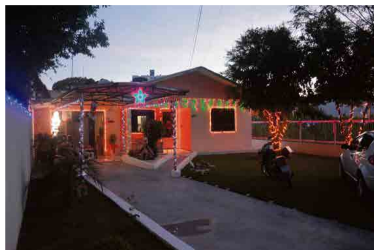
O Natal é esperado, já que o desenrolar dos fios das luzes é uma terapia

dos fios das luzes é uma terapia. "Tudo aqui é muito simples, mas como é feito com amor, nos transforma. Aconselho a todos que sejam solidários e decorem as casas, porque é o que mantém esse sentimento vivo no coração", finaliza.