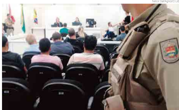
Julgamento foi na Sala do Júri e sentença foi proferida depois das 17h

O crime ocorreu em julho de 2016 em um bar na Avenida Irineu Bornhausen, em Iraceminha.