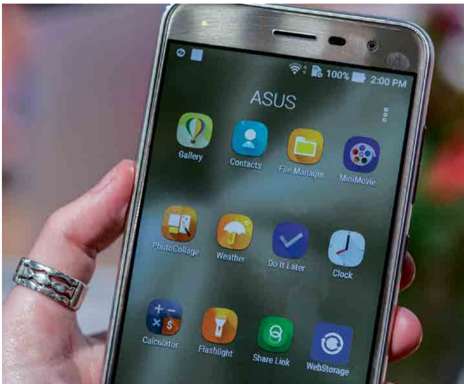
ZenFone 3 é o primeiro na lista do melhor custo/benefício