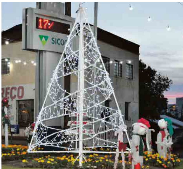
Árvores de Natal representam a vida

PISCAS/MANGUEIRAS/LÂMPADAS/VELAS: Todas as luzes natalinas, seja com velas ou lâmpadas, representam a luz do próprio Jesus, que disse "Eu sou a luz do mundo, quem me segue de modo algum andar em trevas, mas terá a luz da vida". É um dos principais e mais significativos símbolos do Natal.