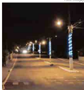
Luzes foram colocadas nas ruas principais

Pensando em deixar o município mais bonito e acolhedor, a administração de Tigrinhos iluminou as principais ruas da cidade e a praça. O objetivo é também fazer com que as pessoas sintam a magia do Natal, época de comemorações, reflexões, pensamentos e desejos bons.