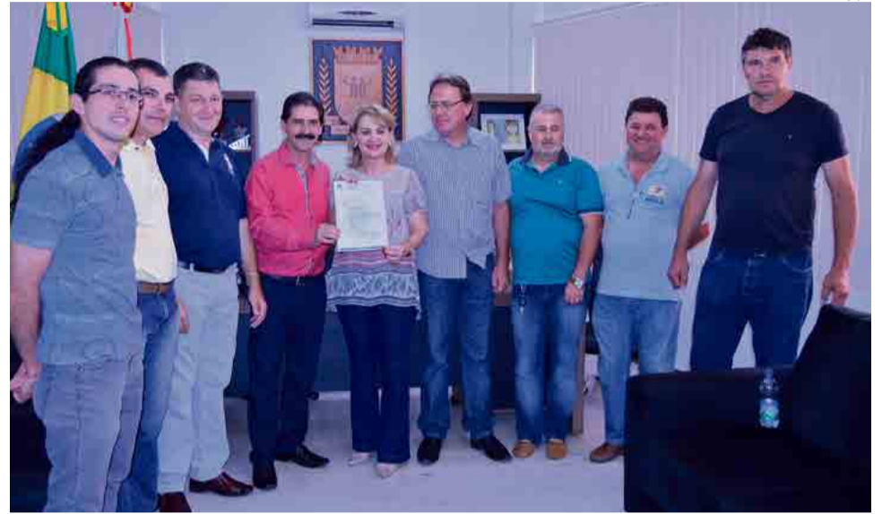
Diversas lideranças estiveram presentes no ato

O presidente da Casa enfatizou que trabalhou durante o ano de forma a con-