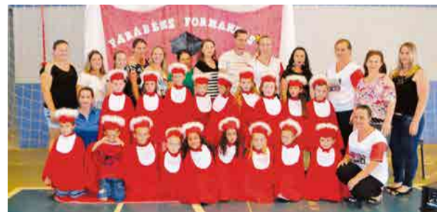
Pré II A