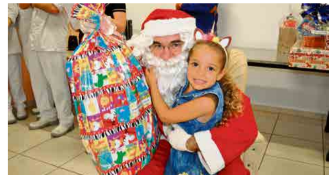
Papai Noel entregou os presentes