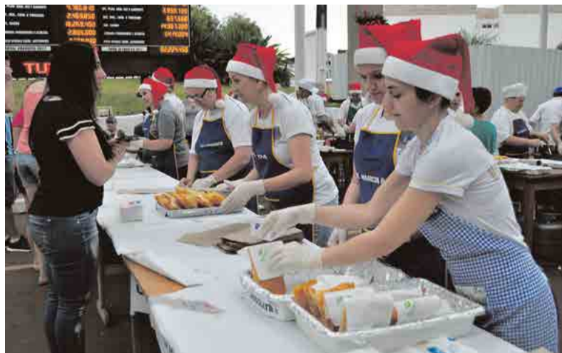
Lions Clube Maravilha Oeste promoveu a Festa do Pastel e do Chopp