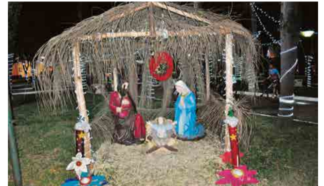
Presépio representa o nascimento de Jesus