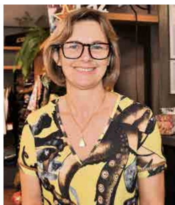
FOTO DA FAMÍLIA

"Neste fim de ano ganhei do Núcleo da Mulher Empresária uma foto da minha família, com uma mensagem de gratidão. Este presente teve um importante significado, pois representa a união do associativismo com a família, algo que não podemos separar. Dedicamos muito tempo à empresa e não podemos esquecer que a família é a base de tudo. O presente me deixou muito feliz, pois o que importa não é o valor monetário, e sim sentimental. É tão bom receber e dar presentes, fico muito feliz. Este é um dos motivos de eu ter escolhido vender presentes."