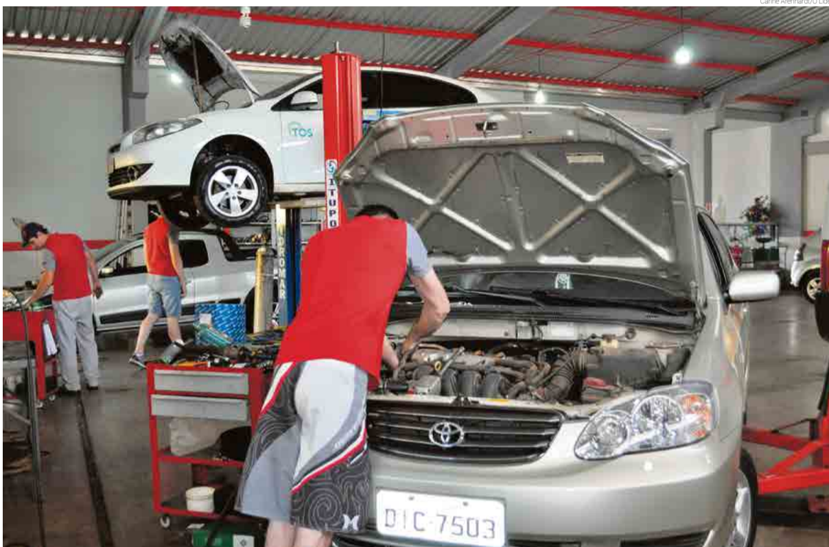
Revisão precisa ser feita antes de iniciar o roteiro

Meurer destaca que é preciso estar atento ao calendário de revisões e trocas de óleo ou peças, que são diferentes em cada carro. Caso o proprietário tenha adquirido um veículo sem estas informações, a orientação é levar até uma mecânica para identificar a situação do automóvel.