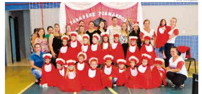
Pré II B