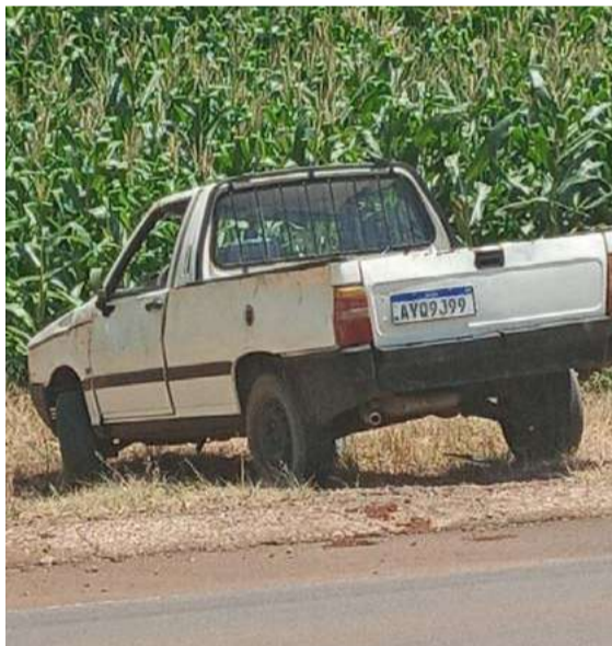
Carro foi localizado abandonado na SC-160

O jornalismo da Rádio Líder acompanhou o trabalho de investigação após o furto. A reportagem apurou que os homens sofreram um acidente com o veículo durante a fuga. Pelos danos, o acidente foi na estrada de chão. Além disso, um dos integrantes do grupo ficou ferido e perdeu sangue dentro do carro. A Polícia Civil já fez buscas em hospitais da região e segue apurando detalhes do furto. Os homens devem ser presos por furto na loja de Maravilha e por levarem o veículo de uma família de São Miguel do Oeste.