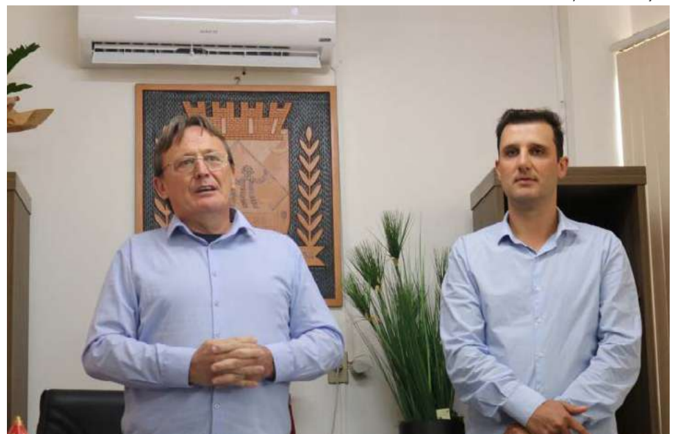
Ato de transmissão do cargo foi realizado no último dia 4