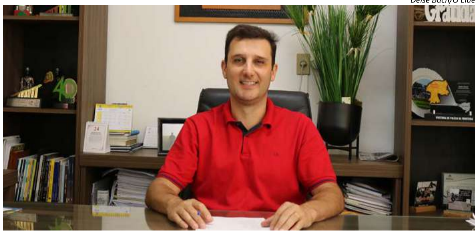
Deise Bach/O Líder

Importante frisar que além do cálculo da distribuição do Fundo de Participação dos Municípios, os dados servem de base para reformulação de políticas públicas mais assertivas, como o direcionamento de investimentos em saúde, educação, infraestrutura e programas sociais.