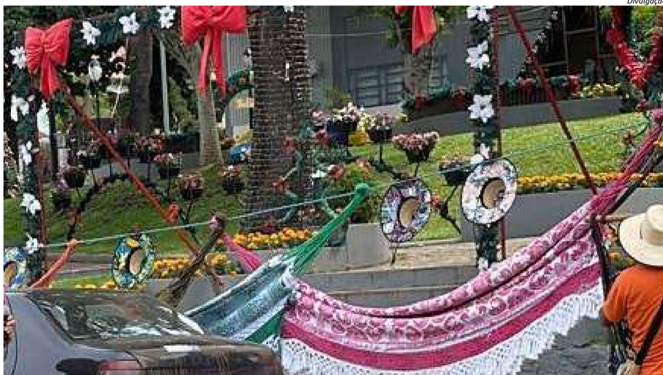
Redes expostas na calçada em frente à praça em São João do Oeste

Segundo o secretário, a entrada de vendedores ambulantes e permanência no município não foi alterada. A proibição atinge locais específicos, já que o município percebeu instalação frequente dos vendedores nas praças e locais públicos. Assim, o decreto vai disciplinar a atividade no território municipal. "Muitos se instalavam nas calçadas e acostamento, atrapalhando o fluxo de veículos", lembra Schneider.