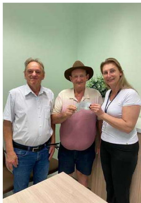
Dinheiro foi recebido depois da realização do evento realizado no CTG

e a doação recebida foi de R$ 15 mil. A diretora do hospital agradeceu o apoio e destacou que os novos equipamentos servem para guardar os insumos para preparo dos alimentos servidos aos pacientes. "São refrigeradores que permitem fazermos a separação dos alimentos de acordo com a norma vigente da Vigilância Sanitária", ressalta. Ainda conforme a diretora, para o hospital significa atender mais uma legislação. "E, claro, também deixar os alimentos bem armazenados", finaliza.