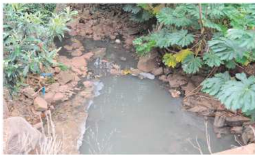
No local, além do cheiro de esgoto, a proliferação de insetos e animais peçonhentos, há assoreamento do córrego, que coloca em risco uma residência

meio a vegetação e por cima do último trecho canalizado.