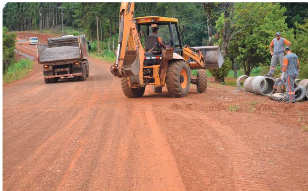
A Gaia Rodovias, responsável pela obra, retomou os trabalhos na última semana e agora atua na colocação da base e sub-base, que receberão a pavimentação final

Conforme o engenheiro, a parte mais difícil foi concluída, que é da terraplanagem, escavação e drenagem, já que em solo argiloso, como da região, qualquer chuva pode atrasar o cronograma. A obra iniciou em maio de 2014 e tinha previsão de conclusão em um ano. O prazo foi prorrogado por seis meses e agora será por mais seis, já que a previsão de conclusão é junho de 2016, totalizando dois anos de obras. "Além das pontes, o projeto precisou ser adequado em diversos pontos, especialmente na drenagem da água, com etapas sendo concluídas agora. Em alguns locais, por exemplo,