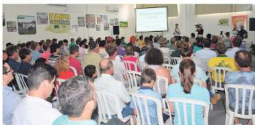
Abertura da feira ocorreu nesta quarta-feira e é considerada o maior evento do agronegócio do Estado

ma sustentada. Desde o Itaipu Rural Show que aconteceu há 18 anos, a Cooperitaipu e seus associados tem a certeza que a