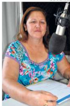
Secretária de Educação cedeu entrevista a WH Comunicações

De acordo com a secretária de Educação a proposta do município é que o reajuste seja parcelado, nas seguintes condições: 5% na folha de pagamento de fevereiro (retroativo a janeiro); 3% na folha de pagamento do mês de março e 3,36% na folha de maio completando os 11,36%. "A ideia é