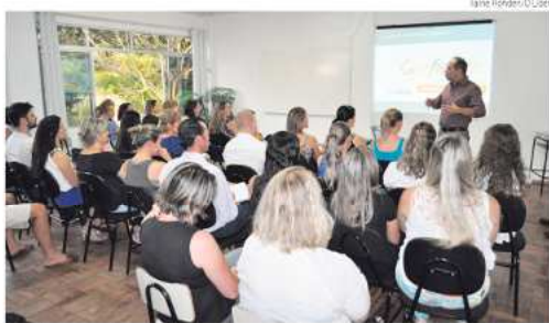
Coordenadores da Positivo apresentaram o sistema para a comunidade escolar

O método do sistema Positivo de Ensino foi apresentado para a comunidade durante