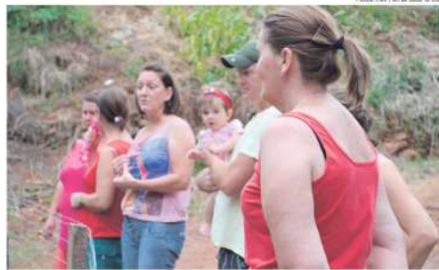
Moradores relataram que o problema perdura há pelo menos três décadas e reforçaram o pedido para continuidade da canalização

tura da rua, que já foi feito calçamento e não tem acesso. É complicado viver nessa situação. Agora que quase não chefe acumula esgoto, o cheiro é insuportável. Quando ameaça chover algumas pessoas soltam resíduos e fica o cheiro de gasolina, óleo. Quando chove muito a água sobe e em uma casa passava por cima, mas obras particulares resolveram isso. O assoreamento é enorme e nada é feito", lamenta.