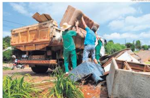
Detentos iniciaram recolhimento dos materiais na terça-feira (26)

Na última semana a Unidade Prisional de Maravilha colocou à disposição do município o trabalho de detentos em que estão regime semiaberto, sendo que três deles iniciaram a limpeza de terrenos baldios, tanto públicos quanto privados, que foram previamente mape-