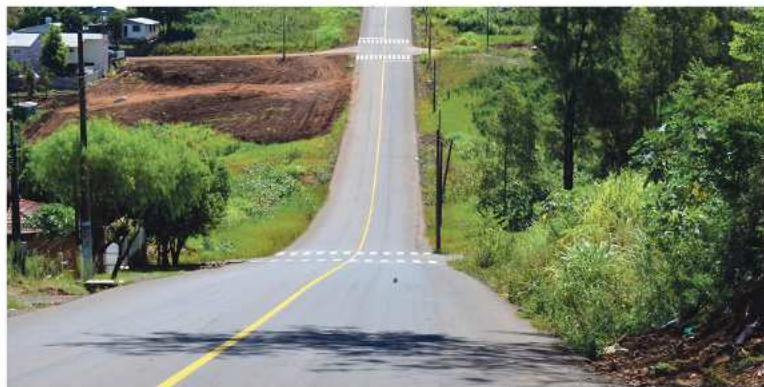
No Centro e Bairro Salete são mais de 1,8 mil metros de pavimentação. Nesses pontos, a obra está pronta e possibilitou, além do interior, acesso pavimentado aos bairros

Já no perímetro rural, pouco mais de dois quilômetros estão concluídos, já passando pela primeira linha contemplada, da Emboada, pela área destinada a indústria e chegando a propriedade da família Zanella. Neste trecho estão prontos o asfalto, os acessos as comunidades e propriedades, toda parte de tubulação, sarjetas e drenagem da água, acostamentos e parte da sinalização. "Até a propriedade da família Zanella falta apenas a sinalização com placas. Inclui-se as sarjetas, que são feitas após o asfalto, estão prontas. Ao contrário do primeiro trecho onde há tubulação, aqui