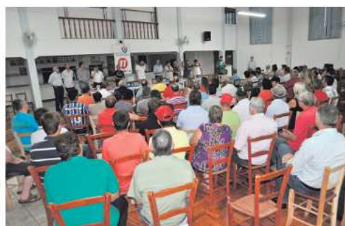
Encontro reuniu lideranças políticas de Maravilha e região

Durante o encontro as lideranças do PP destacaram que o partido está construindo um novo projeto para Ma-