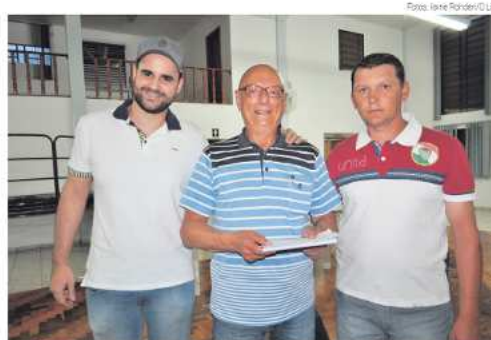
Pedidos foram entregues por lideranças do partido