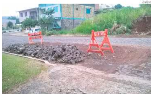
Buraco na Rua Humberto de Campos, no centro de Descanso, está aberto desde o início do ano

Um dos casos está na Rua Humberto de Campos, no centro. Em 2014, após um conserto na rede de água o buraco ficou aberto por mais de nove meses. Na época o transtorno foi maior, com passeio e calçada quebrados e danos nos jardins dos moradores. O calçamento foi refeito em 2015 e o início desse ano um novo problema ocorreu na rede de água. No dia 5 de janeiro, a tubulação recebeu reparos e o buraco ficou. Segundo os moradores, ninguém apareceu para fa-