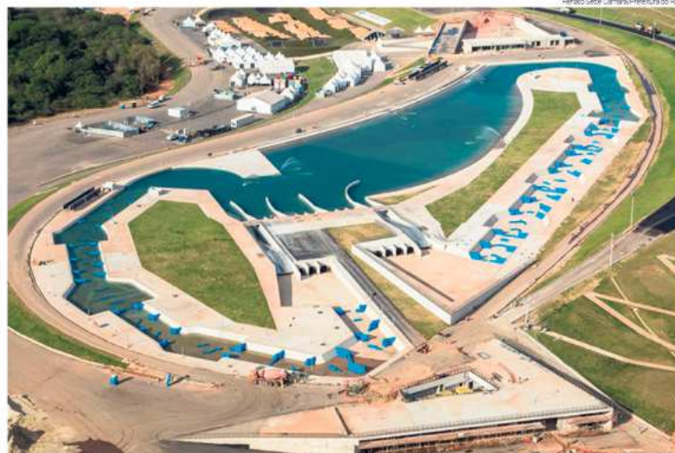
Circuito de canoagem slalom dos Jogos do Rio 2016

Em entrevista à equipe de reportagem do Jornal O Líder, o diretor da