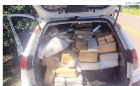
Droga apreendida totalizou aproximadamente 163 quilos

A maconha foi encaminhada para o Pelotão da Polícia Militar de Campo Erê e totalizou 163 quilos.