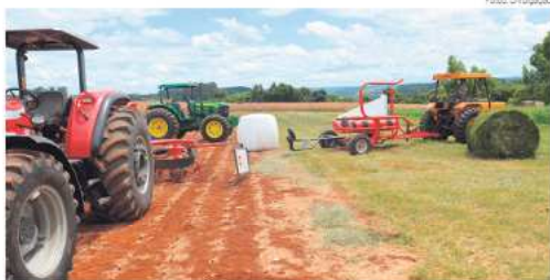
Novas máquinas são apresentadas aos participantes

Considerado o maior evento do agronegócio do estado de Santa Catarina, a feira realizada pela Cooperitaipu, é a vitrine para todos os empresários rurais buscarem novas tecnologias e as mais diferentes formas de se praticar a agricultura, o objetivo é mostrar aos participantes, a evolução das tendências para uma maior eficiência e os possíveis resultados na atividade do agronegócio de forma