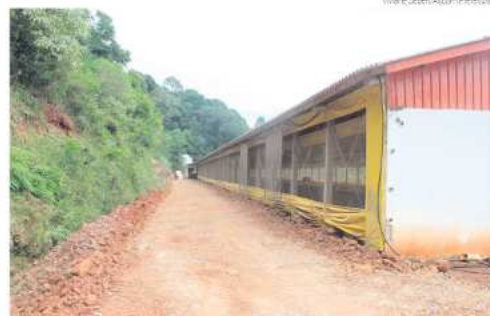
Iniciativa tem objetivo de viabilizar e incentivar diversas atividades