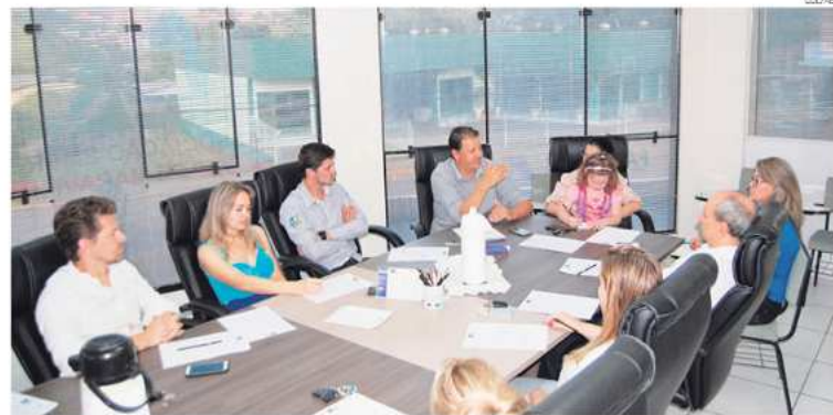
Primeira reunião do ano foi pautada pelo planejamento estratégico