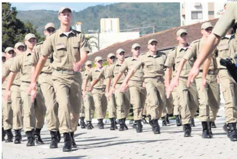
Somente para a Polícia Militar serão convocados 658 soldados

Conforme o governador, a decisão de unificar a convocação apresenta dois ganhos importantes para o Estado: Primeiro coloca esse novo efetivo à disposição da Secretaria de