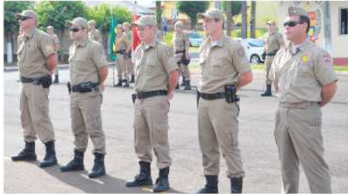
O ato contou ainda com homenagens e reconhecimento a ações de coragem e bravura no atendimento a ocorrências.

A Polícia Militar de São Miguel do Oeste realizou na manhã de sexta-feira (29), solenidade para promoção de praças e oficiais, nas dependências do 11º BPM. O ato contou ainda com homenagens e reconhecimento a ações de coragem e bravura no atendimento a ocorrências e serviços prestados à segurança da população. Participaram do evento autoridades