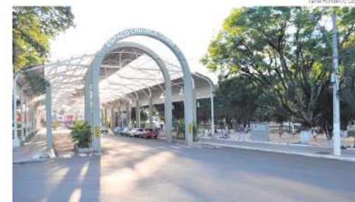
Local ficará fechado para lazer aos domingos

O decreto entrou em vigor no dia 19 de janeiro.