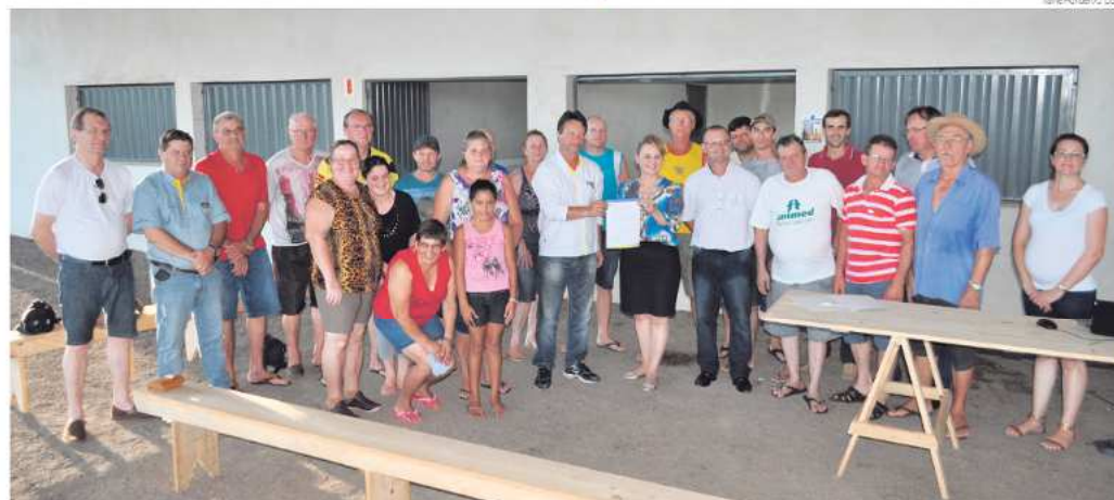
Comunidade participou da entrega da ordem de serviço da Rua A

Será que convergindo todos até um mesmo padrão de corpo homologado das indústrias da imagem, mesmo que de plástica ou anabolizado, esteja-se construindo a ideia do brasileiro, de sucesso? Será?