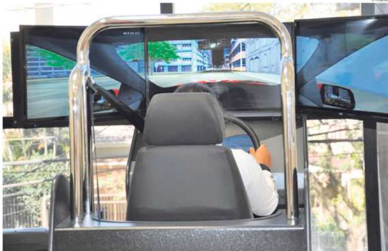
Desde o início do ano, aulas com o simulador de direção passaram a ser obrigatórias para quem quer tirar carteira de habilitação para dirigir carro