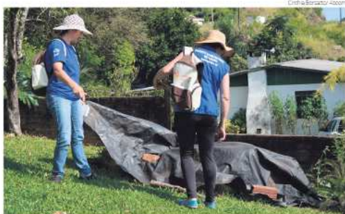
O pedido dos agentes é que a população recolha o lixo e entulhos e coloquem em frente as residências, nas quintas-feiras, sendo este material recolhido todas as sextas

O pedido dos agentes é que a população recolha do pátio o lixo e entulhos como vasos, la-