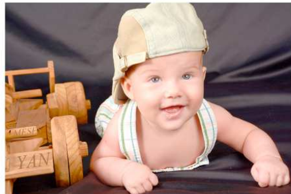
Yan de quatro meses