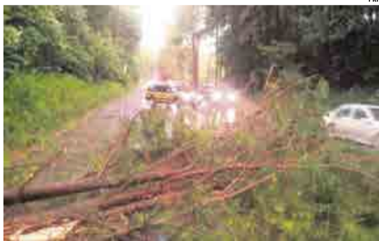
Diversas árvores caíram sob a BR-282, interrompendo o trânsito

foram destelhadas, o que eleva ainda mais os prejuízos, tendo em vista que o temporal de segunda-feira (12) já havia destelhado cerca de