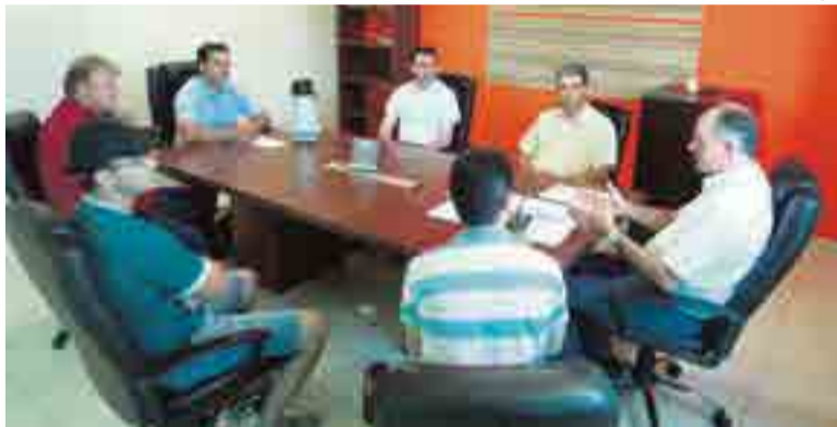
Reunião do Conselho foi realizada na quarta-feira (14)