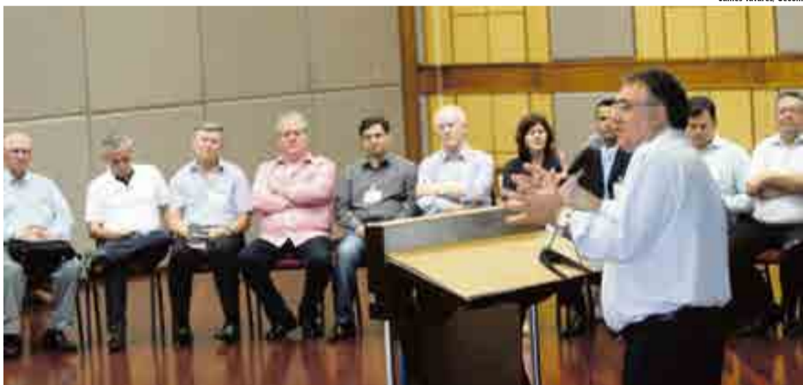
Em primeira reunião com novo colegiado, Colombo cobra controle de caixa e maior fiscalização de obras