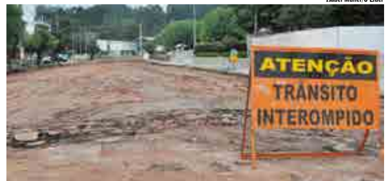
Obras iniciaram na quarta-feira (14)