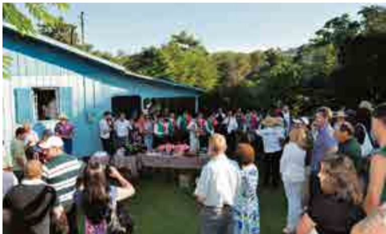
Tradicional café da manhã será realizado na Cantina Ghisleri