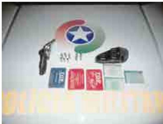
Revólver calibre .38, municiado com seis cartuchos, foi apreendido pela Polícia Militar

Diante dos fatos, foi dada voz de prisão ao jovem, que foi conduzido até a Delegacia de Polícia de Maravilha para a realização dos pro-