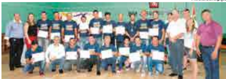
Vinte alunos do curso de Operador de Retroscavadeira realizaram formatura