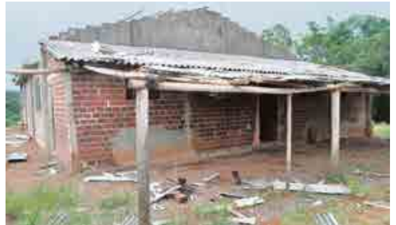
Telhado do salão ficou destruído

No local se reúnem mensalmente os clubes de mães e idosos, além dos integrantes da comunidade católica.