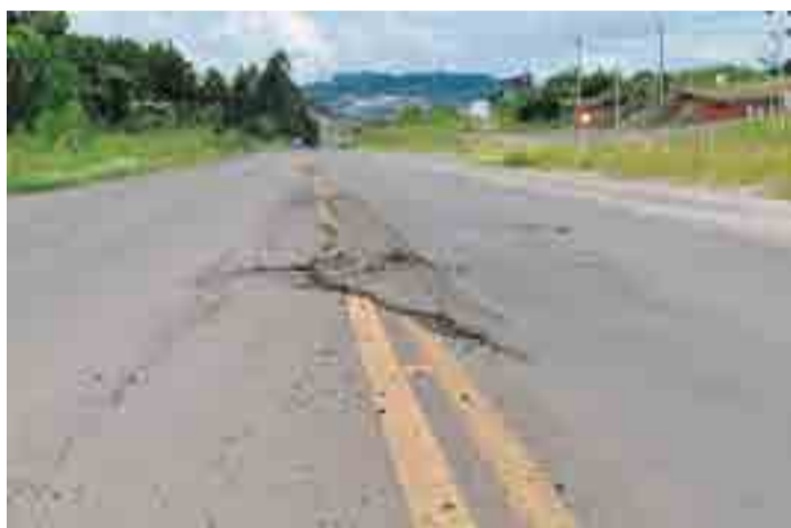
Camaleões em frente à PRF estão se alongando na rodovia