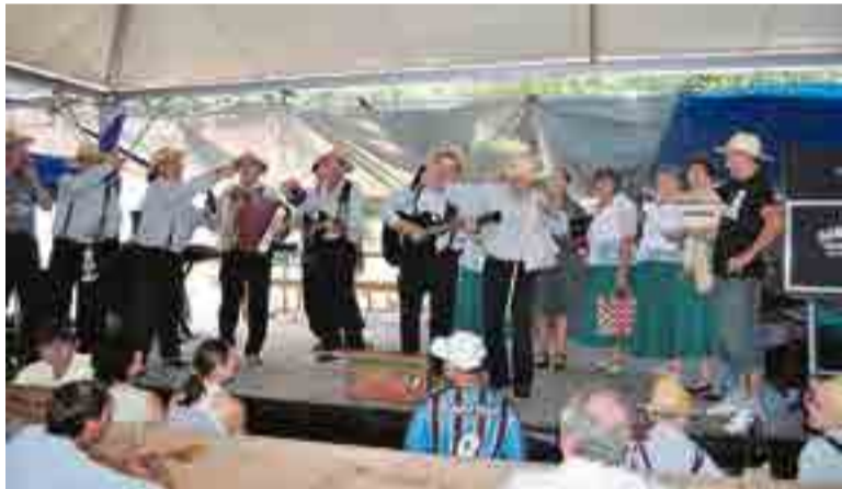
Grupos típicos italianos apresentarão canções durante o evento