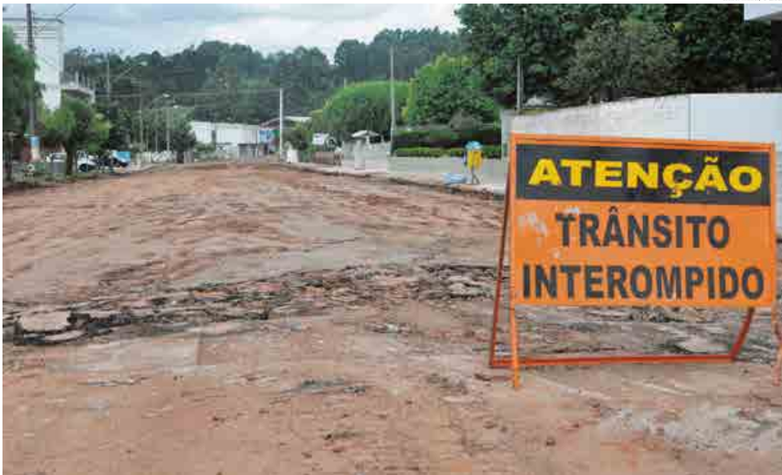
Isabel Müller/ O Líder

Sol com muitas nuvens durante o dia. Períodos de nublado, com chuva a qualquer hora.