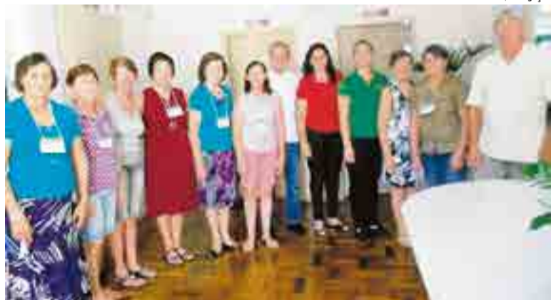
Formatura foi realizada na terça-feira (13)