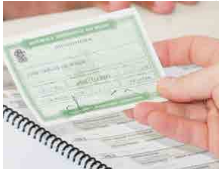
Multa está regulamentada por meio da lei nº 4.737/1965