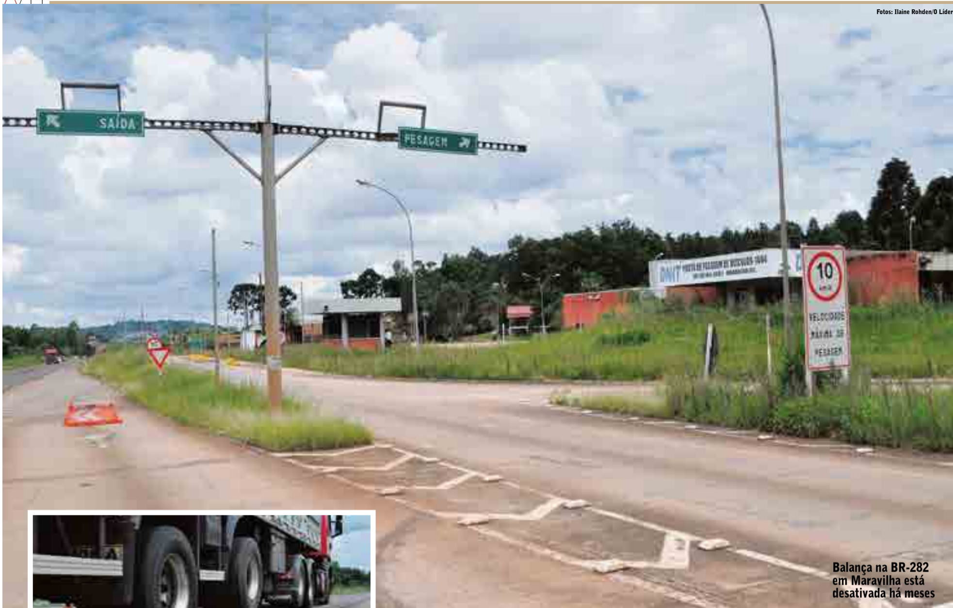
Balança na BR-282 em Maravilha está desativada há meses