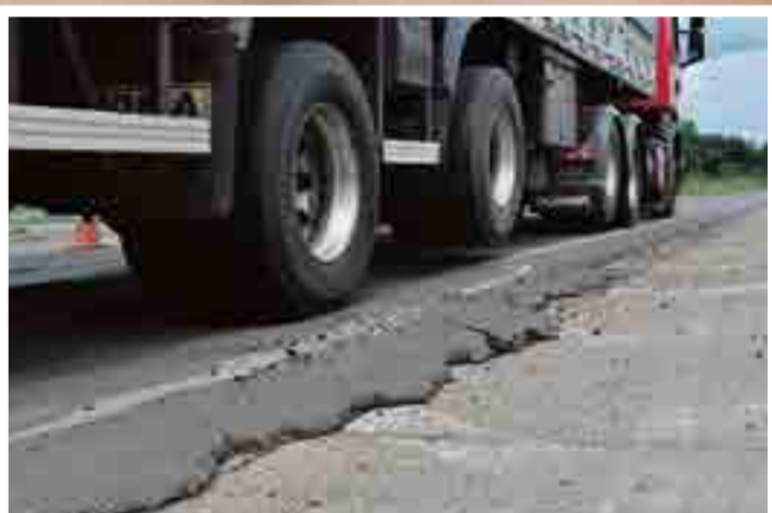
Excesso de peso é um dos principais causadores de danos nas rodovias