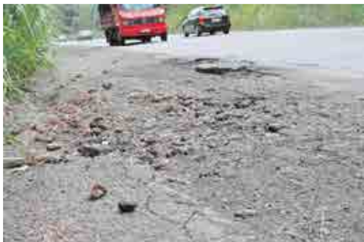
Acostamento também está precário