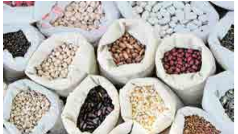
Sementes podem ser comercializadas pelos agricultores familiares