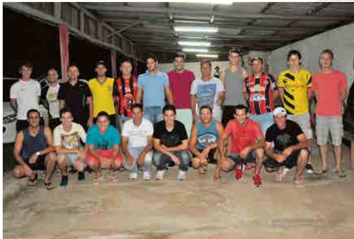
Treinos devem iniciar na próxima semana, visando o Campeonato Estadual Amador, fase Oeste