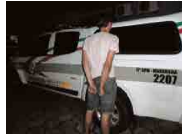
Rapaz foi detido e conduzido até a Delegacia de Polícia de Maravilha

cedimentos cabíveis. Na Delegacia de Polícia foi realizada a consulta