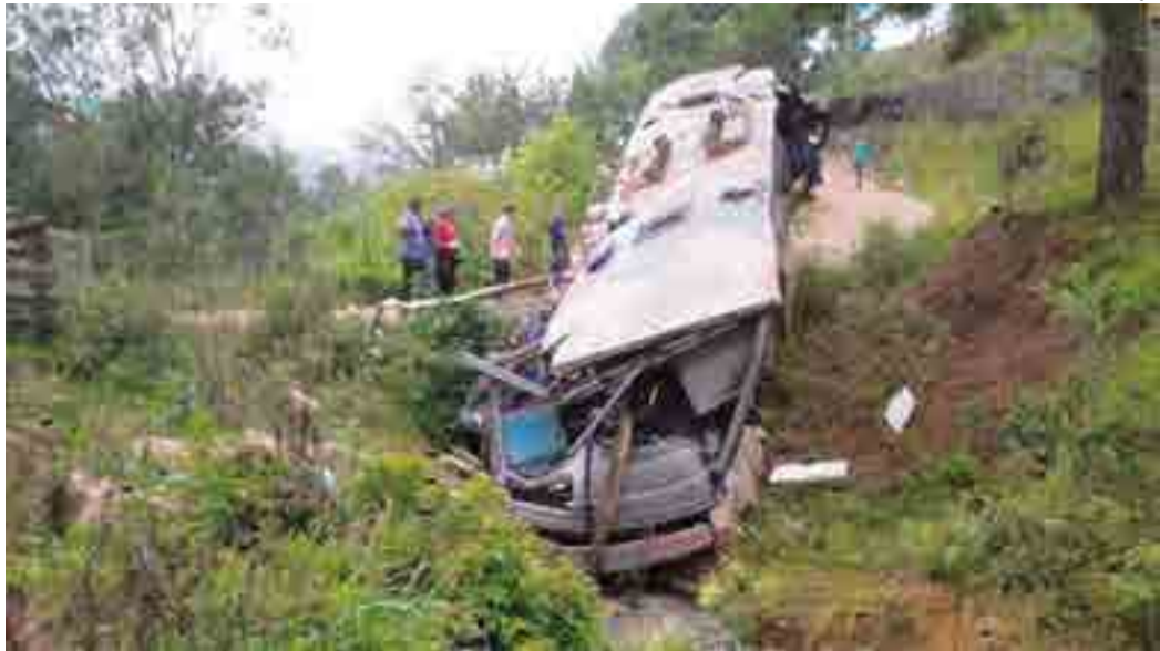
Ônibus saiu de Passo Fundo às 21h30 de sábado (10), com destino a Florianópolis