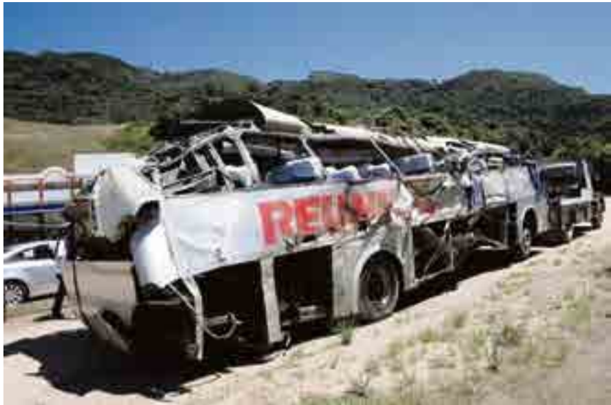
Queda de ônibus em ribanceira provocou a morte de nove pessoas