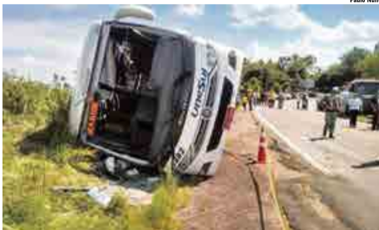
Veículo que saiu de Porto Alegre (RS) ao meio-dia tinha como destino a cidade de Tramandaí (RS), mas tombou em uma curva, no quilômetro 22

A proposta é colher informações com órgãos fiscalizadores de trânsito e adaptar o modo de operação da PRF aos protocolos de inspeção da ANTT. Na prática, isso significaria intensificar a fiscalização (inclusive em terminais