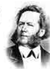
Henrik Johan Ibsen