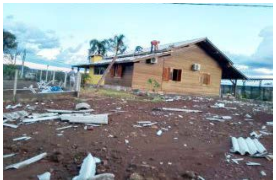
Casas tiveram o telhado arrancado com a força do vento