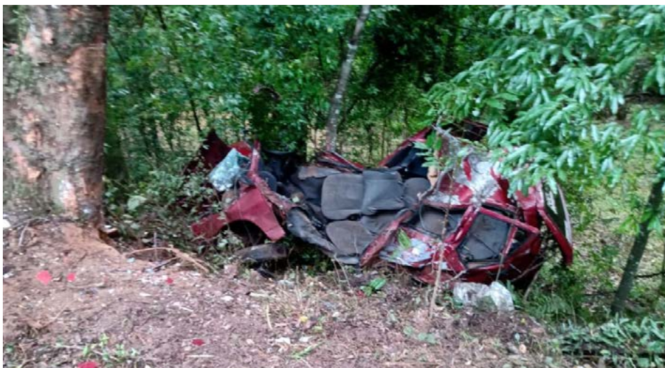
Veículo saiu da pista e bateu contra árvores