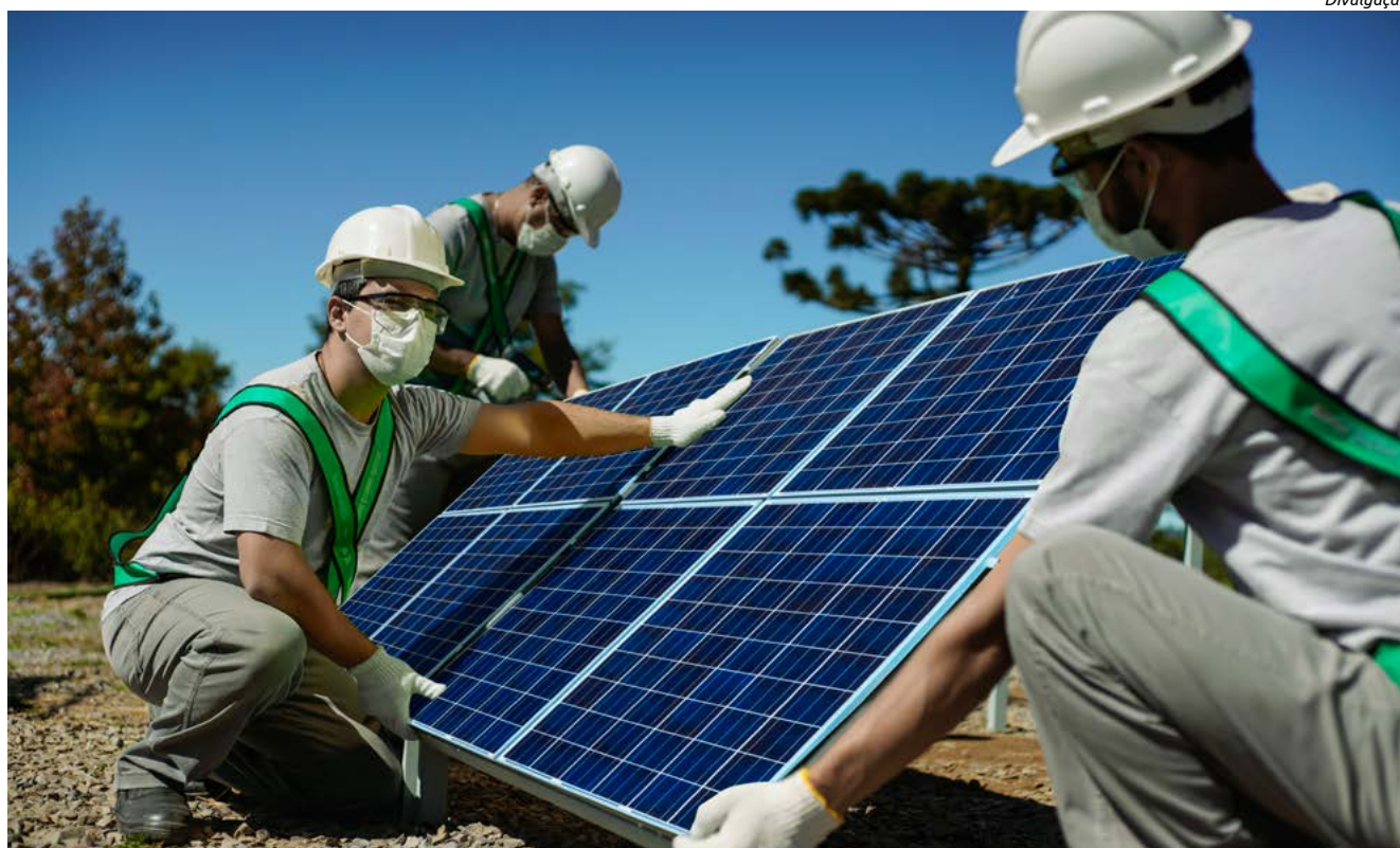
Ação foi pensada em razão da crescente demanda por crédito para a instalação de sistemas de energia solar