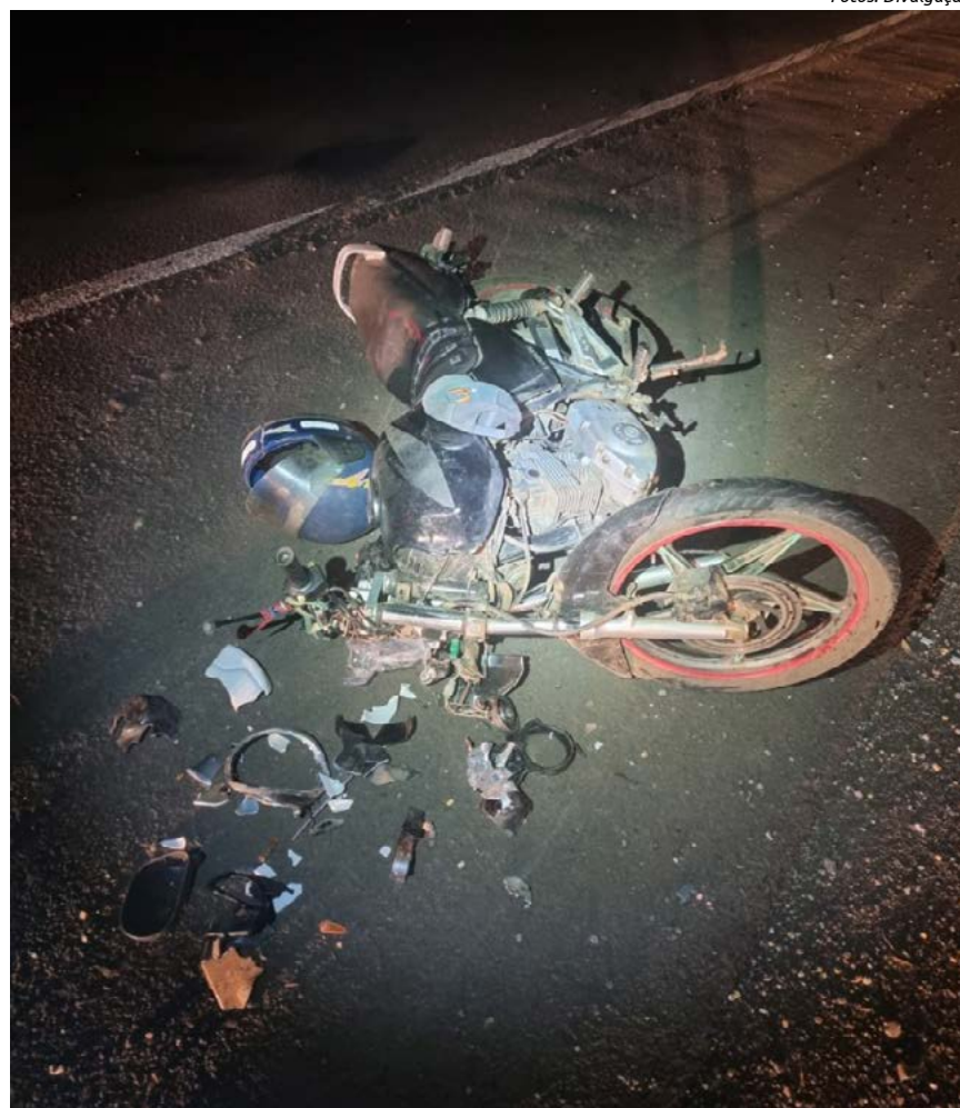
Vítima teve diversas fraturas, não resistiu e morreu dois dias depois do acidente