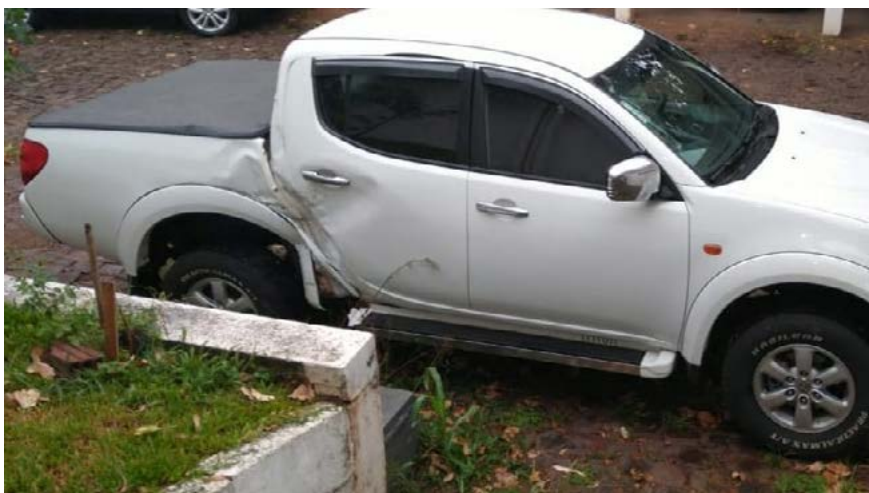
Polícia Civil localizou veículo após troca de informações e denúncias