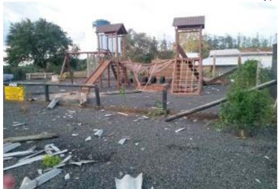
Pesqueiro Paulista sofreu grandes perdas