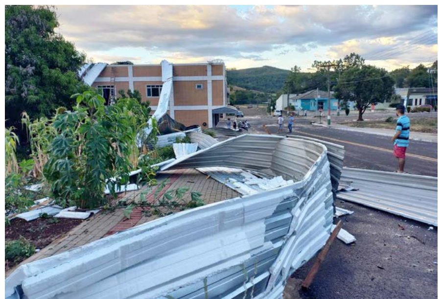
Cenário de destruição foram registrados em vários pontos