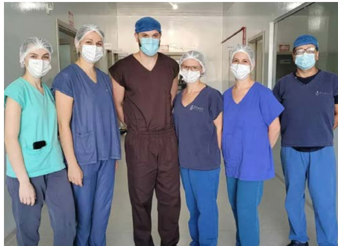
Equipe de profissionais que atuam nos procedimentos

Os procedimentos cirúrgicos são para pacientes com fraturas de mão, punho, antebraço, cotovelo, clavícula, patela, tornozelo, fratura no