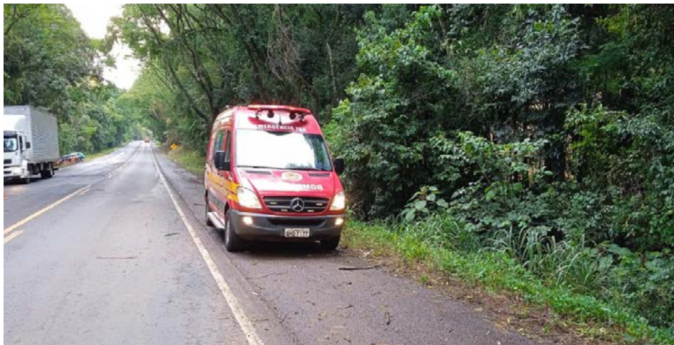
Corpo de Bombeiros foi até o acidente, mas jovem já estava sem vida

Perícias (IGP) foram acionados para o local.