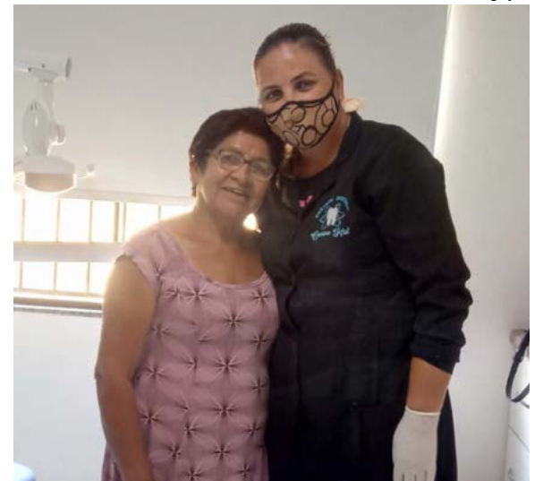
Interessados podem fazer avaliação com os dentistas da Unidade de Saúde