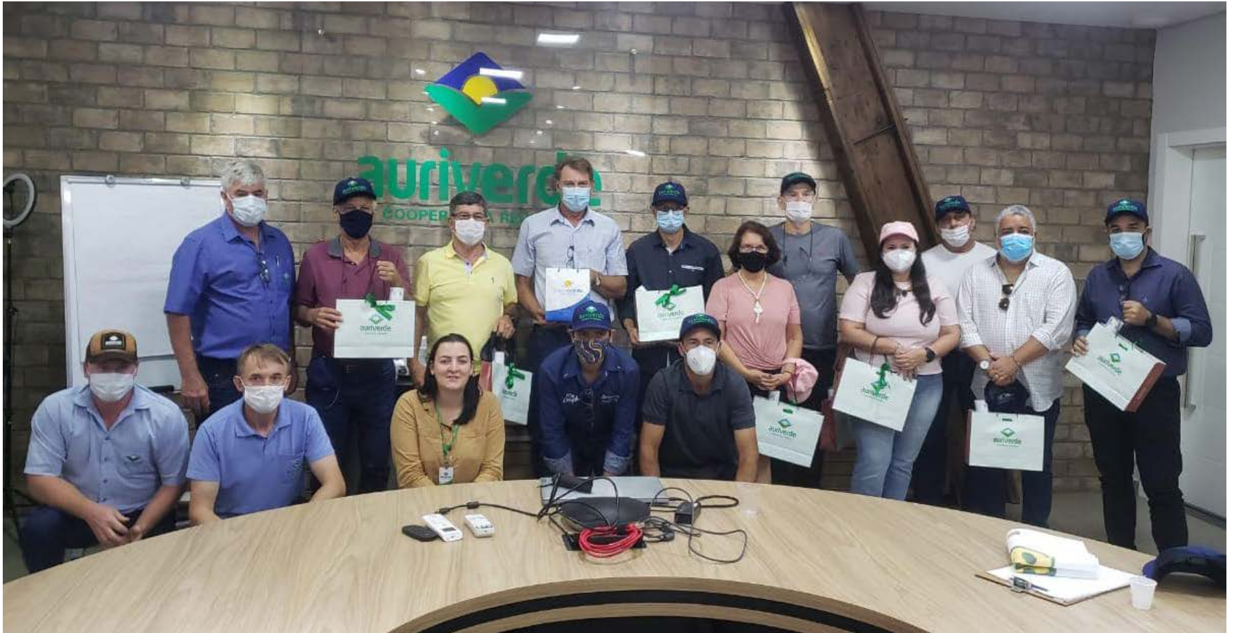
Visitantes receberam um kit com produtos da Realta e boné

A direção da Auriverde recebeu na última semana a missão técnica vinda do Rio de Janeiro. O grupo é formado por dirigentes, conselheiros, produtores rurais, sócios de cooperativas e dirigentes e colaboradores de cooperativas do Rio de Janeiro e foi coordenado pelo engenheiro agrônomo, palestrante, consultor do agronegócio, com mestrado na Nova Zelândia e doutorado na Austrália, Airton Spies.