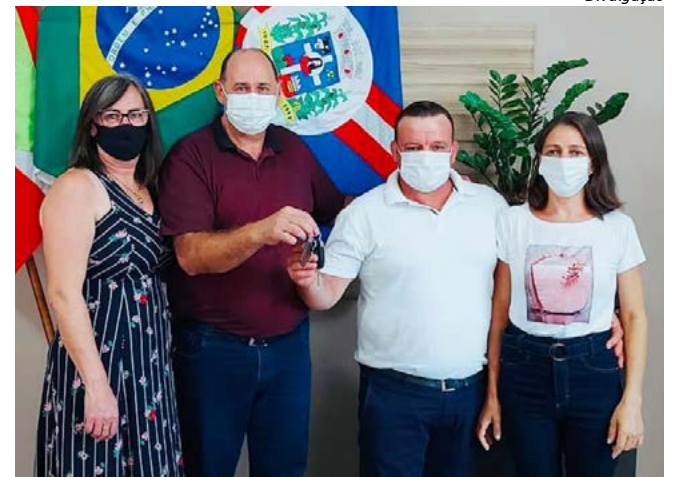
Entrega da chave ocorreu no gabinete do prefeito