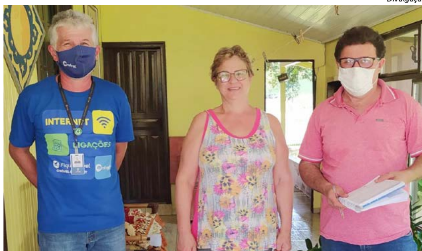
Visita para famílias que poderão ser beneficiadas

O secretário explica que o alto custo da fibra foi um dos empecilhos para o avanço do programa nessas propriedades mais distantes. Em nova reunião com empresa, foi criado um novo programa para atender essa demanda. As famílias estão sendo visitadas pelo secretário e equipe de Agricultura, com o objetivo de fazer o levantamento das propriedades que tem interesse no projeto. Até o momento já foram identificadas mais de 300 famílias que ainda não tem a internet por fibra óptica.