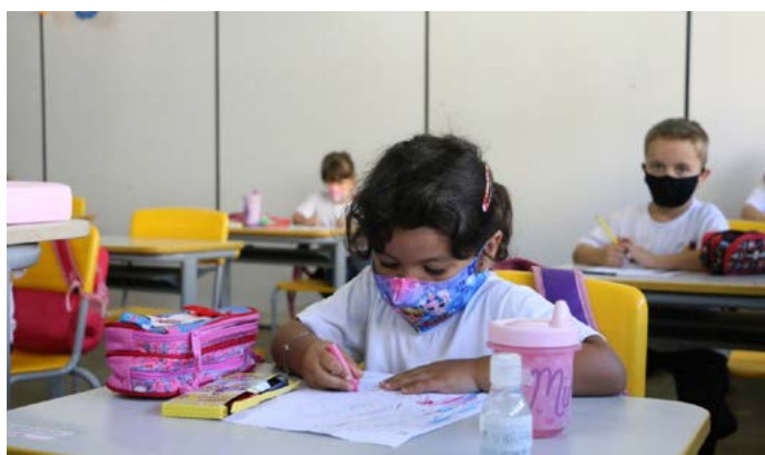
Alunos do pré-escolas já fazem o uso de máscara