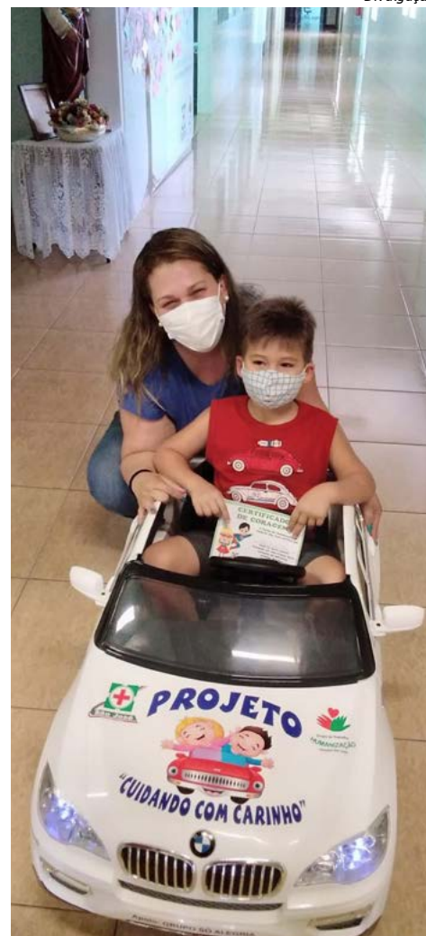
Além do passeio, crianças recebem o Certificado de Coragem

O carrinho foi adquirido antes da pandemia, e devido aos protocolos de segurança o projeto chegou a ser suspenso, e agora aos poucos vem sendo retomado. “Às vezes, o ambiente hospitalar é desconfortável, assim com passeio de carrinho pelos corredores faz com que as crianças se sintam mais seguras. É maravilhoso perceber a felicidade da criança ao entrar no veículo”, destaca a equipe.