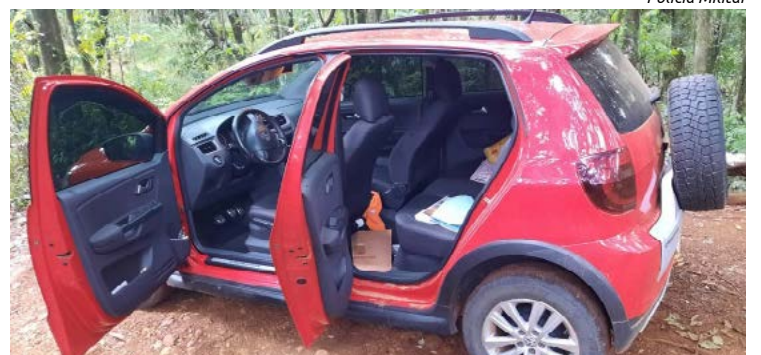
Carro foi recuperado pela Polícia Militar após o roubo