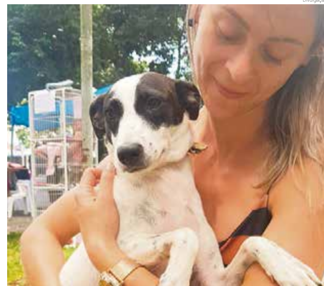
Ação possibilitou a adoção de oito animais

Conforme os voluntários, a Ong conta atualmente com R$ 16 mil em dívidas e só irá atender casos extremamente emergenciais. “É importante lembrar que denúncias podem ser feitas diretamente no site da Polícia Civil e do Ministério Público. Não temos mais condições, precisamos muito da ajuda da população”, destacam.