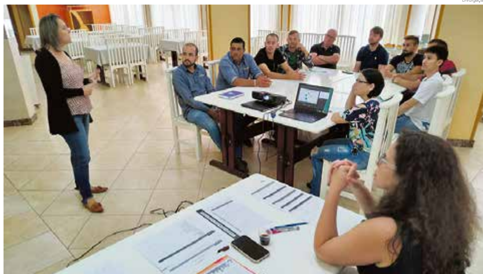
Encontro foi realizado no Maravilha Palace Hotel