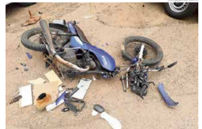
Motocicleta teve danos de grande monta após a colisão

corde na perna e edema na região frontal do crânio. Ele foi atendido pelo Corpo de Bombeiros e Samu e encaminhado ao Hospital São José de Maravilha. Já o motorista do Fiesta, um homem de 60 anos, saiu ileso.