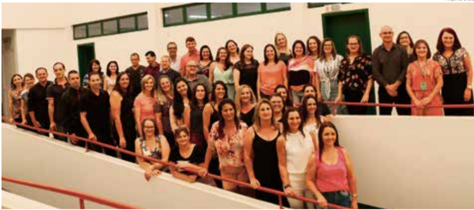
Na regional de Maravilha são 37 novos diretores que estão à frente das escolas

Durante o período em que os novos diretores permanecem no cargo eles vão passar por uma avaliação. “É a avaliação institucional que os alunos vão fazer, mas é algo positivo, pois foi uma escolha democrática”, finaliza o coordenador.