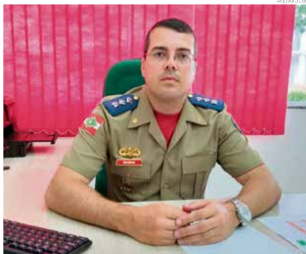
Comandante participou do Atualidades da Líder FM durante a última semana