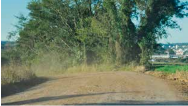
Linha Barro Preto vai ser ligada por asfalto até a BR-282