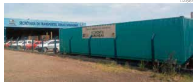
Contêiner é para descarte de eletrônicos

Informações podem ser obtidas pelo número (49) 3664 0776. “Não descarte resíduos de forma irregular, em terrenos baldios ou no Rio Iracema. Contamos com a colaboração de todos”, destacam.