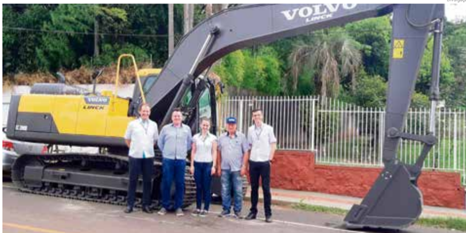
Cooperativa foi parceira na compra de mais uma escavadeira

Para o sócio, a escolha pela linha de crédito de recur-