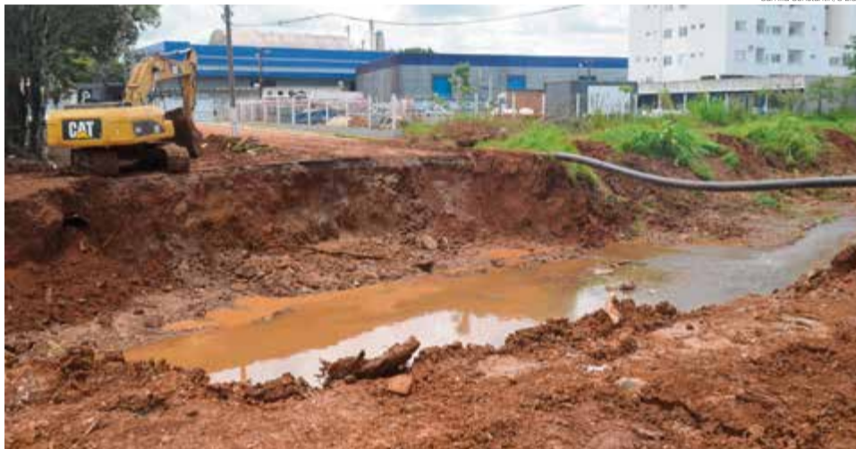
Trabalho é feito na Avenida Orlando Zawadski, que está com tráfego interrompido