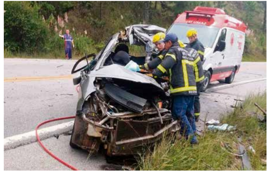
Veículo foi atingido por um caminhão, com placas de Chapecó

O veículo Fit foi atingido por um caminhão de Chapecó, que após a colisão parou em um barranco. Outro carro com quatro pessoas e placas de Passo Fundo (RS) tentou desviar e caiu em uma ribanceira na margem da rodovia. Os ocupantes do carro gaúcho sofreram ferimentos leves. O motorista do caminhão não se feriu.