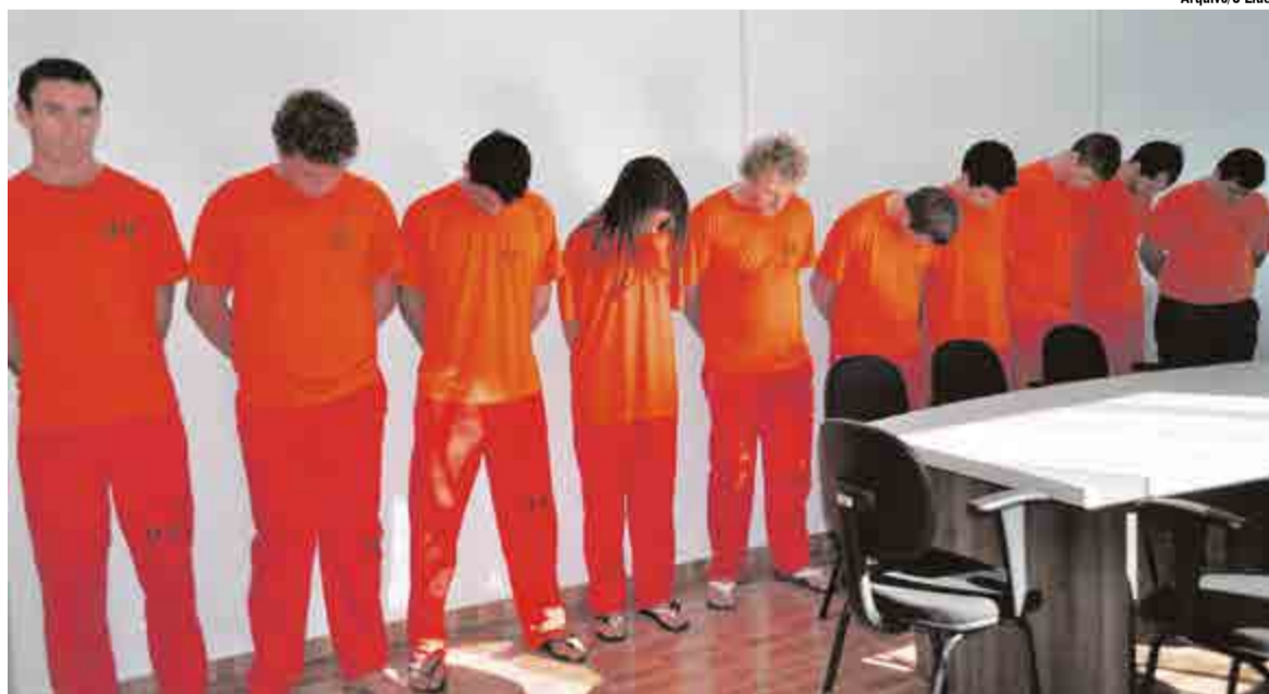
Dez pessoas foram presas durante a operação deflagrada em maio