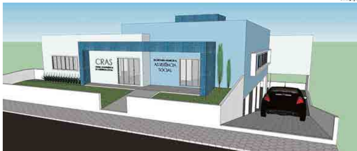
Nova sede do Cras será na Rua Portugal, no Loteamento Nosso Sonho

Em Maravilha o Cras possui também uma unidade descentralizada no Bairro Bela Vista, onde são oferecidas gratuitamente diversas oficinas, como teatro, violão, artesanato e música, além do atendimento à população que acessa benefícios sociais. Mesmo com a nova sede, a unidade descentralizada vai continuar atendendo normalmente no bairro.