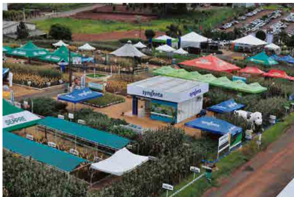
Feira conta com uma área de 205 mil metros quadrados de exposição das mais novas tecnologias para o agronegócio

Itaipu Rural Show. “Temos uma área de mais de 205 mil metros quadrados, onde está sendo exposta muita tecnologia, além de grande variedade de grãos, maquinários, lugares para diversão e lazer. Esta é uma das maiores feiras de segmento do país. Agradecemos aos patrocinadores do evento, aos poderes constituídos e a todas as agroindústrias que auxiliam para a feita acontecer sempre com sucesso absoluto”, salientou.