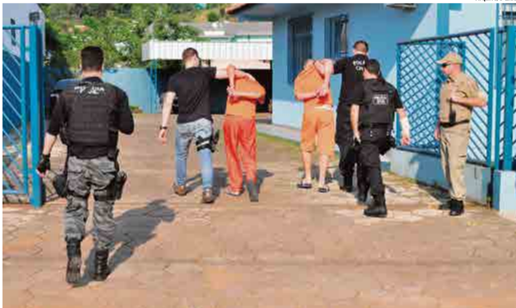
Operação Ostentação foi deflagrada no dia 17 de outubro de 2014