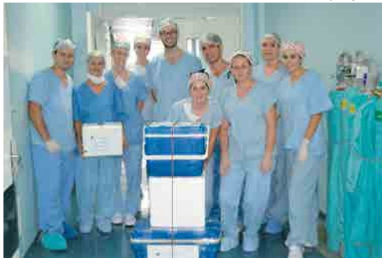
Ascom Hospital Regional SMO

A retirada dos órgãos, que é realizada como um procedimento cirúrgico normal e por cirurgiões com treinamentos específicos, contou com