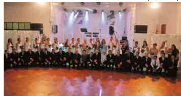
Noivos ganharam de presente a festa com decoração, buquê, coquetel, brinde, valsa e baile