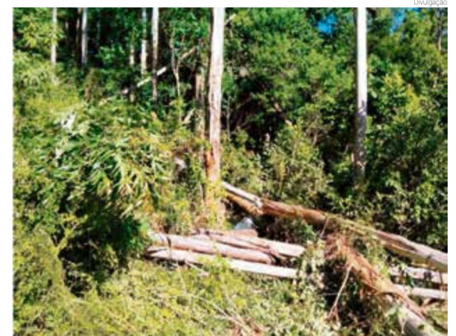
Homem foi atingido e morreu no local do acidente

A Polícia Militar também foi acionada. A Polícia Civil de Palmitos e o Instituto Geral de Perícias de Chapecô estiveram no local para realizar a perícia do acidente.