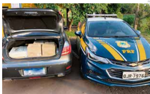
Produtos estavam sendo levados para Porto Alegre

O veículo e a carga foram encaminhados para a Receita Federal de Dionísio Cerqueira. O motorista foi qualificado e os dados encaminhados para a Polícia Federal.