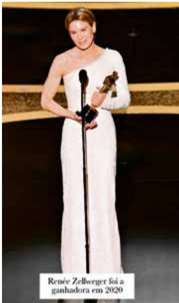
Renée Zellweger foi a ganhadora em 2002