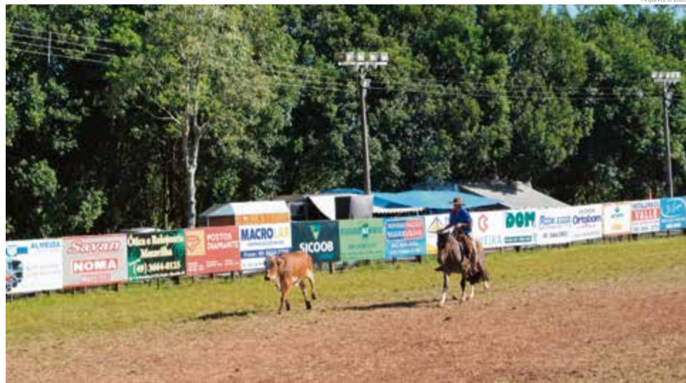
Registro da programação campeira no ano 2019

A abertura oficial está marcada para a tarde de sábado, a partir das 18h, com a Oração da Ave-Maria, presença de lideranças e apresentação dos patrocinadores. Neste dia, após o Duelo