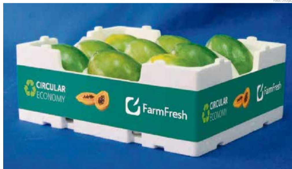
Lançamento em Berlim