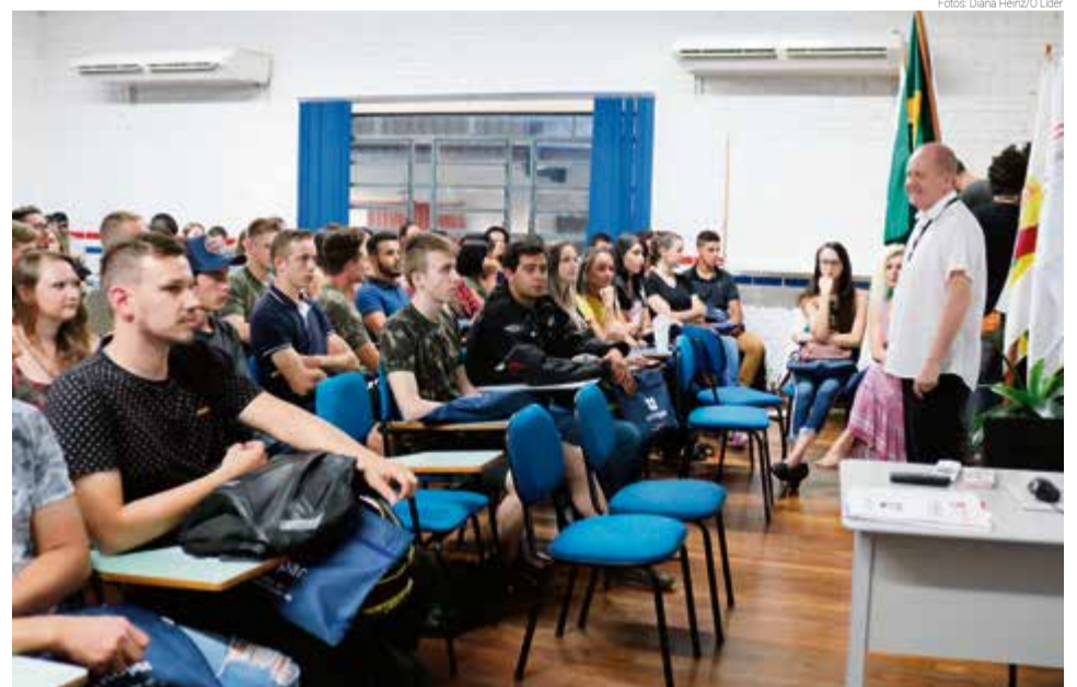
Novos alunos tiveram atividades especiais na quarta-feira (12)

Eles aprenderam sobre a metodologia de ensino da universidade, conheceram os tutores e aprenderam a acessar o portal do aluno. Também visitaram a estrutura e os laborató-