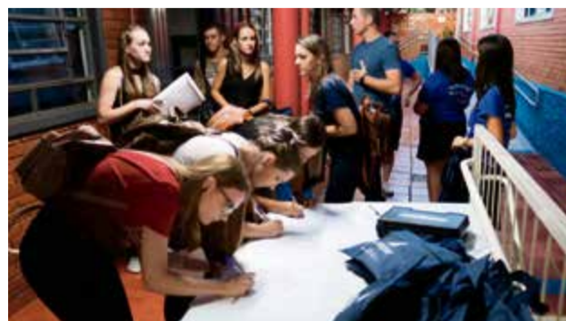
Ano letivo começa na segunda-feira (17)

rios, que são especializados e equipados, para Engenharia Civil, Elétrica, Agronomia, Embelezamento e Imagem Pessoal. Além dos cursos de bacharéis e licenciaturas, a Unopar conta com cursos tecnólogos, pós-graduação na área da saúde, gestão e MBA. O ano letivo começa na segun-