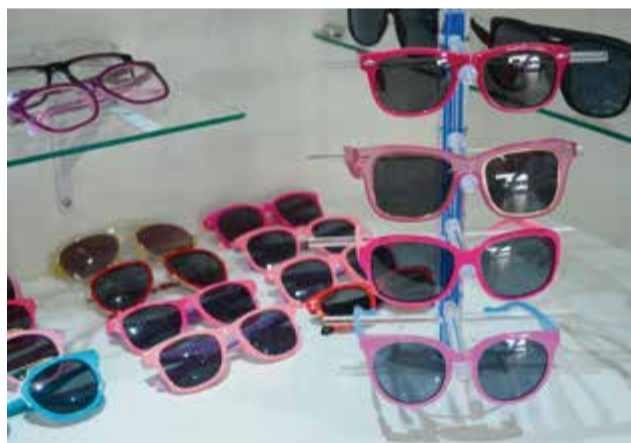
Espaço também possui opções infantis