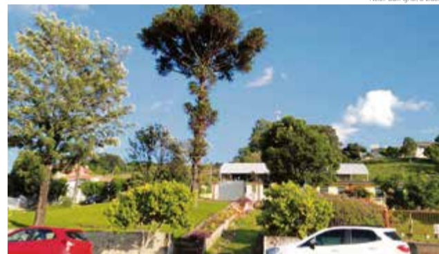
Prefeitura recebeu nesta semana autorização para cortar o pinheiro

O Centro de Cultura foi projetado pela Amerios e tem dois pavimentos. O primeiro terá a parte administrativa do Departamento de Cultura, Biblioteca Municipal Luiz Delfino, sala e vestiários para a Banda Marcial Cidade das Crianças, sala de oficina cultural, depósito e banheiros acessíveis. No segundo pavimento estão previstas salas para ofici-