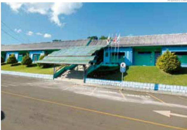
Aulas são ministradas no campus da Unoesc em Maravilha

REFORÇO Ato foi realizado no último dia 7, na Coordenadoria Regional de Maravilha