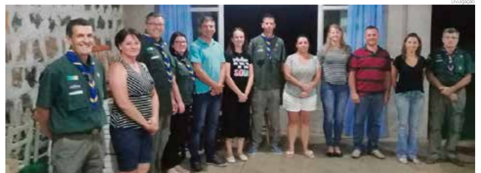
Encontro foi realizado na noite de segunda-feira (10)

Na noite de segunda-feira (10) reuniram-se associados, dirigentes e escotistas do Grupo Escoteiro Raízes para assembleia geral, na sede da entidade. Como ordem do dia, estiveram em pauta a prestação de contas 2019, mensalidades 2020, representantes para assembleia regional, eleição de diretoria (gestão 2020/2021) e atividades a serem realizadas pelo grupo em 2020. "Desejamos sucesso à nova gestão e aproveitamos para lembrar que hoje (15) as atividades com os jovens terão início", finalizam.