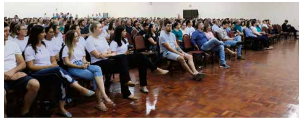
Centenas de pessoas participaram da palestra