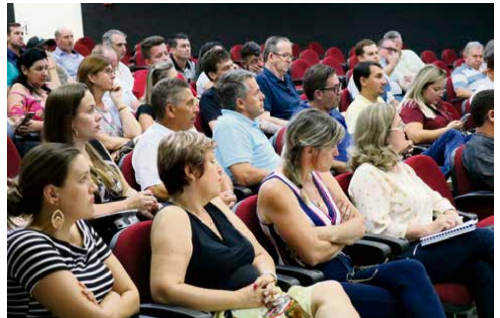
Moradores acompanharam o encontro na Câmara de Vereadores

6 de maio (eleitores) Último dia para regularizar a situação eleitoral junto à Justiça Eleitoral. Assim, pessoas que perderam o cadastramento