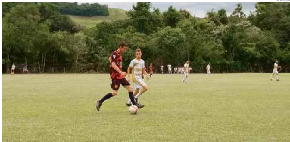
Finais serão nas modalidades de futebol masculino e futebol suíço feminino

Desta forma ficaram definidos os confrontos para decisão de terceiro lugar e a final de ambas as categorias, em data ainda a ser marcada: