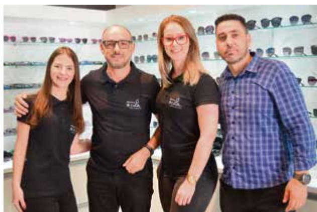
Equipe convida a todos para conhecer as novidades

intermediário ou perto. Quem quiser conhecer mais sobre este sistema pode ir até a loja e tirar dúvidas, bem como conhecer os produtos disponíveis.