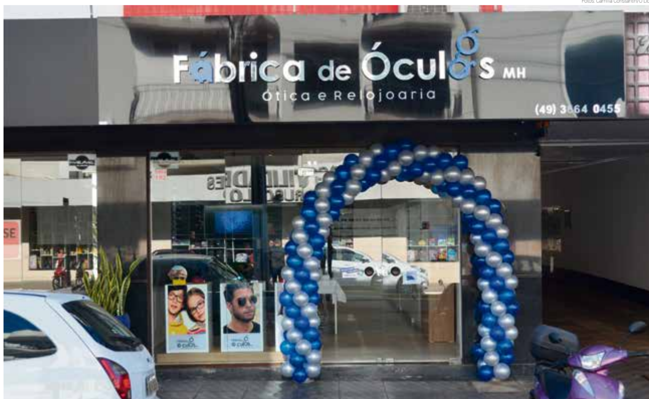
Empreendimento fica na área central de Maravilha