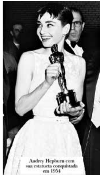
Audrey Hepburn com sua estatueta conquistada em 1954