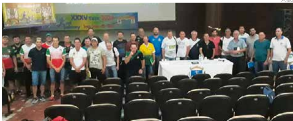
Neste ano competição será no Brasil, em Santo Cristo-RS

A 35ª edição do Torneio Internacional de Integração Carlos Culmey será na cidade brasileira de Santo Cristo-RS, nos dias 6, 7 e 8 de março. A delegação de Maravilha terá mais de 100 atletas nas modalidades de bocha masculino e feminino; bocha 48 masculino; bolão masculino e feminino; corrida rústica masculino e feminino; futebol sete veteranos masculino; futebol sete máster masculino; futsal masculino e feminino; voleibol masculino e feminino; e vo-