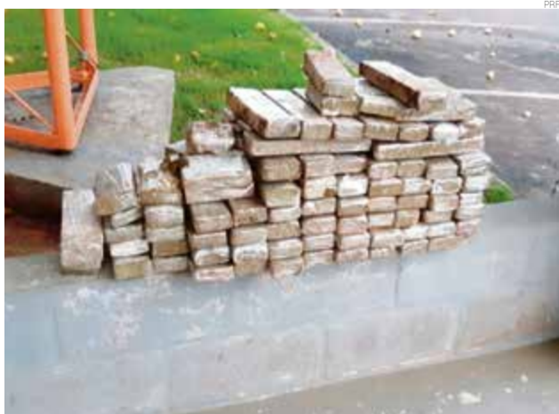
Casal foi pago para transportar a droga para o Rio Grande do Sul

O homem, de 26 anos, e a mulher, de 21 anos, disseram que buscaram a droga em Ponta Porã (MS) e a levariam até Santa Maria (RS).