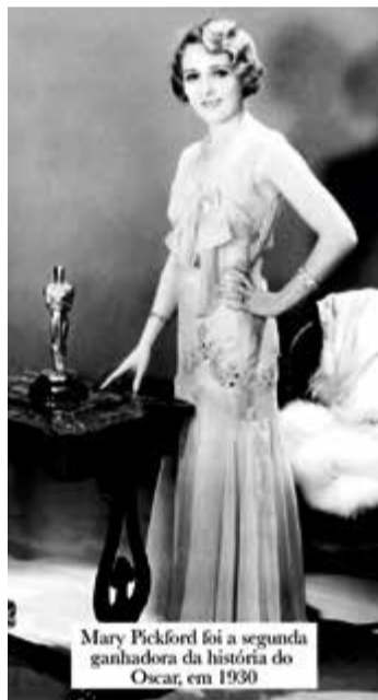
Mary Pickford foi a segunda ganhadora da história do Oscar, em 1930