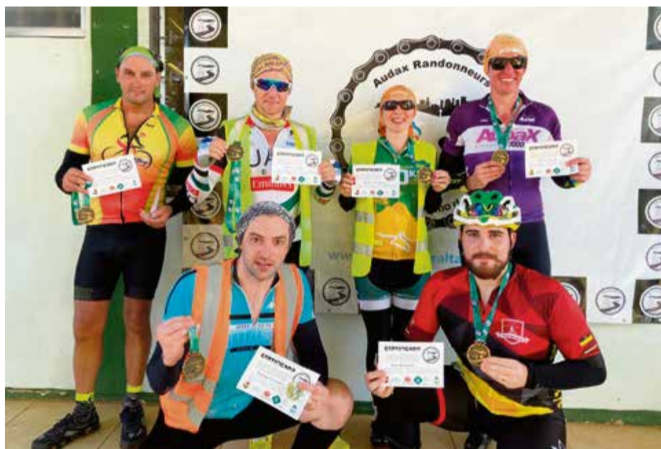
Esta foi a primeira prova de resistência no ano

Ainda este ano, o trio pretende participar de outras competições deste nível e superar a marca do ano passado.