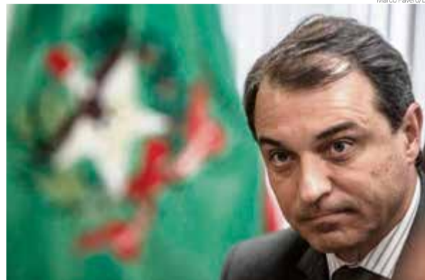
Assessoria do governador diz que Carlos Moisés deve visitar região em breve

secretários de Moisés já visitaram várias vezes o Extremo-Oeste no último ano e o secretariado também faz parte do governo, não apenas o governador. Sobre uma possível visita de Carlos Moisés, a assessoria informou que em breve o governador estará na região junto com deputados e lideranças. Não há uma data exata no momento. O governo informou que por duas vezes teve que cancelar a agenda nos municípios da região: uma por não conseguir voo em razão do clima e outra por ser chamado a Brasília de forma urgente pelo presidente. Sobre o restante das críticas de Gelson Merísio, a assessoria informou que o governador não vai comentar.