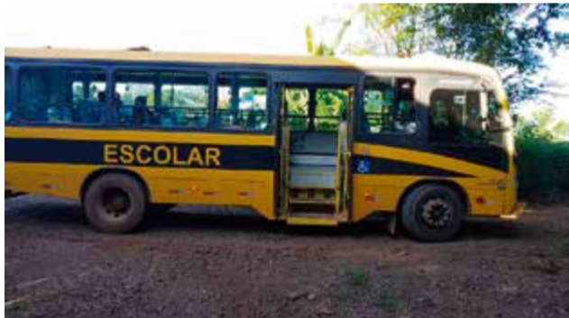
Fiscalização ocorre durante o trajeto no interior