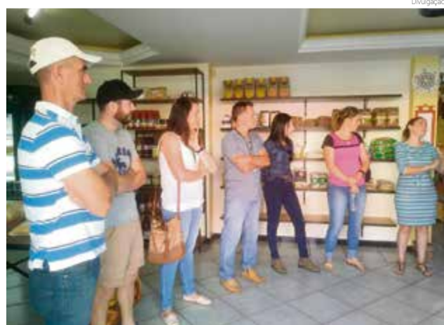
Visita à propriedade rural em Xanxerê

De acordo com o secretário de Agricultura, Pedro Gilberto Ioris, a intenção é buscar experiência e conhecimento para implantar em Maravilha. O município está com o projeto para produção de orgânicos em andamento e as famílias interessadas já passaram por diversas etapas para a certificação.