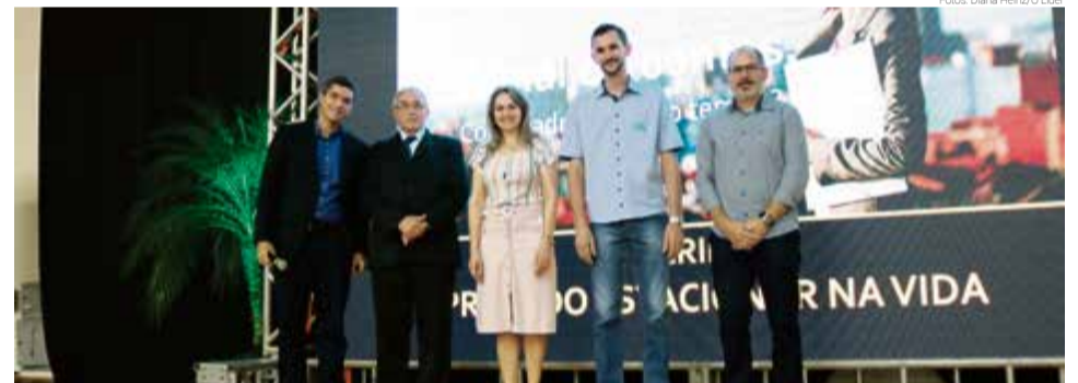
Evento foi realizado no Maravilhas Park Hotel