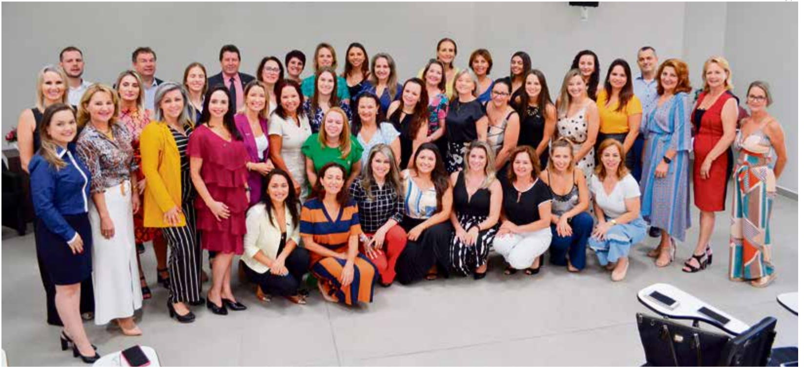
Posse foi realizada em Maravilha e recebeu diversas lideranças estaduais

Com o desafio estadual, ela acredita que trará para mais perto da região o movimento e colocará o Extremo-Oeste em posição de destaque, assim como foi