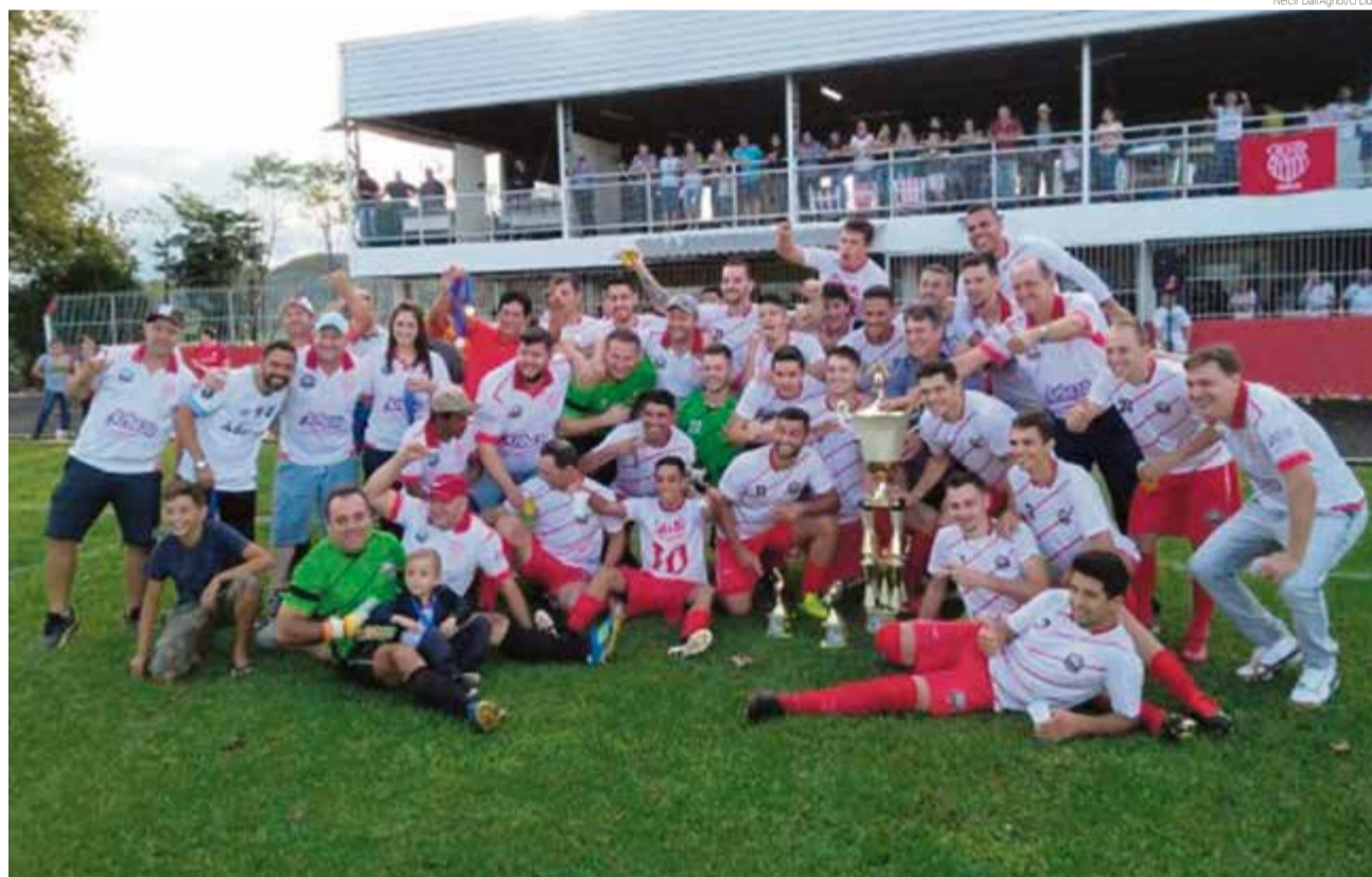
Juventude de Caibi foi campeã da edição de 2019 em decisão contra o Palmeiras de São Miguel da Boa Vista

Quem vota em Maravilha e não consta na lista poderá jogar para qualquer equipe participante do evento. Dia 27 de fevereiro é a data/limite para transferência de título de eleitor. Para participar da partida o atleta e dirigente devem apresentar carteira de identidade original, carteira de motorista original ou passaporte.