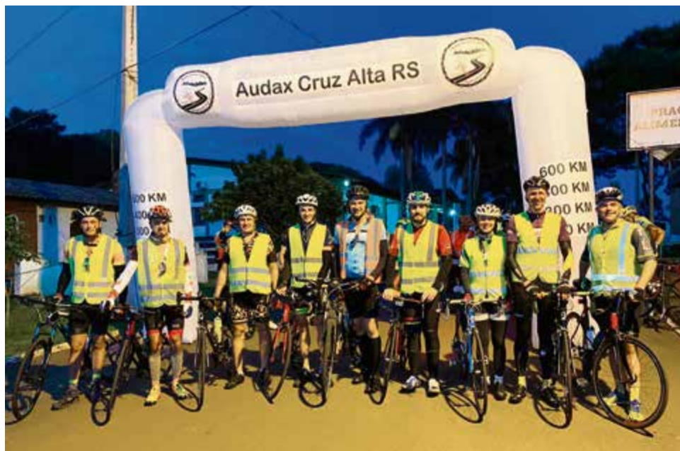
Prova contou com outros atletas da região