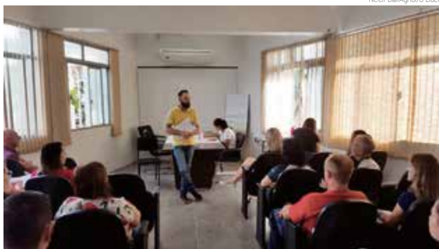
Encontro reuniu parceiros da Sala de Situação