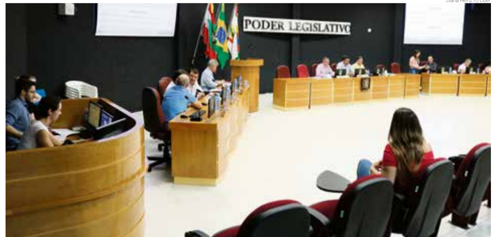
Três projetos de lei foram aprovados