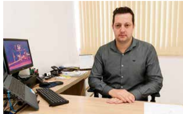
Secretário diz que ainda restam R$ 400 mil de inadimplência do ano passado