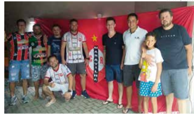
Torcida organizada do CRM foi fundada na noite de quinta-feira (13)

Folle lembra que o CRM admite novos sócios. "Primeiramente a pessoa deve ser apaixonada pelo CRM, adquirir a camisa, pagar a mensalidade, que ainda não teve o valor definido, e posteriormente cada sócio vai receber a carteirainha", ressalta o dirigente.