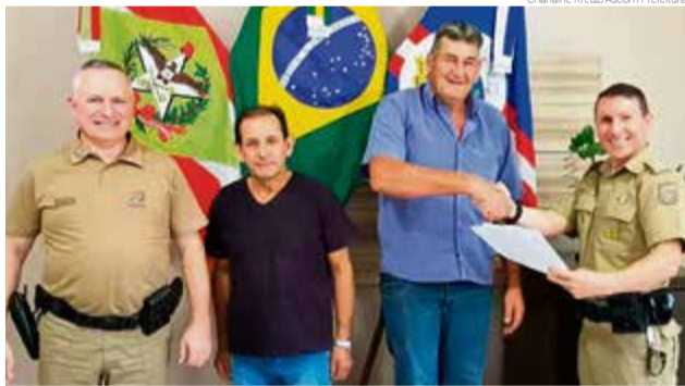
Encontro contou com entrega de ofício

O presidente do Legislativo ressalta que é muito importante alinhar ideias e objetivos para melhorar a segurança. "Cada um sabe seus anseios e dificuldades. Unidos podemos enfrentar melhor os problemas e encontrarmos soluções", afirma.