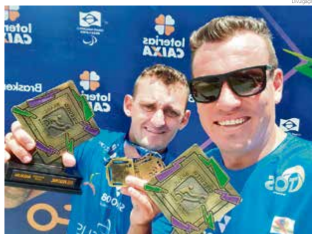
Atleta, ao fundo, acompanhado pelo professor, com troféus conquistados