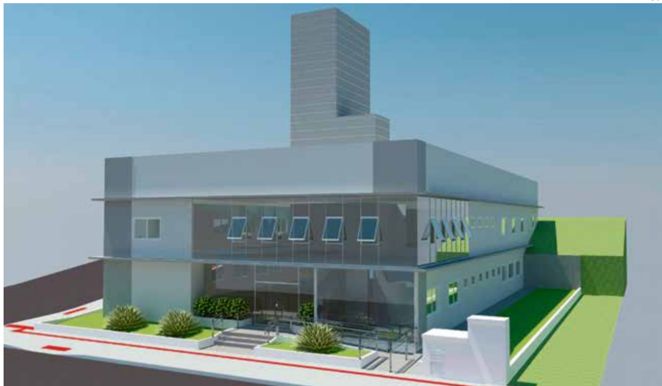
Obra de dois pavimentos será construída ao lado do Centro Educacional Raymundo Veit

nas culturais, sala de dança, banheiros, além de um auditório para 248 pessoas com palco e camarins. A área total da obra é de 1.046 metros quadrados.