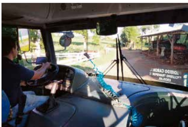
Monitoramento visa garantir a segurança dos usuários

CONFIRMADO Para presidente local da sigla, ex-vereador tem condições de administrar o município