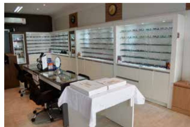
Loja conta com produtos de marcas renomadas e preços acessíveis