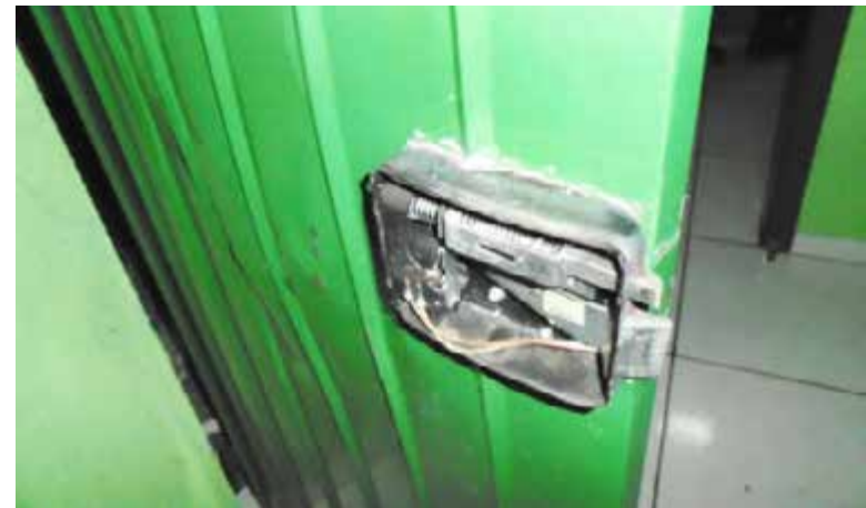
Com barra de ferro quebraram o cadeado da porta

Detentos conseguiram arrancar uma barra de ferro de uma das grades da porta da cela de isolamento