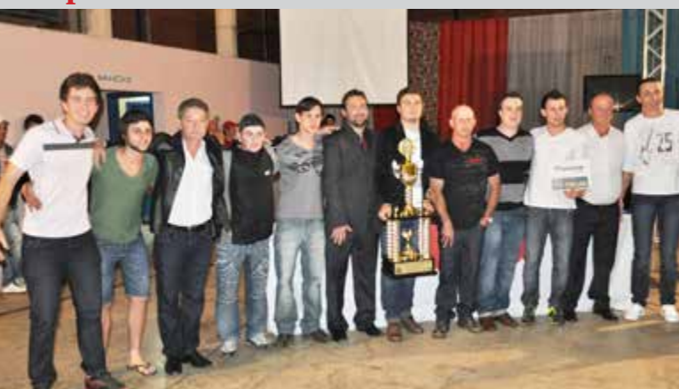
Campeão geral da 2ª Jasflor com 503 pontos – Equipe da Cia do Buteco