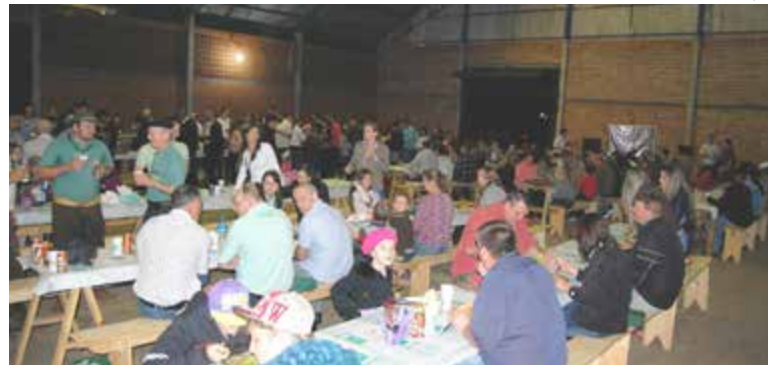
Cerca de 200 pessoas participaram do jantar