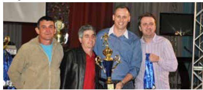
Equipe do Ajax