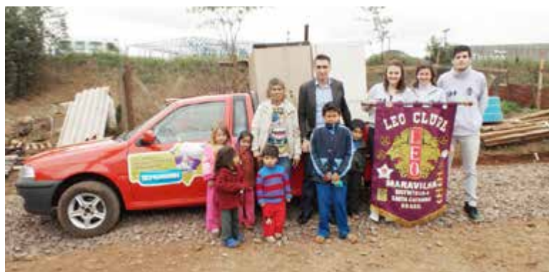
Família carente da Linha Barro Preto recebeu um refrigerador

de Maravilha. “Sentimo-nos muito felizes em conseguir ajudar algumas famílias carentes do nosso municí-