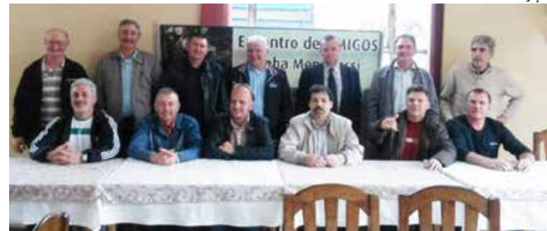
Amigos se reencontraram na Churrascaria 7 de Setembro

Conforme Dércio este foi apenas um encontro, o primeiro de muitos que pretendem fazer no decorrer dos anos.