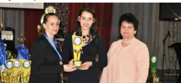
Categoria livre feminino Equipes do Milan e Real Madrid