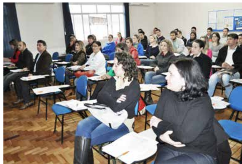
Responsáveis pelo setor das empresas participaram da oficina