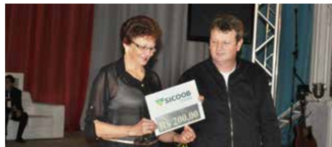
Com 268 – Equipe do Juventude de Linha Guarani