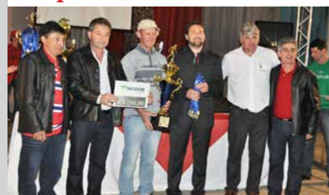
Equipe Posto Flor do Sertão/ Transportes Zanluchi