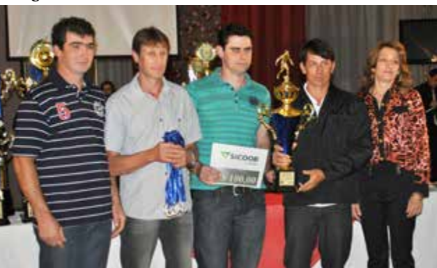
Equipe do América