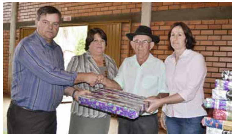
Idosos recebem uma lembrança em homenagem ao Dia do Idoso