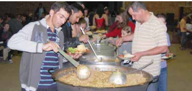
Galinhada, vaca atolada e acompanhamentos fizeram parte do cardápio