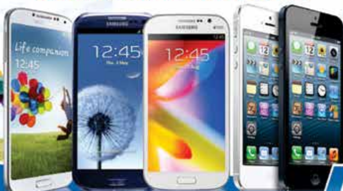
SAMSUNG GALAXY S4