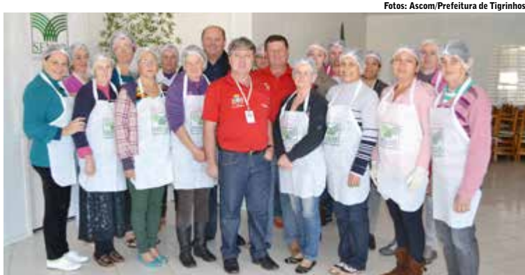
Prefeito, secretário e engenheiro com as participantes do curso

De acordo com o prefeito, o curso faz parte da programação de aniversário de Tigrinhos e o principal objetivo foi proporcionar às mulheres um período de aprendizado e descontração.