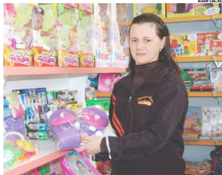
Empresária tem expectativas de ampliar as vendas em relação ao mesmo período de 2012

Levantamento do Instituto Mapa, realizado de 10 a 16 de setembro nas 20 cidades de maior Índice de Potencial de Consumo em Santa Catarina, apontou que o gasto médio com presentes para o Dia das Crianças deste ano deve ser de R$ 136,00. A pesquisa, divulgada pela Federação das Câmaras de Dirigentes Lojistas de Santa Catarina (FCDL/