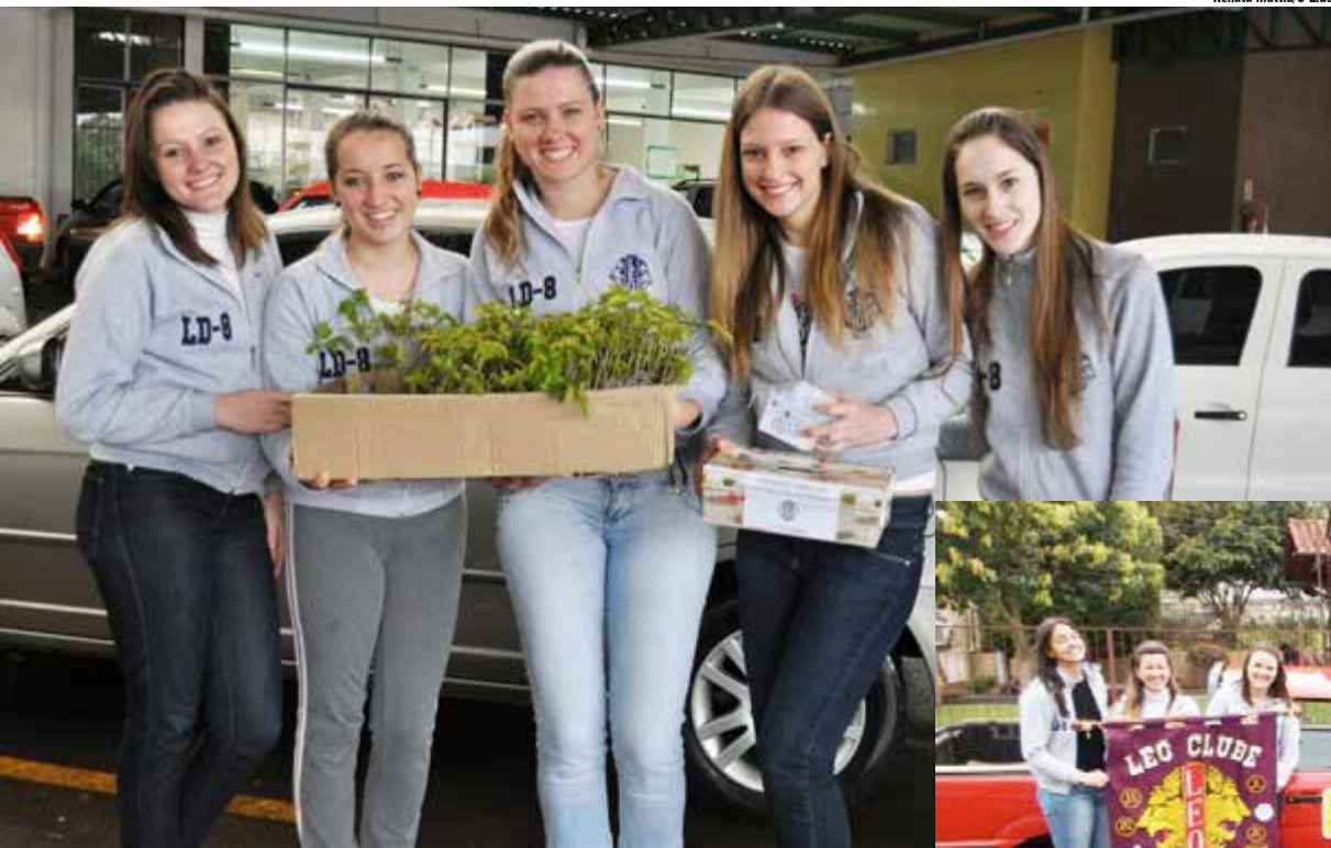
Renata Mattia/O Líder

Famílias carentes dos alunos da APAE e a própria instituição foram beneficiadas com eletroeletrônicos pelo LEO Clube em parceria com a Loja Schumann