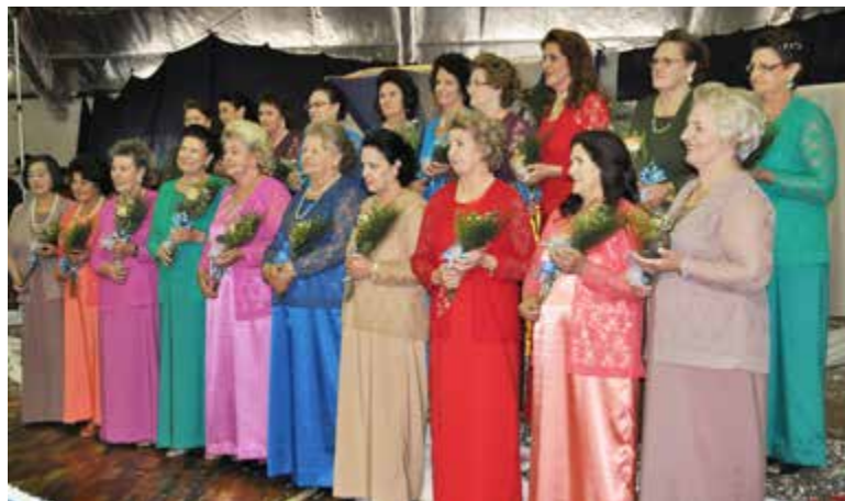
20 candidatas desfilaram no último sábado (28)