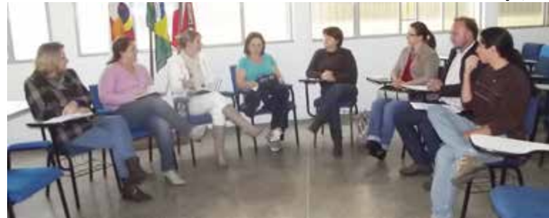
Esta foi a primeira reunião que visou o Carnaval 2014 em Maravilha