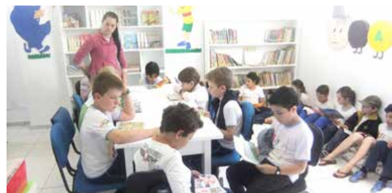
Alunos também aproveitaram para ler alguns livros