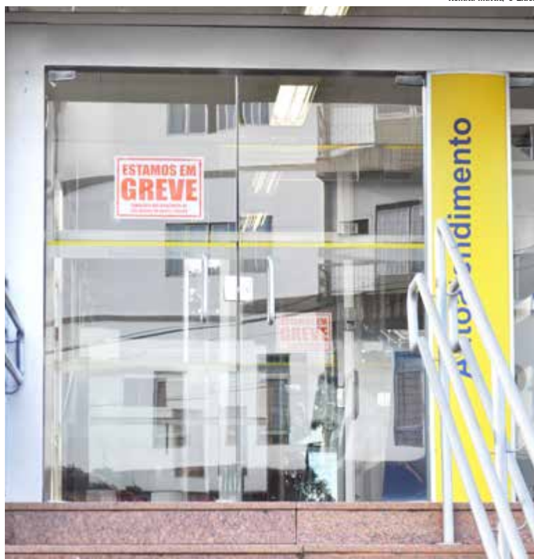
Agências do Banco do Brasil e Caixa Econômica Federal continuam paralisadas em Maravilha

Para pagar contas, os bancos orientam que o cliente utilize os diferentes canais de acesso disponíveis — e não as agências. É possível utilizar caixas eletrônicos, internet banking, aplicativos no celular (mobile banking), operações bancárias por telefone e também pelos correspondentes (casas lotéricas, redes de supermercados e demais estabelecimentos comerciais credenciados).