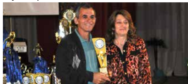
Categoria veterano Equipe do Marmeleiro