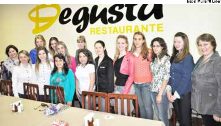
Secretárias participaram de atividades dinâmicas e receberam homenagem