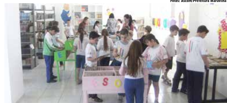
Alunos do 3º ano da E.E.B. Santa Terezinha conheceram a biblioteca