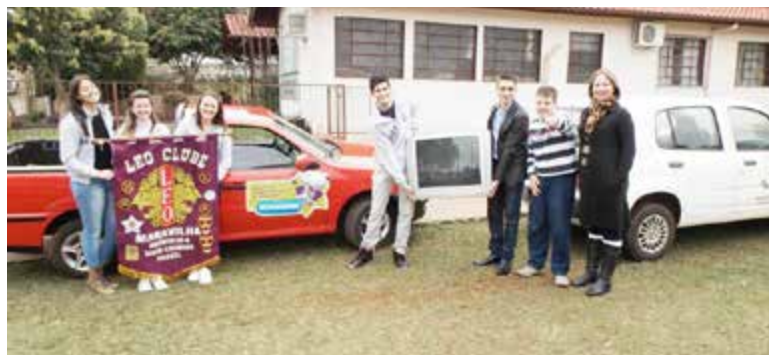
Um televisor de 21 polegadas foi entregue para a APAE

A entrega aconteceu na última semana, e contou com a presença de um responsável da Loja Schumann e de alguns integrantes do LEO Clube