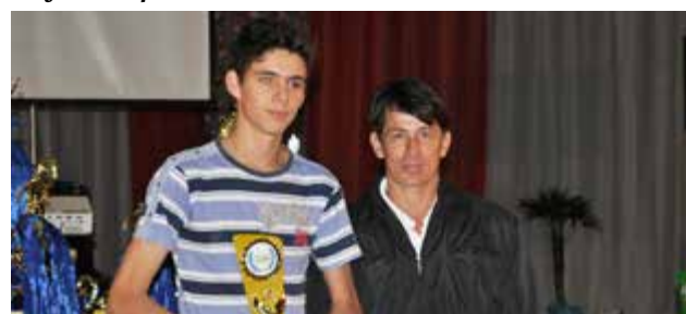
Categoria livre masculino Equipe Tarairás