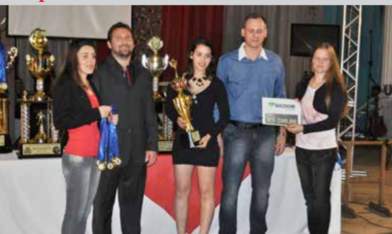
Equipe Real Madrid