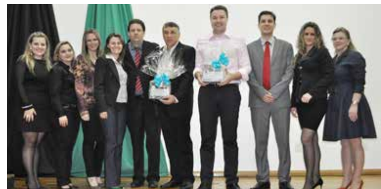
Organizadores do 1º Fórum Empresarial juntamente com o presidente do Sicredi Alto Uruguai e o palestrante da noite