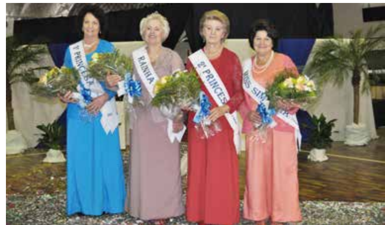
As novas soberanas da 3ª idade de Maravilha foram escolhidas num belo desfile organizado pela Secretaria de Assistência Social