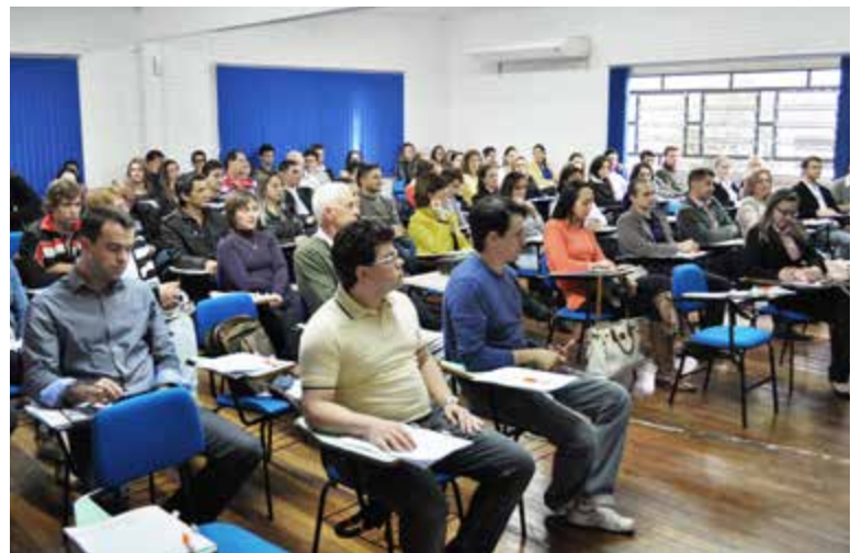
A oficina contou com o maior número de participantes