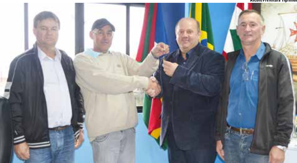
Funcionário se despede da profissão e entrega a chave da máquina que trabalhava ao prefeito