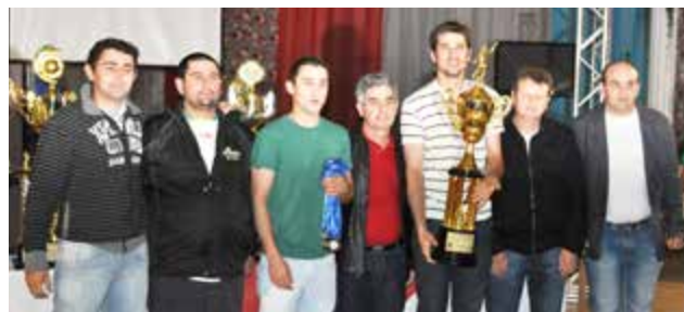
Equipe da Juventude da Linha Guarani