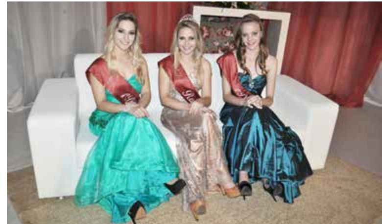
Rainha e princesas entregaram a faixa na noite de sexta-feira