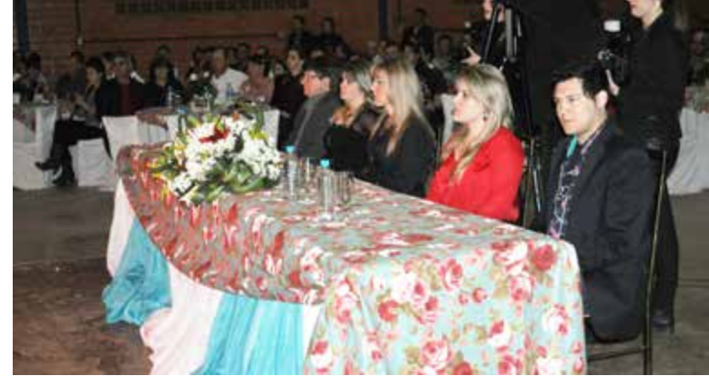
Cinco jurados avaliaram as candidatas