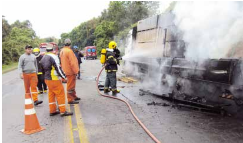
As chamas estavam concentradas na parte traseira do veículo, onde estava a carga

Segundo a guarnição, foram montadas duas linhas de mangueiras, sendo que o combate iniciou no foco maior do incêndio e resfriamento das partes adjacentes. Após o pedido de auxílio a uma máquina tipo retroescavadeira e um caminhão guincho foi efetuada a retirada do material combustível do caminhão. O fogo atingiu em torno de 60% da carga e foi salva a parte da cabine do caminhão.