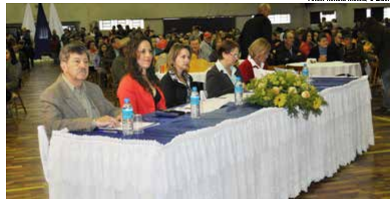
Jurados tiveram a dura missão de escolher as soberanas