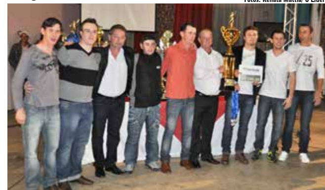
Equipe do H2O Vilson Cabeleireiro