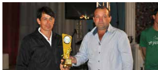
Categoria veterano Equipe do América