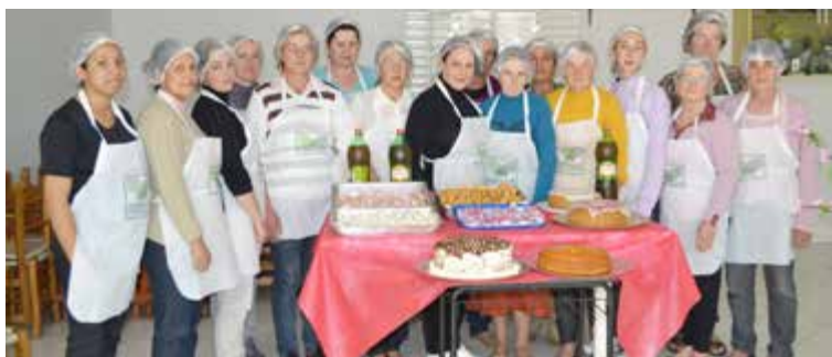
Mulheres apresentaram e degustaram as guloseimas que foram fabricadas