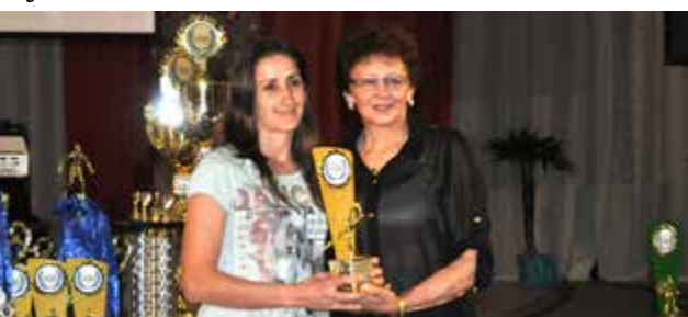
Categoria livre feminino Equipe do Barcelona