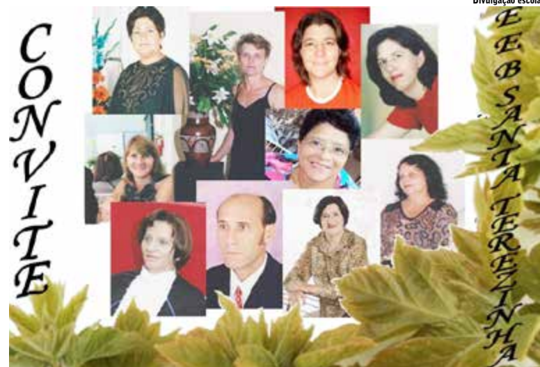
Celebração de reconhecimento acontecerá no próximo sábado (05)