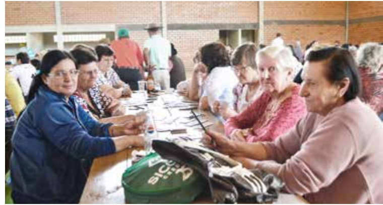
Jogos de baralho animaram os idosos