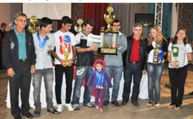
Com 343 pontos – equipe do Marmeleiro