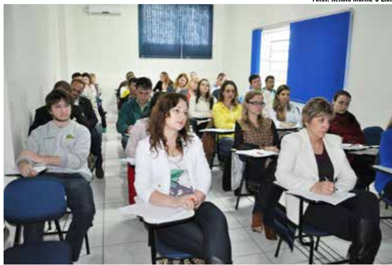
Os olhares ficaram atentos para a brilhante explanação