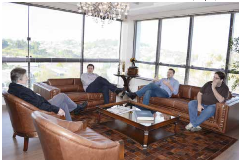
CDL/Associação Empresarial Maravilha