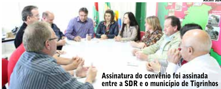
Assinatura do convênio foi assinada entre a SDR e o município de Tigrinhos