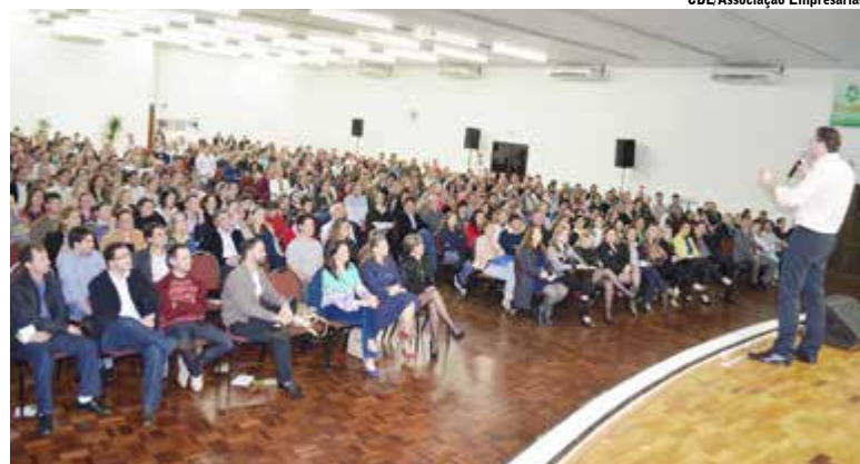
Mais de 650 pessoas prestigiaram o 1º Fórum Empresarial