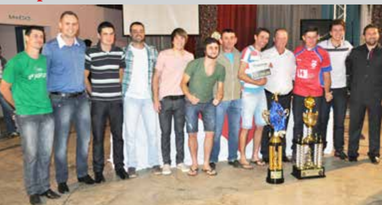
Associação Atlética Independente