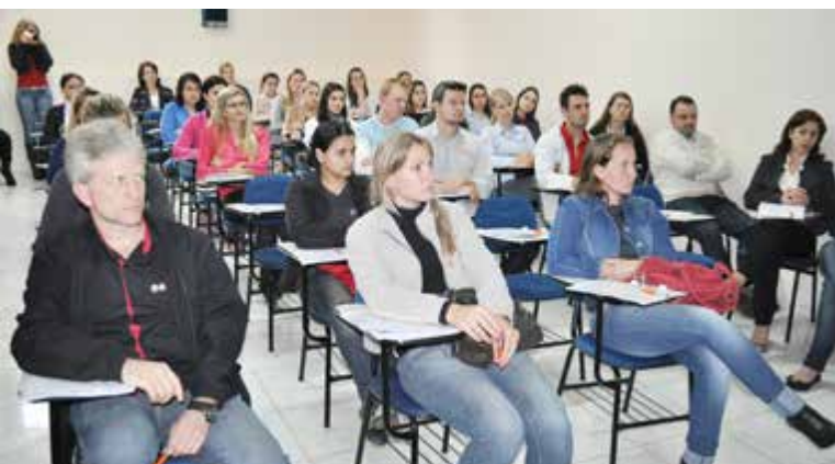
Participantes estiveram atentos às explicações