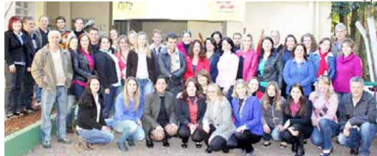
Integradores e multiplicadores dos NTEs participaram do encontro