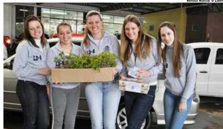
Pedágio foi realizado nos estacionamentos dos mercados de Maravilha