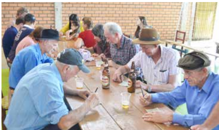
Bingo também foi uma das atrações