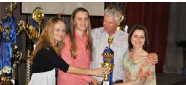
Equipe Associação Atlética Independente