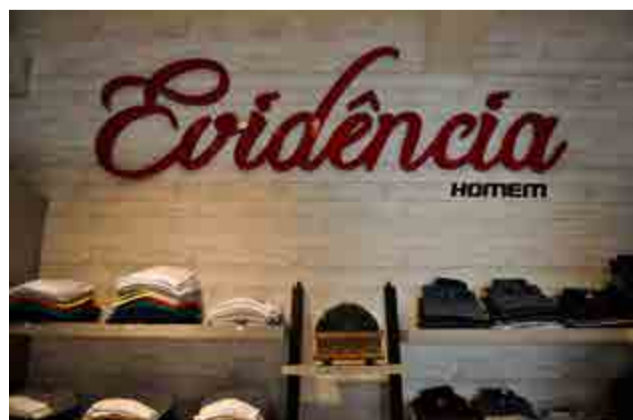
Moda homem incrementa o mix de peças...