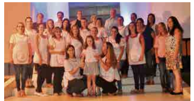
Equipe lembra que as matrículas estão abertas até segunda-feira (13)