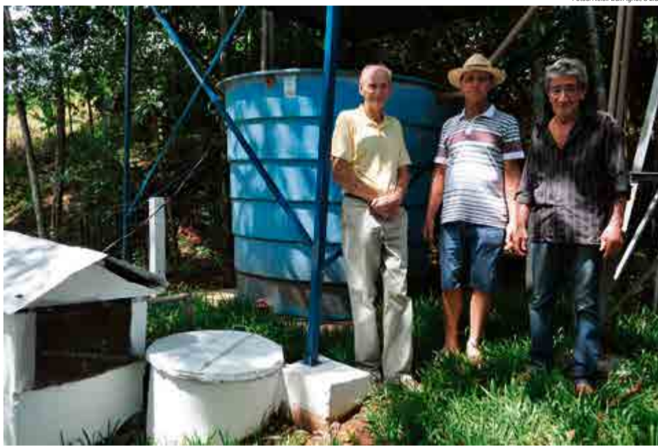
Integrantes dizem que fonte não vai secar e sentem orgulho do trabalho