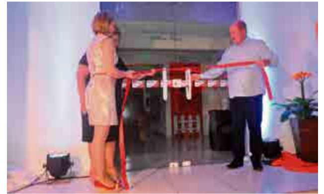
Após o desenlace da fita, os participantes puderam conhecer as novas instalações