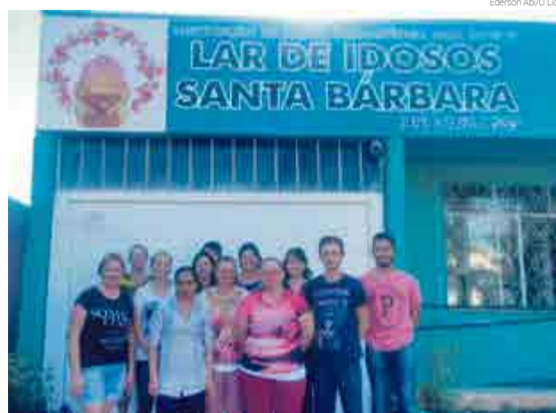
Lar Santa Bárbara está localizado no Centro de Maravilha

Jomertz relata que na maioria dos casos os idosos vão para a instituição pela correria do dia a dia. “As famílias optaram por acomodar o idoso em um lar em comum acordo com ele. Outros também estavam em outros lares, como no Rio Grande do Sul,