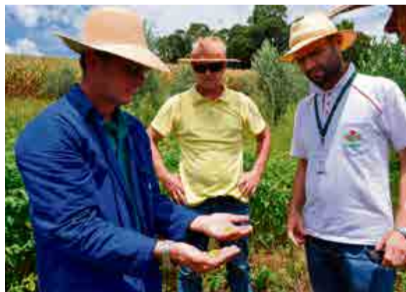
Colheita foi realizada de forma manual pela equipe da Epagri de Chapecó