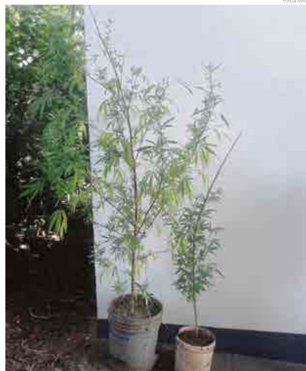
Polícia Militar Exemplares estavam em vasos em uma área aberta

As plantas foram recolhidas pela Polícia Militar e entregues à Delegacia de Polícia Civil para apuração criminal do plantio e identificação da autoria.