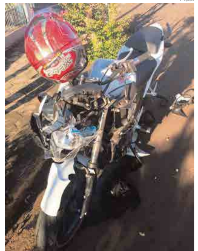
Motocicleta ficou danificada ao colidir contra veículo

O homem era funcionário da empresa maravilhense RPM há mais de um ano. Ele morava em Maravilha, deixa um filho menor de idade e esposa.