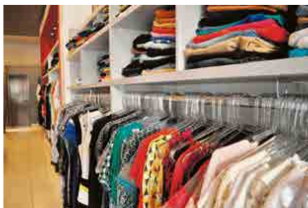
...Que é composto por roupas femininas, para gestantes e plus size