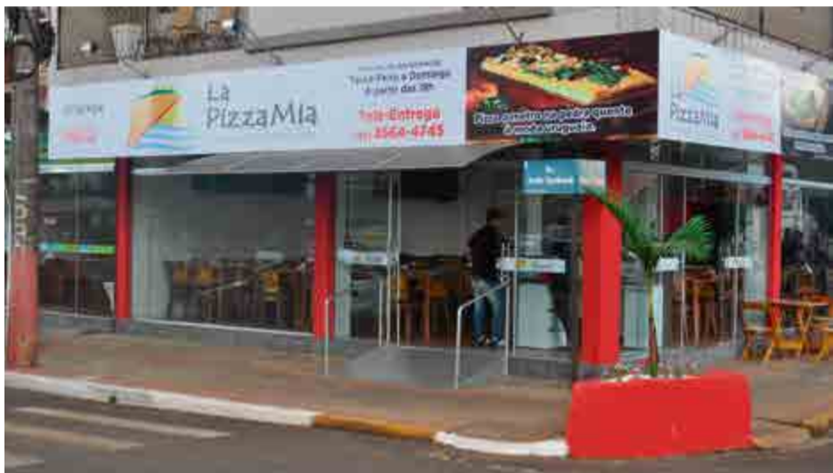
Novo empreendimento serve exclusivamente pizza à moda uruguaia

também para experimentar a novidade", destaca.