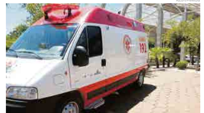
Ambulância já está no município para uso do Samu