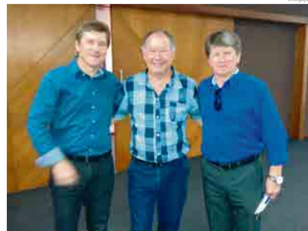
O 4º Curso de Presidentes das apaes de Santa Catarina foi realizado nos dias 4 e 5 de fevereiro

Além dos alunos do município, a unidade atende pessoas de outras cidades através de acordos com as prefeituras. "Nós estamos de portas abertas, oferece-