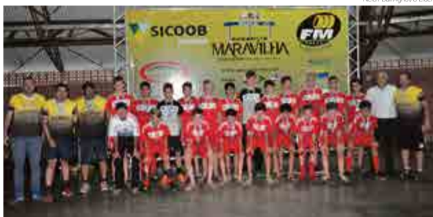
Das equipes de Maravilha, a de melhor campanha foi a Acema/DME/Maravilha, na categoria sub-15, com o 4º lugar

Na Copa, as categorias em disputa foram sub-11, 13, 15 e 17. Clube Recreativo Maravilha (CRM) (sub-17), Apaf/Acema/Maravilha (sub-11 e sub-13) e Acema/DME/Maravilha (sub-15) representaram Maravilha. O CRM, campeão da categoria no ano passado, foi eliminado no dia 1º. O time caiu nas quartas-de-final, derrotado pelo Liberdade/Genoma Colorado de Novo Hamburgo/RS pelo placar de 1 a 0. Já as equipes da Apaf disputaram apenas a primeira fase.