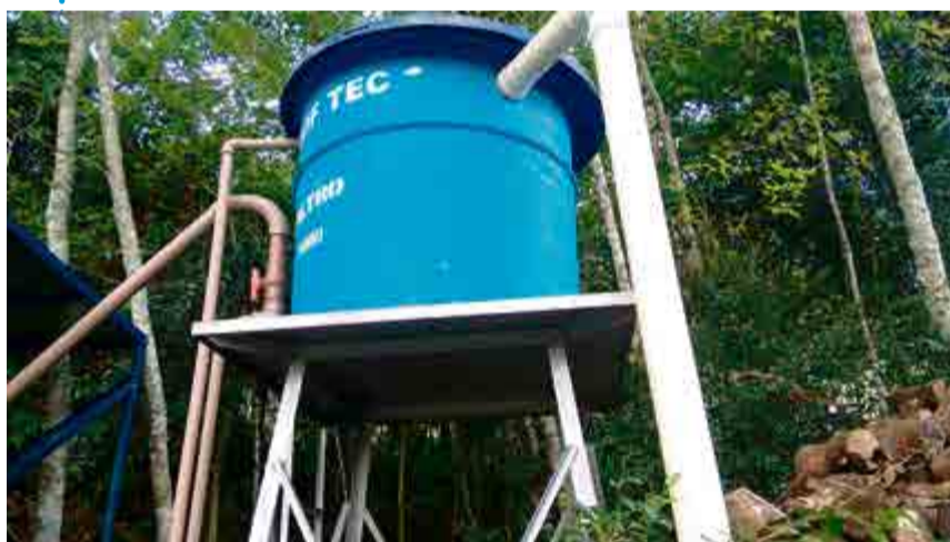
Água captada passa por filtro e tratamento

Alebrandt afirma que o tratamento da água é com o mesmo sistema feito em poços artesianos. Existe uma caixa de cloro, filtrada e controle de qualidade. "Tratada 100% para uso humano, tudo automático", explica.