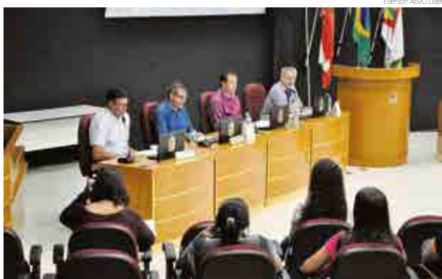
Público participou da segunda sessão ordinária do ano

De acordo com ele, o objetivo do grupo de trabalho é tratar da criação de uma rodovia com asfalto até o município de Bom Jesus do Oeste, com extensão e tra-