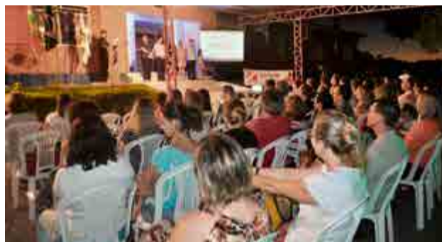
Cerimônia contou com a presença de pais, alunos e lideranças