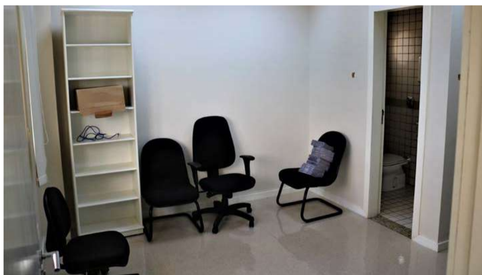
Sala é integrada com outro ambiente e a inauguração está prevista para o dia 8 de março