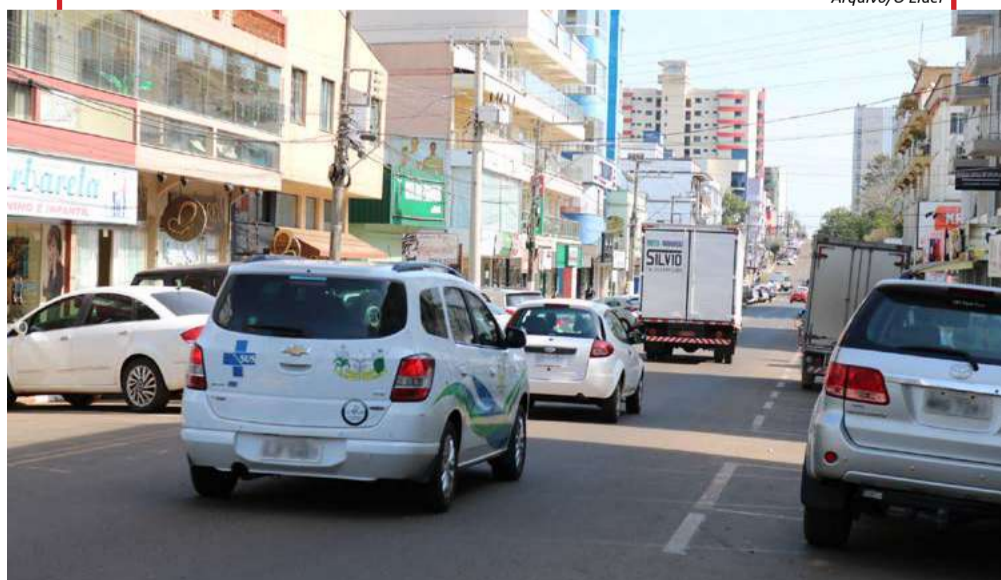
Reclamações por falta de vagas no município são recorrentes