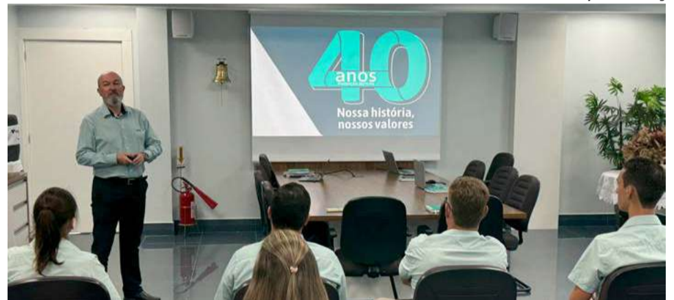
Lançamento foi realizado em reunião no município de Cunha Porã