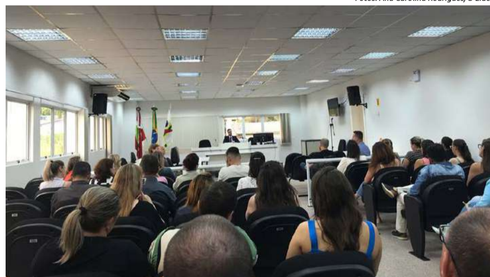
A reunião contou com a presença de autoridades que contribuíram com a ideia