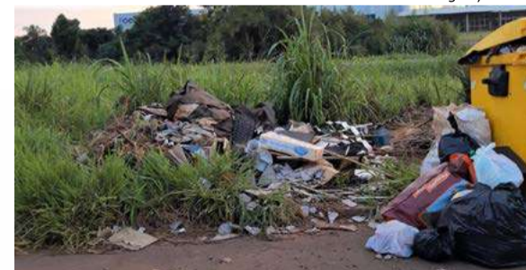
Registro feito no Bairro Industrial em Maravilha