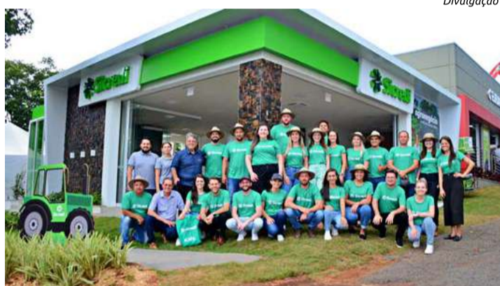
Estande fica na parte central do parque

Toda a estrutura é repensada ano a ano para entregar a melhor experiência aos expositores, parceiros e, principalmente, visitantes, proporcionando informações que promovem maior eficiência na atividade do agronegócio na região Sul do país.