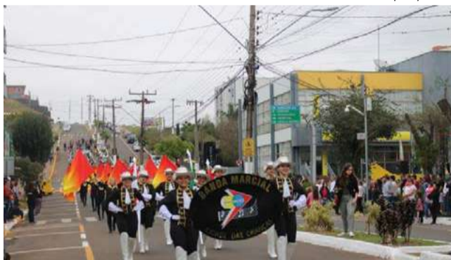
Ao todo, são 10 vagas disponíveis para a temporada 2024