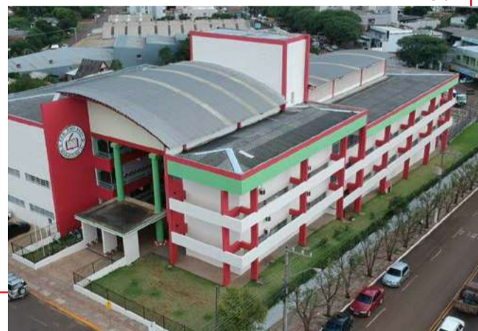
Escola após as reformas necessárias

A Escola Estadual é referência em ensino e conta com uma equipe de professores e funcionários capacitados para atender as necessidades dos alunos, além de proporcionar uma aprendizagem de qualidade.