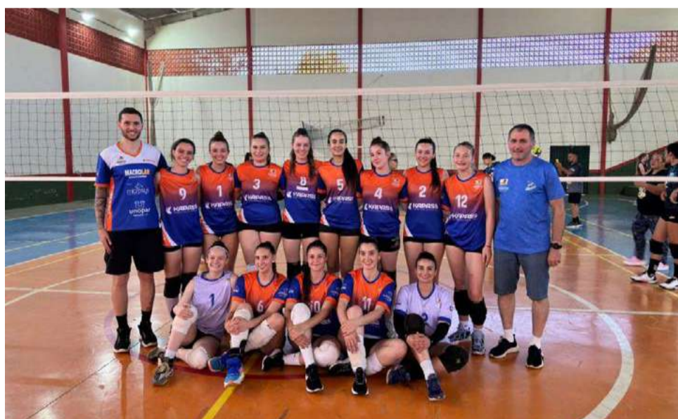
No último ano tiveram mais de 12 categorias treinando, desde crianças com 7 anos a adultos

suem parceria do projeto Vida Vôlei em conjunto com a Administração e a Secretaria de Esportes, Juventude e Lazer. Os treinos ocorrem no Ginásio Municipal e também no ginásio da Escola Estadual João XXIII.