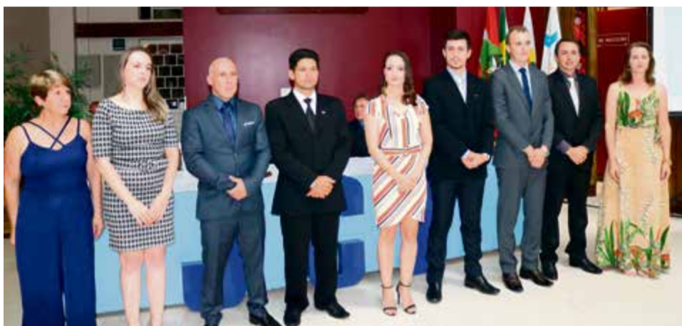
Membros da nova diretoria para o ano 2020