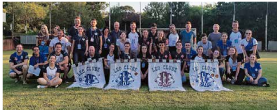
Evento foi uma proposta do Distrito LEO LD-8

“Os companheiros também foram desafiados a ocupar cargos da diretoria, aprendendo ainda mais sobre as funções de cada um, e sentindo na pele os desafios enfrentados pelos que desempenham os cargos durante o Ano Leonístico”, afirma.