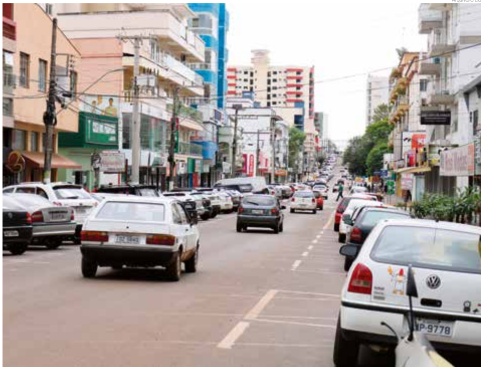
Veículos deixam ruas movimentadas principalmente nos horários de pico

Com números tão expressivos, o trânsito da cidade se-