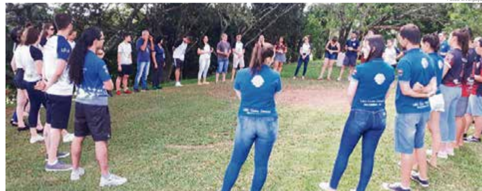
Mais de 40 pessoas participaram da atividade