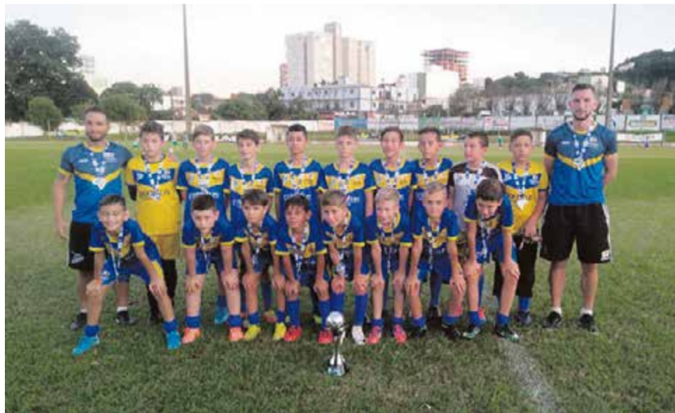
SEJL/Acema conquistou a segunda colocação na sub-11

Pela categoria sub-17 a Escolinha de Futebol Atleta Nota 10 Guarany Xaxim foi campeã ao bater o Caxias. Terceiro colocado foi o Ypiranga e TAC Unopar.