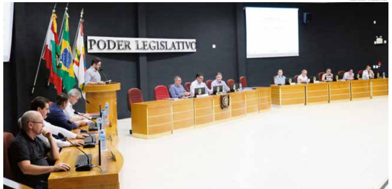
Primeira sessão do ano 2020 foi realizada segunda-feira

federal nº 11.738, de 16 de julho de 2008, que determina a atualização anual do piso salarial de professores do magistério público da educação básica. Em Maravilha, a soma dos reajustes dos últimos sete anos é de 71,40%, conforme o setor de Recursos Humanos da prefeitura.