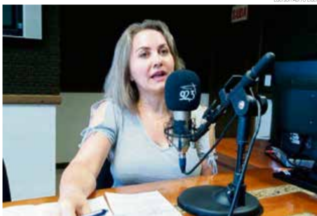
Presidente das entidades tem grande experiência na Associação Empresarial

A nova presidente destacou o Líquida Maravilha, de 8 a 15