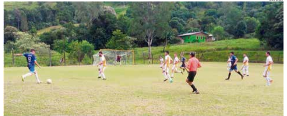
Jogos são aguardados com ansiedade pela comunidade esportiva

No feminino: 1º Soccer Girls, 2º Amigas da Bola, 3º