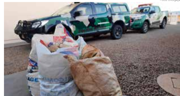
Vinte policiais militares ambientais trabalham na região

gumas regras sobre a prática da pesca precisam ser observadas, tanto para pescadores amadores, como para profissionais. Por isso, havendo qualquer dúvida a Polícia Militar Ambiental pode ser contatada pelo telefone 3631 3730.