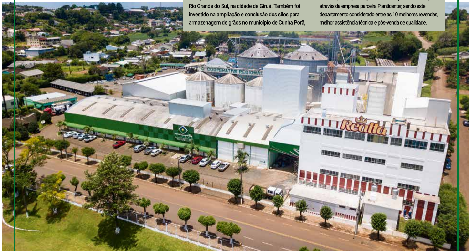
Ampliação e modernização do Moinho da Realta Alimentos

No início deste ano o departamento de máquinas e equipamentos agrícolas da Auriverde também recebeu troféu de revelação 2019, como reconhecimento e destaque na premiação TOP 10 no quesito revenda, através da empresa parceira Planticenter, sendo este departamento considerado entre as 10 melhores revendas, melhor assistência técnica e pós-venda de qualidade.