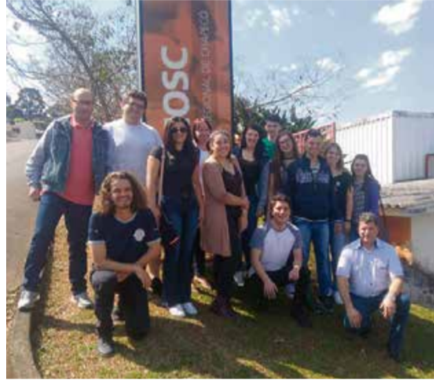
Registro de um dos encontros para doação

Eles organizam as idas, informam pessoas interessadas e selecionam uma data disponível no Hemosc. Tudo de forma gratuita. Desde que começou, há um ano e meio, o grupo fez o trajeto cinco vezes. A próxima ida será na quarta-feira (12) e interessados po-