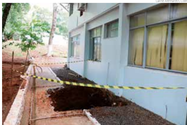
Elevador está sendo instalado na prefeitura

O investimento é de R$ 121.950 mil, com recursos próprios do município. A instalação do elevador é feita pela empresa Dalcar, vencedora do processo de licitação. O acesso ao equipamento será pela parte interna da prefeitura, no primeiro piso, dando acesso ao segundo andar.