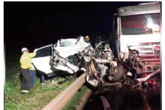
Carro ficou destruído e família presa nas ferragens

A Associação Chapecoense de Futebol divulgou uma nota de pesar durante a semana.