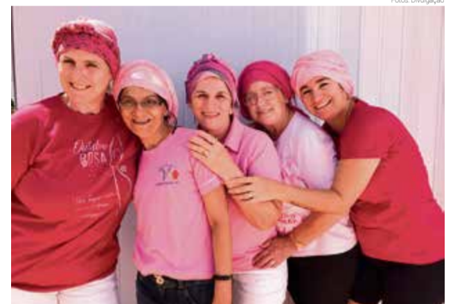
Colaboradoras também participaram da ação

As voluntárias afirmam que toda atitude de luta contra a doença, toda nova ideia que auxilie na prevenção do câncer, sempre será bem-vinda.