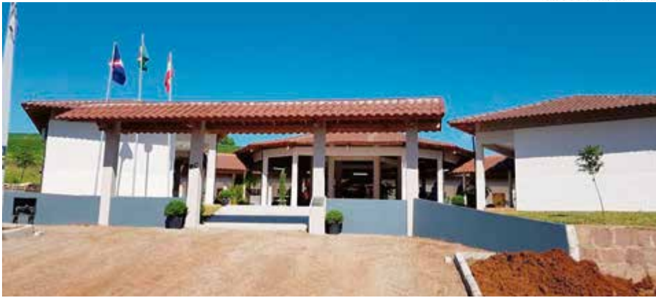
Nova estrutura contou com investimento de mais de R$ 1 milhão

Na cerimônia de inauguração, a secretária de Educação,