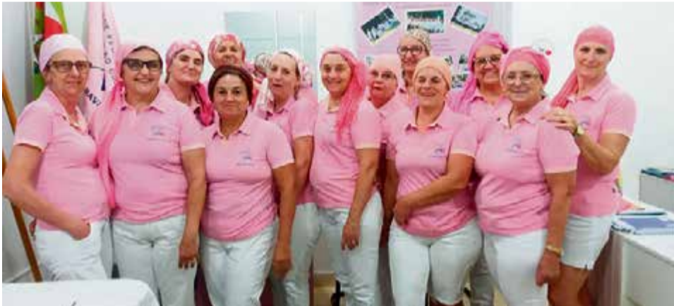
Voluntárias se reuniram com lenços na cabeça

Conforme as integrantes da Rede, qualquer pessoa pode estar sujeita à doença, além das milhares que já convivem com o câncer. “O dia 4 de fevereiro serve para todos