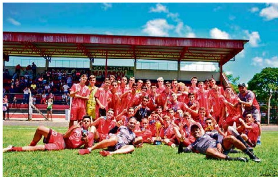
Equipe de Xaxim conquistou o primeiro lugar pela sub-17