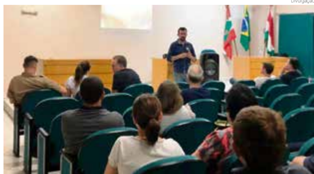
Reunião foi promovida no último dia 30

Na ocasião ficou definida a criação do Conselho Municipal de Turismo que, juntamente com o Departamento de Turismo, irá discutir estratégias para ser implementadas ainda neste ano. A primeira delas é a criação de uma rota das cachoeiras, aproveitando a generosidade da natureza local.