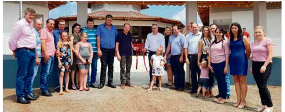
Solenidade teve a presença de lideranças e da comunidade escolar

ção pedagógica, almoxarifado, sala da direção, dois sanitários e sala de nutricionista e o bloco de serviços é composto pela cozinha, área de serviço, depósito de comida e sanitários. Já o bloco pedagógico conta com seis salas de aula que serão utilizadas pelos alunos de 1º ao 5º ano, sala dos professores e de informática, além do hall de entrada com refeitório.