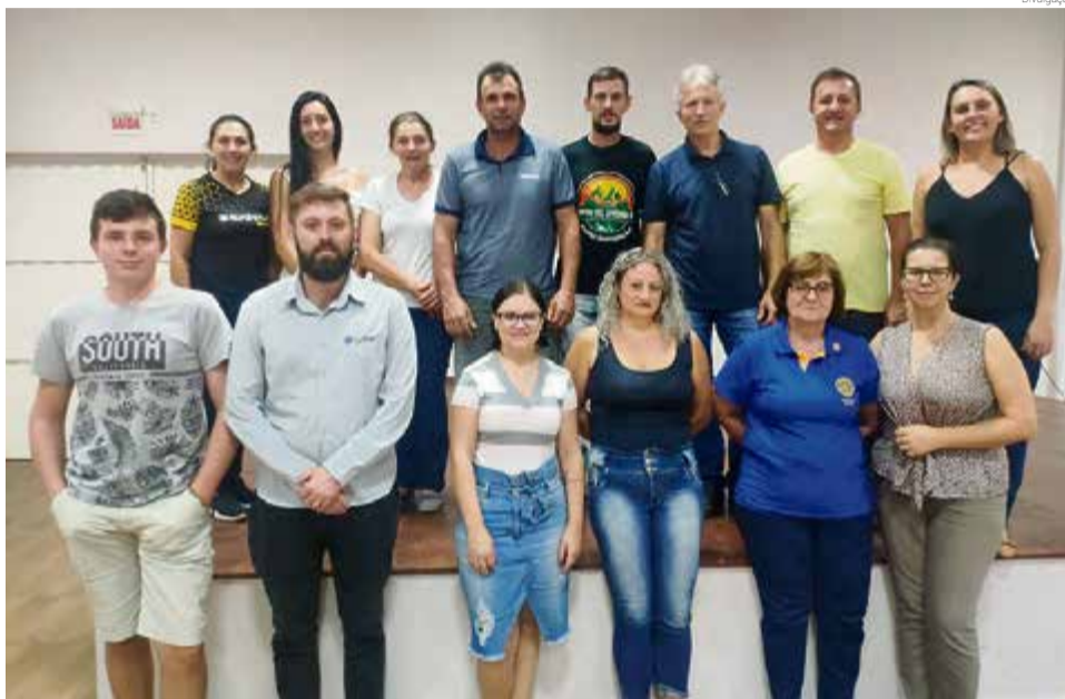
Reunião contou com a presença de agricultores, ciclistas, servidores públicos e pessoas ligadas ao turismo