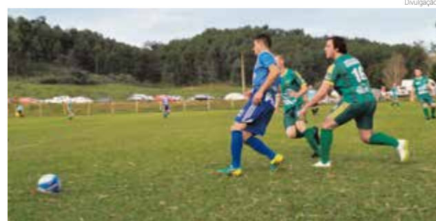
Amanhã (9) tem jogos no Esporte Clube Iraceminha e na Linha Santa Fé

No domingo (2) foi realizada em Iraceminha a segunda rodada do Campeonato Municipal de Futebol, nas comunidades de Linha Moroe, Distrito de São José do Laranjal, e no campo do Esporte Clube Nova Estrela. Em São José do Laranjal jogaram pela categoria aspirante a equipe da casa contra o Juventude, com placar favorável para a Associação São José por 2 x 0. Na Linha Moroe se enfrentaram Grêmio Moroe e Canarinho/Flamengo, nas catego-