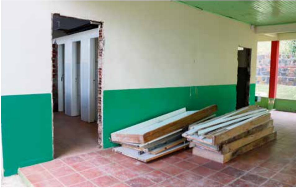
Obra no CE Vereador Raymundo Veit começou neste mês

sino deve atender aproximadamente 930 estudantes no ensino fundamental e mais de 750 na pré-escola. As creches, que iniciaram o ano letivo já na quarta-