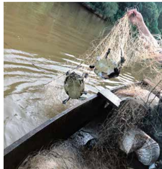
Restrições ocorrem em razão da reprodução dos peixes