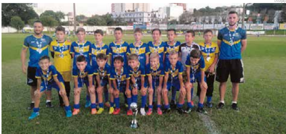
Meninos que vestiram a camisa de Maravilha foram vice em 2020

De Maravilha, a categoria sub-13 chegou às semifinais e foi eliminada pelo Lajeardense