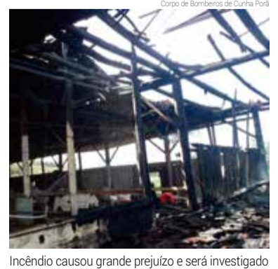
Incêndio causou grande prejuízo e será investigado

O proprietário relatou que o fogo começou onde havia forno industrial, caixa de energia elétrica, fogão a lenha, além de materiais para uso no campo. Ele destaca que só percebeu o incêndio quando parte da estrutura, que não tinha seguro, já estava tomada pelas chamas.