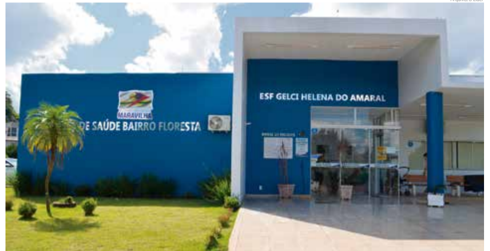
Imunização será na Sala de Vacinas, na unidade do Bairro Floresta

Nesta semana foi anunciada a ampliação da faixa etária que vai receber a dose. Devem ser vacinadas todas as pessoas com idade entre seis meses e 49 anos. A responsável pela Sala