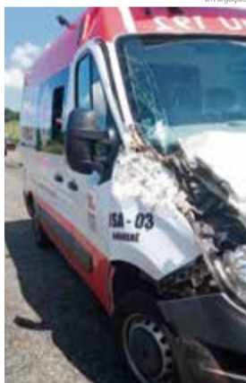
Ambulância teve danos, mas ninguém ficou ferido

Após a colisão, a ambulância do Samu de Maravilha foi até o local e concluiu a transferência.