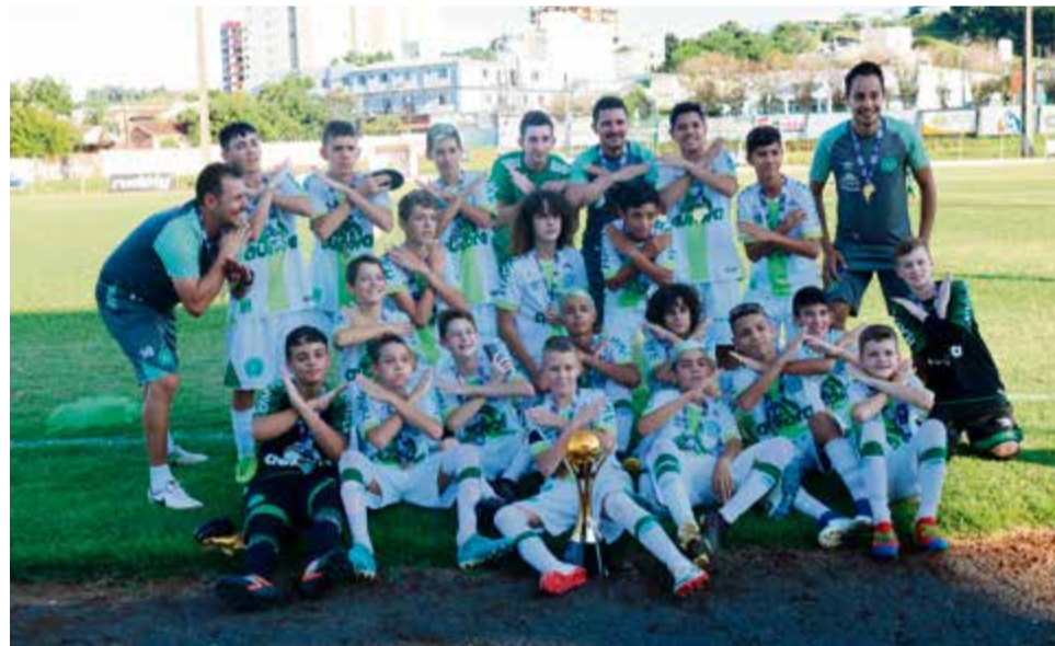
Chapecoense foi a melhor equipe pela sub-13