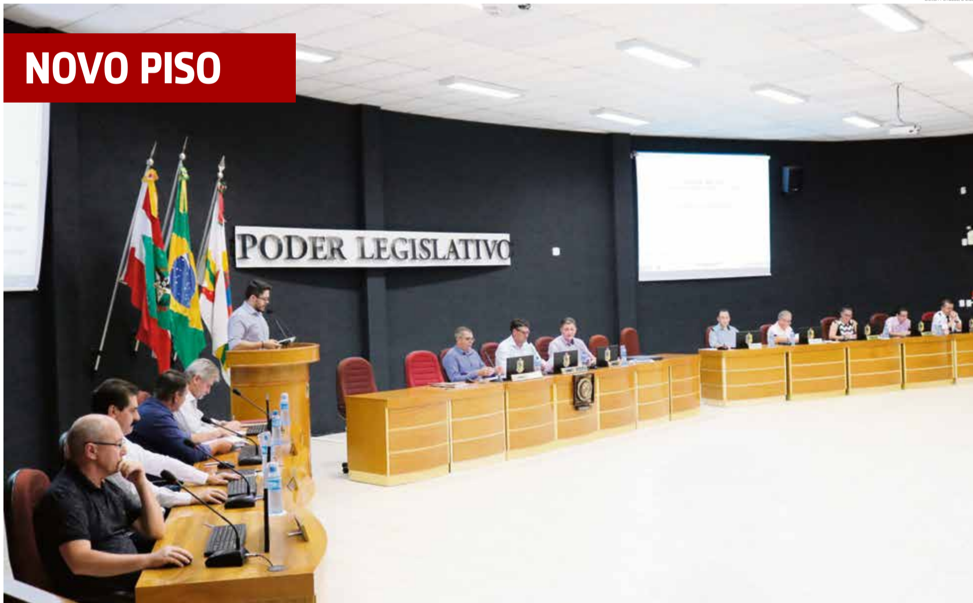
Cleiton Ferrazzo/O Líder