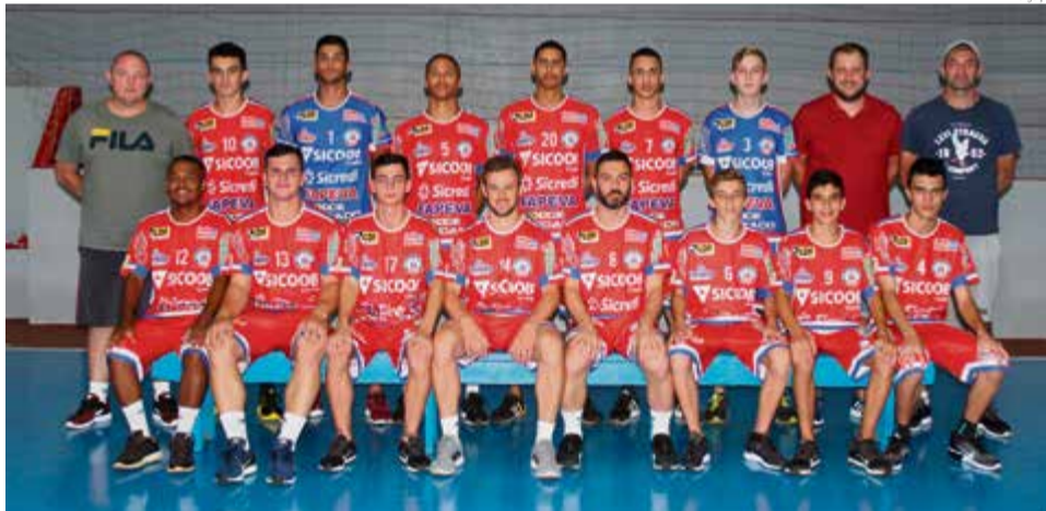
Elenco adulto conta com novos jogadores, bem como atletas que subiram da categoria de base

Logo após a apresentação o grupo se deslocou até o campo do Esporte Clube Cunha Porã, onde deu início às atividades