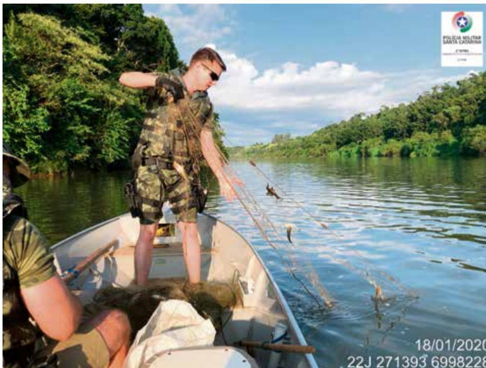
Período encerrou no último dia 31

Na região 20 policiais militares ambientais trabalham no combate ao crime. Num comparativo com o último período da Piracema, houve um aumento no número de material apre-