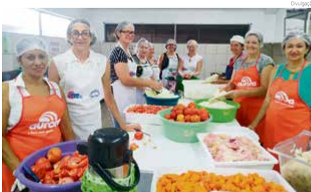
Sócias do Grupo de Idosos Pequena Fortaleza

as participaram do churrasco e da matinê com a Banda Tri Gaitaço. "Ficamos felizes com a confraternização e com a presença de quase 30 grupos. Estamos gratos pela dedicação dos nossos sócios e da boa vontade dos participantes", explica.