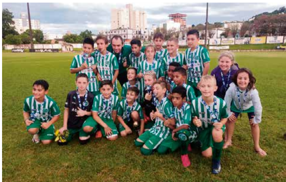
Na sub-15 Juventude ergueu o segundo troféu na competição