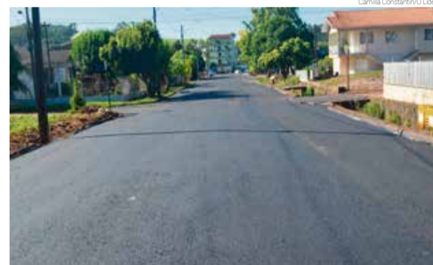
Serviço foi feito na quinta-feira (6)

O município também anunciou um novo pacote de obras de pavimentações que serão feitas: Rua Independência, Carlos Thomas Marcolin, Atílio João Zanotto, Carlos Antônio Cembranel, em todo o trecho restante da Monteiro Lobato, João Regner (entre a Irmã Dulce e Tenente Ari Silva), Nidolfo Carlos Mattje (entre a Santa Catarina até a Palmitos) e também na Rua Santa Catarina (entre a Prefeito Deonubem Baldissera até a Irmã Maria Borja). A pavimentação da Rua Presidente Juscelino, em frente à Apae Marisol, já foi concluída.