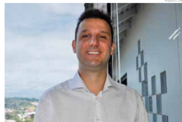
Presidente local afirma que eleição será diferente para vereador por não ter coligações

O presidente afirma que o partido não vai exigir que os atuais vereadores sejam candidatos, mas eles serão convidados para a reeleição. Sobre os secretários, vale a mesma situação. “Todos serão convidados a serem candidatos a vereadores. São pessoas que acumularam experiência, adquiriram capacidade para a administração pública e fazendo bom trabalho”, justifica o presidente. Ao todo, 17 nomes serão lançados pelo partido para a Câmara de Vereadores, sendo 30% mulheres, por força de legislação.