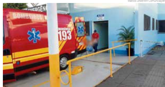
Após bater em homem, coletivo colidiu contra um muro

de uma oficina mecânica quando foi atingido por um micro-ônibus desgovernado. Foram