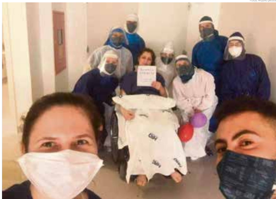
Paciente venceu a Covid-19 em outubro do ano passado