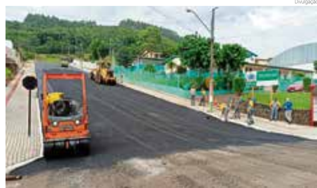
Rua Vitória, ao lado do Centro Educacional