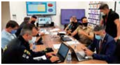
Uma sala especial foi montada para o trabalho de gerenciamento no município de São Miguel do Oeste

Mais de 400 policiais participaram da ação para o cum-