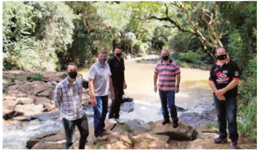
Encontro foi realizado na Prainha do Rio Jundiá para fiscalização das obras no local

no futuro local da captação. Os vereadores aguardam o retorno da Casan, em razão do ofício enviado solicitando a visita, para também averiguar a subestação de captação de água, que deve acontecer nos próximos dias. "A comissão especial segue com os trabalhos para averiguar e fiscalizar o que já vem sendo feito e sugerir medidas mais efetivas para solucionar com o problema de falta de água no município de Maravilha", disseram os vereadores.