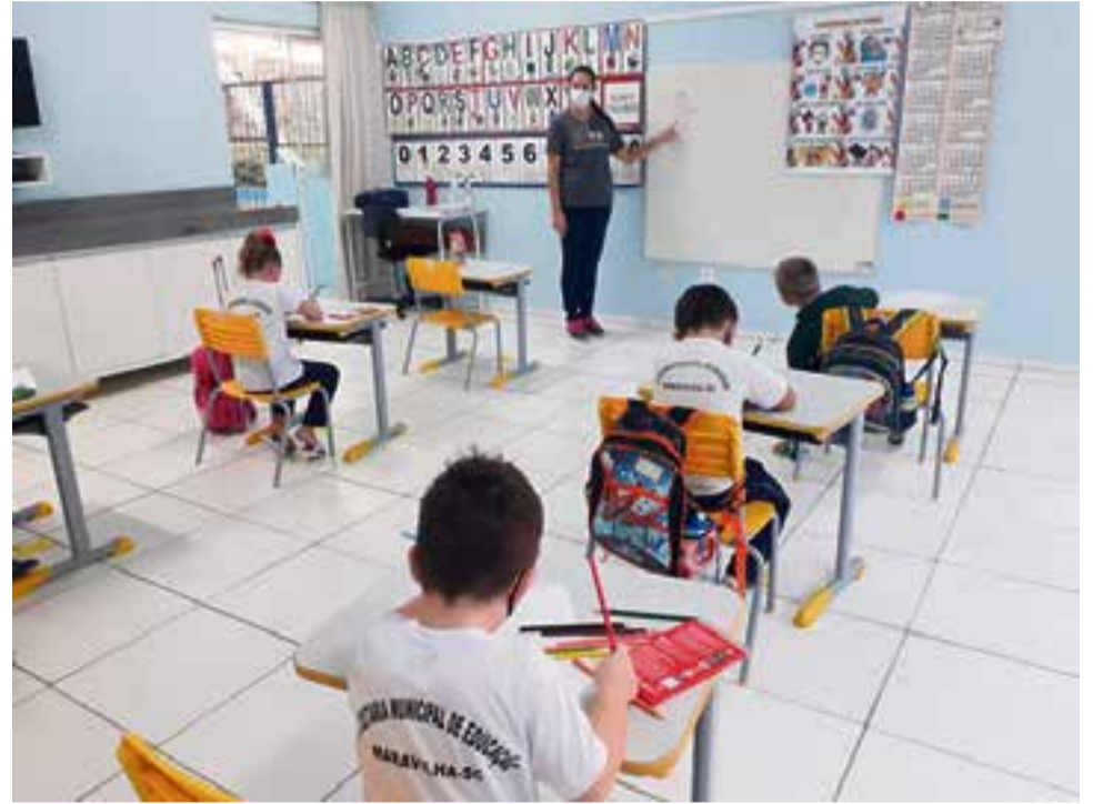
Alunos da pré-escola aprenderam logo sobre os cuidados

Em Maravilha, os alunos são distribuídos em duas turmas: A e B. Enquanto os alunos de uma turma frequentam a escola, outra fica em casa fazendo atividades remotamente. A medida visa diminuir a aglomeração