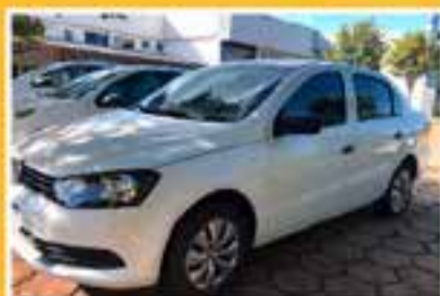
VOLKSWAGEN VOYAGE 2013