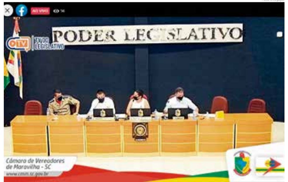
Próxima sessão está marcada para segunda-feira (1º) às 19h

Entre as necessidades relatadas durante a sessão está o número de efetivos, considerado baixo e a alteração da rádio comunicação do sistema analógico para o digital. Uma imposição da Anatel. Outra dificuldade é a redução de recursos por con-