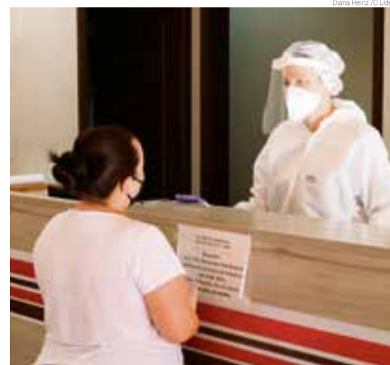
Boletim epidemiológico diário passou a ser divulgado após às 20h30 em razão do atendimento ampliado na Sala de Triagem