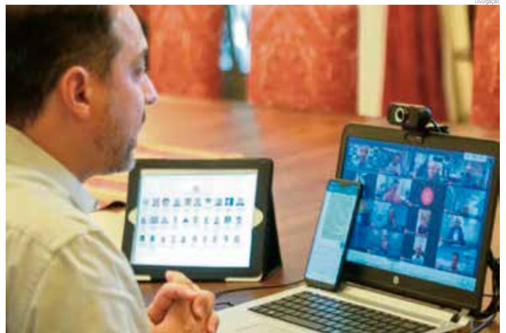
Medidas estão sendo debatidas com gestores municipais

O chefe do Executivo estadual destaca o aumento da fiscalização como estratégia fundamental de combate à Covid-19. “Estamos direcionando esta força operacional de 500 policiais militares para intensificar a fiscaliza-