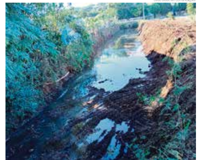
Serviço de desassoreamento foi realizado no Lajeado Ibirapuitã

no local. O objetivo é evitar que o rio sofra um processo de transbordamento, causando possíveis transtornos. O trabalho foi realizado pela extensão do rio ontem (26). Outros pontos da cidade devem receber a equipe para a mesma ação.