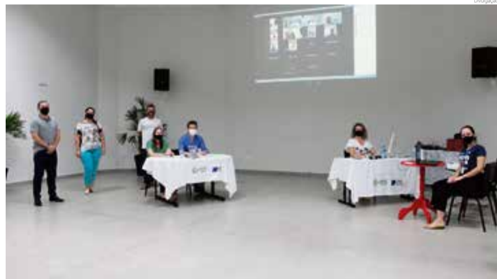
Foram realizadas diversas alterações estatutárias da Associação Empresarial de Maravilha

- Modificação seção I da Assembleia Geral, artigo 16: as assembleia geral será Ordinária e/ou Extraordinária, podendo ser realizada de for-