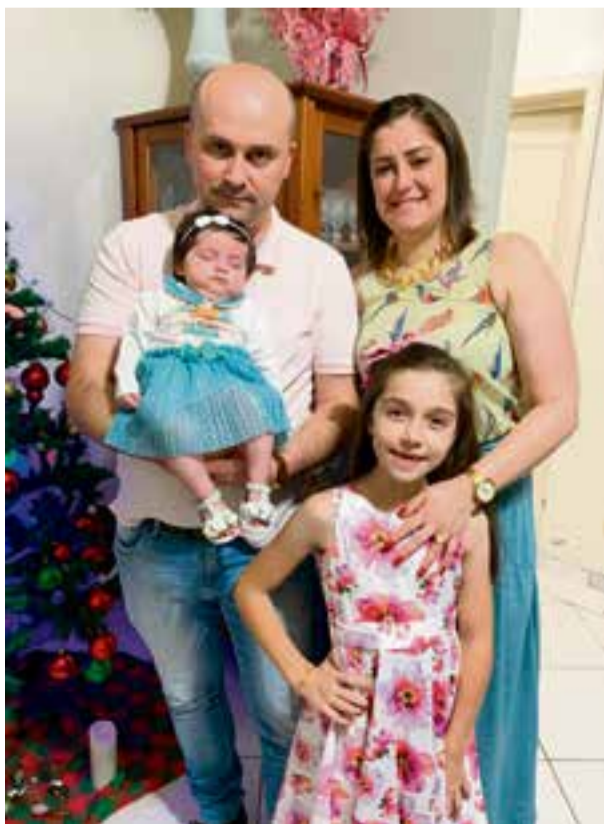
Família conseguiu celebrar o Natal com saúde em Maravilha