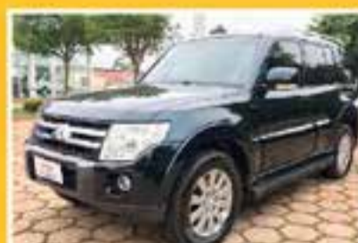
MITSUBISHI PAJERO HPE 2008