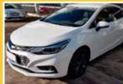
CHEVROLET CRUZE LTZ 2017