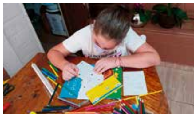
Crianças da catequese da Linha Barro Preto fizeram cartões que foram anexados nos pacotes