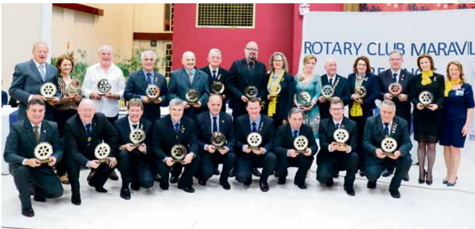
Registro foi feito em 2019, no aniversário de 25 anos do Rotary Club de Maravilha, em que ex-presidentes receberam troféu de agradecimento

Seus sócios se reúnem para tratar de assuntos que compreendem os mais diversos temas, com destaque especial para as causas comunitárias. "Todos unidos em um só ideal. O ideal de servir ao próximo através do lema rotário Dar de Si antes de Pensar em Si", destacam.