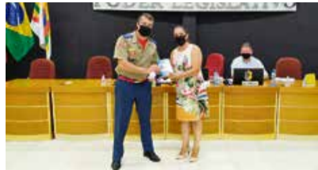
Presidente da Casa entregou um livro sobre a história da Câmara de Vereadores ao capitão

O Corpo de Bombeiros atende Maravilha, Santa Terezinha do Progresso, Tigrinhos, Flor do Sertão, Iraceminha e São Miguel da Boa Vista.