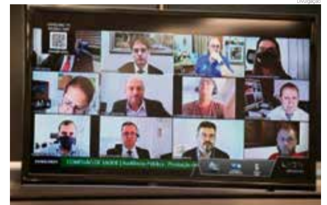
Objetivo do Legislativo é unir esforços para definir estratégias