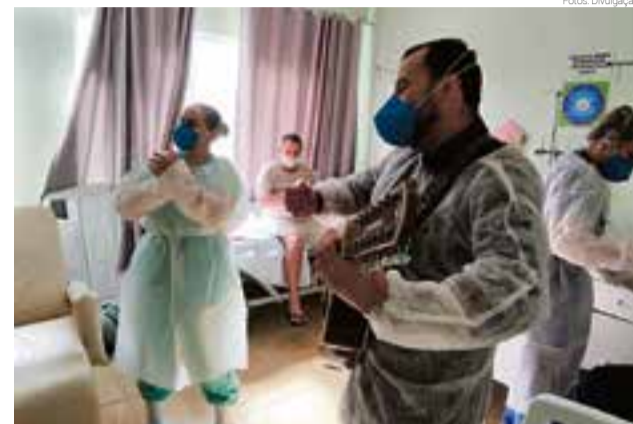
Tratamento emocional faz parte da internação