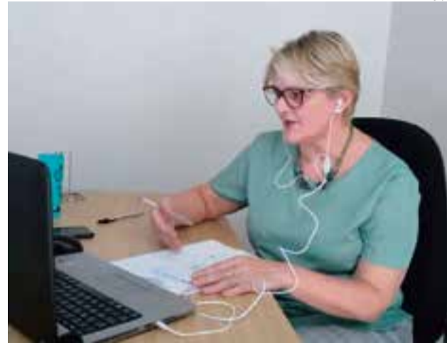
Deputada estadual Luciane Carminatti (PT) falou sobre a situação calamitosa da falta de leitos

A deputada estadual Luciane Carminatti (PT) falou em entrevista ao Grupo Wh Comunicações sobre duas importantes reuniões para o enfrentamento à Covid-19 no Oeste de Santa Catarina, representando os deputados da Bancada do Oeste. De acordo com a deputada, o Comitê Integrado de Operações de Enfrentamento Covid-19 da macrorregião Oeste destacou a situação calamitosa da falta de leitos clínicos e de UTI para os pacientes infectados pelo novo coronavírus. “Mesmo que abrissemos mais de