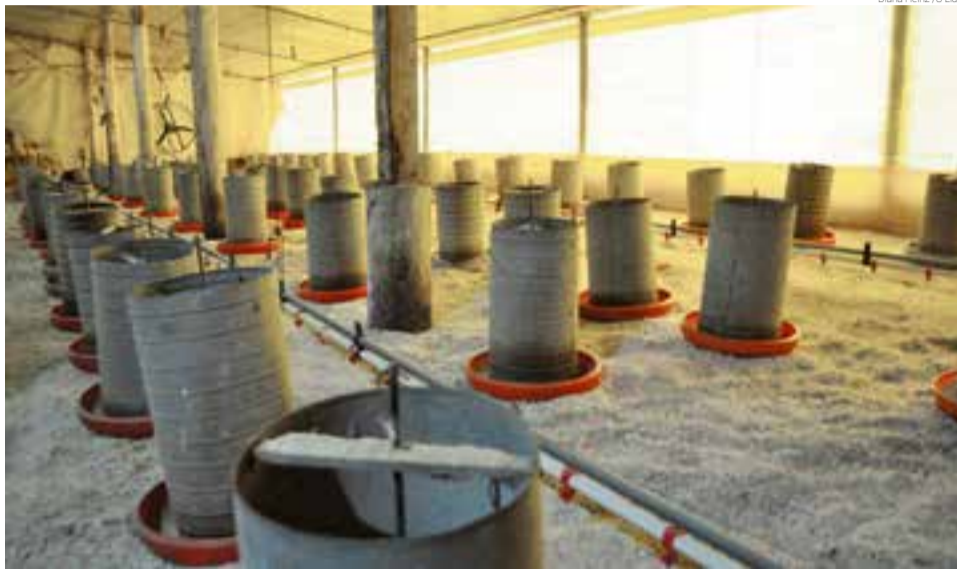
Custos com nutrição subiram 38,9% no período

No caso das aves, a Empresa Brasileira de Pesquisa Agropecuária (Embrapa) calculou uma elevação de 43,2% no custo de produção de frangos nos últimos 12 meses. Só os custos com nutrição subiram 38,9% no período. O cenário preocupa o setor e in-