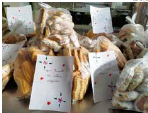
Profissionais do Centro Especializado em Saúde e Sala de Triagem também devem receber os pacotes