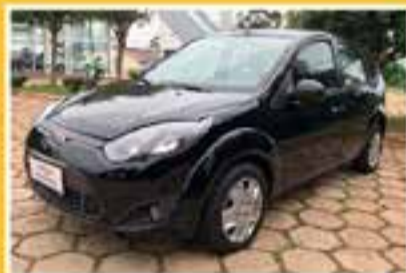
FORD FIESTA FLEX 2012