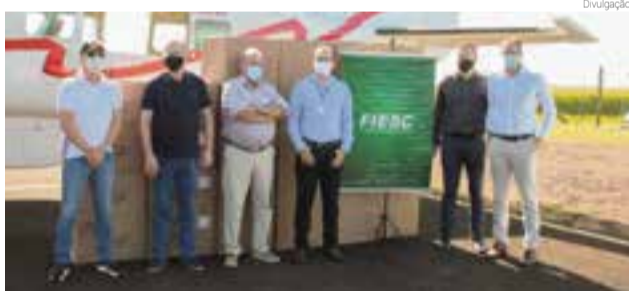
O transporte dos aparelhos foi feito pelo Aero Clube de Santa Catarina

A Federação das Indústrias de Santa Catarina (FIESC) doou oito ventiladores pulmonares à região. A entrega ocorreu nesta semana em São Miguel do Oeste, cidade cujo hospital regional possui 18 leitos de UTI e 16 leitos clínicos destinados ao tratamento de Covid-19. O investimento da FIESC foi de R$ 321,5 mil, incluindo o transporte aéreo. Os ventiladores são de procedência catarinense, foram fabricados em Mafra, pela GreyLogix, empresa que iniciou produção do equipamento em 2020, após receber apoio tecnológico dos