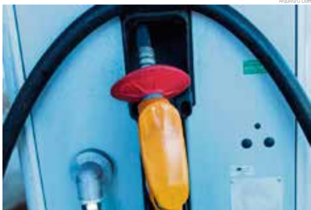
Preço médio da gasolina comum é R$ 5,08 e aditivada R$ 5,17

R$ 5,08. Esse é o preço médio do litro da gasolina comum em Maravilha. Já a gasolina aditivada custa, em média, R$ 5,17. O balanço médio foi realizado pela reportagem do Grupo WH Comunicações nesta terça-feira (22). O preço médio não inclui os descontos nos dias de promoções ou oferecido por aplicativos. Há estabelecimento que o produto é vendido a R$ 4,99 até R$ 5,17 para o tipo comum, podendo chegar até R$ 5,25 se o consumidor optar pela qualida-