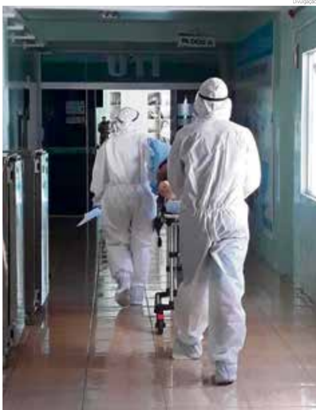
Todos os 10 leitos de Maravilha serão para tratamento contra a Covid-19

enfermaria Covid e os 10 leitos de UTI ocupados, ela confessou que o contato com o Ministério Público significa um "pedido de socorro", pois o cenário futuro é preocupante. A diretora afirmou que o hospital tentou comprar insumos e os fornecedores não têm mais produtos. Vários itens estão escassos e isso pode implantar um colapso no sistema de saúde do município.