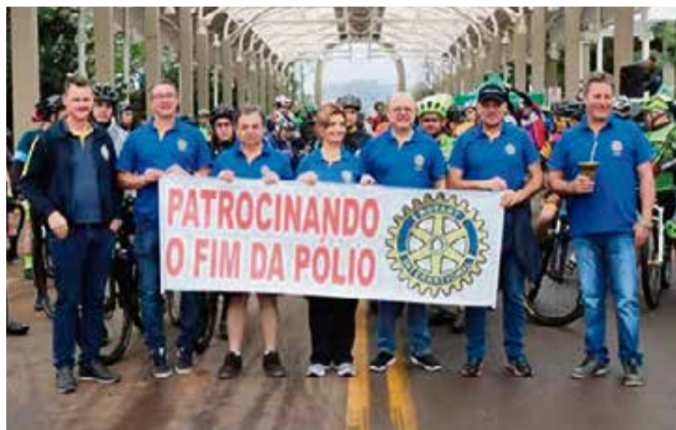
A erradicação da pólio constitui uma das iniciativas mais longas e importantes da trajetória do Rotary

Diversos projetos são desenvolvidos em Maravilha, entre eles: Campanha Hepatite Zero; Parceria e apoio à Polícia Militar na formação de jovens do Proerd; Projeto Profissional Destaque; Projeto Manta de Amor e Crescendo Juntos (cada criança que nasce no hospital pelo sistema SUS recebe uma manta do amor e uma planta. Além disso, o Rotary mantém um quarto da maternidade); Banco Ortopédico - empréstimos de equipamentos hospitalares como cadeiras de rodas, cadeiras de banho, muletas, andadores, botas imobilizadoras e outros. Recentemente foram disponibilizados cinco elevadores hidráulicos automatizados; Entrevero de Pinhão; Jantar das Massas e Maravilha de Natal. Em função da pandemia, algumas ações não foram realizadas em 2020.