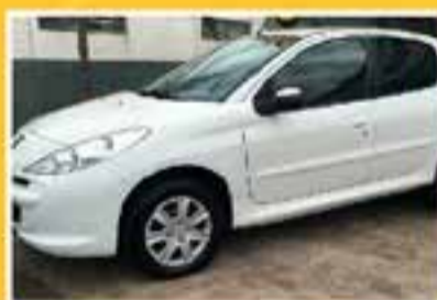
PEUGEOT 207 HB ACTIVE 2014