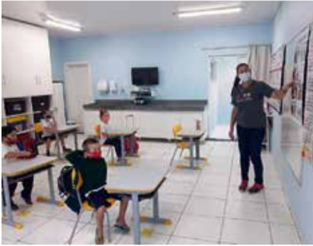
Uso de máscara é obrigatório na sala de aula

“No portão da escola nós aferimos a temperatura dos alunos e em seguida eles mesmos se direcionam até o álcool em gel para higienizar as mãos, depois seguem até a sala de aula respeitando o distanciamento entre um e outro. Lá dentro, eles respeitam o distanciamento e mantêm a má-