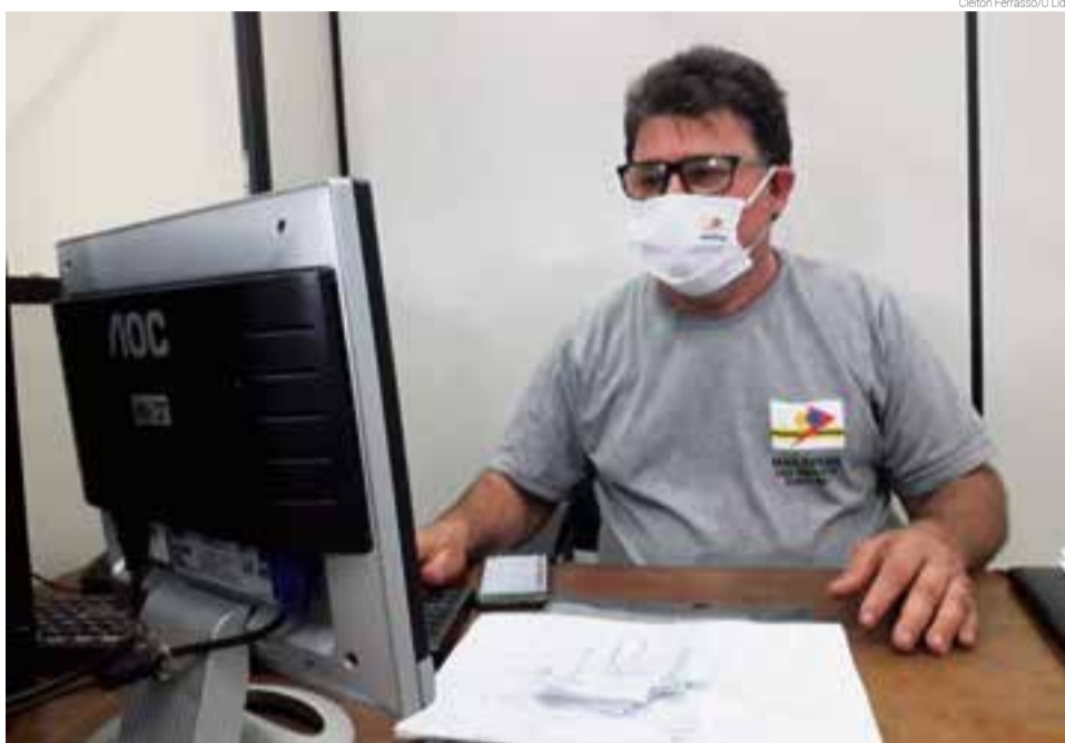
Benefício é de 1,7% para produção de até R$ 100 mil

O município realiza o pagamento desse bônus todo mês aos agricultores que estão em dia com a prestação de contas. O secretário disse ainda, em entrevista à reportagem, que o prazo para a renovação já expirou. “O período para o agricultor prestar contas do bloco já esgotou, mas