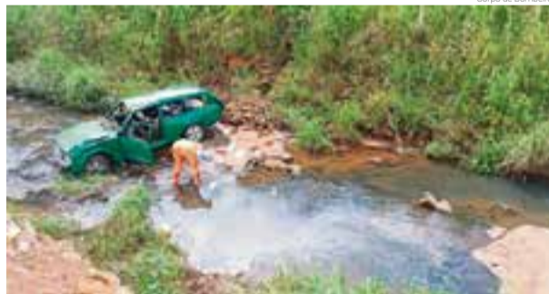
Carro foi parar no meio do rio após ficar sem freio nas proximidades do Cemitério Jardim da Paz

A Polícia Militar também esteve no local para fazer levantamento e o boletim de ocorrência.