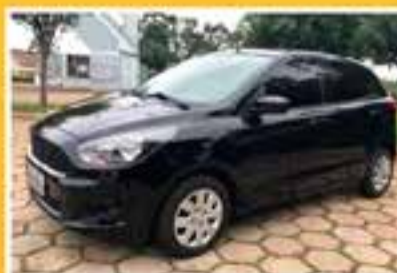
FORD KA SE HATCH 2018