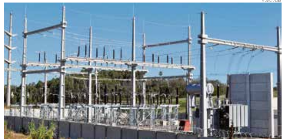
Iniciativa permite que o cliente faça a negociação e o pagamento sem que haja necessidade de uma entrada de 33% do valor da fatura em aberto

Está disponível na Celesc a opção de pagamento parcelado das faturas de energia elétrica em atraso, por cartão de crédito. A medida traz mais conforto aos clientes, pois amplia suas opções para pagamento e dá mais agilidade ao atendimento presencial, já que a negociação pode ser feita em aproximadamente 80 lojas de atendimento e Unidades da Celesc, em todas as regiões do estado. “A Celesc tem uma finalidade social e pública de importância para a comunidade, por isso, ações como essa, que apoiam os consumidores e ajudam a reduzir a inadimplência, são muito importantes e representam um grande passo na qualidade no relacionamento entre eles e a empresa. Antes desse recurso, o cliente somente poderia ne-