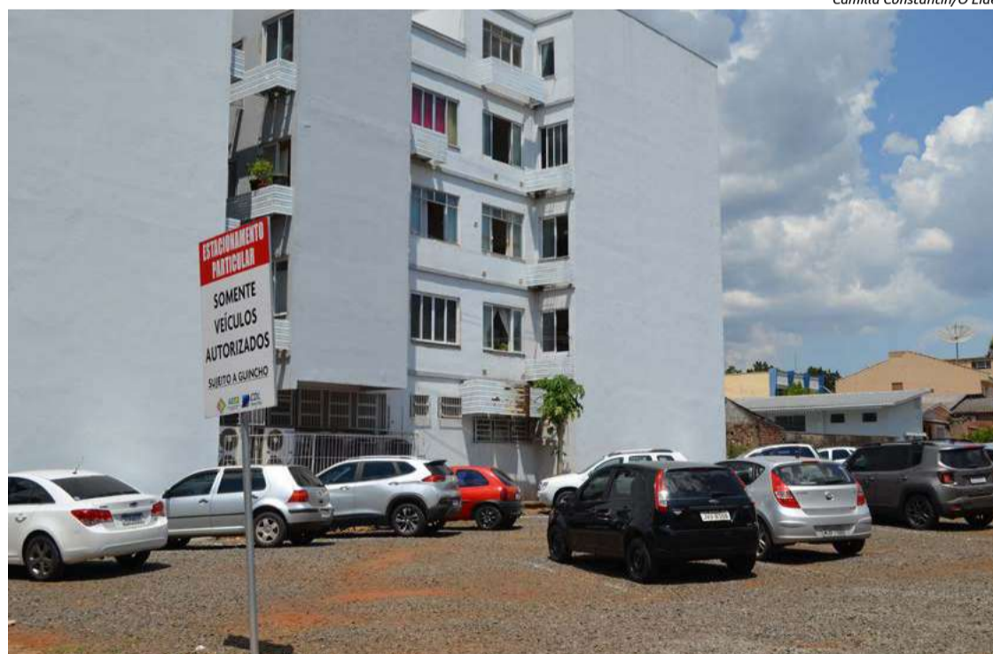
Atualmente a CDL e AE conta com cinco terrenos para estacionamento

NO SICOOB, CONTA CORRENTE SEM TARIFA E CARTÃO SEM ANUIDADE NÃO É MAIS NOVIDADE. MAS O POINT BACK É!