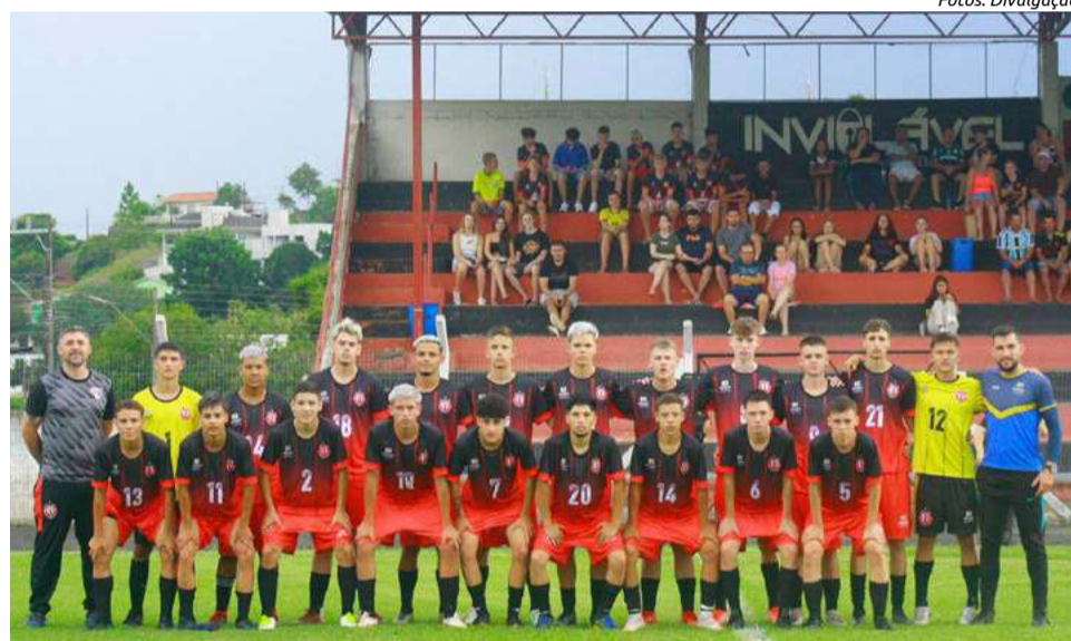
Meninos do sub-18 sofreram goleada por 5 a 1