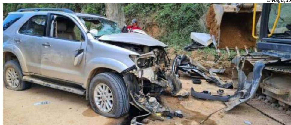
Caminhonete colidiu contra o equipamento que fazia trabalhos no local

Testemunhas do acidente informaram que já haviam alguns carros parados na via, quando a caminhonete teria efetuado uma ultrapassagem e colidido com a máquina.