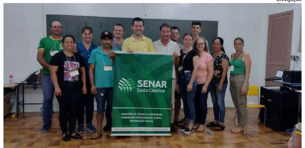
Mais um encontro será promovido em março