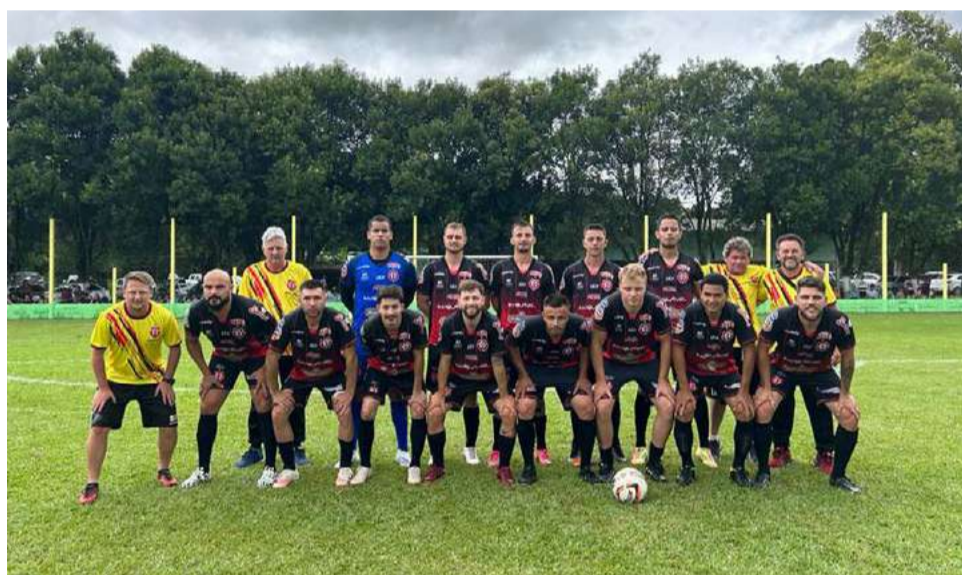
Na categoria adulta, a vitória foi de 2 a 0

pontos e o primeiro colocado é o Aliança, com sete pontos. No sub-18 o CRM também ocupa a segunda colocação, mas com seis pontos. O primeiro colocado é o Ypiranga com nove pontos.