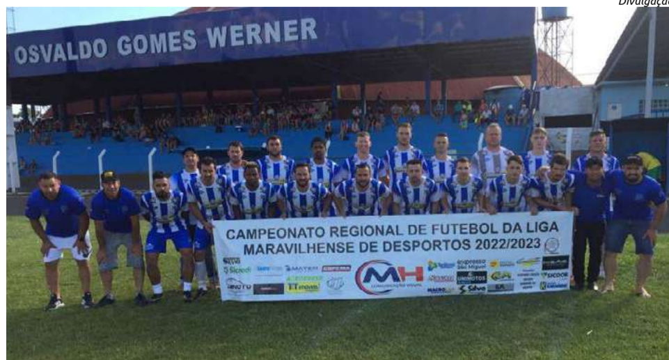
Madalozzo/Acema enfrenta São Miguel da Boa Vista na semifinal