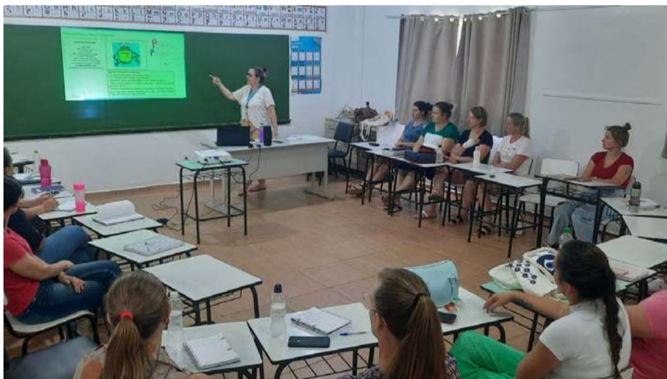
Instrutora do sistema de ensino Aprende Brasil ministrou formação para todos os professores