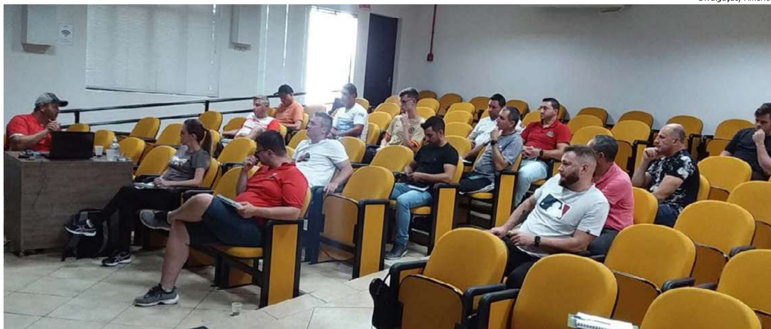
Reunião foi promovida nesta semana em Maravilha