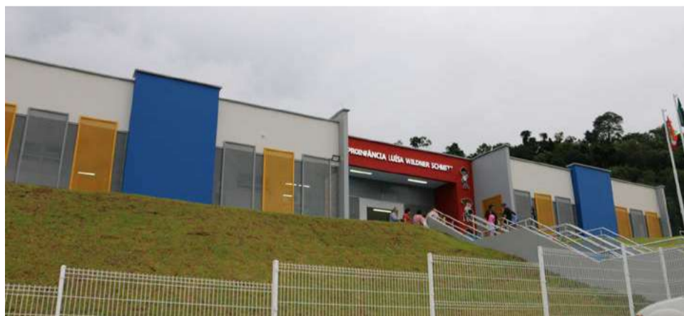
Creche irá atender 171 crianças