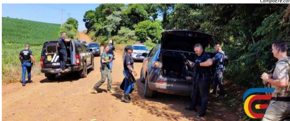
Diversos policiais foram empenhados para buscas no município de Campo Erê

O Grupo de Atuação Especial de Combate ao Crime Organizado (GAECO) é uma força-tarefa composta pelo Ministério Público de Santa Catarina, Polícia Civil, Polícia Militar, Polícia Rodoviária Federal, Polícia Penal, Receita Estadual e Corpo de Bombeiros Militar.