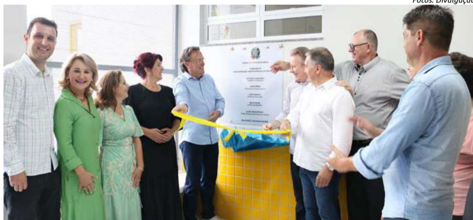
Inauguração foi realizada no último dia 3