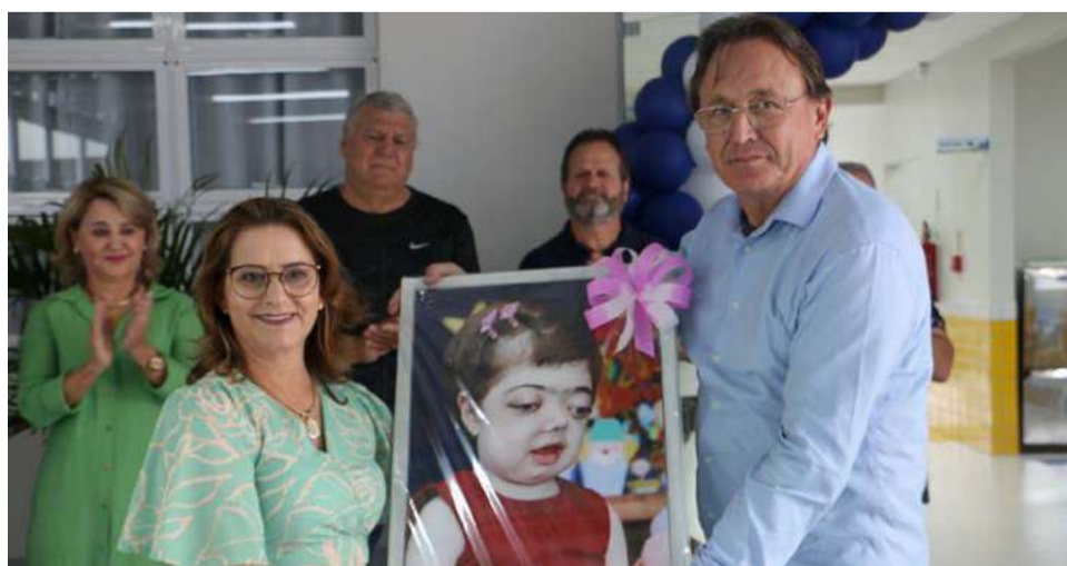
Familiares da homenageada participaram da cerimônia