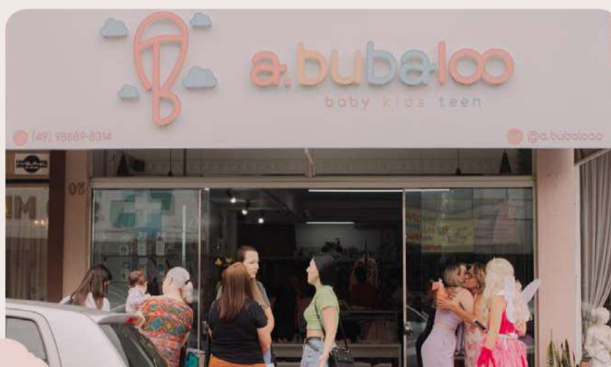
Empreendimento fica localizado na Avenida Araucária