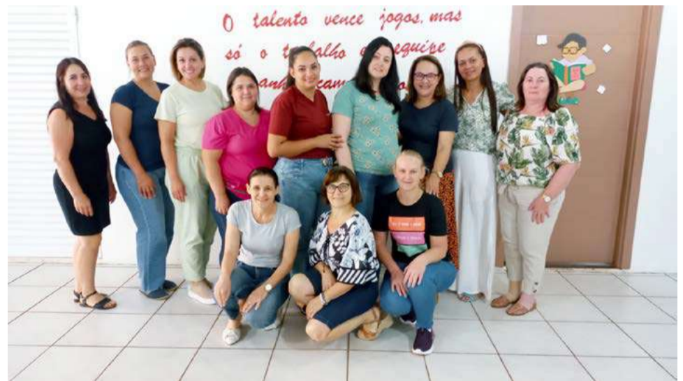
Professores de São Miguel da Boa Vista e Tigriinhos receberam orientações