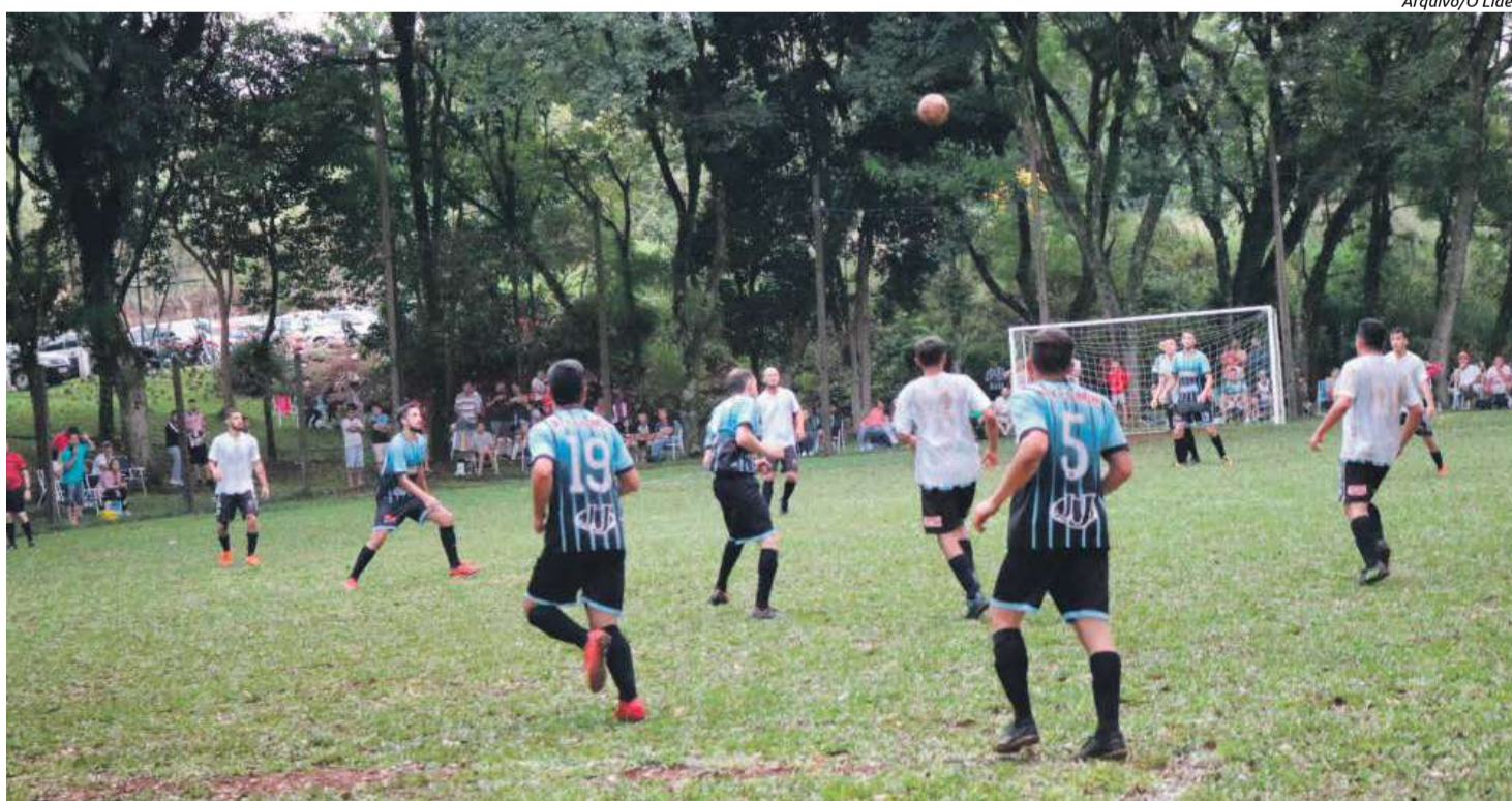
Somente atletas votantes em Maravilha podem participar

As fichas estão disponíveis no site maravilha.digital.esp.br e também na Secretaria de Esportes, até segunda-feira (13). O congresso técnico será realizado na terça-feira (14), na sala de reuniões da prefeitura, às 19h30.