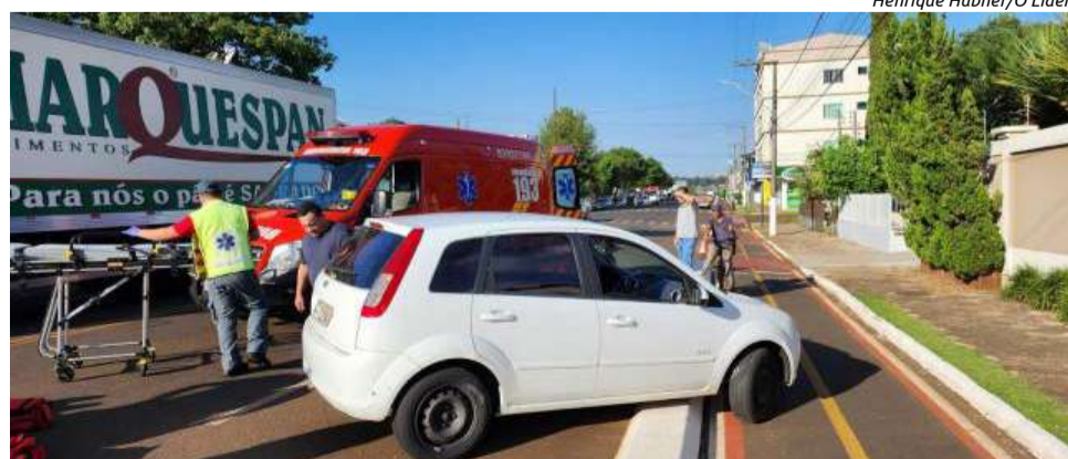
Colisão foi registrada nas proximidades do campo do CRM

A Polícia Militar também esteve no local.