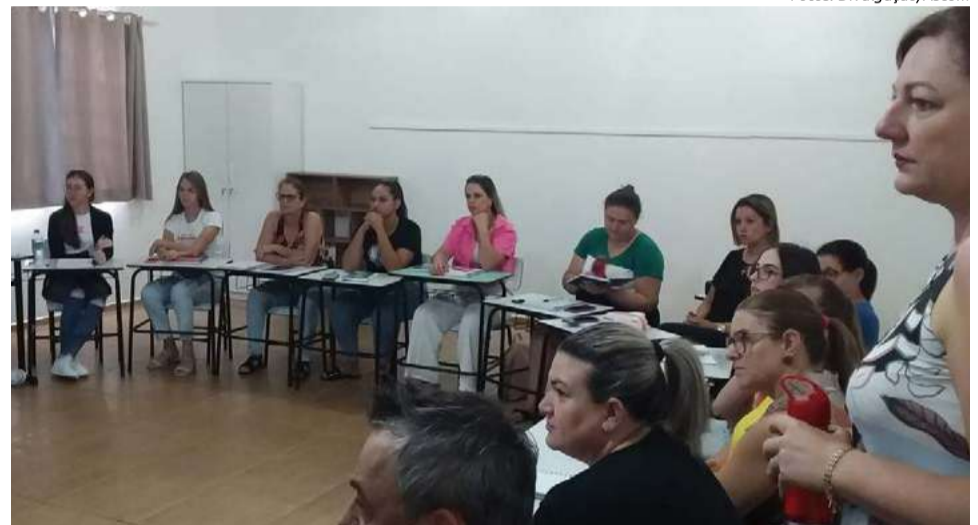
Docentes receberam instruções sobre o programa Saúde na Escola