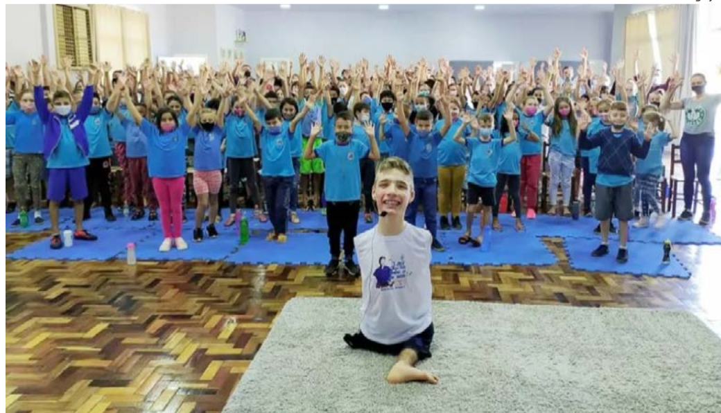
Alunos da rede municipal e estadual também acompanharam o evento