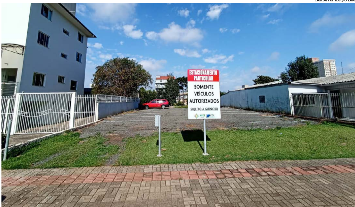
Terreno próximo da Escola Nossa Senhora da Salete

Alguns empresários ainda comentaram sobre a liberação das