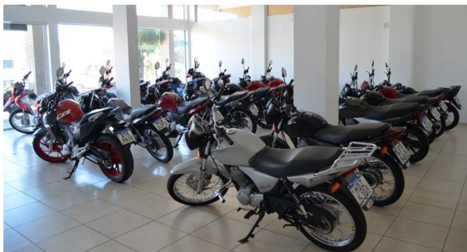
Espaço conta com diversas opções

tes e amigos que fazem parte da trajetória da empresa e convida a todos para conferir as opções disponíveis.