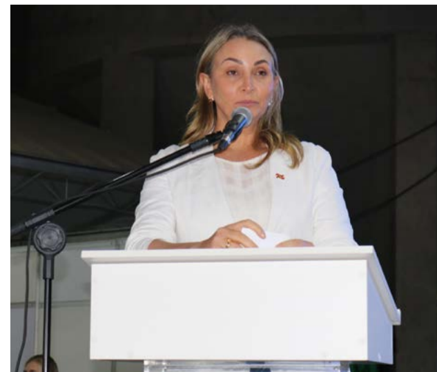
Vice-governadora também falou aos presentes