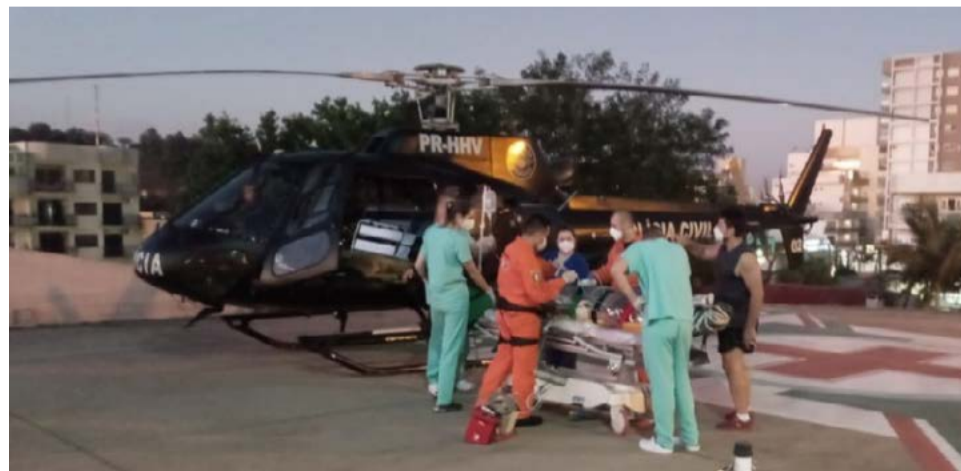
Uma das vítimas foi levada logo depois para o Hospital Regional de Chapecó