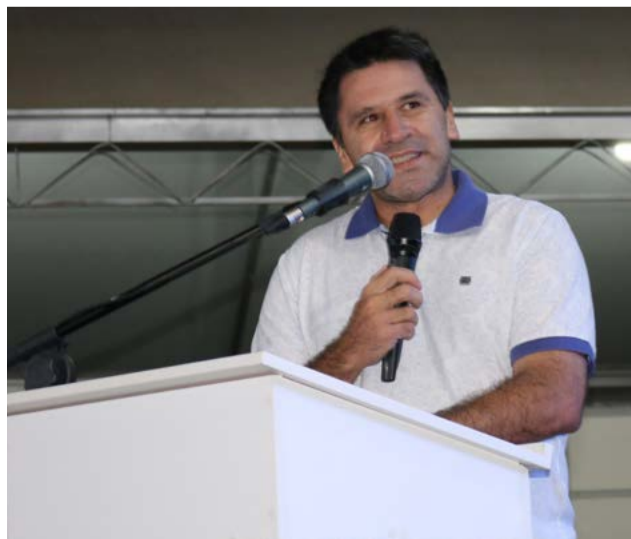
Pároco da paróquia católica de Maravilha deu a benção das edificações