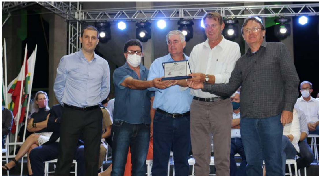
Município de Maravilha entregou placa de homenagem à direção da Auriverde