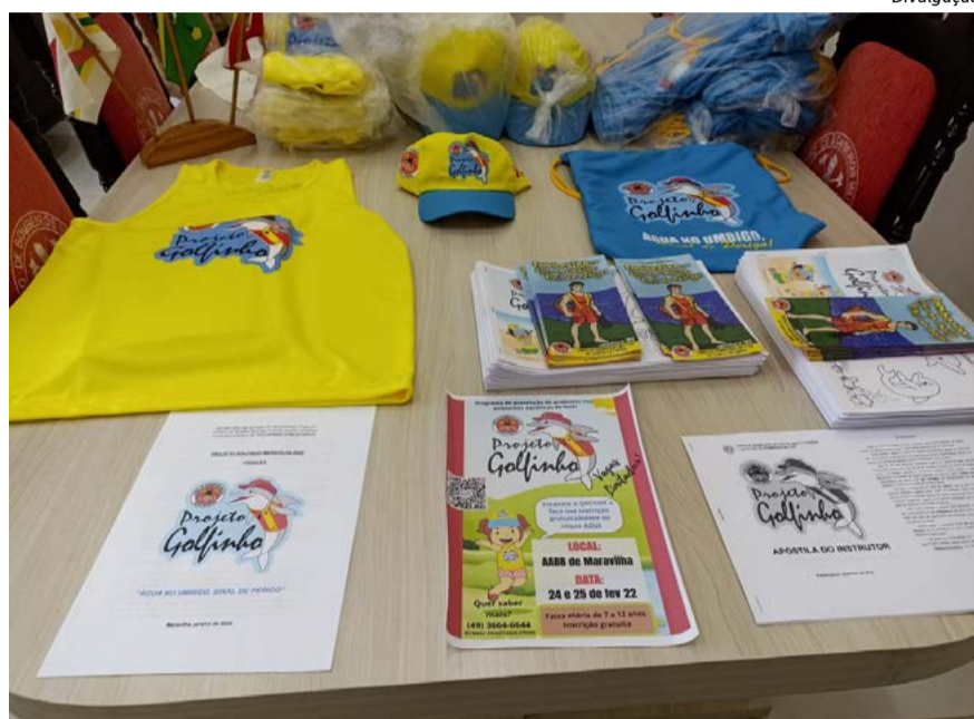
Alunos receberão kit's para acompanhar a aula

Segundo o capitão, são 50 vagas disponíveis, sendo que 25 são destinadas para a Assistente Social e 25 para a população em geral. Os interessados podem fazer a inscrição nas redes sociais do Corpo de Bombeiros Militar de Maravilha.