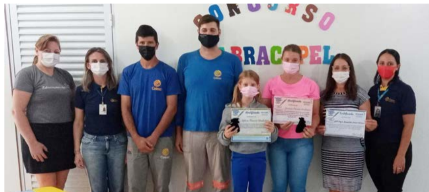
Alunos e professoras receberam o certificado da equipe da Celesc