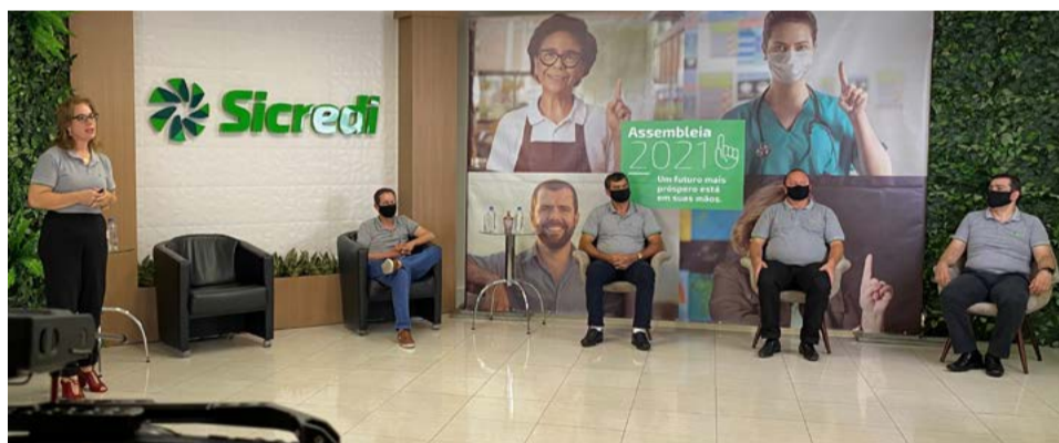
Assembleias serão realizadas no formato digital, facilitando a participação dos associados

Assim como no ano anterior, em 2022, as assembleias serão realizadas no formato digital, facilitando a participação dos associados, para que expressem suas opiniões e decidam os temas deliberativos. Por este motivo, o convite é para que o maior número de pessoas participe