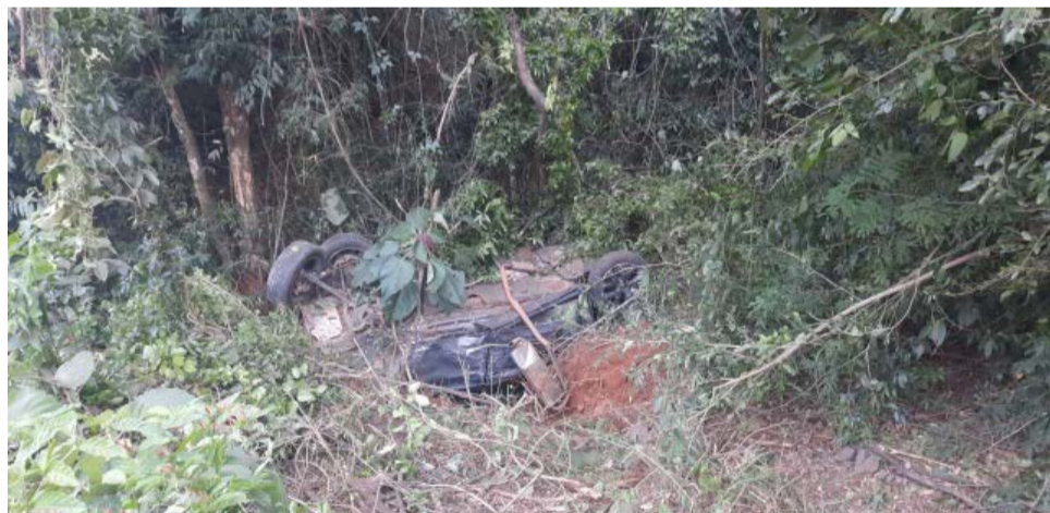
Um dos veículos ficou com as rodas para cima às margens da rodovia

O quinto veículo envolvido foi uma Hilux SW4 com placas de Chapecó, sem vítimas. A rodovia ficou bloqueada nos dois sentidos das 17h30 até às 21h30.