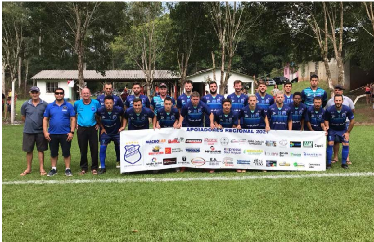
Madalozo joga com regulamento debaixo do braço, em casa resultado simples classifica