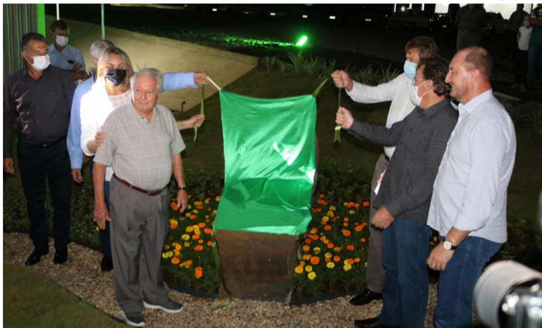
Ponto alto foi o descerramento da pedra inaugural