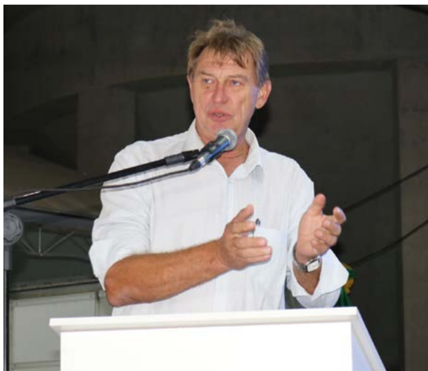
Presidente Claudio Post agradeceu os parceiros na realização da obra