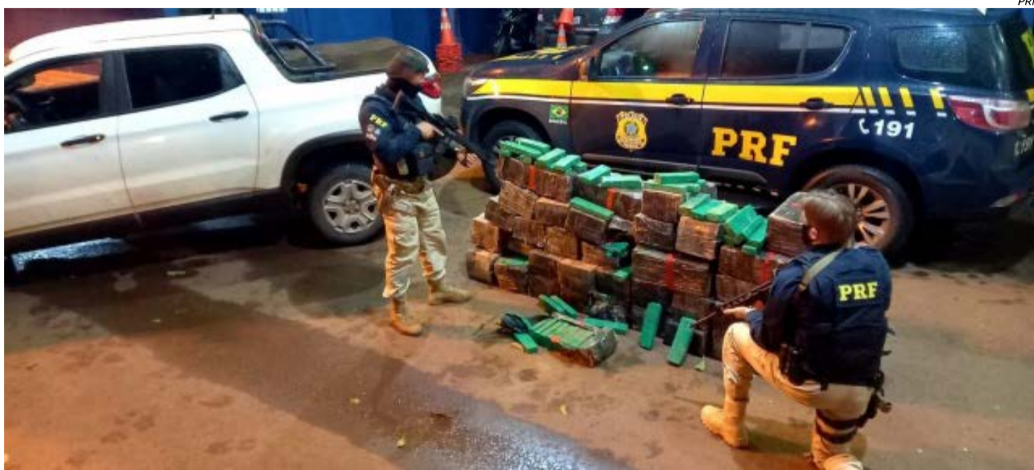
Droga estava em um veículo Fiat Toro e duas pessoas foram presas

Os policiais então passaram a investigar o possível trajeto do veículo, que tinha outro automóvel fazendo o trabalho de "batedor". Por volta das 16h, policias da 5ª SDP de Pato Branco e rodoviários federais identificaram o veículo e também o batedor, um Agile, ambos com