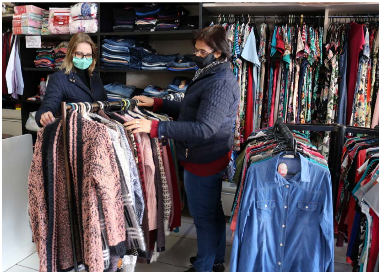
Comércio acabou perdendo vagas formais em 2021, mas teve crescimento na movimentação econômica

O comércio fica com a terceira colocação neste ranking geral de número de empregados, com mais de 2.300 vagas formais, no entanto o saldo de 2021 foi negativo. As demissões superaram o número de novas contratações no comércio maravilhense, que perdeu 77 postos de trabalho no último ano. O setor de construção civil também teve saldo negativo, com 10 vagas perdidas em 2021, empregando apenas 268 trabalhadores formais, conforme dados atualizados em dezembro.