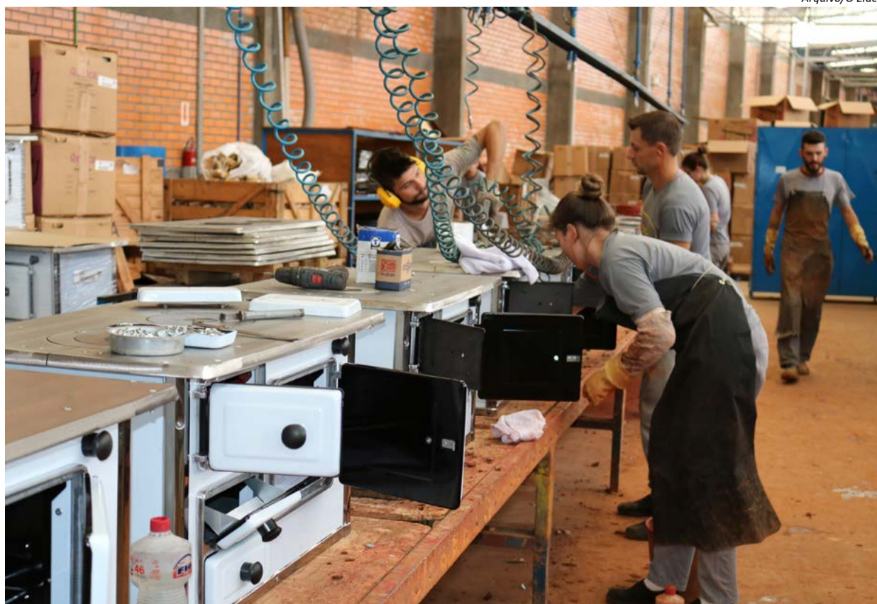
Indústria se destaca em movimentação econômica e geração de empregos

R$ 480 MILHÕES A MAIS NA ECONOMIA MARAVILHENSE