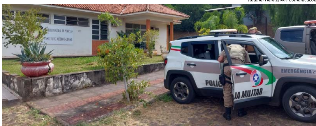
Homem estava em uma residência e foi cercado, preso e encaminhado para a delegacia

Ele estava sendo procurado desde o início da semana, quando fugiu de uma abordagem em Barra Bonita. Desde então, diversas equipes policiais atuaram nas buscas, por toda a região, com objetivo de recapturar o fugitivo.