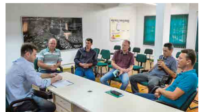
Reunião entre prefeitos e superintendente do Deinfra

do Deinfra, apresentar as reivindicações. O prefeito destaca que lideranças re-