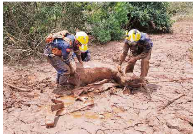
Equipe catarinense no resgate de um bovino

“Durante a noite a gente se reunia e conversava sobre o dia, é uma tristeza muito grande, um cenário de destruição total. Às