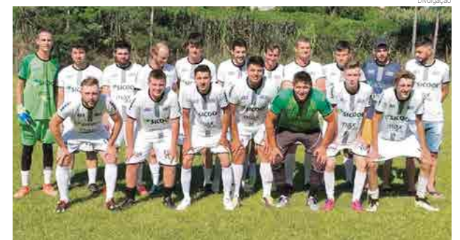
Cadeado/Móveis Queiróz fez 5 x 1 no Guaicurus A

Hoje (16) serão realizados os confrontos entre Guaicurus x Guaicurus A, às 15h30, e em seguida jogam Marmoraria Pape x Cadeado/Móveis Queiróz, folgando Independente da Barra Bonita. Os jogos serão na Linha Cadeado.