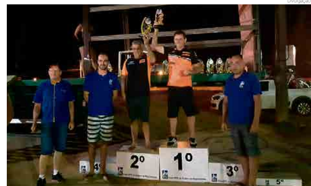
O percurso da prova foi de 250 quilômetros feitos em aproximadamente 10 horas

catarinense. Foram 250 quilômetros de percurso que mesclou trilhas de areia com terra e asfalto. A maior parte do desafio foi percorrida a noite. A próxima competição que Meca participa será nos dias 22, 23 e 24 deste mês, em prova válida pelos campeonatos Sul Brasileiro, Brasileiro e Gaúcho. O desafio será em Cambará do Sul/RS.