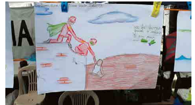
Crianças fazem desenhos para os bombeiros