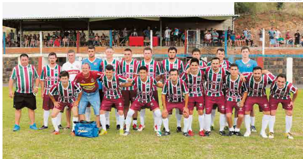
Fluminense A vai a Santa Terezinha do Progresso enfrentar o Miraguai A