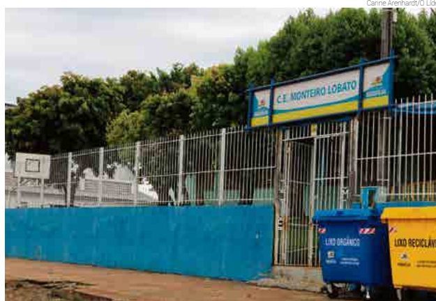
Centro Educacional Monteiro Lobato vai passar por reforma e reestruturação

O primeiro investimento do ano será na reforma e reestruturação de espaços para salas de aula no Centro Educacio-