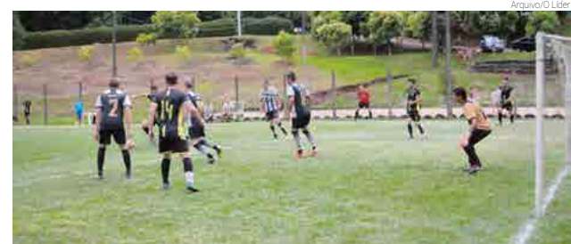
A briga pelo título está esquentando e só os melhores permanecem

mia 0 x 1 Tigres do Barro Preto. Hoje (16) jogam no Estádio Pena Branca, às 14h, Auto-escola Trevo x União Real, depois tem HG Auto Center/Academia Corpo Expressão/Aracnomania x Nova Brasília, às 15h40 jogam Autoelétrica Bordin x PS do Brasil e para fechar a rodada tem Eduarda Móiéis/Rogerinho Montagens x Instalar/Canarinho.