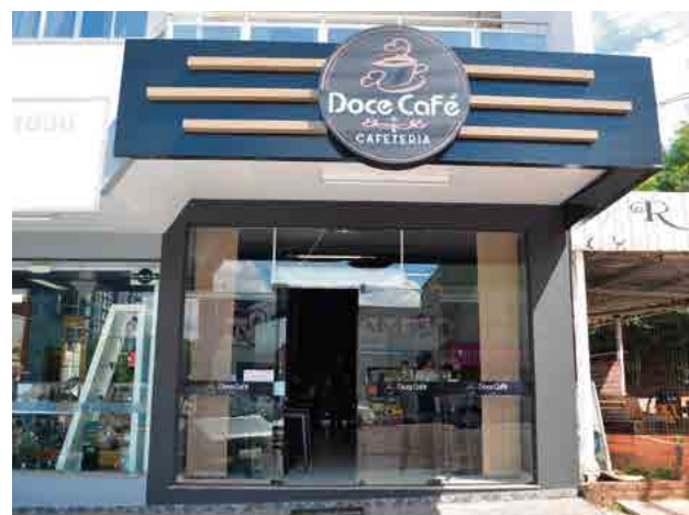
Cafeteria fica localizada no Centro de Maravilha

para venda, com opções novas e usadas, além de locação e serviço de manutenção. “Convidamos a todos para que venham conhecer nosso espaço”, afirmam. A Doce Café atende de segunda a sexta-feira das 7h15 às 20h e no sábado das 7h30 às 12h.