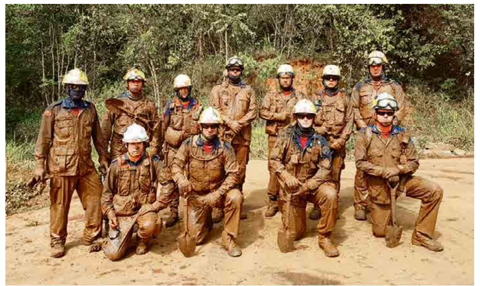
Bombeiros encerravam o dia cobertos de lama