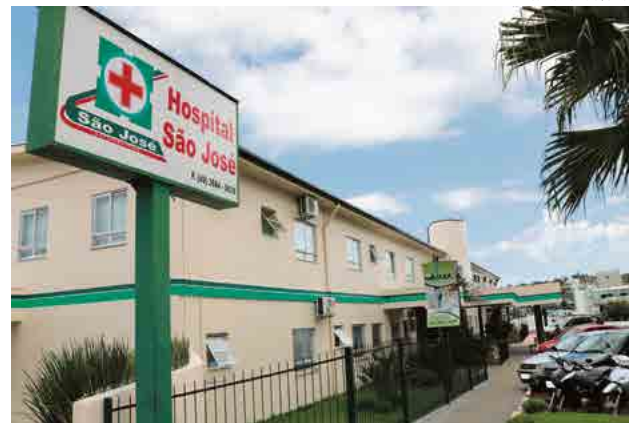
Hospital São José recebe gestantes de vários municípios da região

Em 2018 a entidade hospitalar contabilizou 615 nascimentos, dos quais 320 eram meninos e 295 meninas. A maioria dos partos foi por cesárea, mais de 85% das mães passaram pelo procedimento cirúrgi-