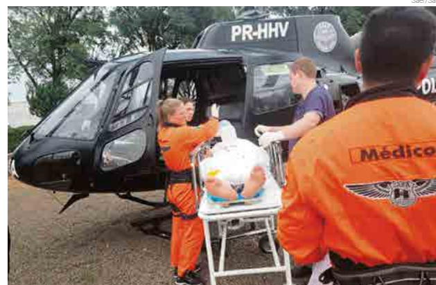
Idoso foi transferido do Hospital de Maravilha em razão da gravidade do acidente

to pela ambulância da equipe da Secretaria de Saú-