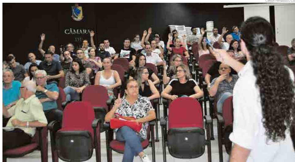
População votou nas adequações do Plano Diretor

Caucionamento e descaucionamento dos lotes - O caucionamento é a garantia que o loteador dá ao município de que vai terminar. O descaucionamento poderá ser parcial: ao final das obras de terraplena-