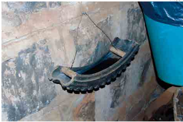
Armadilha também foi deixada na garagem da prefeitura

Segundo ela, nos casos positivos é feito um “pente-fino” em um raio aproximado de 300 metros do local da armadilha. A profissional conta que em novo resultado positivo é feita uma revisão da área. “Basta um punhado de água parada em locais que muitas vezes nem imaginamos para o mosquito procriar. Em calhas, parabólicas, garrafas, vasos de flor. Também já encontramos larvas em bromélias”, alerta.