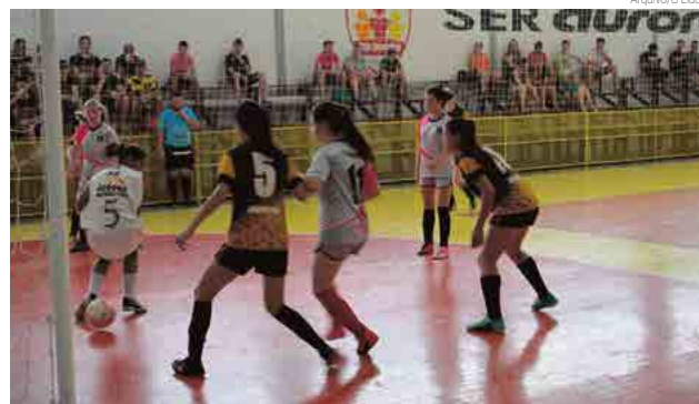
Serão quatro jogos valendo prêmio de terceiro e primeiro lugar

No sábado (23) jogam, pela decisão do terceiro lugar da categoria livre, às 14h, Urso Polar x Dinamo, e a final da categoria livre, às 16h30, Metropol x Urso Branco. A decisão do primeiro lu-