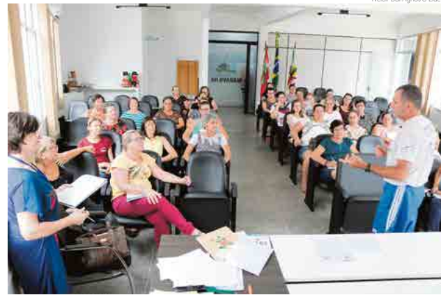
Representantes participaram para definir como serão os jogos