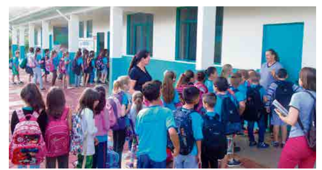
Neste ano, cerca de 100 alunos irão estudar no educandário

dagógica é aproveitar a oportunidade para iniciar o ano da melhor forma possível”, diz. A instituição também dispõe de pré-escola e creche, atendendo crianças a partir dos seis meses.