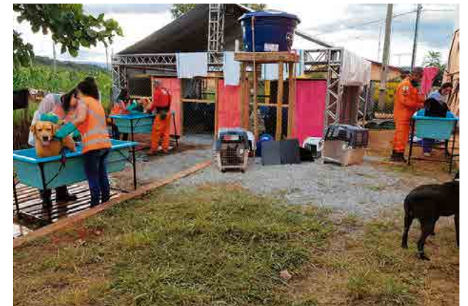
Equipes de voluntários dando banho nos cães

Crianças fazem desenhos para os bombeiros, com homenagens pelo trabalho desenvolvido no cenário pós-tragédia. Há também equipes de voluntários que diariamente dão banho nos cachorros e lavam as fardas dos bombeiros.