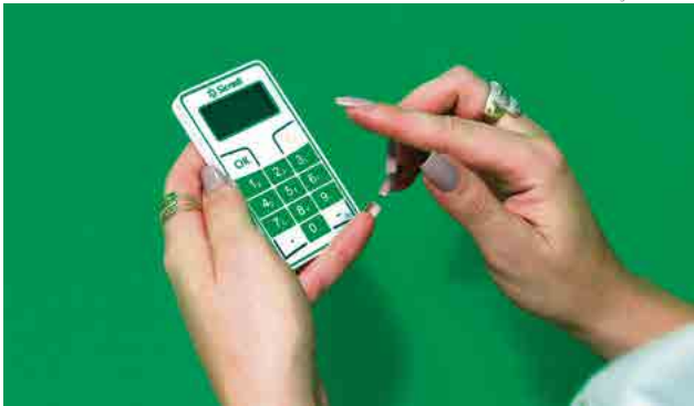
Associados realizarão a votação pelo dispositivo eletrônico