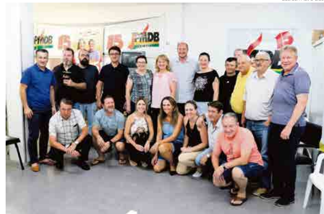
Reunião contou com lideranças locais