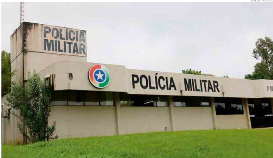
Estrutura terá pavimento superior e mais salas para o trabalho da Polícia Militar

De acordo com o deputado, o recurso de R$ 1 milhão é destinado para a construção de um segundo pavimento no quartel da Polícia Militar do município e outras adequações. No lo-