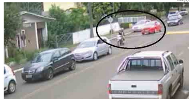
Motorista causador do acidente não parou após congestionamento no cruzamento

Uma mulher de 26 anos sofreu ferimentos leves ao se envolver em um acidente de trânsito no fim da tarde de quinta-feira (14), na Avenida Padre Antônio, em Maravilha. Ela dirigia uma Honda Biz quando foi atingida por um Focus vermelho, conduzido por uma mulher de 62 anos, que lançou a moto para frente. Com o impacto, a moto bateu atrás de um Vectra, que era conduzido por um homem de 27 anos.