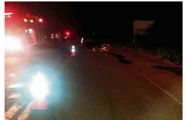
Motociclista colidiu contra a traseira de um caminhão e morreu no local do acidente