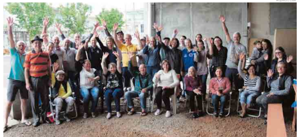
Mais de 400 pessoas participaram da última edição