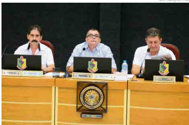
Proposta necessita de aprovação da Câmara de Vereadores e está sendo discutida

O poder Executivo encaminhado para a Câmara de Vereadores o projeto de lei complementar nº 001/2019 propondo Refis para recuperação de valores devidos ao município de Maravilha vencidos até o dia 31 de dezembro de 2018. Na proposta, elaborada pela Secretaria de Administração, Fazenda e Planejamento, os devedores terão descontados os valores de juros e multas decorrentes de atraso nos pagamentos. “A isenção é somente em relação aos juros e multa, ou seja, o contribuinte que está em débito com o município ainda deverá pagar o valor integral com a cor-