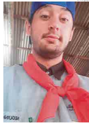
Jovem era integrante da comunidade tradicionalista e querido por todos

O Corpo de Bombeiros de Cunha Porã foi acionado para atender a ocorrência, mas o jovem morreu no local. Ele sofreu múltiplas fraturas. A Polícia Militar, Polícia Civil e Polícia Rodoviária Federal também atenderam