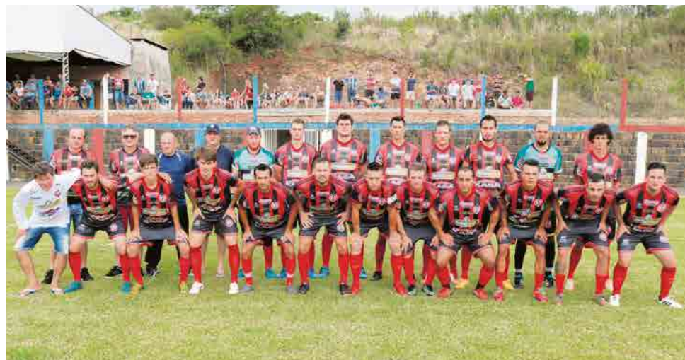
CRM joga na terça-feira (19) a noite no Madalozzo

Palmitos 1 x 0 Ipanema, Na terça-feira (13), ainda pela primeira rodada teve em Riqueza Ginástica/CME Riqueza 2 x 1 Saltinho.