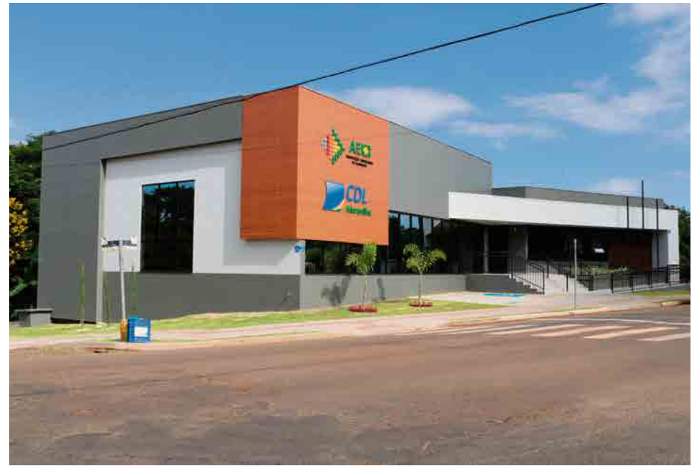
Sede própria fica localizada na Rua Jorge Lacerda