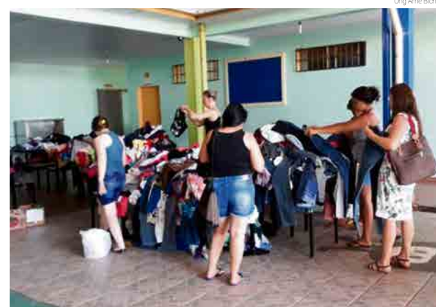
Brechó teve presença dos moradores e venda de calçados e roupas

O objetivo é tentar promover um brechó em cada bairro ao longo do ano. O evento também contou com a parceria da líder de negócios da Natura Sônia Tressi.