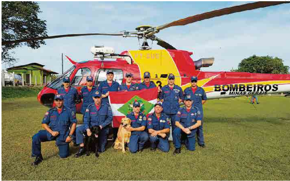
Missão contou com 12 militares catarinenses

É estranho pensar que o resgate de um corpo é o que anima