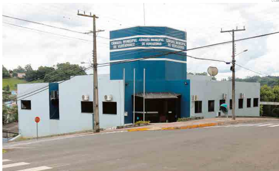
Projeto deverá contemplar mudança na atual fachada da Câmara de Vereadores

até o dia 12 de março, podendo ser prorrogado em caso de necessidade. A dispensa de licitação explica o motivo da contratação do profissional especificado. "Considerando as propostas de orçamento apresentadas conforme documentos acostado ao procedimento, observou-se que a proposta apresentada pela empresa foi a mais baixa em relação às demais, tendo ainda apresentado todas as negativas pertinentes, e assim, em vista do melhor interesse público, será portanto, contratada para o fornecimento do objeto", diz o texto.