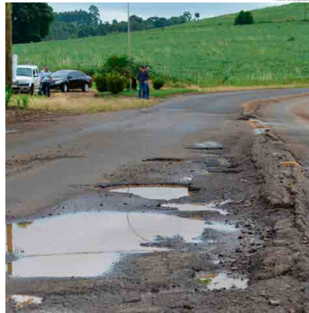
Trechos da rodovia SC-160 estão precários