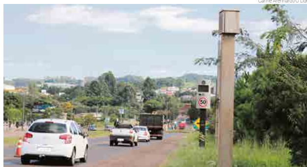
Radares serão retirados das rodovias para instalação de novos equipamentos