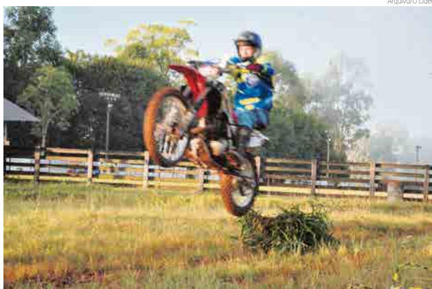
Trilhas já estão sendo preparadas para o evento

metros de trilhas, com ampla área de camping junto