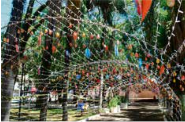
Túnel é destaque na Decoração de Páscoa 2021