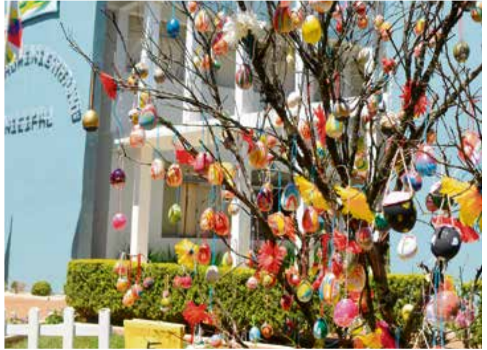
Árvore da Páscoa (Osterbaum) foi montada por integrantes do grupo Volkstanzgruppe Wunderbar