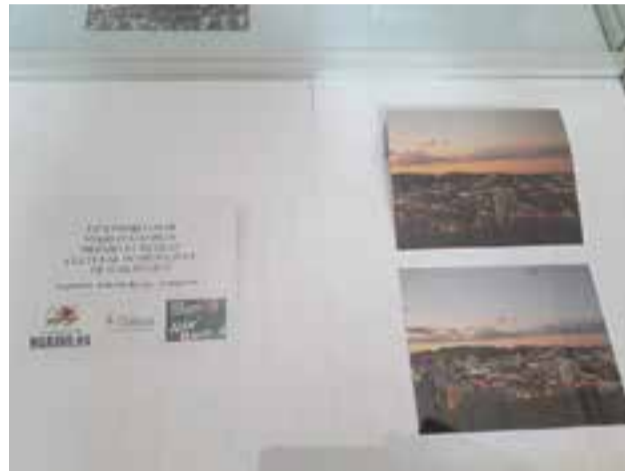
Fotos fazem parte do projeto da Lei Aldir Blanc