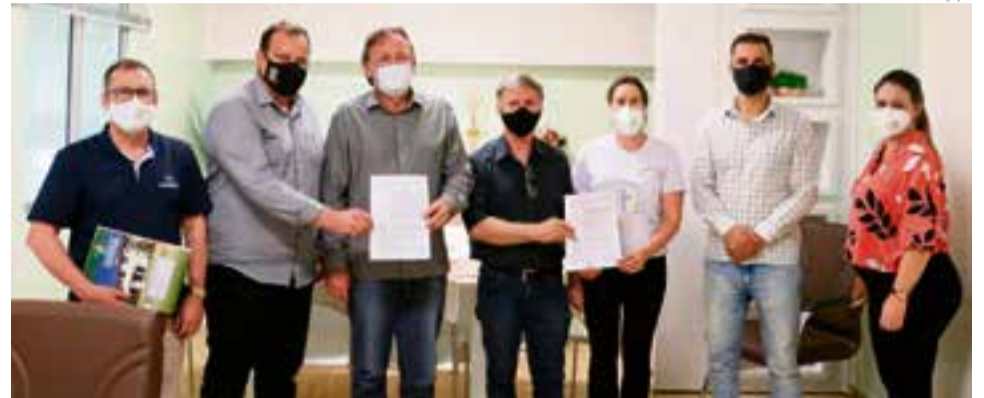
Assinatura ocorreu na semana passada

A Associação dos Municípios do Entre-Rios (Amerios) repassou o valor de R$ 200 mil para quatro hospitais da região. O valor estava no caixa do CIS-Amerios, foi aprovado pelos prefeitos que compõem a Associação e visa custear as despesas decorrentes do novo coronavírus. O valor do recurso é baseado pela quantidade populacional.