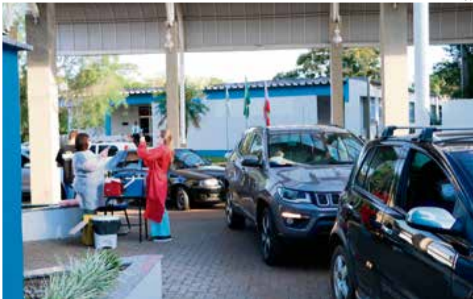
Até o momento foram quatro recebimentos que totalizam 1.034 doses

A vacina Coronavac necessita de duas doses com um determinado espaço de tempo entre as aplicações. Por esse motivo, 275 doses foram destinadas a uma segunda aplicação em profis-