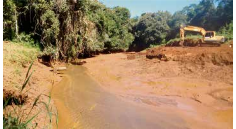
Máquinas trabalharam no local durante a semana e retiraram lama e vegetação