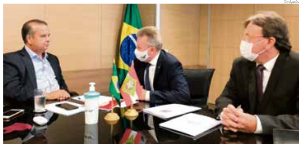
Donati entregou um relatório completo sobre as obras já executadas

Em resposta, o ministro disse que é preciso primeiro a aprovação do orçamento, que deverá ser votado até o dia 24 de março e necessi-