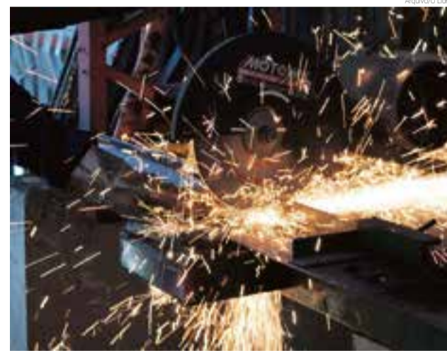
Linha de produção chama atenção pelo número de vagas

Mesmo com a crise econômica relacionada a pandemia de coronavírus, Maravilha registrou um considerável aumento no número de vagas disponíveis. O número de oportunidades aumentou nas últimas semanas e estão disponíveis no Sistema Nacional de Emprego (Sine) de Maravilha. São mais de 250 vagas em diversas áreas de atuação.