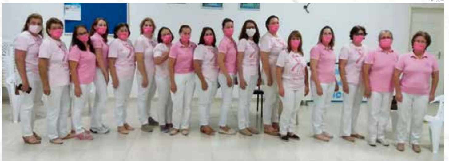
Rede Feminina de Combate ao Câncer de Maravilha trabalha com a divulgação da campanha

Doença é quarta causa de morte de mulheres por câncer no Brasil