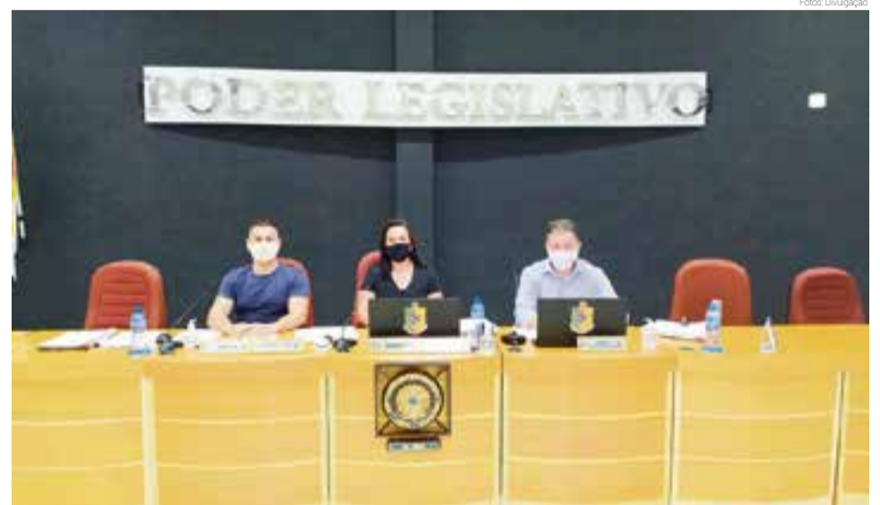
Vereadores devem participar da próxima sessão de forma online

gundo turno o Projeto de Lei Complementar (PLC) que fala sobre o vencimento do cargo de Agente Comunitário de Saúde (ACS). De autoria do Executivo, o PLC altera o vencimento base para o valor de R$ 1.550,00, o qual deverá ser pago de forma retroativa ao dia primeiro de janeiro