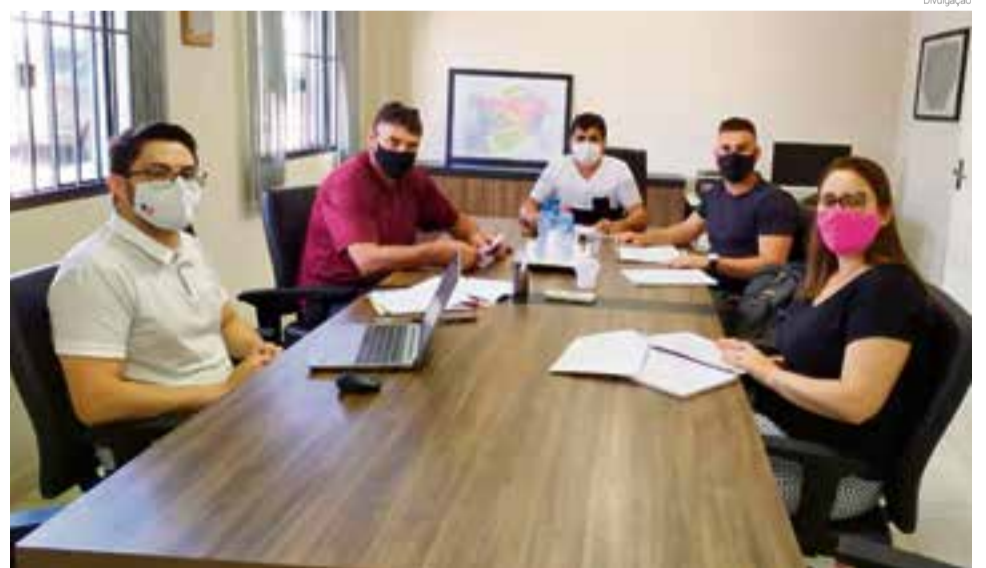
Vereadores debateram o assunto e decidiram promover mais estudos sobre a matéria

Os vereadores debateram o assunto e decidiram