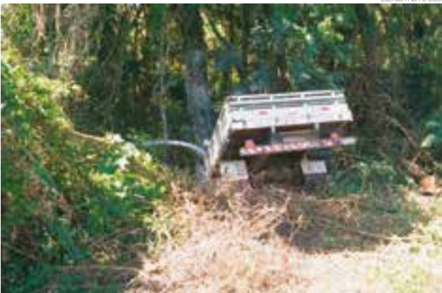
Veículo desgovernado parou quando bateu em uma árvore às margens de um riacho