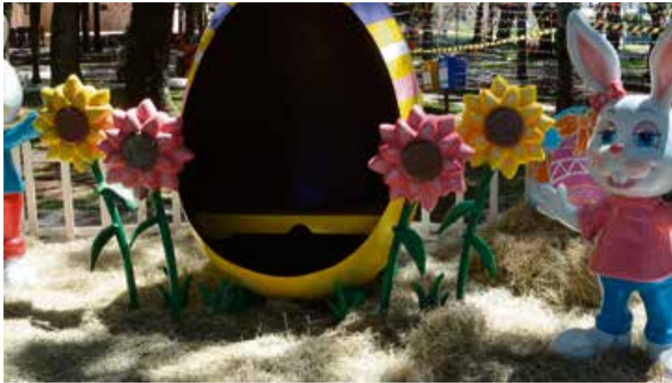
Cenário na Praça Padre José Bunsse é ideal para fotos

neck, foram utilizadas mais de três mil casquinhas plásticas na decoração. "O destaque é para o túnel na praça da Igreja Matriz, enfeitado com casquinhas, cenouras e flores. Além disso, temos coelhos de 1,64 cm