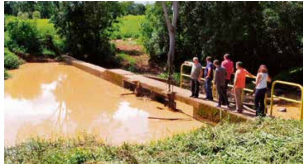
Comissão verificou situação e acredita que melhoria promovida vai fazer a diferença