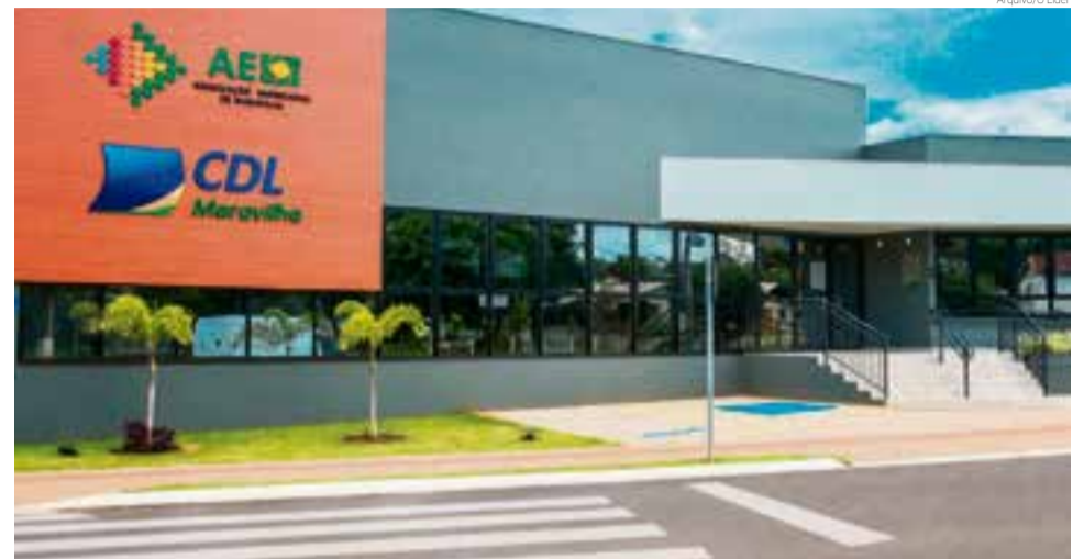
Primeira etapa desenvolverá um curso sobre setor financeiro

so trabalhará temas como: realizar o controle de caixa básico, criar planilha de controle de caixa diário (entradas e saídas), separação das despesas, fechamento de caixa diário, separação recursos sócio x empresa, movimentação bancária, controle de