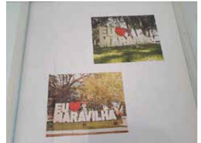
Imagens retratam diversos pontos da cidade