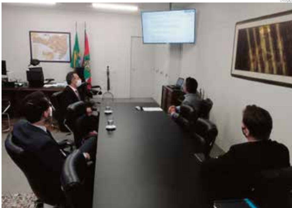
Escola deve ser comunicada imediatamente caso aconteça algum caso de Covid-19 na família dos estudantes ou professores

Foi apresentado aos promotores alguns dados sobre o acompanhamento que a SED realiza junto às 1.065 escolas da rede estadual, com o objetivo de ter o controle das informações para tomar as decisões. Atualmente, há 11 escolas da rede (1,03%), que suspenderam as atividades presenciais por casos suspeitos ou confirmados de Covid-19, de forma que esses alunos e professores passaram para o modelo 100% remo-