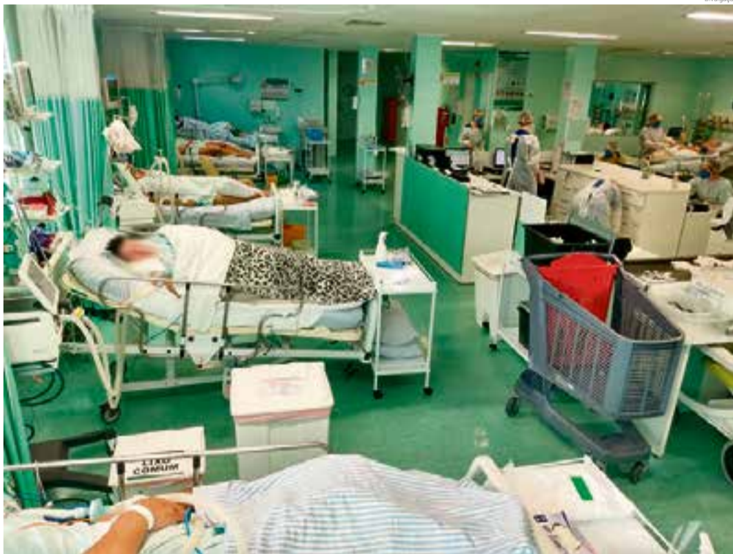
Metade dos pacientes internados na UTI são de Maravilha

78 anos, que está intubada, aguarda uma vaga pela central de regulação de leitos de UTI. Na enfermaria a situação não é diferente. São 17 pessoas internadas na ala Covid-19, sendo sete maravilhenses.