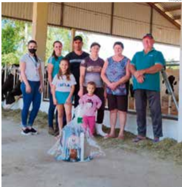
Com o apoio da cooperativa, família investiu em um barracão

Conforme o presidente, Hermes Barbieri, o Sicoob Credial acredita e investe no desenvolvimento e crescimento de seus associados. "A agricultura é de grande importância para nossa região e país, e nos sentimos honrados em sermos reconhecidos como a melhor opção financeira para tantas famílias e agronegócios", finaliza.