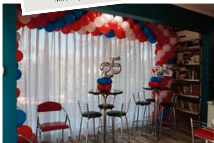
Instituição completa 25 anos de história neste mês

Escola inaugurou sua sede própria no início deste ano