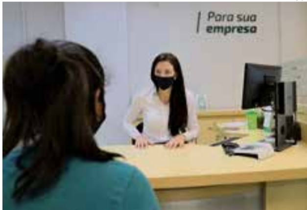
Assembleia será on-line neste ano, em razão da pandemia de coronavírus

Para acompanhar é necessário acessar o site do Sicredi. Após a transmissão dos eventos, os associados (incluindo aqueles que não puderem participar ao vivo) terão 10 dias para acessar o conteúdo e manifestar seu voto nos temas da pauta. Nas agências, os colaboradores estão à disposição para apoiar os associados neste processo, munindo-os de informações e disponibilizando as ferramentas para que possam registrar a presença, opinião e voto.