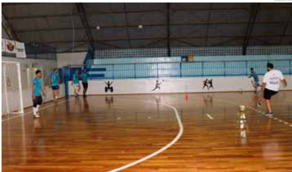
Grupo volta às atividades apenas após o fim do decreto

Atendendo a nova redação do decreto 224/2020 em que foram incluídas novas medidas para diminuir a circulação de pessoas e combater o avanço da Covid-19 em Maravilha, o time adulto do MH Futsal/SEJL/Acema, suspendeu os treinos. O decreto foi alterado e publicado pela Administração Pública de Maravilha, na última sexta-feira (5). De acordo com a direção e comissão técnica da equipe maravilhense, que disputa as competições da Liga Catarinense de Futsal (LCF), os treinos só vão