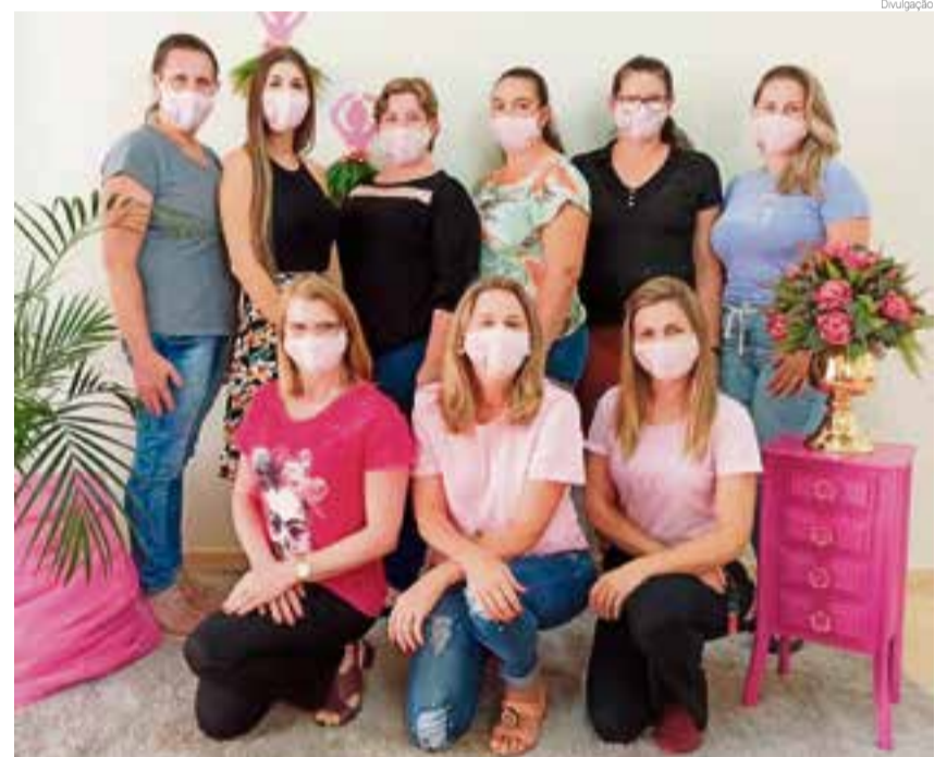
Objetivo da iniciativa foi homenagear as mulheres florsertanenses