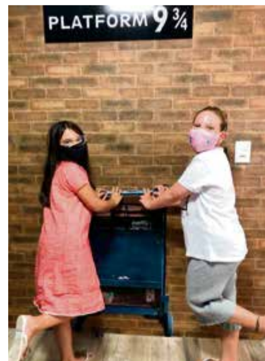
Decoração foi projetada para promover uma interação entre aluno e cultura do idioma ensinado