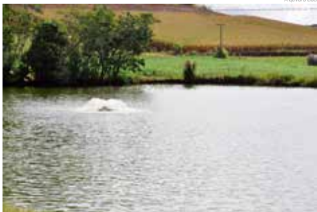
Consumidores poderão comprar peixe na propriedade ou em pontos da cidade

“A falta de chuva baixou as águas dos açudes e diminuiu a produção de peixe para a Semana Santa. Enquanto que nas edições anteriores tínhamos uma agenda apertada para encaixar produtores,