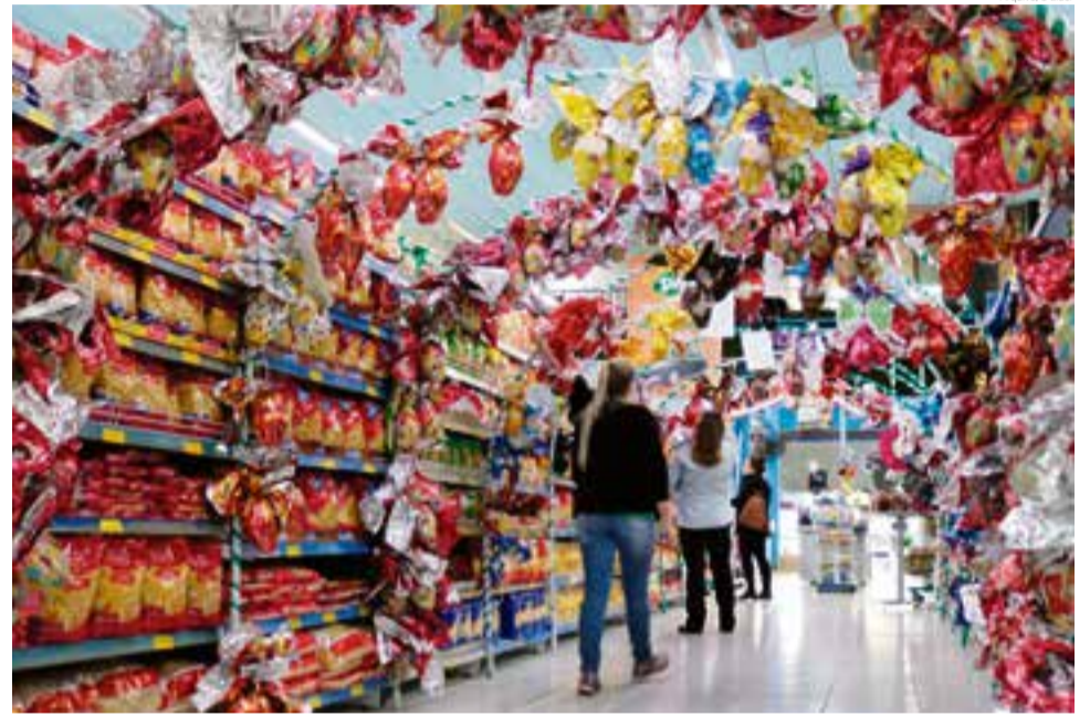
Levantamento aponta que vendas para a data serão superiores às registradas no mesmo período do ano passado

Mesmo com os impactos da pandemia, 42,2% dos entrevistados que apontam aumento na data avaliam que o crescimento do vo-