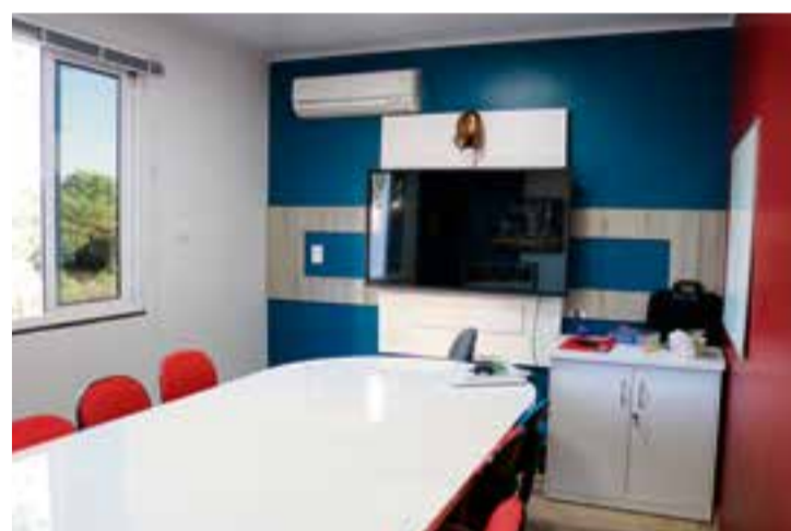
São sete salas equipadas para atender crianças e adultos