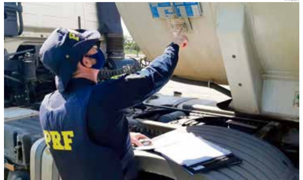
Operação teve como objetivo garantir o transporte seguro de cargas classificadas como perigosas

No entanto, além de oferecer risco ao motorista, estas cargas podem causar danos ao meio ambiente em caso de acidente ou vazamento, com possibilidade de explosões ou incêndios. Por isso, há um conjunto de normas específicas que prevê equipamentos de proteção obrigatórios e procedimentos de segurança a serem seguidos em caso de emergências.