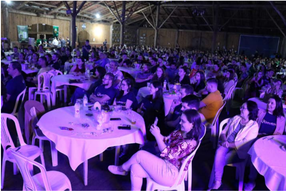
Grande público acompanhou o show

do stand-up A Culpa é do Cabral. Ele se apresentou por último e resgatou piadas do cotidiano.