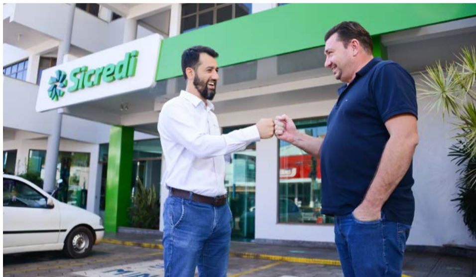
Cooperativa projeta a abertura de mais de 20 pontos de atendimento no Estado