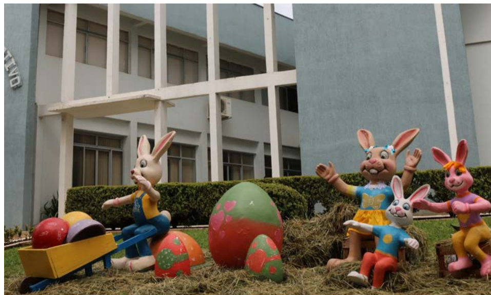
Cenário em frente a prefeitura