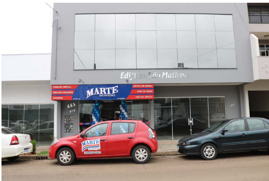
Loja atende na Rua Duque de Caxias

A tradicional loja de decorações de ambientes, Marte, inaugurou a nova sede sábado (19). A partir de agora, o atendimento ocorre na Rua Duque de Caxias, próximo ao Brechó da Rede Feminina. Antes, a loja atendia na Avenida Araucária. O novo espaço é bem iluminado, contém diversas opções de persianas, cortinas e papéis de parede.