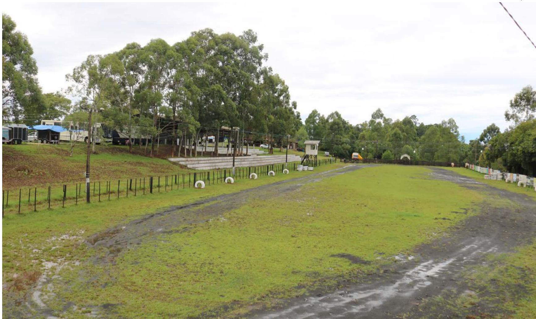
Campeira foi um dos locais que recebeu melhorias