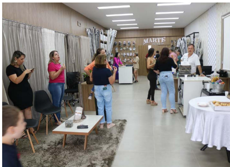
Inauguração movimentou a loja