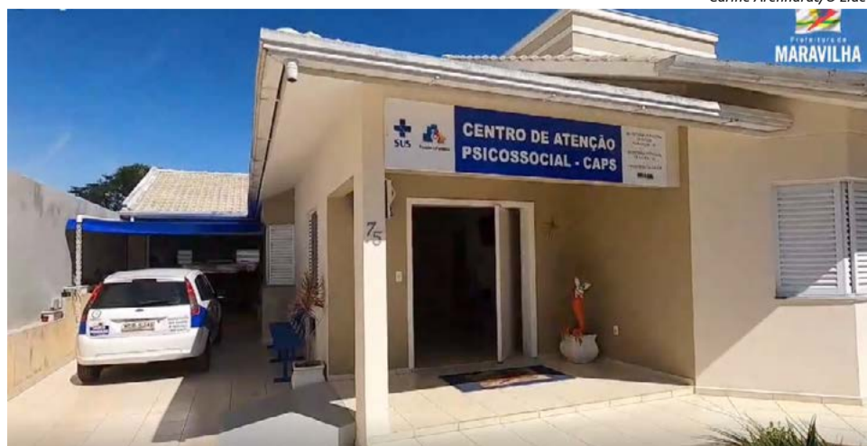
Sede fica na Rua Zacarias Kasper