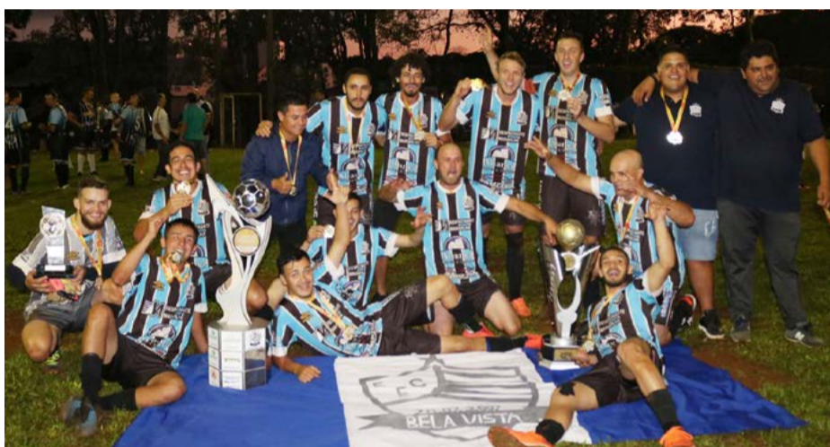
1º lugar: Esporte Clube Esportivo Bela Vista