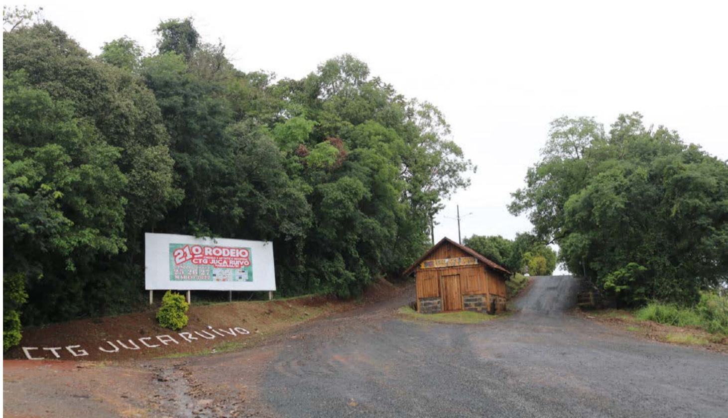
Parque recebeu melhorias para receber a 21ª edição do evento

A programação inicia oficialmente nesta tarde, mas o parque já vinha registrando aumento na movimentação durante a semana, principalmente na área dos acampamentos, com a chegada e organização dos competidores. Nos últimos dias foram intensificados os trabalhos no parque, com melhorias na parte campeira, banheiros, estacionamento, barracão central e também nos acessos.