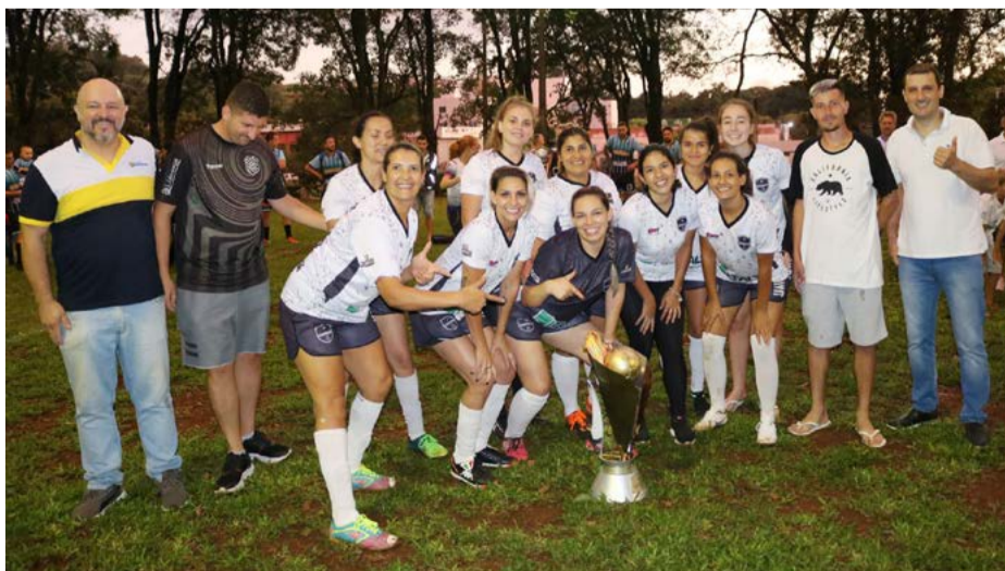
1º lugar: Chavosas