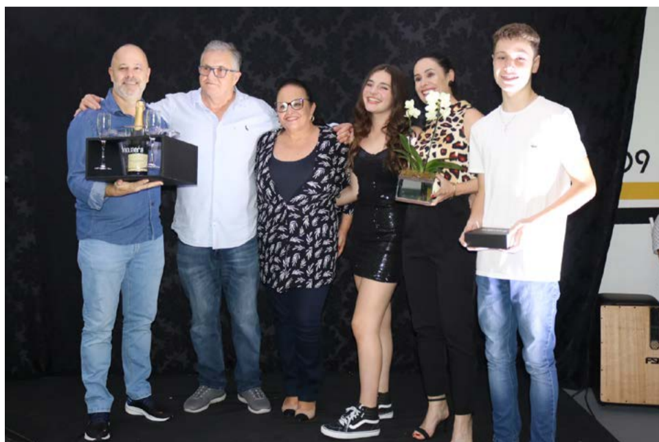
Entrega das chaves dos apartamentos para moradores