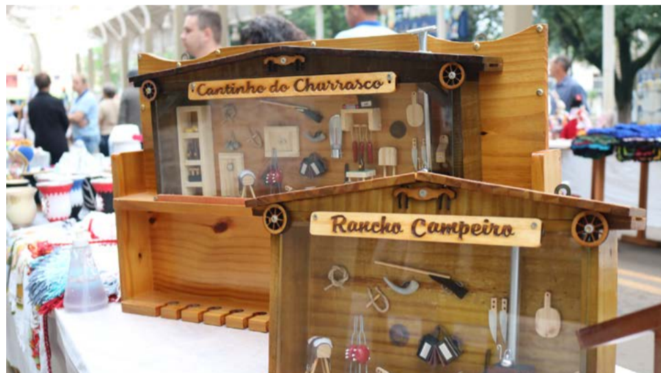
Artesãos comercializaram o trabalho na feira