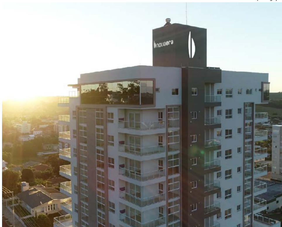
Prédio possui 42 apartamentos