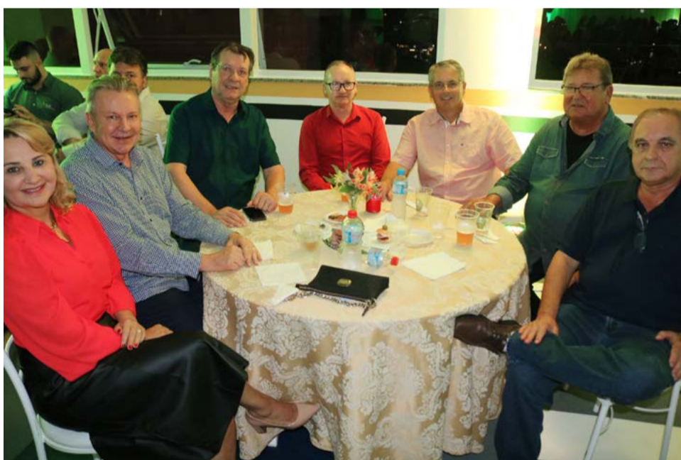
Autoridades prestigiaram o evento