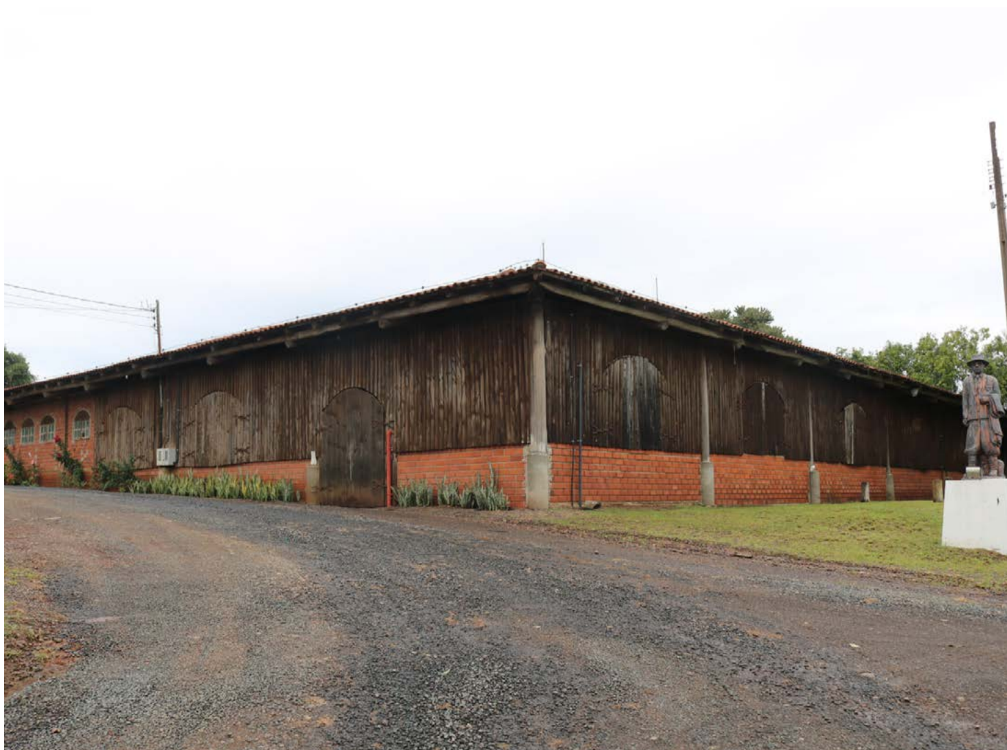
Competições artísticas ocorrem na sede social

Além da parte campeira, a programação artística também está confirmada, com apresentações e premiações no domingo. O início será às 7h, com provas em diversas modalidades, marcando também a realização da 1ª etapa do 16º Festival Regional da Cultura Gaúcha. A parte artística ficou restrita ao domingo devido ao cenário de pandemia e também algumas mudanças que precisaram ser adotadas pela patronagem levando em consideração os custos para realização do evento.