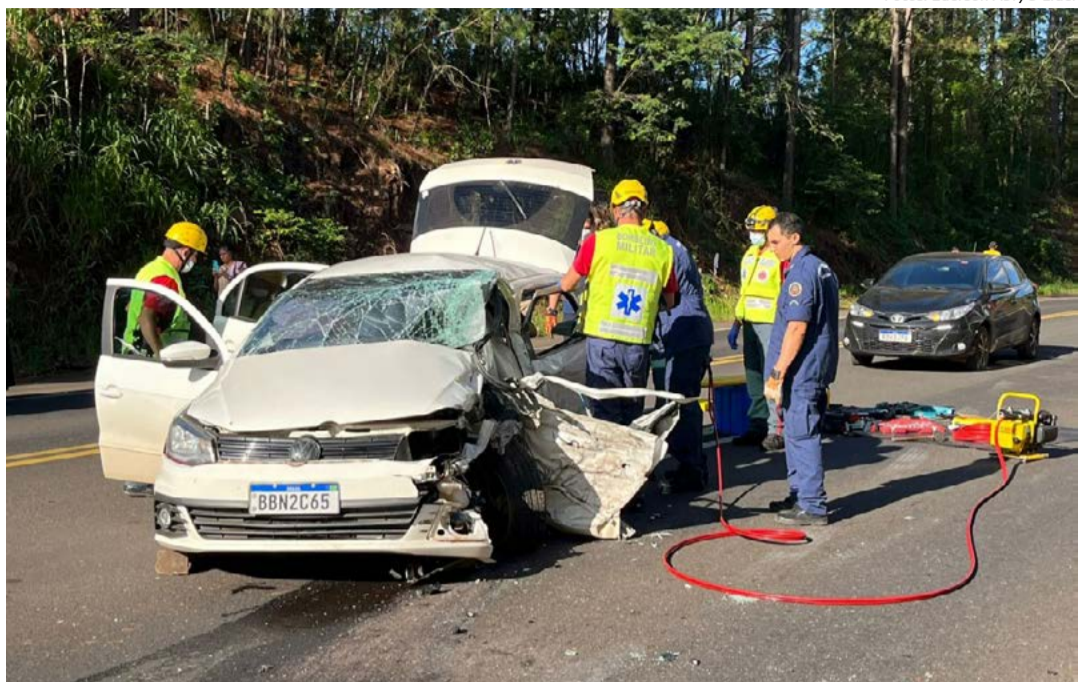
Trânsito ficou bloqueado na rodovia para atendimento do Corpo de Bombeiros e Samu

O trânsito ficou bloqueado nos dois sentidos da rodovia e liberado cerca de 30 minutos depois.