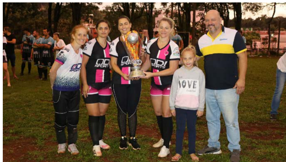
2º lugar: Odi Sports