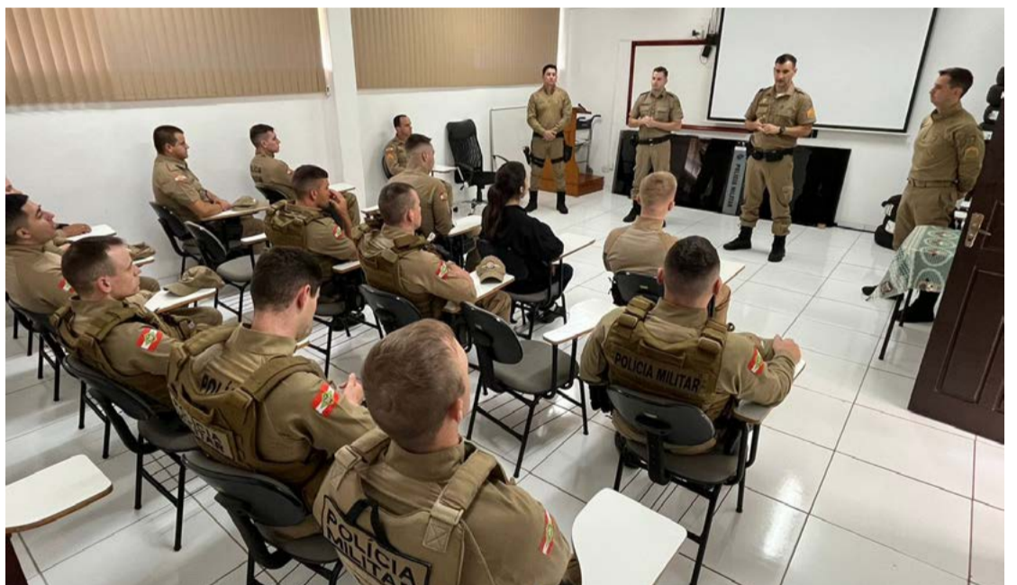
Novos soldados foram orientados pelo comando sobre direitos e deveres