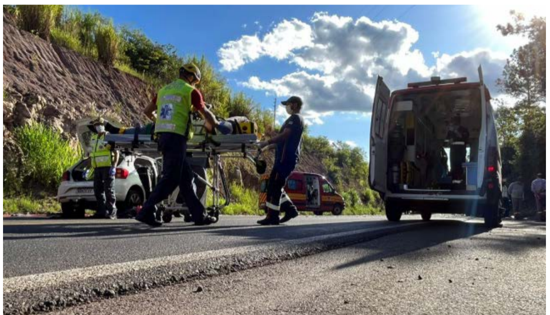
Homem foi resgatado e encaminhado pelo Samu para o hospital de Maravilha