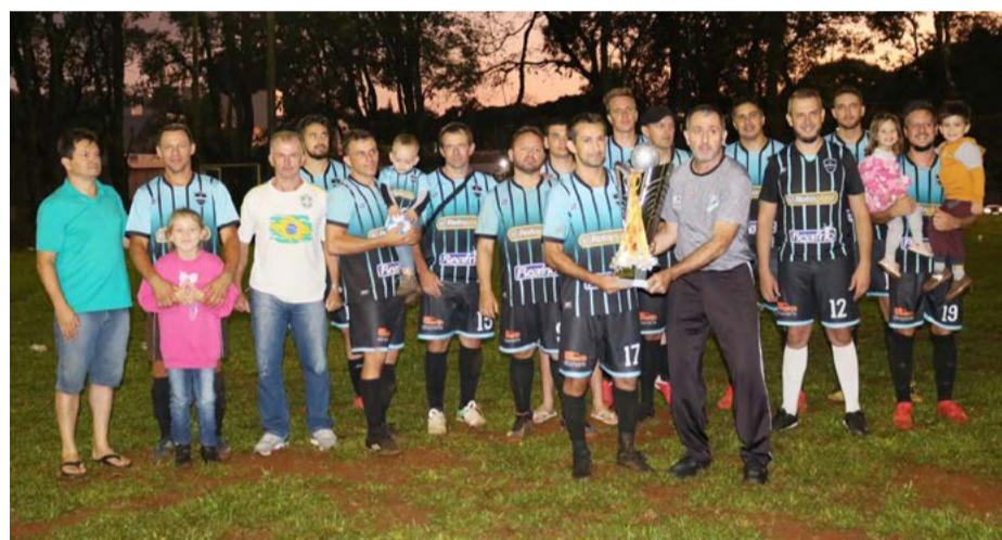
2º lugar: Maravilha Tintas