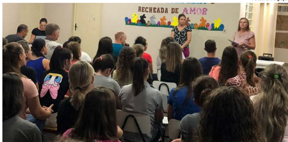
Diretoras do CEI Chapeuzinho Vermelho conduziram os trabalhos