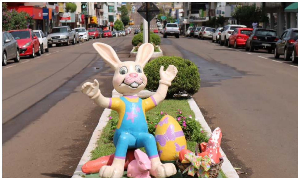
Avenida Araucária também recebe decoração

Nesta semana o município também confirmou a realização do evento Caça aos Ovos, programado para o dia 9 de abril. O evento é organizado pelo Departamento de Cultura e não era realizado há duas edições, devido a pandemia. A abertura está marcada para às 14h, sendo que a brincadeira vai ocorrer em três largadas, conforme a idade das crianças. Cada criança poderá trocar um ovo por um brinquedo. Em caso de chuva a programação será cancelada.