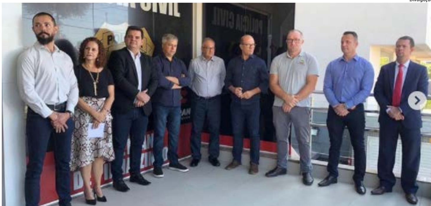
Unidade do Ciretran inaugurada nesta semana em Pinhalzinho

Esta será segunda unidade nova na região, sendo que a primeira foi inaugurada na segunda-feira (21) em Pinhalzinho, a qual vai atender os municípios de Pinhalzinho, Nova Erechim, Saudades, Sul Brasil, Bom Jesus do Oeste, Modelo e Serra Alta, com serviços relacionados a veículos, habilitação e penalidades. A Ciretran de Pinhalzinho também é parte da Delegacia