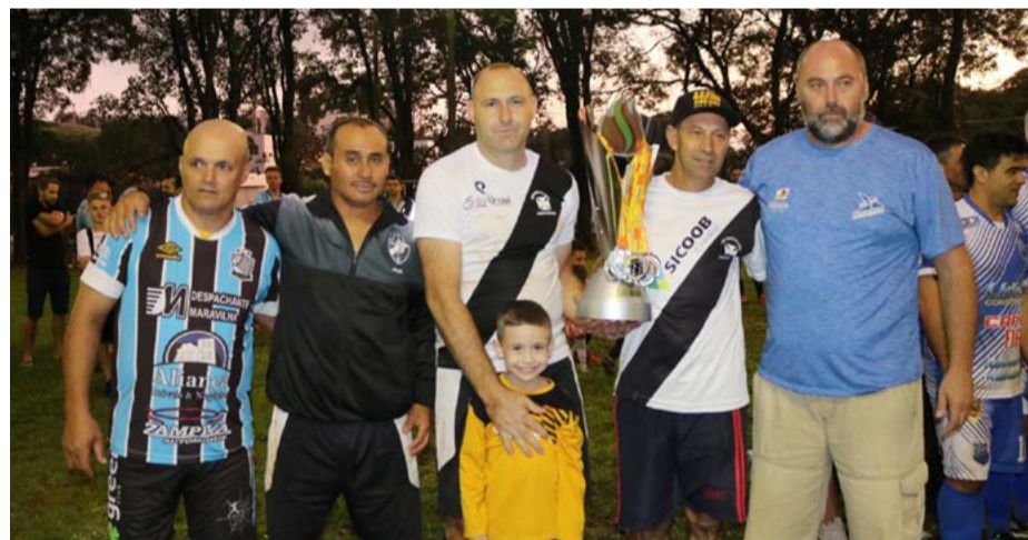
2º lugar: SER Vasco da Gama