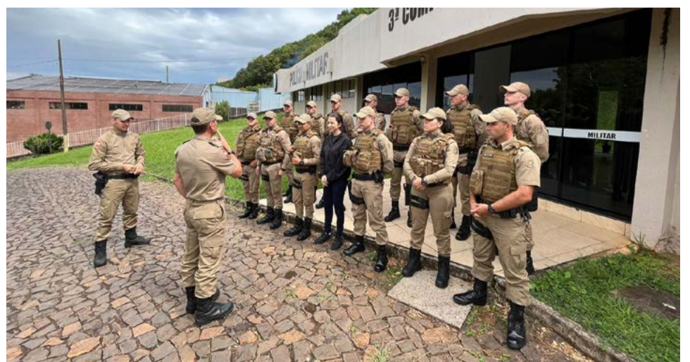
Comandantes orientaram soldados sobre trabalho no primeiro dia na região