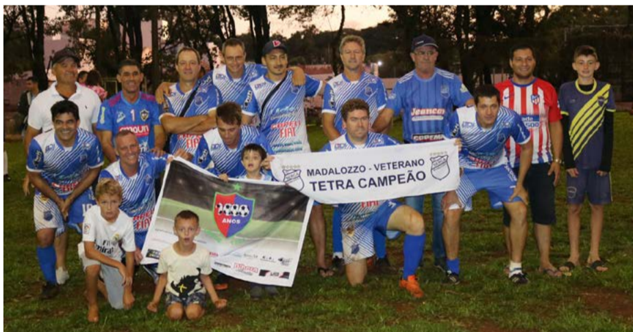
1º lugar: Mil Anos