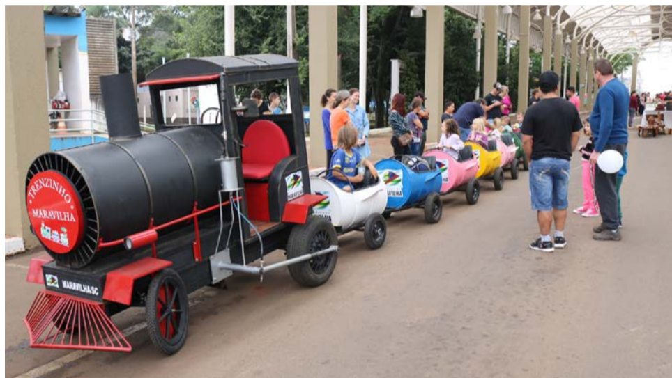
Trenzinho Maravilha foi inaugurado sábado (19)

divertiram nos passeios pela cidade. O investimento no brinquedo é de R$ 17,5 mil.