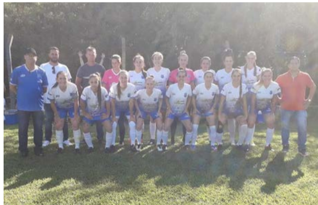
Equipe feminina do Madalozo de Maravilha