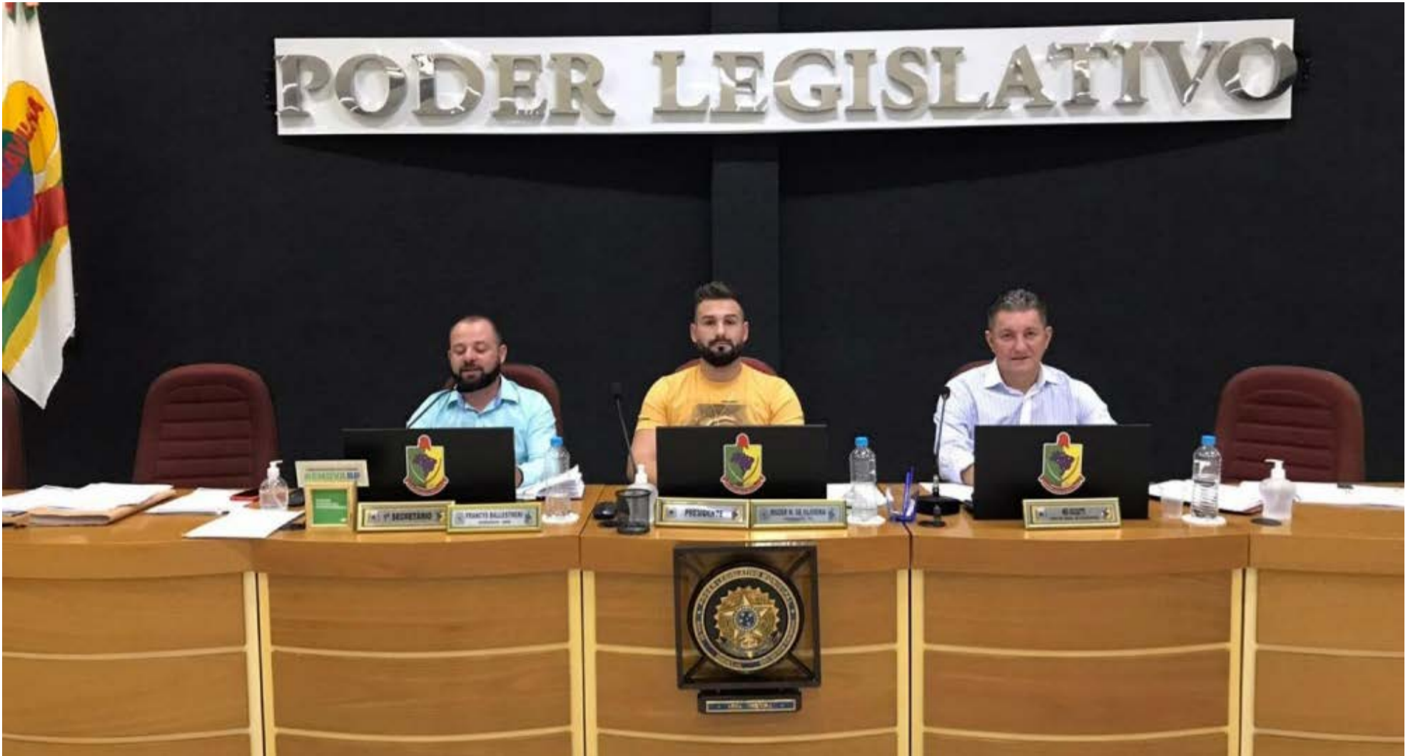
Vereadores realizaram duas sessões na mesma noite para aprovar reajuste de servidores