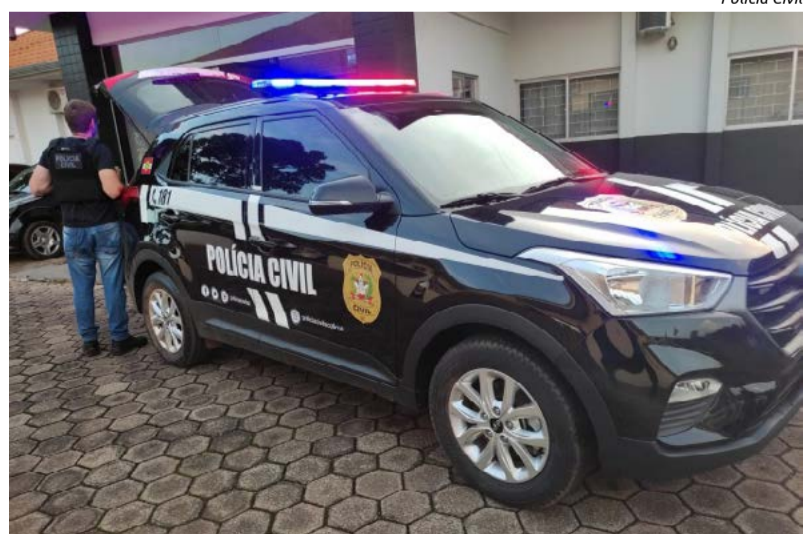
Policiais localizaram homem de 33 anos que estava foragido

O delegado relata que a vítima possuía somente 12 anos