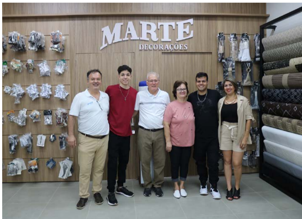
Familiars convidam para conhecer o novo espaço