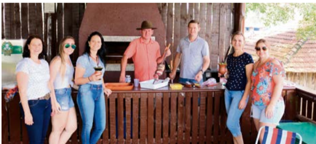
No preparo do churrasco, o acompanhamento é o bom e velho chimarrão