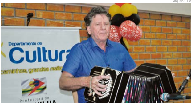
Última edição contou com a participação de mais de 20 músicos

Cada músico irá receber um troféu como lembrança pela par-