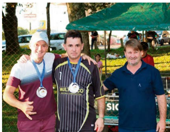
Veteranos: Morte Súbita, Mil Anos e Atlético MH foram as melhores defesas