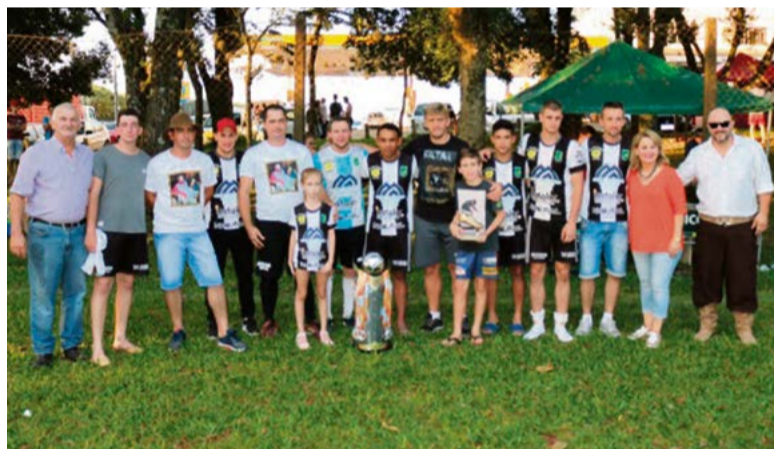
Vice da categoria livre foi Instalar Canarinho de Linha Primavera Alta