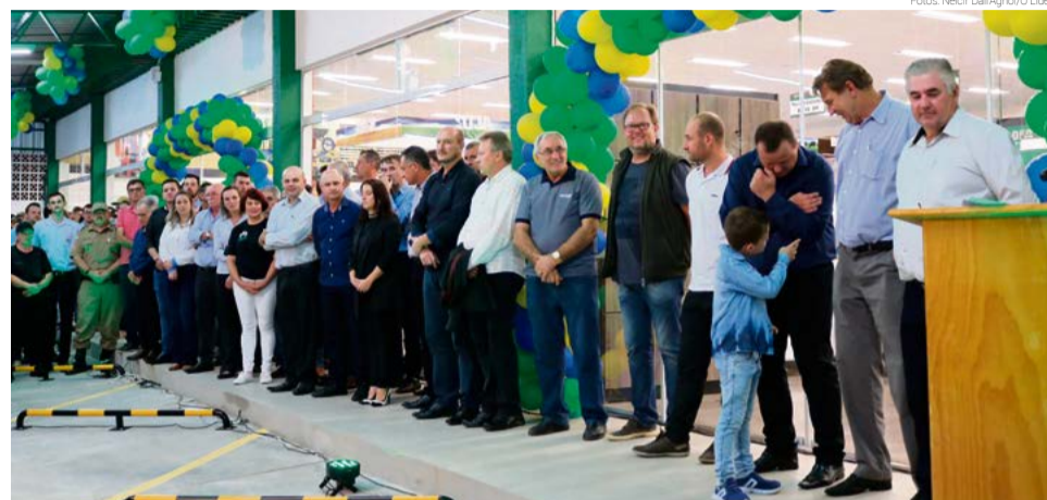
Direção da cooperativa, lideranças locais, regionais e políticas marcaram presença

quetel e na sequência show com o Grupo Chama.