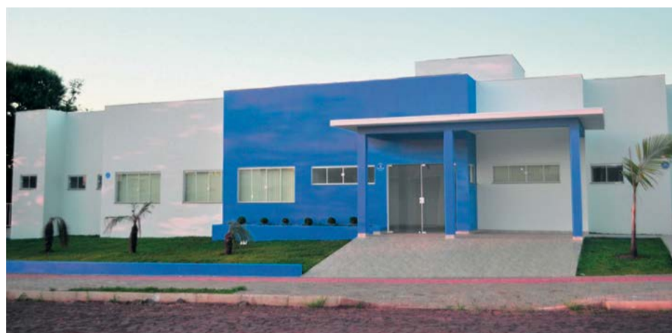
Empresa também atende em obras públicas