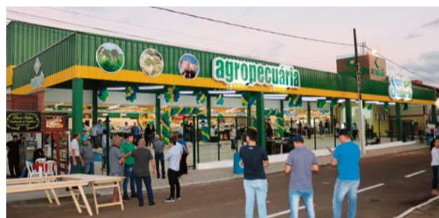
Obra conta com 2.470 m 2 e tem investimento na marca de R$ 3 milhões