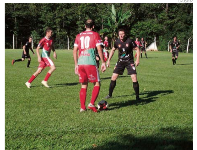
Na primeira partida, Ginástica ganhou de 2 x 0 de Palmitos

Ontem (29) teve, em Palmitos, o time da casa enfrentando Riqueza e amanhã todos os jogos são às 16h, quando, em Caibi, o time da casa pega o Fluminense B e o Fluminense A vai a Mondai enfrentar o Ipanema e em Santa Terezinha do Progresso o Miraguai A enfrenta São Miguel da Boa Vista.