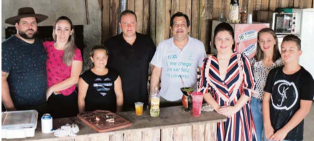
Iraceminha também esteve presente em um dos quiosques

de todos. Churrasco todos tem e há aqueles que preparam costelão, na churrasqueira ou no fogo de chão, e até mesmo o pernil de cordeiro não falta nessas reuniões de amigos.