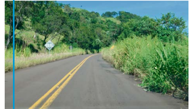
Trechos também começam a receber roçadas

O Departamento também iniciou nas rodovias estaduais da região manutenções preventivas que incluem tapaburacos e roçadas. Os trechos de Iporã do Oeste a Itapiranga, o trevo da SC-386 até São João do Oeste e o trecho de Mondaiá até Águas de Chapecó já receberam manutenção. Agora, segundo o superintendente, o serviço será iniciado na SC-160 de Pinhalzinho até Campo Erê.