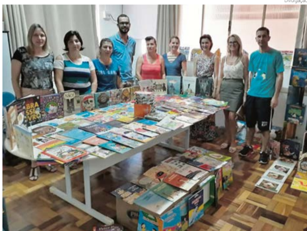
Kit de biblioteca escolar irá contribuir com processo de aprendizagem

Além dos livros, foram adquiridos novos brinquedos. Para Fabiane, o ato de brincar é importante para o processo de aprendizagem e faz com que as crianças estejam mais preparadas emocionalmente para controlar suas atitudes e emoções dentro do contexto social, obtendo melhores resultados gerais no desenrolar da vida.