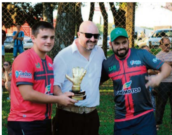
PS do Brasil teve a defesa menos vazada