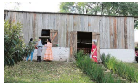
Galpão recebeu reformas, mas será aperfeiçoado

O palco de declamações recebeu as primeiras apresentações no sábado (23). Nesta edição, a estrutura recebeu o concurso da mais prendada prenda, declamações e o concurso de causos, que é a grande novidade de 2019. No início da tarde de sábado o trabalho no local começou com as apresentações do concurso da mais prendada prenda.