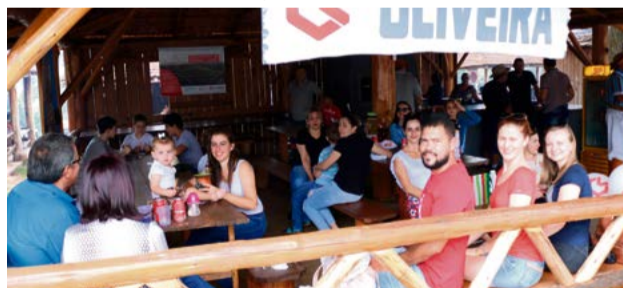
Grupo Oliveira não deixou por menos e reuniu colaboradores e amigos