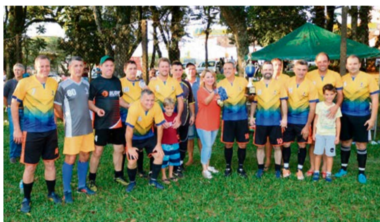
Mil Anos foi campeão da categoria veteranos