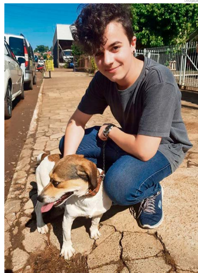
Mesmo com nove adoções, ONG ainda abriga 29 animais