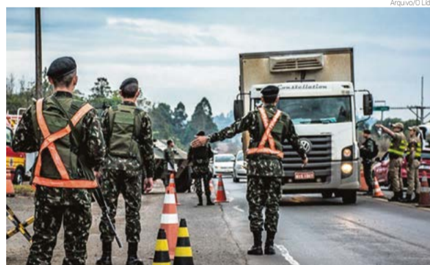
Exército faz pontos de fiscalização nas BRs-282 e 163

Durante as buscas, os militares realizaram a segurança do perímetro enquanto os policiais civis realizavam as buscas domiciliares. Em uma das resi-