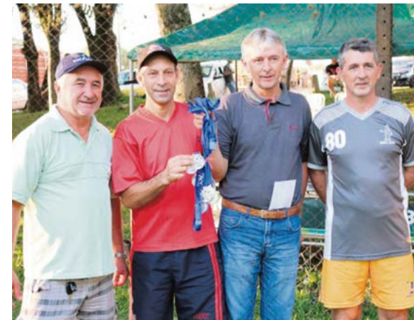
Mil Anos conquistou o segundo lugar dos cinquentões