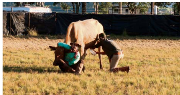
Prova exige força e habilidade dos competidores