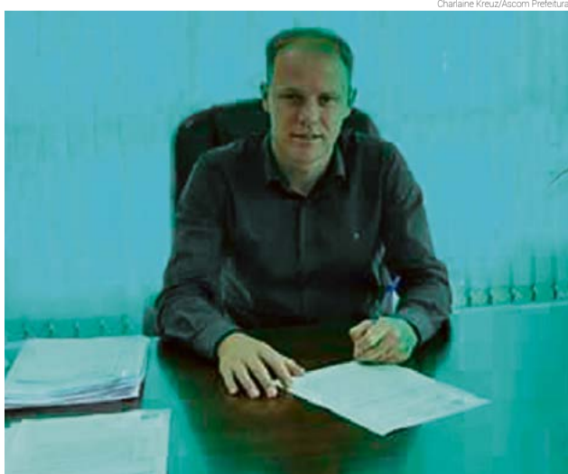
Decreto foi assinado pelo prefeito no último dia 22

o objetivo é repor as perdas e visa também à valorização do funcionalismo público. "Enquanto alguns municípios da região têm grandes dificuldades de pagar a folha, nós, com gestão e economia, conseguimos repassar este aumento para os funcionários públicos", afirma.