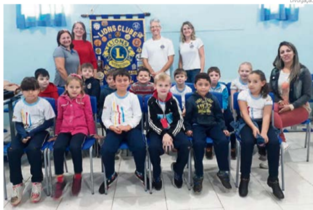
De todas as escolas avaliadas, 30 crianças foram diagnosticadas com alguma dificuldade

tiveram o apoio da Ótica Minerva, que forneceu tecnologia para melhorar a avaliação feita de forma gratuita nos alunos. Na Escola João XXIII foram realizados 158 testes; na Juscelino Kubitschek, 70; na Nossa Senhora da Salette, 153; e na Escola Santa Terezinha, 90 testes. Das 471 crianças avaliadas, 30 foram diagnosticadas com alguma dificuldade. A família foi avisada e posteriormente, se necessário, o clube auxiliará nas consultas médicas, armação e lentes.