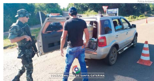
Mercadoria estava em veículo e seria comercializada, possivelmente, na região

É proibida a colheita, coleta, transporte e comercialização do pinhão antes do dia 1º de abril.