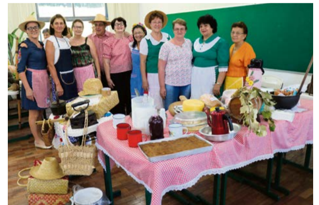
Tradição italiana em evidência