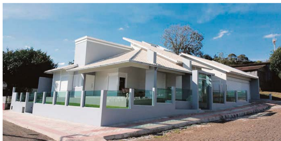
Janelas integradas manuais em alumínio