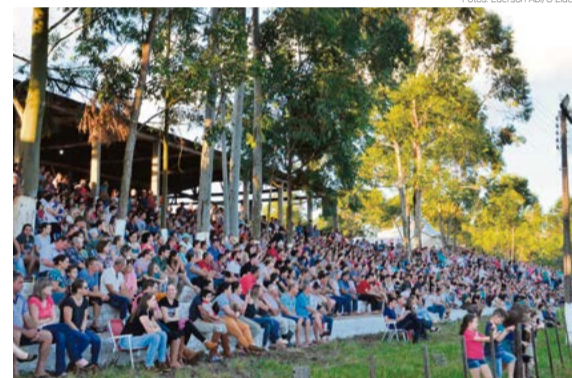
Público lotou a arquibancada da campeira do CTG Juca Ruivo