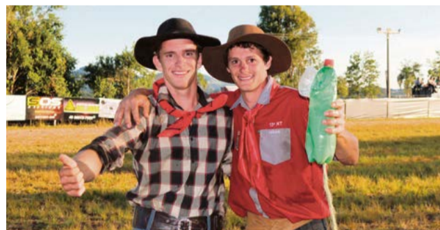
Dupla que mais ordenhou foi de São Miguel da Boa Vista

um segurava o animal, o outro ordenhava. A dupla que mais ordenhou foi de São Miguel da Boa Vista.