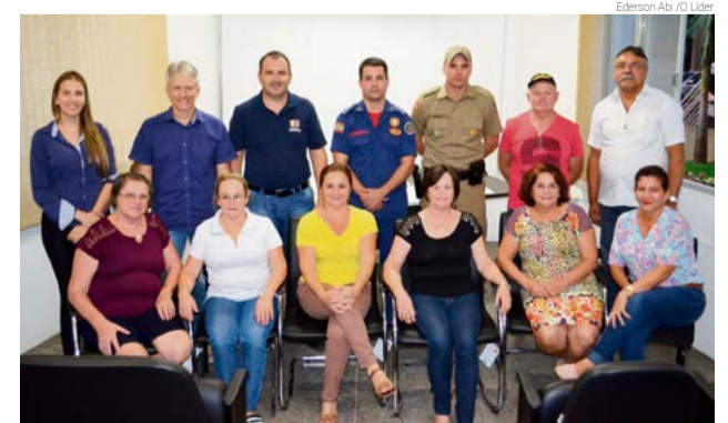
Moradores sugeriram assuntos para debate e integração dos vizinhos

Para quem tem interesse em participar do Vizinho Maravilha, o secretário orienta buscar informações junto à Secretaria de Indústria, Comércio e Turismo.