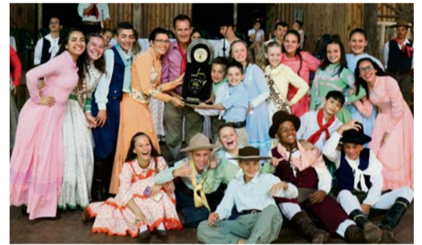
CTG Vaqueiros Foi campeão geral da parte artística do 20º Rodeio de Maravilha