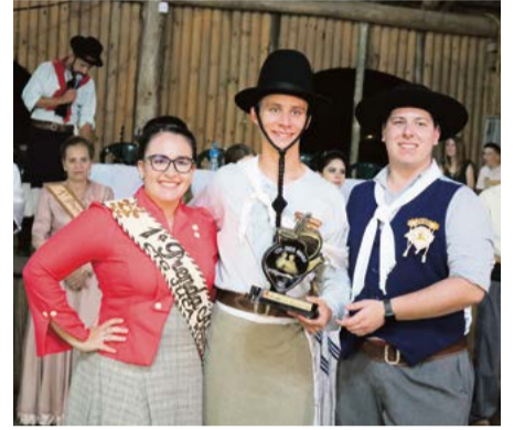
Terceiro na dança tradicional adulto também ficou em Maravilha