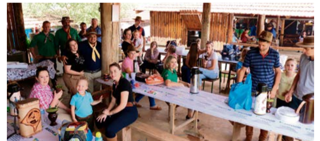
Quiosque ficou lotado no almoço de domingo