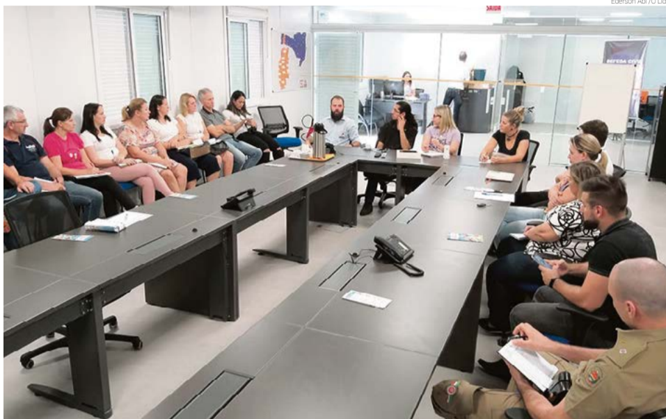
Encontro com parceiros da Sala de Situação foi realizado no Centro Regional da Defesa Civil