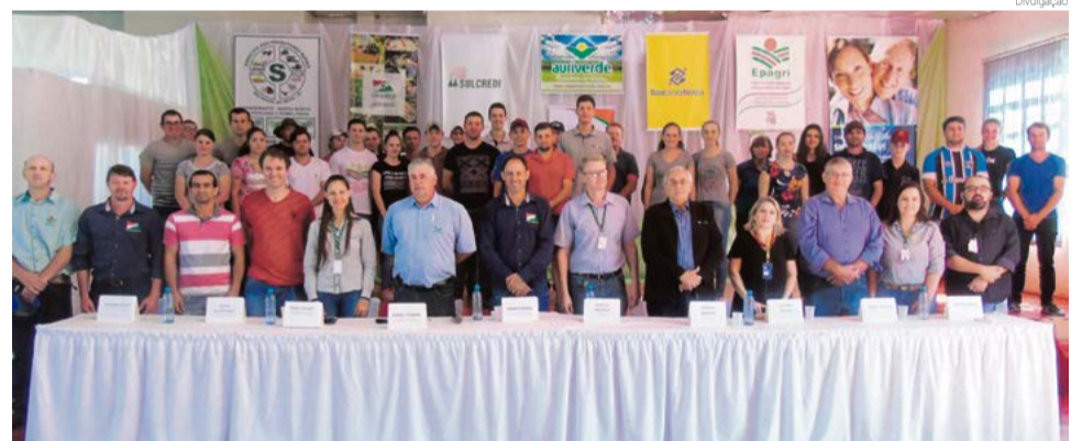
Alunos, familiares e lideranças presentes na solenidade

Cada módulo é composto por uma manhã de estudo e