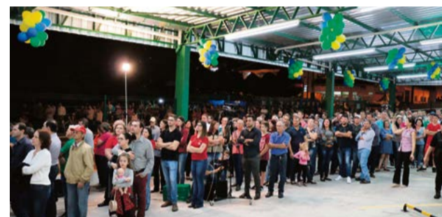
População acompanhou o ato de inauguração