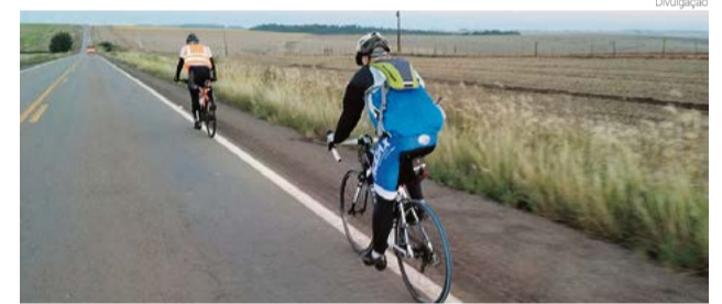
Tempo-limite para completar o percurso era de 20 horas e eles fizeram em 17 horas

Os ciclistas destacam que o Audax 300, nesta oportunidade, teve uma elevação acumulada de 4.556 metros e o tempo para percorrer o trajeto foi de 17 horas com uma velocidade média de 20,8 km/h. O tempo-limite permitido para realizar o desafio era de 20 horas. “Teve um pouco de vento con-