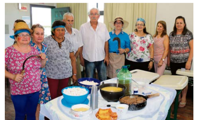
Cultura cabocla também foi tema apresentado