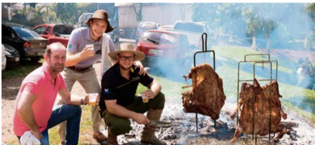
Costelão no fogo de chão que os amigos prepararam para almoçar no domingo