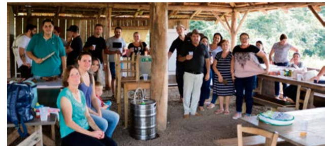
Chope regou o momento de descontração junto aos amigos