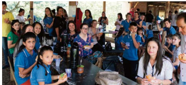
Escotismo tem espaço garantido dentro do parque do rodeio