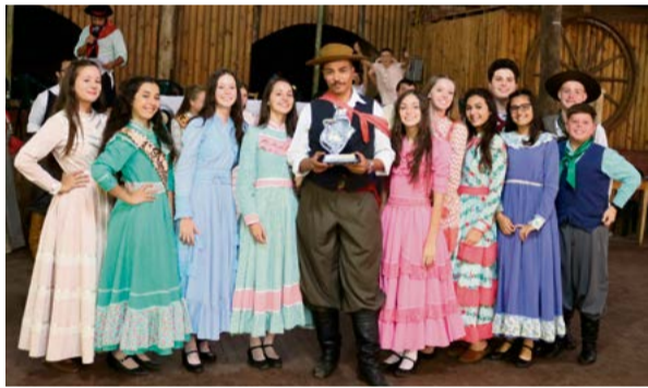
Dança tradicional juvenil B: o melhor grupo foi de Maravilha