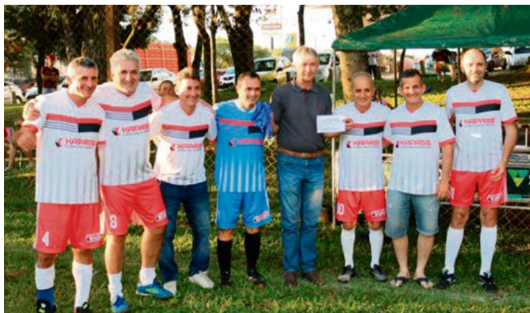
Kappas/Cinquentões foram os melhores na categoria cinquentões