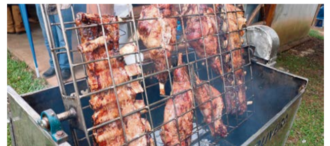
Costela de gado e aquele pernil de cordeiro nunca podem faltar em rodeio