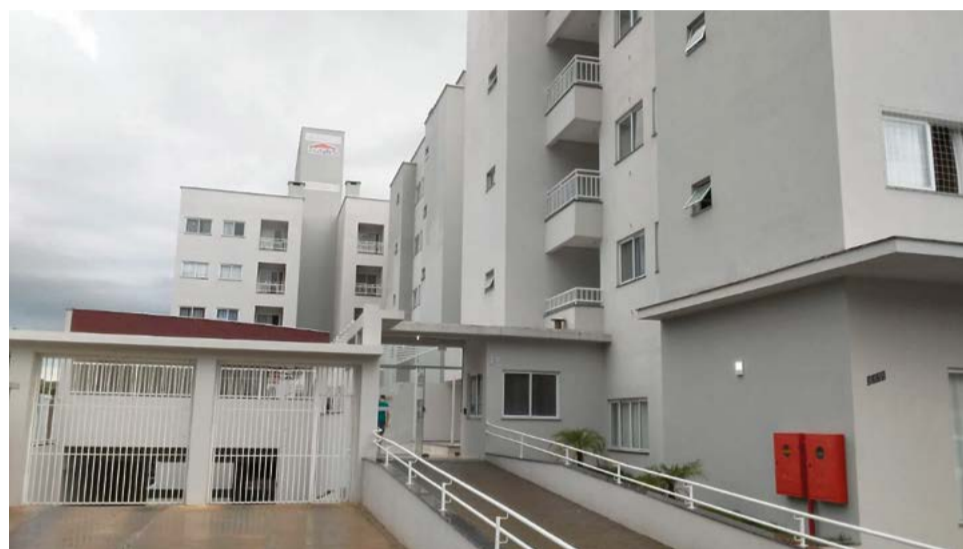
Esquadrias em alumínio