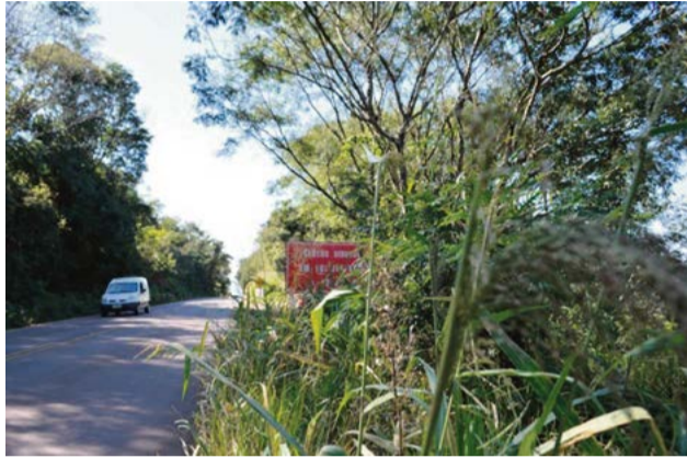
Deinfra pede a instalação de seis balanças de pesagem na região

O objetivo é controlar o excesso de cargas nas rodovias estaduais e o pedido foi encaminhado à Secretaria de Estado de Infraestrutura. "Solicitei seis balanças, uma na divisa do Paraná