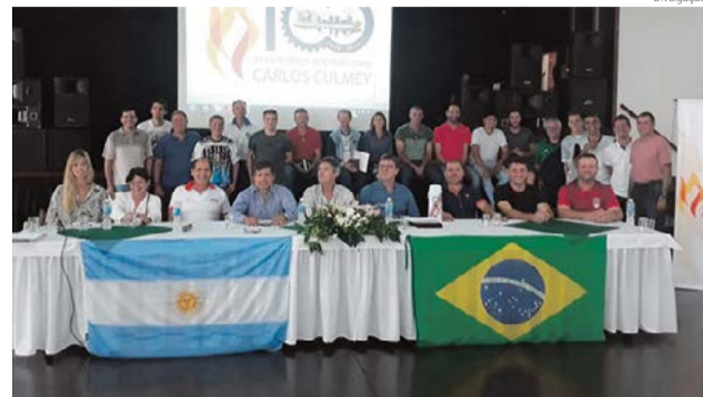
Reunião foi realizada no último dia 22, em Puerto Rico, na Argentina

Na oportunidade foram definidas as modalidades que