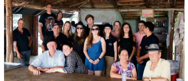
Aqui a alegria não faltou no momento do almoço do domingo