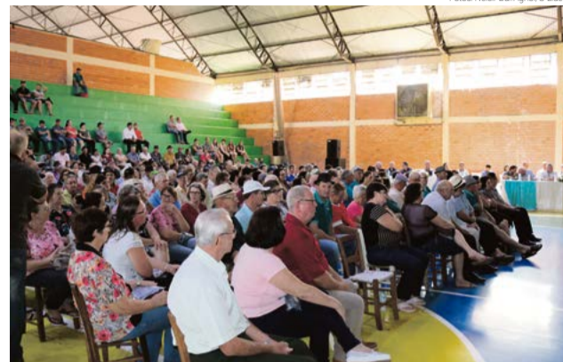
Reunião foi realizada em Cunha Porã, município-sede da instituição

de R$ 14 milhões foram destinados para os associados em forma de capitalização e conta corrente e R$ 7 milhões foram para reservas.