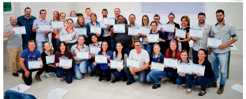
Profissionais contaram com quatro meses de treinamento

O conteúdo abrangeu técnicas de vendas, programação neurolinguística, planejamento e organização do tempo, negociação e atendimento, oferecendo ferramentas para aperfeiçoar o traba-