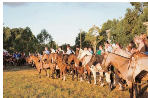
Tradicionalistas se emocionaram com o momento