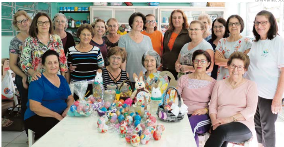
Voluntárias se reúnem nas tardes de terça-feira para confeccionar os produtos