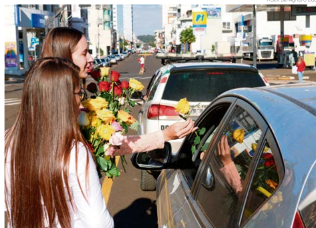
Venda de flores nos semáforos resultou em R$ 3 mil