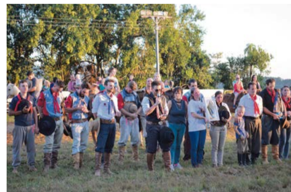
Participantes do rodeio pedem proteção para Nossa Senhora de Aparecida