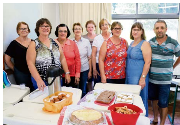
Cultura polonesa também foi exposta