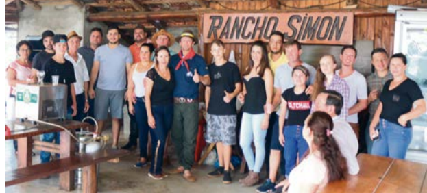
Muita gente reunida para confraternizar a tradição gauchesca