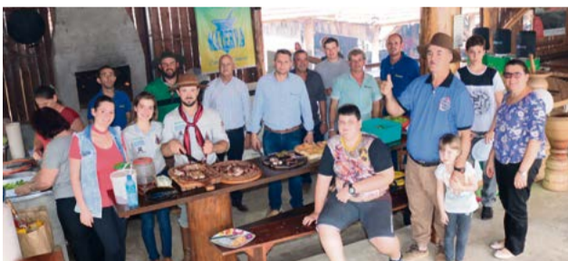
Churrasco já foi servido para a alegria de todos