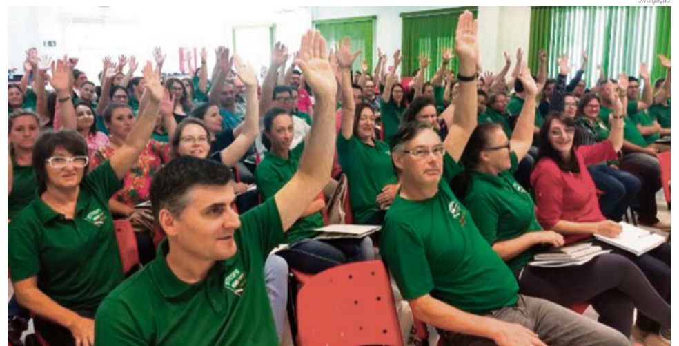
Sindicato aprovou greve no último fim de semana em Chapecó

Segundo o sindicato, "a Reforma da Previdência é maléfica para todos os trabalhadores, mas em especial ela ataca de forma mais cruel as mulheres e os pobres do país". Um debate so-