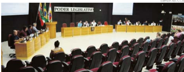
Maiores polêmicas foram para os projetos do Refis e da proibição de vereadores de ocuparem cargos na administração

No entanto, o projeto polêmico recebeu parecer contrário na comissão de Finanças, Orçamento, Tributação, Fiscalização e Contas e foi derrubado em plenário com votos da maioria dos vereadores. Com a derrubada do texto, por lei, o projeto não pode tramitar mais neste ano.