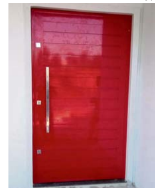
Alumínio em diversas cores, sob encomenda