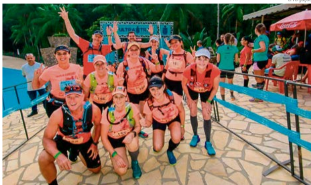
Prova teve os percursos de 27 e 13 quilômetros