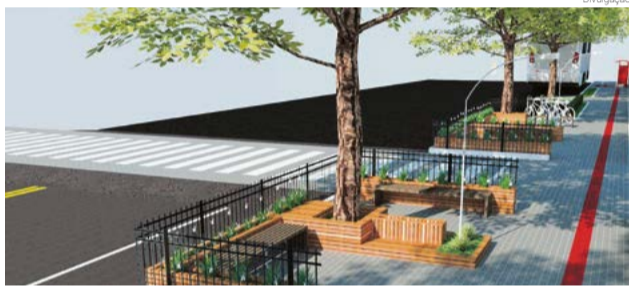
Projeto de revitalização da Avenida Maravilha

O projeto foi elaborado pela Amerios. A revitalização do trecho prevê luzes para pedestres, construção de calçadas, restauração de todo o pavimento, construção de ciclovia e instalação de parklets, que são áreas de lazer sob as árvores que serão mantidas.