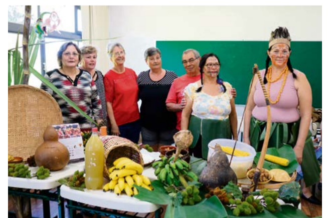
Civilização indígena e sua história