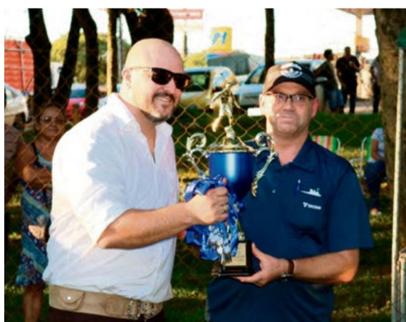
Morte Súbita perdeu na final pelo placar de 2 x 1 e ficou com o 2º lugar