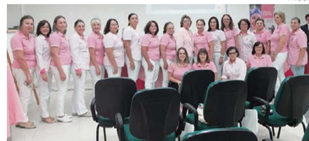
Integrantes da Rede promoveram palestra

O objetivo da campanha nacional “Preciso viver” é chamar a atenção das autoridades para o cumprimento dos direitos dos pacientes com câncer e, assim, garantir que tenham acesso a um tratamento de saúde humanizado e tempestivo. A presidente da Rede Feminina ressalta que é necessário garantir a aplicabilidade e eficácia da Lei 13.019, que estabelece prazo máximo de 30 dias para que as unidades do Sistema Único de Saúde (SUS) realizem exames e diagnósticos e executem procedimentos necessários à saúde dos pacientes.