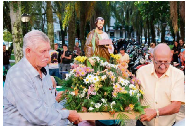
Procissão está programada para o dia 5 de maio