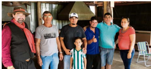
Tradicionalismo é preservado entre amigos que frequentam o espaço em dias de rodeio