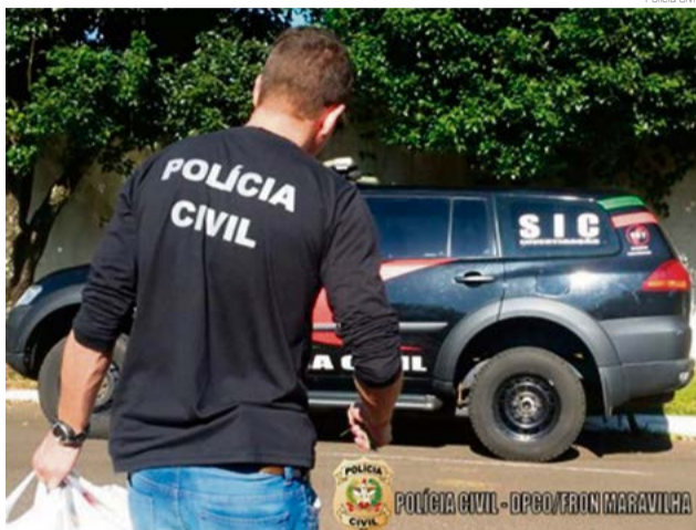
Polícia Civil recolheu produtos e encaminhou à Defesa Civil para descarte

Dos estabelecimentos fiscalizados, sete apresentaram irregularidade em produtos comercializados, os