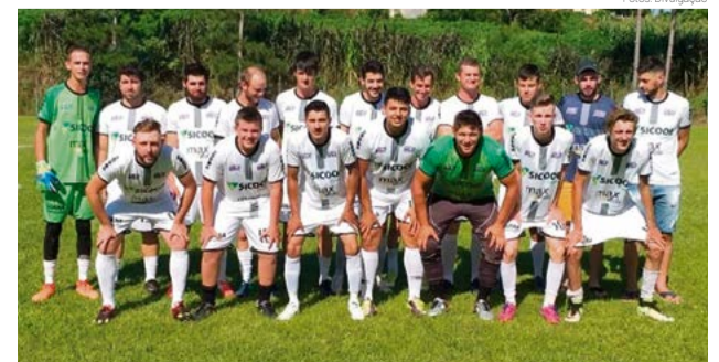
Cadeado/Móveis Queiroz recebe a oitava rodada hoje (30)