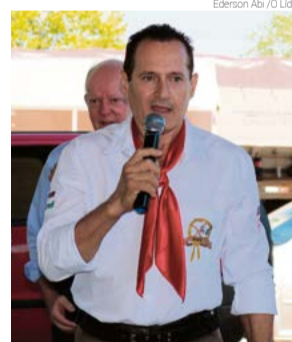
Patrão falou com a reportagem do grupo WH Comunicações em entrevista

Ele falou também sobre os investimentos em melhorias e