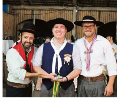
Maravilhenses receberam a premiação do primeiro lugar chula trio veterano