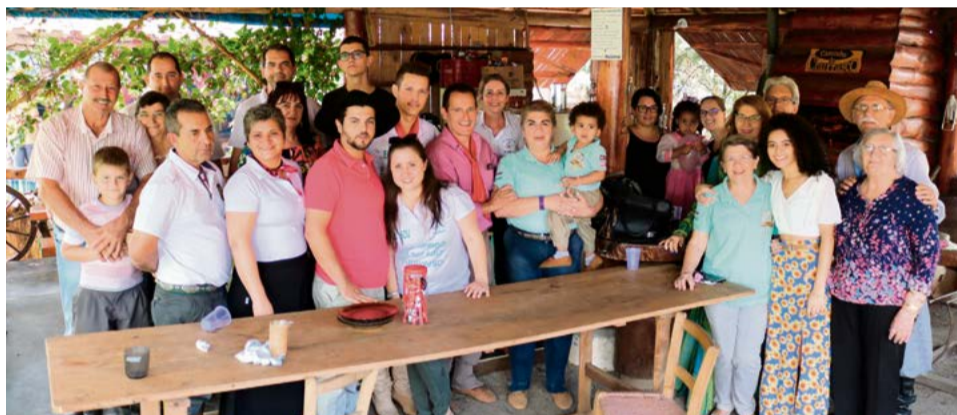
Rodeio é o momento de reunir a família para celebrar a tradição do Sul

Durante os três dias de rodeio o quiosque da Sul Brasil Automotiva ficou lotado, com amigos, parentes e pessoas próximas ao patrão. A boa conversa e contação de causos regados a mate amargo também estiveram presentes no espaço. O churrasco foi o prato principal nas refeições, mas o bom e velho carreteiro também marcou presença.