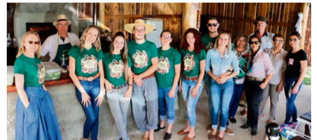
Juventude também gosta da cultura gaúcha e não deixa a tradição acabar