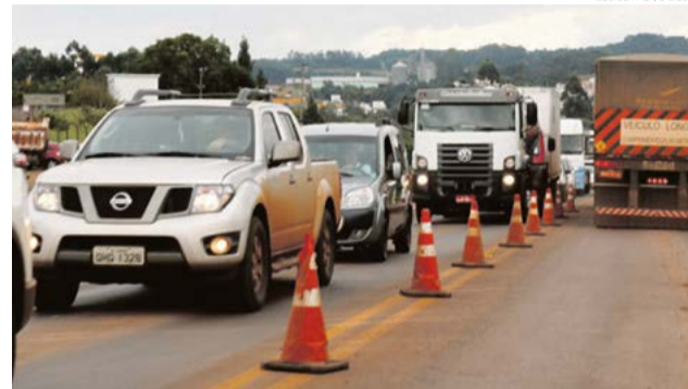
Explosões são realizadas nas proximidades do CTG Juca Ruivo e causam lentidão

O Departamento Nacional de Infraestrutura de Transportes (Dnit) anunciou, nesta semana, que a BR-282 sofrerá bloqueios frequentes para detonações nas regiões de São Miguel do Oeste a Chapecó. O trabalho é necessário em razão das obras de restauração da rodovia. Na região, o trabalho começou na terça-feira (26) com bloqueio para explosões nas proximidades do CTG Juca Ruivo, em Maravilha, e próximo ao trevo de Iracemi-