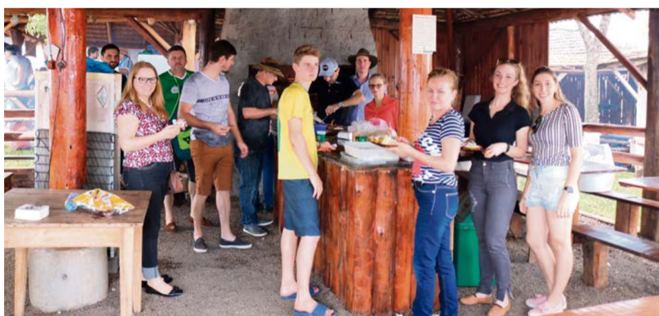
Amigos reunidos no quiosque da Cooperativa Auriverde

A cooperativa é originária da atividade no campo e o gauchismo também é da mesma origem, e este é o ponto principal que liga os dois segmentos. O quiosque no parque é o local para reunir amigos, em especial nos dias de rodeio. Como exemplo dos outros quiosques, este foi palco de muita diversão e preparo de alimentos. O churrasco também não faltou.