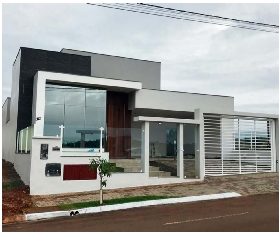
Fachada Glazing com vidro refletivo