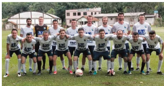
Marmoraria Pape ganhou da equipe Cadeado/Móveis Queiroz na última rodada

pes Bar e Bolão do Glinke x Pit Stop E; e Pit Stop B x Bar e Bolão do Glinke B.