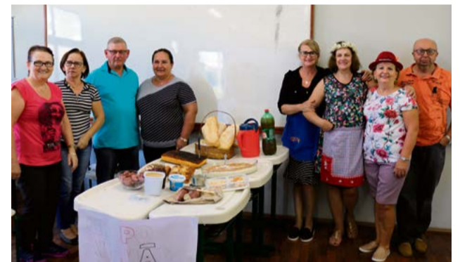
Costumes, roupas e comidas típicas alemãs