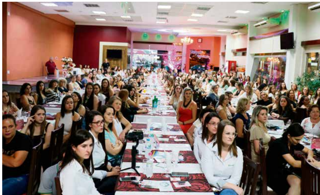
Evento contou com a presença de aproximadamente 200 pessoas

zer o melhor no dia a dia para deixar um legado, por mais singelo que seja”, disse Rosimar.