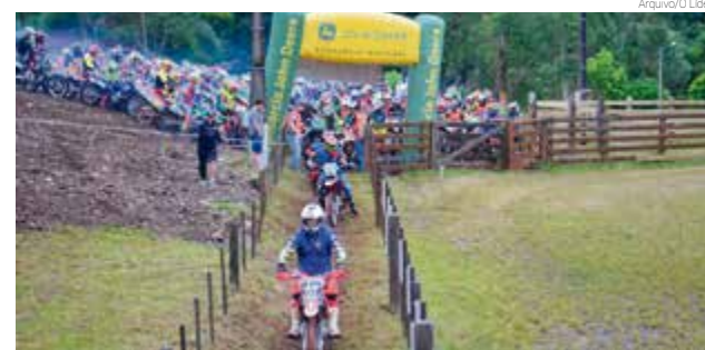
Emoção sobre duas rodas está de volta em Maravilha

Pelo segundo ano consecutivo as mulheres podem participar, sendo que no ato da inscrição recebem uma camiseta exclusiva. O valor para as mulheres é de R$ 50 e para os homens é R$ 90.