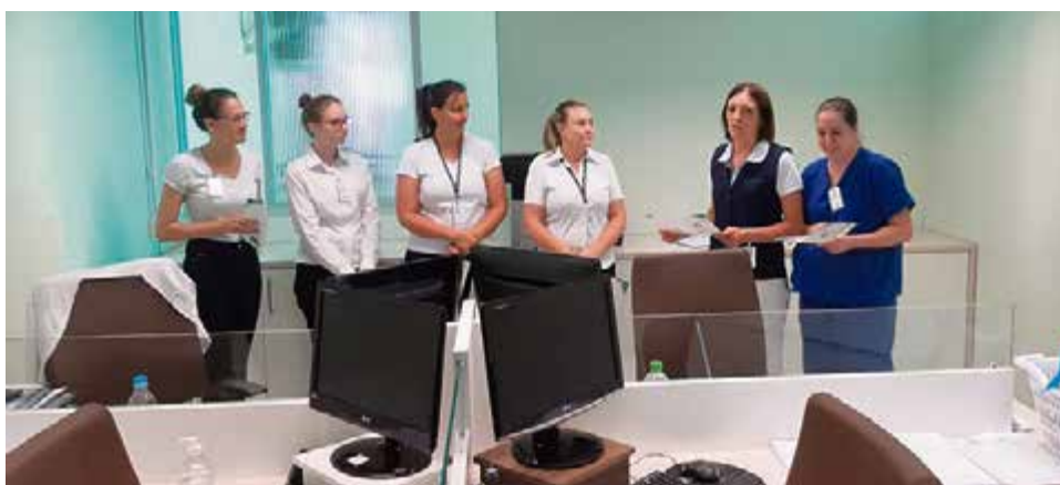
Equipe orienta recepção do Hospital São José sobre possíveis casos suspeitos