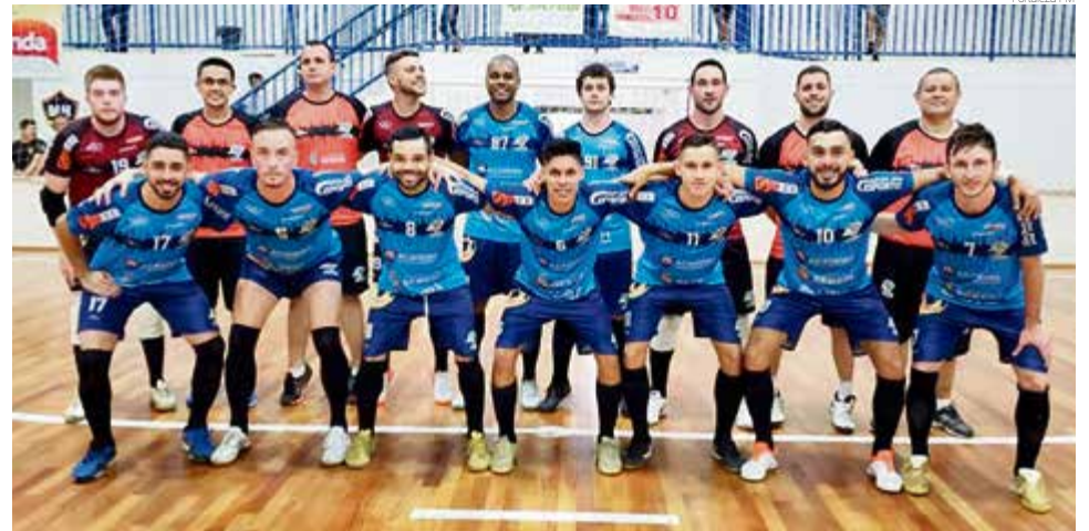
Equipe de Seberi-RS também se prepara para disputar competição no Rio Grande do Sul