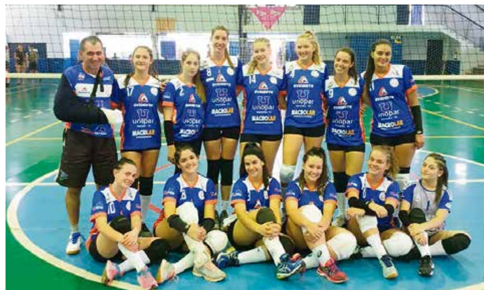
Meninas ficaram na terceira colocação geral da competição