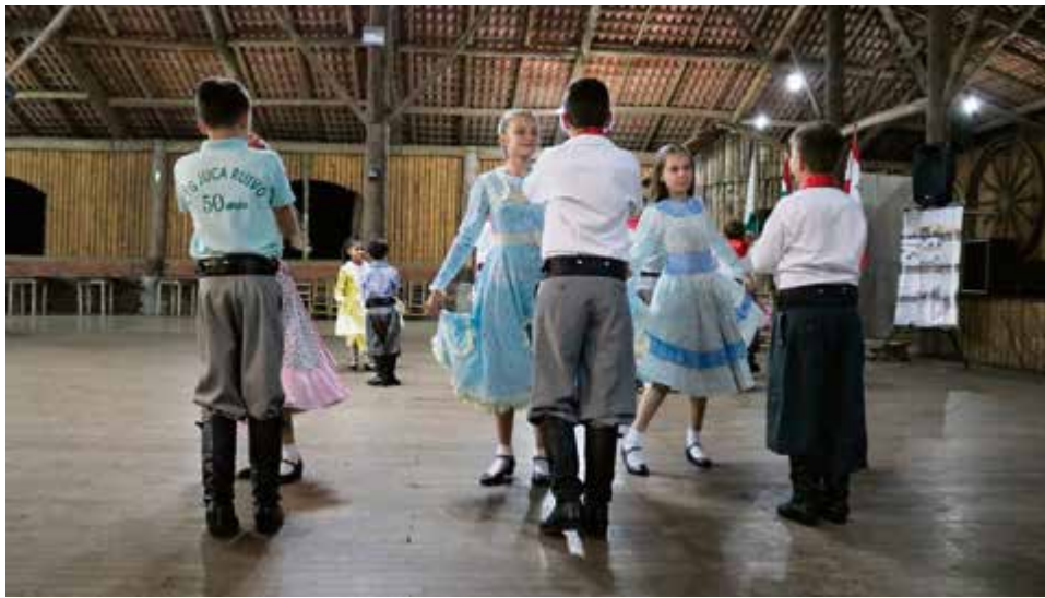
Foram realizadas apresentações artísticas durante o evento

ra e artística em conjunto. Em paralelo ao evento também é realizada a 1ª Etapa do 16º Festival Regional da Cultura Gaúcha do CTG Juca Ruivo (FRCG).