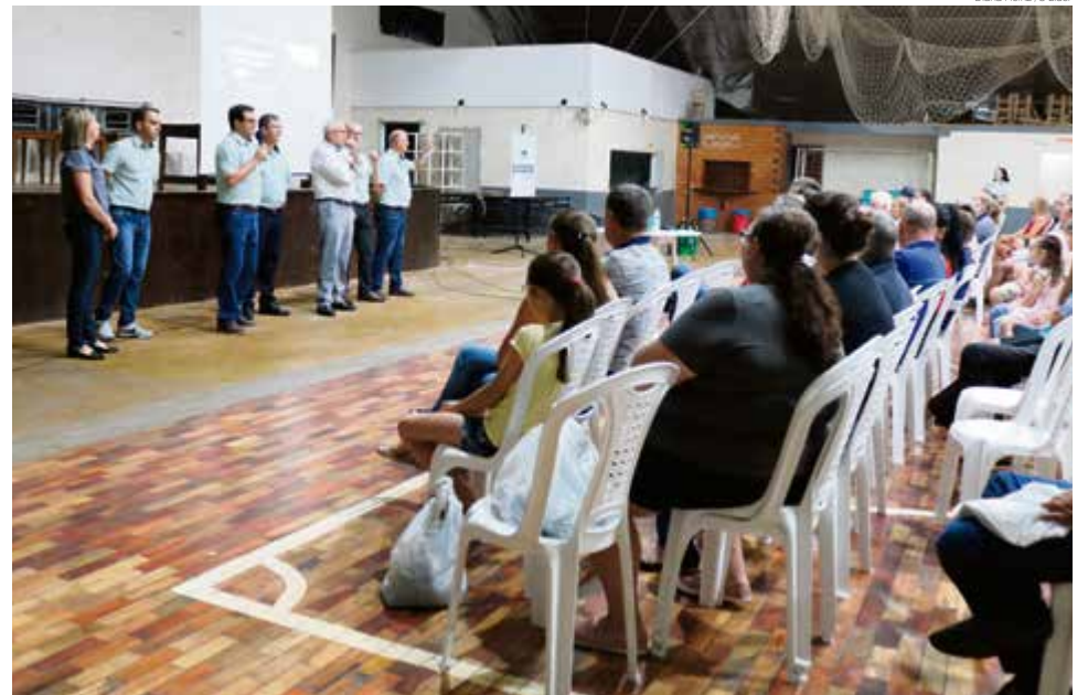
Centenas de pessoas participaram do evento