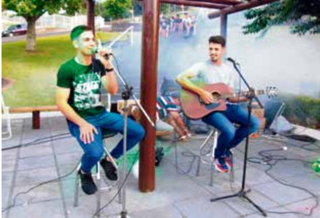
Dupla animou o público na praça municipal