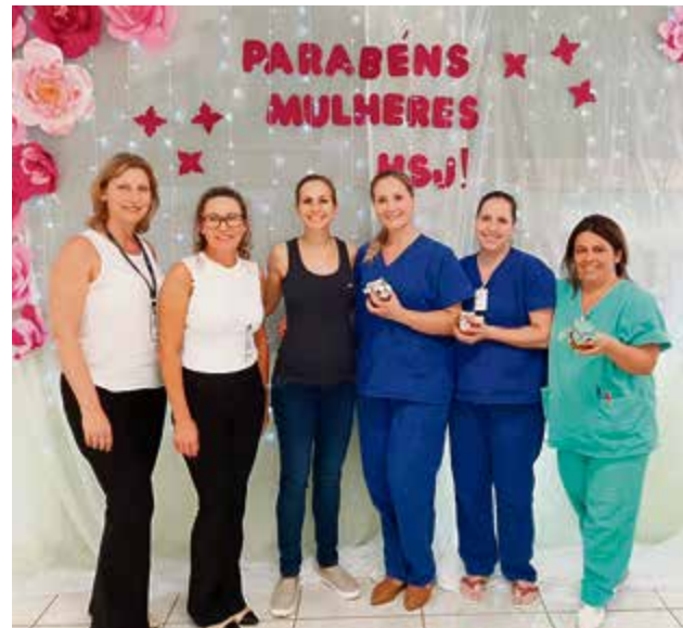
Mulheres foram homenageadas e receberam presentes