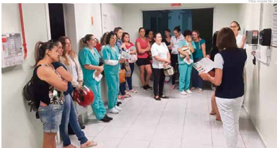
Todos os setores participaram das orientações para casos de coronavírus