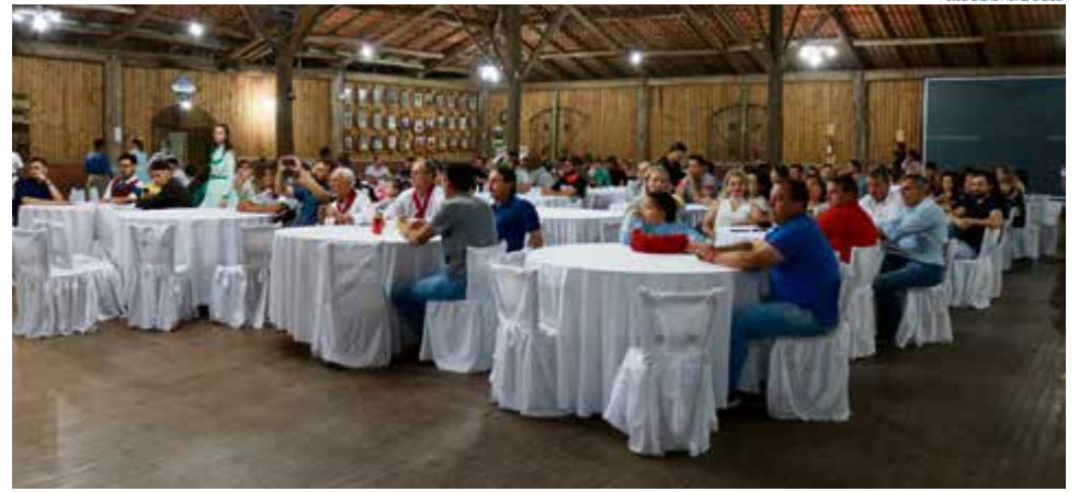
Lançamento foi na quarta-feira (11), na sede da entidade