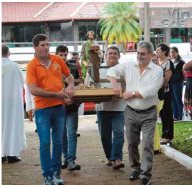
Registro das festividades em honra ao padroeiro em 2019