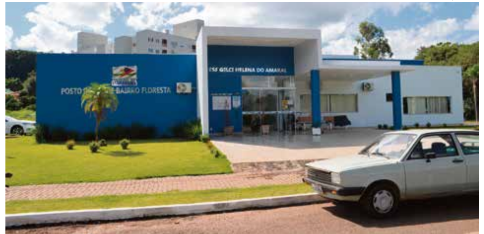
Vacinas contra o sarampo continuam sendo feitas no posto de saúde do Bairro Floresta

A campanha de vacinação contra o sarampo terminou ontem (13) em todo o Brasil, no entanto, a vacinação continua o ano inteiro nos postos de saúde. Em Maravilha, foram conferidas 2030 carteiras de vaci-