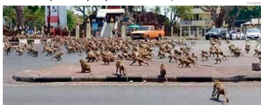
Macacos famintos correm por rua na Tailândia

Bandos de macacos famintos estão sendo vistos vagando por ruas de Lopubri, na Tailândia, após os costumeiros turistas desaparecerem da região por causa do temor ao coronavírus. Sem os visitantes, as centenas de animais perderam a principal fonte de alimentação.