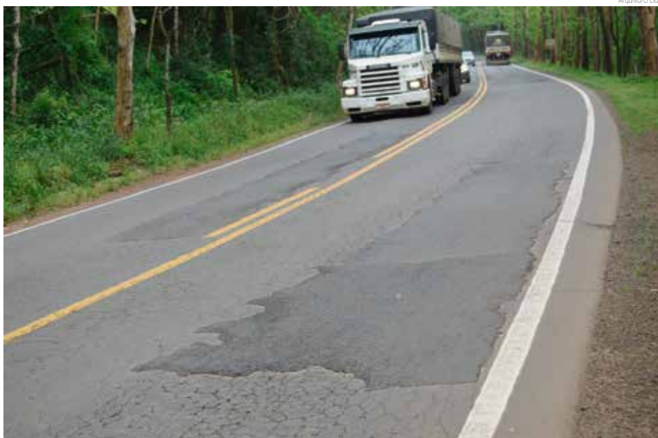
Trechos da SC-160 entre Pinhalzinho e Campo Erê estão entre os mais precários da região