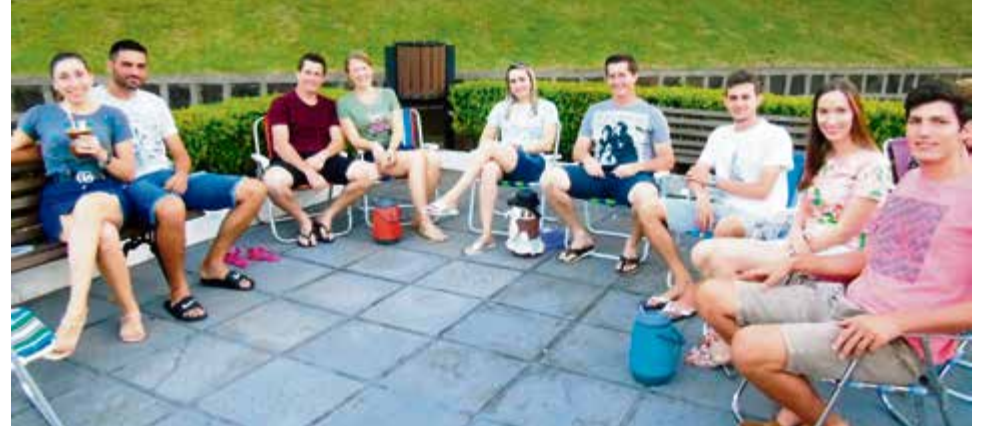
Amigos se reuniram para conversar e compartilhar tererê