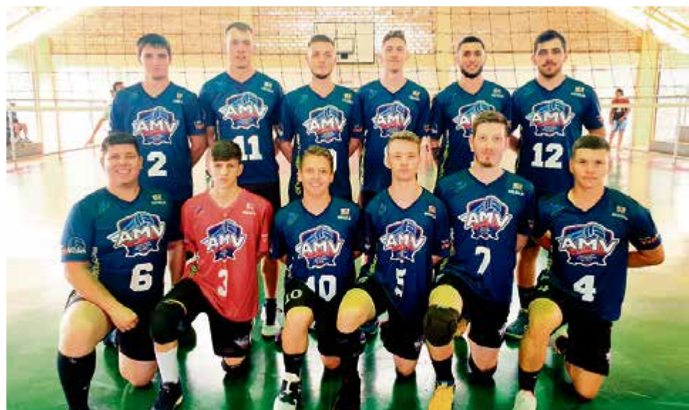
Time masculino ficou em segundo lugar depois de enfrentar Cunha Porã na final