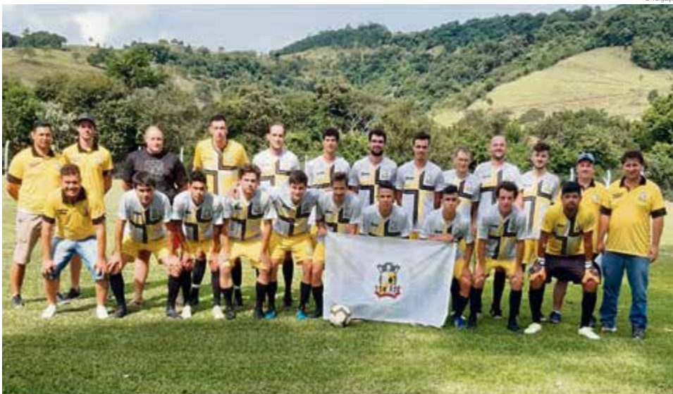
Iraceminha começou com empate fora de casa

Já em Santa Terezinha do Progresso outro empate em dois gols, desta vez entre Miraguai e Palmeiras de São Miguel da Boa Vista. No mesmo local teve a única partida da rodada no naipe feminino e foi entre Miraguai e Palmeiras, que terminou com