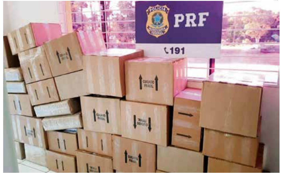
Garrafas ilegais foram apreendidas e caminhão liberado

A mercadoria foi apreendida e levada à Receita Federal em Dionísio Cerqueira. O ca-