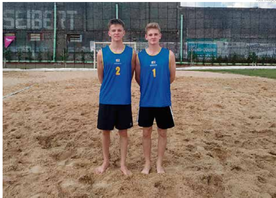
Vôlei de praia também ficou em segundo, na final perdeu para São Carlos

“Nosso voleibol fez grande campanha, jogando contra equipes adultas, e nossas equipes formadas com meninos e meninas novos das nossas categorias de base. Parabéns a todos pela grande competição que fizeram”, avaliam os integrantes da comissão técnica de Maravilha.