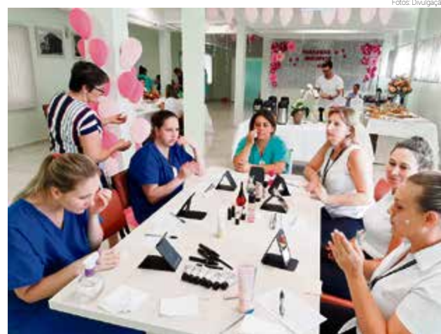
Dia especial foi organizado pela direção, grupo de trabalho e humanização

O encontro também teve troca de presentes e muita diversão.