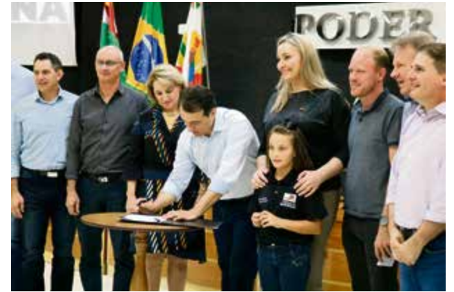
Assinatura dos convênios para o transporte escolar

tadual. “Hoje a Alesc enfrenta com o governo do Estado uma pauta que é muito difícil. Nós temos ali muitos deputados que já são favoráveis, assim como a sociedade organizada, a rever a previdência