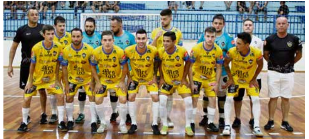
Equipe e torcida gostaram do que viram em quadra