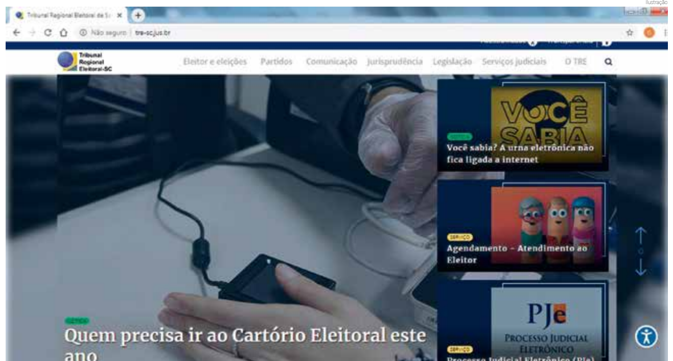
Consultas sobre regularidade de títulos e partidos estão disponíveis no site do Tribunal Regional Eleitoral de Santa Catarina

A 58ª Zona Eleitoral de Maravilha encerrou a revisão obrigatória do eleitorado em 28 de junho de 2019. Quem perdeu o prazo, mas compareceu ao cartório após a data, já tem a garantia de regularidade do título. Quem ainda não fez a biometria deve regularizar o título até o dia 6 de maio, caso contrário não poderá votar na eleição municipal em outubro.