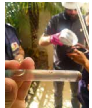
Maravilha conta com 16 casos confirmados de dengue, 19 suspeitos e 116 focos do mosquito Aedes aegypti