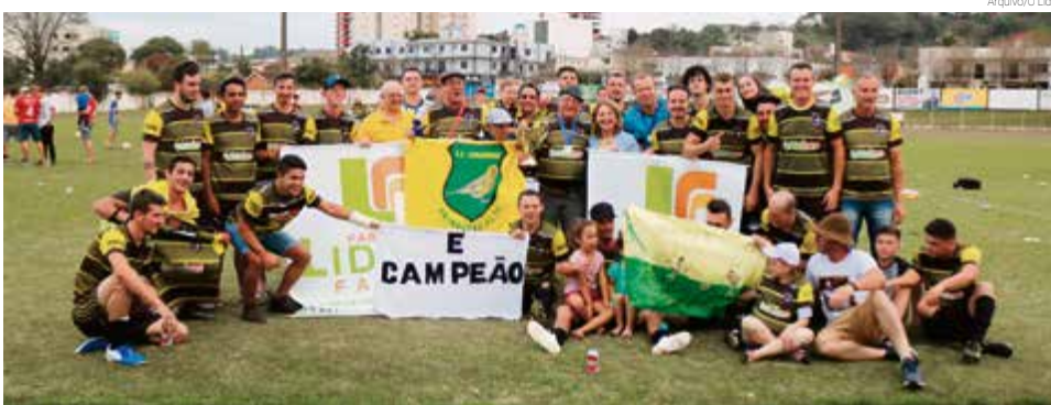
Canarinho da Linha Primavera Alta defende o título em 2020

Na tarde de hoje (14) terá início o Campeonato Municipal de Futebol de Maravilha, com sete equipes participantes nas categorias aspirante e principal. A forma de disputa será todos contra todos em turno único, sendo que os dois primeiros colocados vão direto para a segunda fase, o terceiro colocado enfrenta o sexto e o quarto pega o quinto. Quem passar destes confrontos enfrenta os dois primeiros colocados na semifinal. A equipe que ficar na última colocação fica fora.