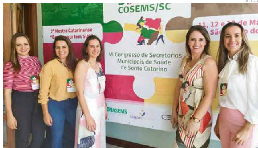
Equipe de Maravilha fez a apresentação dos projetos para os participantes da Mostra

Durante o evento houve uma nova seleção entre os 40 projetos apresentados. Foram escolhidos 20 para a etapa nacional da Mostra Nacional “Brasil, aqui tem SUS”, sendo que Maravilha teve os dois projetos selecionados para o novo período.