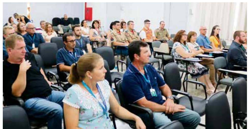
Encontro reuniu gestores estaduais da região

cados de Novos Rumos e Recuperar, na área de Educação o Minha Nova Escola, e na saúde a Política Hospitalar Catarinense. Sobre as rodovias na região, o secretário destaca que o Estado deve seguir com as negociações para efetivar uma parceria com os municípios, através do projeto Recuperar, para a manutenção da malha rodoviária estadual. Já o programa Novos Rumos deve destinar recursos para obras, a exemplo do projeto do Contorno Viário de Maravilha.