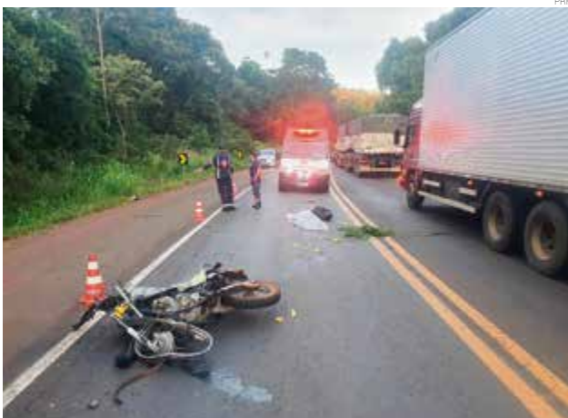
Condutora da motocicleta morreu no local após forte colisão contra o caminhão

Equipes do Corpo de Bombeiros, Samu, PM, PRF, Saer e Sara foram acionadas para o atendimento à ocorrência.