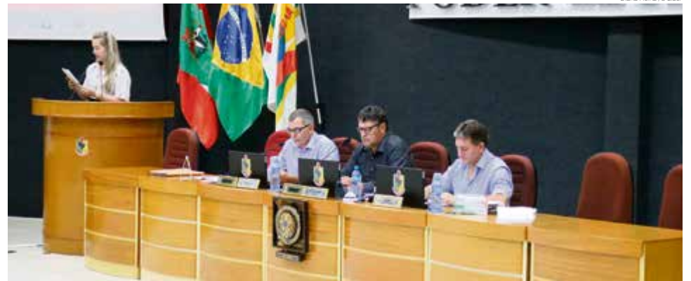
Deram entrada na sessão três indicações, um ofício e um projeto de lei complementar

Com mais de duas horas de duração, o Legislativo de Maravilha aprovou, na sessão ordinária de segunda-feira (9), quatro projetos em primeiro turno e um em turno único. Por unanimidade foi aprovado o projeto que dispõe sobre a revisão anual dos vereadores e servidores do Legislativo, em 2,92% de INPC e 2,08% de reajuste. Também foi aprovado o projeto que autoriza o Poder Executivo a efetuar permuta de bem imóvel no Loteamento Nosso Sonho e o que revoga a lei municipal que proíbe a privatização da captação, tratamento e distribuição de água e saneamento básico. Outro projeto aprovado em primeiro turno foi o que declara o Grupo de Estudos e Apoio à Adoção de Maravilha (Geaa-