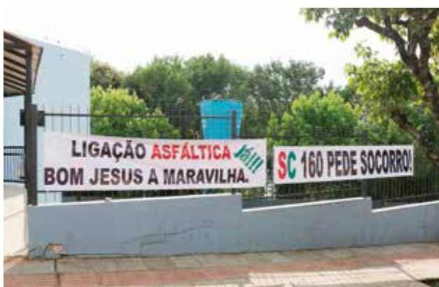
Faixas foram colocadas nas proximidades da Câmara de Vereadores e cobraram investimentos na região

Em São Miguel do Oeste o governador assinou na quinta-feira o termo de transferência da SC-163, trecho entre Itapiranga e São Miguel do Oeste. O processo foi iniciado ainda em 2014 e era uma das principais reivindicações de lideranças regionais. A federalização tem como principal objetivo aumentar a disponibilidade de recursos para obras no trecho, que recebe fluxo intenso de veículos de carga diariamente.