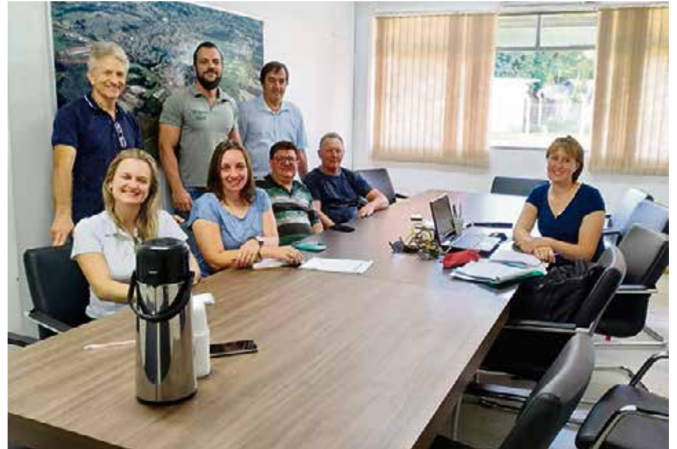
Implantação envolve diversos setores e pretende ampliar vendas de produtos da agricultura familiar

A solução pretende garantir um fluxo de produ-