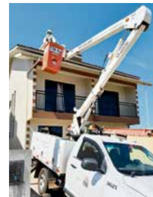
Celesc auxiliou nos acessos difíceis para verificar as calhas das casas