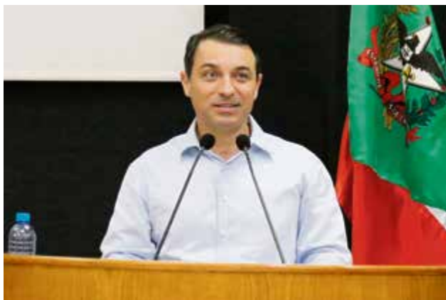
Discurso do governador em Maravilha

mandato e afirmou que 2020 deve ser um ano produtivo, com obras, reposição salarial de servidores públicos, reforma da previdência estadual, prevenção do coronavírus, investimento em educação e rodovias.