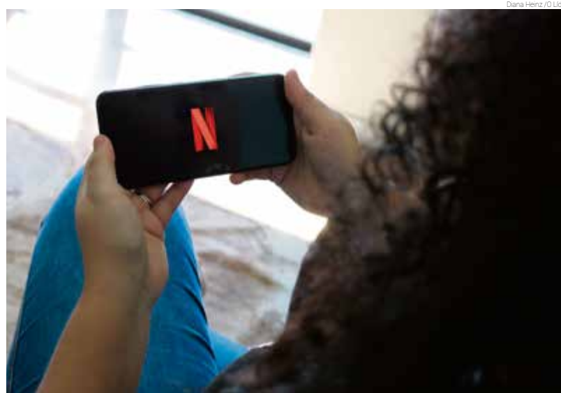
Serviços de streaming têm sido uma forma rápida e fácil de entretenimento