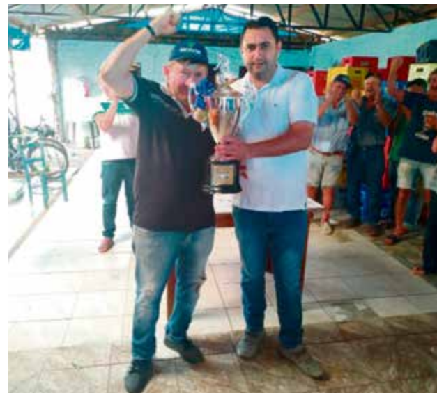
Representante do Bar do Vande I recebeu troféu de campeão