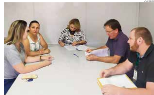
Assinatura do convênio foi nesta semana