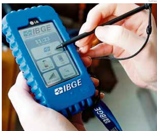
Trabalhadores temporários serão contratados para a realização do Censo 2020

O segundo edital oferece vagas para recenseador, com remuneração definida de acordo com a produtividade. Os candidatos devem ter o ensino fundamental completo e serão responsáveis pela coleta de dados. Para Maravilha são oferecidas 24 vagas para recense-