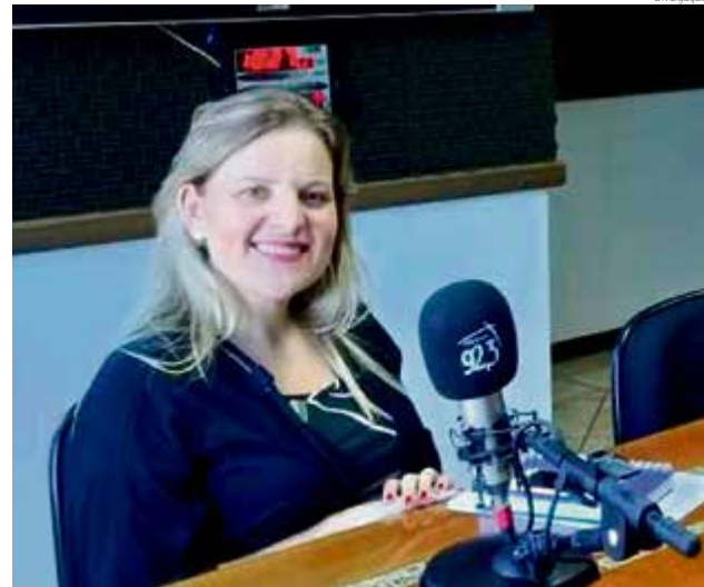
Diretora de Relações Públicas, Marketing e Eventos da CDL afirma que é oportunidade para todos

A programação, baseada no tema “Desenvolver pessoas = gerar resultados”,