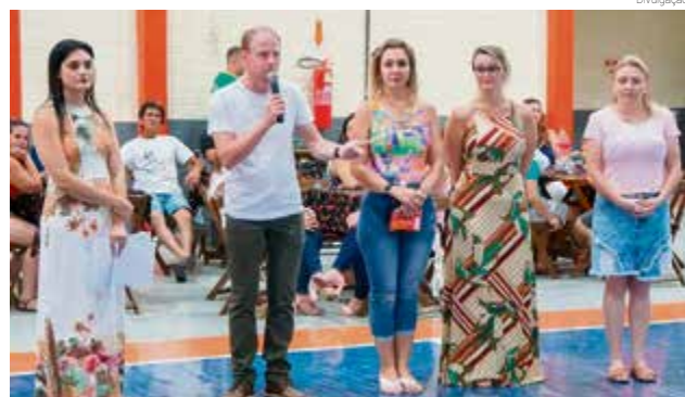
Prefeito falou sobre a importância de valorizar o comércio local

A administração de Bom Jesus do Oeste, em parceria com a Câmara de Dirigentes Lojistas (CDL) e o Departamento de Cultura, promoveu nos últimos dias 7 e 8 a 2ª Feira da CDL. O comércio local fez a exposição de produtos e serviços dos mais diversos segmentos e o evento também contou com shows de entrada gratuita aos visitantes.