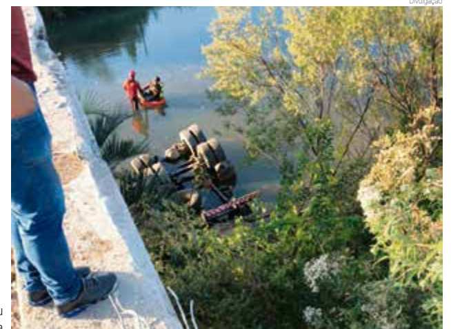
Caminhão caiu da ponte e ficou virado dentro da água

Bombeiros voluntários de Irani também foram acionados para prestar apoio. A Polícia Rodoviária Federal deverá identificar as causas do acidente.