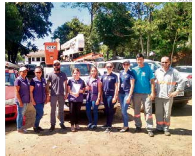
Parceria entre Celesc e prefeitura para combater o mosquito transmissor da dengue