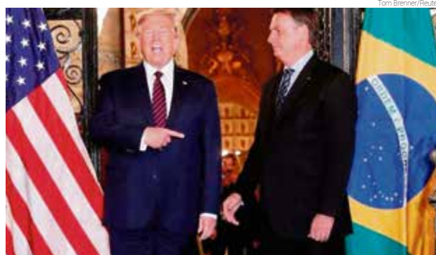
Donald Trump e Jair Bolsonaro

O governo brasileiro assinou um acordo de desenvolvimento de projetos com os Estados Unidos que pode dar acesso ao Brasil a um fundo de desenvolvimento de tecnologia para defesa que chega a US$ 100 bilhões. O acordo pode ajudar o Brasil a capacitar sua indústria e abrir o mercado norte-americano para a indústria nacional da área militar. O financiamento será público e terá de ser dividido entre os dois países, mas o desenvolvimento das pesquisas será feito por empresas privadas. Como é natural, a oposição preferia um acordo com a Venezuela.