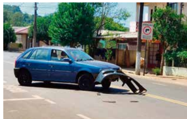
Após a colisão, Corpo de Bombeiros foi deslocado para atendimento dos envolvidos

da moto, uma Honda/Fan, sofreu ferimentos leves e foi levado ao Hospital São José.