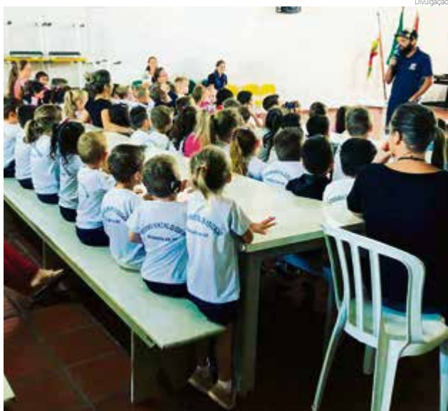
Crianças de seis a 12 anos são atendidas pela palestra

“A partir do momento que ensinamos alguém a realizar a tarefa corretamente, sabemos que isso vai gerar resultados melhores no futuro. Então essa parte do ensino da Sala de Situação vincu-