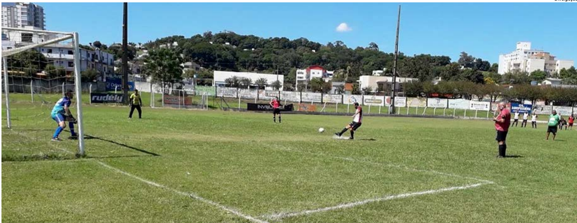
Semifinal foi decidida nos pênaltis com placar de 7 a 6 para o Madalozzo

título será a equipe do Canarinho de São Carlos. A primeira partida da final será em Maravilha e o jogo de volta em São Carlos.