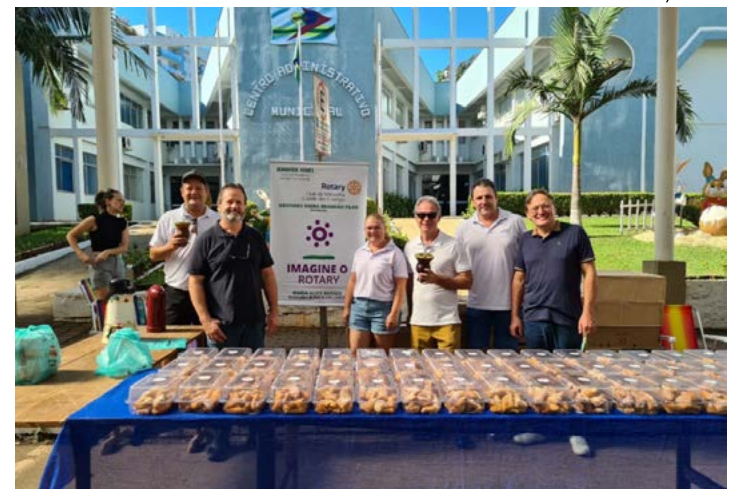
Segunda edição da iniciativa Grostoli do Bem contou com 800 bandejas