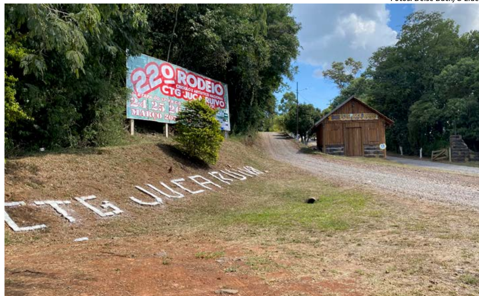
Parque irá receber mais de mil competidores