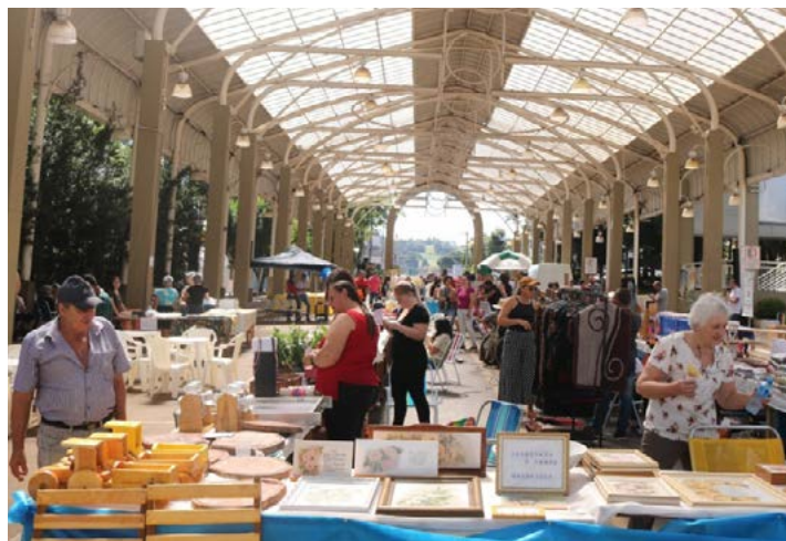
Evento recebeu grande fluxo de visitantes ao longo do dia