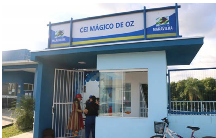
CEI atende atualmente 80 alunos

dos através de emenda parlamentar do deputado federal Valdir Cobalchini.