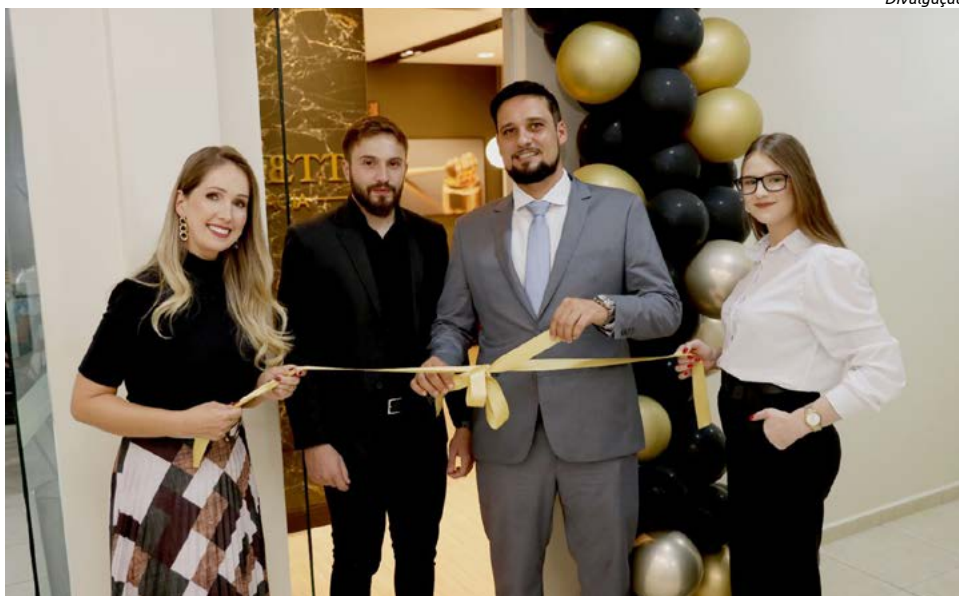
Inauguração oficial foi feita na última sexta-feira (17)