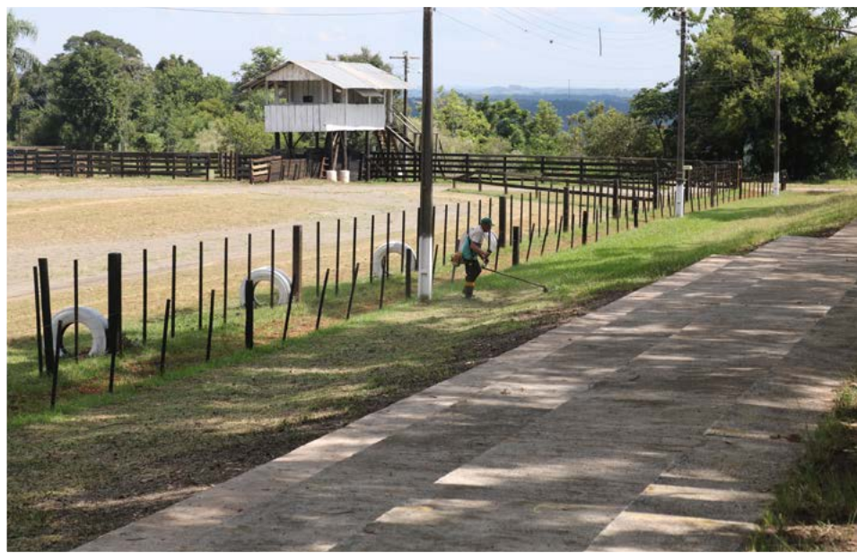
Preparativos foram intensificados ao longo da semana

Ao longo da semana foram feitos os últimos ajustes no CTG Juca Ruivo. O cenário é o mais organizado possível para receber os competidores, familiares e visitantes em geral.