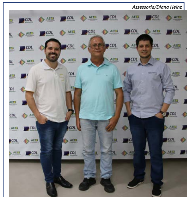
Ovos Maravilha, Sabore Massas e Salgados e Von Borstel Seguros e Consultoria foram os participantes