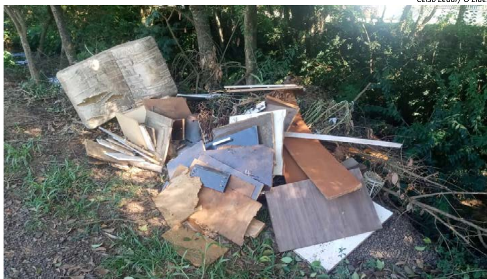
Móveis foram descartados perto do rio