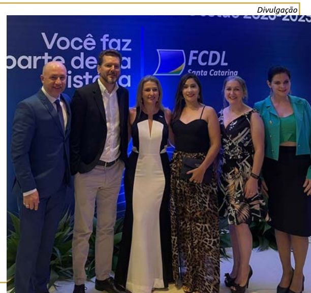
Programação foi realizada em Florianópolis

Organizada em 33 distritos, a FCDL/SC fortalece o papel estratégico do varejo na economia destas regiões. Para cumprir sua missão, a FCDL/SC oferece um leque diversificado de opções a seus associados, com equipe qualificada, tecnologia de ponta e serviços inovadores. Um dos mais destacados é o SPC, o mais completo banco de dados em informações de crédito de pessoas físicas e jurídicas.