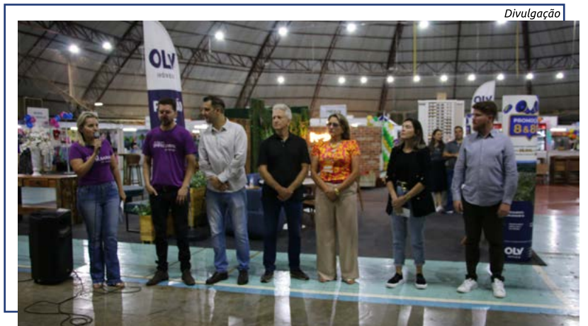
Evento foi realizado nos dias 11 e 12 de março

do evento, no próximo ano novos segmentos serão incrementados.