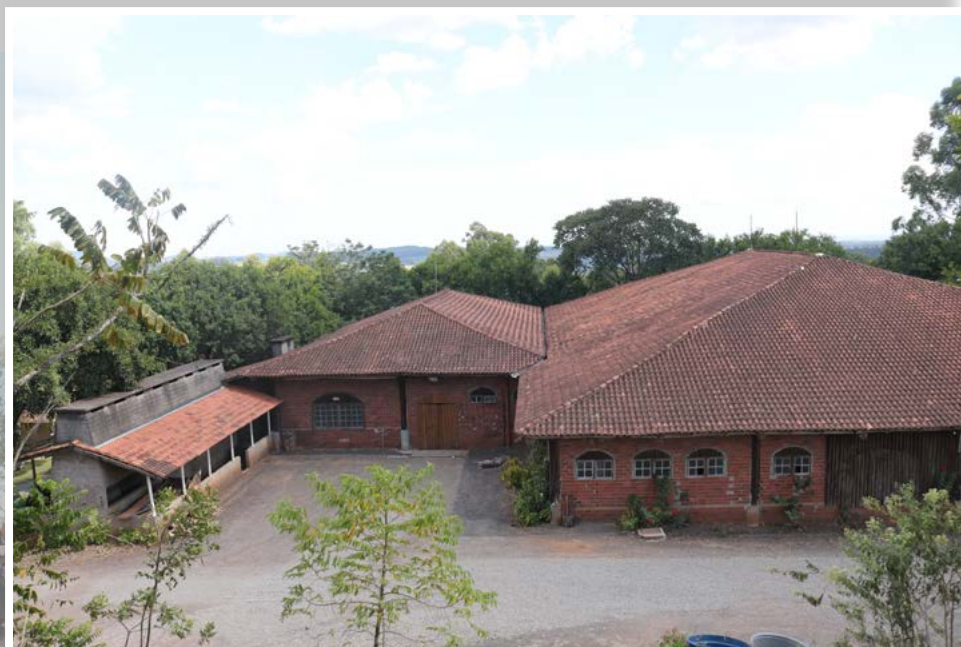
Fandango no CTG será promovido no sábado (25)