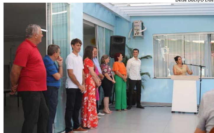
Lideranças participaram do ato de inauguração