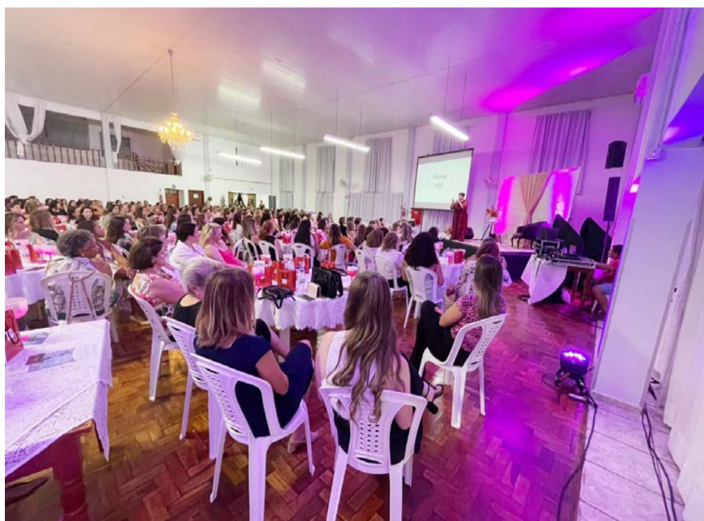
Público expressivo acompanhou o evento