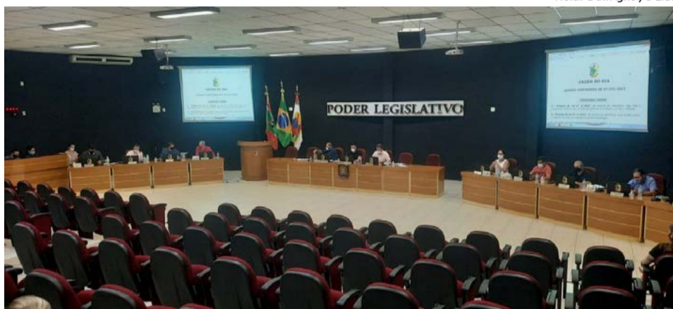
Sessão foi realizada na segunda-feira (7)