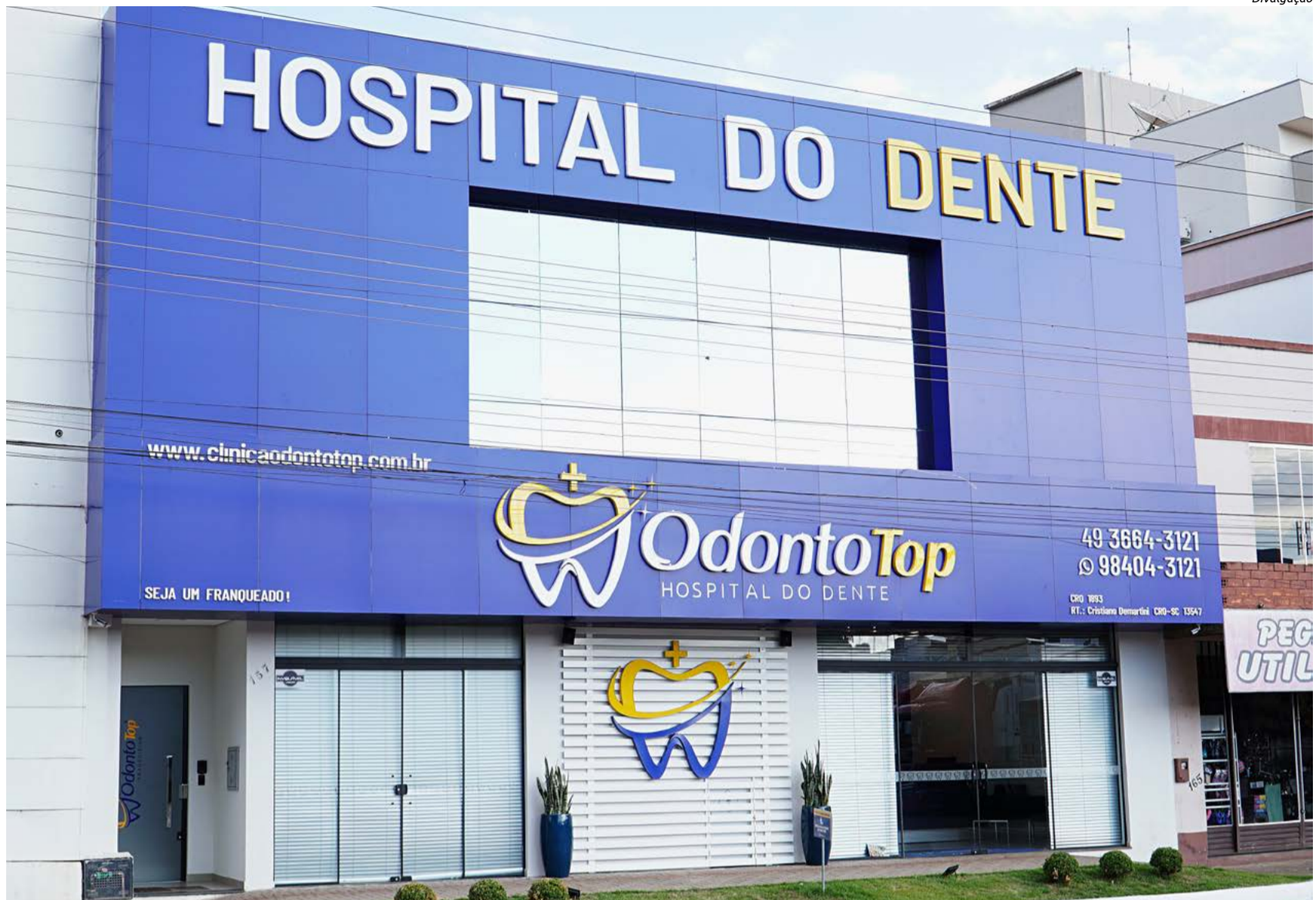
Clínica fica localizada na Avenida Sete de Setembro