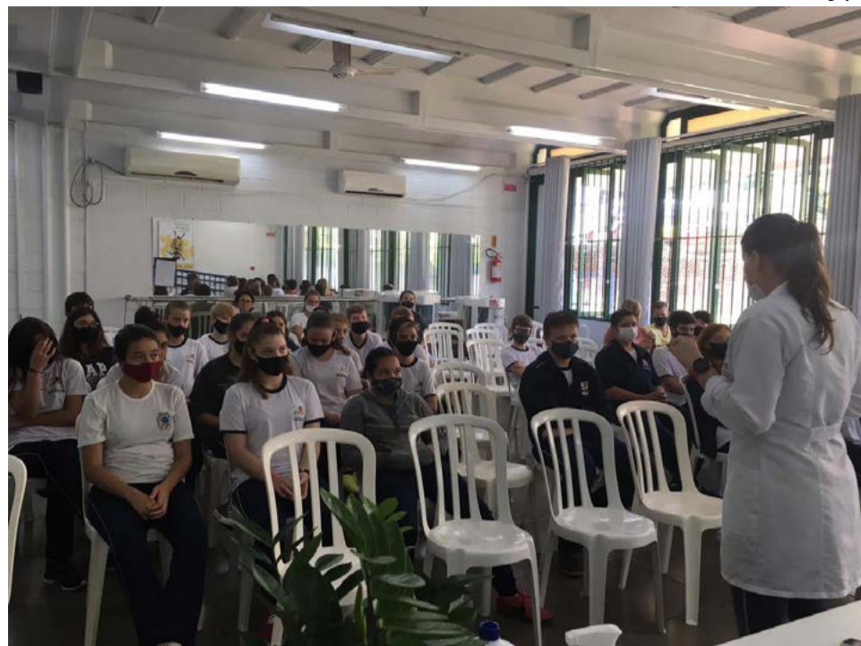
Foram 137 participantes, entre alunos e professores

Foram 137 participantes, entre alunos e professores. A equipe agradece a direção da escola por apoiar a ação e organizar as turmas. Outras ações e campanhas de prevenção, sobre diferentes temas, já estão sendo planejadas pela equipe para ocorrer neste ano.