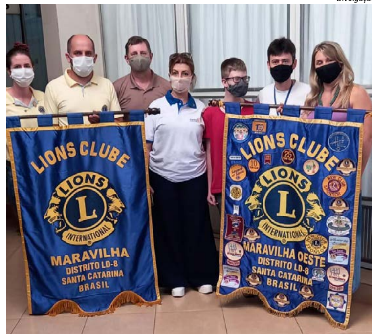
Lente custou mais de R$ 6 mil e foi adquirida em Florianópolis

O óculos foi adquirido em Florianópolis, desenvolvido pelo Laboratório e Óticas Via Visão, um dos únicos no Brasil que faz este tipo de lente (-10º). As entidades se uniram para confeccionar e adquirir o óculos e proporcionar ao menino uma qualidade de vida um pouco melhor.