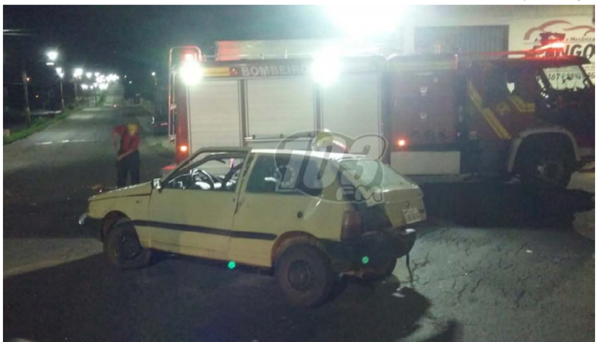
Vítimas foram levadas para o hospital após colisão na madrugada

A segunda vítima socorrida pelos Bombeiros foi um homem, de 41 anos, que estava no interior do veí-