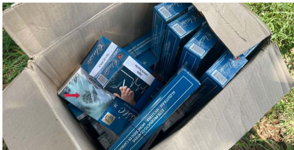
Cigarro ilegal também foi localizado em um dos veículos

No total, foram mais de R$ 23 mil em produtos ilegais apreendidos que foram levados até a central da Receita Federal.