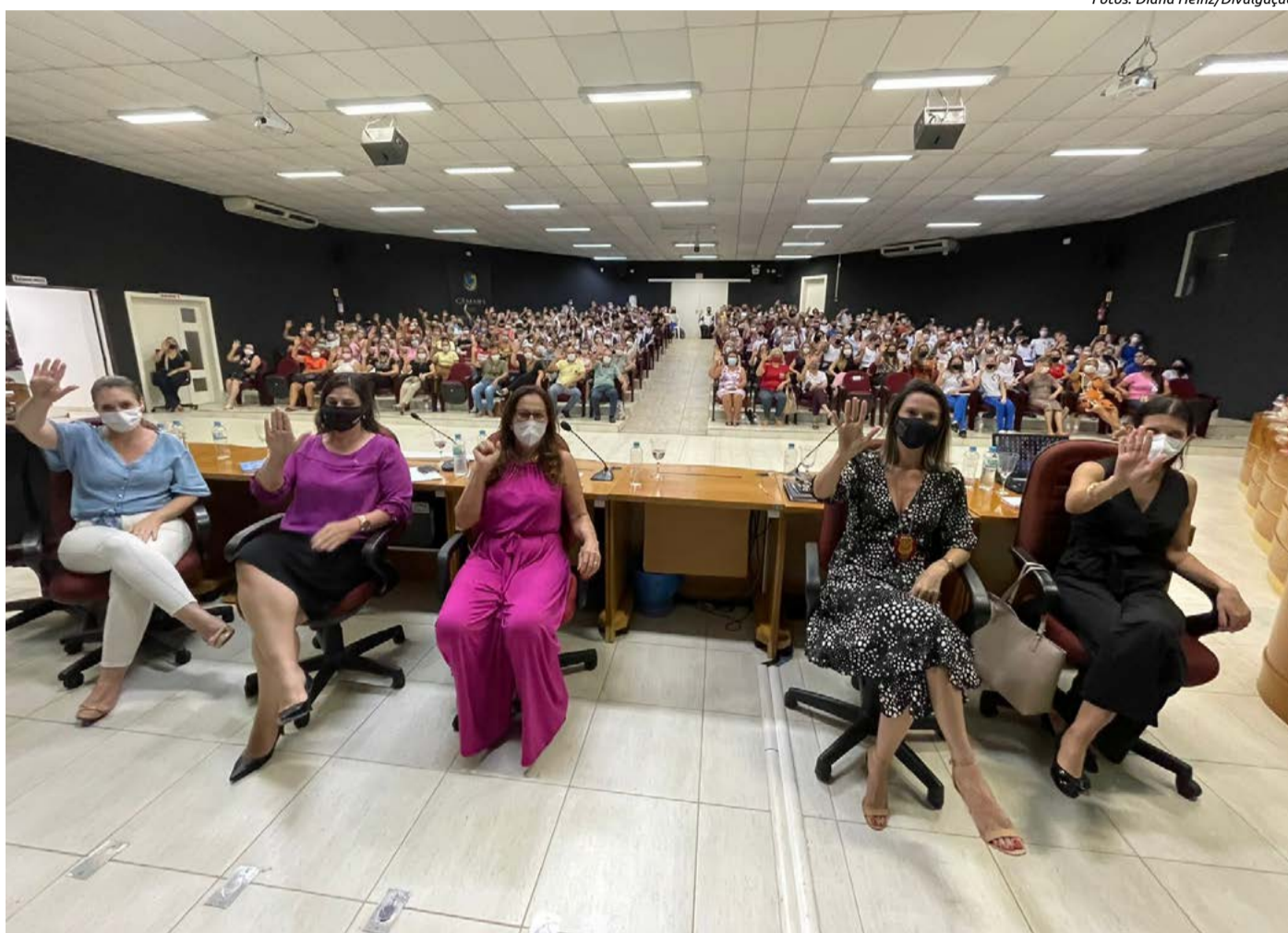
Público lotou o plenário da Câmara de Vereadores