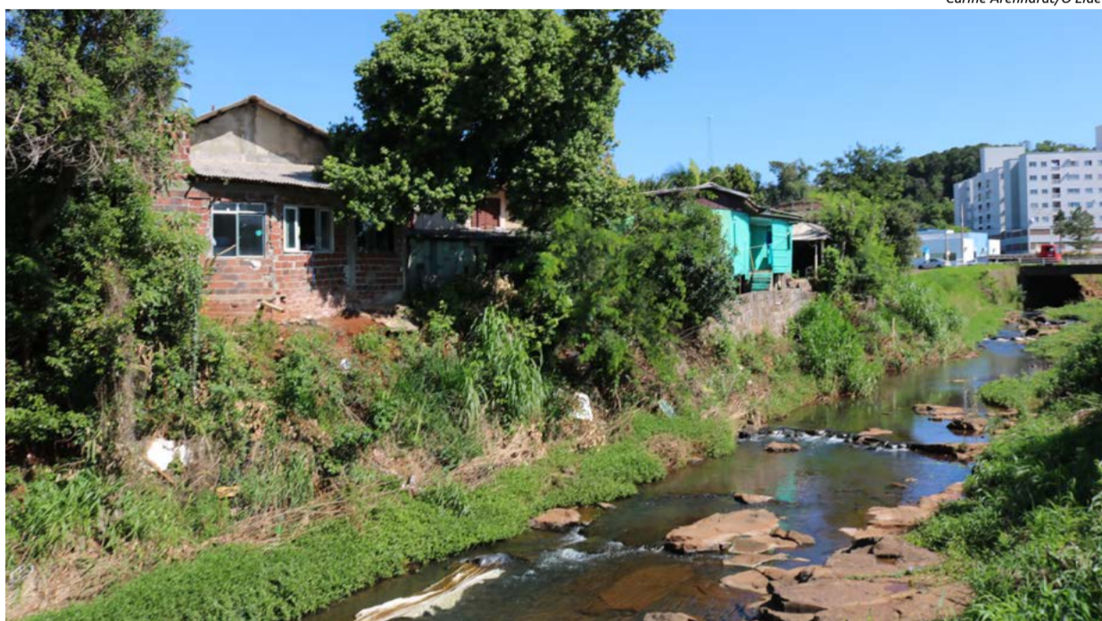
Proximidade das casas com o rio preocupa moradores e município

A área que já era considerada de risco, teve os problemas agravados com o andamento das obras de aprofundamento e alargamento do Rio Iracema. As casas ficaram ainda mais vulneráveis, após a limpeza das laterais, com retirada de árvores e vegetação. O trabalho de aprofundamento e detonação de rochas no rio precisou ser suspenso nessa área, devido ao risco de desmoronamentos. A obra só será concluída no local após a retirada das famílias.