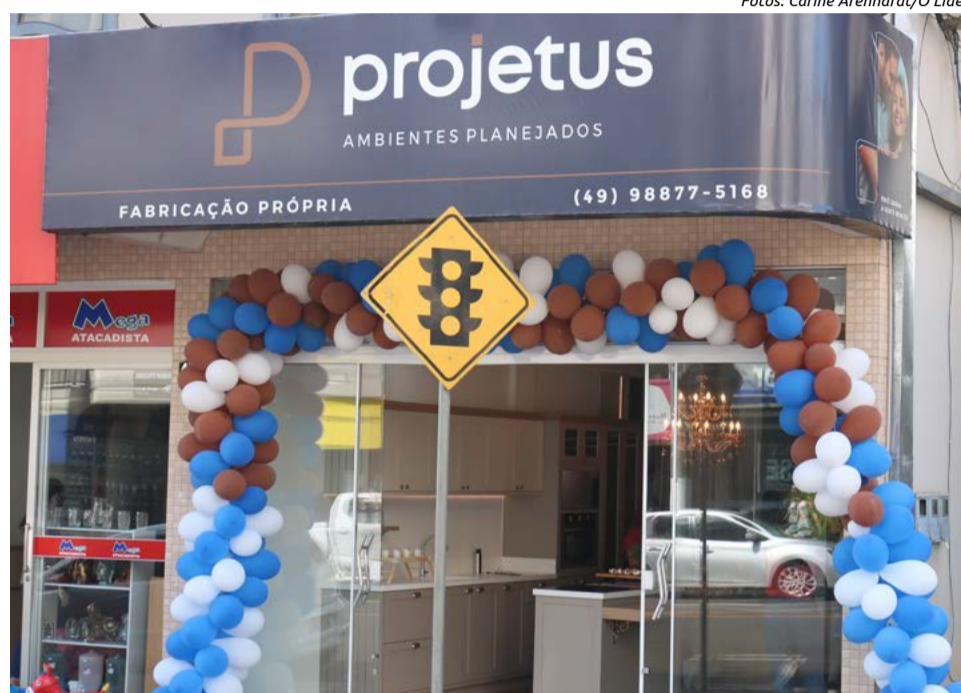
Empresa fica na Avenida Sete de Setembro