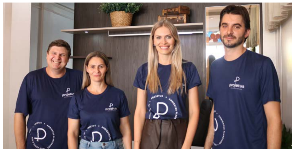
Sócios da Projetus Ambientes Planejados