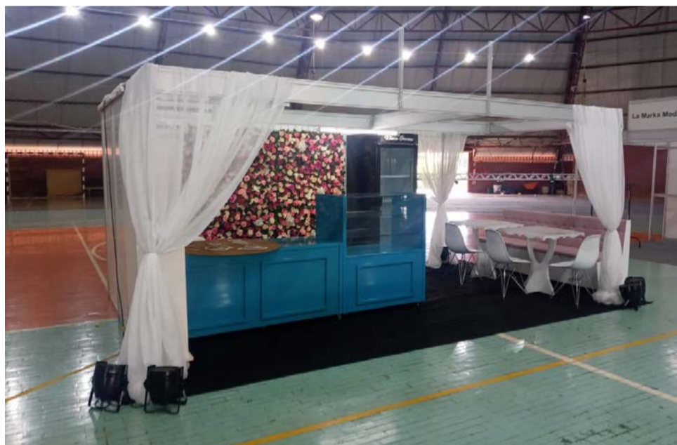
Espaço recebe estruturas de lojas e peças para comercialização