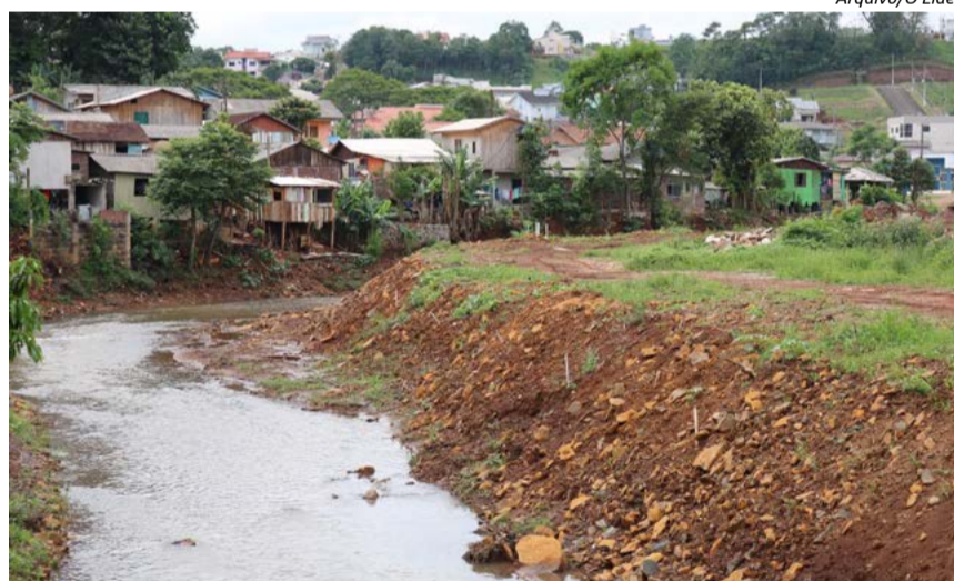
Registro feito em 2019, após o início das obras no rio, mostra faixa de residências em área de risco

O município tem aproximadamente 15 casas vagas no Loteamento