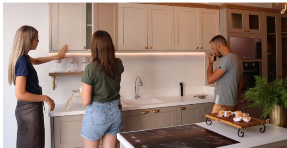
Clientes podem conferir um showroom de produtos