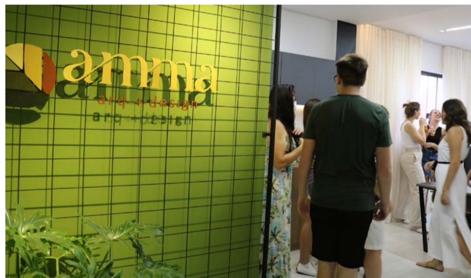
Entrada do escritório no Edifício José Sangalli