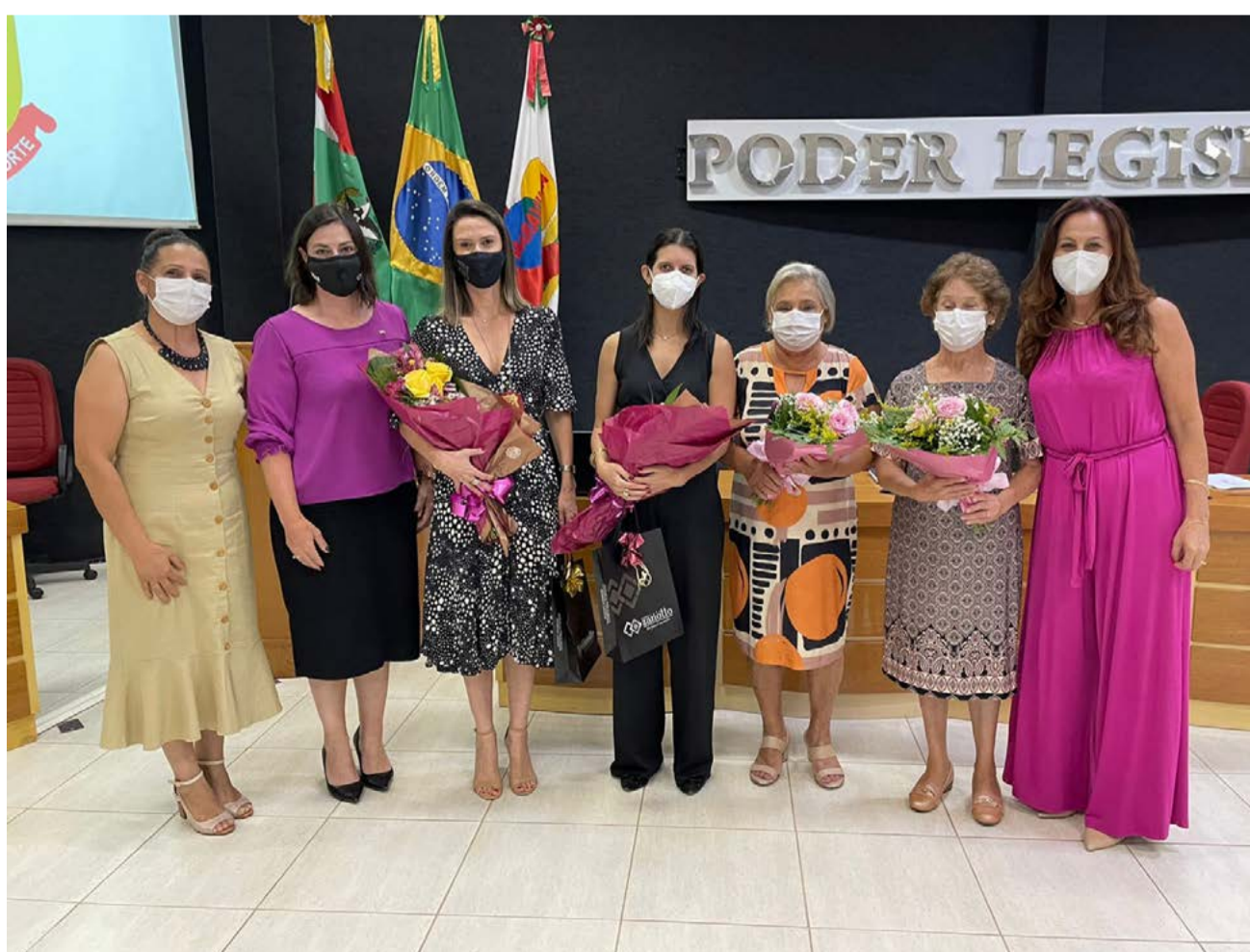
Palestrantes, representantes da OAB e Procuradoria Especial da Mulher, e as primeiras mulheres a nascerem em Maravilha