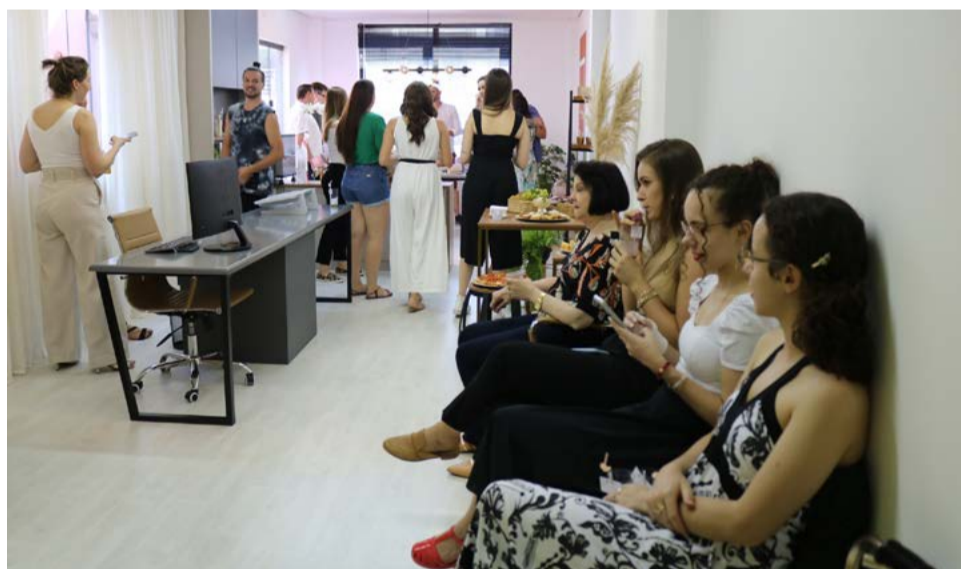
Amigos e clientes prestigiaram a inauguração

As sócias também destacam que estão apresentando uma novidade no escritório, que são os projetos na plataforma BIM, que é a modelagem da informação na construção. “Essa plataforma permite criar elementos que geram informações muito úteis para execução, como quantitativo de materiais, compatibilização de projetos e sem contar na agilidade da elaboração de um projeto nessa plataforma”, explicam.