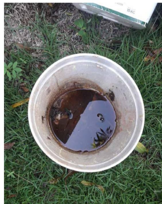
Cidade está infestada e tem mais de 60 focos contabilizados neste ano

Para este sábado (12), a Sala de Situação está organizando um mutirão, envolvendo também as agentes comunitárias de saúde, para fiscalizar e orientar a população nessa área central da cidade. Em caso de chuva a ação será adiada.