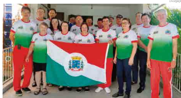
Município foi representado por 16 atletas

a equipe masculina de bocha, campeã da modali-