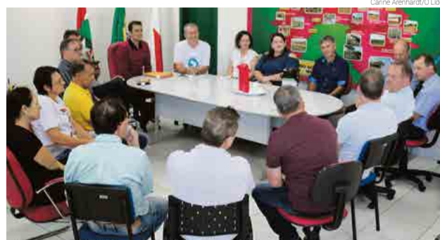
Cinco hospitais da região receberam recursos

O Hospital São José de Maravilha vai receber R$ 440 mil, sendo deste total R$ 250 mil do deputado federal Celso Maldaner (MDB), R$ 75 mil do deputado federal Pedro Uczai (PT) e R$ 115 mil do deputado federal João Rodrigues (PSD). O valor será usado para despesas de custeio.