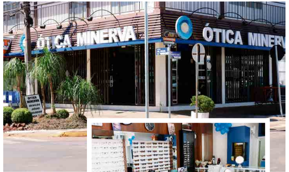
Estabelecimento está localizado no Centro de Maravilha