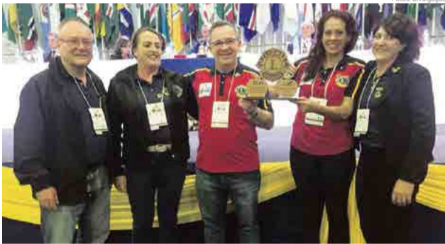
Lions Clube Maravilha ganhou nove prêmios e foi campeão

De acordo com os integrantes, foram dias de muito aprendizado e amizade. “Salientamos que os recursos da viagem e estadia são oriundos de cada sócio”, afirmam. A convenção, que reuniu aproximadamente 600 participantes, contou com diversas premiações e atividades especiais. O Lions Clube Maravilha foi o grande campeão, totalizando nove prêmios.