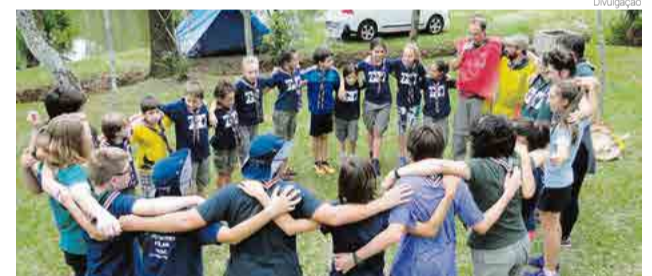
Atividades começam amanhã (22)

Na segunda-feira (23) comemora-se o Dia Mundial do Escoteiro e, de 21 a 29 de abril, os grupos escoteiros do Brasil comemoram a Semana Escoteira. Em São Miguel do Oeste o Grupo Escoteiro Atalaia preparou uma série de eventos especiais para comemorar a data. Dentre as atividades previstas, destacam-se o Amanhecer Escoteiro, com um piquenique matinal e a renovação da promessa escoteira, programado para as 6h15 de domingo (22), em área próxima do aeroporto municipal.