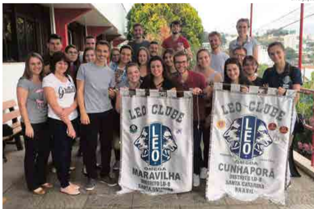
Integrantes da entidade e população fizeram parte da campanha

Até o dia 25 de abril o Clube promove arrecadação de livros novos ou usados para a campanha LEO Clube Pela Educação. O objetivo do movimento é incentivar a leitura, pois os livros doados serão entregues a uma instituição de ensino de Maravilha e a entidade também fará contações de histórias no local. A entrega das obras literárias pode ser feita na Cabana Bis, La Marka Modas, Manfrin Troféus, Iguatemi Alimentos, Posto Maratona e Sorelle Semijoias e Lingerie.