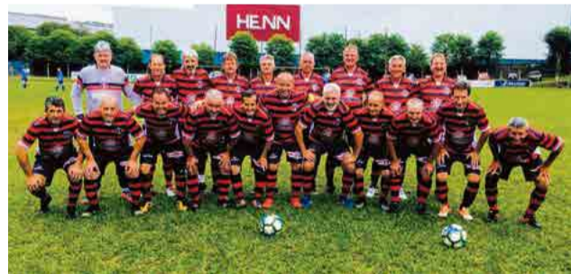
CRM ganhou de Mondai pelo placar de 2 x 1