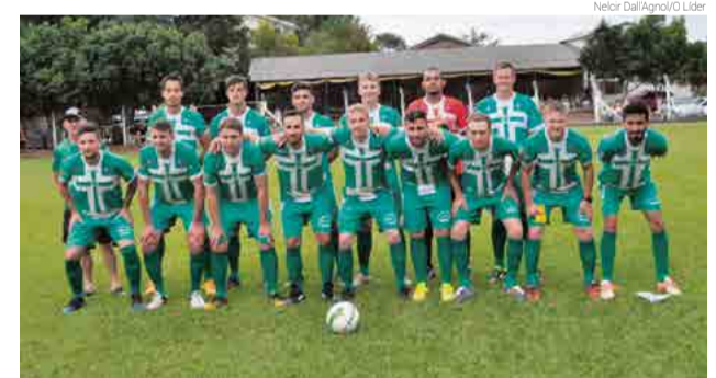
Na categoria principal o 4S ganhou pelo placar de 2 x 0 fora de casa

No próximo sábado (21), no Estádio Osvaldo Werner, tem Esportivo Bela Vista x 4S Amizade e na Linha Água Parada jogam Água Parada e Vasco da Gama. Os jogos começam, pela aspirante, às 13h45, e principal às 15h45.