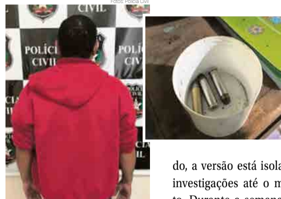
Prisão aconteceu após homem se apresentar para a Polícia Civil acompanhado de advogado