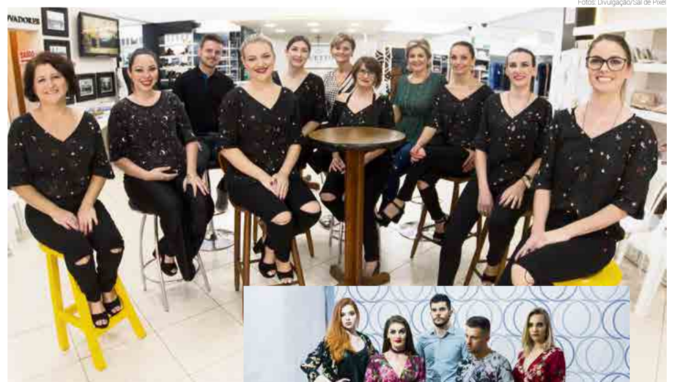
Equipe da Duetto Concept

No sábado (14) a Duetto Concept promoveu a 12ª Edição do lançamento da coleção Outono/Inverno 2018. O evento recebeu clientes da loja, teve música, coquetel e desfile. A equipe da Duetto Concept agradece a presença de todos que prestigiaram as novidades. “Foi um sucesso! Sete desfiles apresentaram a nova coleção feminina e masculina, que encantou o público com muita informação de moda”, contam.