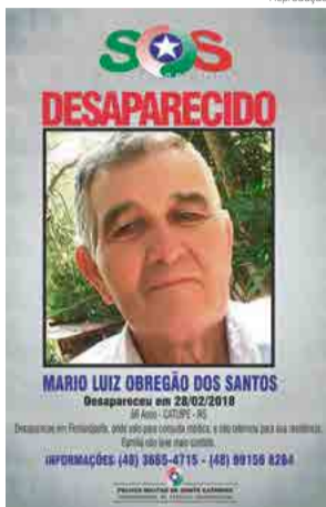
O desaparecimento do idoso foi incluído no Programa SOS Desaparecidos da Polícia Militar de Santa Catarina