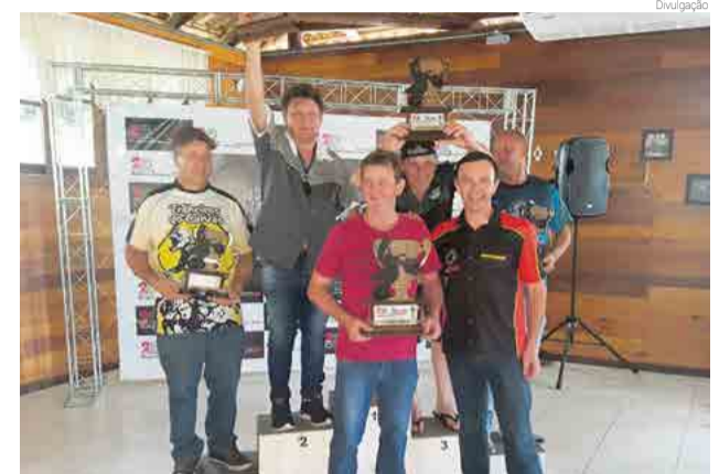
Maravilhense tem mais uma vitória e neste fim de semana compete em Erechim (RS)