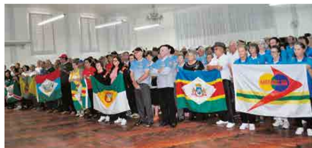
Mais de 300 atletas participaram da fase realizada em Maravilha

ravilha classificou nos dois napes; dança de salão, categoria de 60 a 69 anos, Pinhalzinho, assim como na dança acima de 70 anos; nas danças coreográfica e folclórica Maravilha está classificado.