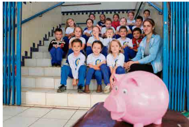
Crianças do 1º ano também aprendem sobre gastos