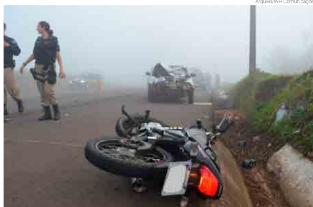
No ano passado, em toda a região, foram 473 acidentes envolvendo motociclistas