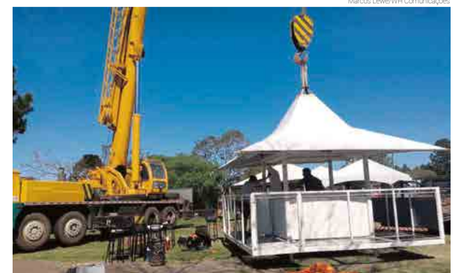
Bar nas alturas é uma das grandes atrações do Moto Entrevero

16h - Show de Wheeling Praça de Alimentação Bar nas alturas