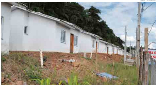
Recursos arrecadados com a renegociação serão usados para construção de novas moradias populares

O desconto oferecido pelo município é de 50% para mutuários que estejam com parcelas atrasadas e 60% para quem es-