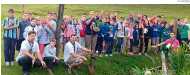
Escoteiros plantaram mudas de árvores nativas