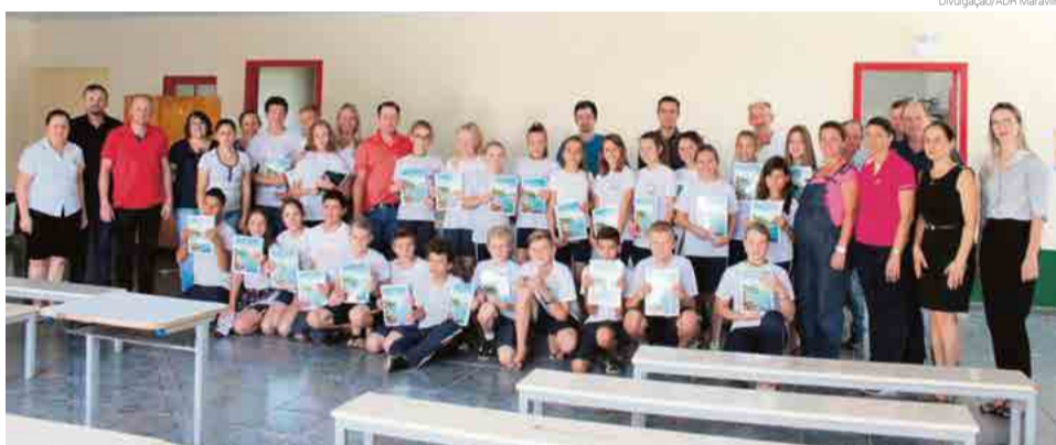
Entrega feita na EEB Silvío Romero, em Bom Jesus do Oeste

Os kits são compostos por cola, compasso, esquadro, transferidor, folhas A4, régua, apontador, borracha, caneta esferográfica, lápis, lápis de cor, caderno brochura, caderno de desenho e caderno universitário.