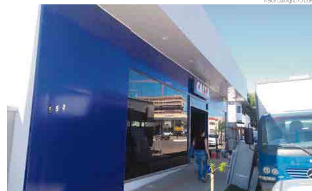
Estrutura está recebendo ajustes e todo serviço será migrado neste fim de semana

Conforme o gerente, a nova sede da Caixa Econômica Federal começa o atendimento em novo endereço às 10h de segunda-feira (23). A nova estrutura fica na Avenida Araucária, ao lado da Drummond Cafeteria & Livraria.