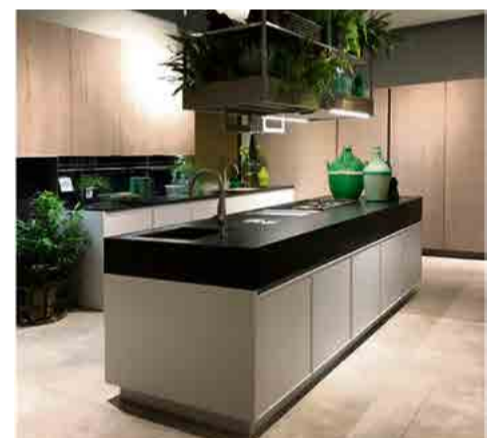
As cozinhas em madeira, cerâmica e metal laqueado da Doimo tem estética limpa sem serem frios.