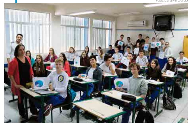
Alunos do projeto Economia Familiar produziram gráficos sobre gastos da própria casa

ções sobre necessidades básicas e o que significa dinheiro. “Queremos incentivar o raciocínio lógico, mostrar como funciona para conseguir comprar coisas e que tudo possui um custo”, afirma.