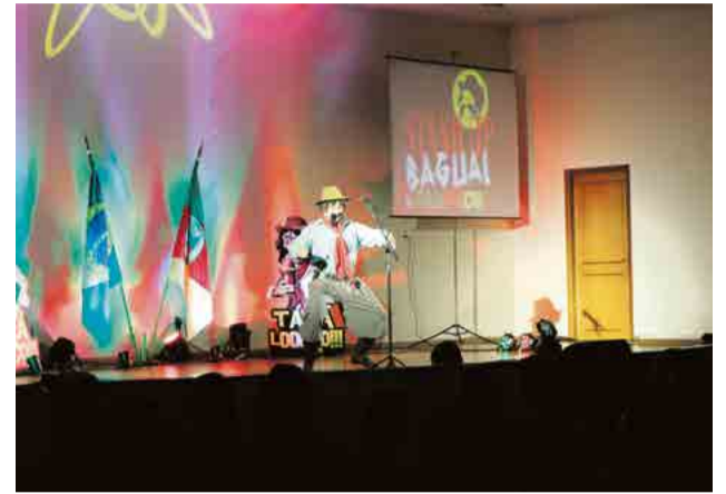
Apresentação em Maravilha lotou auditório do Maravilhas Park Hotel

O artista é conhecido em todo o país pelos personagens Gaudêncio, Jorge da Borracharia, Virginia Estar Uars, Kirilove, Ródsom dos Anjos e Claudiovaldo Nogueira.