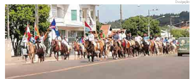
Tradicional cavalgada reuniu mais de 23 grupos

cipantes, a tradição vem crescendo ao longo dos anos