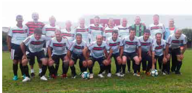
Maravilha 50tões também fez placar positivo contra Riqueza