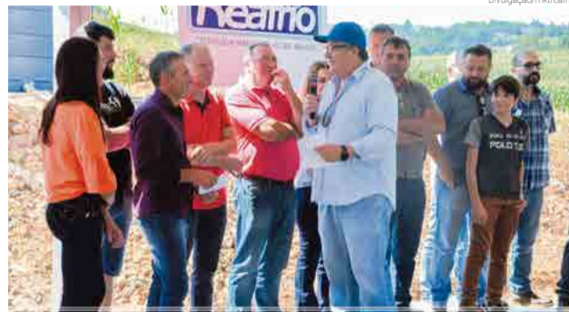
Inauguração Fazenda Vitória 14 de abril de 2018

O projeto de investimento dos proprietários começou no ano passado e conta com a parceria entre as empresas Reafrio e MX do Brasil. Hoje a denominada Fazenda Vitória conta com equipamentos modernos e ampla estrutura. "Temos um verdadeiro centro de pesquisas, com testes de novas tecnologias e ainda uma extensão da nossa área de engenharia, onde treinamentos e visitas técnicas serão colocados em prática. Aqui investimos e aplica-