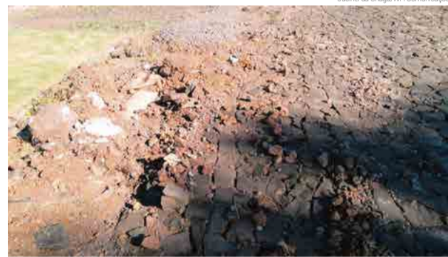
Calçamento está com pedras soltas e restos de obras

Uma moradora compartilhou nas redes sociais a insatis-