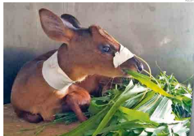
Veado-bororódo-sul ficou internado durante 25 dias na CliniVet