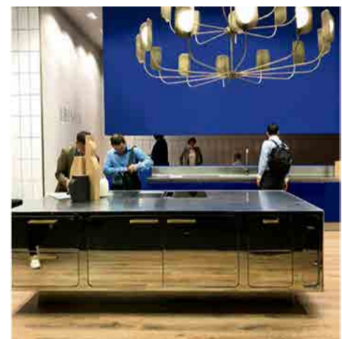
Abimis: cozinha modular em aço inox (poderá ser colorido como o azul ao fundo).

perfícies abrem e fecham com precisão - e até a pia desaparecerá para depois voltar à sua função tradicional, em uma espécie de jogo criado para facilitar as tarefas do cotidiano. A seguir, confira algumas das novidades que encontramos por lá!