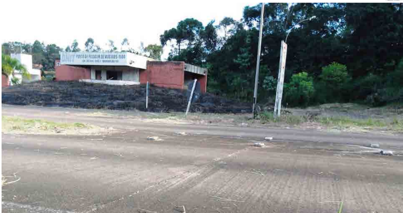
Local recebeu melhorias na semana passada às margens da BR-282