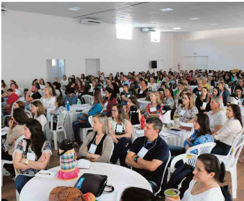
Encontro reuniu dezenas de profissionais da área e os secretários de educação dos municípios da Amerios

Após a etapa entre os municípios, haverá a fase estadual, que deve acontecer até outubro. A conferência em Brasília será realizada até novembro, com a presença dos delegados escolhidos nas etapas anteriores.