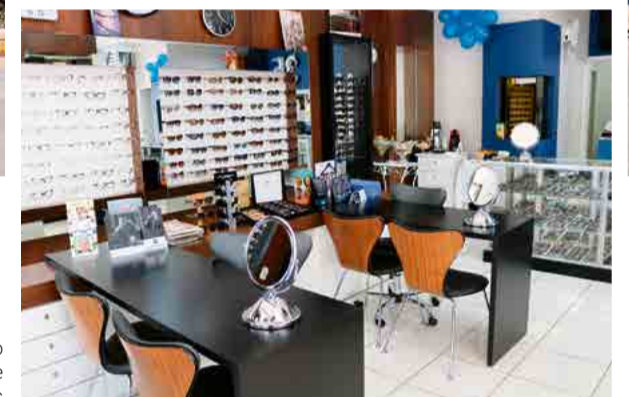
Mês de aniversário conta com promoções e diversas novidades

acesse o site e inscreva-se vestibular.unoesc.edu.br