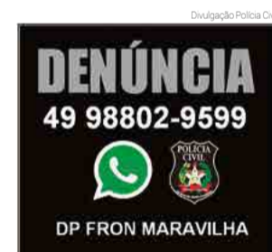
Denúncias podem ser feitas pelo aplicativo WhatsApp

A Polícia Civil ressalta que o serviço não é registro de ocorrência, mas captação de informações que poderão ser utili-