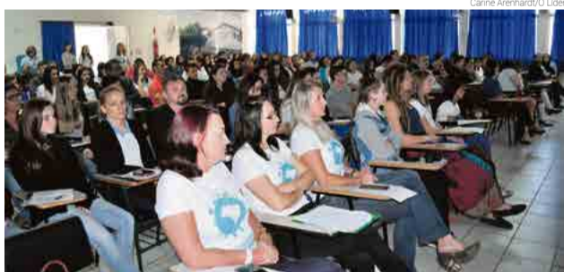
Conferência realizada no auditório da Escola Nossa Senhora da Salette

alizado a conferência interna, escolhendo um projeto e um aluno delegado para apresentar a ideia na