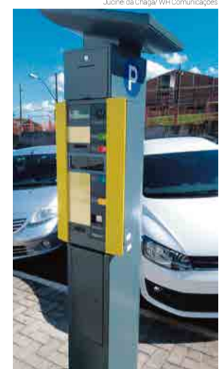
Cinco parquímetros estão sendo instalados no centro da cidade

"A empresa está na cidade trabalhando, instalando os cinco parquímetros na área central para a população ir se