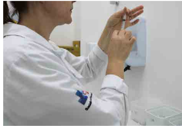
Até dia 1º de junho, fim da campanha, Santa Catarina deve aplicar 700 mil doses

O atendimento será realizado na Sala de Vacinação localizada na Unidade de Saúde Gelci Helena do Amaral, no Bairro Floresta, e na Unidade de Saúde Noili Berguer Diehl, no Bairro Bela Vista. As vacinas serão aplicadas de segunda a sexta-feira, das 7h30 às 11h e das 13h às 17h, sendo que a campanha encerra dia 1º de junho. Já o Dia D de Vacinação será realizado dia 12 de maio, das 8h