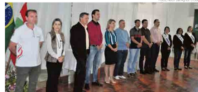
Lideranças políticas e ligadas ao esporte estiveram presentes na abertura