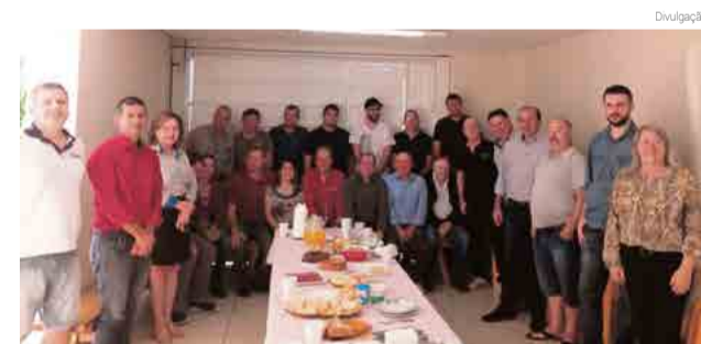
Reunião foi realizada na quarta-feira (18)