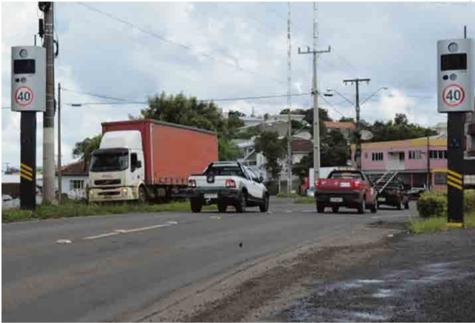
Administração disse que os novos equipamentos foram instalados em conformidade com as orientações do TCE/SC

Estudos técnicos insuficientes para definição dos locais para instalação de radares e lombadas eletrônicas, com base na análise das causas dos acidentes de trânsito ocorridos, ausência de fiscalização de contratos e de comprovação da aplicação dos recursos arrecadados com as multas para melhoria do sistema, falhas na execução de programas de educação para o trânsito. Estas foram algumas das constatações apuradas nas auditorias realizadas pelo Tribunal de Contas de Santa Catarina para verificar a regularidade do projeto básico e da execução contratada