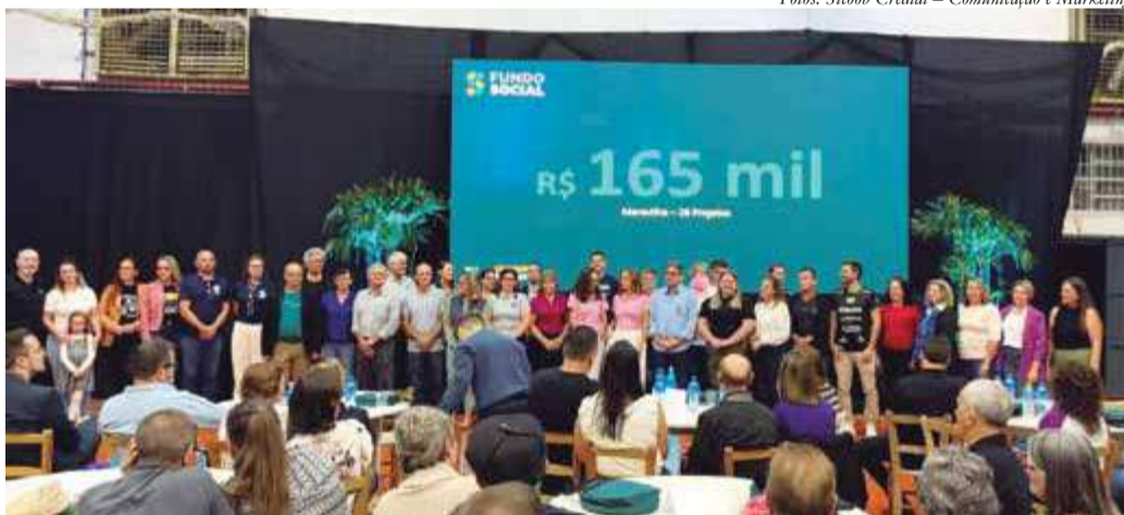
27 entidades de Maravilha foram contempladas