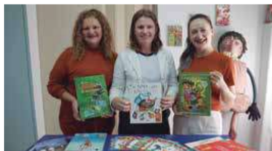
Com diversos livros em mãos, as contadoras já embasam o próximo repertório, que irá abordar de forma criativa as lendas brasileiras e o folclore

De acordo com a diretora, neste momento, o projeto arquitetônico com as mudanças está em elaboração. “A proposta é que a biblioteca seja um espaço de permanência, onde as pessoas venham não apenas para retirar livros, mas também para ler, conviver e se conectar com a cultura” , conta.