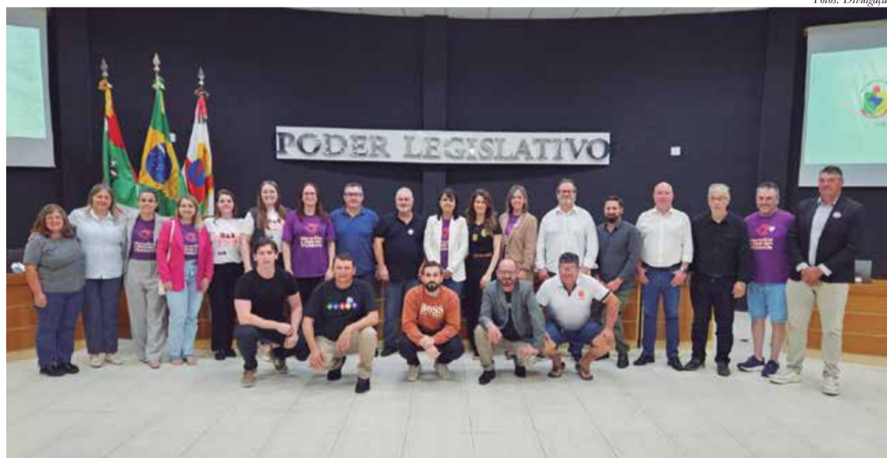
Participação especial na segunda sessão ordinária de abril (13/04)