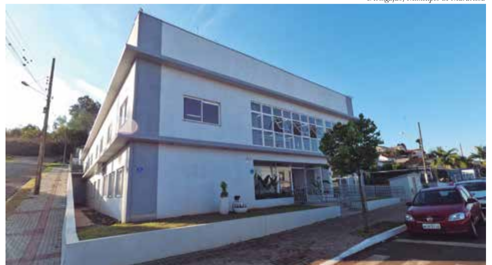
Encontro vai ser promovido no Centro de Cultura