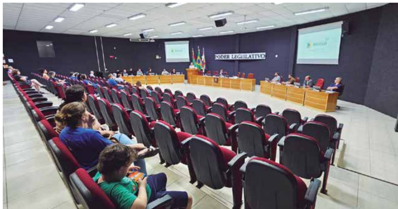
Público na primeira sessão ordinária de abril (06/04)