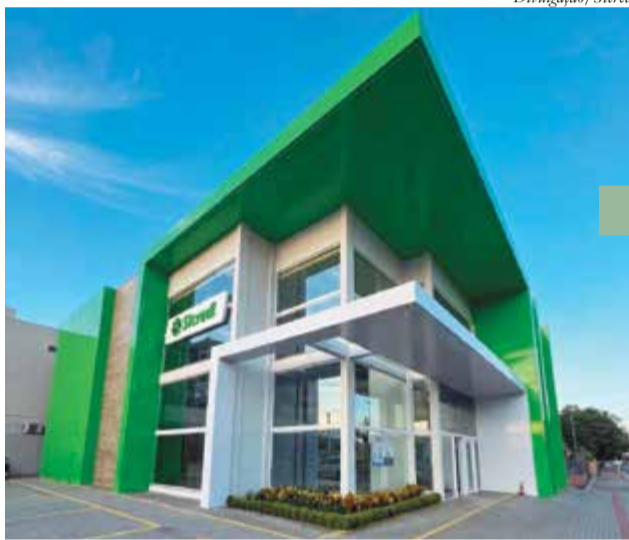
Agência está localizada na Avenida Anita Garibaldi, nº 550