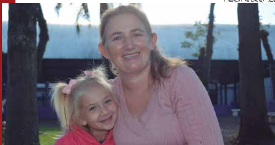
União e cuidado marcam a rotina da família após o diagnóstico