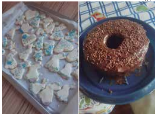
Renata desenvolveu receitas adaptadas para garantir uma alimentação segura e saborosa para a filha