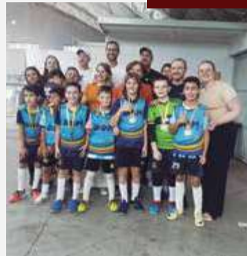
Representante da equipe campeã na categoria Sub-10 compartilha experiência na competição