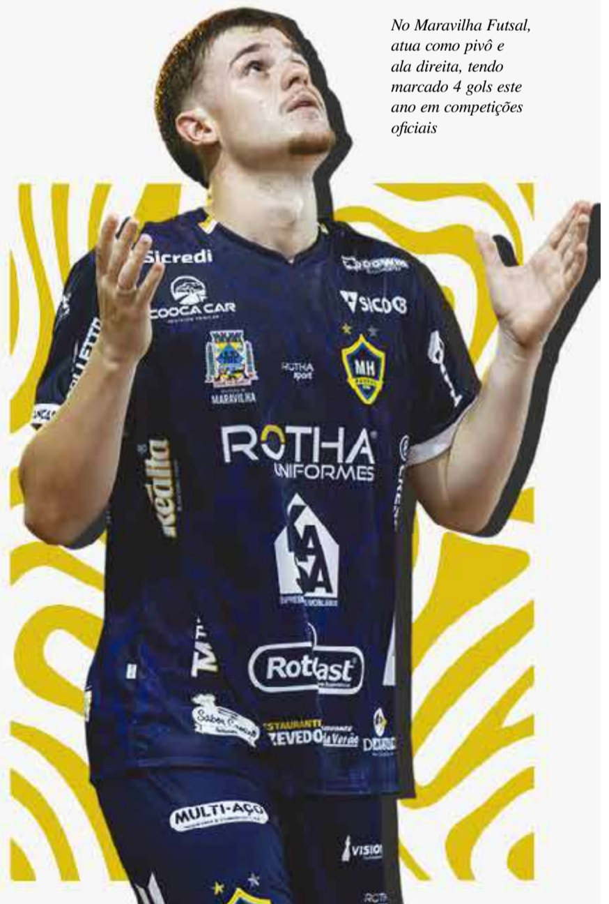
No Maravilha Futsal, atua como pivô e ala direita, tendo marcado 4 gols este ano em competições oficiais