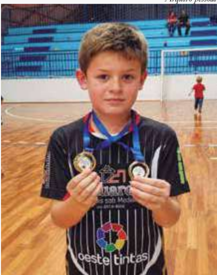
Aos 9 anos, em um mesmo dia foi campeão no campo e na quadra, momento que segue influenciando em sua trajetória até os dias atuais