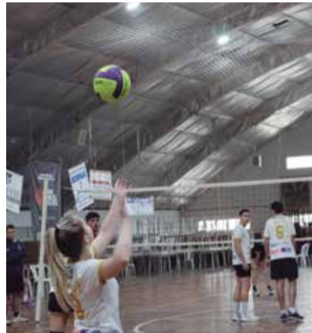
Equipes de voleibol protagonizaram grandes jogos durante o domingo (26)