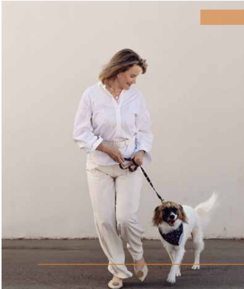
Passeio faz parte da rotina e fortalece ainda mais a conexão entre os dois