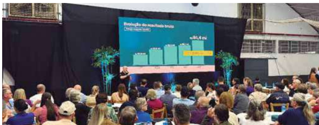
Dentre os números do exercício de 2025, foi destacada a distribuição de R$ 45 milhões em sobras aos cooperados, o maior valor já registrado na história do Sicoob Credial