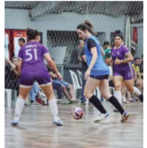
Futsal movimentou intensas disputas durante cinco dias de jogos