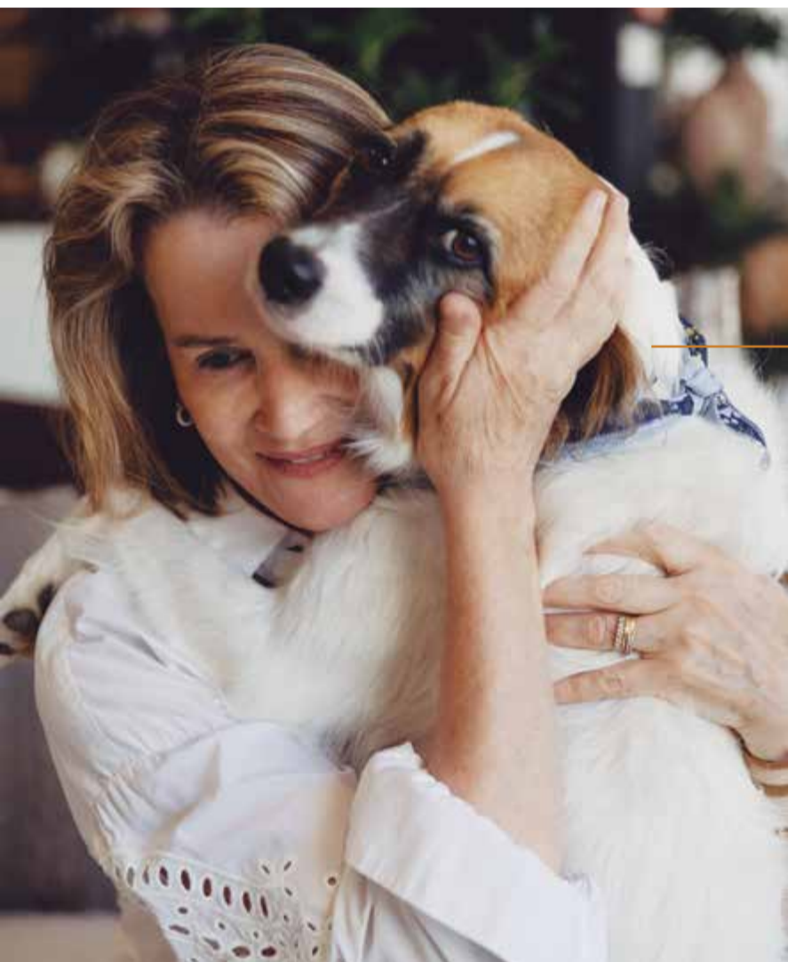
Família teve a vida transformada após a chegada de mais um companheiro de quatro patas

Após aprovação, é realizado o preenchimento e assinatura do termo de adoção responsável. Sempre buscamos lares com espaço adequado e pessoas comprometidas com amor, cuidado e responsabilidade por toda a vida do animal. Após a adoção, a ONG fiscaliza periodicamente os animais doados para verificar se estão sendo bem cuidados.