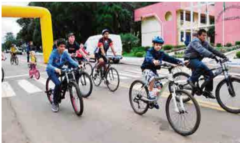
Passeio ciclístico também foi uma das atrações