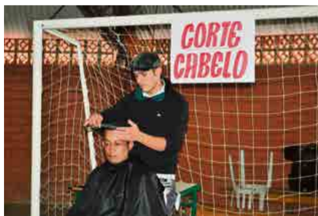
Corte de cabelo gratuito foi oferecido aos participantes da ação