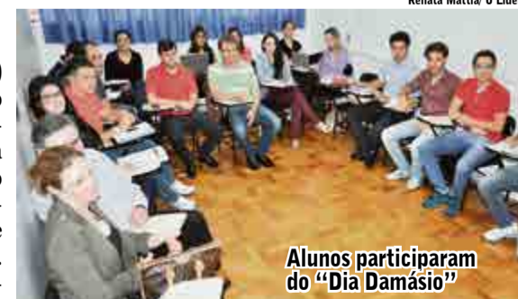
Alunos participaram do "Dia Damásio"

Além dos cursos preparatórios para o Exame de Ordem, o Damásio de Jesus de Maravilha oferece cursos preparatórios para concursos