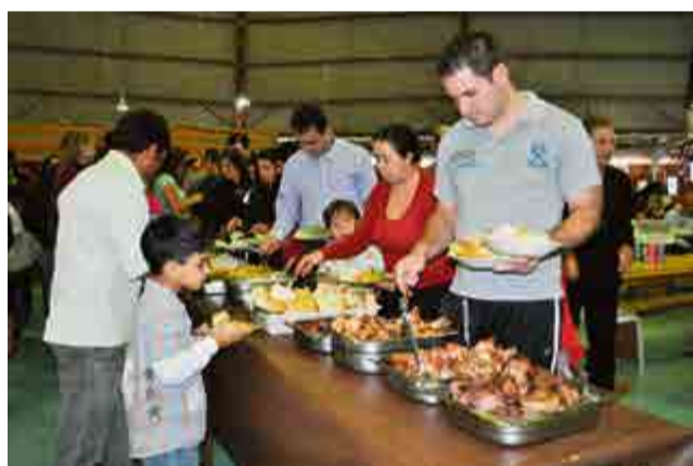
Almoço reuniu mais de 900 pessoas