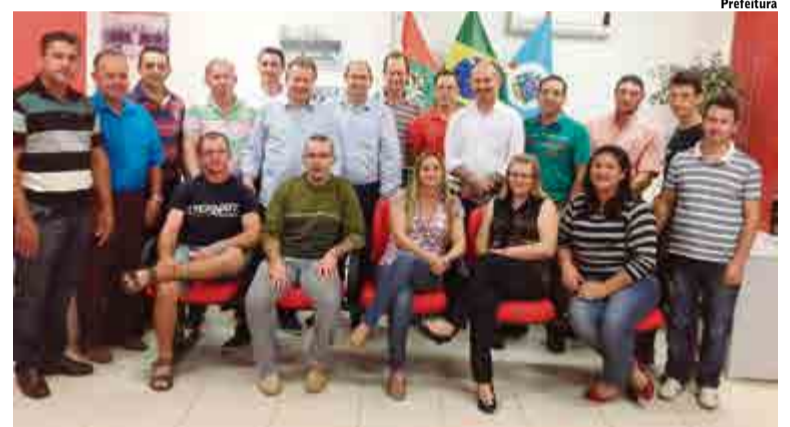
Encontro ocorreu na Prefeitura e foi acompanhado por lideranças municipais