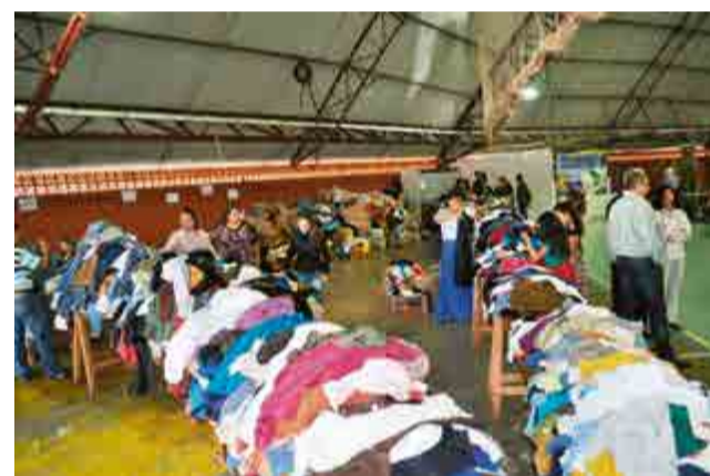
Um contêiner de roupas novas e usadas foi comercializado no brechó