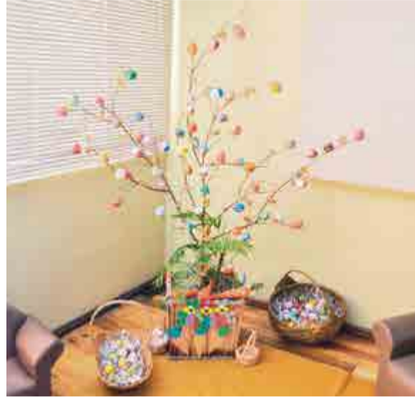
Árvore de Páscoa encanta a todos

A família tem a tradição de esconder os presentes das crianças e também dos adultos, sendo que cada família tem a sua cesta, que se encontra cheia na manhã da Páscoa, mas sempre em