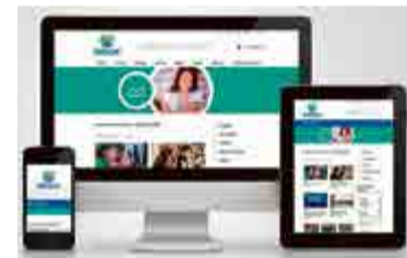
Site está de cara nova desde a última segunda-feira (14)

A GAMBATTO VEÍCULOS QUER DIVIDIR COM VOCÊ UMA CONQUISTA MUITO ESPECIAL!