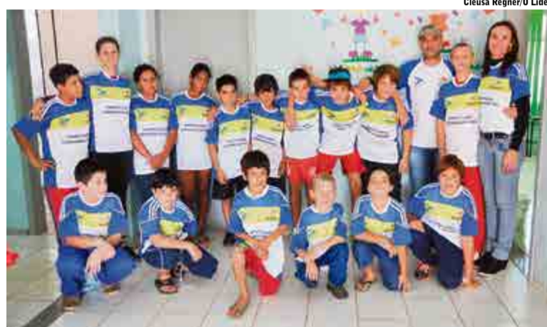
Enxadristas receberam uniformes na última terça-feira (15)