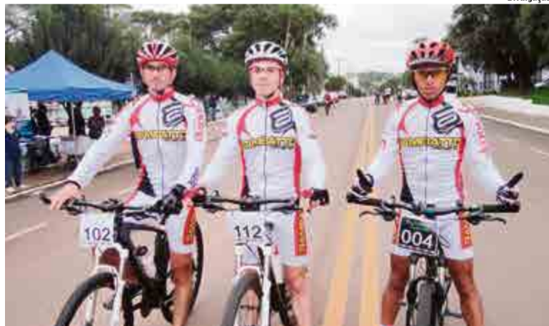
Equipe Gambatto Racing de MTB obteve bom resultado nas provas