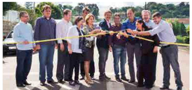
Corte da fita da Avenida Padre Antonio com a Rua Serafim Bertaso marcou a inauguração

obra. "Esses momentos são os que marcam a vida de um político, quando conseguimos fazer o bem para a comunidade. É isso que propomos, trabalhar para o nosso município para ter uma melhor qualidade de vida, e aqui está, as pessoas com seus imóveis valorizando a cada dia mais e o trânsito fluindo. Até o final do ano temos muitas outras ruas a serem inauguradas e virá mais R$ 600 mil para podermos fazer mais asfalto", afirmou.