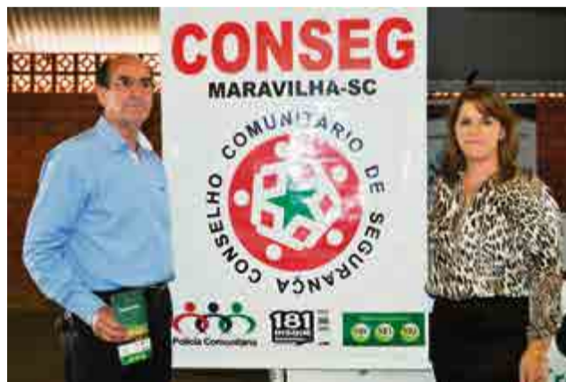
Conseg participou repassando orientação sobre a segurança