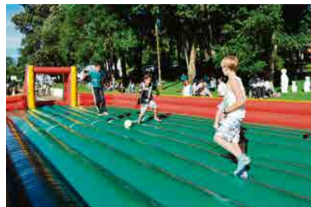
Brinquedos infláveis estiveram à disposição das crianças