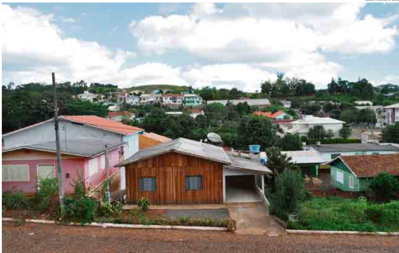
Isabel Muller/O Líder

No bairro tem apenas um mercado, mesmo assim os moradores não sentem falta do comércio, pois a proximidade com o Centro de Maravilha possibilita o fácil acesso com os mais variados setores comerciais.