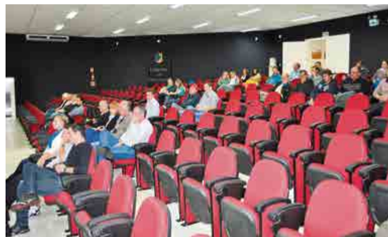
Palestra foi direcionada para a comunidade em geral e interessados no Plano Diretor