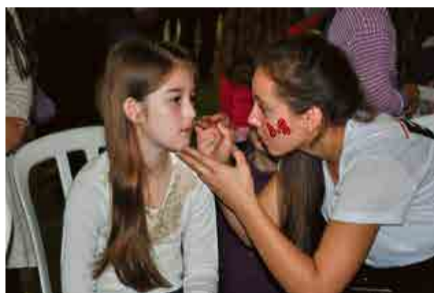
Crianças se divertiram com a pintura facial