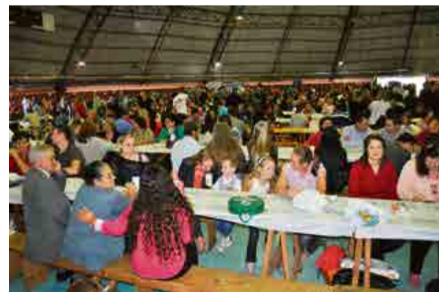
Grande público prestigiou a 9ª Ação Voluntária