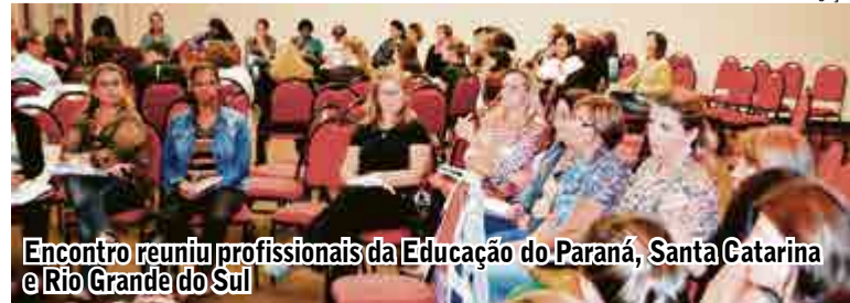
Encontro reuniu profissionais da Educação do Paraná, Santa Catarina e Rio Grande do Sul