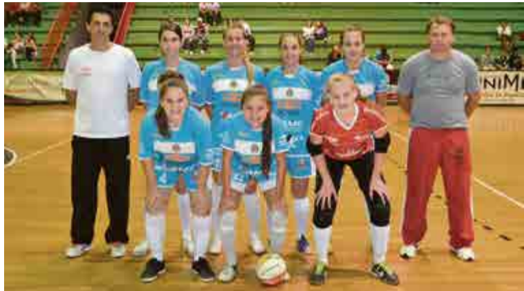
Equipe feminina ficou em terceiro lugar na competição