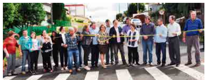
Descerramento da fita inaugural da pavimentação da Rua São Francisco teve o investimento de recursos próprios do município com contribuição dos moradores