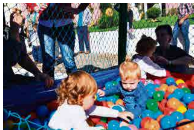
Menores de um ano se divertiram na piscina de bolinhas