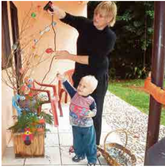
Netos e sobrinho auxiliaram na construção da osterbaum