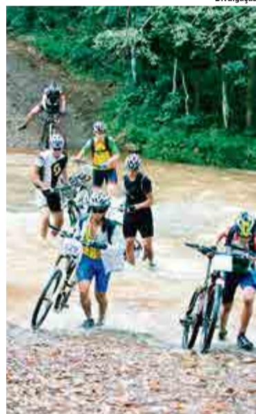
Diversos foram os obstáculos durante o percurso