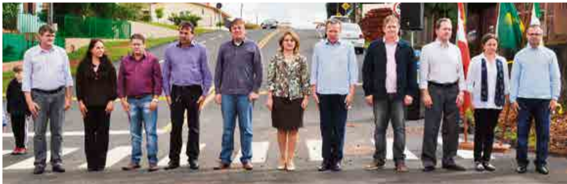
Ato solene foi realizado no entroncamento da Avenida Padre Antonio com a Rua São Francisco e contou com a presença das autoridades municipais

da Rua Serafim Bertaso e Avenida Padre Antonio teve um valor total de R$ 527.400, sendo que R$ 389.882,94 foram provenientes de recursos da União, por meio do Ministério das Cidades, com contrapartida do município de R$ 137.517,06.