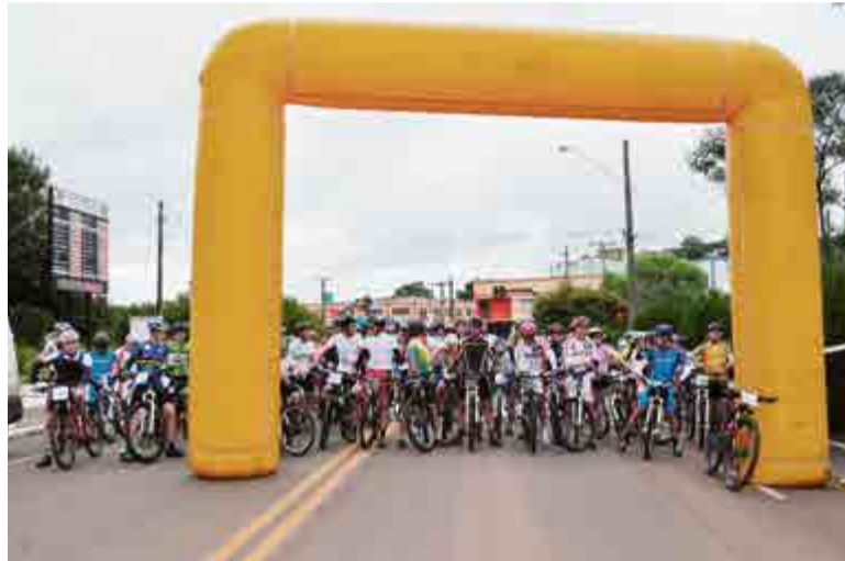
Largada foi realizada no início da manhã de domingo