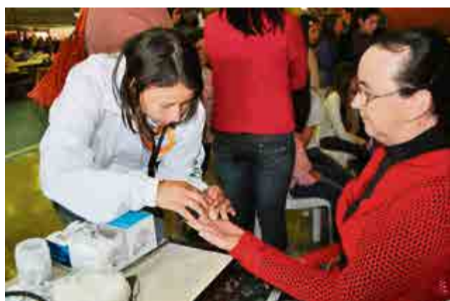
Secretaria de Saúde do município realizou os exames de diabetes e hepatite