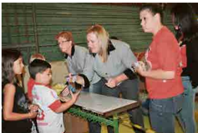
Cada ovo encontrado foi trocado por um brinquedo