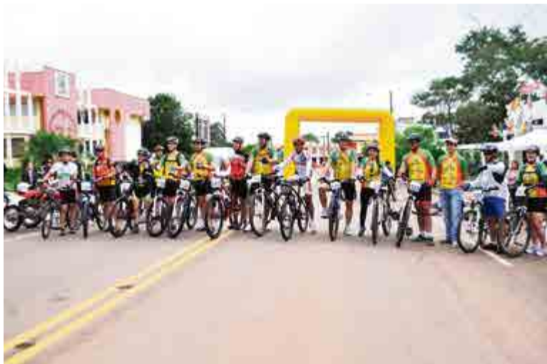
Evento foi organizado pelo Grupo Pedal Maravilha