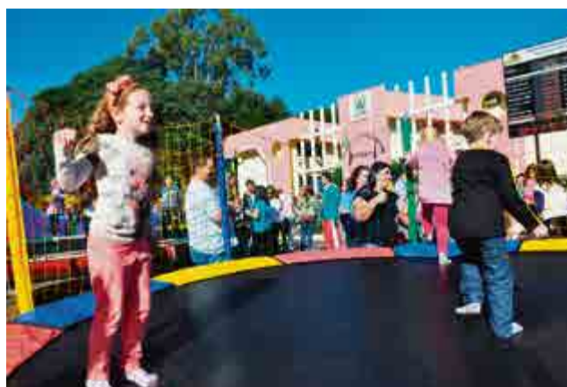
Após a Caça ao Ovo, diversão ficou por conta dos brinquedos disponíveis