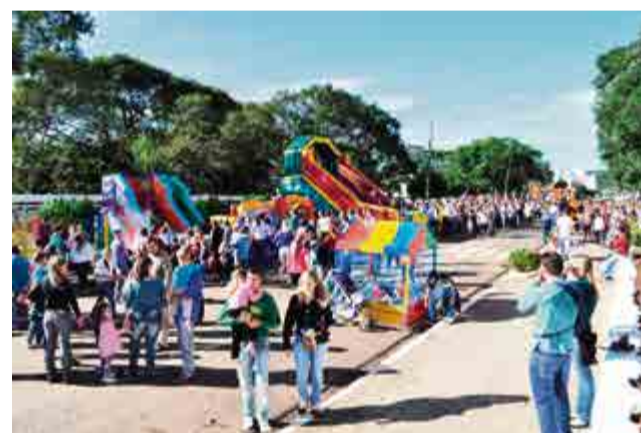
Pais, familiares e crianças aproveitaram as atividades programadas para a 6ª Caça ao Ovo