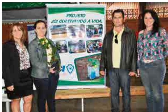
Associação Movimento Amigos do Entre-Rios (Mader) e JCI colaboram com o evento