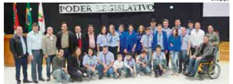
Grupo Escoteiro Raízes prestigia atividades do Legislativo