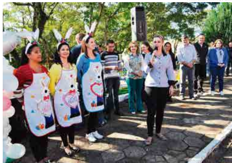
Autoridades acompanharam a abertura do evento