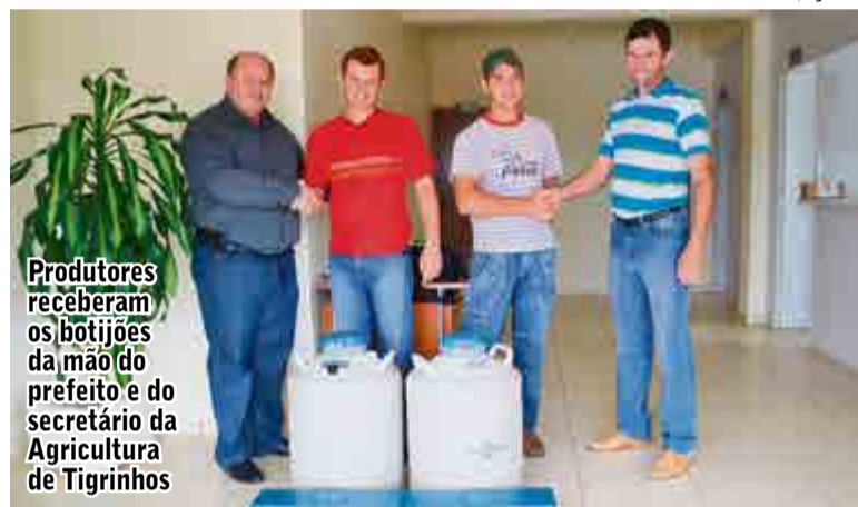
Produtores receberam os botijões da mão do prefeito e do secretário da Agricultura de Tigrinhos