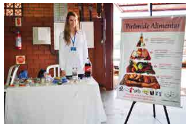
Orientações nutricionais também foram oferecidas