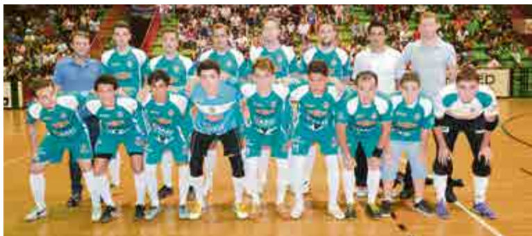
Troféu disciplina ficou com ala masculina da Modelo