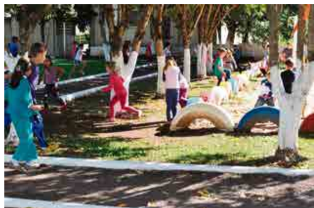
Crianças se divertiram à procura dos ovos de Páscoa