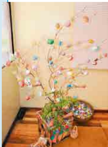
Uma decoração diferenciada na Páscoa fez com que algumas cidades de Santa Catarina ganhassem destaque nacional