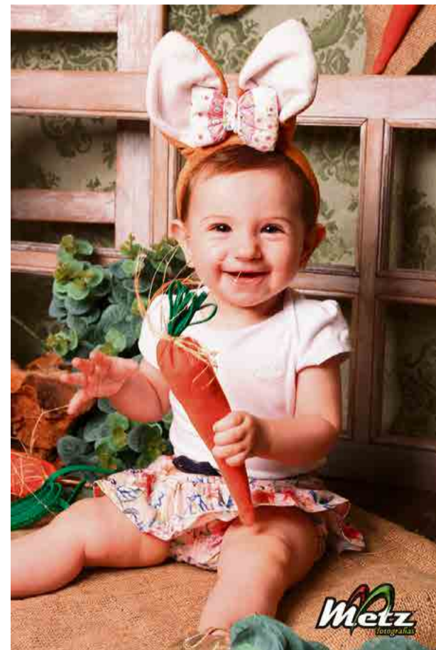
Valentina, uma fofurinha de coelhinha