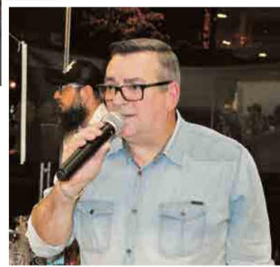
Gerente deu as boas-vindas ao público da noite