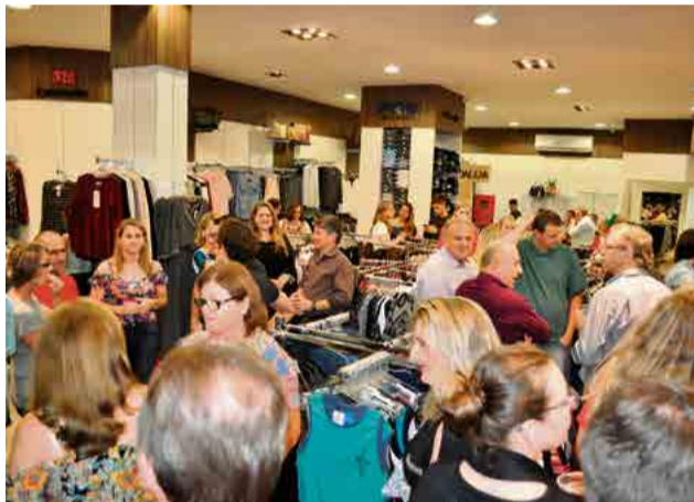
Clientes marcaram presença em noite especial

Em evento especial para convidados e à imprensa na noite de quarta-feira (4), foi realizada a inauguração da loja Cia Mega Store, na esquina da Avenida Sul Brasil com a Rua Prefeito Albino Cerutti Cella. Os proprietários salientam a nova arquitetura do ambiente, moderna e acolhedora, para que os clientes tenham mais conforto na hora de realizar suas compras.