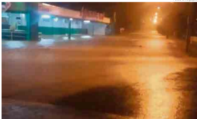
Alagamento na região do Iguatemi Alimentos