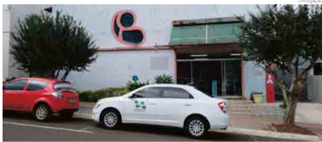
Novo endereço fica na Rua Almirante Barroso, em frente ao cartório, no prédio onde funcionava o Procon e a Casa da Cidadania

prédio localizado na Rua Guilherme Missen e foi transferida para a antiga sede da Câmara de Vereadores, junto ao Centro Cultural. Agora é a vez da Saúde, que funcionava no mesmo prédio da Rua Guilherme Missen. Segundo o prefeito, Wilson Trevisan, o principal motivo destas mudanças é a economia que será gerada por sair do aluguel. "São cerca de R$ 22 mil que deixaremos de gastar todo mês. Até o fim da nossa gestão, serão poupados mais de R$ 700 mil apenas com esta iniciativa", destaca.