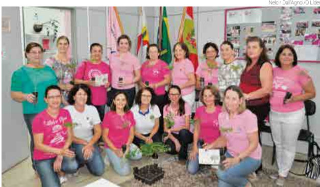
Mudas de moringa, doadas na sede da Rede Feminina de Combate ao Câncer

no combate à fome pelo planeta. “Depois de uma pesquisa, constatamos centenas de benefícios da árvore e queremos que todos compartilhem disso. Ela é chamada de árvore mágica pelos botânicos e conseguimos as mudas para Maravilha”, destacam os integrantes.