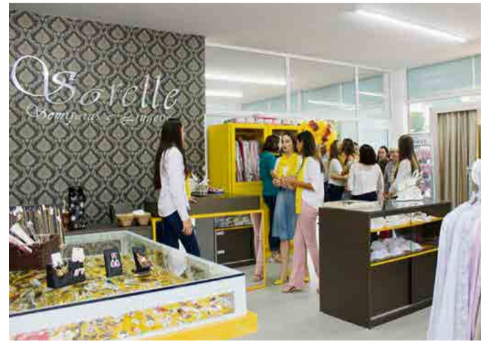
No dia da inauguração, equipe atendeu clientes