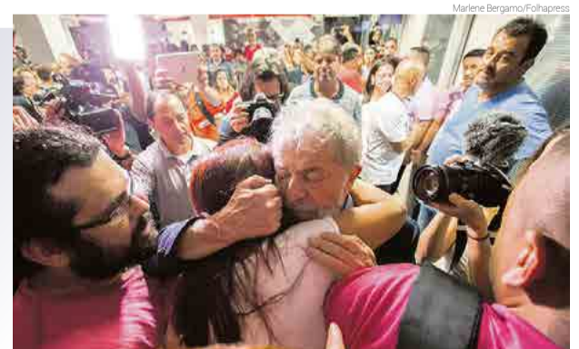
Lula recebe apoio de simpatizantes e lideranças em São Paulo

O partido argumenta que a decisão visa impedir a candidatura de Lula nas eleições deste ano. "O povo brasileiro tem o direito de votar em Lula, o candidato da esperança. O PT defenderá esta candidatura nas ruas e em todas as instâncias, até as últimas consequências".