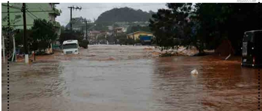
Enchente de 2015

Os moradores de Maravilha, principalmente os que moram à beira do Rio Iracema, tiveram um fim de semana de terror. Com as fortes chuvas, o rio saiu do leito e tomou residências, estabelecimentos comerciais e ruas da cidade. Para quem passou por enchentes, sabe que é uma tragédia. Perdemos quase tudo na de 2015 e tem gente ainda pagando os prejuízos havidos. Mas estamos vendo luz no fim do túnel, pois estão assegurados os recursos para a solução do problema em definitivo, conforme palavras da prefeita, Rosimar Maldaner. O grande problema é a burocracia, que emperra maior agilidade na obra.