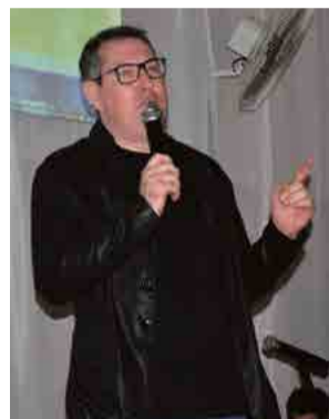
Para Henzel, as pessoas se odeiam por coisas pequenas e isso prejudica todos