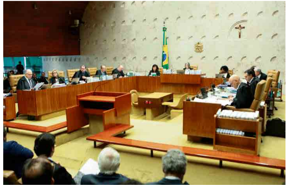
Sessão teve duração de mais de dez horas

O ex-presidente iniciará o cumprimento da pena em uma sala de 15 metros quadrados com banheiro, no quarto andar da Superintendência da Polícia Federal em Curitiba. O despacho de Moro justifica a escolha da sala reservada como um ambiente "sem risco para a integridade moral ou física".