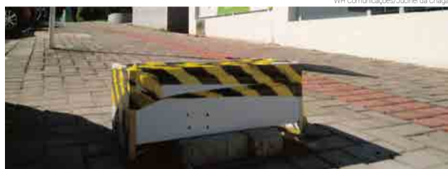
Em 60 dias a empresa vencedora da licitação deve começar operar com o novo sistema

Em 60 dias a empresa vencedora da licitação deve começar operar com o novo sistema. Antes disso, será realizado convênio com 50 estabelecimentos comerciais que irão disponibilizar os botões de estacionamento para venda. A secretária enfatiza que um aplicativo para smartphones também já está disponível para facilitar a compra dos créditos. O valor da hora será de R$ 2 para carros e de R$ 1 para motocicletas.