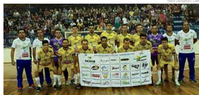
Maravilha abriu vantagem, mas no fim do jogo resultado ficou apertado

Na noite de sábado (31) a equipe do Maravilha Futsal deixou a torcida maravilhense feliz. Em jogo realizado pela terceira rodada da Liga Catarinense de Futsal, no Ginásio Municipal de Esportes Gelson Tadeu Lara, de Maravilha, a equipe da casa confirmou a boa campanha. A vitória contra Xaxim garan-