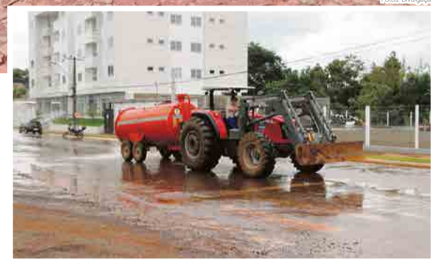
Equipes da prefeitura trabalhando na limpeza da cidade

Na Avenida Presidente Kennedy uma família ficou presa dentro do carro. Eles estariam se deslocando para socorrer outros familiares, onde uma casa estava sendo alagada, mas ao tentarem passar pela região de alagamento a água invadiu o carro, causando falhas no sistema elétrico do veículo. As portas ficaram travadas na parte interna e a família foi socorrida por uma pessoa próxima ao local que percebeu o problema.