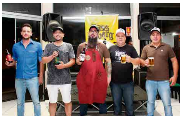
Equipe presta atendimento com as melhores opções do ramo