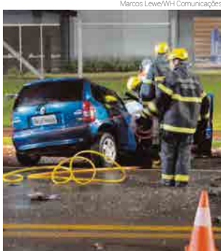
Acidente aconteceu na madrugada do último sábado