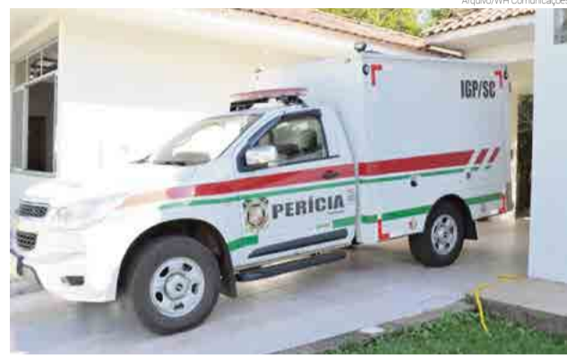
Viatura estaria com eixo quebrado e impossibilitada de realizar os trabalhos

Um dos casos em que os Bombeiros foram acionados foi no acidente de trânsito