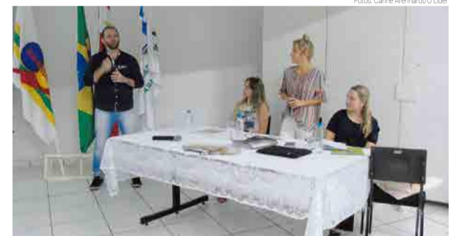
Diretoria comandou o evento