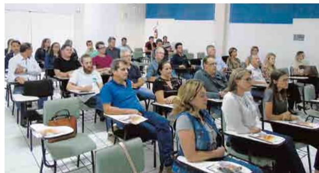
Associados acompanharam a assembleia

bro, com mais de 400 m 2 de área construída. A estrutura vai contar com salas administrativas, sala de reuniões, copa, auditório com capacidade para dois eventos simultâneos e já com possibilidade de ampliações futuras. No próximo dia 16 será realizada explanação sobre o projeto, com espaço para esclarecer as dúvidas das empresas interessadas. No dia 25 é o prazo final para apresentação das propostas.