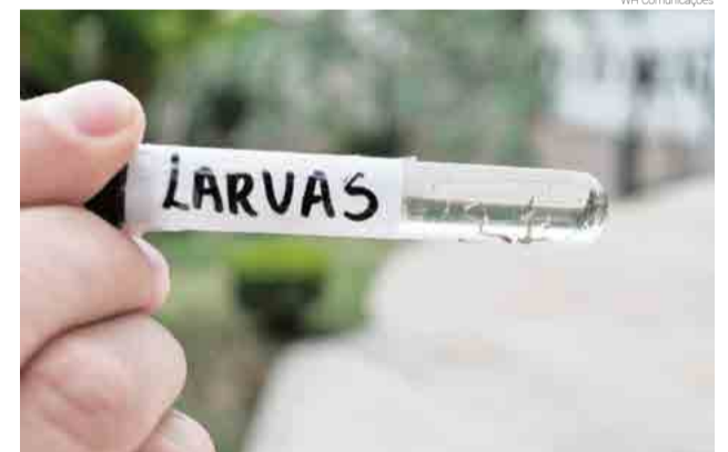
São Miguel do Oeste já registra 271 focos do mosquito que é transmissor da dengue, zika e chikungunya

Entre os municípios que apresentam alto risco estão Bandeirante, Belmonte, Paraíso e Iporã do Oeste. Já entre os que apresentam médio risco, completam a lista os municípios de Anchieta, Descanso, Guaraciaba, Maravilha e São Miguel do Oeste. Neste último, os números só fazem aumentar. Somente na semana passada foram registrados 17 novos focos do mosquito em São Miguel do Oeste. Atualmente, o setor de combate à dengue tem instalado na área urbana 86 armadilhas.