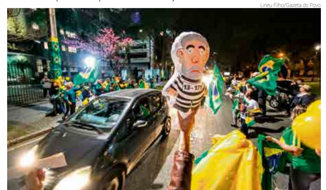
Manifestantes comemoram ordem de prisão