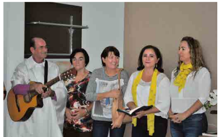
Ledacir contou um pouco da história da loja aos presentes