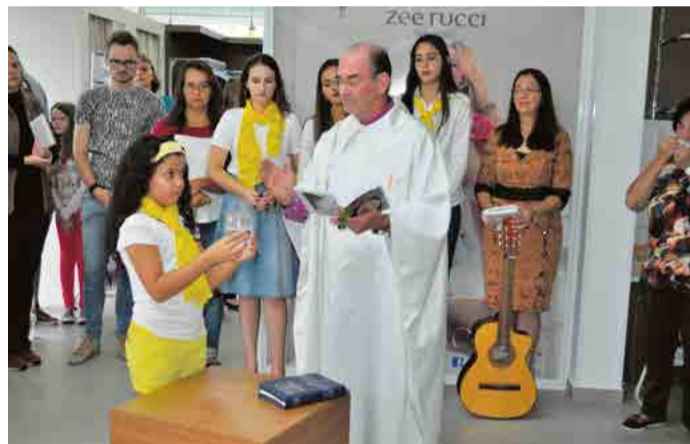
Ministros realizaram cerimônia para pedir proteção e sucesso