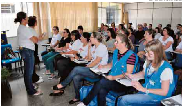
Nove mil folhetos foram entregues durante reunião com os agentes de saúde

O presidente agradece ao Sicoob Credial de Maravilha pelo apoio financeiro para a confecção dos folhetos e a secretaria municipal pela parceria. “A nossa entidade está grata pela colaboração das pessoas. Dessa forma nossas campanhas são mais eficientes”, afirma.