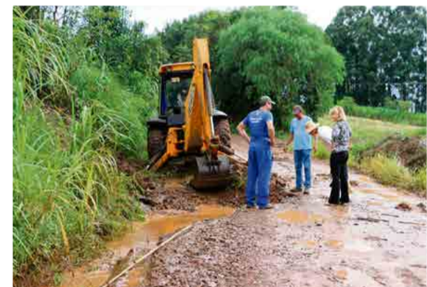
Governo municipal trabalhou em pontos emergenciais no interior para restabelecer as vias