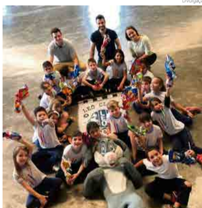
Objetivo da campanha é desenvolver o trabalho em equipe e o espírito da Páscoa

lembrança. Cada criança ganhou um ovo de chocolate para levar para casa. "Ficamos felizes com o movimento de felicidade que criamos. Agradecemos a escola pela oportunidade", finalizam.