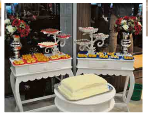
Doces e salgadinhos foram oferecidos aos convidados e clientes