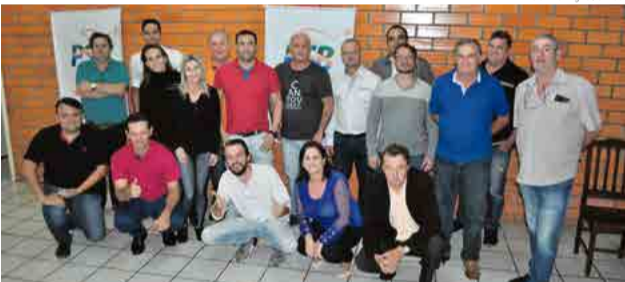
Lideranças da sigla se reuniram com deputado na Assommar