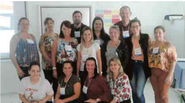
Curso teve carga horária de 12 horas

A meta é atingir 500 jovens até dezembro deste ano com cursos de 12 horas, trabalhadas em formato de oficinas. “Queremos inspirar os jovens para o mercado de trabalho. Ao longo do ano vamos espalhar essas 14 pessoas que fizeram parte do curso pelas instituições e projetos de ensino”, afirma.