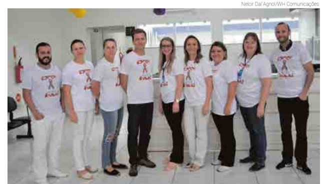
Equipe de servidores da Unidade de Saúde Gelci Helena do Amaral aderiu à causa adquirindo camisetas da campanha