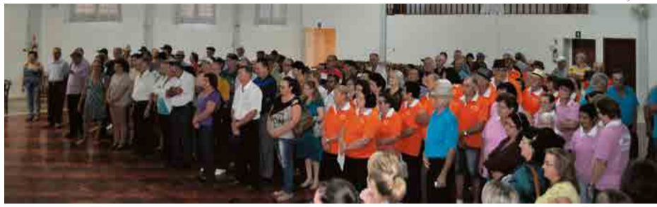
Neste ano aproximadamente 300 atletas participaram

Os Jogos Abertos da Terceira Idade (Jasti) foram realizados na quarta-feira (4) no Lar de Convivência, reunindo mais de 250 participantes. As modalidades disputadas foram bolão, bocha, canastra e dominó masculino e feminino; truco masculino; dança de salão de 60 a 69 anos; dança folclórica e coreográfica. A Secretaria de Assistência Social, por meio da coordenação da terceira idade, foi responsável pela organização do evento, que também teve o apoio da Secretaria Municipal de Esportes na condução e arbitragem das modalidades. A fase microrregional será no dia 18 de abril, no Lar de Convivência, em Maravilha.