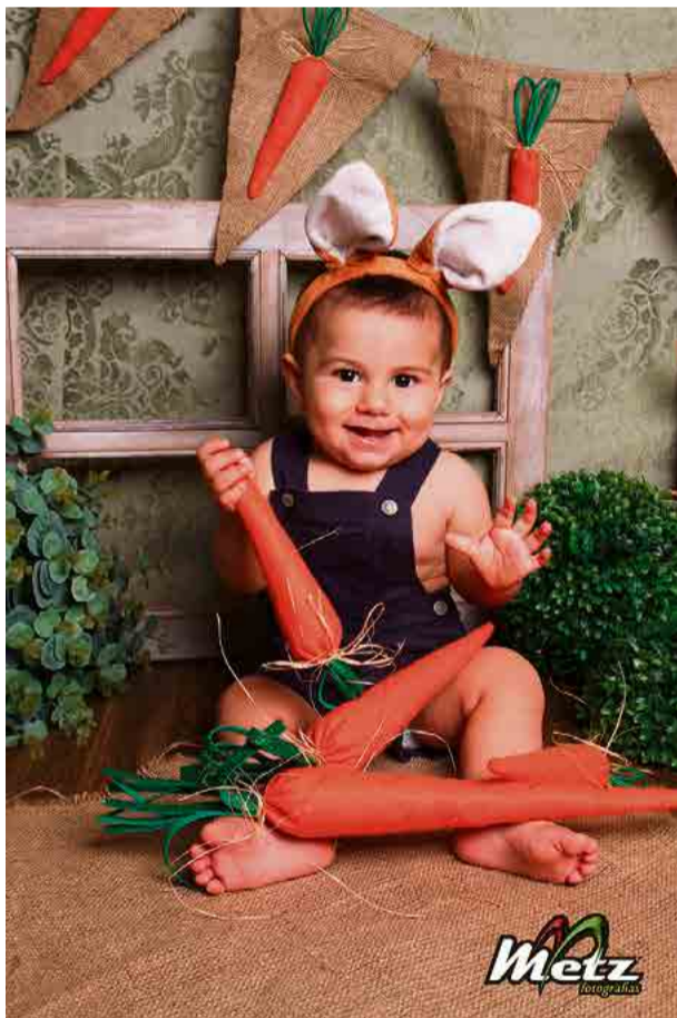
Lorenzo, um coelhinho danadinho!