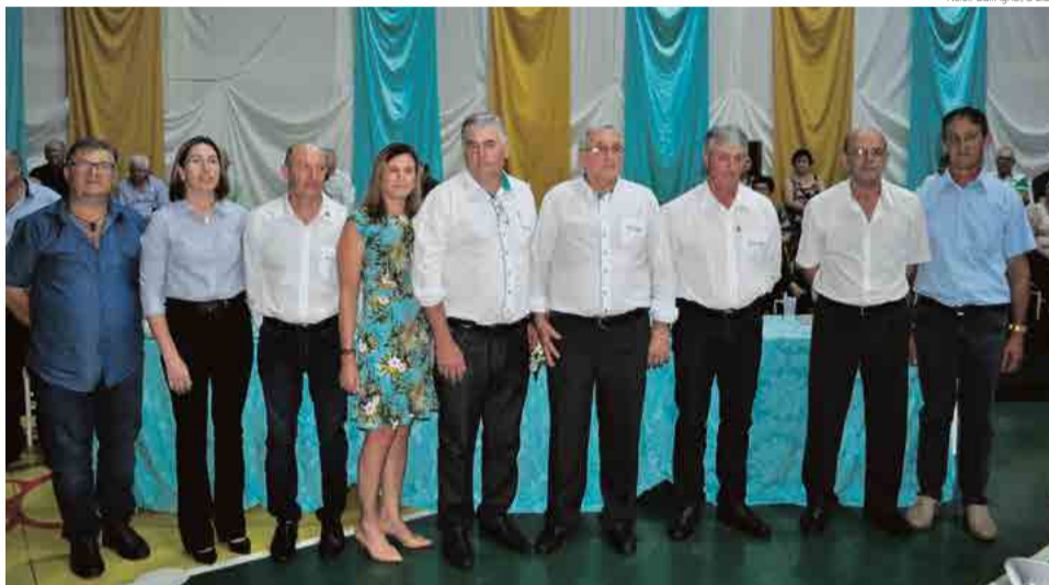
Única chapa apresentada foi eleita por unanimidade

Em 2017 a cooperativa registrou resultado superior ao exercício de 2016 de 31%, isto é, de R$ 16.280 milhões para R$ 21.360 milhões. Destes, R$ 13 milhões foram destinados