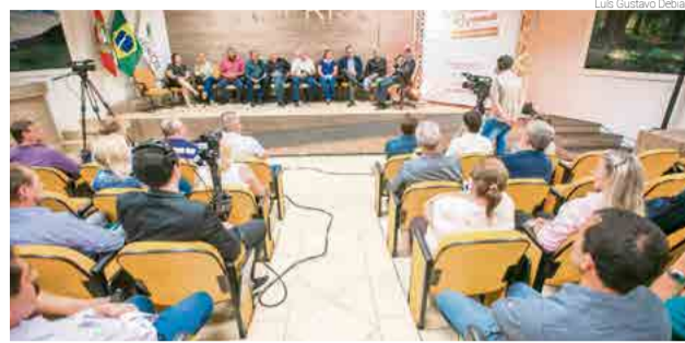
Deputado fala sobre diversos assuntos