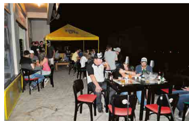
Clientes lotaram a parte externa da casa

O melhor plano de saúde do estado, segundo a ANS.