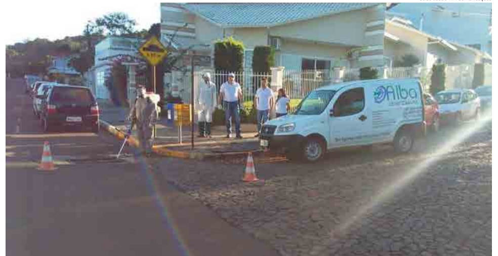
Trabalho começou nas ruas centrais da cidade e vai se estender por toda cidade

Com o objetivo de evitar riscos para a saúde e bem-