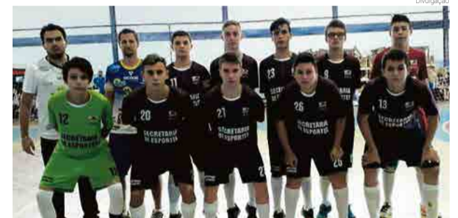
Foco da equipe são as competições da Liga e a Olesc