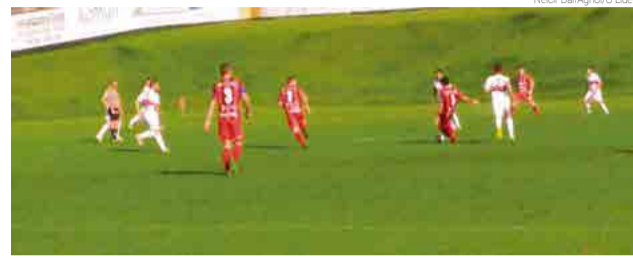
Partida foi marcada por três pênaltis: dois para o Ajap e um para o CRM