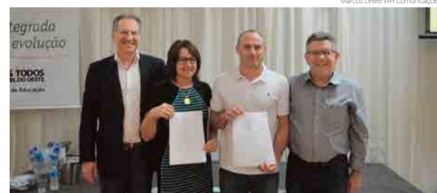
Ato foi realizado durante o 1º Encontro de Pais promovido pela Secretaria de Educação

O ato foi realizado durante o 1º Encontro de Pais promovido pela Secretaria de Educação, para os responsáveis por alunos da educação infantil e anos iniciais do ensino fundamental, atendidos pela rede municipal de ensino. O evento contou com a parceria do Sistema Educacional Família e Escola (SeFe), empresa fornecedora dos novos materiais didáticos e capacitações para professores,