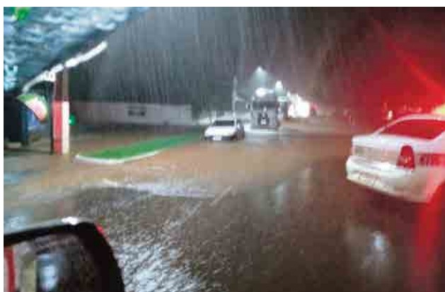
Veículos foram atingidos em regiões de alagamentos

Em 24 horas, entre o sábado e domingo, o volume médio de chuva ficou entre 95 e 110 milímetros em Maravilha, conforme apurado pela Defesa Civil. Já a Secretaria Municipal de Agricultura informou que algumas localidades do interior chegaram a registrar 135 milímetros neste mesmo período.