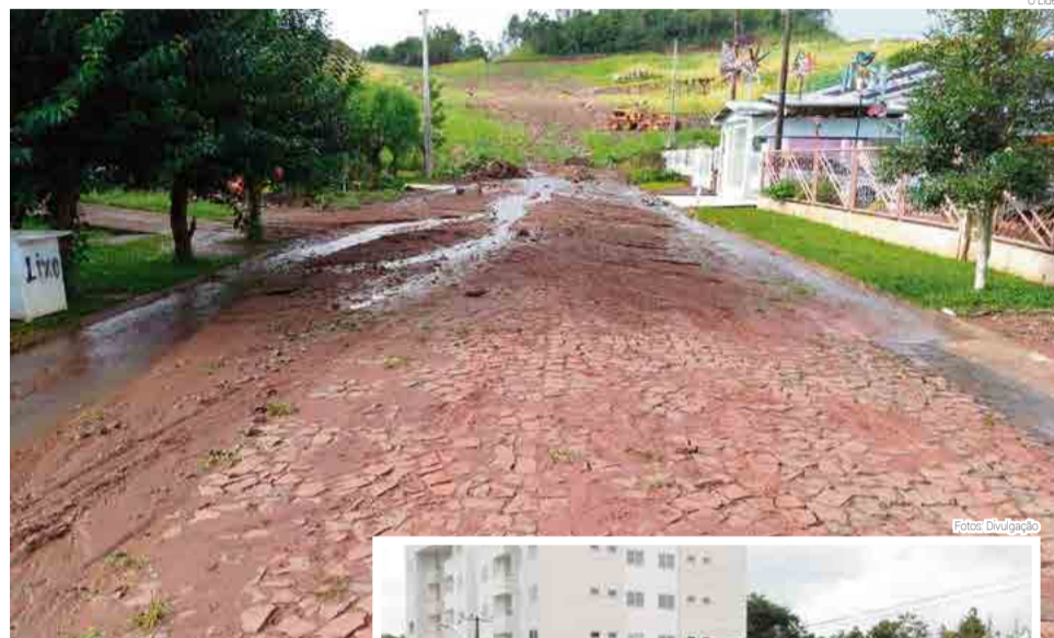
Registro feito no Bairro Pioneiro na manhã de domingo

Entre os prejuízos do poder público, os danos maiores foram no perímetro rural. Uma ponte de madeira da Linha Barra do Segredo foi levada pelas águas do Rio Iracema. A passagem segue interdita e o município busca agora, em conjunto com a administração de Cunha Porã, conseguir um kit de transposição (ponte) para instalar no local. As estradas rurais também foram danificadas. Após uma trégua nas chuvas, na segunda-feira (2) a equipe de obras e serviços urbanos começou o trabalho de recuperação nos pontos emergenciais. Conforme o secretário de Agri-