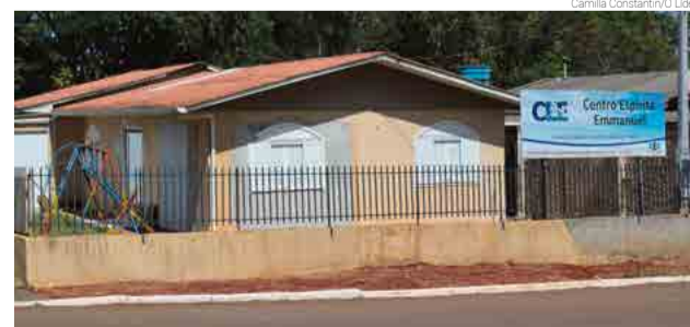
Sede está localizada na Avenida Presidente Kennedy