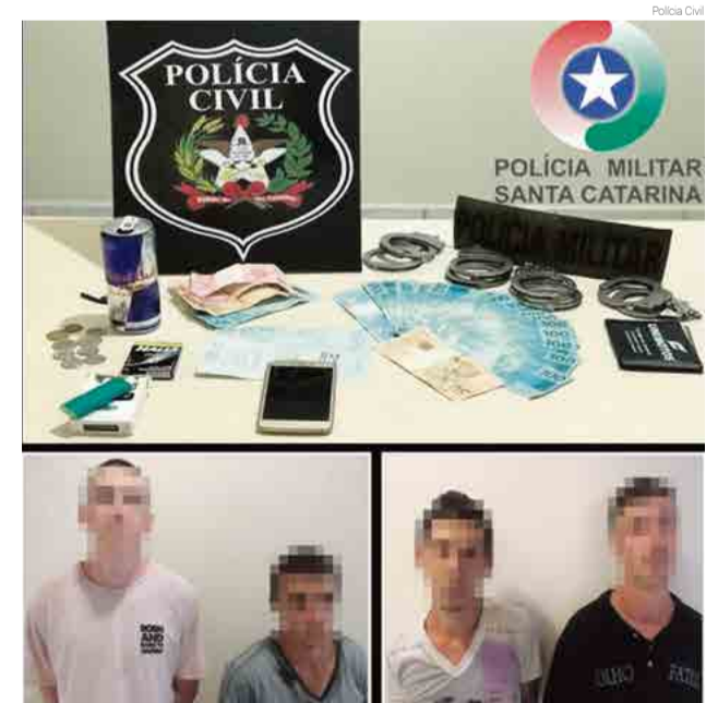
Polícia Civil divulgou imagens dos objetos apreendidos e dos suspeitos do crime

Conforme informou a polícia, com os ocupantes foram encontrados R$ 2.120 mil, além de folhas de cheques em nome da vítima. Os quatro homens foram presos em fla-