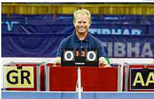
Esta foi a sexta vez em que o árbitro maravilhense foi convocado pela CBTM

Entre os jogos realizados, destaque para a semifinal da