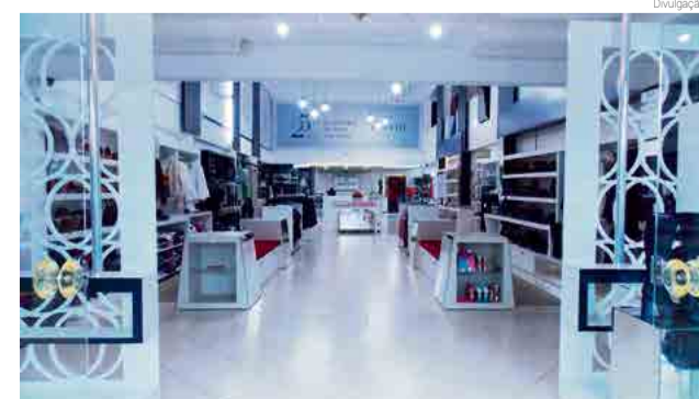
Evento inicia a partir das 13h30

do evento, que terá exposição de roupas, calçados e acessórios das marcas oferecidas na loja. "Convidamos a todos para participar de uma tarde descontraída e inspiradora. Esperamos você", declara a equipe.