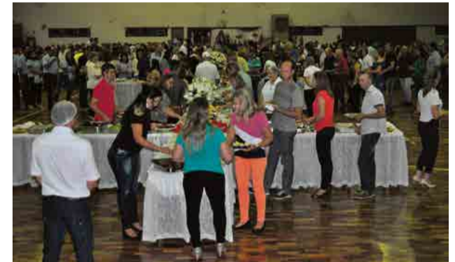
Público expressivo prestigiou o evento