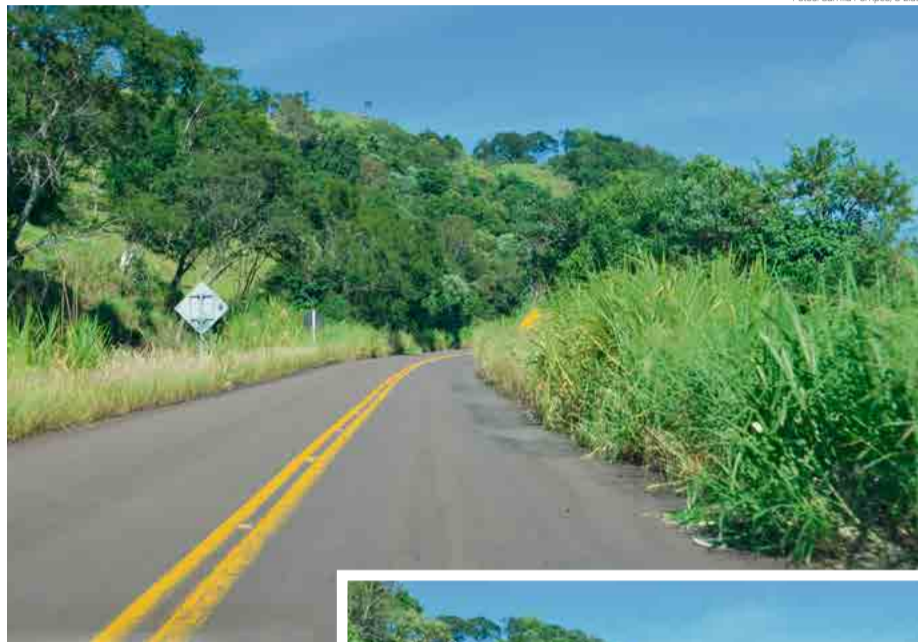
Rodovias da região estão tomadas por vegetação

Conforme a assessoria, o Deinfra deve assumir a função, mas não dispõe dos recursos necessários para atender a todas as demandas. "Há também um problema de dotação or-