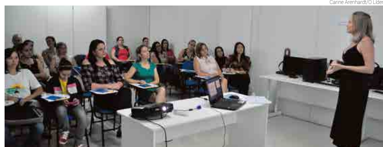
Profissionais da região participaram do evento