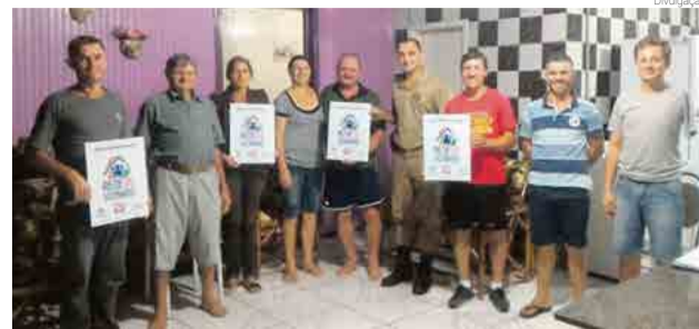
Moradores receberam placas de identificação

Com entrega de placas aos moradores participantes, foi efetivada a implantação do programa Rede de Vizinhos em Flor do Sertão. A iniciativa, que já havia sido apresentada para um grupo de moradores no último dia 15, é uma estratégia de policiamento pautada na filosofia de polícia comunitária, em que uma rede organizada entre comunidade e Polícia Militar reúne vizinhos de uma determinada localidade.