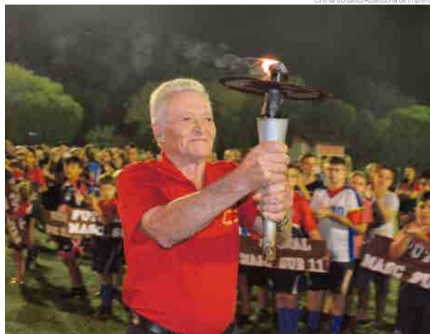
Abertura dos Jogos Abertos de Guaraciaba

Conforme o Departamento Municipal de Esportes, as disputas já iniciaram no sábado (7) e terão cerca de três meses de duração. As modalidades em disputa nesta edição dos Jogos Abertos são bolão, suíço livre e veterano, quatrilha, bocha, 48, truco, sinuca, vôlei adulto feminino e de base, futsal adulto masculino, feminino e de base, e canastra masculina e feminina.