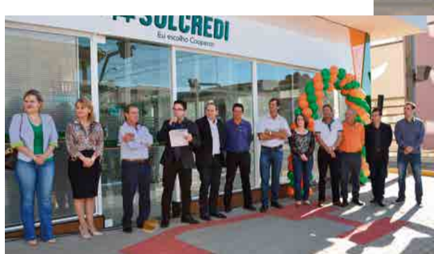
Vice-presidente falou sobre a história da cooperativa