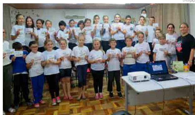
Alunos do 1º ao 5º ano participaram da atividade

Fabiane acredita que é importante garantir momentos em que todos pensem em ações concretas para garantir a inclusão. "As estratégias inclusivas devem acionar toda a comunidade escolar", diz.