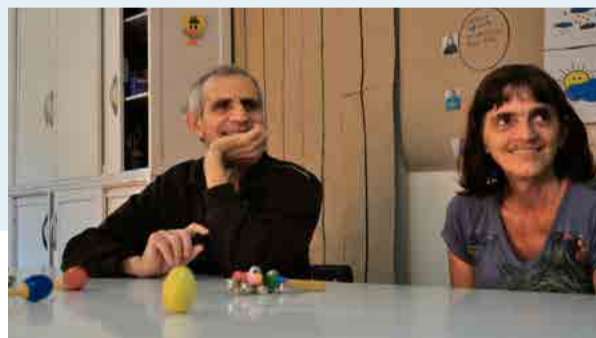
Sorrisos mostram que alunos aprovaram a nova terapia

Neste sentido, a musicoterapia, é o campo da medicina que estuda os efeitos da música no ser humano, na comunicação, e as intervenções musicais que se pode utilizar para produzir efeitos terapêuticos para promoção, prevenção, reabilitação e manutenção da saúde física, psíquica e social. As sessões devem ser coordenadas por um musicoterapeuta qualificado, com um paciente ou grupo.