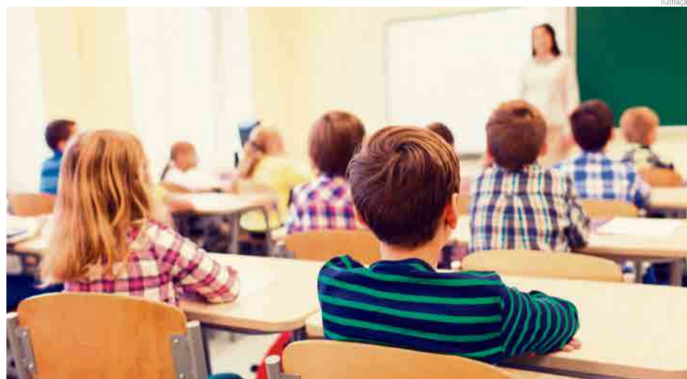
ANA analisa a alfabetização das crianças em leitura, escrita e matemática

Recentemente foram divulgados os resultados das provas aplicadas em 2016 e as notas mostram que Santa Catarina está entre os primeiros colocados nas três avaliações. Na escrita, Santa Catarina ficou com a segunda colocação em nível na-