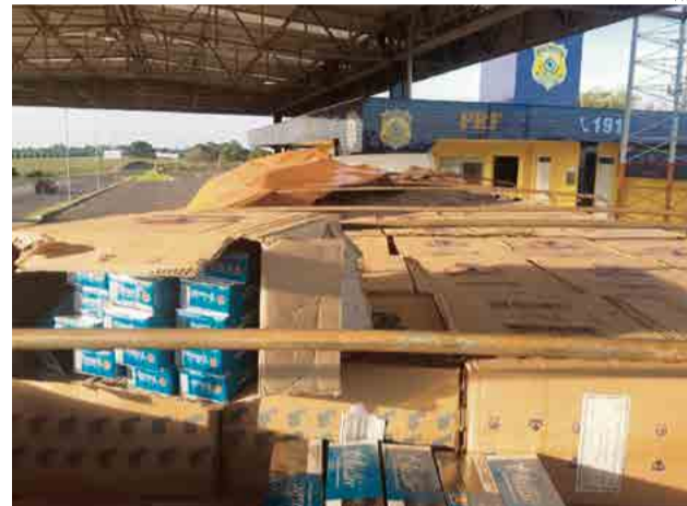
Veículo também transitava com placas falsas

os agentes constataram que ela estava lotada de cigarros para-