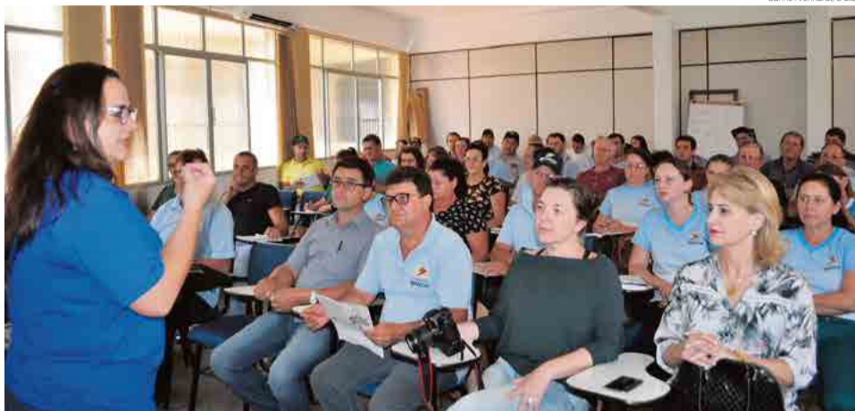
Reunião foi realizada nesta semana na prefeitura