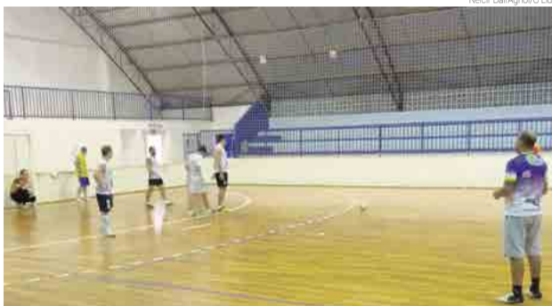
Equipe principal treina semanalmente para manter a ponta da tabela

No sábado (21), em Maravilha, às 19h, no Ginásio Municipal de Esportes Gelson Tadeu de Lara Mello, pela Liga Catarinense, tem a equipe sub-16 de Maravilha contra São Lourenço, e mais tarde, às 20h40, joga o time principal contra Saudades.