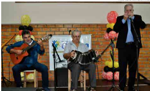
Evento reuniu tocadores de gaita, violão e bandôñion

guindo com apresentações, quando foi destacado que Maravilha é o único município catarinense que promove o encontro destes artistas, abrindo espaço tanto para profissionais, como para aqueles que apenas têm a prática como uma atividade de lazer. Cada artista recebeu um troféu de participação. O encontro encerrou com jantar servido aos presentes.