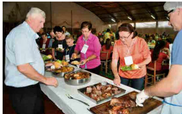
Almoço foi servido no Pavilhão Evangélico