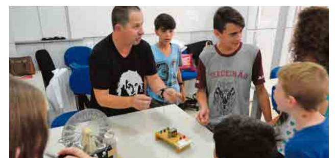
Oficinas educativas foram realizadas

tituto Ayrton Senna, em parceria com a Organização para a Cooperação e Desenvolvimento Econômico (OCDE). Conforme o estudo, os alunos que recebem apoio e atenção dos pais na vida escolar estão, em média, quatro meses à frente no aprendizado em comparação com os que não recebem essa atenção.