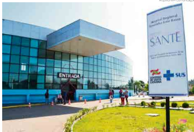
Instituto Santé aguarda aditivo ao contrato para administrar setor oncológico

Conforme o deputado, a reunião resultou em uma confirmação de que o setor deve entrar em funcionamento no mês de maio. "Expliquei ao secretário que diariamente famílias e pacientes me procuram e não podemos mais esperar. O Estado está ciente que terá que bancar estes atendimentos