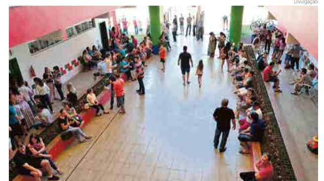
Escola João XXIII recebeu mais de mil pessoas durante encontro

Em outras instituições de ensino não foi diferente, diversas atividades foram programadas pelas escolas da ADR Maravilha, como apresentações artísticas, ginástica cultural, esportiva e recreativa,