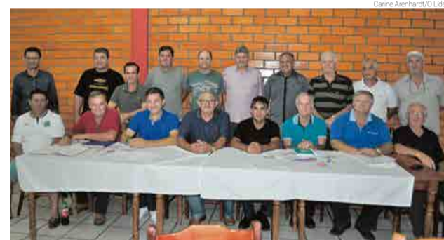
Associados se reuniram para eleger a nova diretoria