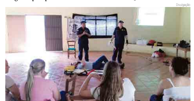
Qualificação teve o apoio da 3ª Companhia do Corpo de Bombeiros Militar