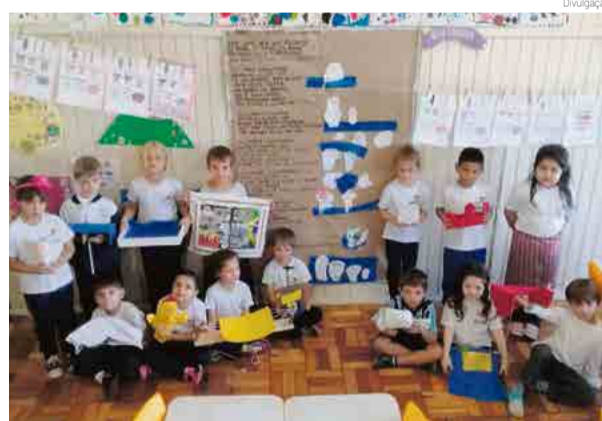
Alunos apresentaram trabalhos para os colegas