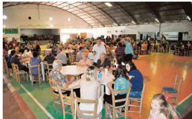
Cerca de 300 pessoas participaram do evento