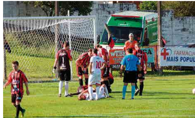
Semifinal foi em São João do Oeste, entre Aliança e Guarani