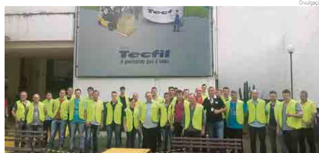
Visita na fábrica de filtros

A empresa afirma que sempre está preocupada com o desenvolvimento profissional de seus colaboradores e parceiros, investindo constantemente em treinamentos técnicos voltados às áreas de mecânica, chapeação e atendimento através do programa Desenvolver para Crescer.