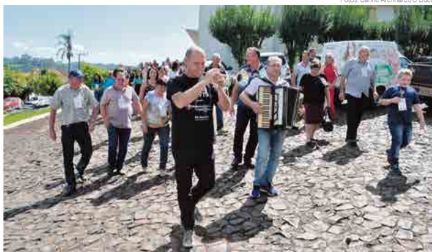
Dia foi de muita animação para os participantes

Logo em seguida, os participantes foram cantando e tocando instrumentos até o Pa-