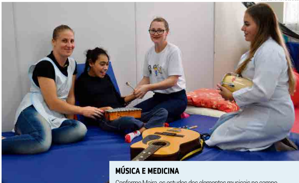
Sessões estimulam o desenvolvimento dos alunos

sentam dificuldade motora, o movimento através dos ritmos poderá trazer benefícios para a parte física do corpo, já para crianças que tenham dificuldade de comunicação ou interação, a música poderá auxiliar no desenvolvimento destas expressões, seja através do corpo ou instrumentos. Desta mesma forma, a musicoterapia pode trabalhar com alunos que tenham dificuldades cognitivas, fazendo com que se sintam mais úteis e participativos.