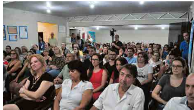
Palestra marcou a inauguração do Centro Espírita