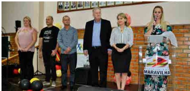
Lideranças presentes no evento