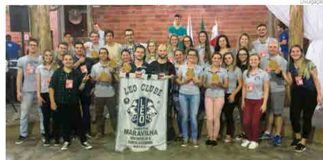
Clube maravilhense no momento da premiação

Na segunda-feira (9) parte do clube participou da 3ª reunião de parceiros da sala de situação, com o objetivo de criar estratégias de combate e con-