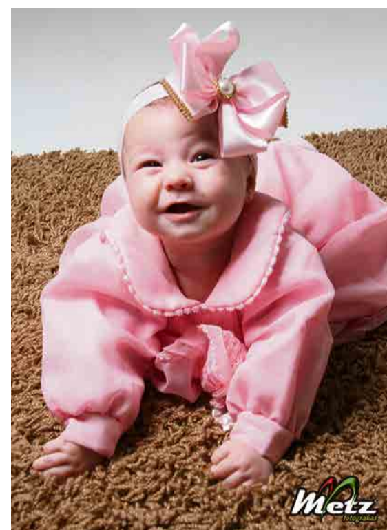
Mirela é uma fofura