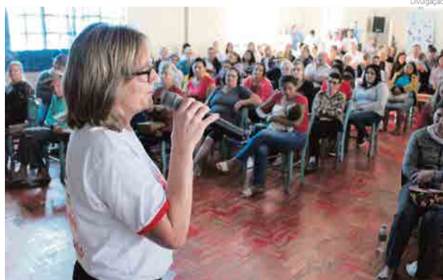
Flor-sertanenses contaram com diversas atividades

Já em Bom Jesus do Oeste o evento realizado no Clube de Idosos teve como temática principal o "Programa municipal de controle e erradicação da tuberculose e brucelose". A programação especial foi uma iniciativa da administração, juntamente com as secretarias de Saúde e Agricultura, Epagri, Cidasc e Icasa.