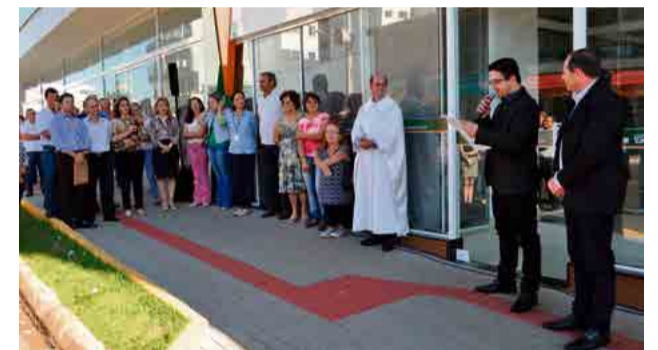
Evento contou com a presença de lideranças e comunidade

Em Maravilha, a Sulcredi está localizada no edifício Illuminato. “Convido a todos para conhecer as instalações e acompanhar nosso trabalho”, destaca.