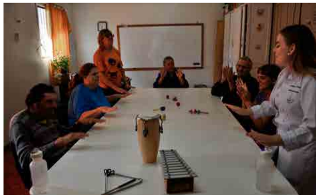
Musicoterapia é trabalhada em grupos na escola especial

sentam dificuldade motora, o movimento através dos ritmos poderá trazer benefícios para a parte física do corpo, já para crianças que tenham dificuldade de comunicação ou interação, a música poderá auxiliar no desenvolvimento destas expressões, seja através do corpo ou instrumentos. Desta mesma forma, a musicoterapia pode trabalhar com alunos que tenham dificuldades cognitivas, fazendo com que se sintam mais úteis e participativos.