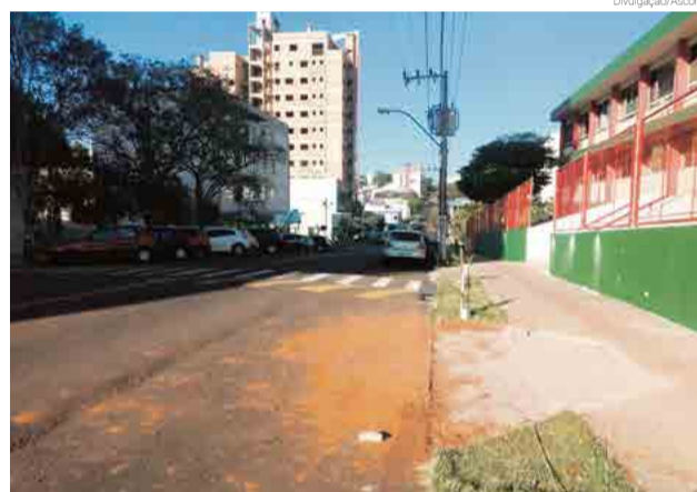
Cerca de 180 vagas para pessoas com necessidades especiais e idosos serão implantadas

É de acordo com o decreto que a administração está se baseando para fazer as adequações, tendo em vista que em