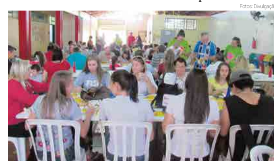
Evento contou com momentos de lazer e interação