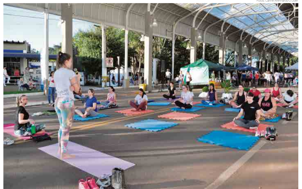
Atividades em grupo foram realizadas no Espaço Criança Sorriso

No sábado (7) o Espaço Criança Sorriso e o Centro de Saúde 1 sediaram diversas atividades lembrando o Dia Mundial da Saúde, programação que também teve como objetivo fazer uma breve demonstração para a comunidade local das novas