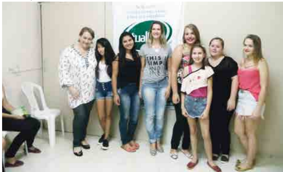
Formatura do Curso de Manicure/Pedicure e Maquiagem realizado pela Atualizar na quarta-feira (13). Parabéns, vocês serão destaque no mercado de trabalho.