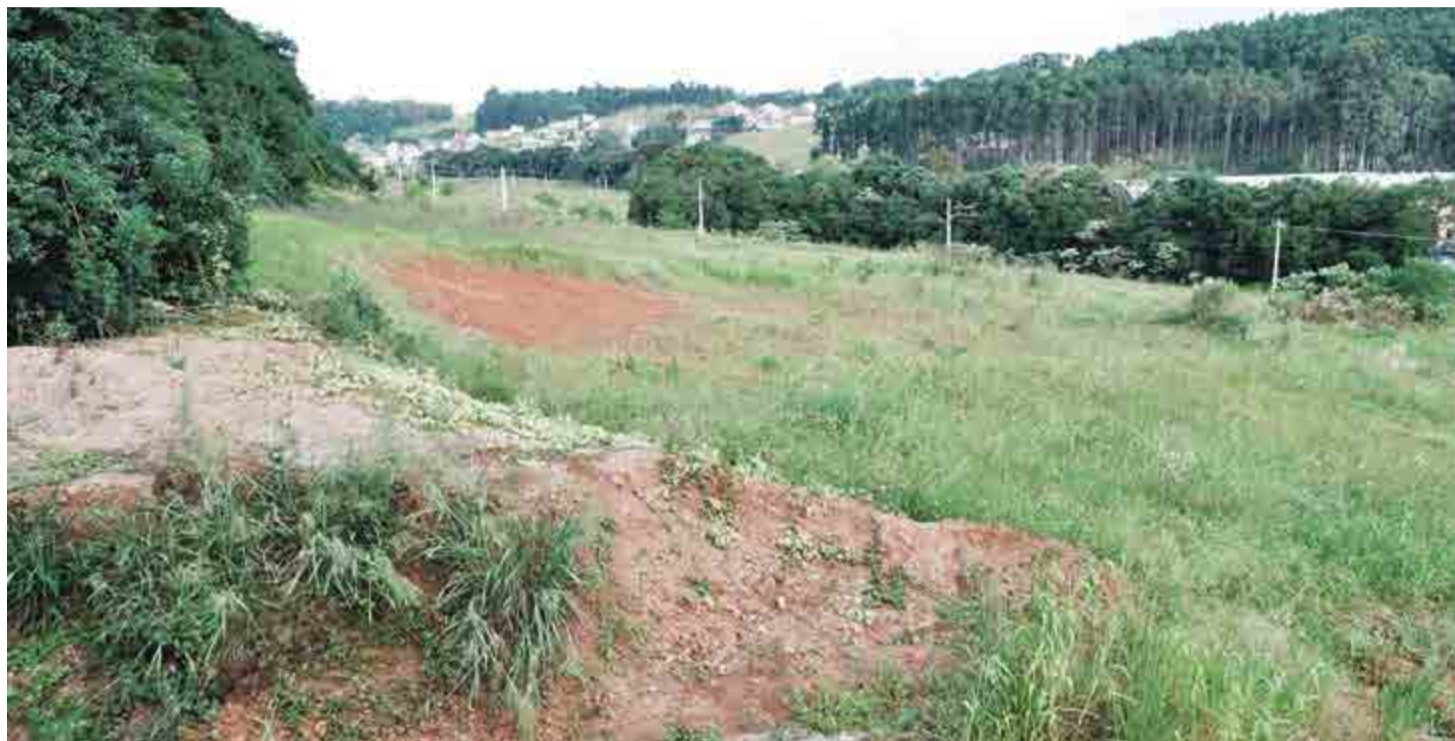
Local onde serão edificadas as casas do loteamento

O Loteamento 'Nosso Sonho', do programa habitacional Minha Casa, Nosso Sonho foi, por várias vezes, tema de reportagem do Grupo WH Comunicações. O programa gerou muita expectativa aos maravilhenses na concretização do sonho da casa própria. Lançado em 2011, tinha como proposta ser desenvolvido em três etapas. Na primeira etapa, são 106 famílias contempladas de acordo com sorteio já realizado. Além disso, mais 106 famílias estão no cadastro reserva. Caso alguma família não se encaixar no programa, serão chamadas as que estão neste cadastro reserva. Vale