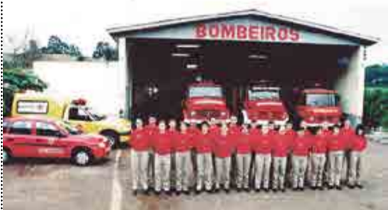
Bombeiros tinham estrutura reduzida no início