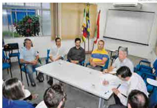
Primeira reunião discutiu ideias e teve boa aceitação