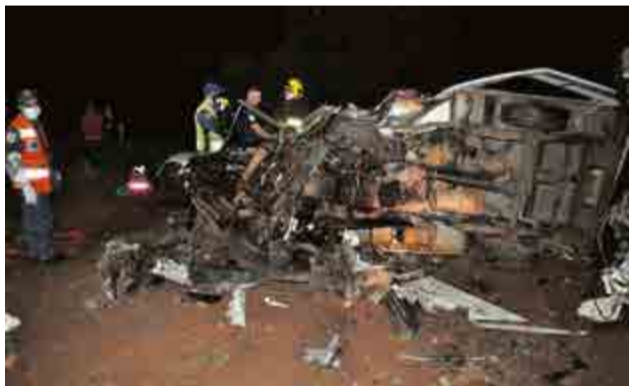
Segundo acidente foi no dia seguinte e mais dois morreram