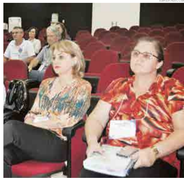
Debate aconteceu na Câmara de Vereadores