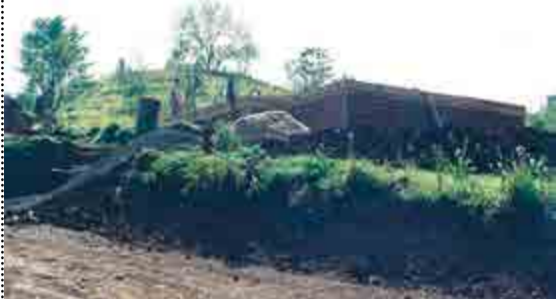
Comunidade auxiliou na construção do quartel