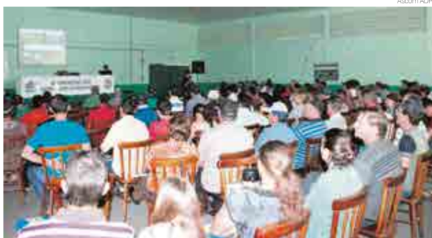
Seminário foi realizado na terça-feira (12) em Bom Jesus do Oeste

O evento, promovido pela Empresa de Pesquisa Agropecuária e Extensão Rural de Santa Catarina (Epagri) com apoio de Bom Jesus do Oeste, Saltinho, Serra Alta, Modelo e Sul Brasil teve como intuito apresentar novas técnicas na produção leiteira e ainda expor experiências de famílias beneficiadas pelo pro-