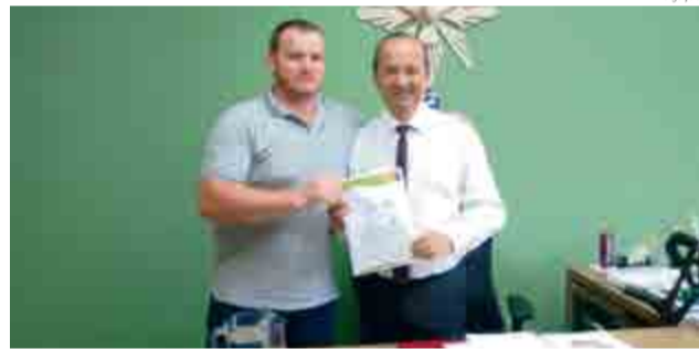
Schmitt entregou solicitação para o deputado federal Jorginho Mello

Na avaliação de Schmitt “a reunião foi extremamente proveitosa, uma grande troca de ideias e experiências, as quais agregarão em muito para o crescimento não somente da sigla partidária, mas a sociedade maravilhense como um todo”.