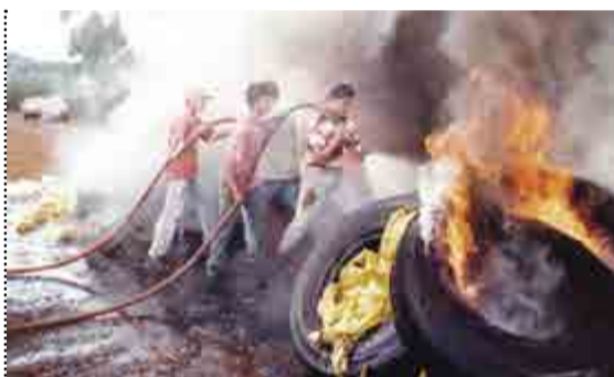
Primeiros integrantes fazem treinamento contra incêndio