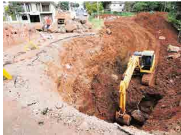
O início da obra contou com a retirada de todo o material do local para conhecer o que causou a erosão e abertura de uma enorme cratera na via

Um problema já crônico em uma das ruas do centro de São Miguel do Oeste, esta semana recebeu uma nova esperança de que agora o problema deve ser solucionado. A enorme cratera que interrompeu o trânsito no local e ainda trouxe prejuízo aos moradores da localidade, está passando por obras de melhorias desde 2014 quando ocorreu o primeiro desmoronamento. Este ano após um novo desmoronamento, uma equipe da Secretaria de Obras da prefeitura de São Miguel do Oeste iniciou os serviços para recuperação da Travessa Javari, uma importante via de ligação do centro da cidade. A passagem de veículos e pedestres durante a obra deve