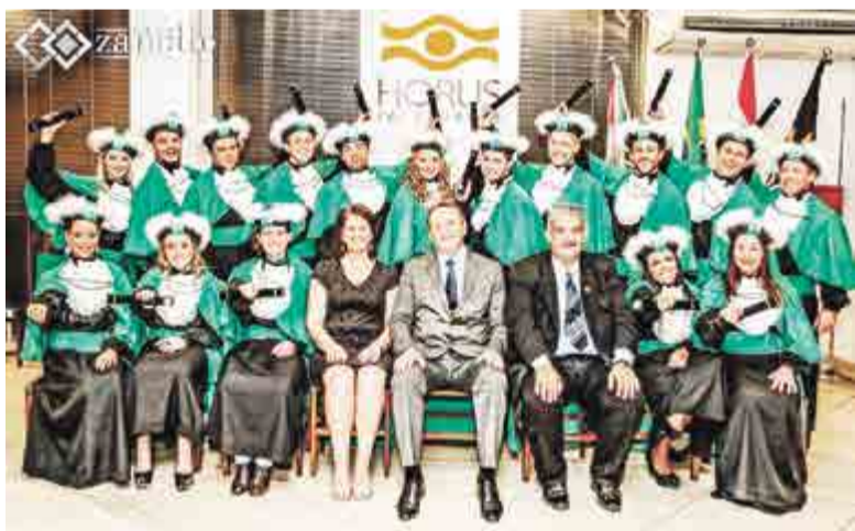
Parabéns a todos os formandos da turma de educação física da Horus de Pinhalzinho. Sucesso a todos nessa nova etapa.