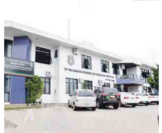
Atualmente, em São Miguel do Oeste estão instaladas a 13ª DRP/Fron, a DPCo/Fron, a DIC/Fron e a DPCAMI/Fron, as quais possuem a expressão "Fron" ao final por se tratar de região fronteiriça do Brasil PÁGINA 19