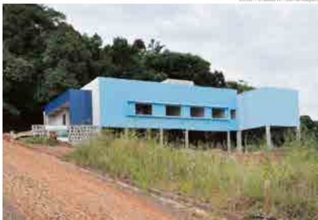
Obra tem prazo de término para fim de abril

Atualmente, o Cras possui um espaço alugado no Centro e, com a sede própria que está sendo construída na Rua Portugal, Loteamento Nosso Sonho, os custos diminuirão. "Serão R$ 4 mil a menos em aluguel, que poderão ser aplicados em políticas públicas", explica a secretária.