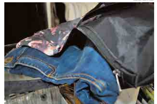
Mulher pede mercadorias em condicional e se recusa a pagar

Ele explicou que uma mulher solicita vários produtos em condicional, principalmente roupas. Na ação seguinte, a golpista repassa nomes falsos e não aceita assinar o documento de recebimento ou pagar pelos itens. Ela é procurada pela