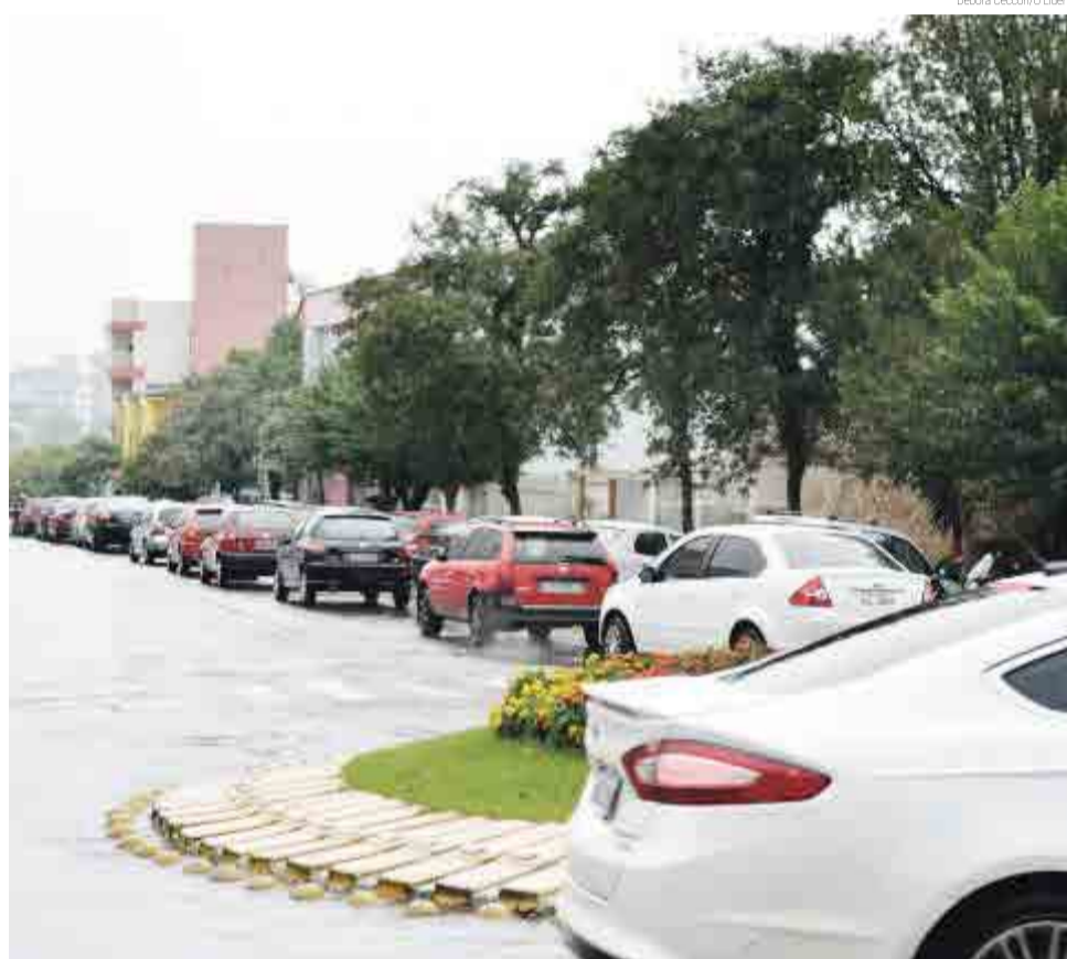
Sinalização e vias de mão única vão anteceder rotativo em São Miguel do Oeste