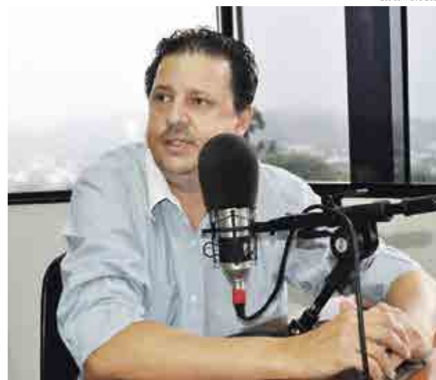
Folle destacou a importância das denúncias para regularizar atividades dos vendedores ambulantes

"O município tem um sistema de plantão, e esta pessoa quem está legalizado, e poderá informar se o vendedor está em dia ou então fazer a abordagem", comenta Folle. O telefone do plantão é 8832 3530.