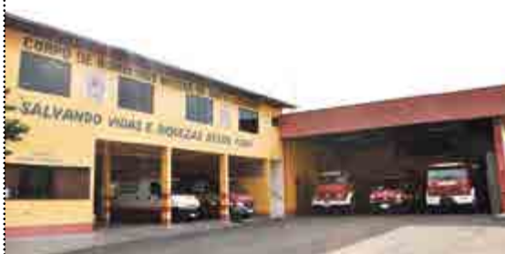
Bombeiros usam mesma sede há 20 anos