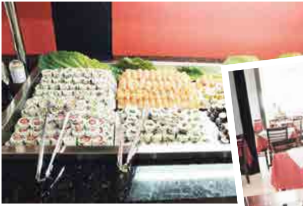
Ninja Suschi começou nesta semana o atendimento em Maravilha. Fica na 7 de Setembro, em frente ao CRM