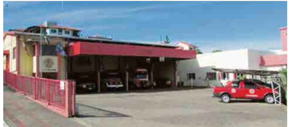
Em 16 de março de 2007 que iniciou efetivamente o serviço de bombeiro para a população de Guaraciaba e Barra Bonita