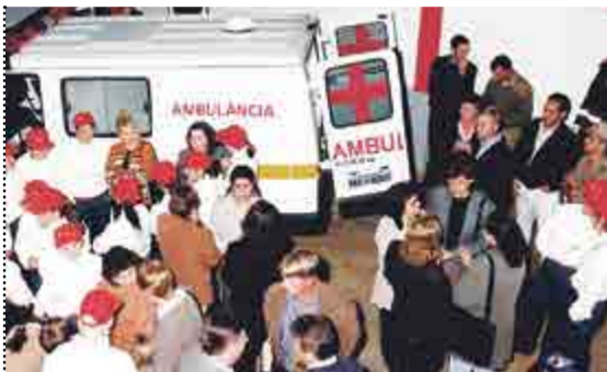
Evento de Inauguração em 1996