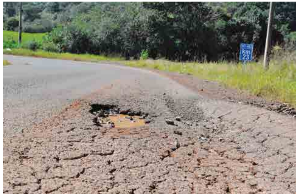
Vários buracos entre os municípios de Maravilha e Tigrinhos