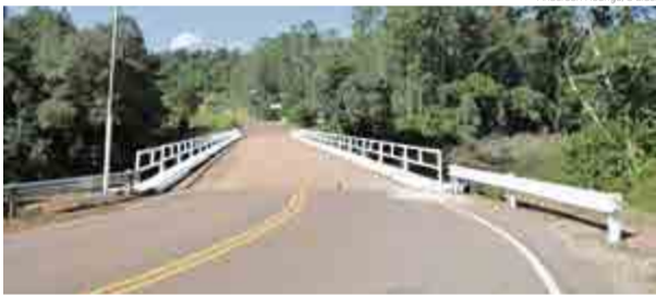
Grades de proteção, pinturas de sinalização e iluminação foram recuperadas na última semana

Com a promulgação, Brasil e Argentina tem amparo legal para a execução da obra da nova ponte internacional e das demais situações aduaneiras. A ponte prevista terá extensão de 210 metros. Porém, ainda não há um prazo definido para início a obra.