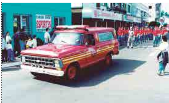
Bombeiros presente em desfile de 7 de Setembro