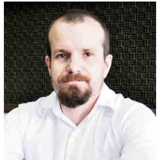
Delegado afirmou que Maravilha tem grande apoio de policiais de outros municípios da região