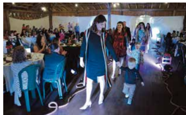
Ao fim do evento, todos entraram na passarela para fazer a última apresentação