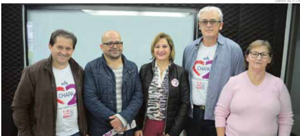
Integrantes da Chapa 2 estiveram no estúdio da Rádio Líder e Jornal O Líder

em Educação realiza a eleição estadual e, também, em todas as regionais de Santa Catarina. Em Maravilha são duas chapas concorrendo ao cargo de coordenador do Sinte. A eleição será nos dias 11 e 12 de junho.