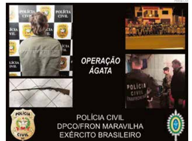
Homem foi preso no interior de Iraceminha durante a operação Ágata

Ele foi preso em flagrante pelo crime de posse irregular de arma de fogo, com pena de detenção de um a três anos e multa, sendo encaminhado à Unidade Prisional Avançada de Maravilha.