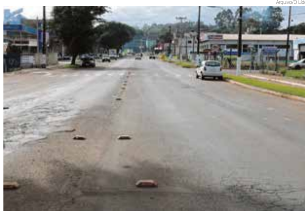
Obra vai começar nas proximidades do trevo

A equipe aguarda uma melhora no tempo chuvoso para começar os trabalhos na pista. A obra terá início no trecho entre o trevo de acesso à cidade e o Mercado