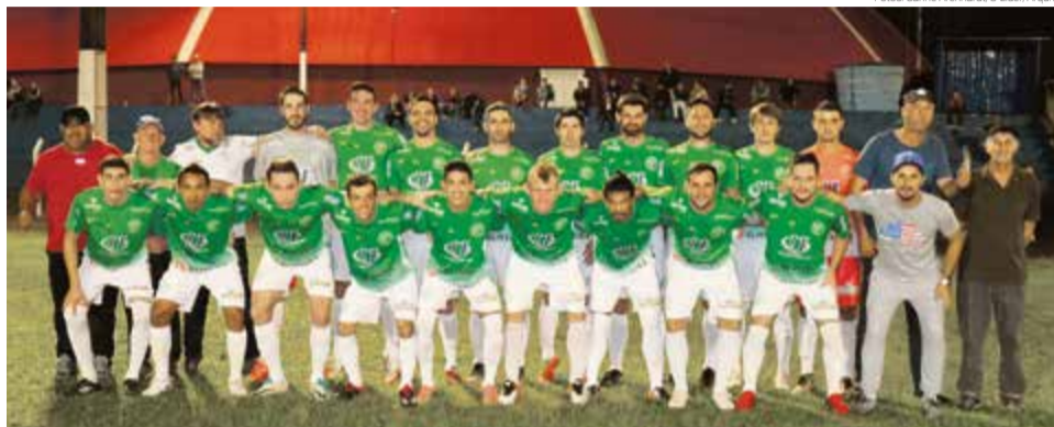
Guarani recebeu na quarta-feira o Metropol e empatou em casa

Agora as duas equipes voltam em campo am-