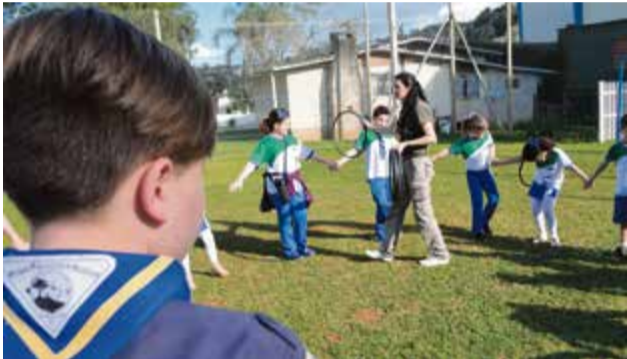
Alunos e integrantes do grupo tiveram interações e troca de experiências