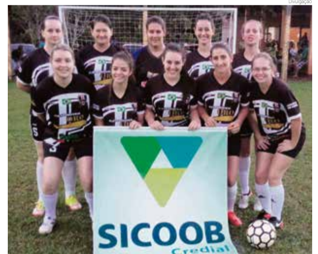
Meninas do Posto ganharam de 2 x 1 da equipe do América

A próxima rodada é hoje (25), no campo do Penharol, com jogos a partir das 13h. O primeiro jogo é entre Associação Amigos do Sarandi x Avenida, Facc x Cruzeiro A/Sertão Alimentos, Cruzeiro B/Sertão Alimentos x Independente, Posto x Sertão FC e o Internacional x Auriverde. Os jogos são na ordem descrita acima. Não haverá jogos pelo naipe feminino hoje.