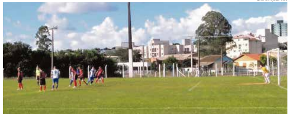
Não faltaram gols bonitos na rodada de sábado (18)

Teve também jogo entre o Canarinho da Linha Primavera Alta e o Canarinho da Linha Água Parada. No aspirante placar de 2 x 1 para o Canarinho da Linha Água Parada e na principal