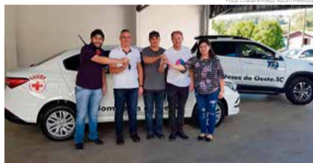
Entrega das chaves foi feita no pátio da Secretaria de Saúde

Questionado sobre o porquê de adquirir uma caminhonete para a Saúde, o prefeito disse que a emenda parlamentar veio direcionada para esse fim. "Inclusive nós também fomos cobrados pela população. Essa emenda parlamentar veio moldada para comprar um veículo com modelo caminhonete a diesel 4x4. Então é um recurso específico para comprar esse tipo de automóvel", justifica.