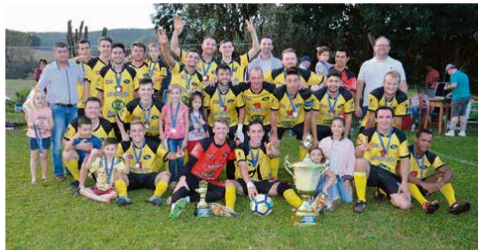
E.C. Cruzeiro Central é o melhor entre os veteranos