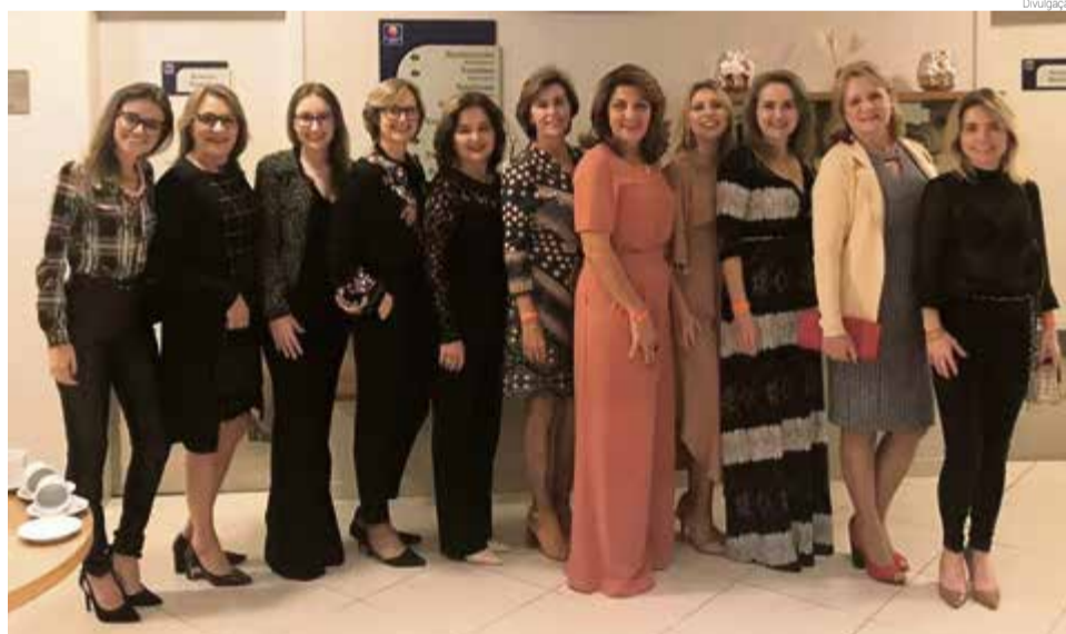
Lideranças do setor empresarial de Maravilha presentes no evento em Joinville

A participação, avaliada como missão empresarial, constava no planejamento do Núcleo, com o objetivo de capacitar e desenvolver as empresárias