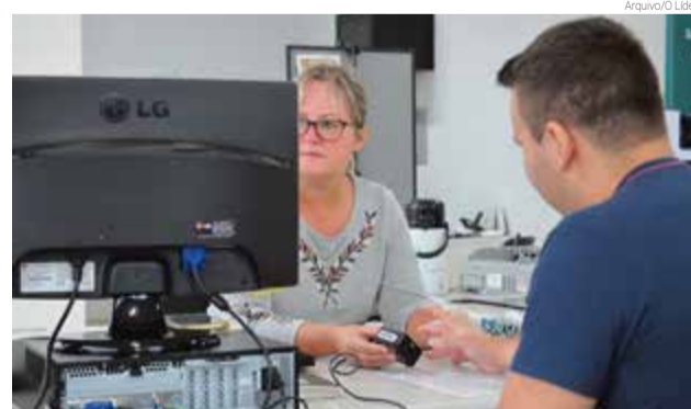
Cidadãos podem procurar o cartório hoje, das 9h às 15h. Durante a semana atendimento é das 12h às 19h