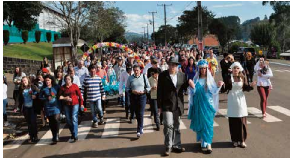
Mais de mil pessoas participaram do evento em 2018