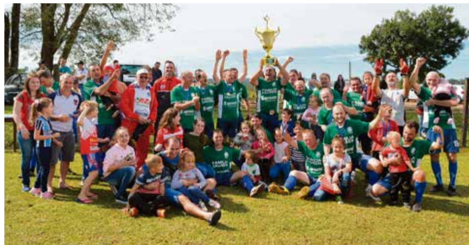
Fathi & Amigos F.C. levantou o troféu principal da categoria livre