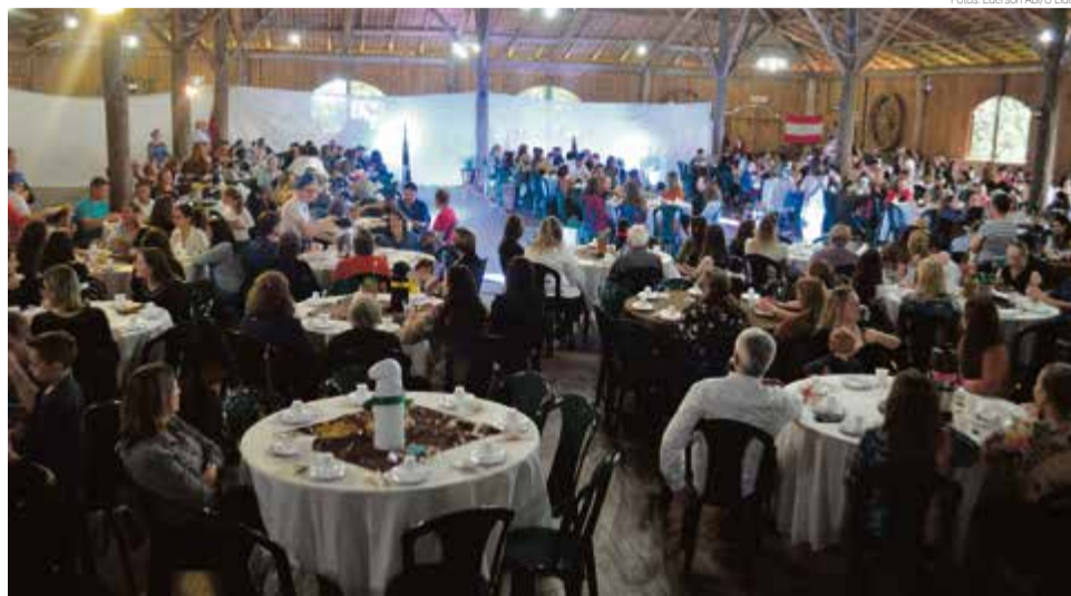
Mais de 450 pessoas participaram do Chá da Inclusão neste ano em Maravilha

Logo no início, houve a apresentação de um vídeo institucional da Apae Marisol, produzido pela jornalista Carine Arenhardt, mostrando os trabalhos que são realizados na escola. O objetivo foi promover