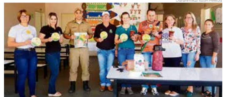
Mateada contou com entrega de brindes aos participantes

A iniciativa, feita com apoio da Secretaria de Educação e Polícia Militar, contou com mateada em parceria com a erva-mate Sabadin e entrega de brinde às famílias.