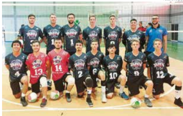
O time masculino conseguiu triunfar apenas contra Cunha Porã