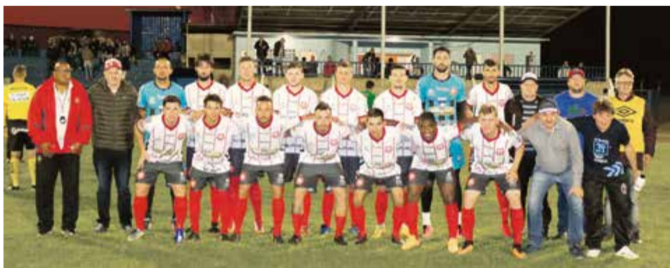
CRM foi até Águas Frias, saiu na frente, mas cedeu ao empate

nhã, às 15h, o Guarani joga em São Carlos contra o Metropol e o CRM no mesmo horário pega novamente o Ipiranga, na abertura do retorno.