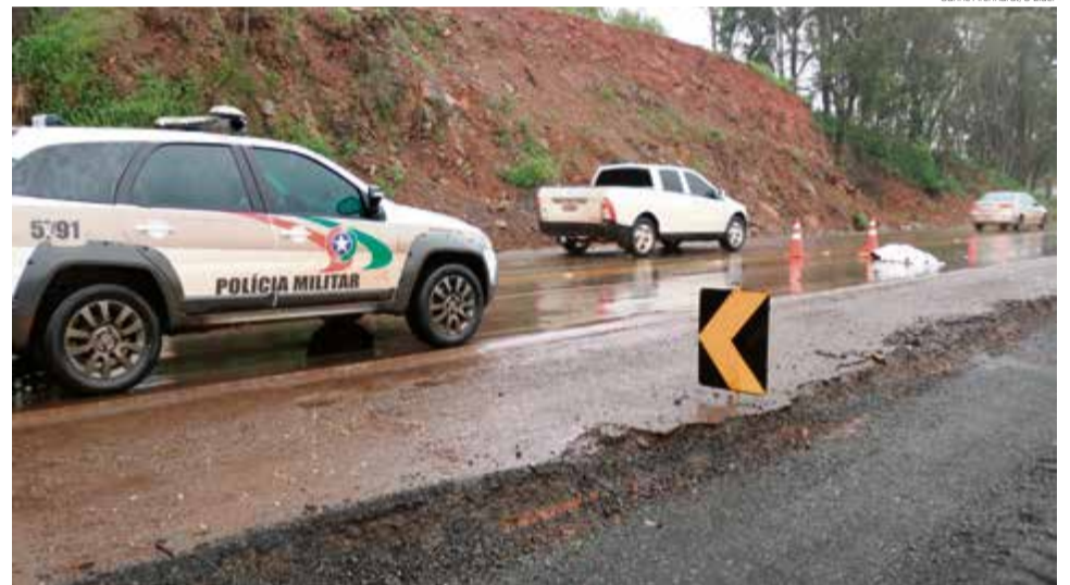
Polícia Militar auxiliou no trânsito, que ficou bloqueado no local do acidente

o tipo de veículo que provocou o atropelamento, já que o mo-