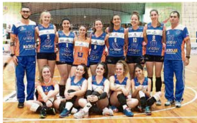
Time feminino não conseguiu vitória nesta etapa

cipam da primeira competição do ano e estamos com duas equipes muito jovens, com poucas pessoas da categoria adulto, competindo com grandes equipes de nossa região e do Estado do Paraná. Queremos agradecer a administração municipal e Secretaria Municipal de Esportes, Juventude e Lazer e nossos patrocinadores. Vamos nos dedicar mais nos treinamentos para conseguir nossos objetivos nas próximas etapas", finalizam os técnicos.