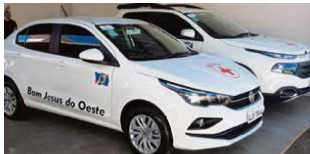
Veículos foram adquiridos por meio de emendas e contrapartida do município

NOSSA SENHORA DO CARAVAGGIO Evento é tradicional no município e reúne centenas de fiéis de toda a região