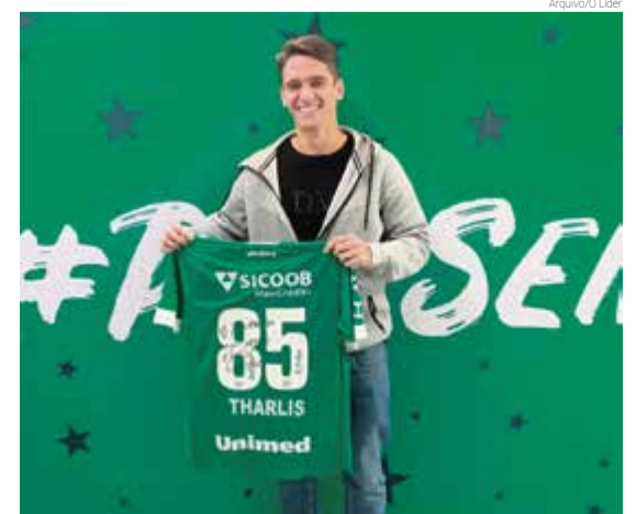
Volante revelado na base do Internacional está no Verdão e assinou extensão do vínculo

Com Ney Franco, Sartori fez apenas uma partida. O volante trabalha para ser opção no domingo, diante do Cruzeiro, pela sexta rodada do Brasileiro.