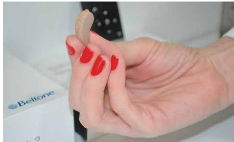
Profissional mostra o quanto os aparelhos auditivos são pequenos e discretos

• Remoto Care: Permite que os aparelhos auditivos sejam ajustados onde quer que você esteja, seja em casa ou qualquer lugar do mundo. É só enviar um pedido e o profissional irá ajustar à distância.