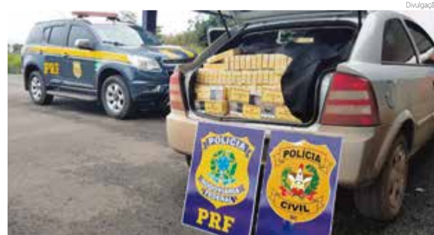
Veículo foi apreendido pelas forças de segurança e encaminhado para a Receita Federal

rante foi abordado um homem, que inicialmente negou ser o condutor do veículo. Po-