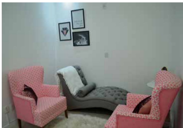
Em Maravilha, profissional atua na Policlínica Central, sala 306