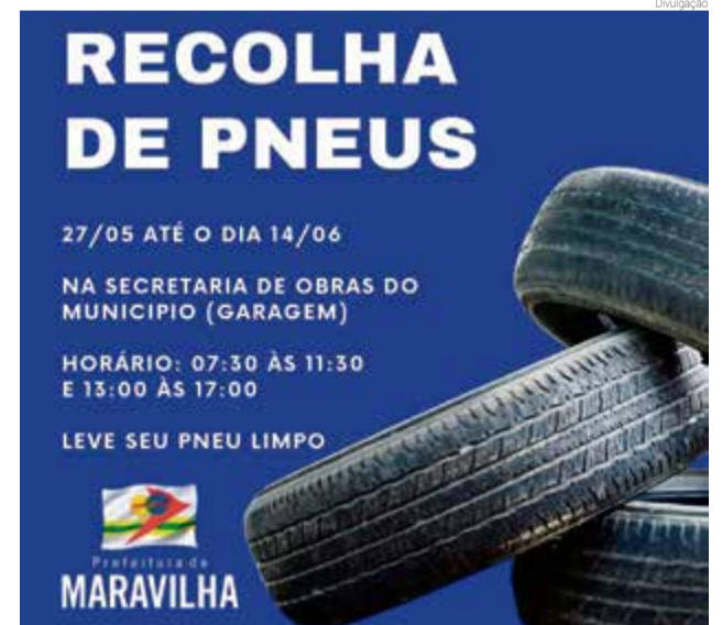
Ação começa na segunda-feira (27) e encerra em 14 de junho

o dia 14 de junho. Um funcionário da Sala permanecerá neste período na garagem da prefeitura, na Avenida Maravilha, onde será realizada a recolha das 7h30 às 11h30 e 13h às 17h. Quem deseja participar deve lavar os pneus antes da entrega. "Pedimos que realmente quem tenha aquele pneu em seu terreno que leve. Ele acumula água e causa mais focos, consequentemente mais mosquitos. A entrega é gratuita e estamos à disposição", disse a equipe da Sala.