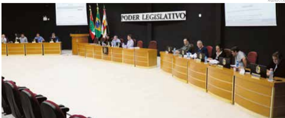
Esta foi a terceira sessão ordinária do mês

da, em segundo turno, é o projeto de lei legislativo nº 02/2019 que amplia em uma vaga o cargo de assessor legislativo PNE (portador de necessidades especiais). O servidor fará parte do quadro permanente do Legislativo de Maravilha, contratado através de concurso público da Câmara de Vereadores.