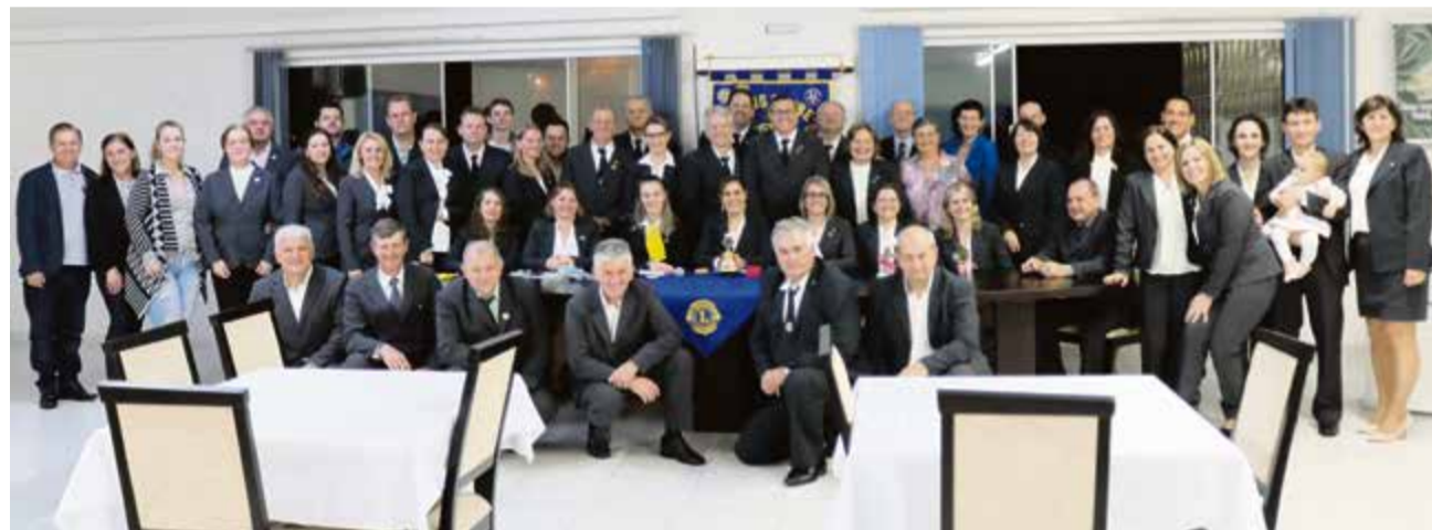
Solenidade contou com a presença de associados