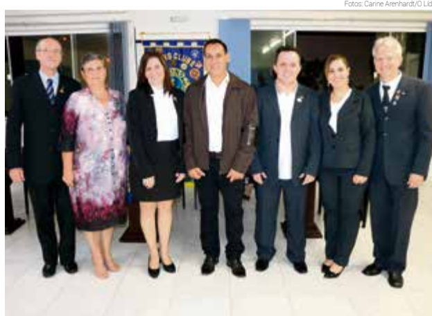
Novos companheiros com o casal presidente do Lions Clube Maravilha Oeste

A solenidade também contou com homenagens para os aniversariantes do mês de maio e ao Dia das Mães. Para encerrar a programação teve jantar de confraternização.