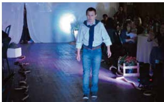
Lojas apresentaram a coleção outono/inverno com as tendências das estações