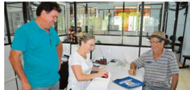
Secretário de Agricultura afirma que produtores devem ficar atentos aos critérios para participar

de fontes, silagem ou plantio, terraplanagem e internet rural. “Queremos destacar que no programa mais recente que implantamos, o internet rural, estão tendo muitas adesões e pagaremos em incentivos mais de R$ 7 mil somente referente às ligações do mês de maio”, avalia. De janeiro a maio foram 26 adesões de agricultores ao programa que leva internet por fibra óptica até a propriedade rural com incentivo de até R$ 500 pagos pelo município.