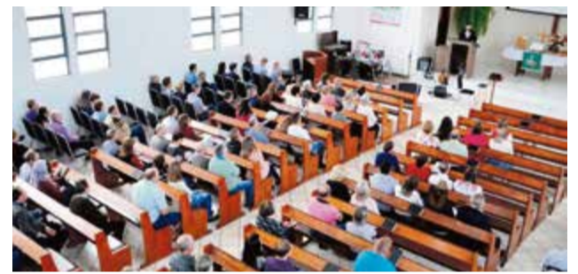
Durante a manhã, fieis participaram da celebração na igreja

luntárias que se doa pela sua igreja. Que o bondoso Deus abençoe sempre nossa igreja e nos dê mais muitos e muitos anos para celebrarmos juntos", afirma o pastor.