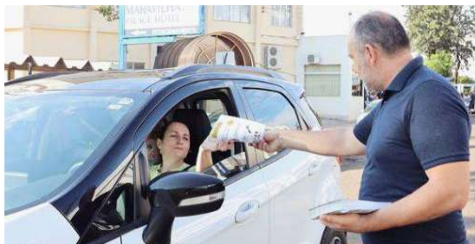
A campanha teve como título "Paz no trânsito começa por você!"

Ômega Maravilha, Lions Clube Maravilha Oeste, Lions Clube Maravilha, Rotary Clube Centro, Rotary Clube Cidade das Crianças e Polícia Militar.