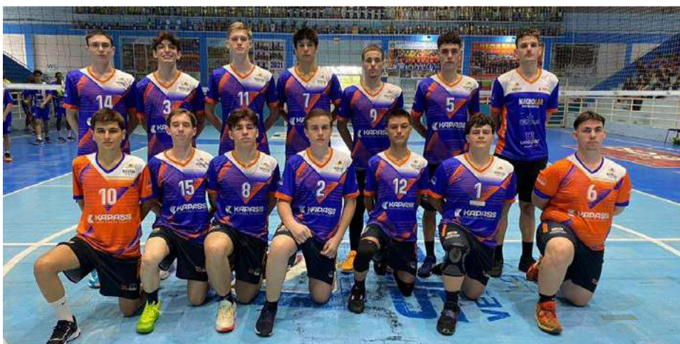
A equipe masculina garantiu vaga na final da Liga