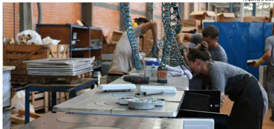
Indústria somou 156 novas vagas