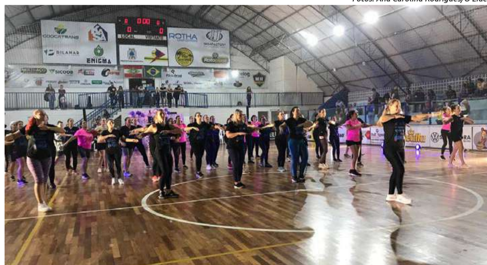
Além das crianças, os adultos que fazem parte das oficinas também se apresentaram