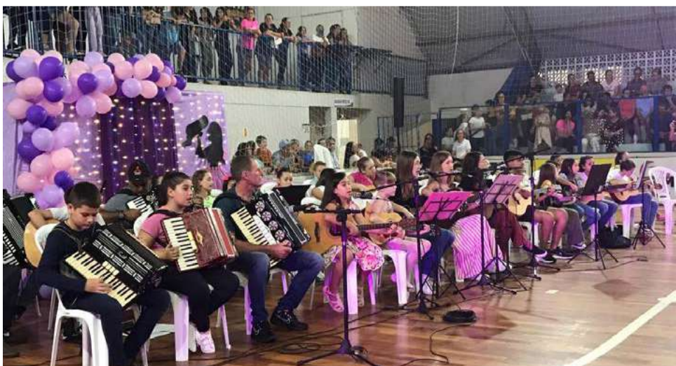
A homenagem contou com mais de 15 apresentações