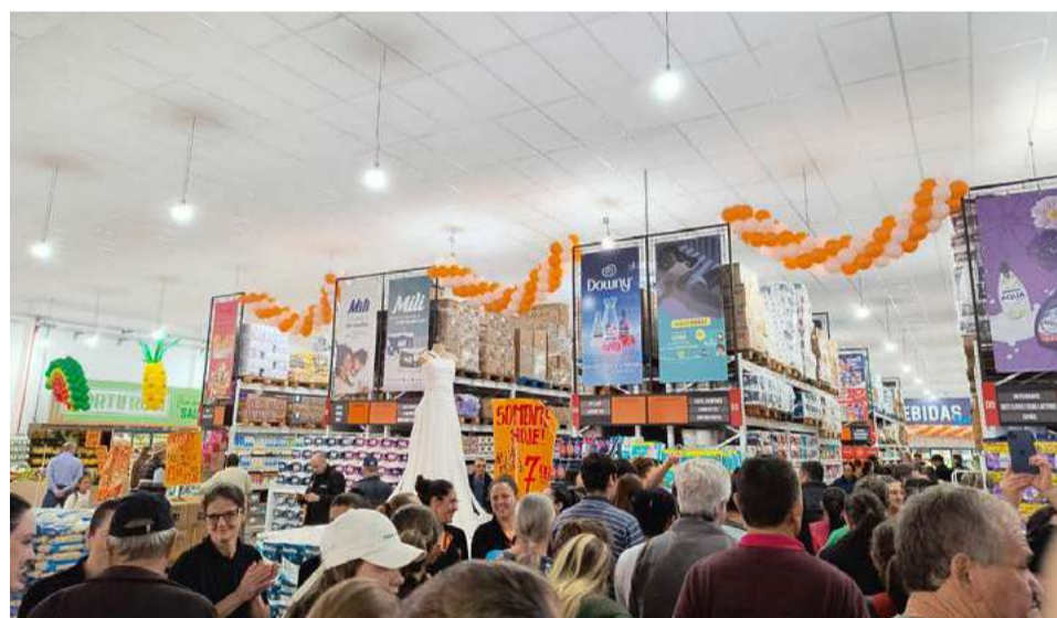
Espaço ampliado, com 2 mil m 2