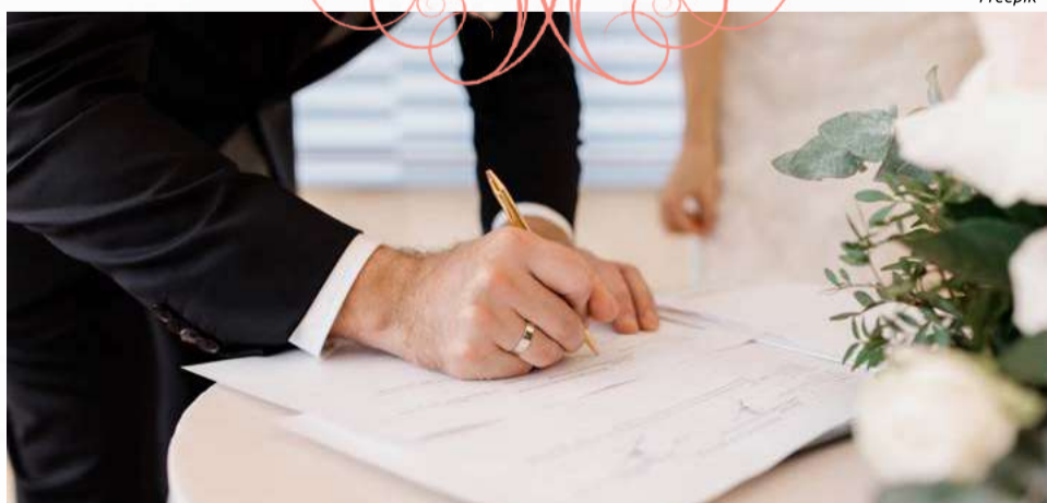
Neste ano, 27 uniões já foram oficializadas no município