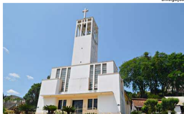
A igreja completa 71 anos no município

Romeu Januário, o Milionário, apresenta: