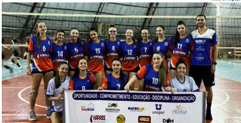
Equipe feminina conquista bons resultados