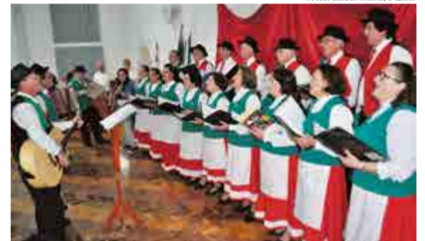
Coral da Acima iniciou as apresentações