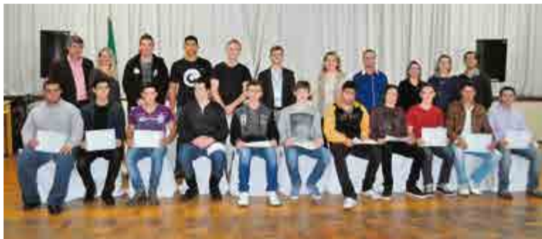
Vinte jovens receberam certificação do curso de Montador e Reparador de Computadores

cializado. Com as tecnologias vêm as mudanças e é preciso buscar especialização", enalteceu.