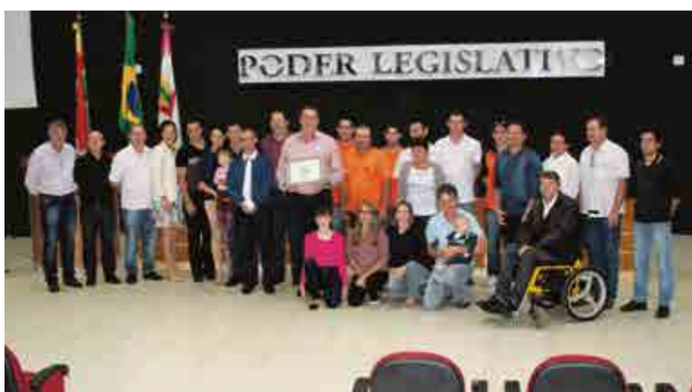
Vereadores com a equipe da E.N.D.

Em fevereiro de 2009 a empresa deixou de ser apenas prestadora de serviços e se tornou loja, com a comercialização de materiais elétricos,