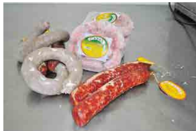
Salame, morcela branca e lingüicinha tem a marca Canaã