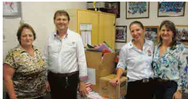
Equipe da Gerência de Educação de Maravilha entregou kits para a E. E. B. Emilia Boos Laus Schmidt de Saltinho