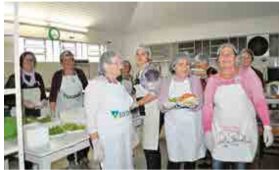
Mulheres auxiliaram na cozinha com o preparo das saladas