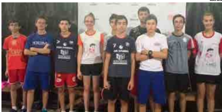
Treinamento entre as equipes foi realizado no Tomatão