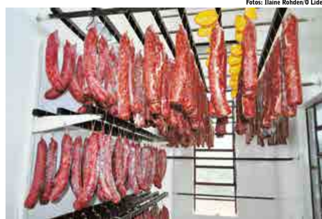
Seis tipos de salame são produzidos no Embutidos Canaã

Para acompanhar as exigências e melhorar a produção, nos últimos seis meses algumas melhorias foram feitas na agroindústria, quando foram investidos em torno de R$ 60 mil. “Foram colocadas portas novas de alumínio, foi climatizado o ambiente, construída uma câmara nova e adquirido um novo resfriador”, comentam. Eles destacam que do valor total, R$ 19.700 mil foram recebidos por meio do Programa SC Rural, por meio da Epagri.