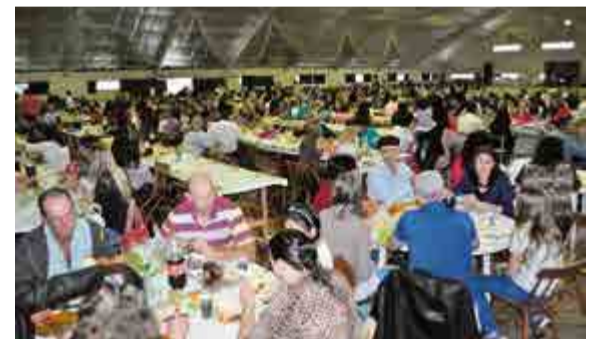
Grande público prestigiou o evento