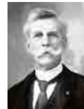
OLIVER W. HOLMES