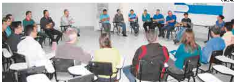
Próxima reunião será marcada para ver quais avanços foram obtidos

Não. É permitida somente a comercialização de carne temperada embalada e rotulada já oriundas da indústria ou entreposto. No açougue a venda de carnes temperadas fracionadas está proibida.