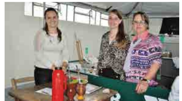
Mulheres auxiliaram na pescaria