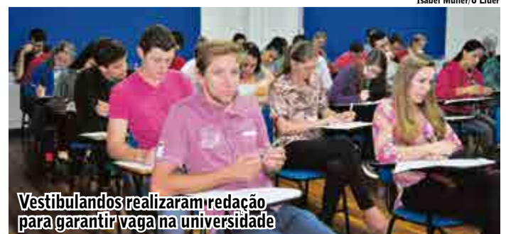
Vestibulandos realizaram redação para garantir vaga na universidade

São 28 cursos ofertados, sendo que as matrículas iniciaram na quinta-feira (28) e vão até 10 de junho. As aulas estão previstas para iniciar na primeira quinzena de agosto.