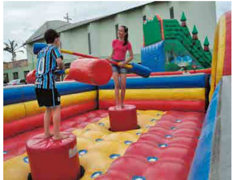
Atividades da Rua do Lazer serão realizadas no Loteamento Jardim América, das 14h às 17h