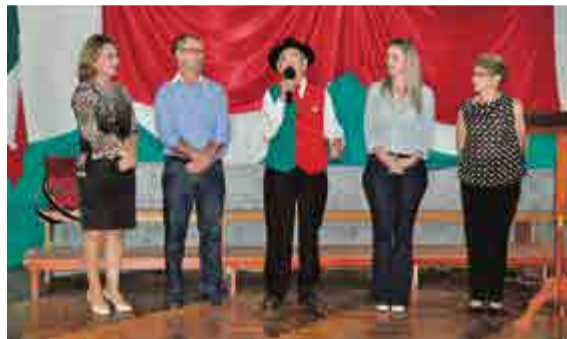
Lideranças municipais acompanharam a abertura do evento