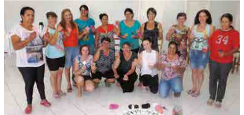
Mulheres iniciaram no encontro do mês a arteterapia