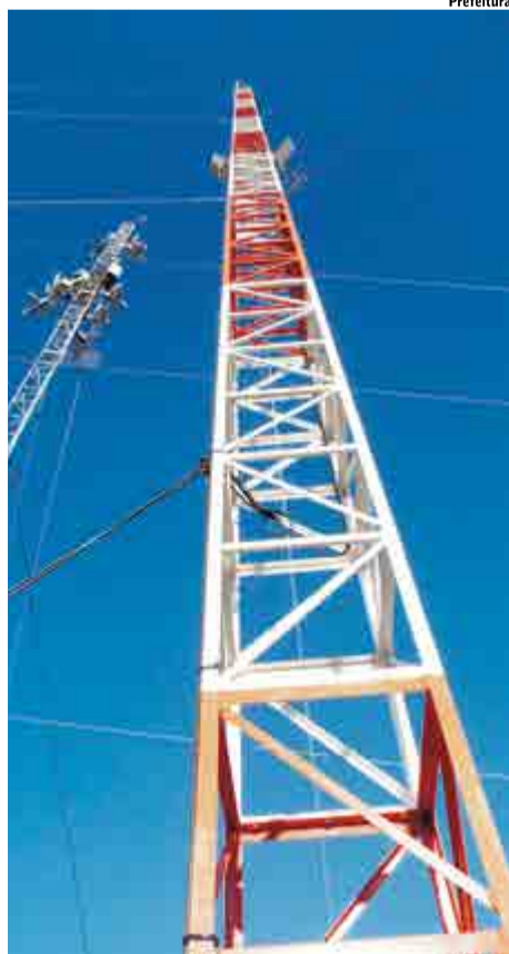
Nova torre tem 30 metros de altura

“Buscamos, dentro da legalidade, resolver a substituição da torre, que foi totalmente danificada após a forte chuva que atingiu o município no mês de outubro de 2014. A administração fez um grande empenho para concretizar o mais rápido possível a conclusão da torre junto às duas empresas que executarão a obra e também junto aos técnicos da RBS TV, de Chapecó e Porto Alegre (RS), que instalarão novamente todos os equipamentos antigos e alguns novos e queremos nos solidarizar com a população que vinha se restringindo com a transmissão deste canal aberto de TV local, pois é o único no município. Mas agora o problema está solucionado”, frisou o secretário de Administração, Walter Naujorks.