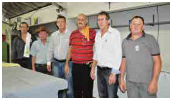
Festeiros responsáveis pela venda das bebidas