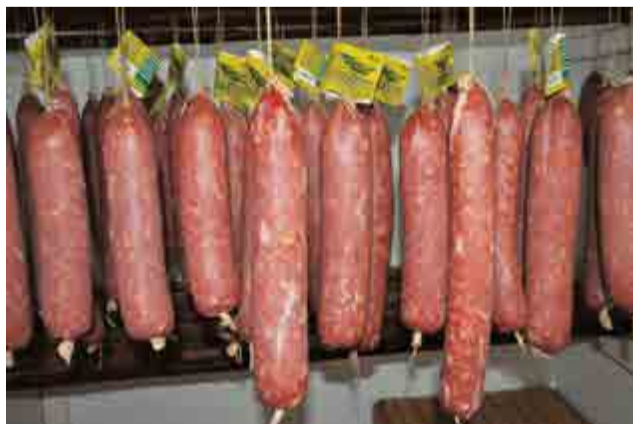
Aproximadamente 800 kg de salame são vendidos mensalmente pelo Embutidos Maravilha