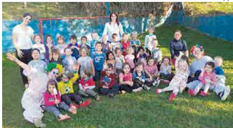
Profissionais do Nasf interagiram com as crianças mostrando as práticas de higiene do dia a dia