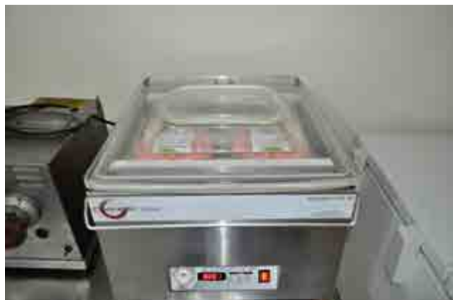
Seladora à vácuo foi uma das últimas aquisições para a agroindústria