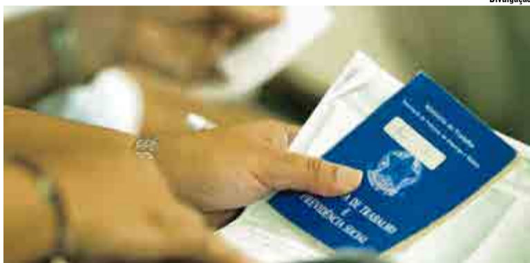
Para que a mudança entre em vigor, a Câmara ainda precisa concluir a votação das demais sugestões de alteração da medida provisória

"O FP se aplica obrigatoriamente na aposentadoria por tempo de contribuição, seja para aumentar ou para diminuir o benefício, e facultativamente, na aposentadoria por idade e na aposentadoria especial do deficiente. Nestes dois últimos casos só se aplica o FP se for mais favorável ao segurado, ou seja,