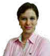
por Luciane Mozer

Então, essa capacitação buscou passar as primeiras informações de como o projeto vai ocorrer, como vai ser aplicado nos estabelecimentos com a participação do empresário e no final, com um feedback, ele vai retornar com os resultados daquela ação", esclarece Lisot.