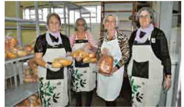
Pães e cucas foram comercializados na festa