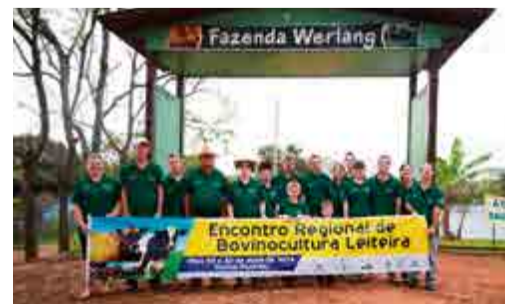
Família Werlang desenvolve trabalho totalmente familiar

Para Werlang, foi uma grande satisfação receber todos em sua fazenda e poder mostrar tudo o que está sendo desenvolvido na propriedade.