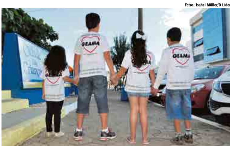
Grupo Maravilhas da Adoção conta com cerca de 25 integrantes

"Ele não nasceu de mim, nasceu para mim" é o lema do grupo