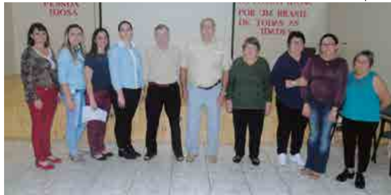
Delegados titulares e suplentes foram escolhidos