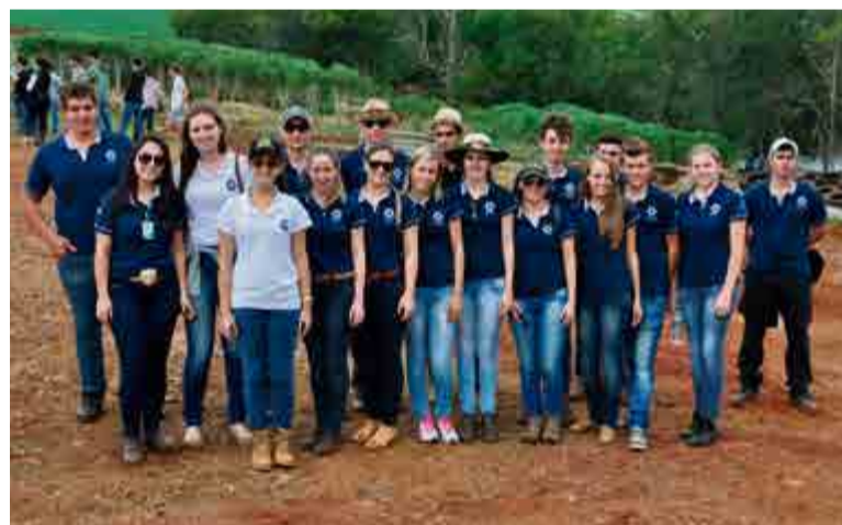
Alunos do curso de Agronomia da Unoesc

nova turma. No fim de 2016 se forma a primeira turma do curso. As aulas são realizadas de segunda a sexta-feira à noite e em sábados intercalados. A duração do curso é de cinco anos.