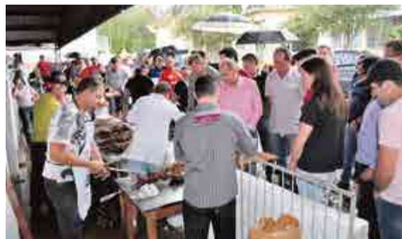
Cerca de 1.250 quilos de carne foram assados