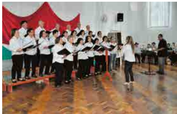
Coral de Caibi