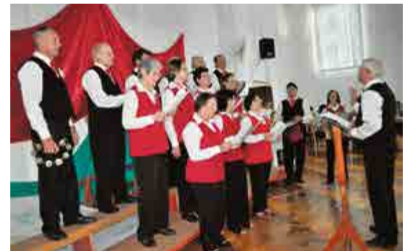
Coral de Palmitos