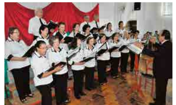
Coral alemão do 25 de Julho de Maravilha participou do evento