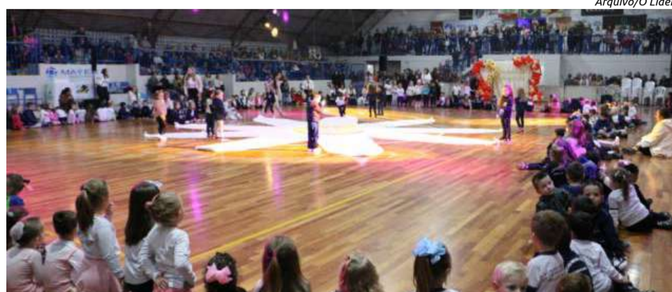
Diversas famílias acompanharam as apresentações no último ano

Na ocasião, serão feitas diversas apresentações promovidas pelo Departamento de Cultura, Secretaria de Educação e Secretaria de Esportes, Juventude e Lazer. “Junte a família e amigos e venha passar uma noite de emoção, de demonstração de amor e gratidão pelas mães”, destacam os organizadores.