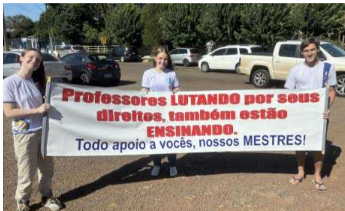
O encontro que ocorreu no município contou com o apoio de alunos

que o governo tenha mais tempo para estudar as possibilidades e apresentar uma contraproposta. Entretanto, se o governo não apresentar nenhuma proposta, os grevistas retornam com a paralisação.