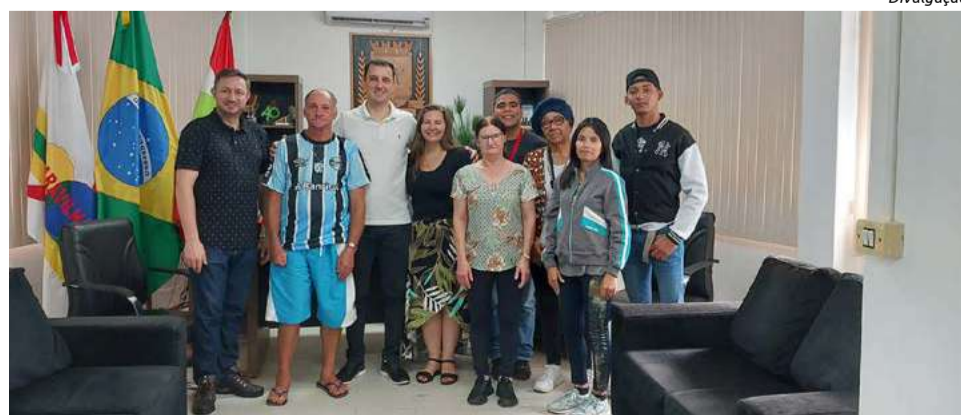
Alunos são da turma de nivelamento matutino