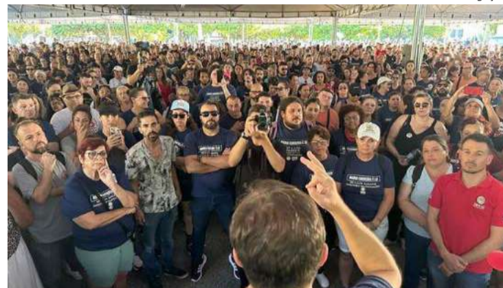
Ato estadual reuniu muitos professores