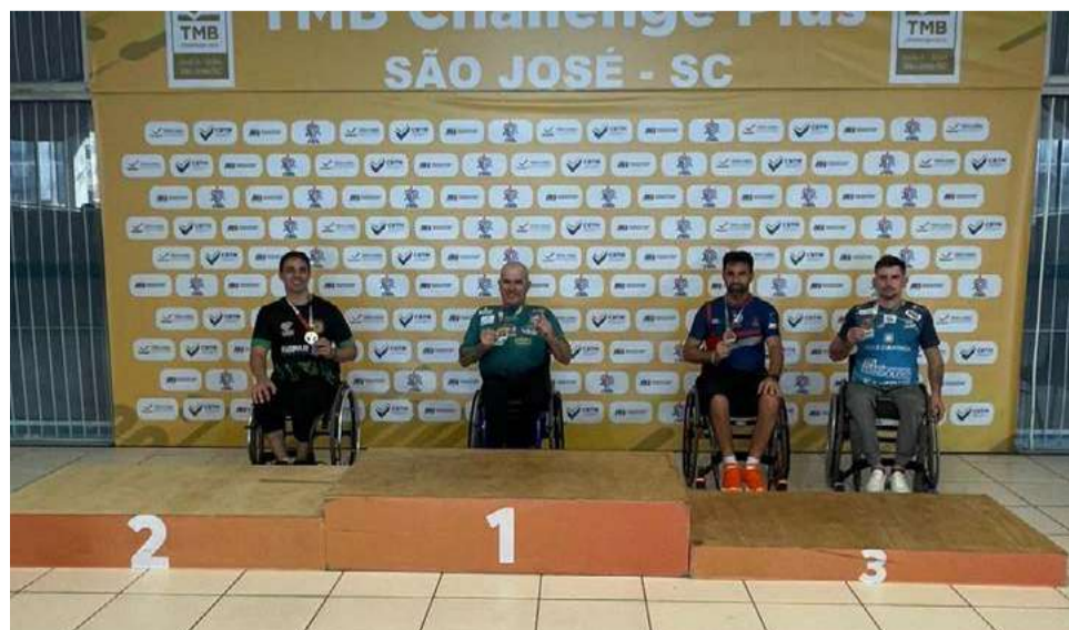
Principais nomes do tênis de mesa olímpico e paralímpico participaram do campeonato