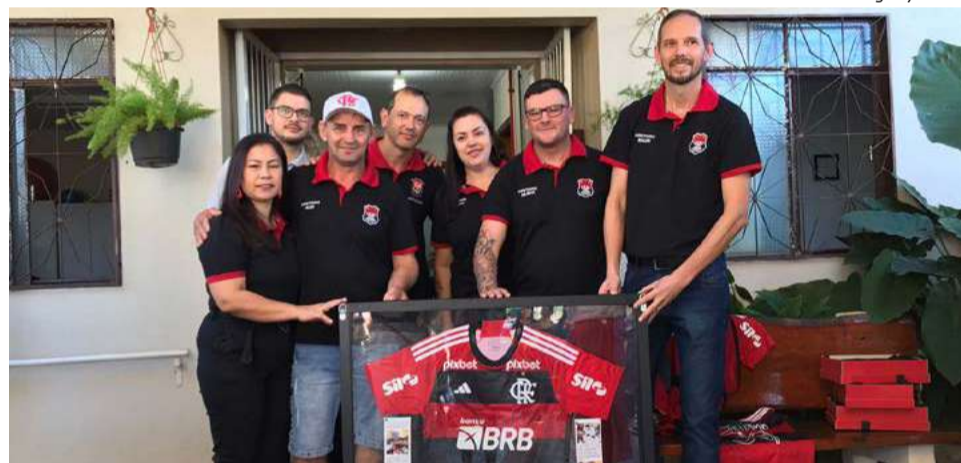
Foi entregue ao consulado do Flamengo uma das quatro camisetas, como forma de agradecimento aos integrantes