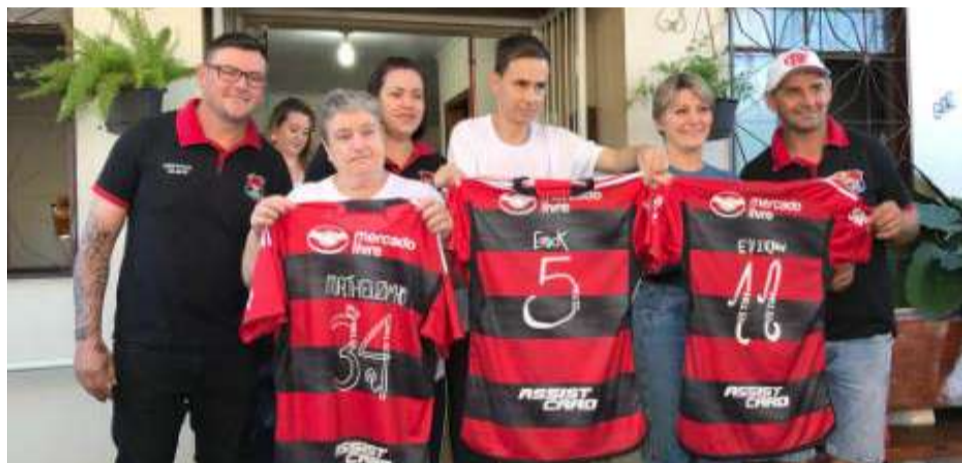
Para personalização das camisetas foram utilizados quatro desenhos feitos por alunos da APAE