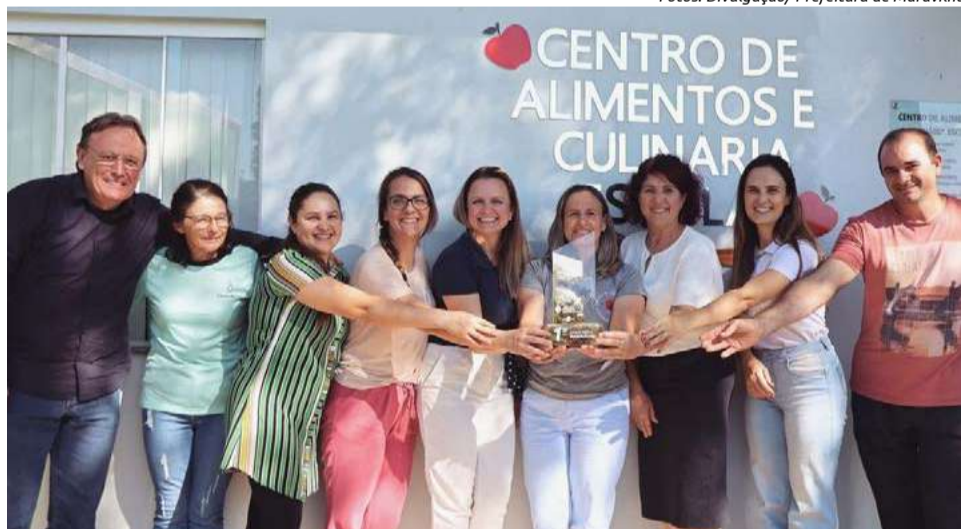
Prêmio foi entregue na segunda-feira (6)