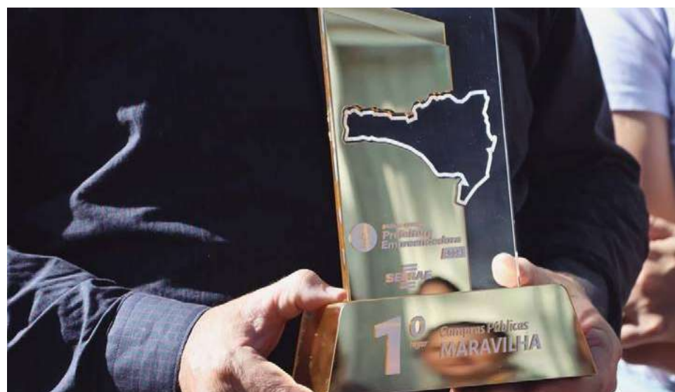
Iniciativa concorre à premiação nacional em Brasília