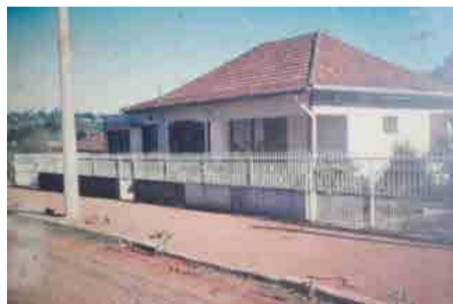
Casa da família Birck foi construída nos anos 60