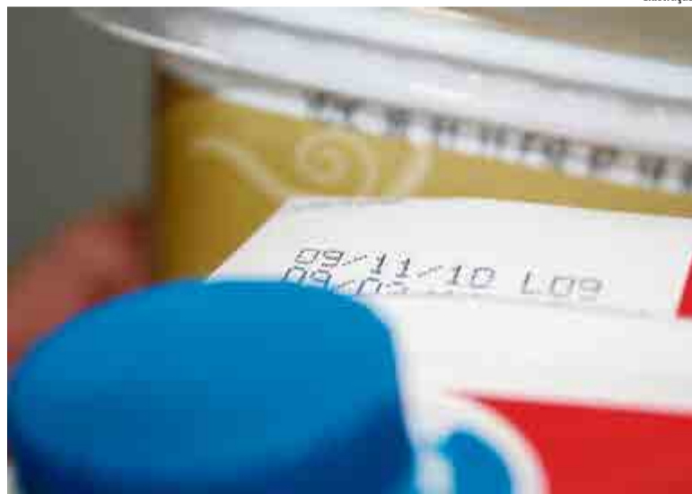
De acordo com o CCO, comercializar produtos com prazo de validade vencido ou fora das normas é crime formal e de perigo abstrato, dispensando a perícia

Também foi referendada pela Associação Nacional do Ministério Público do Consumidor