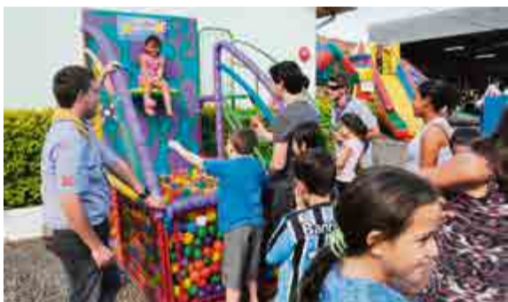
Crianças se divertiram com os brinquedos infláveis