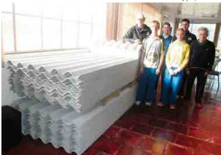
Doação auxiliará na cobertura da instituição