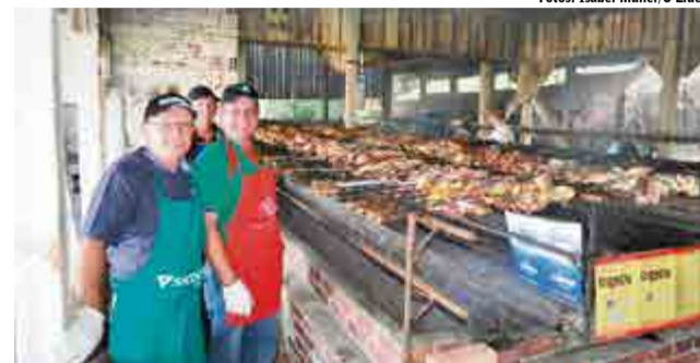
Confraternização envolveu colaboradores do evento