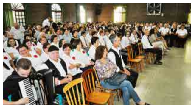
Grande público acompanhou as apresentações

IMPERDÍVEL! Toda Linha Novo Palio em estoque