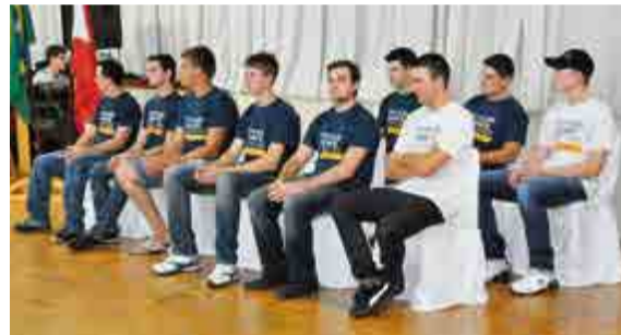
Formandos receberam certificado na noite da última terça-feira (20)