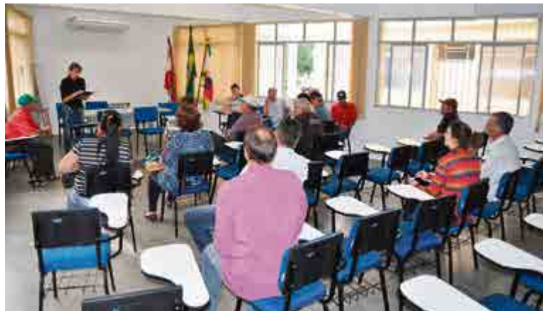
Associação foi criada em reunião na semana passada