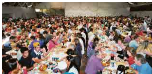
Mais de mil pessoas almoçaram na festa