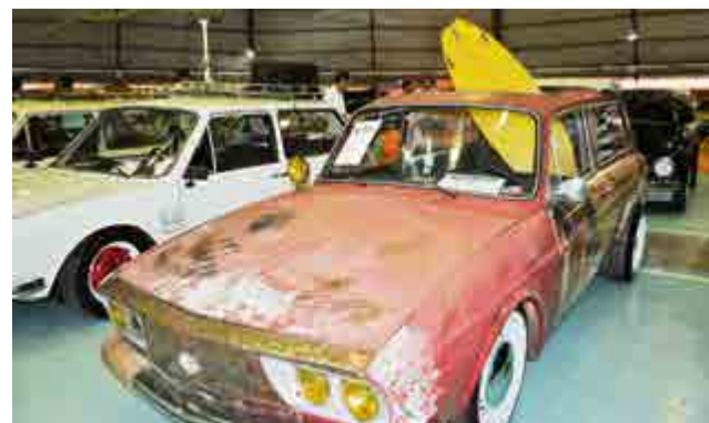
Carro hood ride mantém o estilo original do veículo sem mexer na estética