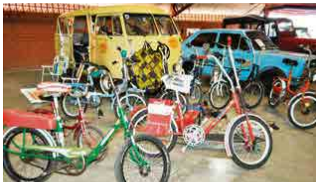
Bicicletas antigas também foram expostas