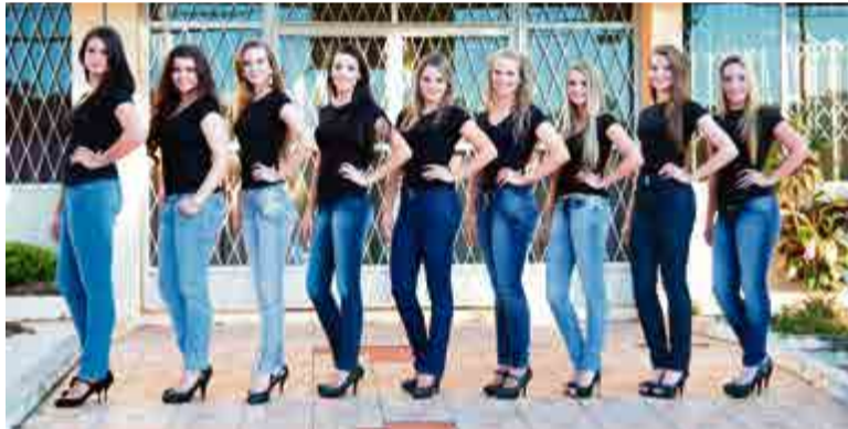
Nove jovens se preparam para o desfile que elegerá aquelas que representarão o município