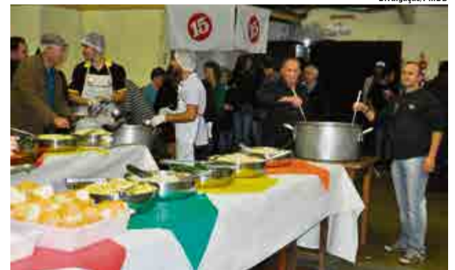
Feijoada e acompanhamentos foi servida a todos os presentes