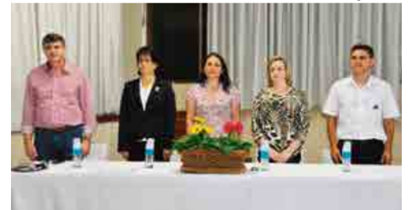
Autoridades parabenizaram os formandos e destacaram a importância da formação