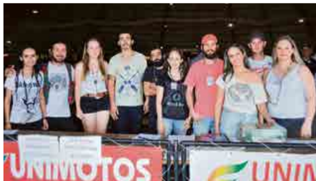
Sonhadora Produções Artísticas e Culturais foi a produtora do 1º Encontro e Exposição de Carros Antigos em Maravilha