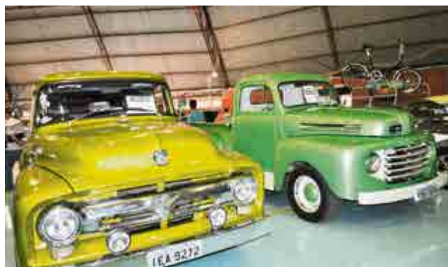
Fords fizeram sucesso na exposição