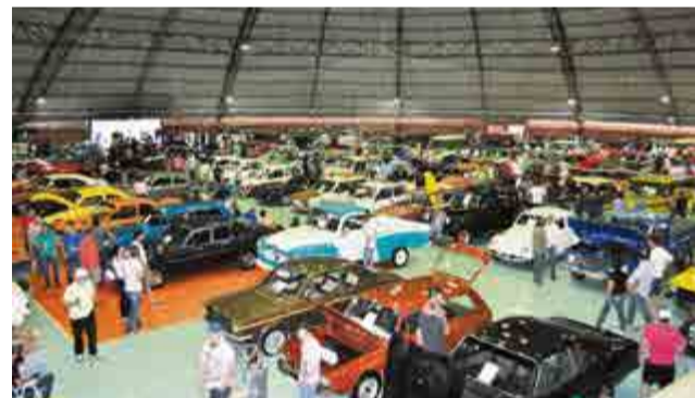
Mais de 100 carros e aproximadamente 500 pessoas passaram pelo evento