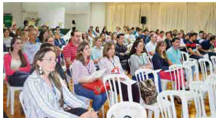
Em São Miguel do Oeste, evento teve palestra-show com Thiago Tombini