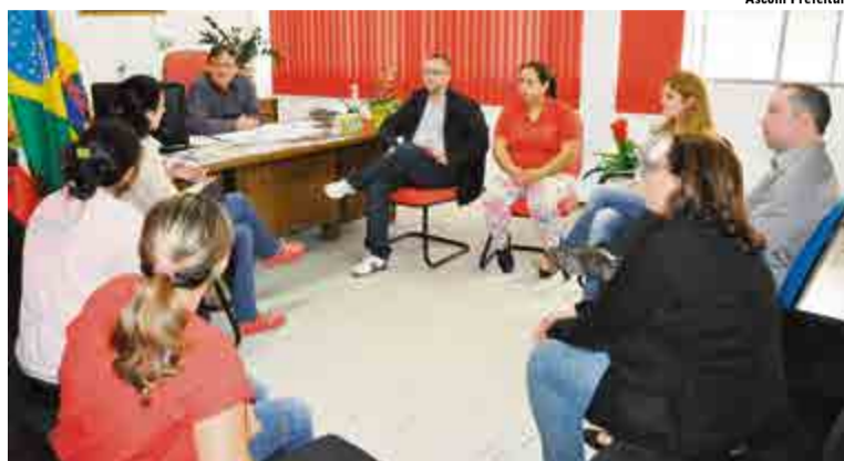
Nova proposta foi apresentada pela Administração em reunião com lideranças do movimento