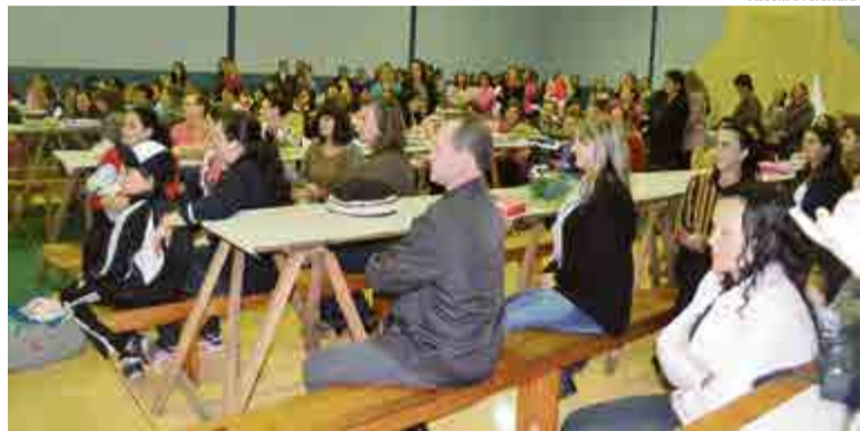
Mães prestigiaram a homenagem ao seu dia