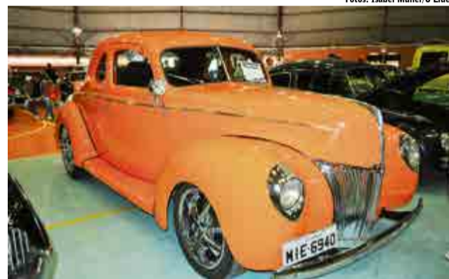
Ford Coupl, 1946, de Chapecó, foi um dos carros expostos