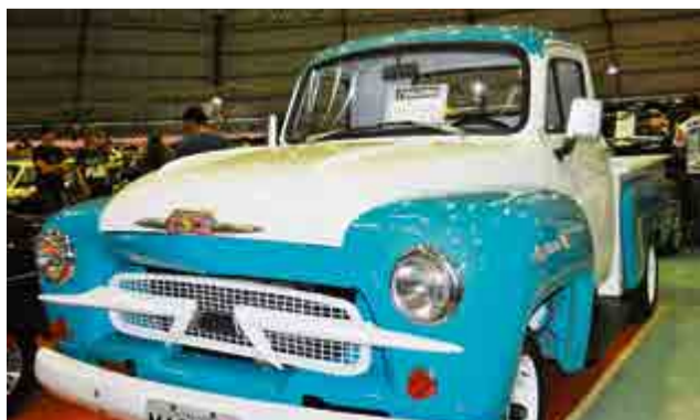
Chevrolet Brasil 3100, ano 1961, de Maravilha, também chamou a atenção dos apaixonados por carros antigos