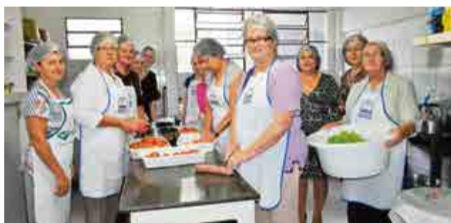
Mulheres da OASE também colaboraram com a comercialização das saladas