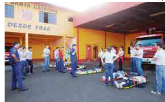
Instruções e avaliação de atendimento foram realizadas