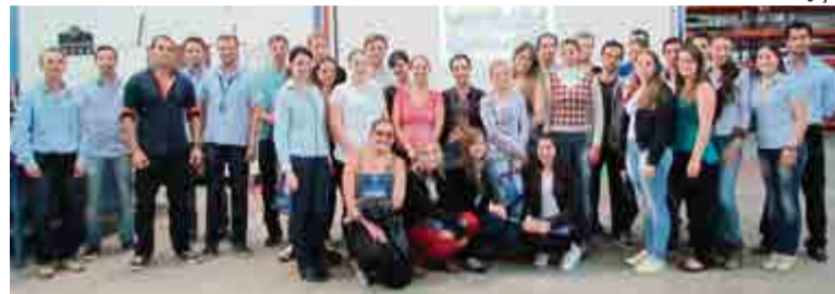
Acadêmicos foram recepcionados na indústria pela direção e colaboradores da JJ