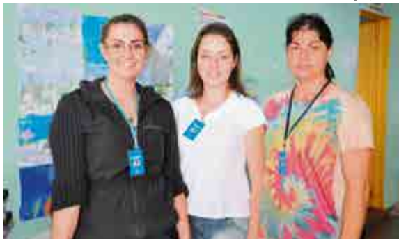
Equipe da saúde do Bela Vista também participou das ações