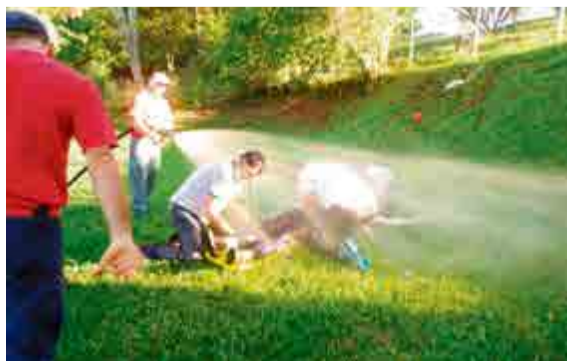
Sob sol e água, futuros bombeiros comunitários atenderam vítimas

Ele ensina o que uma pessoa deve fazer quando se depara com um acidente ou qualquer tipo de ocorrência. "O curioso não deve mexer na vítima a fim de não agravar a situação do paciente e para que ele não se torne mais uma vítima, dependendo o tipo de cena que estiver sujeito, por exemplo, um ambiente com eletricidade, com líquido perigoso, com ameaça de desabamento ou qualquer outro meio que coloque a vida dele em risco também; outra dica é manter-se afastado; acionar o serviço de emergência pelo número 193 e isolar a área, se for possível. Isso já contribui para o serviço da guarnição", orienta.