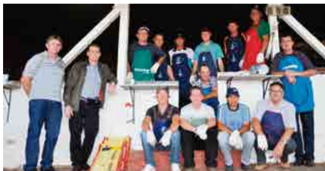
Churrasqueiros se responsabilizaram pelos mais de mil quilos de carne assados