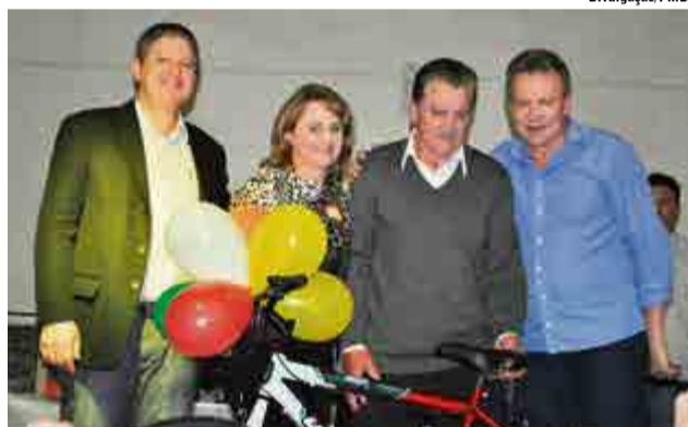
Diversos prêmios foram sorteados entre os presentes