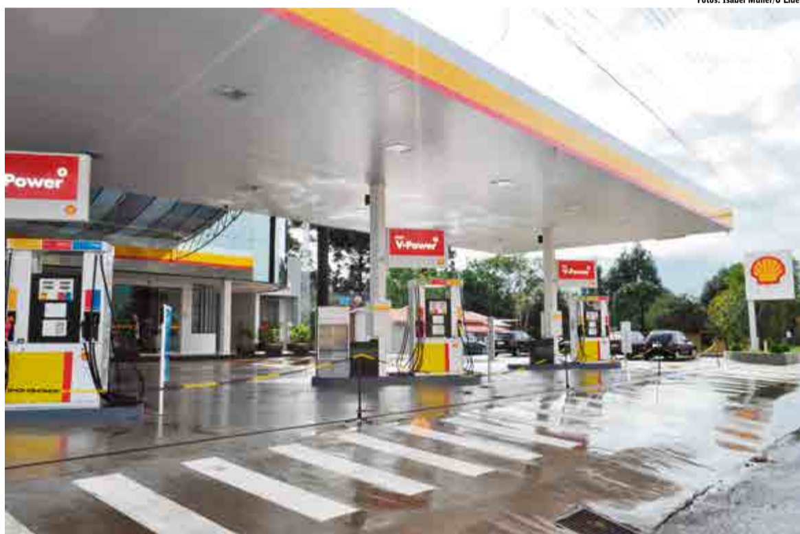
Diamante 2 está localizado na Avenida Anita Garibaldi, próximo ao cemitério municipal