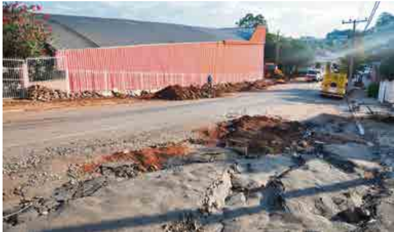
Local teve investimento de R$ 20 mil por parte da Casan