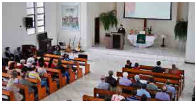
Programação das comemorações do 61º aniversário teve início com culto