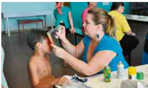
Diversas atrações foram programadas para a tarde de sábado