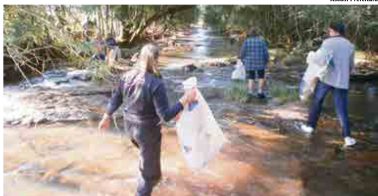
Alevinos também foram soltos no Rio Joelho