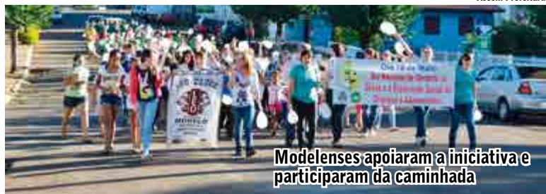
Modelenses apoiaram a iniciativa e participaram da caminhada