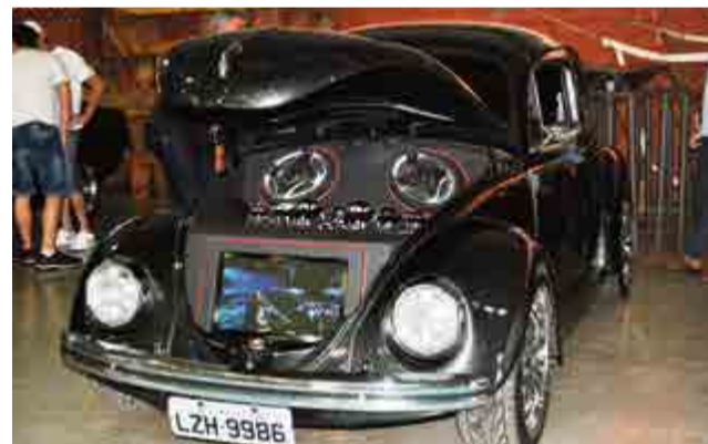
Tecnologia também foi adaptada em diversos carros antigos expostos no encontro