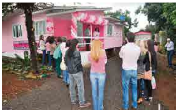
Voluntárias e autoridades acompanharam a inauguração da sede do Brechó Rosa