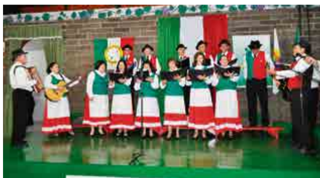
Coral da Acima abriu as apresentações da tarde