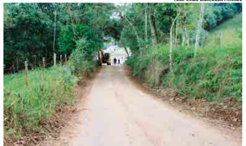
Via era considerada estreita, visto o grande tráfego de veículos

"As melhorias promovidas na estrada que liga a Linha Glória ao Itapé era uma antiga reivindicação, visto que a mesma era estreita e não se mantinha em boas condições. Agora, com o alargamento no acesso da