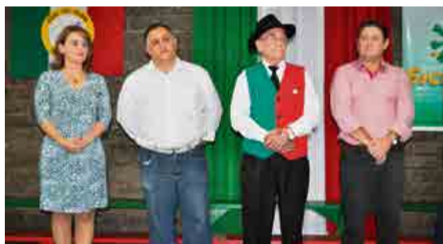
Autoridades realizaram a abertura do evento