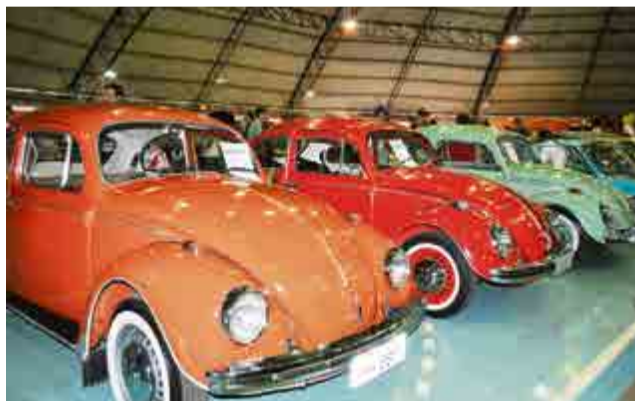
Populares Fuscas também mostraram sua originalidade