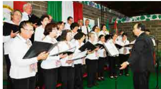
Coral do 25 de Julho também participou da festa