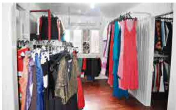
Local é amplo e bem organizado