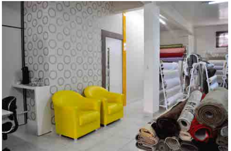
Duo Arquitetura está localizada na Avenida Araucária, 343, sala 103, anexo à Encanto Decorações