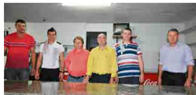
Ala masculina cuidou das bebidas