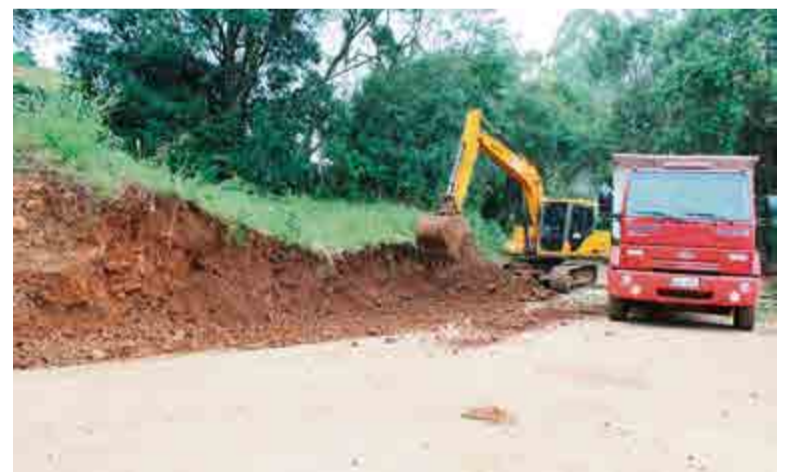
Equipes estiveram empenhadas para viabilizar concretização dos trabalhos