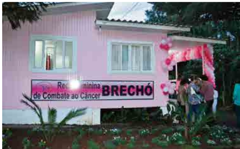
Brechó Rosa agora está na Rua Santos Dumont, 165