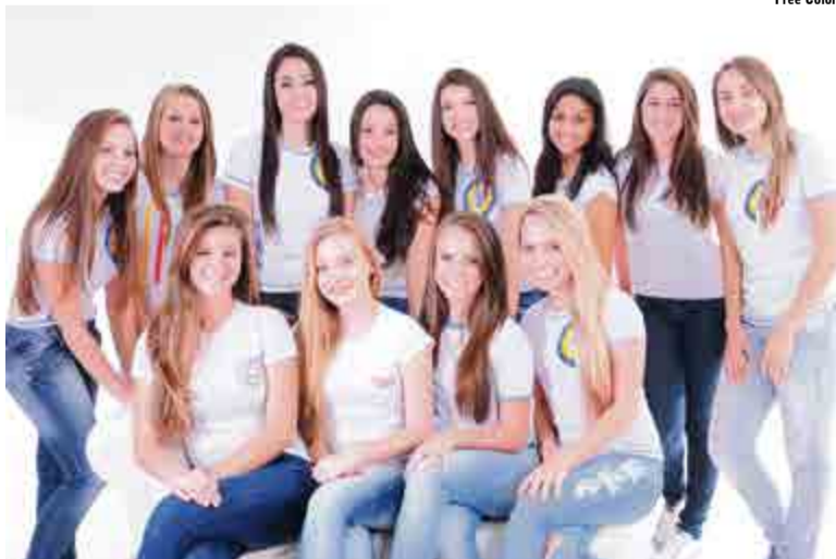
Doze jovens disputam ao título de Garota Estudantil 2014