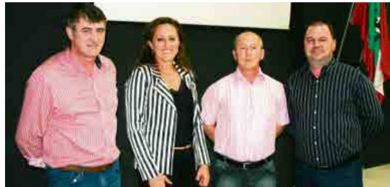
Oposição busca respostas a diversas solicitações reivindicadas pelos municípios maravilhenses