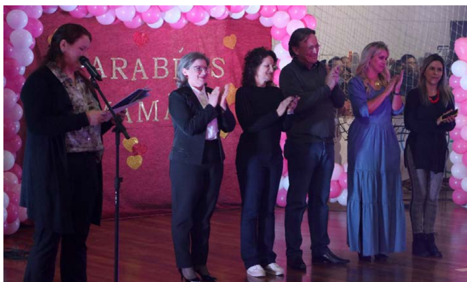
Autoridades presentes no evento