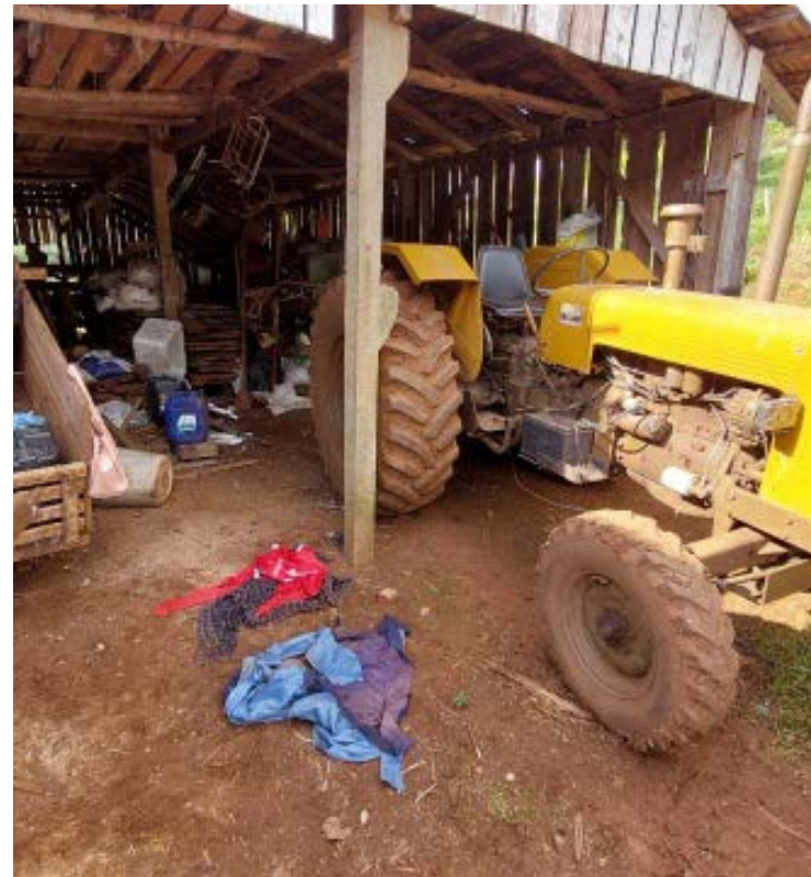
Tragédia foi no interior de São Miguel do Oeste