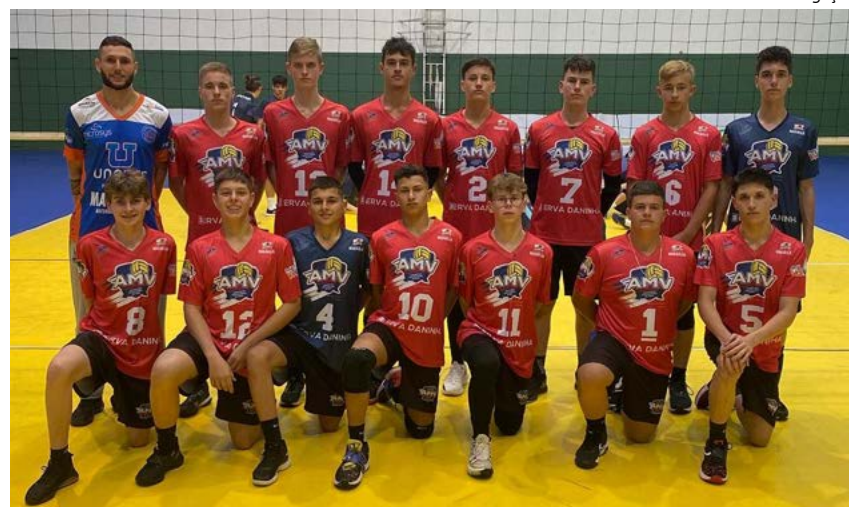
Meninos ganharam de todos os adversários pelo placar de 2 sets a 0

dos meninos entrarem em quadra, onde jogaram contra Cunha Porã, Pato Branco, Palmitos e Chapecó. Eles ganharam todos os jogos pelo placar de 2 sets a 0 e com isso foram campeões da primeira etapa. Com o bom desempenho na etapa os maravilheneses conquistaram o direito de sediar a próxima etapa.