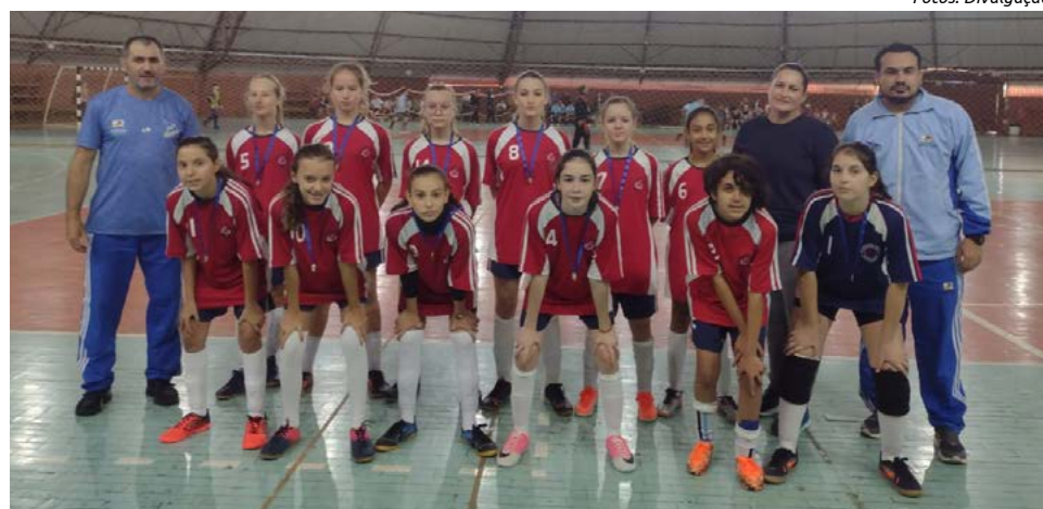
No feminino Escola João XXIII teve a melhor campanha

1° Lugar – Escola João XXIII 2° Lugar – Escola Nossa Senhora da Salete