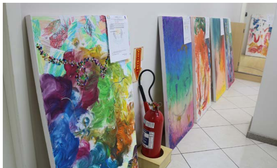
Exposição no Sicredi em Maravilha