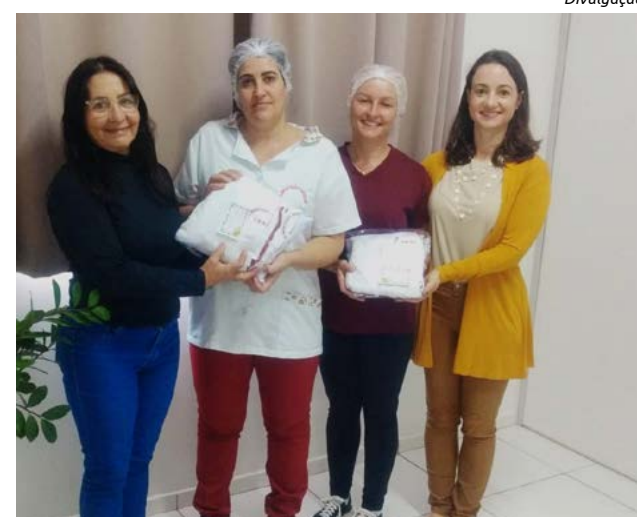
Kits foram entregues na última semana para as profissionais

As merendeiras e serventes da Rede Municipal de Ensino de São Miguel da Boa Vista receberam novo uniforme. O kit é composto por avental, camisetas manga curta e longa, na cor branca e com identificação. Os mesmos destinam-se ao uso no ambiente de trabalho para ser utilizado durante as atividades do Setor de Alimentação Escolar, conforme o preconizado pela legislação sanitária em vigor do Programa Nacional de Alimentação Escolar.