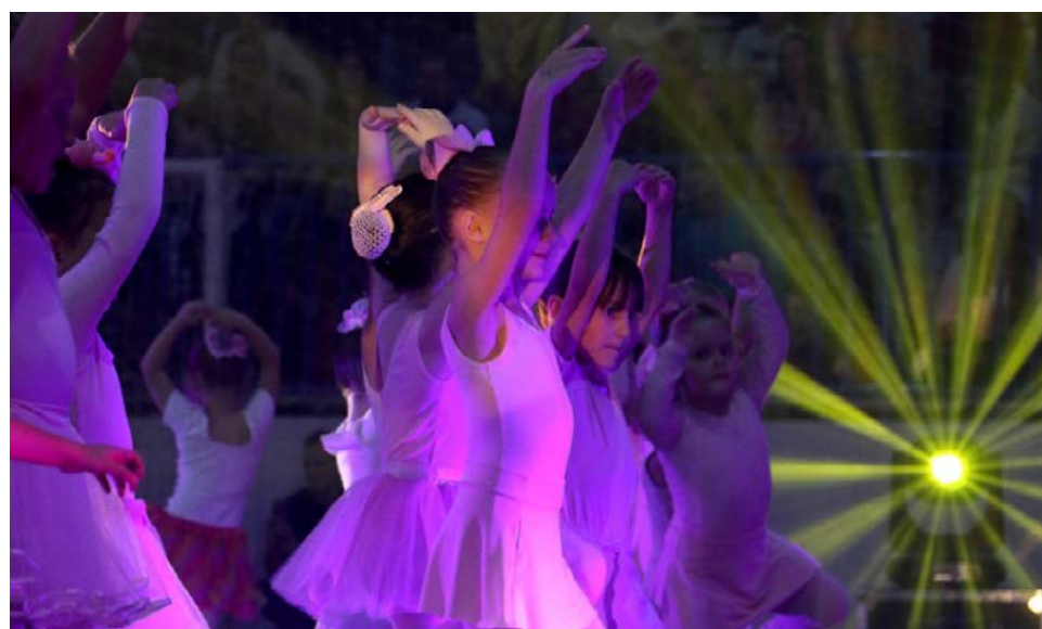
Alunas da oficina de Balé da Cultura