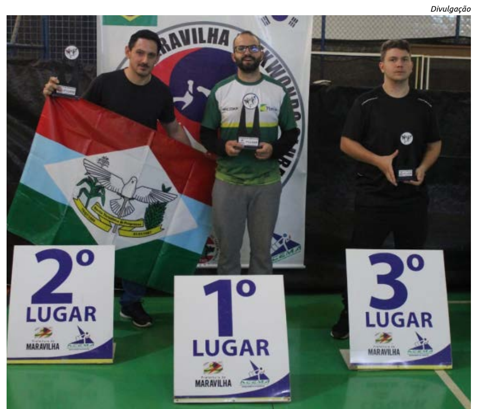
Maravilha 1º lugar; Santa Terezinha 2º lugar e 3º Cunha Porã

Na classificação final geral Maravilha ficou em 1º lugar; Santa Terezinha 2º lugar e 3º Cunha Porã. “Mais um evento de grande sucesso que a atual Administração municipal proporcionou”, finalizam os organizadores.