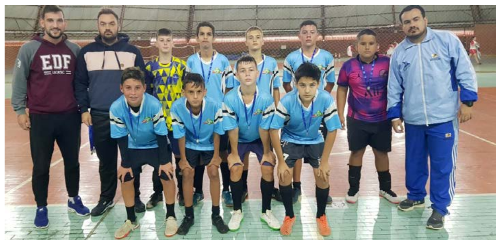
No masculino Escola Santa Terezinha ficou em primeiro

última semana. A etapa recebeu as equipes com alunos de 12 a 14 anos, na modalidade de Futsal.