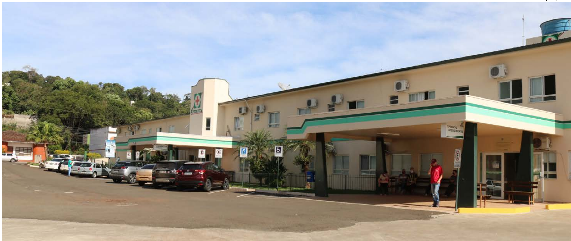
Hospital São José tem mais de 100 profissionais da área no quadro de colaboradores