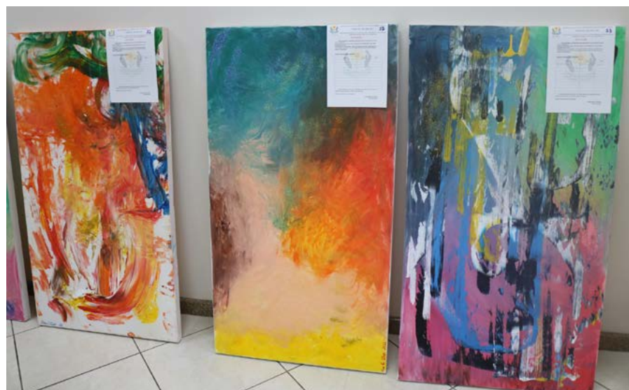
Pinturas foram feitas pelos alunos da Apae