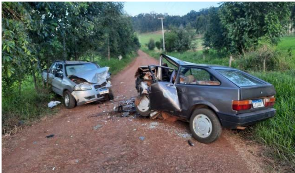
Após trabalho das equipes, vítimas foram levadas para o hospital