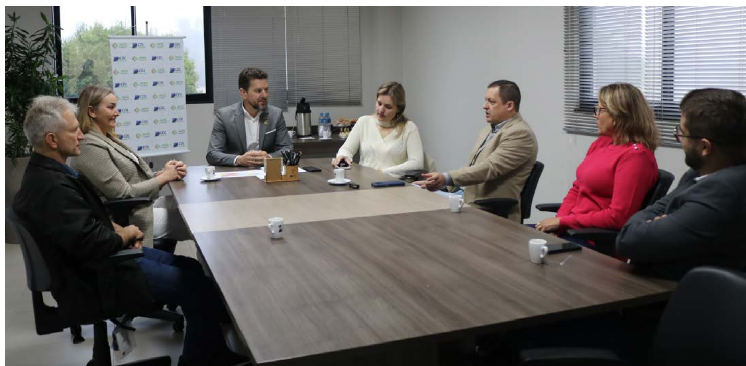
Reunião foi com os dirigentes da CDL e AE

Entre os pedidos está a pavimentação de todo trecho de nove quilômetros do contorno viário, construção do viaduto no entroncamento das BRs 158 e 282, pavimentação asfáltica entre Maravilha e Bom Jesus do Oeste, resolução dos problemas no abastecimento de água no município e implantação de um Centro tecnológico para os principais setores econômicos.