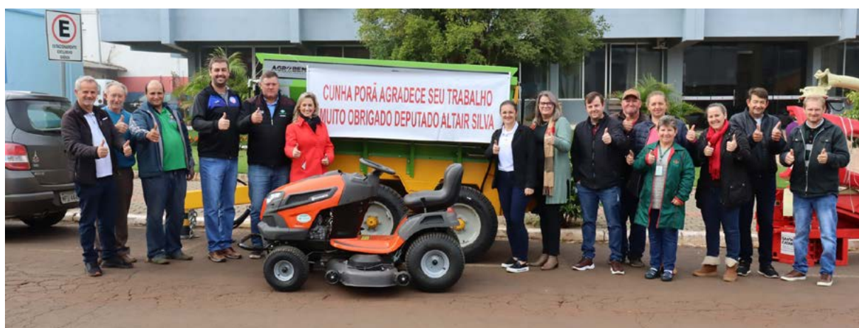
Administração agradeceu aos deputados por beneficiar o município

tos são um novo distribuidor de adubo líquido quatro toneladas, mais dois distribuidores de adubo seco, calcário e adubo químico, uma ensiladeira colhedora e um trator cortador de grama. Os equipamentos serão utilizados para auxiliar os agricultores do município.