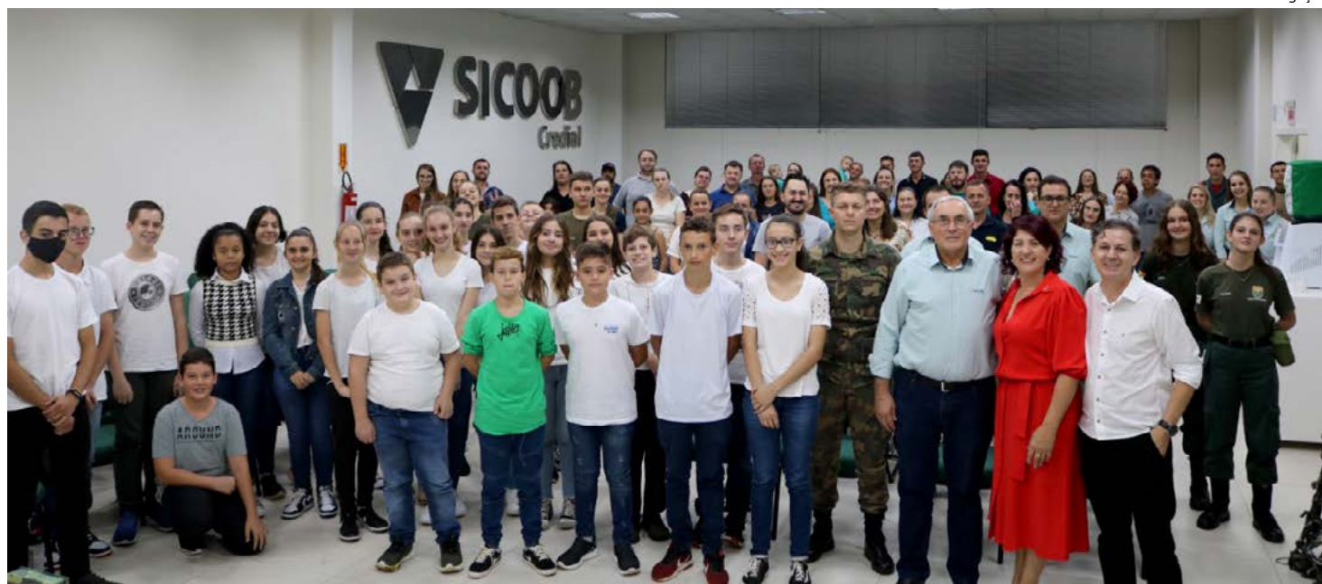
A turma é composta por 25 alunos, que participam de encontros semanais