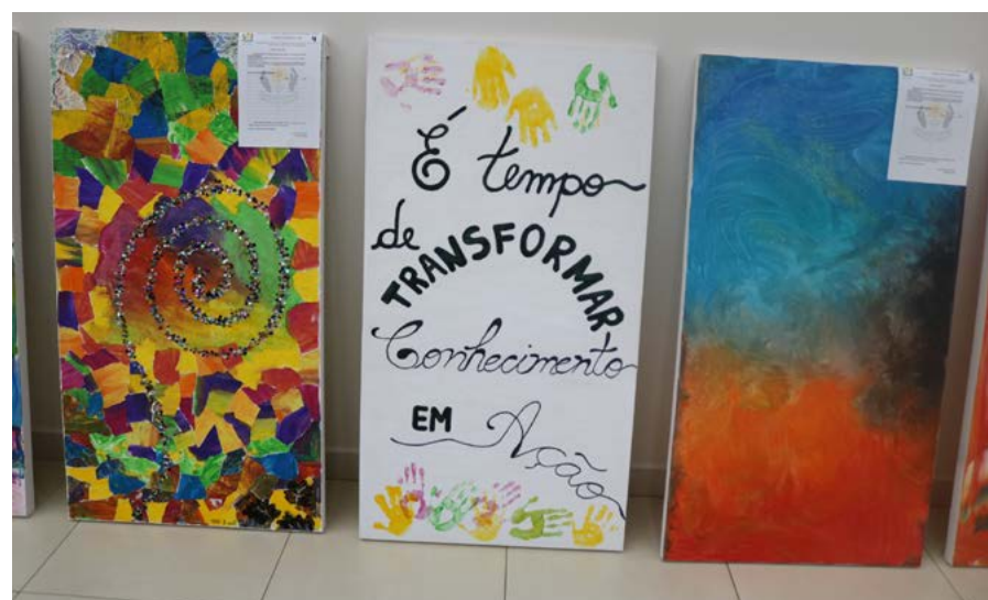
Beleza dos quadros chama a atenção