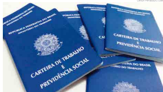
Não há custos para a emissão do documento

Para emitir a Carteira de Trabalho, o cidadão precisa apresentar Certidão de Nascimento, CPF, RG e comprovante de residência. A foto é