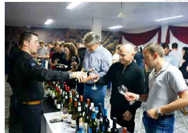
Além de degustação, convidados tiveram oportunidade de adquirir produtos expostos

O Wine Day também teve a parceria de Excel-sior Frigorífico, El Toron Pimentas, Pizza Sabor Carioca, além de mostrar a produção própria, com massas, pães rústicos e carnes de raças europeias.