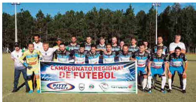
Dionísio Cerqueira Futebol Clube