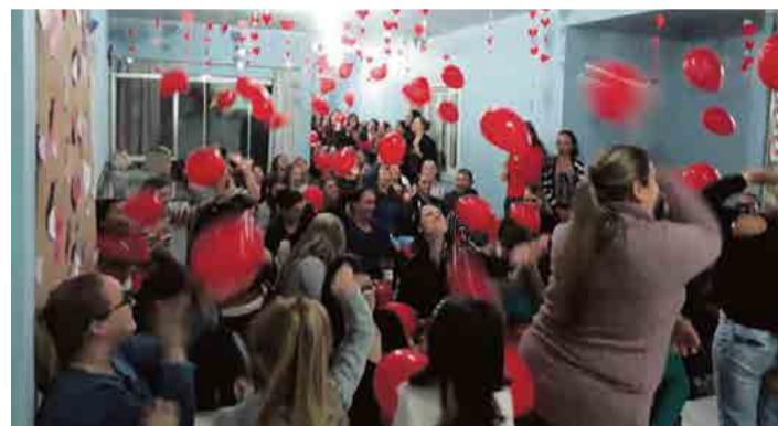
Centro de Educação Infantil Sílvia Ebert teve balões e muitas emoções para as mães