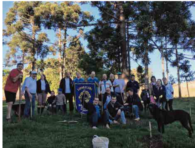
Plantio de árvores na beira de rios

tê permanente para esta pasta. "Participamos de várias campanhas de plantio de árvores na beira de rios, plantio de árvores para embelezamento da cidade, campanhas de conscientizações sobre descarte e reciclagem do lixo", destacam os companheiros.