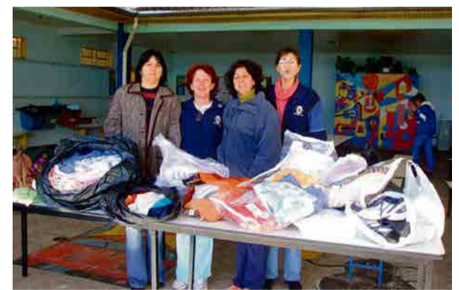
Entrega de roupas na Escola Monteiro Lobato