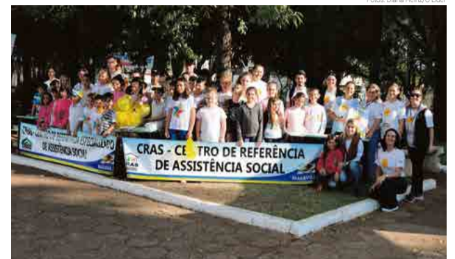
Alunos do Serviço de Convivência e Fortalecimento de Vínculos participaram da ação

ainda permanece em algumas famílias onde situações reais existem, porém nos últimos anos a procura por parte dos parentes aumentou consideravelmente. “É importante denunciar e conscientizar a população a prevenir, e diante de qualquer suspeita que envolva exploração e violência sexual, denunciar aos órgãos competentes”, afirma.