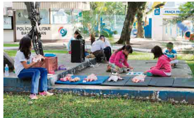
Dia Nacional de Combate ao Abuso e à Exploração Sexual de Crianças e Adolescentes foi ontem (18)

Esclarecer o que caracteriza o abuso e exploração sexual é o objetivo das instituições envolvidas na programação do mês maio. Mostrar à comunidade como é o problema e quais atitudes são necessárias foram informações repassadas ontem (18), na Praça Padre José Bunse, pelos profissionais do Centro de Referência de Assistência Social (Cras), Centro de Referência Especializado de Assistência Social (Creas), Conselho Tutelar e alunos do Serviço de Convivência e Fortalecimento de Vínculos (SCFV).