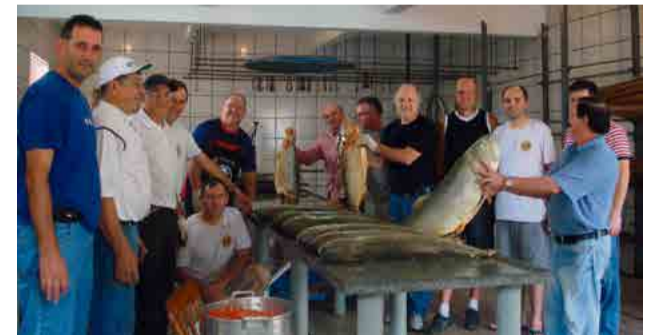
Preparação para o Jantar do Peixe