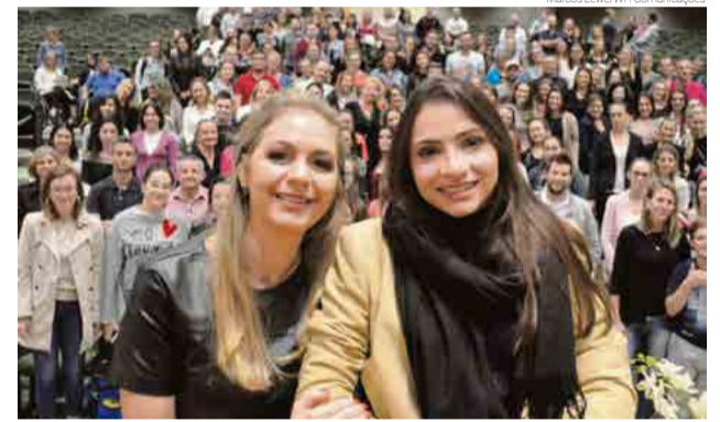
Com o tema Códigos de Superação, palestra foi realizada na quinta-feira (17) em São Miguel do Oeste

grande ponto é ser feliz, me superar, não deixar a minha vontade, porque estou sem movimento, nas mãos de outras pessoas. Aprendi a pegar as rédeas da minha vida e seguir pelo caminho que eu realmente quero”, finaliza.