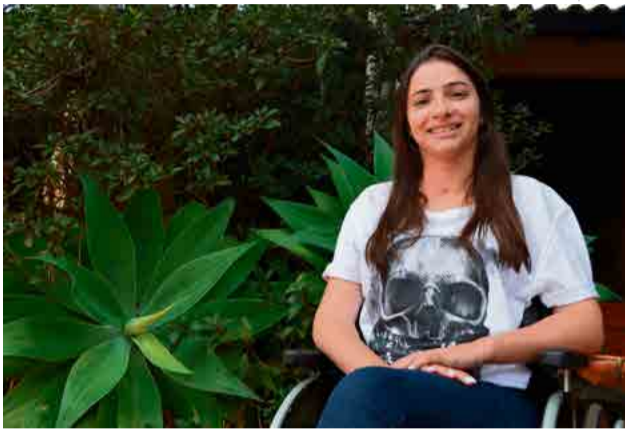
A ex-ginasta olímpica esteve em São Miguel do Oeste nesta semana e conversou com a reportagem do Grupo WH Comunicações

“Sempre fui muito esportiva, de não parar. Com a quantidade de anos que tive de treinamento, imagina! Eu