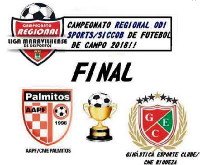
Competição é organizada pela Liga Maravilhense de Desportos

Já pelo naipes feminino as finais serão entre as equipes do Fluminense e Águas Frias. A primeira partida será em Tigrinhos, às 15h30 de amanhã (20).