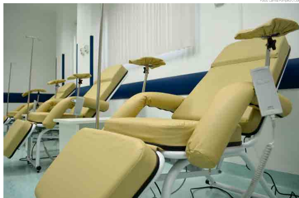
Com investimento de R$ 2,35 milhões, setor foi equipado visando à autonomia dos pacientes

Para atender toda a demanda, a estimativa é que o repasse mensal para manter os trabalhos oncológicos seja de R$ 1,1 milhão. Além das quimioterapias, estão incluídas cirurgias e exames. “Em termos de atendimento, serão 55 cirurgias ao mês, 442 quimioterapias ao mês,