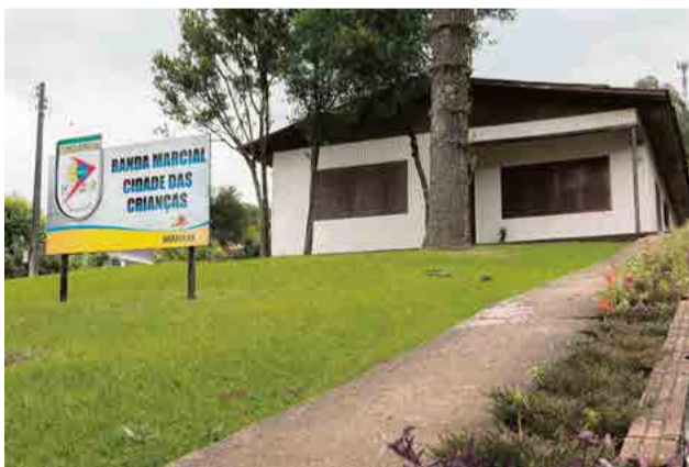
Atualmente a casa é sede da Banda Marcial