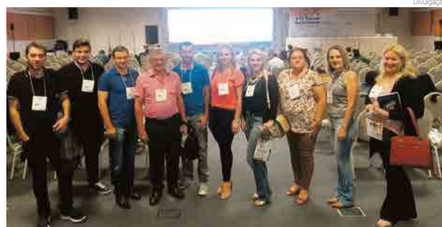
Profissionais da região participaram do evento

O objetivo do evento é proporcionar a integração das regiões catarinenses, além de promover o debate das políticas públicas do se-