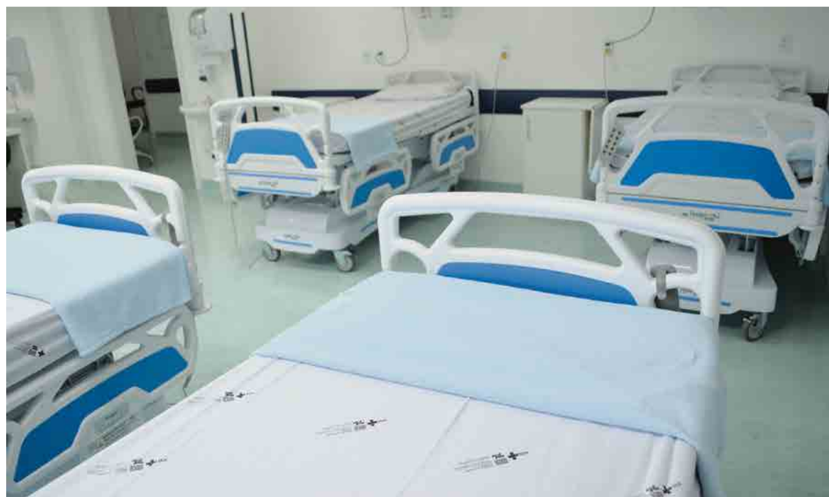
Pacientes de 30 municípios da região vão ter atendimento mais perto de casa