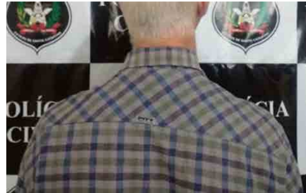
Polícia Civil divulgou imagem do idoso, que já presidiu o Conselho Comunitário de Segurança e renunciou após as investigações

Com base nas informações, o delegado solicitou a prisão preventiva do idoso, o que foi aprovado pelo Poder Judiciário. Para o delegado, a prisão vai evitar tumulto e comprometi-