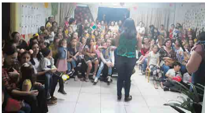
Alunos do Centro de Educação Infantil Branca de Neve também organizaram homenagens