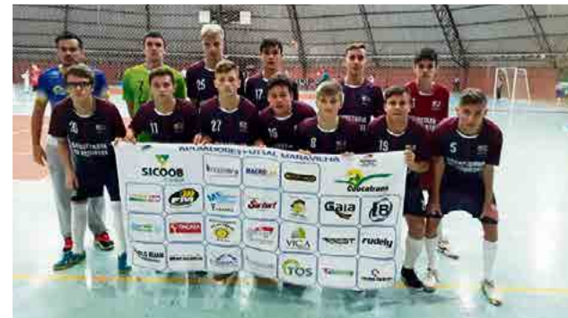
Na categoria sub-17 goleada de 8 x 0 contra os visitantes