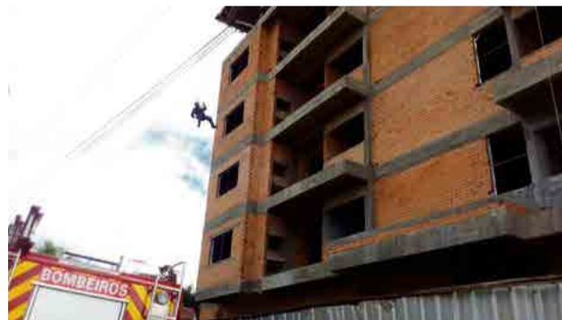
Rapel guiado foi treinado pela equipe

Salvamento de vítima com rapel: Simulação de vítima que precisou ser resgatada de um prédio.