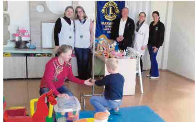
Integrantes realizam ações frequentes no local

Quem conhece o Lions Clube provavelmente já ouviu falar da Campanha da Visão. O projeto auxilia todos os anos dezenas de crianças a enxergar melhor através de testes, prevenindo problemas, e da doação de óculos. Na Escola de Ensino Fundamental Juscelino Kubitschek de Oliveira, por exemplo, a Campanha da Visão é uma das