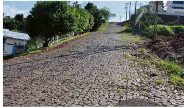
Trecho da Rua Nereu Ramos onde será feito o serviço de reperfilagem

O investimento para esta obra será de aproximadamente R$ 490 mil para pavimentar área total de 7.449,15 m 2 . Os recursos são provenientes de emenda parlamentar do deputado federal Celso Maldaner (MDB), com contrapartida do município e dos moradores. O município aguarda a autorização da Caixa