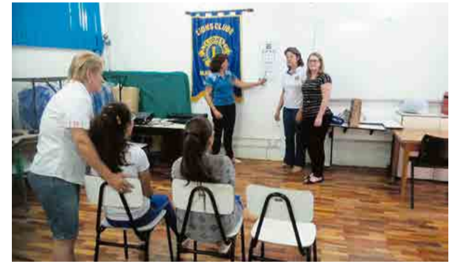
Testes de visão feitos nas escolas

Uma das campanhas humanitárias de maior importância realizada pelo Lions Clube é a Campanha da Visão, feita nas escolas por meio do teste de acuidade visual em crianças entre seis e sete anos. Os alunos que apresentam alguma deficiência são encaminhados para consulta e, se necessário, o Lions ajuda na aquisição de óculos. De acordo com os integrantes, a campanha ocorre há aproximadamente 40 anos e os recursos são adquiridos com o lucro do Jantar do Peixe ou da venda de lasanhas.