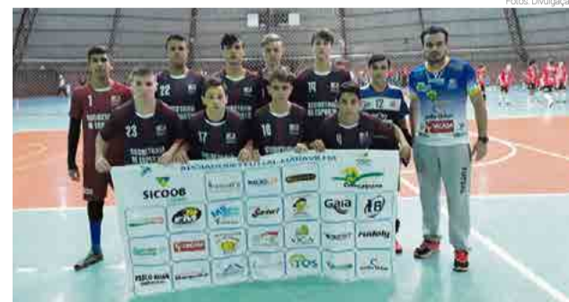
Equipe sub-15 fez 5 x 2 em Mondai, em jogo realizado no Tomatão

sal de base, contra Mondai. Maravilha perdeu em apenas duas categorias: na sub-9, 6 x 0 para os adversários; e na sub-13, 3 x 1. Pela sub-15 e sub-17, categorias treinadas pelo professor Gian Mauro Silva, vitória de 5 x 2 e 8 x 0, respectivamente. Na sub-7 vitória de Maravilha por 5 x 2; e na sub-11, 1 x 0.