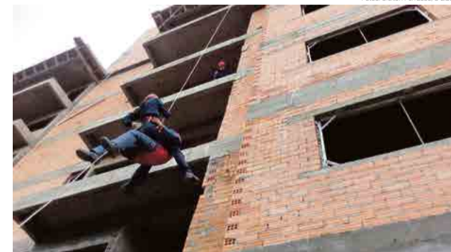
Salvamento de vítima foi praticado