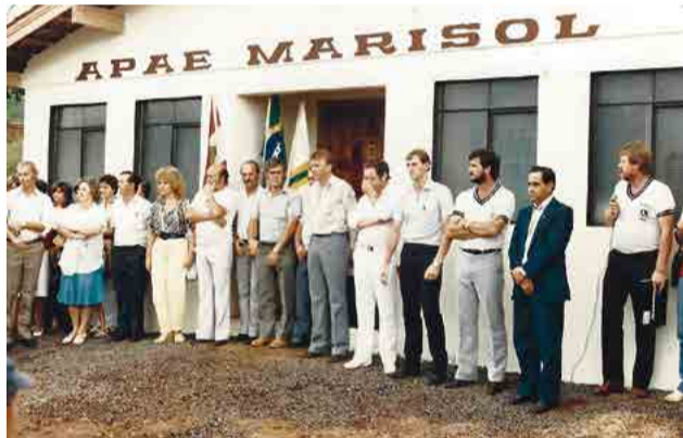
Clube auxiliou na construção da Apae

Nestes 50 anos, os membros do Lions Clube Maravilha auxiliaram na fundação do Corpo de Bombeiros Voluntários, participaram da construção da sede do Programa de Erradicação do Trabalho Infantil (Peti) e apoiaram o desenvol-