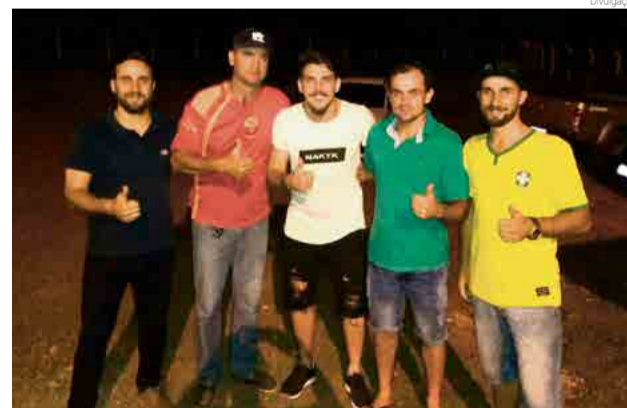
Jovem de 23 anos vem para defender o Guarani

ritiba. De acordo com a diretoria do Leão do Vale, o atleta vem para jogar, mas estava parado há quatro meses, e se aparecer proposta de outras equipes do futebol profissional, está liberado para seguir. Para atuar no Guarani o jogador será baixado da categoria profissional para amador.