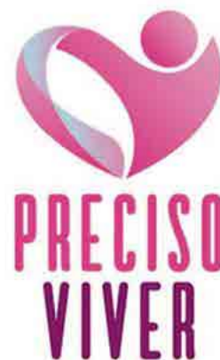
Ilustração Logomarca Campanha