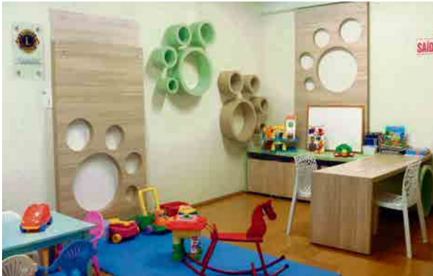
Brinquedoteca construída pelo Lions no Hospital São José