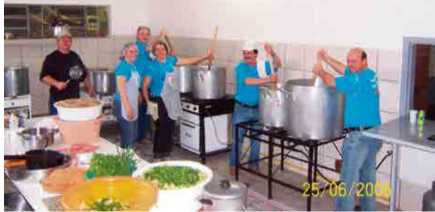
Feijoada é tradicional no município