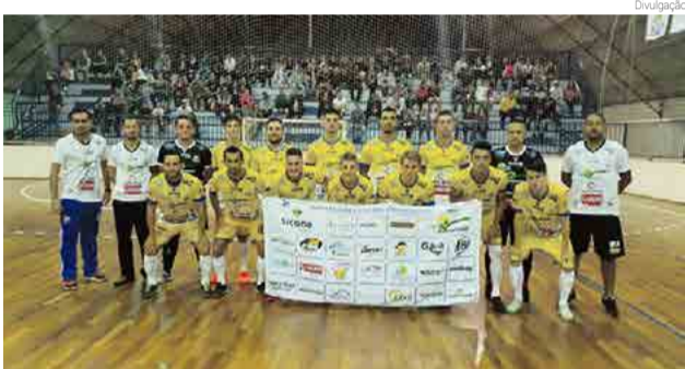
Equipe tem três vitórias, dois empates e duas derrotas

No começo da partida deu a impressão que Maravilha havia retomado o bom futsal apresentado no começo da competição. Maravilha marcou com Tonini e Biju nos minutos iniciais. Passado o