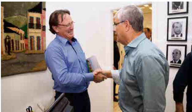
Camerata Florianópolis está confirmada no aniversário de Maravilha