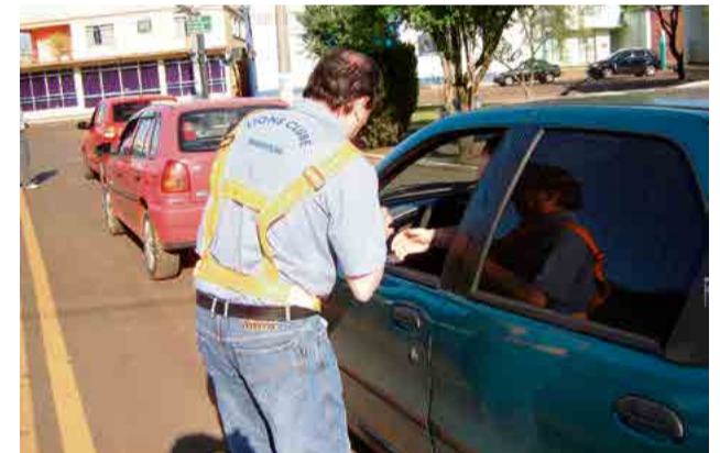
Campanha de trânsito

Os membros do Lions Clube fazem parte de diversos conselhos, cumprindo seu papel de liderança e auxiliando no cumprimento das políticas públicas. Assim, nos últimos 50 anos o clube presta serviços voluntários com o apoio da comunidade maravilhense.