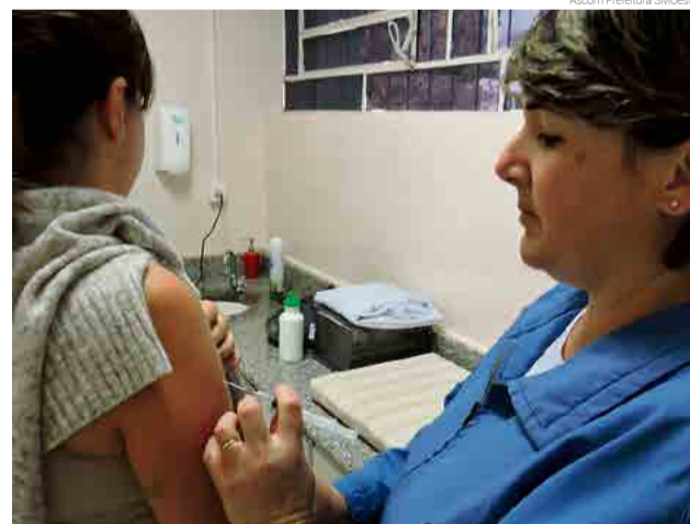
Cerca de 500 doses foram aplicadas no sábado (12), Dia D da Campanha

necessidade da documentação pessoal para fazer a vacinação. Quem tiver com febre ou usando antibiótico, deve aguardar para fazer a vacina em alguns dias.