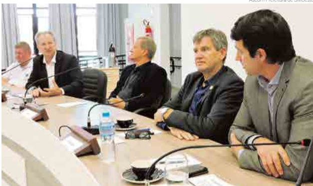
Ministro interino destacou a importância de Santa Catarina para o agronegócio brasileiro