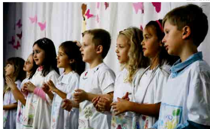
Ederson Abi/O Líder