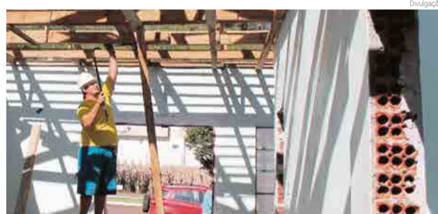
Obra deve ficar pronta em três ou quatro meses

A Secretaria de Agricultura de Flor do Sertão está sendo reformada. Segundo o prefeito, Sidnei Willinghöfer, será feita a troca do telhado, esquadrias, forro, piso e aberturas, além de melhorias na instalação elétrica. A previsão é de que a obra seja entregue em três ou quatro meses e o investimento será de R$ 100 mil, com recursos próprios do município. Além da reforma estrutural, a obra prevê adequação de acessibilidade.