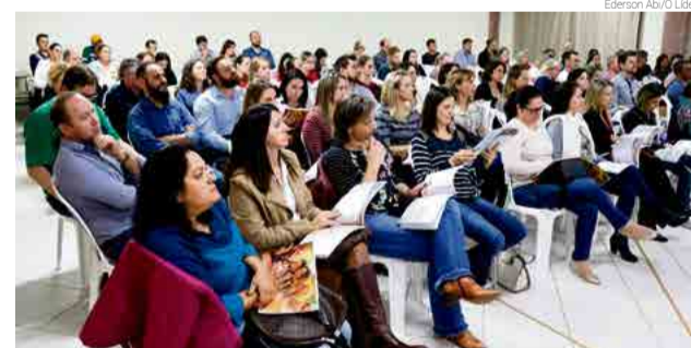
Projeto lotou auditório da escola com pais e alunos

De acordo com a escola, os alunos participam do projeto desde o início do ano, com material disponibilizado pelo escritor Augusto Cury. O objetivo é trabalhar os valores e outros ensinamentos, integrando pais, alunos e escola. O tema do primeiro encontro com os pais foi "Vida em família", que terá o próximo evento no dia 19 de junho, também na escola.