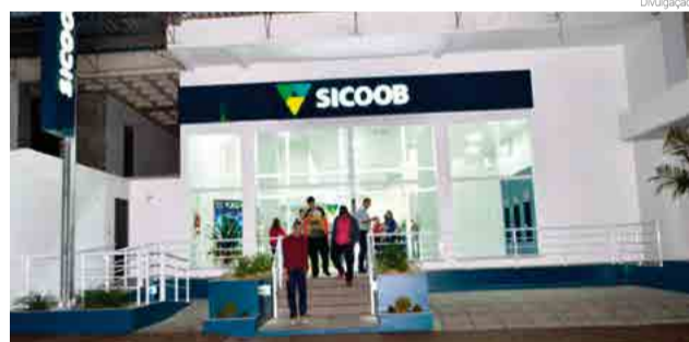
Agência de São José do Cedro possui mais de quatro mil associados e representa, em média, mais de 8% do volume de negócios da cooperativa