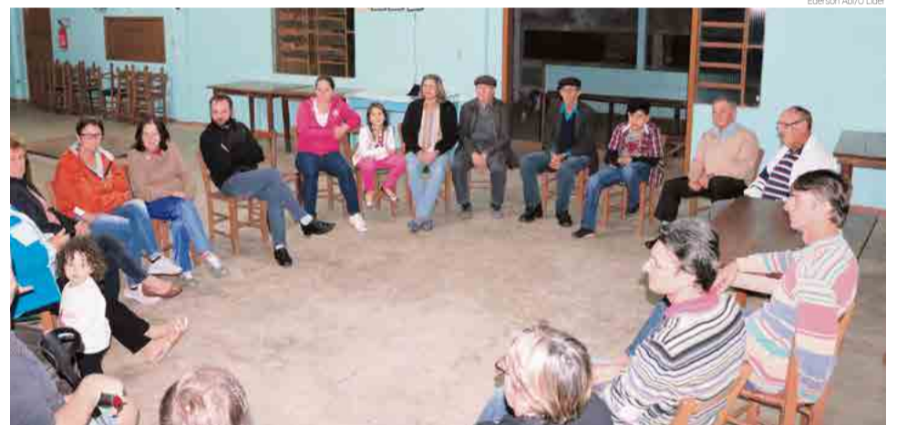
Sala de Situação se reuniu com moradores do Bairro União, nesta semana, para reforçar o trabalho de hoje (19)

Segundo o coordenador, atualmente Maravilha tem 92 focos do mosquito transmissor da dengue, chikungunya e zika. Balestreri avalia que o número diminuiu em relação ao ano passado, porém ainda está alto. "Nosso objetivo daqui a cin-