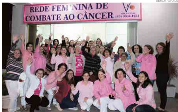
Cerca de 50 mulheres participaram do evento