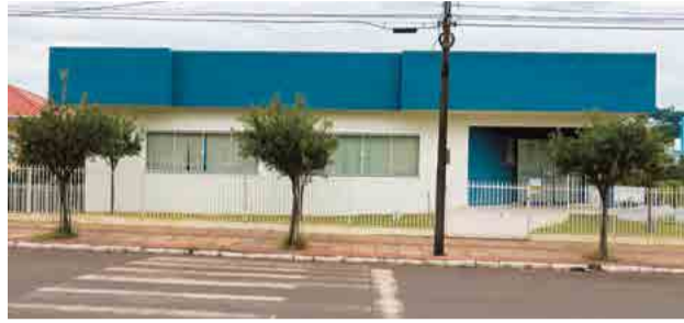
Sede do Clube está localizada na Avenida Presidente Kennedy

nova sede para as reuniões e atividades. O local também contou com doações da comunidade maravilhense.