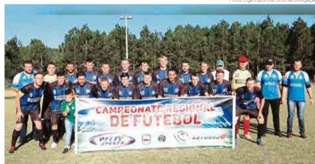
DNA Gaiola Club/DME de Princesa