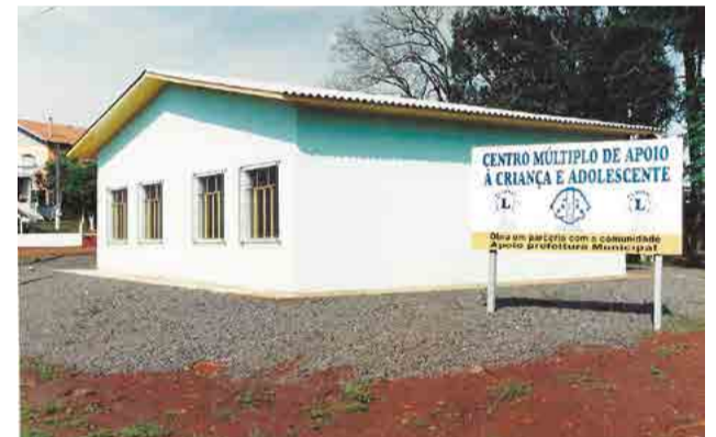
Clube também participou da construção do projeto do Centro Múltiplo de Apoio à Criança e Adolescente