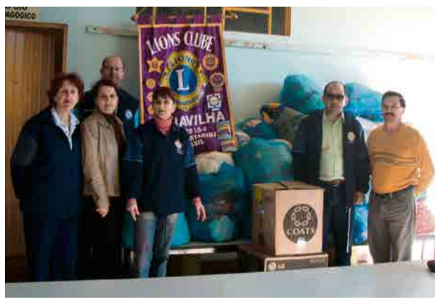
Produtos angariados na Campanha do Agasalho

O Clube apoia a Banda Marcial, o Apadrinhamento Afetivo e a campanha de conscientização sobre o autismo. "Sempre estivemos presentes em campanhas do agasalho, de trânsito, distribuições de cestas básicas e prestamos auxílio a pessoas com necessidades especiais, além de atividades junto ao Hospital São José, onde pos-