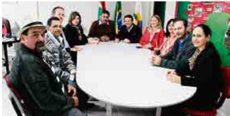
Convênio foi assinado com repasse do Governo do Estado