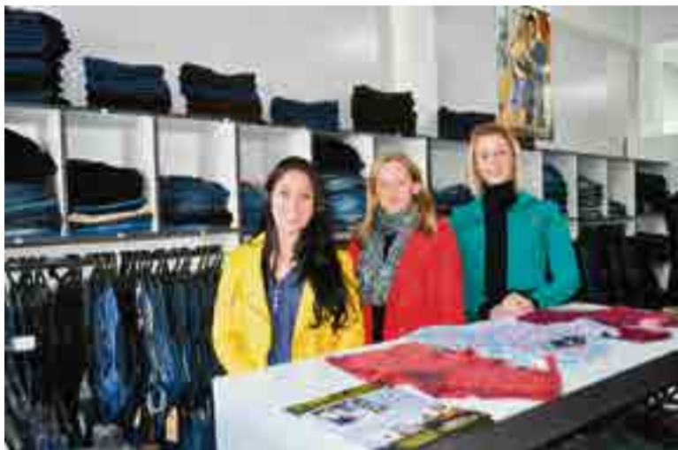
Três colaboradoras estão à disposição nos atendimentos aos consumidores

"Toda a semana estaremos recebendo novidades. Trabalhamos sempre com as novas coleções das marcas", afirmou. Sobre os pagamentos, o proprietário afirmou que a Rei do Jeans aceita pagamento em até três vezes no cartão de crédito. "Trabalhamos com pagamentos à vista ou, ainda, em até três vezes no cartão de crédito. Teremos um horário diferenciado aos nossos consumidores. A Rei do Jeans trabalhará das 9h às 12h e das 13h30 às 18h30", ressaltou.