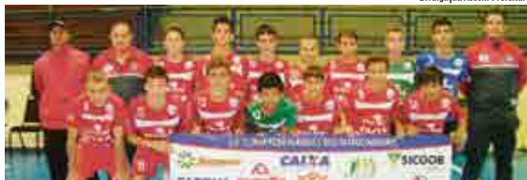
Time da Morada do Verde demonstrou esforço e determinação que resultou na garantia para a próxima etapa da competição