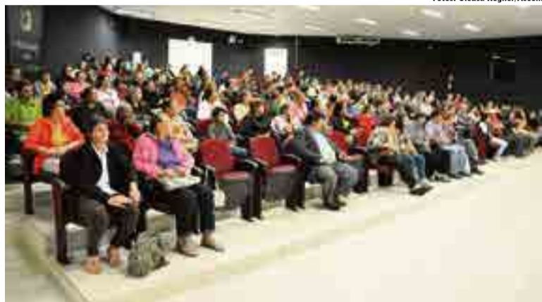
Beneficiados receberam informações sobre o andamento do programa