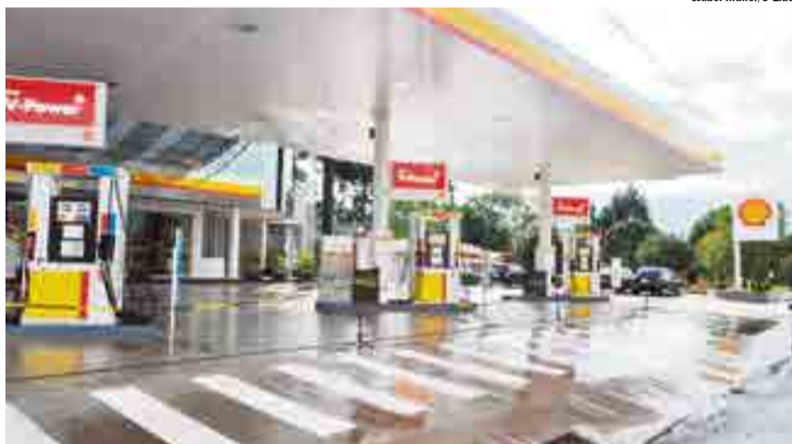
Diamante II está localizado na Avenida Anita Garibaldi