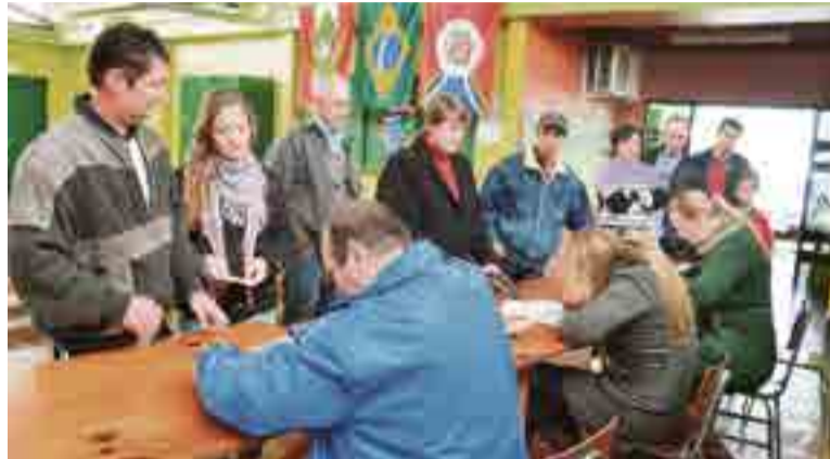
Atendimentos se direcionaram à emissão de documentos