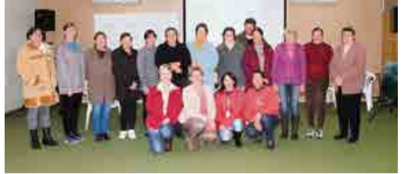
Representantes do grupo familiar puderam adquirir conhecimento sobre o projeto, além de participar de palestra sobre embelezamento das moradias