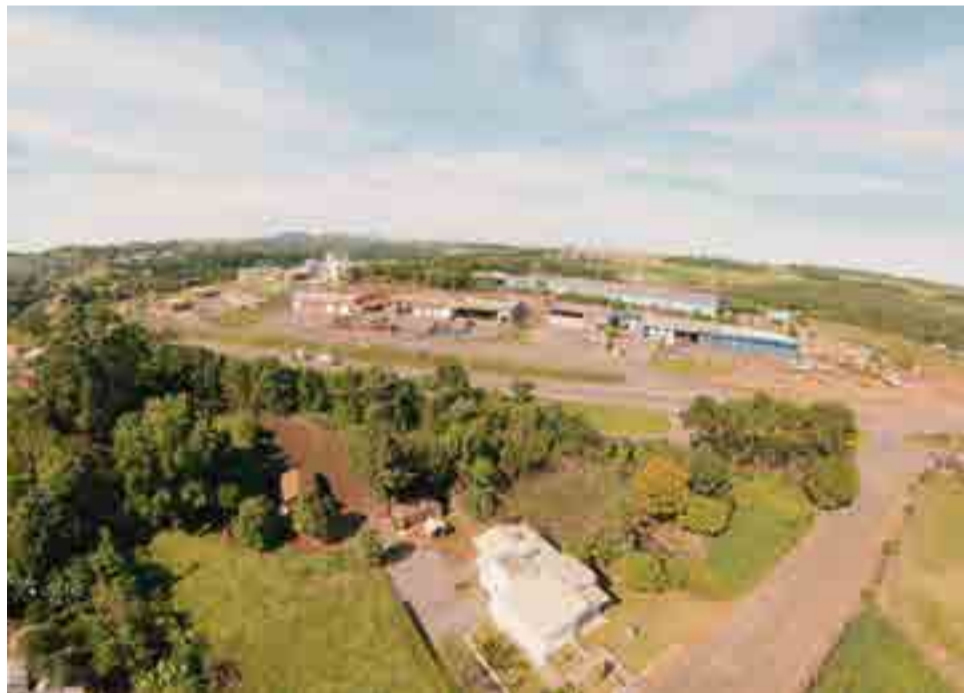
Fotos proporcionam ângulos e perspectivas diferentes

Conforme a empresa, em breve estarão operando com a possibilidade de ver tudo o que a câmera capta do alto, sendo que essa tecnologia irá somar para o desenvolvimento da região.