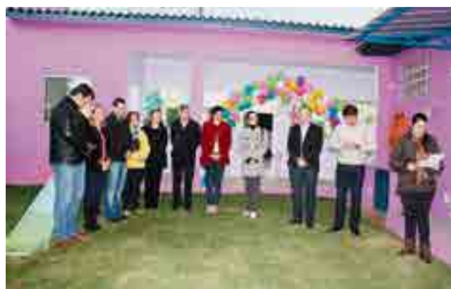
Autoridades e lideranças acompanharam solenidade