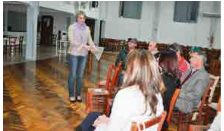
Deputada Luciane Carminatti prestou contas aos maravilhenses sobre seu primeiro mandato