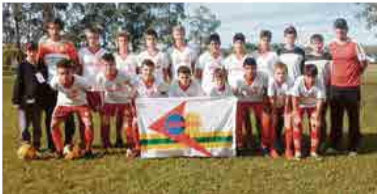
Equipe sub-14 conquistou o 3º lugar

No campeonato deste ano o Genoma Colorado de Maravilha teve um bom desempenho. A categoria sub-12 conquistou o 2º lugar, com três vitórias, um empate e uma derrota. A campanha teve 14 gols marcados e apenas dois sofridos. Essa mesma