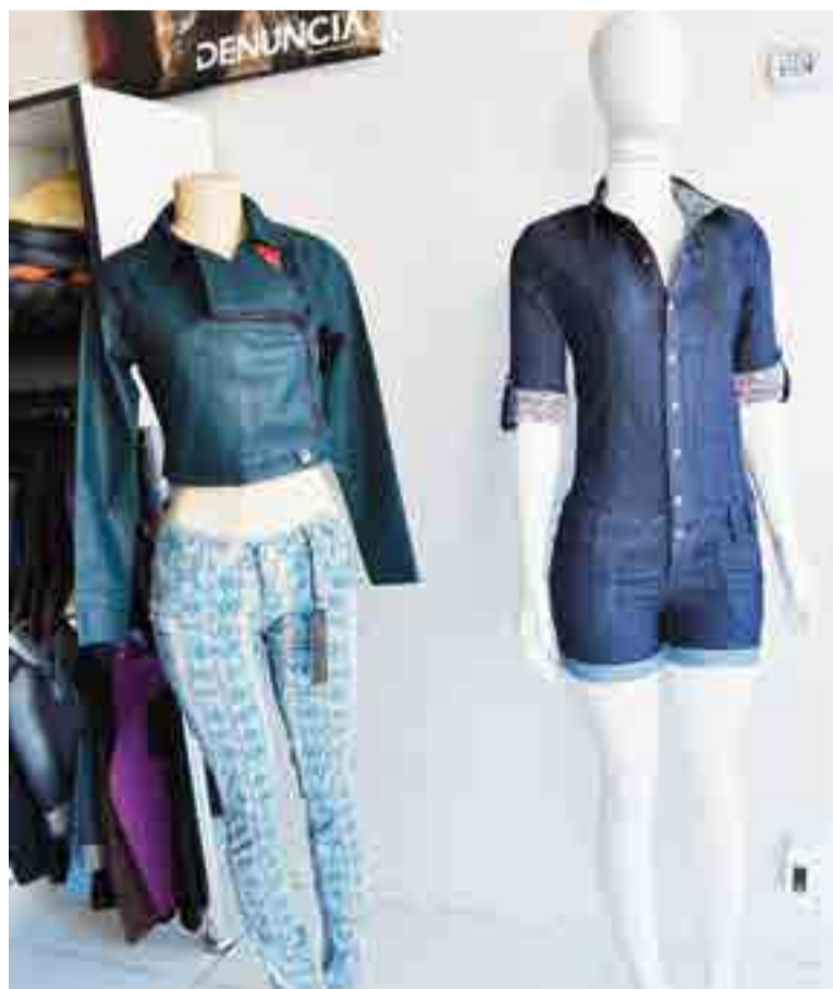
Peças variadas em jeans são comercializadas

Rei do Jeans está localizada na Rua Prefeito Albino Cerutti Cella, 101, Centro - em frente ao terminal rodoviário de Maravilha. "Estamos aguardando a presença de todos", finalizou o proprietário