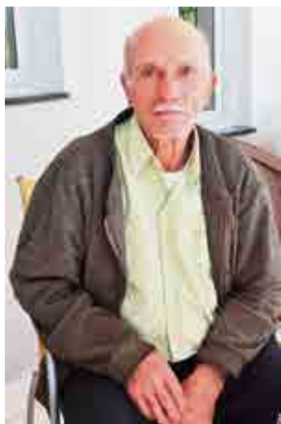
Isabel Müller/O Líder