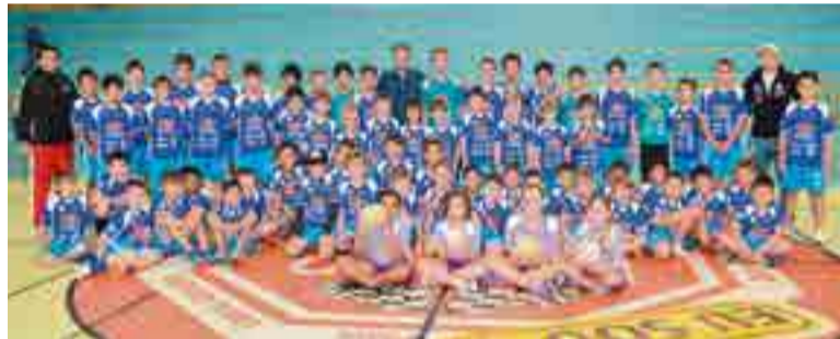
Cada atleta recebeu uma camiseta e um calção