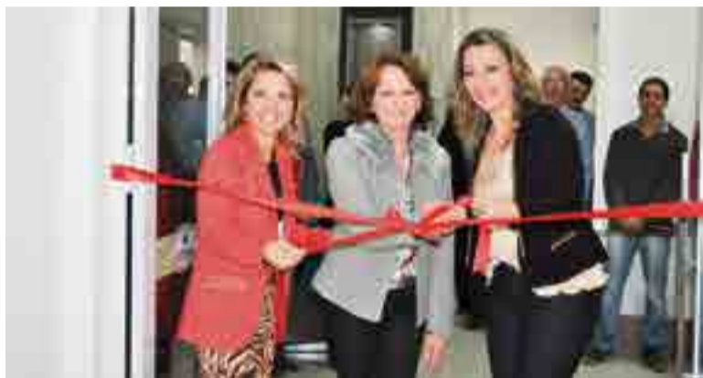
Sócias-proprietárias fizeram o descerramento da fita inaugural