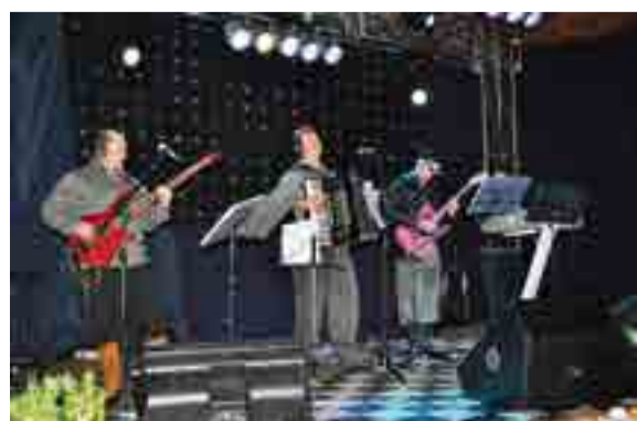
Grupo Harmonia Fandangueira seguiu com o baile