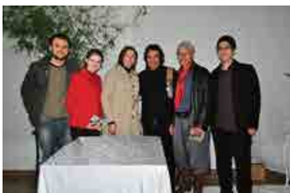
Idealizadores dos shows tradicionalistas em Maravilha