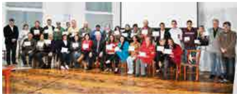
Cerca de 40 novas filiações foram feitas