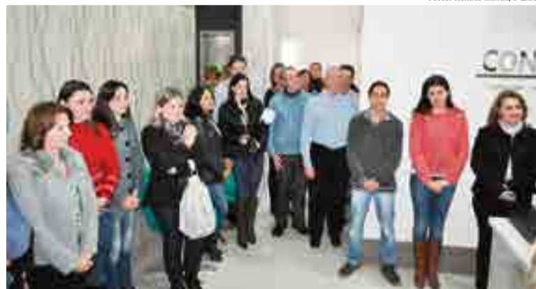
Autoridades, colaboradores, clientes e amigos prestigiaram o ato