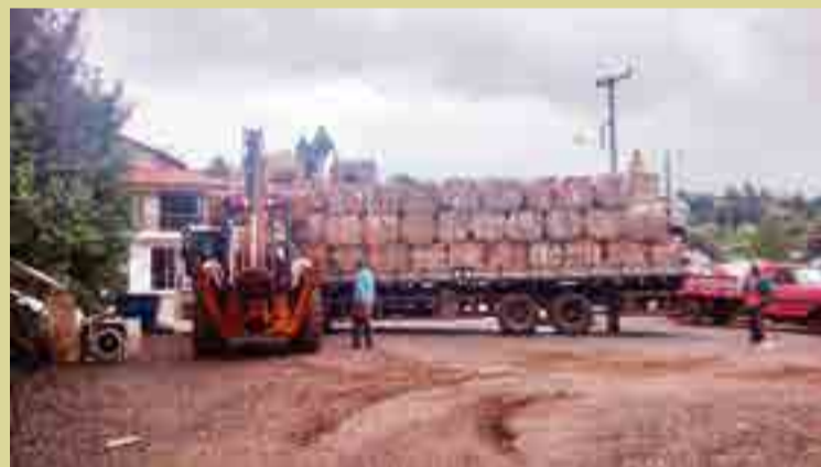
Uma das maiores cargas recolhidas pelo Projeto Reciclar

sar de fazerem parte de uma associação, não têm a mentalidade do trabalho em grupo. Muitos ainda acham que são autônomos, então cada um tem o seu ponto. "Eles não imaginam a importância que têm e do trabalho que desenvolvem. Imagina Maravilha sem essas pessoas, sem o trabalho, se por mês eles retiram das ruas toneladas de materiais recicláveis? Para onde iria todo esse material sem a associação? Nós da coordenação estamos aqui para ajudar essas pessoas a aprender a trabalhar o coletivo, eles são agentes habitacionais e pessoas humildes".