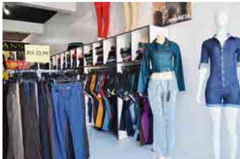
Preços variam de R$ 22,99 a R$ 89,99