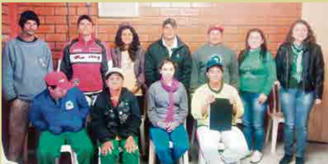
Coletores do projeto fazem a sua própria renda

Não recolhe: vidro, madeira, borracha, pneus, isopor e lâmpadas fluorescentes.