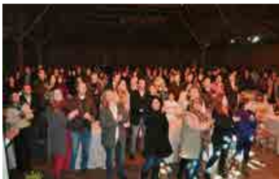
Grande público prestigiou o evento