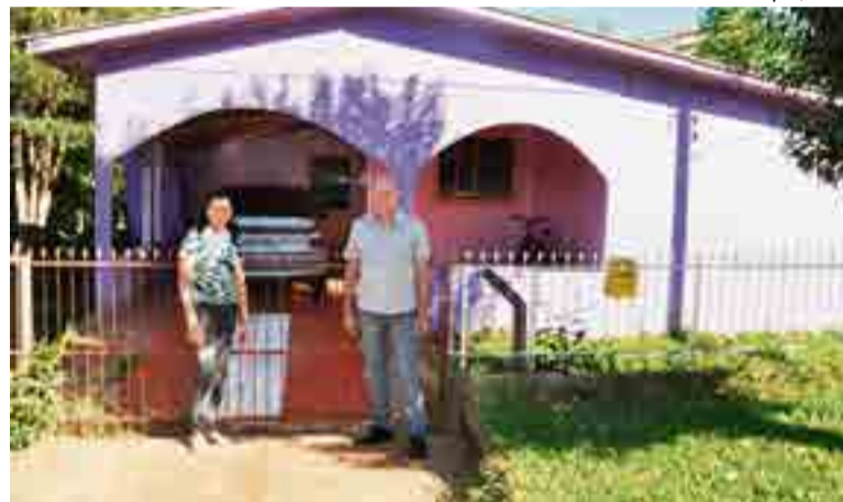
Descaso com a consumidora foi evidenciado na edição de fevereiro do jornal O Líder