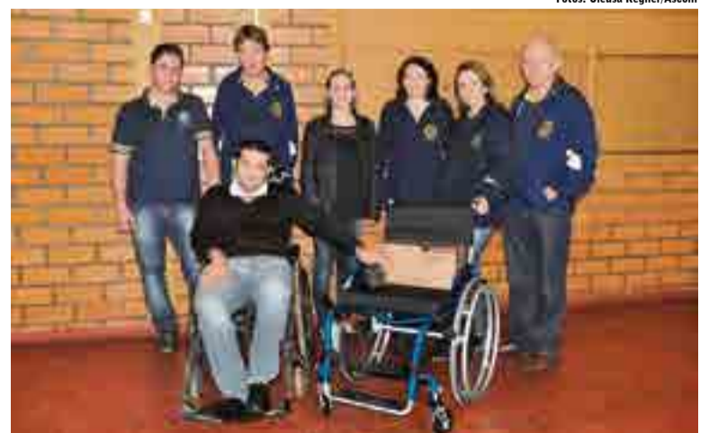
Integrantes do Rotary Club de Maravilha prestigiaram a entrega em Serra Alta

Até o momento Maravilha já recebeu quatro cadeiras mo-