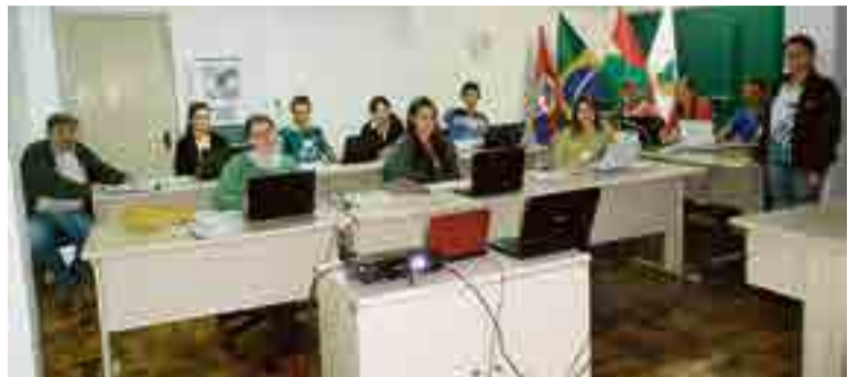
Curso abordou temas da Cidasc