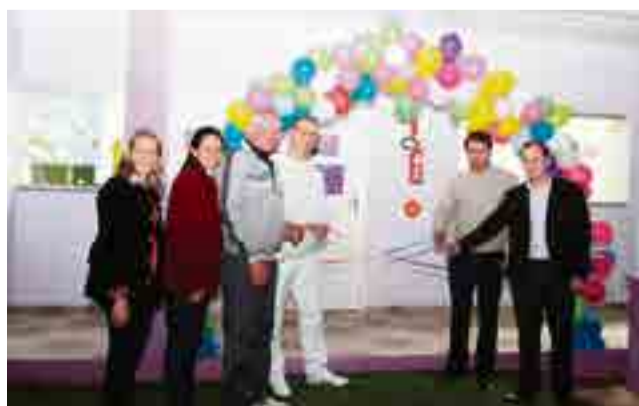
Descerramento da fita marcou ato inaugural