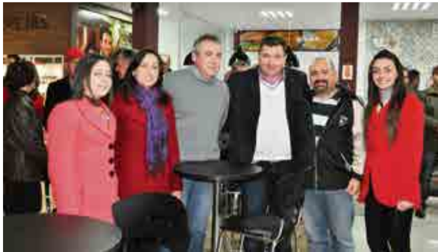
Empresário e sua família, juntamente com os representantes da Shell do Brasil