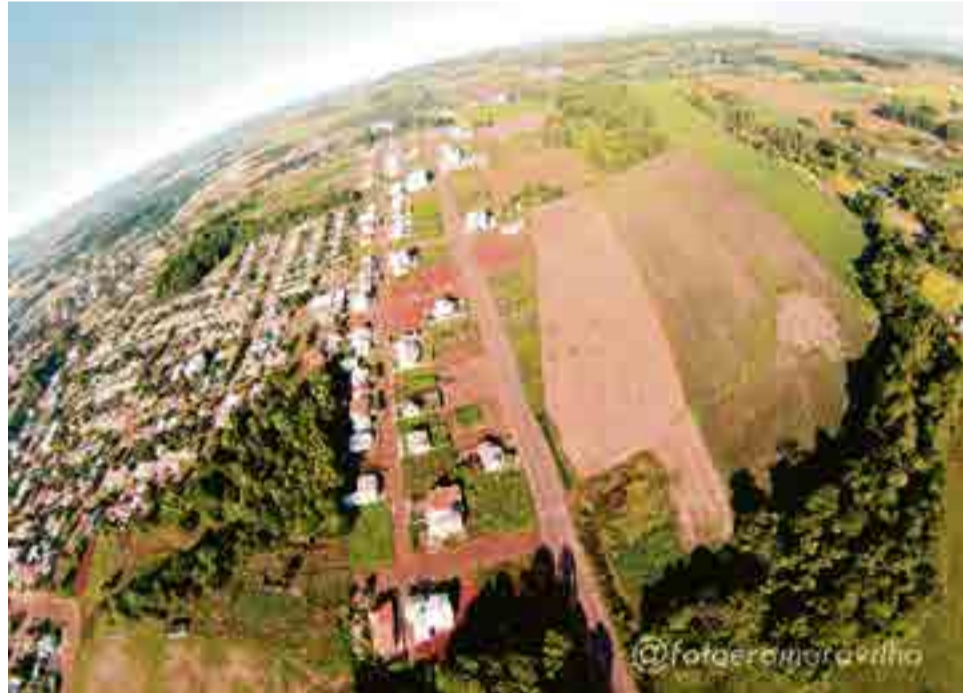
Foto aérea do Loteamento Universitário

Tecnologia de ponta em fotos e filmagens Aéreas