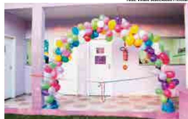
Ambiente mais amplo e confortável proporcionará condições de novas atividades