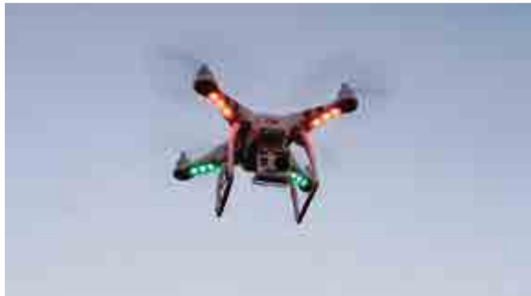
Equipamento de alta tecnologia utilizado para a captura de imagens aéreas

Fotoero Maravilha é uma empresa dedicada a fazer fotos e filmagens aéreas de alta resolução com tecnologia inovadora e novas perspectivas sobre os serviços prestados. Utiliza um equipamento de controle a um custo acessível, se comparado com o custo do serviço executado com aeronaves tripuláveis convencionais. A empresa também associa seus conhecimentos