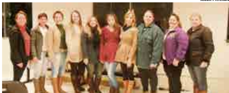
Participaram do curso responsáveis por salões de beleza do município