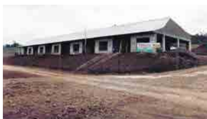
Primeiro bloco construído da universidade