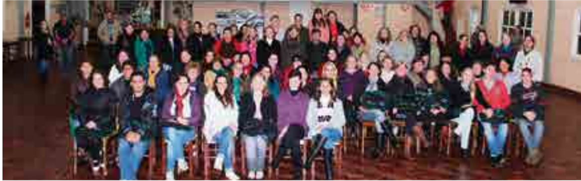
Municípios celebraram a confirmação das capacitações que tem por objetivo aperfeiçoar para o mercado de trabalho