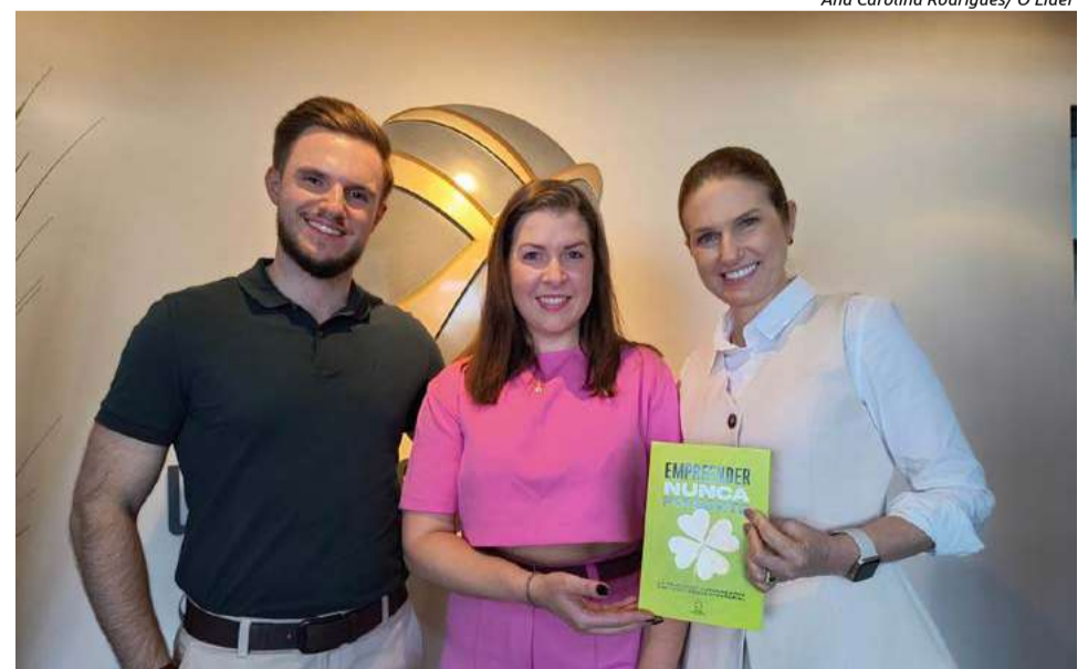
Direção recebeu a mentora nas instalações da Líder FM