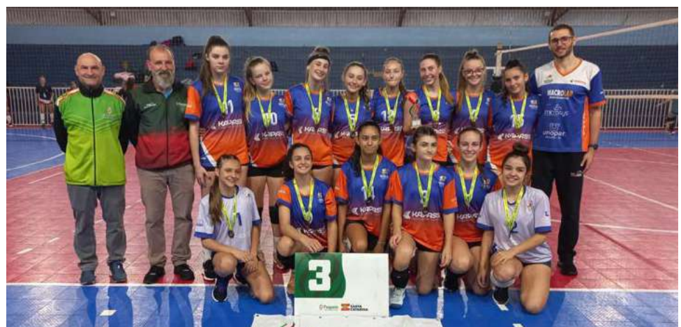
Equipe feminina conquistou o principal objetivo, que era a vaga para a fase regional