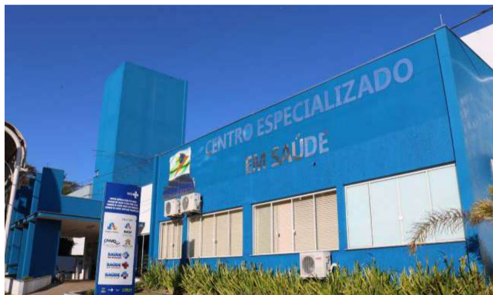
Sala de Vacinas fica localizada no Centro Especializado em Saúde

Conforme a SES, a proteção só ocorre de duas a três semanas após a aplicação da dose, por isso é importante se vacinar o quanto antes, evitando casos graves, hospitalizações e mortes por gripe.