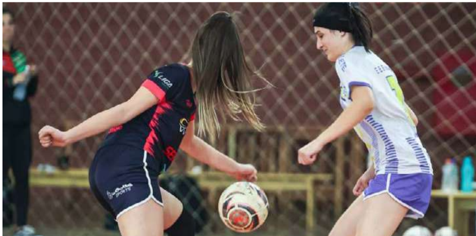
Os jogos serão realizados até o dia 3 de junho

Além disso, os jogos contam com a participação de escolas maravilhenses e escolas de municípios vizinhos, como Pinhalzinho, Flor do Sertão, Tigrinhos, Romelândia, Serra Alta, Bom Jesus do Oeste, Saltinho, Saudades e Santa Terezinha do Progresso.