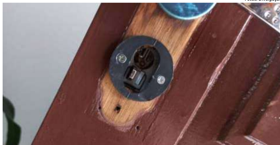
Fechadura estava danificada