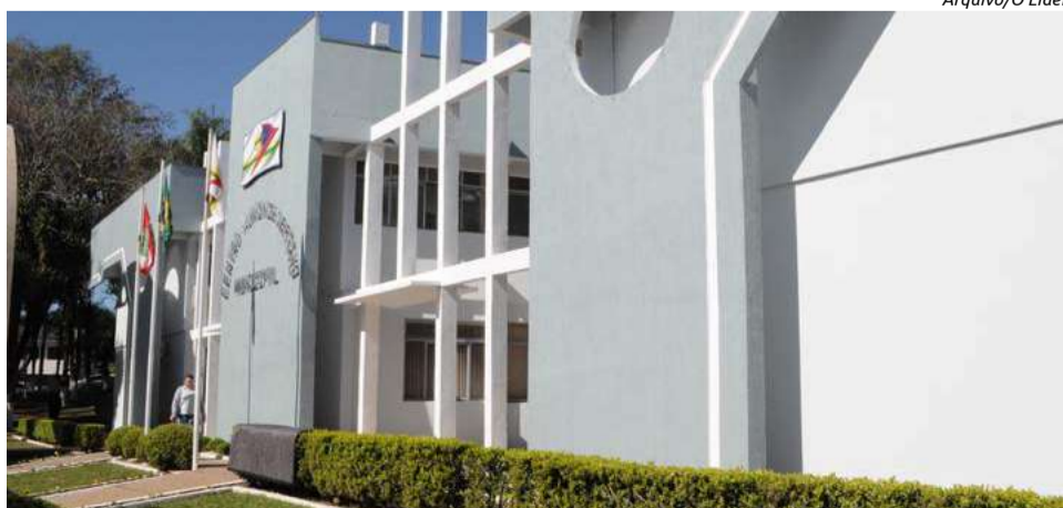
Processo seletivo é destinado ao provimento de vagas e formação de cadastro reserva