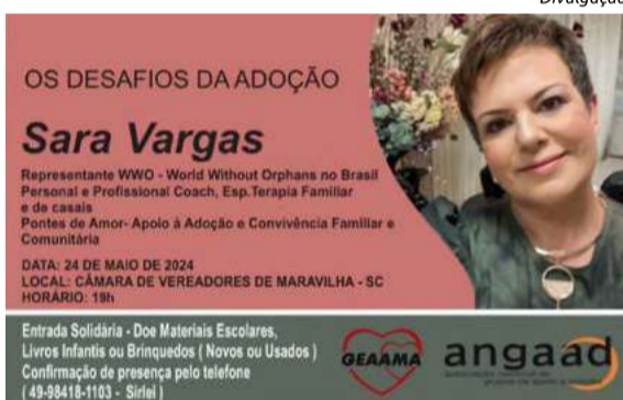
A palestra é promovida pelo GEAAMA de Maravilha