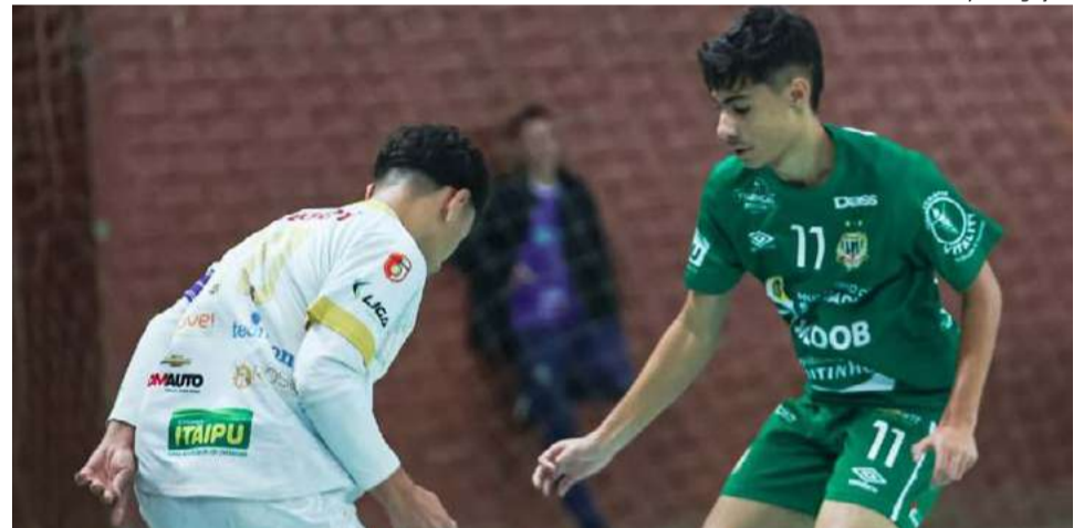
Período de competição do futsal foi do dia 20 a 23 de maio