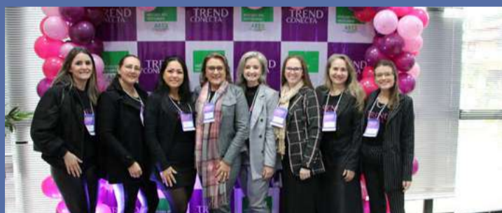
Na segunda-feira, 20, aconteceu na CDL e Associação Empresarial de Maravilha a 2ª edição do TREND CONECTA, organizado pelo Núcleo do Vestuário e conhecido como o maior evento do Oeste Catarinense.

Em Maravilha, o NJE, está realizando a conscientização através das redes sociais do núcleo, com a postagem de conteúdos que facilitem o entendimento da população sobre os impostos que ela mesmo paga. Os temas escolhidos para serem abordados foram "O que é o feirão do imposto?"; "Tipos de imposto"; "A importância do imposto"; "Diferença entre imposto, tributos e taxas"; e "Imposto de Pessoa Física". Para concluir essas ações, neste sábado, 25, os nucleados realizarão o "DIA D", expondo o "impostômetro" em espaços públicos para conscientizar as pessoas que passarem pelos locais.