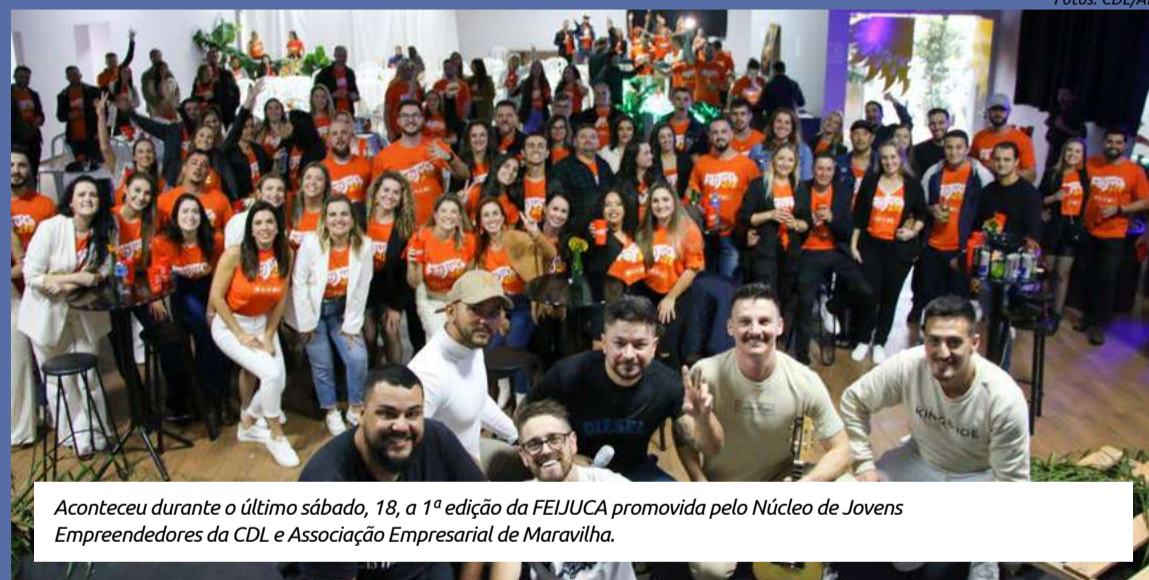
Aconteceu durante o último sábado, 18, a 1ª edição da FEIJUCA promovida pelo Núcleo de Jovens Empreendedores da CDL e Associação Empresarial de Maravilha.