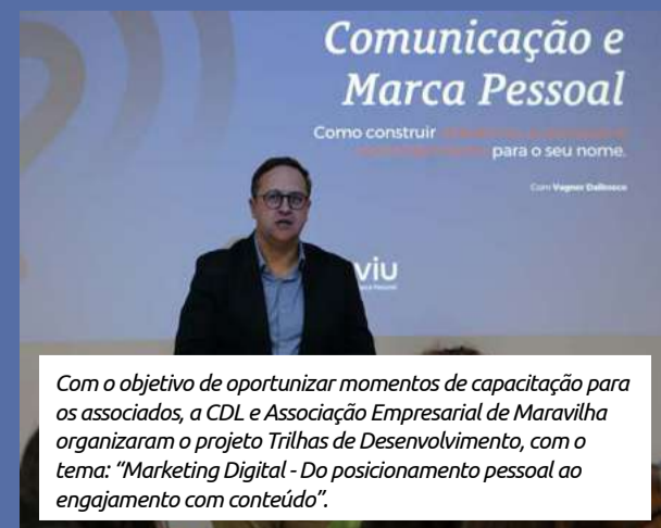
Com o objetivo de oportunizar momentos de capacitação para os associados, a CDL e Associação Empresarial de Maravilha organizaram o projeto Trilhas de Desenvolvimento, com o tema: "Marketing Digital - Do posicionamento pessoal ao engajamento com conteúdo".