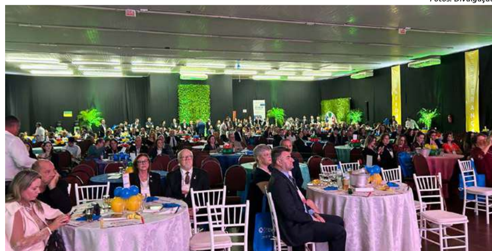
A Conferência da Alegria, da Esperança e da Gratidão