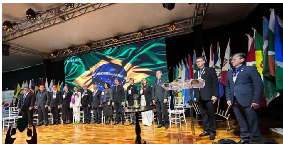
Autoridades municipais prestigiaram o evento

A programação contou palestras motivacionais e sobre saúde mental, além de shows humorísticos, apresentações, debates, homenagens ao governador e demais membros, plantio de árvores e baile temático.