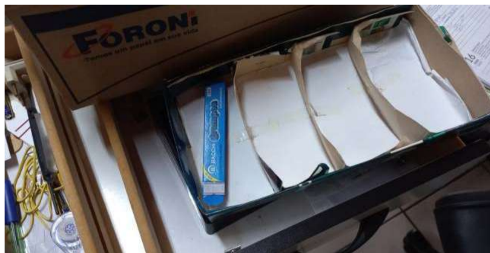
PM foi acionada na manhã de segunda-feira (20)

Igreja Luterana em Maravilha. A mulher que percebeu os danos na fechadura acionou a Polícia Militar de Maravilha para registrar o furto.