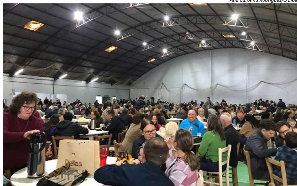
Neste ano, cerca de 900 almoços foram servidos

A programação também contou com atividades especiais, como pescaria e a exposição de livros infantis, além da venda de brigadeiros pelos jovens da Igreja.