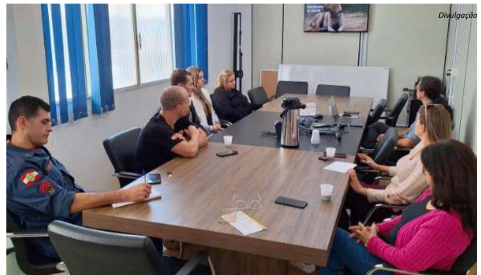
Aconteceu na última terça-feira (21) uma reunião com o Setor do Meio Ambiente e Bem-Estar Animal, ONG Ame Bicho, Corpo de Bombeiros, Polícia Civil, Cidasc e Setor do Planejamento

A programação acontecerá no Setor de Meio Ambiente e Bem-Estar Animal, ao lado do CDL e AE de Maravilha. Com início às 8h30 e término às 16h. Além disso, conta com a participação e apoio da ONG Ame Bicho, com o brechó.