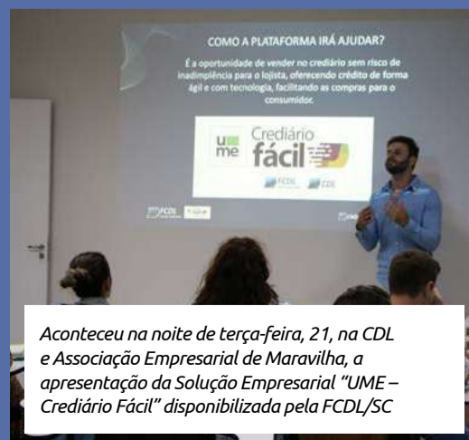
Aconteceu na noite de terça-feira, 21, na CDL e Associação Empresarial de Maravilha, a apresentação da Solução Empresarial "UME – Credíário Fácil" disponibilizada pela FCDL/SC