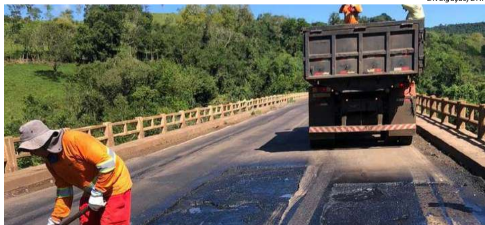
Neste ano, serão destinados cerca de R$ 80 milhões para este contrato

em 2024, iniciando os trabalhos pelo trecho de Pinhalzinho, da BR-282.