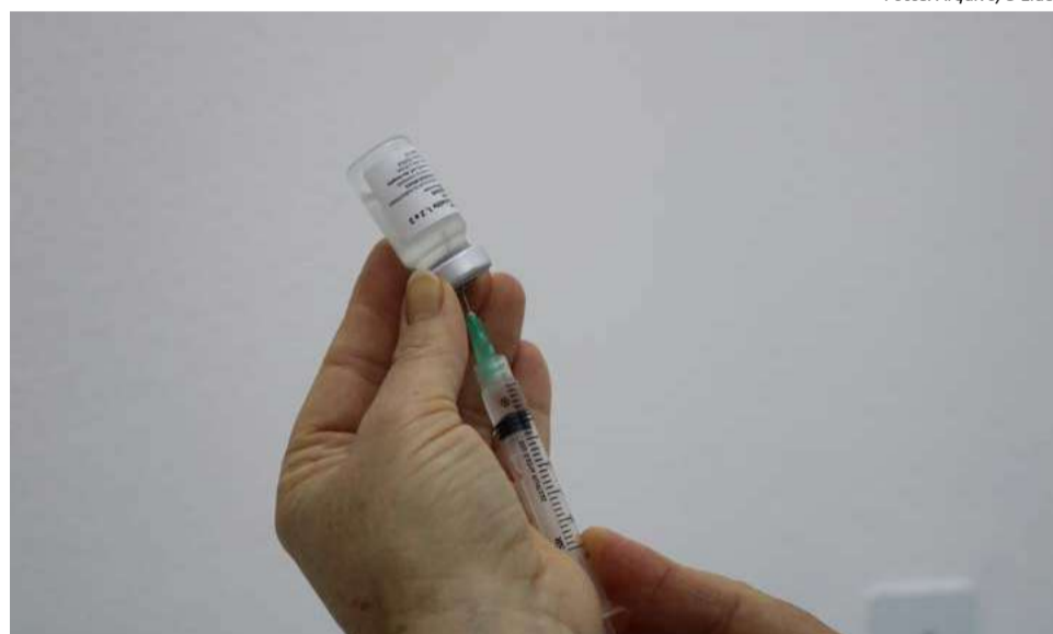
Vacina é voltada para toda a população acima de seis meses