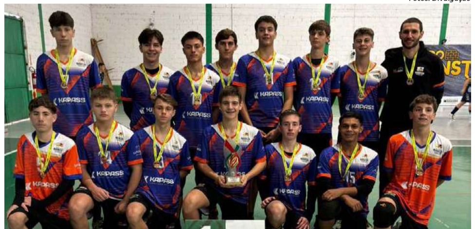
A equipe masculina conquistou o título de forma invicta