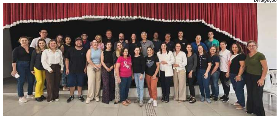
Encontro contou com diversas lideranças e representantes