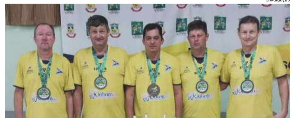
Cinco atletas participaram da competição

reuniu 20 equipes e 115 atletas, destacando-se pelo alto nível técnico e jogos emocionantes. “Um agradecimento especial à Federação de Bocha Rafa Vollo de Santa Catarina (FEBOSC) e às cidades de Salto Veloso e Arroio Trinta pelo apoio e organização do evento”, destacam os participantes e equipe técnica.