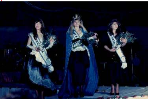
Primeira rainha e princesas do concurso, em 1987