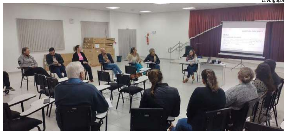
No encontro, foram definidas quatro diretrizes

4. Garantia de que todos os projetos inscritos e contemplados no Edital realizem pelo menos uma ação cultural em áreas periféricas, atendendo ao critério de vinte por cento dos recursos destinados a essas áreas.