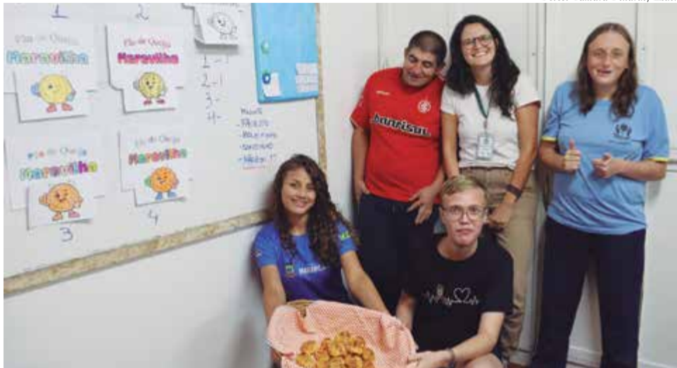
A marca do produto foi criada do zero com os alunos