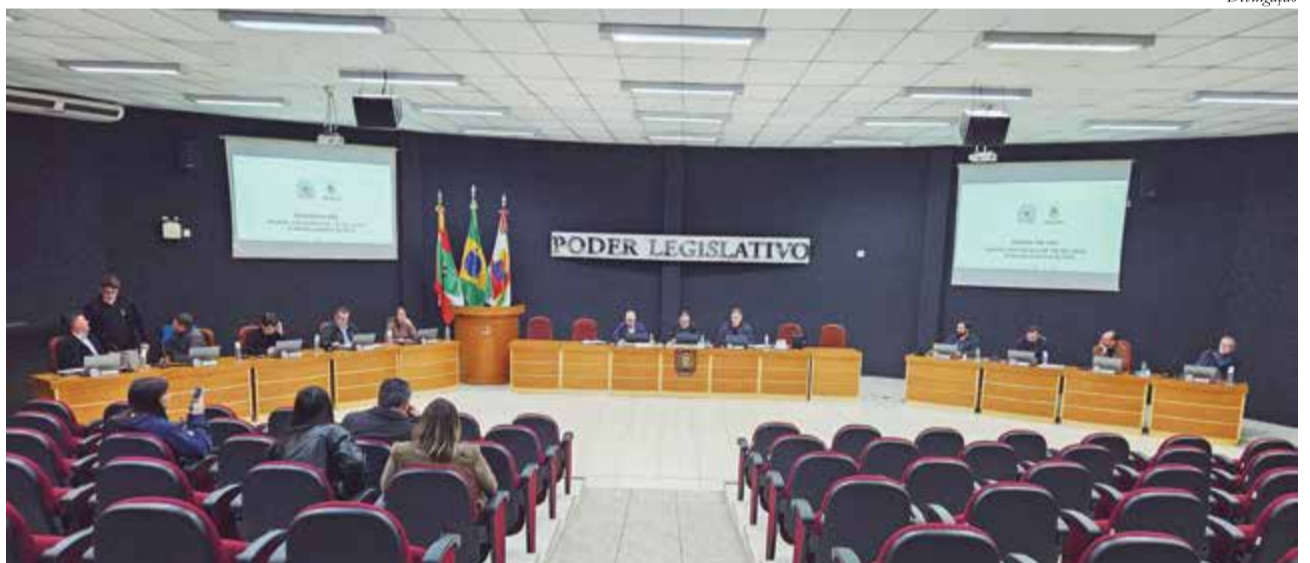
Sessão ordinária de 18/05