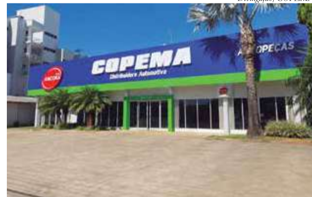
Empresa é reconhecida pela tradição e inovação em autopeças