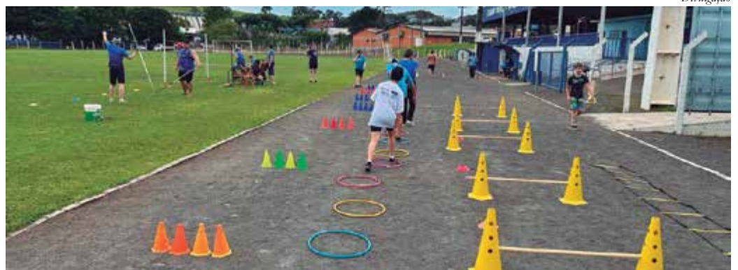
Atualmente, os treinamentos do Centro de Referência acontecem em diferentes espaços esportivos do município, de acordo com as características de cada modalidade. Um destes locais é o Tomatão

Já o Município de Maravilha, por meio da pasta do esporte, é responsável pela coordenação prática do projeto, disponibilização da estrutura física, ampliação da equipe de profissionais, apoio complementar com materiais esportivos e custeio das despesas relacionadas às competições, eventos e participação esportiva dos atletas - a exceção é o Festival Paralímpico, ação promovida diretamente pelo CPB em parceria com os Centros de Referência do Brasil.