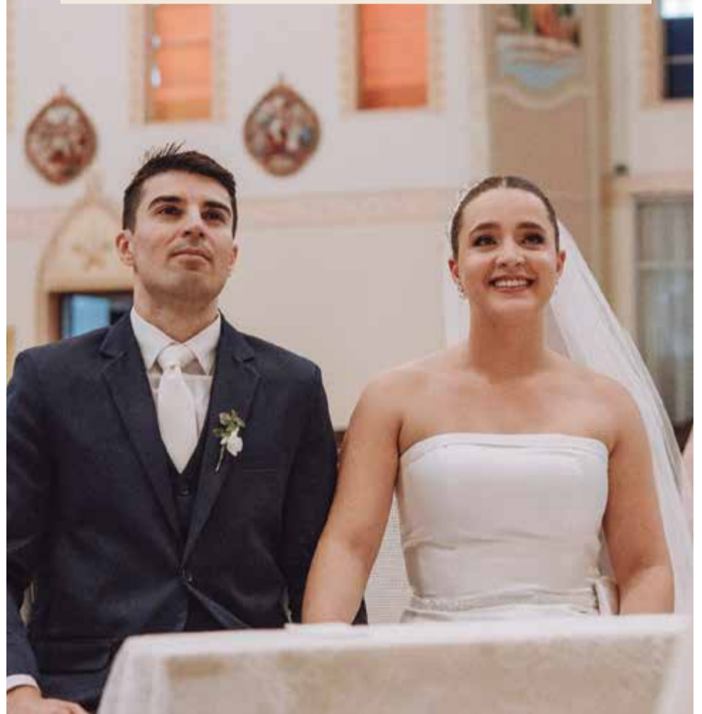
Os recém-casados afirmam que a fé é um dos principais pilares da relação