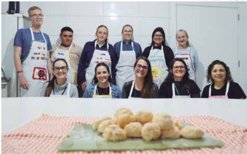
Parte das atividades é desenvolvida na cozinha educativa da Apae