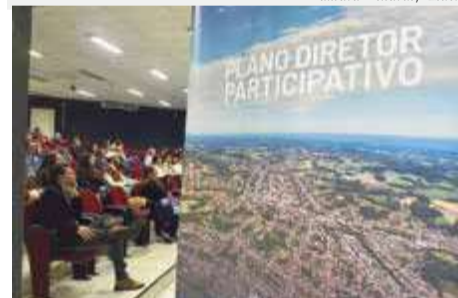
Audiência reuniu mais de 50 pessoas na noite de quarta-feira (27)