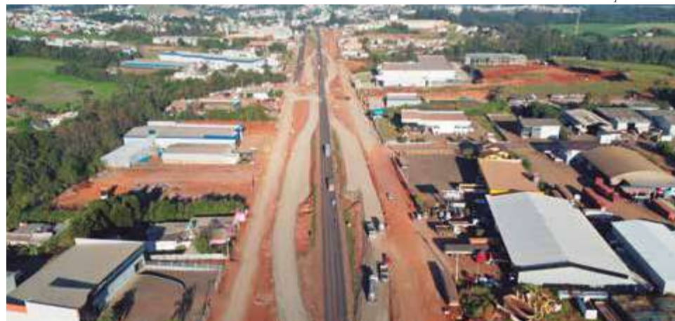
Atualmente, a obra apresenta aproximadamente 25% de execução, aponta DNIT