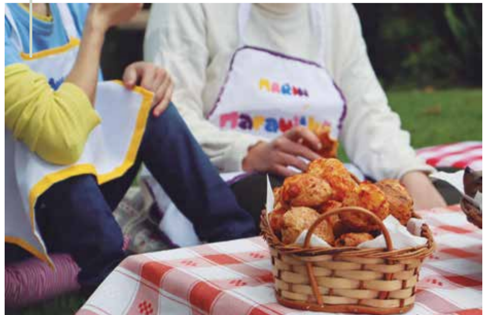
O pão de queijo será comercializado, e a equipe compartilha alguns segredinhos da receita

Durante este mês, os aprendizes visitaram a Chácara Nossa Senhora Aparecida, em Maravilha, onde acompanharam e participaram da colheita de uma das matérias-primas da receita: a batata-doce. A atividade foi encerrada com um piquenique que, é claro, contou com pão de queijo, momentos de descontração e ainda mais entusiasmo dos educandos para iniciar a produção e as vendas.