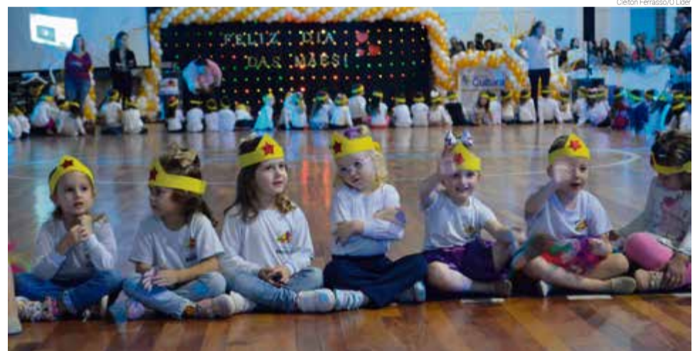
Alunos da rede municipal de ensino fizeram apresentações

A noite cultural em homenagem às mães teve apresentações musicais com violão e acordeom, ginástica rítmica, balé, patinação e dança sênior e ainda reuniu a Banda Marcial Cidade das Crianças e crianças da educação infantil.