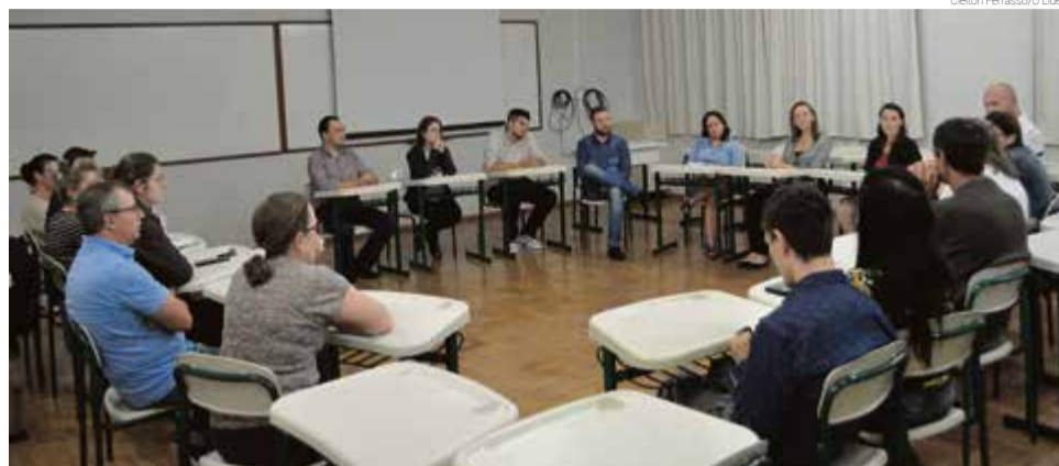
Participantes relataram como é a convivência em casa com autistas

Durante a conversa, os participantes relataram como é a convivência em casa com filhos autistas. Já os psicólogos orientaram sobre a melhor maneira de lidar em al-