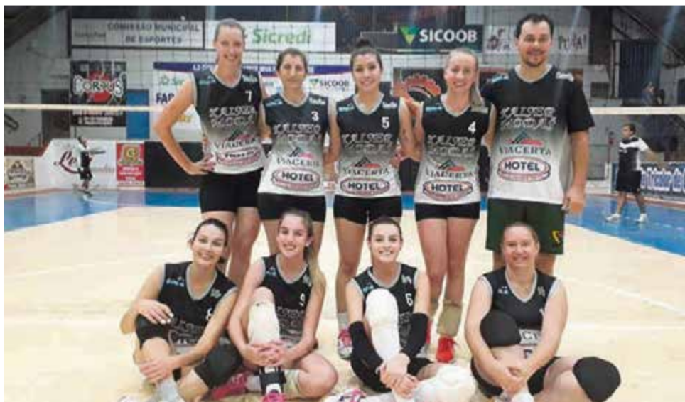
Hoje (18) Feras do Vôlei enfrentam as Gurias do Vôlei

pa, a partir das 14h, Gurias do Vôlei x Feras do Vôlei, Império do Vôlei x Time do Cipó e Vôlei.com x Sicredi.