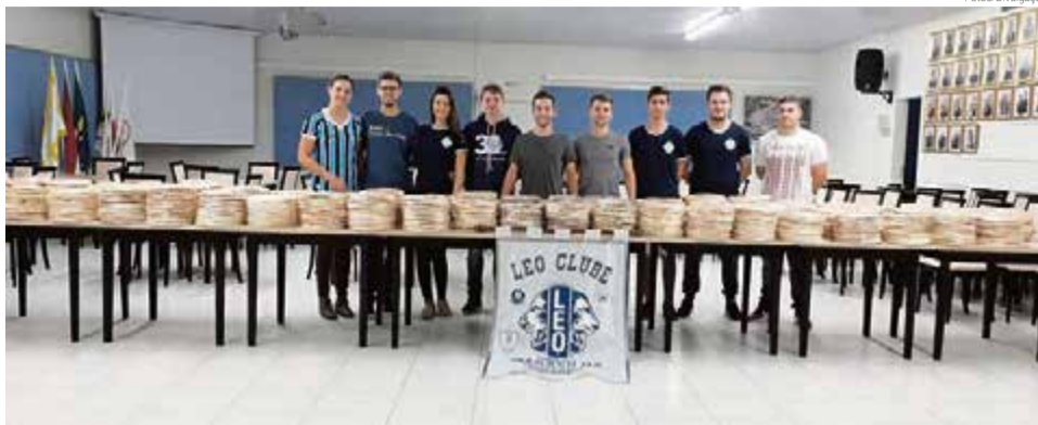
Campanha das pizzas comercializou 1.347 unidades, 100 a mais do que em 2018