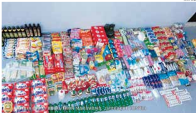
Produtos foram apreendidos pela Polícia Civil e um homem preso

Os policiais civis passaram a realizar diligências investigativas acerca dos fatos e identificaram o suspeito, que já havia sido indiciado por furto, já que foi encontrada em sua residência uma ligação clandestina de água da Casan, e coletaram indícios sobre sua conduta ilícita, assim como de seus comparsas, os quais recebiam os produtos por eles subtraídos.