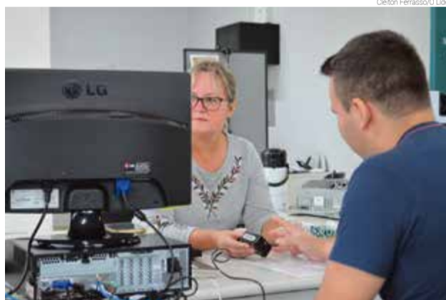
Cadastramento biométrico é obrigatório na 58ª Zona Eleitoral

No último sábado foram 36 atendimentos. Con-