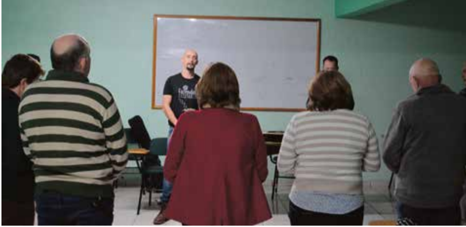
Encontros semanais são realizados em sala do Salão Paroquial