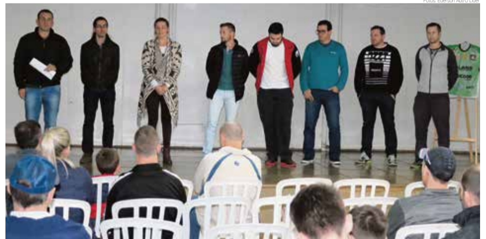
Estiveram presentes patrocinadores, professores e diretoria, eleita no ato