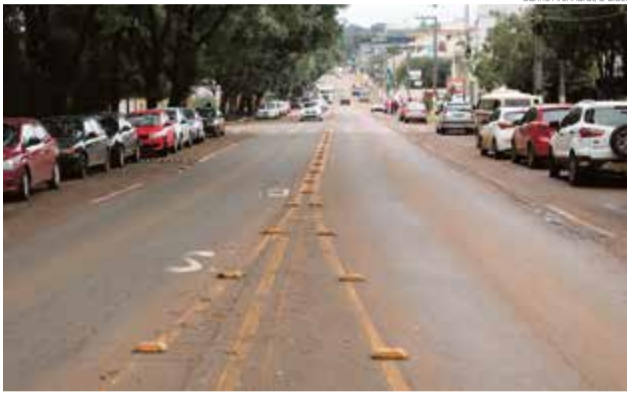
Obra será no trecho entre o trevo a esquina com a Avenida Sul Brasil