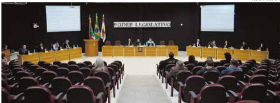
Votação do projeto foi tranquila e sem muita discussão