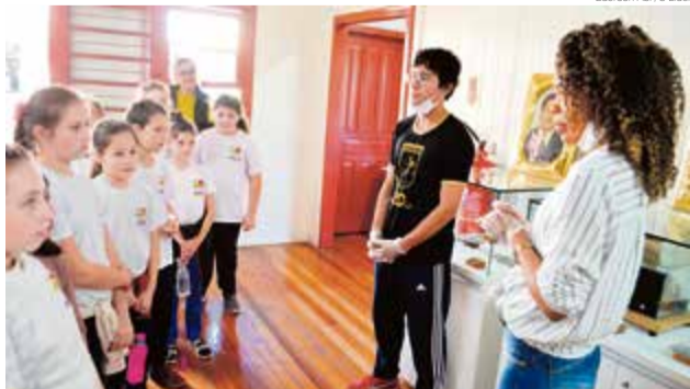
Valquíria e Cavaleiro apresentam exposição para os visitantes em Maravilha