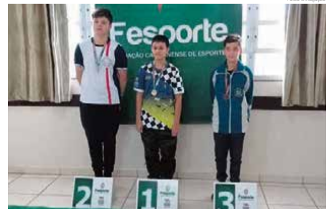
No masculino vai ser com a EEB Nossa Senhora da Salette