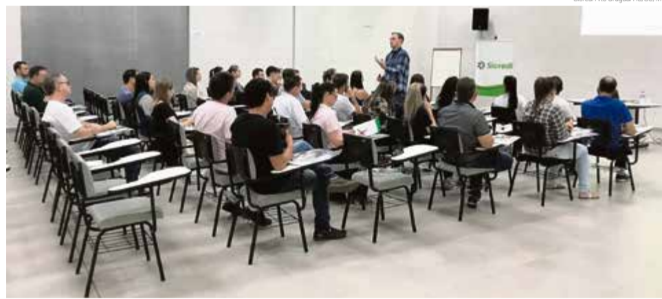
Turmas já iniciaram no município de Maravilha

O programa desenvolvido pela cooperativa tem parceria com a UCEFF de Itapiranga e a URI de Frederico Westphalen, que colaboraram com a elaboração e aplicação dos conteúdos. Em 2018 mais