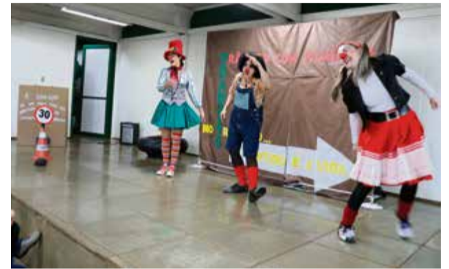
Teatro é apresentado pelas professoras da Contação de Histórias

nhora da Salete e na quarta-feira (22) na Escola de Ensino Fundamental Juscelino Kubitschek de Oliveira.