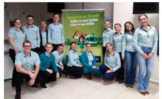
Funcionários foram capacitados para apresentar corretamente o produto

acreditamos que com estas especializações podemos oferecer o produto adequado ao nosso associado, atendendo assim a sua necessidade", finaliza.