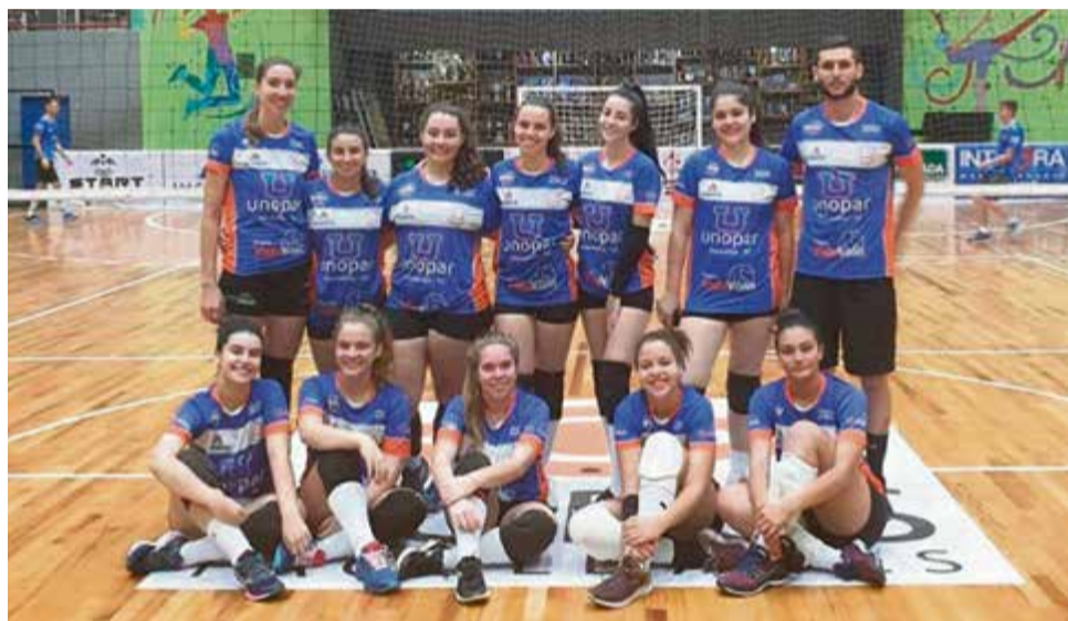
Naipes feminino foi até Pinhalzinho encarar o time da casa