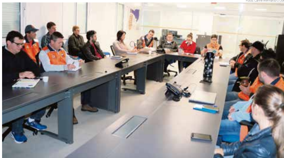
Encontro reuniu coordenador regional e representantes municipais da Defesa Civil

Conforme Cocco, este plano de contingência vai conter um aglomerado de informações sobre o que cada órgão vai fazer em caso de desastres, com atribuições e forma de atendimento de cada ocorrência. "O plano serve como base para um atendimento mais eficaz dos órgãos de segurança e administração pública municipal e estadual. Serve como base para o atendimento, o que cada órgão vai fazer em caso de tais sinistros", reforça.