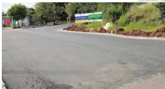
Trecho foi asfaltado nesta semana

ursos para o trecho 1 da pavimentação são de emenda parlamentar do senador Esperidião Amin e o trecho 2 do orçamento municipal. O valor total da obra é de R$ 337.483,15. A equipe ainda deve retornar ao local para concluir a parte de sinalização e pintura da rua.