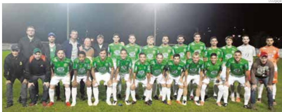
Guarani foi até Águas Frias e trouxe três pontos na bagagem

equipes estão na mesma chave e amanhã (19), às 15h, no Osvaldo Gomes Werner, se enfrentam.