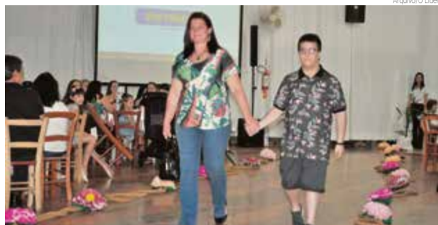
Edição 2018 foi considerada um sucesso

Na oportunidade, também haverá apresentação de vídeo institucional da Apae Marisol. O objetivo é promover um evento inclusivo para os alunos da escola especial. O evento também visa a arrecadação de recursos com a venda das fichas, para investimentos na Apae.