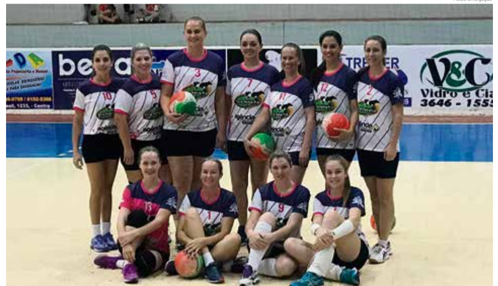
Time do Cipó pega as meninas do Império do Vôlei