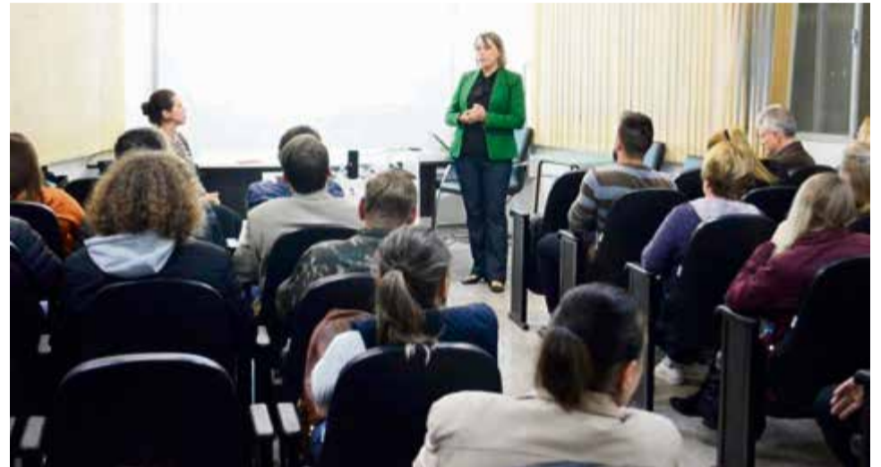
Além de lideranças, agências participaram do encontro sobre turismo