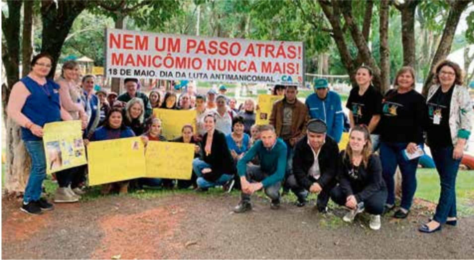
Grupo levou cartazes e uma faixa com a frase "Nenhum passo atrás, manicômio nunca mais"

Conforme a coordenadora do Caps, Solange Bales-