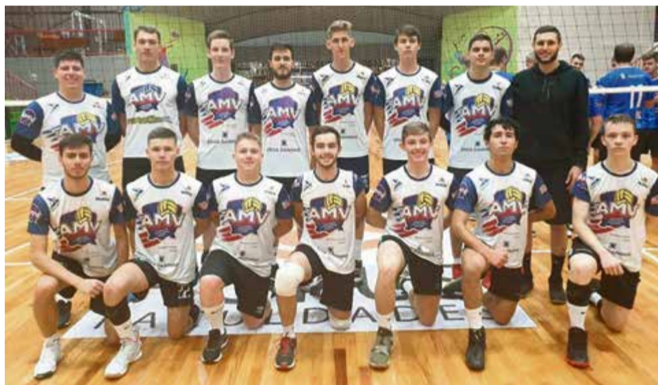
Rapazes perderam em Pinhalzinho em amistoso