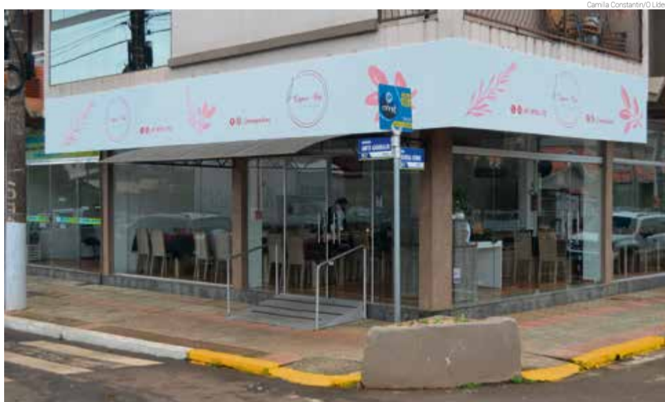
Restaurante fica localizado no Centro de Maravilha