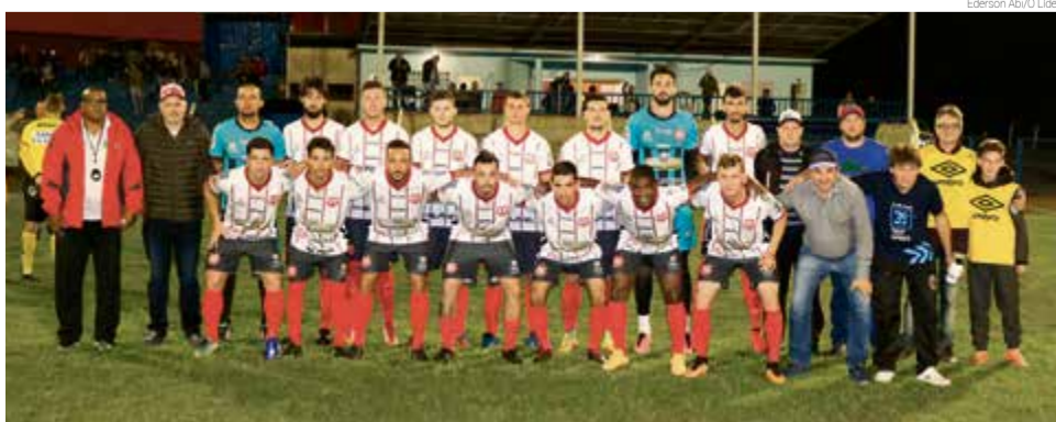
CRM, em casa, perdeu para o Metropol de São Carlos