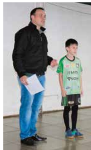
Uniformes foram apresentados

A Escolinha de Futsal Amec foi apresentada oficialmente na noite de quarta-feira (15) em Maravilha. O evento de lançamento foi realizado no Centro Educacional Mundo Infantil