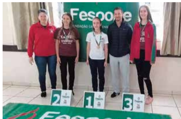
Na categoria feminina, Maravilha estará presente na fase estadual com o Caic

Os primeiros colocados de cada naipe vão participar da fase estadual dos Jesc, que será em agosto, no município de Curitibaanos.