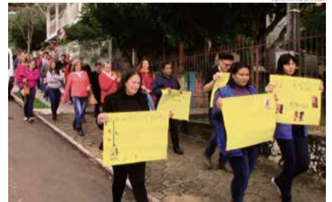
Caminhada foi pelas ruas e avenidas centrais da cidade

Em Maravilha a equipe atende mais de 170 pacientes fixos e tem uma média de 500 a 600 atendimentos por mês. São usuários com diagnóstico de depressão profunda, bipolaridade, esquizofrenia, transtornos permanentes, vícios e dependência química.