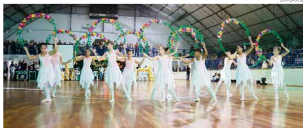
Noite cultural contou com várias apresentações