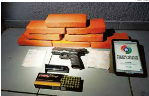
Conforme levantamento, droga seguiria para Palmitos

A guarnição do Pelotão de Patrulhamento Tático (PPT) realizou abordagem em um ônibus e locali-