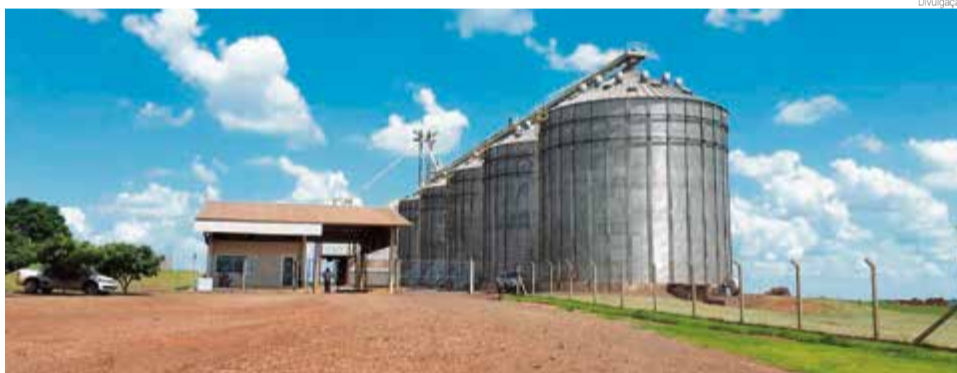
Unidade fica localizada no município de Giruá

A unidade ainda possui uma tuita, um tombador de 10 metros e outro de 18 metros, uma máquina de beneficiamento de cereais, um secador de cereais, um