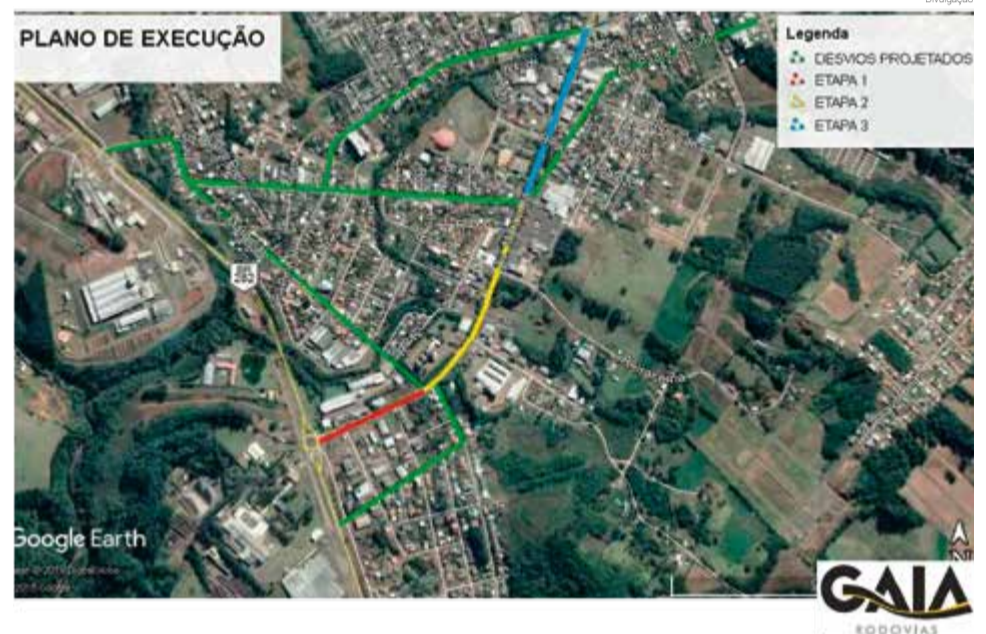
Mapa mostra etapas da obra e desvios traçados para o tráfego de veículos

via, parklets (áreas de lazer em meio às árvores) e calçadas. O investimento é de R$ 4.169.693,70, recurso financiado pelo município. Os testes de carga já foram feitos pela empresa Gaia. O prazo para execução é de 13 meses.