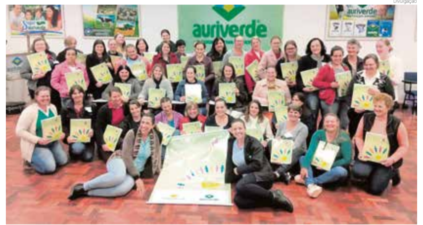
Grupo de mulheres cooperativistas é composto por 43 participantes

Ao todo serão feitos seis módulos de formação, com os seguintes temas: educação cooperativista, desenvolvimento interpessoal e relacionamento familiar, protagonismo feminino e liderança cooperativista, sociedades cooperativas, empreendedorismo cooperativo, organização do quadro social, além de encerramento com solenidade de formatura. Após, as mulheres são convidadas a participar do Núcleo Feminino Auriverde.