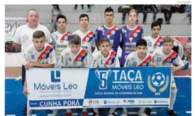
Sub-15 aplicou uma goleada de 10 x 0 na equipe de Riqueza