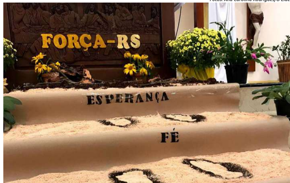
Ao longo da celebração foram feitas orações pelas famílias afetadas no Rio Grande do Sul