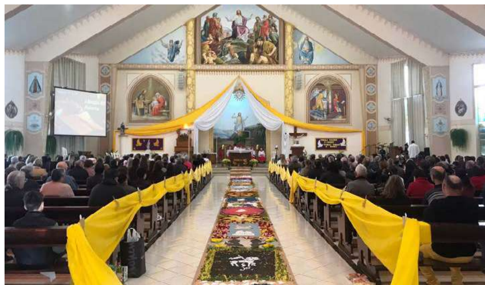
Este ano o tapete decorado foi feito somente dentro da igreja