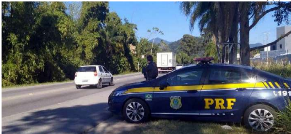
Operação encerra neste domingo (2)