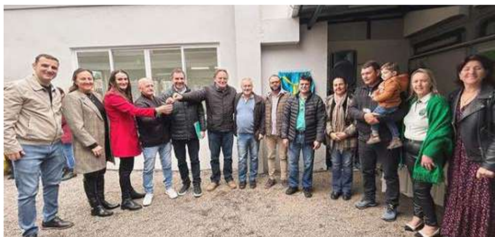
Entrega do Refeitório Cor e Sabor com Pitada de Amor