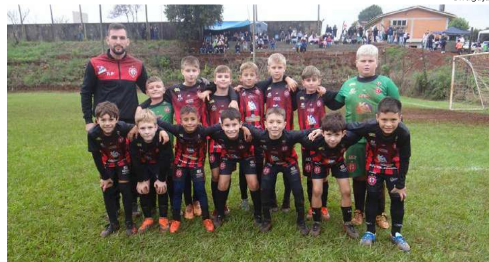
A categoria Sub-10 é uma das participantes do projeto "Passes para o Futuro"

desenvolvido com a ajuda de uma nutricionista especializada.