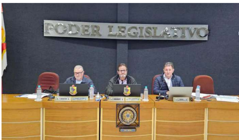
Última sessão do mês ocorreu na segunda-feira (27)

Acompanhe a próxima sessão da Câmara de Vereadores de Maravilha: segunda-feira (03/06), às 19h, no Plenário Frei Silvestre Galdi.