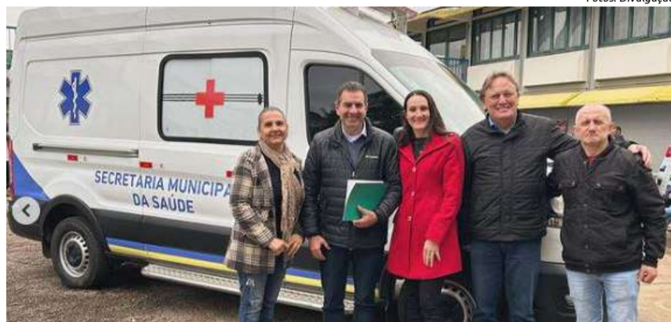
Nova ambulância para a Secretaria de Saúde