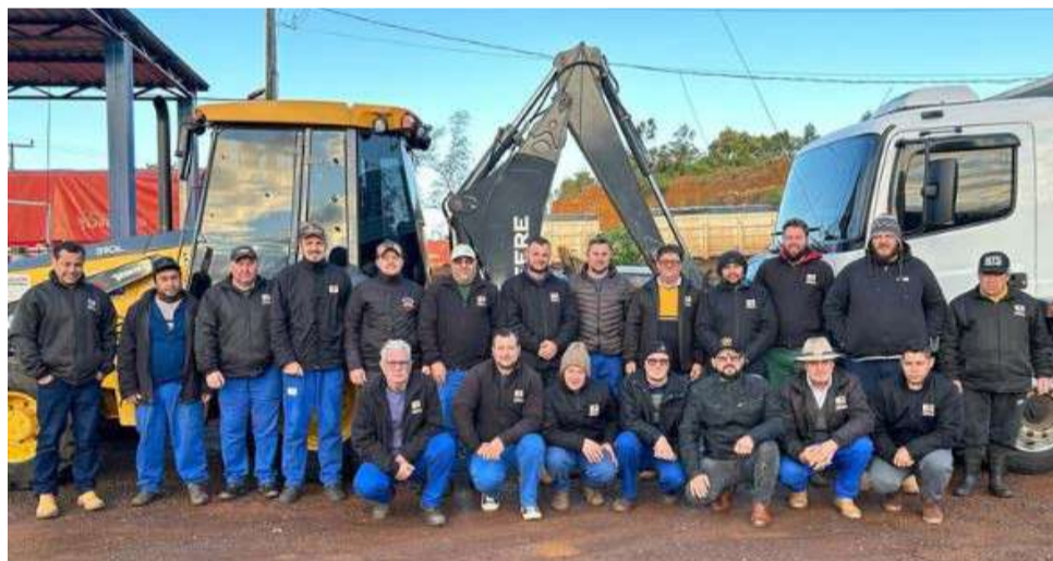
Integrantes da Secretaria de Obras vão auxiliar no que for necessário durante uma semana em Relvado

Na quarta-feira (29), as autoridades municipais e representantes das entidades parceiras se reuniram no Centro de Cultura de Maravilha, para discutir quais os próximos passos e medidas que serão tomadas em prol do município gaúcho.