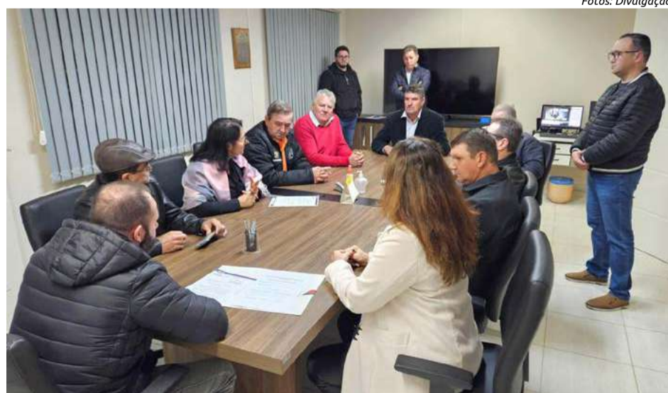
Reunião da CCJ, no momento em que a sessão foi suspensa