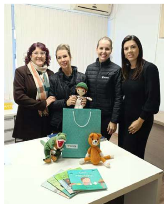
Reunião com Secretária de Educação aconteceu na terça-feira (28)