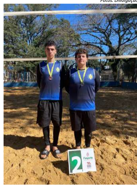
Dupla masculina do vôlei de praia conquista segunda colocação