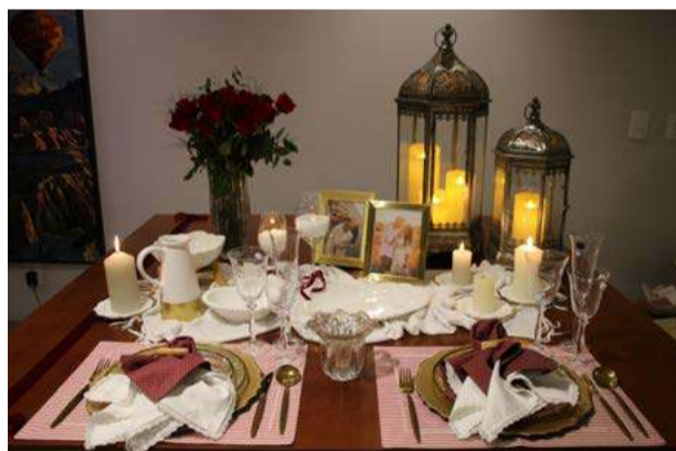
Evento foi organizado pelas nucleadas

desejavam aprender mais sobre mesa posta, e como utilizar desta arte para demonstrar afeto e carinho dentro de suas casas”.