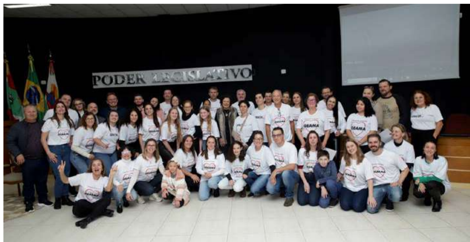
O GEAAMA de Maravilha auxilia inúmeras famílias no processo de adoção