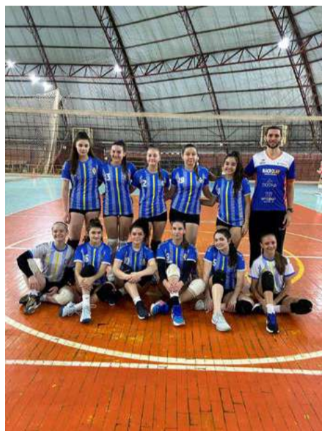
Equipe feminina de voleibol