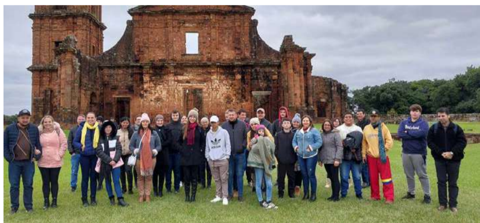
Grupo visitou as Ruínas de São Miguel das Missões

Para os alunos, essa foi uma oportunidade única para conhecer diferentes lugares, obter conhecimento prático e fazer novas amizades.