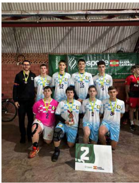
A equipe conquistou bons resultados