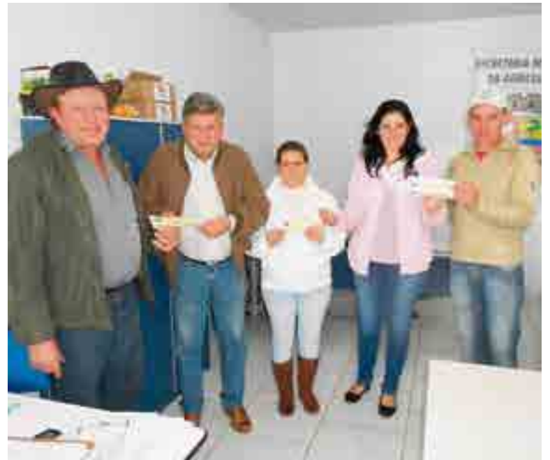
Agricultores estão retirando os vale Bônus Fiscal