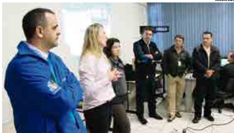
Capacitação envolve todos os municípios pertencentes à Regional