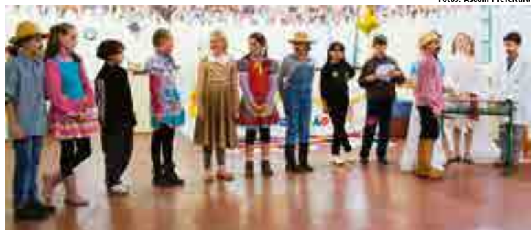
Apresentações foram realizadas pelos alunos