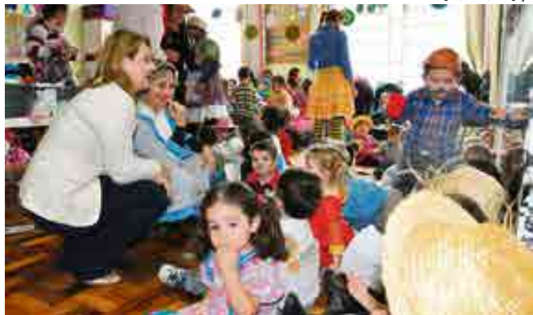
Danças e atividades típicas de São João marcaram as festas