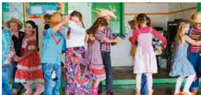
Danças, comidas e decoração animaram a festa junina

"As festas juninas caracterizam um símbolo cultural de nosso país, exigindo que se trabalhe junto à educação. Proporcionamos aos nossos alunos integrar a comemoração da festa junina desenvolvendo o resgate social, exercendo a cidadania através de ações concretas, solidárias e participativas, favorecendo à criança a ampliação de seu universo linguístico, levando ao aluno o conhecimento da origem da festa junina, e a conhecer seus símbolos e valores", justifica a diretora.