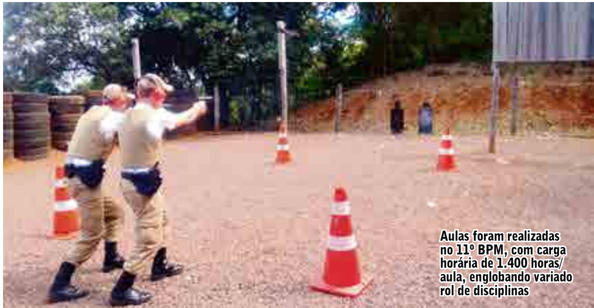
Aulas foram realizadas no 11º BPM, com carga horária de 1.400 horas/aula, englobando variado rol de disciplinas

Os futuros soldados seguem realizando o estágio operacional com a realização de atividade de policiamento, sendo que a sua formatura ocorrerá na sexta-feira (04), em Chapecó. Todos os 34 alunos deverão permanecer na área do 11º BPM/Fron, sendo que ainda segue em formação uma segunda turma composta por mais 32 alunos.