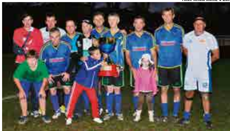
Os Veteranos foram os grandes campeões da Taça Jeancar Multimarcas de Futebol Sete

Na Taça Jeancar Multimarcas de Futebol Sete – Máster a defesa menos vazada ficou com a equipe Multi-Aço/Sicoob Credial, com a média de 1,11 gols sofridos por par-