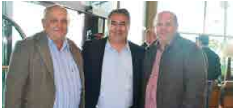
Rudimar conversou com o governador de Santa Catarina, João Raimundo Colombo

Os tigrinhenses estiveram também em Chapecó, na sexta-feira (20), em ato de entrega de máquinas da segunda fase do programa de aceleração do crescimento - PAC 2/MDA, onde Tigrinhos foi contemplado com um caminhão caçamba 6x4 (trucado e traçado), que muito auxiliará os trabalhos da Secretaria