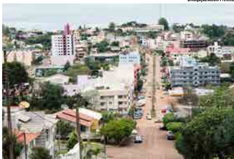
Vista parcial do perímetro urbano da Morada do Verde

Entre os dias 14 e 18 de julho será realizado o projeto Ação Sorriso, no pavilhão católico, com organização da Secretaria de Educação e parceria com o SESC. No dia 16 tem a Rua do Lazer para as crianças das redes de ensino de educação infantil matutino e vespertino, e no dia 17 para