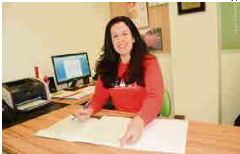
Sindicato encaminhou ofícios para todos os prefeitos da região solicitando que a lei fosse cumprida imediatamente

A presidente também destaca a satisfação pelo fato de a lei proibir a contratação temporária ou terceirizada de agentes de Saúde e de Com-