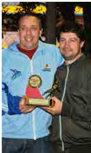
Defesa menos vazada: Multi-Aço/Sicoob Credial