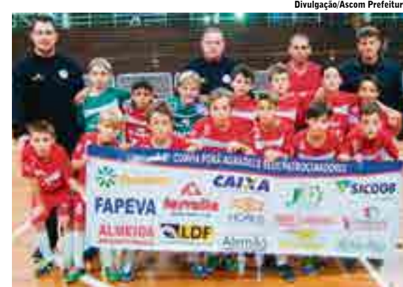
Equipe esteve empenhada e mesmo sem vitórias trouxe experiência para os próximos jogos