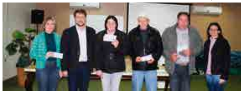
Prefeito e secretária de Educação fizeram repasse para famílias presentes