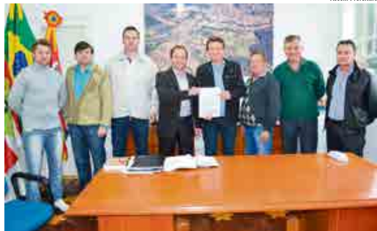
Lideranças do PP de Modelo agradeceram o empenho na busca dos recursos