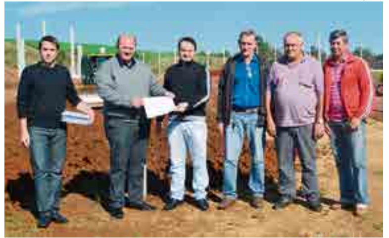
Empresa recebeu a ordem de serviço ainda no mês de abril

Conforme o prefeito, Rudimar Guth, a obra será muito importante para incentivar cada vez mais o esporte do município de Tigrinhos.