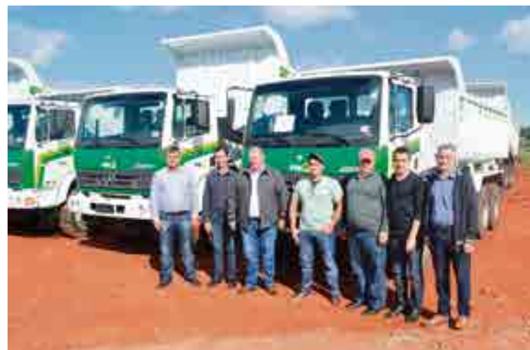
Equipe de Tigrinhos participou da solenidade e recebeu um caminhão-caçamba

do plano é aumentar a renda dos agricultores, além de inovar e estimular a produção de alimentos.