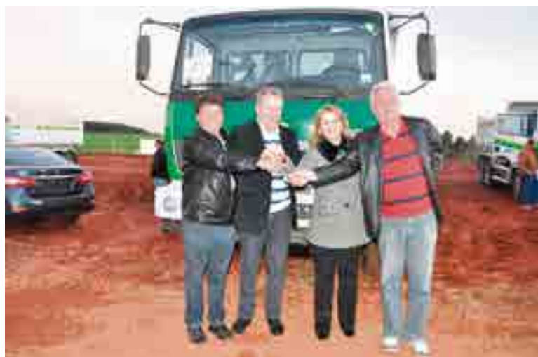
Maravilhenses prestigiaram o ato e retiraram o caminhão-caçamba