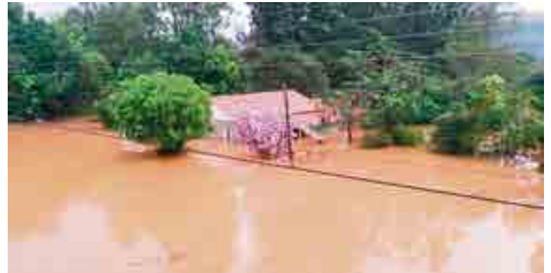
Águas de Chapecó