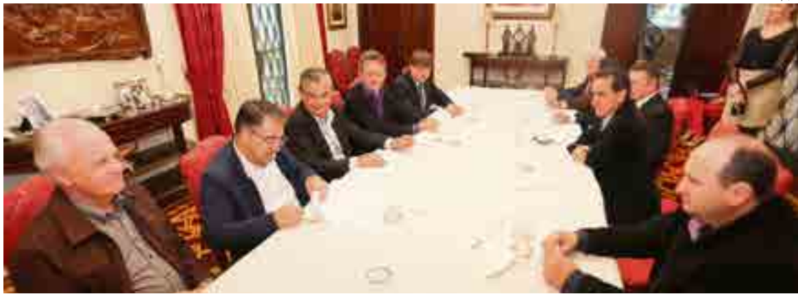
Prefeito participou de café da manhã na residência oficial do governador