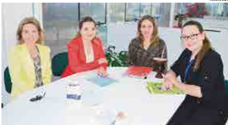
Nucleadas estiveram reunidas na última quinta-feira (26)

Programação - O evento inicia às 8h, com recepção das convidadas, e às 8h30 ocorrem os pronunciamentos de