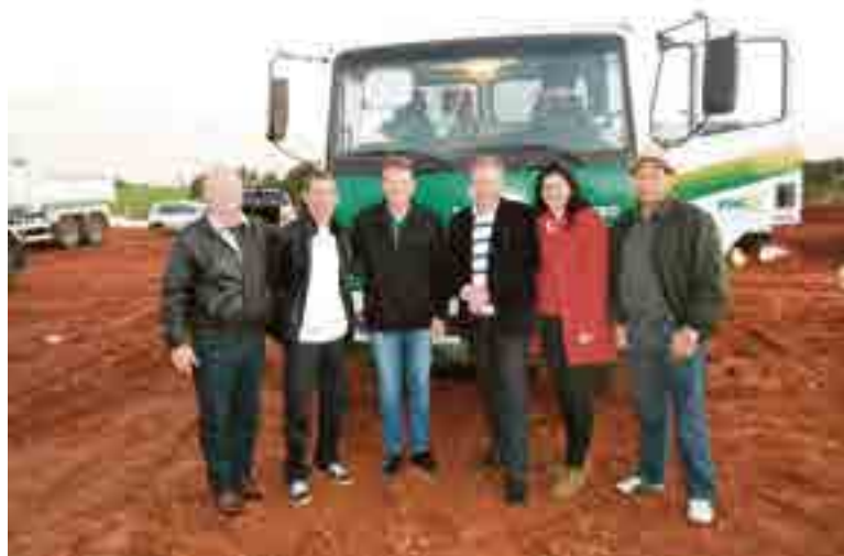
Modelenses participaram da entrega dos caminhões-caçamba