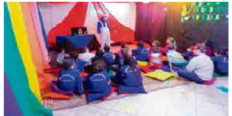
Crianças participaram da contação da história "O Vestido Azul"