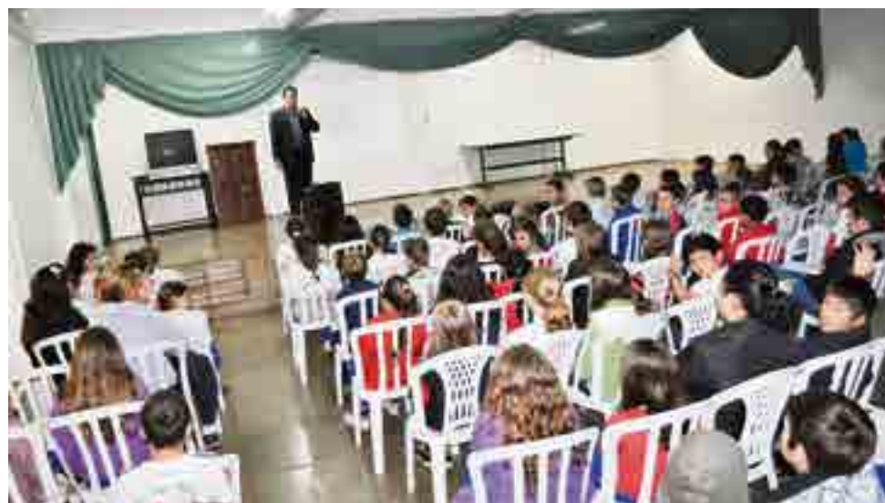
Alunos do Centro Educacional Mundo Infantil (CAIC) receberam palestras nesta semana