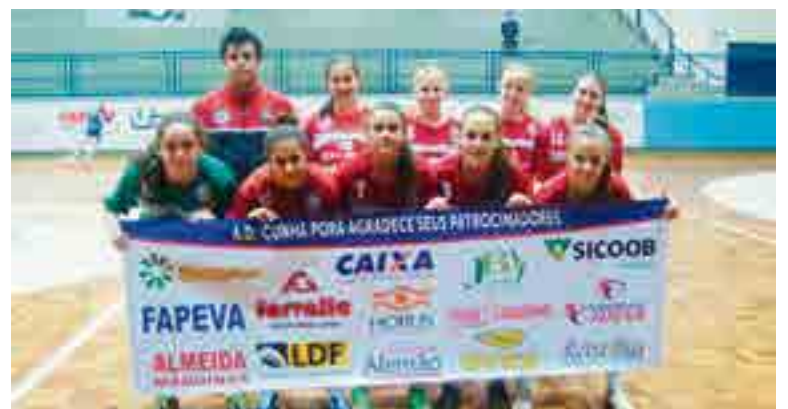
Meninas da Morada do Verde demonstraram comprometimento e venceram duelo