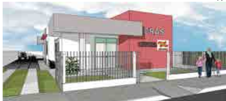
Sede própria terá no total 169,06 m 2