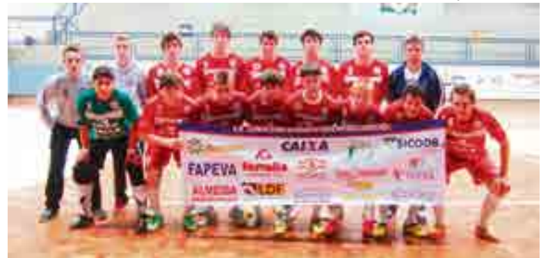
Equipe masculina garantiu vitória já na primeira rodada da competição