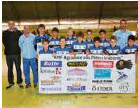
Equipes do sub-9 e sub-11 obtiveram bons resultados