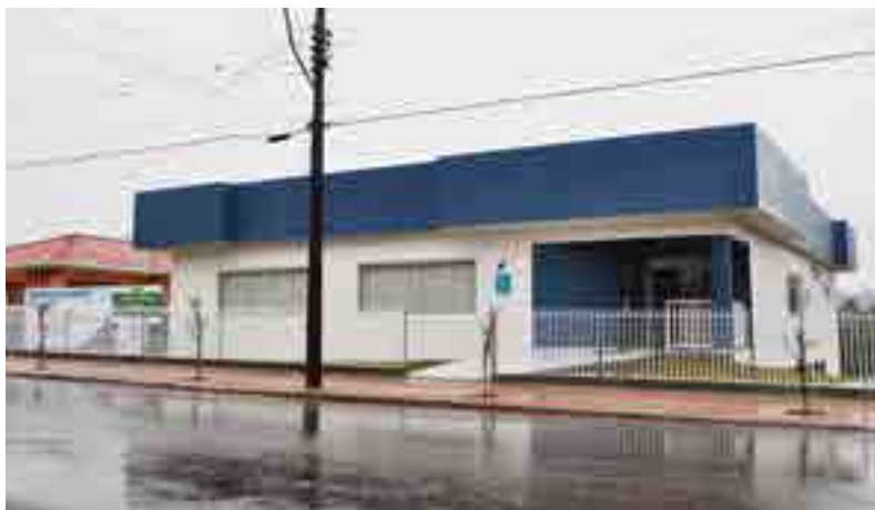
Centro de Eventos tem no total, 424,15 m 2

Conversamos com os presidentes das entidades que serão abrigadas no Centro de Eventos. Confira o que a nova sede representa para eles.