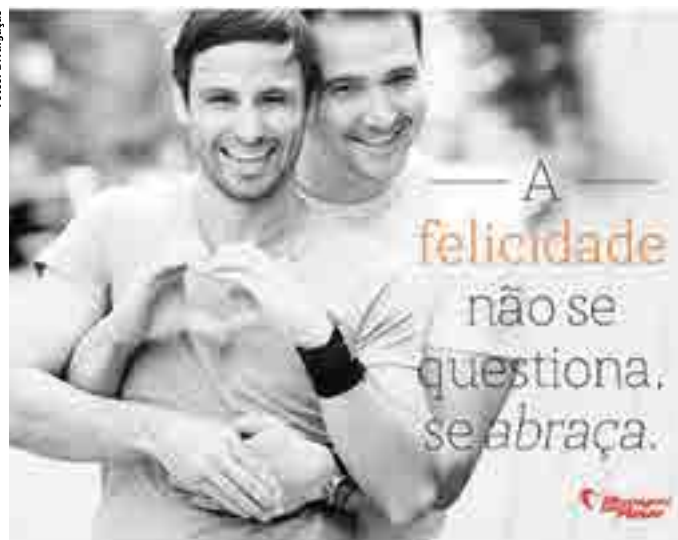
Após a entrevista, Junior disse que gostaria de deixar sua mensagem através desta imagem