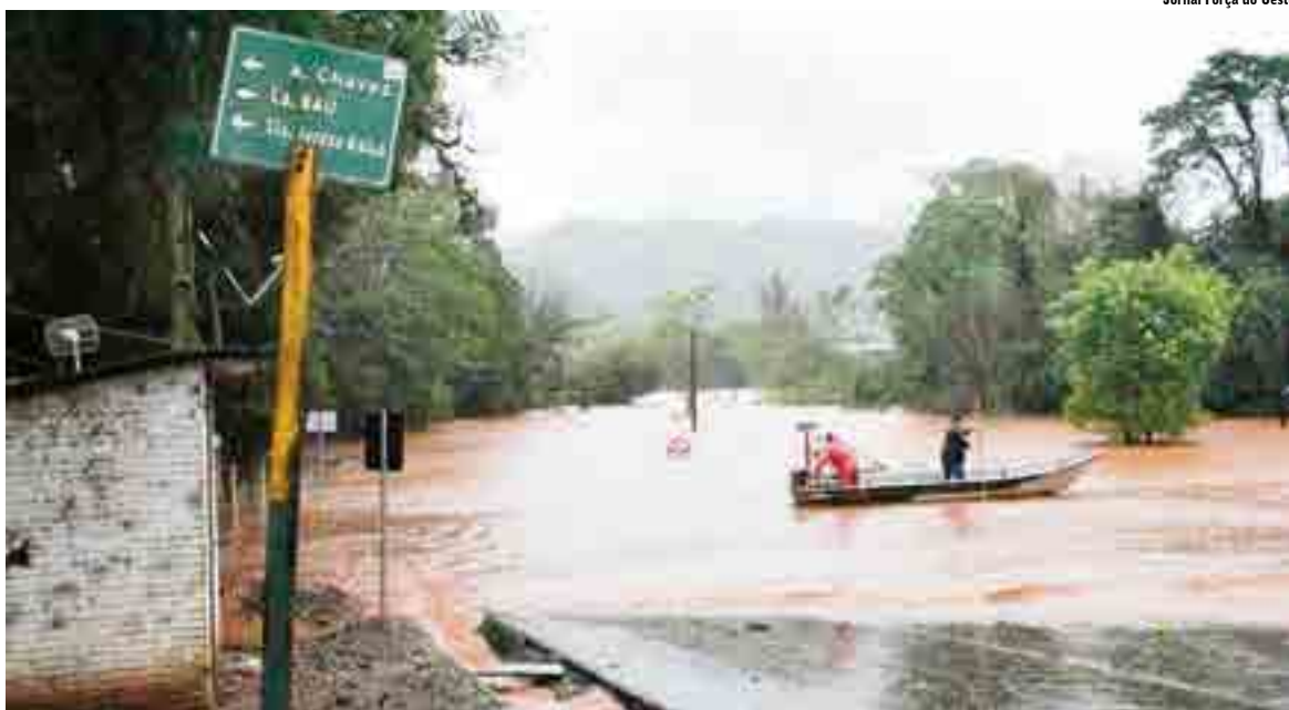
Itapiranga é uma das cidades mais atingidas da região, com Rio Uruguai passando de 14 metros do nível normal nesta sexta-feira