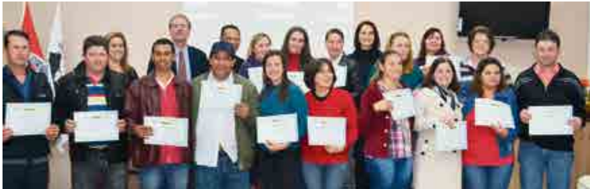
Formatura contou com a participação dos alunos e autoridades