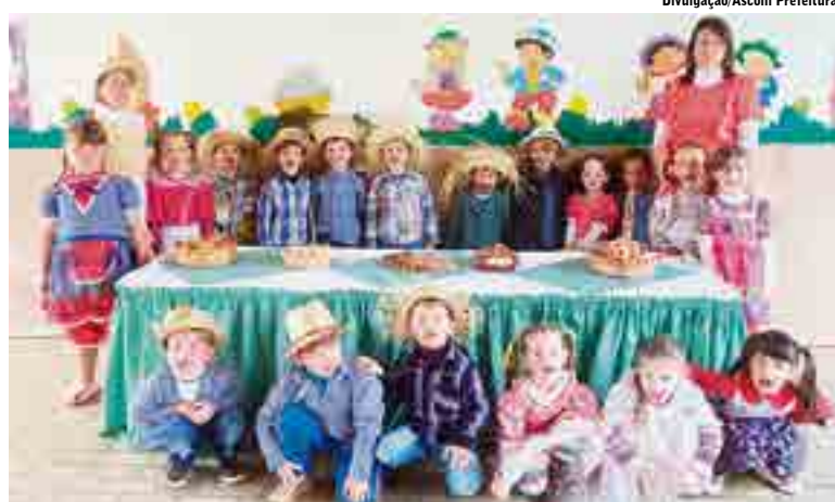
Crianças do CEI Criança Feliz estiveram trajados tipicamente para o evento que proporcionou muita alegria

Conforme as professoras e as diretoras dos centros de Educação Infantil, essa festa é uma tradição, sendo realizada