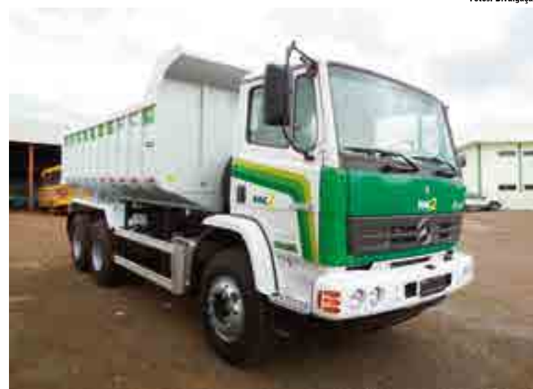
Bom Jesus do Oeste também foi beneficiado

Além do crédito, o Plano Safra contempla medidas como os serviços de Assistência Técnica e Extensão Rural (ATER) e as compras institucionais do Programa de Aquisição de Alimentos (PAA) e do Programa Nacional de Alimentação Escolar (PNAE). O objetivo