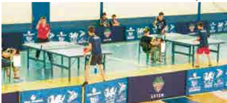
A segunda etapa inicia no dia 14 de julho

A Acema-DME/Erva Daninha/Novoeste segue os treinamentos das equipes de rendimento e das escolinhas visando esta competição. "Prendemos levar um grupo com potencial, mas que tenha, acima de tudo,