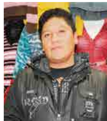
Boliviano tem fabricação própria e ainda revende para outras lojas

Chacón destaca que para participar de feiras, como essa realizada em Tigrinhos, eles recebem convites e selecionam para onde vão. "A feira aqui está fraca em função do frio e de ser final de mês, mas temos boas expecta-