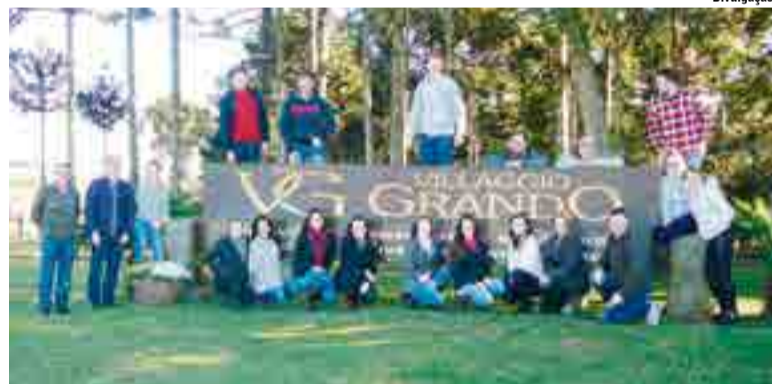
Acadêmicos de Administração em visita à Vinícola Villaggio