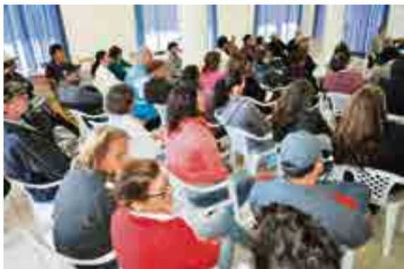
Agricultores e entidades participaram da reunião