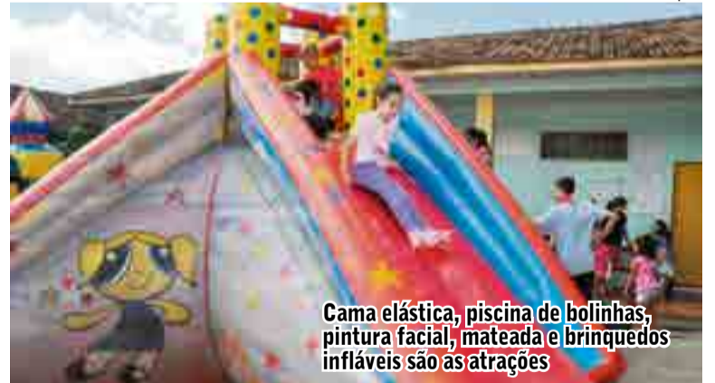
Cama elástica, piscina de bolinhas, pintura facial, mateada e brinquedos infláveis são as atrações