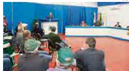
Sargento sanou as dúvidas dos vereadores e comunidade em geral

Conforme o sargento, o evento foi de extrema importância, considerando que ainda existe uma cultura local de resistência a esta atividade,