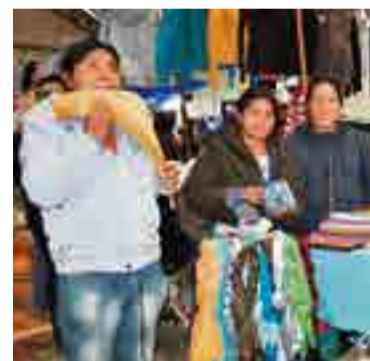
Equatorianos gostam de apresentar seus trabalhos e sua cultura

A família tem uma casa em Curitiba, onde produz os produtos que vende nas feiras. "Quando estamos abastecidos, saímos para vender. Temos artigos em bambu, penas naturais e artificiais, flautas, tudo é feito a mão. Leva um pouco mais de tempo, mas vale a pena porque