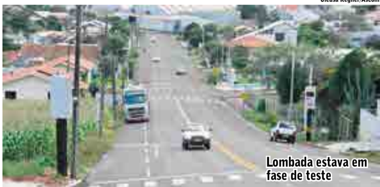
Lombada estava em fase de teste

As lombadas físicas da Avenida Padre Antonio também foram reduzidas com o objetivo de facilitar o trânsito da população maravilhense.