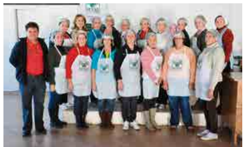
Prefeita e secretário de Agricultura prestigiaram curso na Linha Guaraiipo