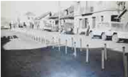
Avenida Araucária quando foi embelezada em 1968