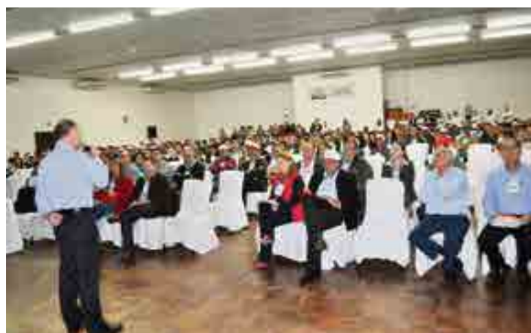
Produtores de leite e autoridades prestigiaram o evento