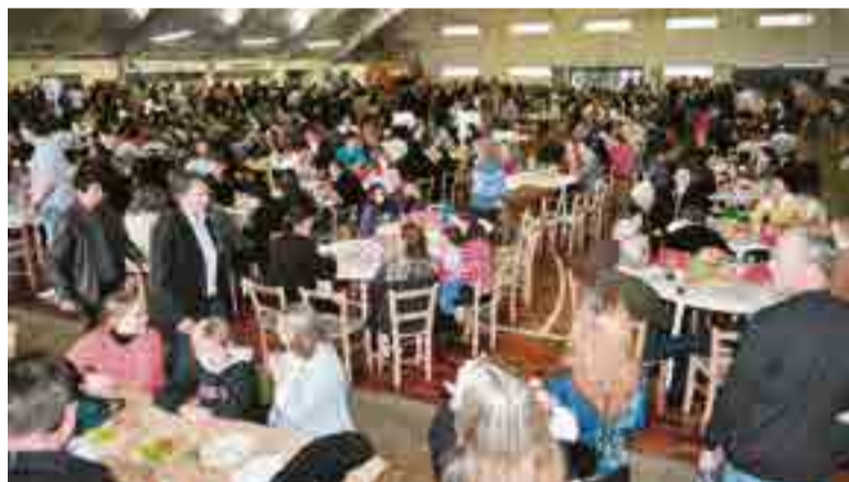
Festa foi uma das maiores organizadas pela Comunidade Nossa Senhora de Fátima