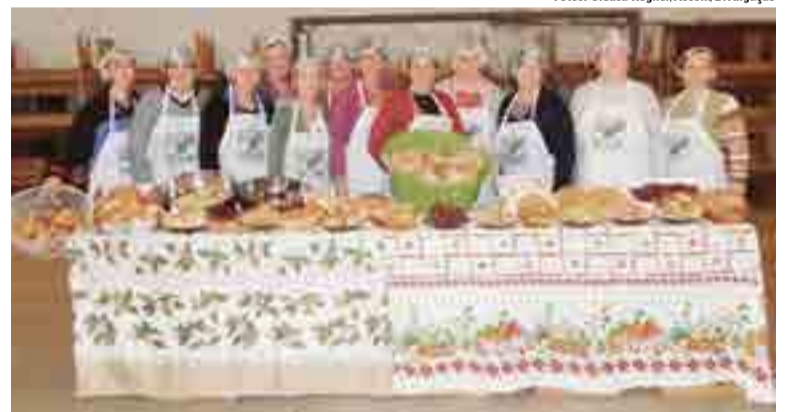
Curso na Linha Água Parada foi sobre Produção Caseira de Pães e Biscoitos