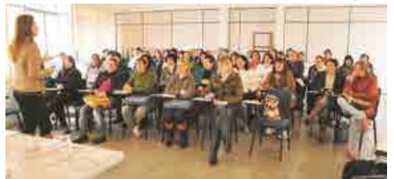
Profissionais receberam orientação de enfermeira estomatoterapeuta