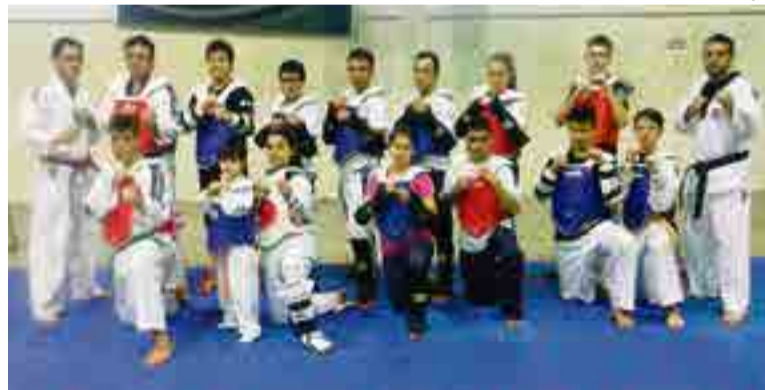
Treino de intercâmbio envolve atletas de Maravilha, Santa Terezinha do Progresso e Cunha Porã