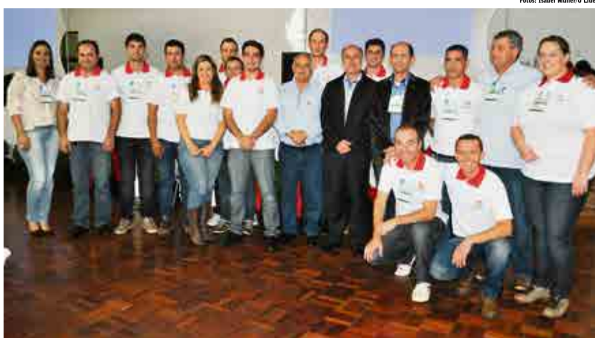
Equipe Piracanjuba organizou o 2º Encontro de Produtores de Leite