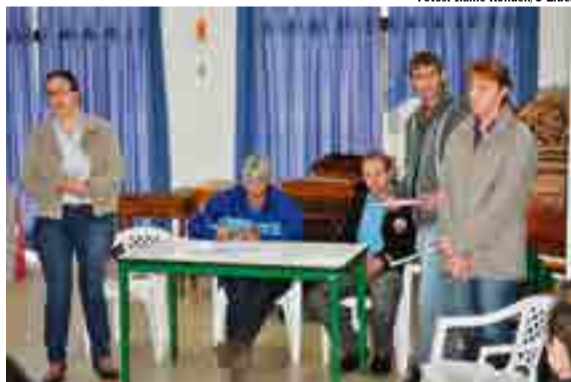
Encontro foi organizado pela Copamar e Secretaria de Agricultura