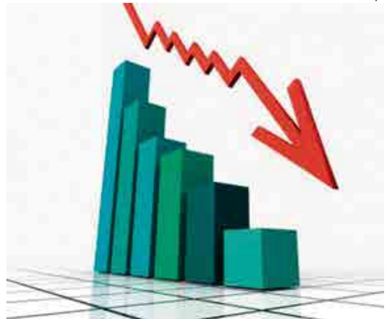
Um fator responsável pelo índice negativo é a preocupação dos catarinenses em gastar menos