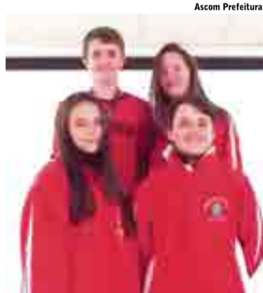
Alunos se destacaram na modalidade de xadrez

Conforme a Administração e o Departamento de Esportes e Lazer, as conquistas demonstram que Flor do Sertão possui potencial igual a outros municípios com caminhada maior na modalidade, o que é re-