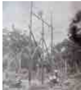
Instalação da energia elétrica no município em agosto de 1966