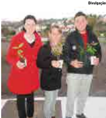
Colaboradores receberam mudas de árvores nesta semana

Desta maneira, entre a segunda-feira (02) e sexta-feira (06), foi implantada a Campanha Meio Ambiente na empresa, que é uma iniciativa da CIPA com apoio de parceiros. Foram entregues aos colaboradores 410 mudas de árvores nativas e frutíferas, entre elas canelinas, pitanga, cereja, guajuvira e angico.