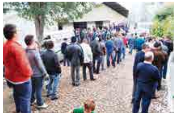
Filas se formaram para a retirada dos churrascos