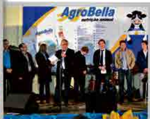
Solenidade de abertura

Inaugurou no último sábado, 31, a unidade Catarinense de nutrição animal na cidade de Caibi.