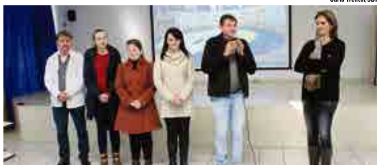
Encontro foi realizado pela Gered e voltado para a educação especial e segundo-professor

"A construção de espaços inclusivos nas escolas vem exigindo dos educadores nova concepção das diferenças humanas, para compreender que a principal característica do ser humano é a pluralidade/heterogeneidade. Não somos iguais e uniformes, temos infinitas formas de manifestar o que pensamos e sentimos", afirma a supervisora de Ativi-