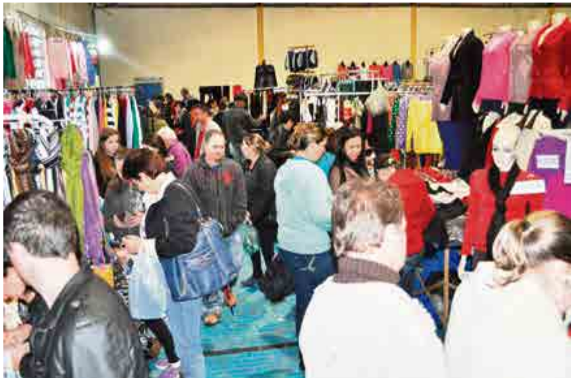
Pessoas de toda a região aproveitaram a feira em Tigrinhos