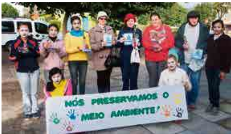
Municípios receberam uma muda de árvore

Conforme os organizadores, a ação teve objetivo de conscientizar os muni-