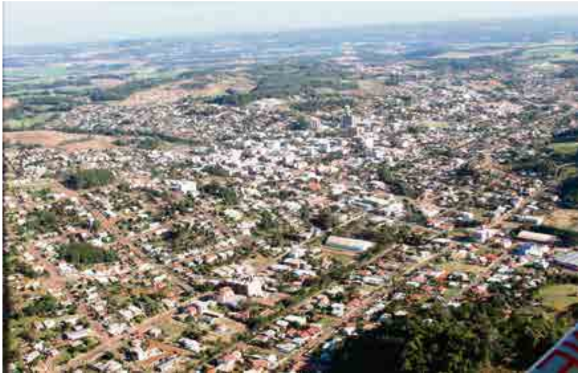
Município está à frente de São Paulo, Itajaí e Sorocaba, na 35ª posição