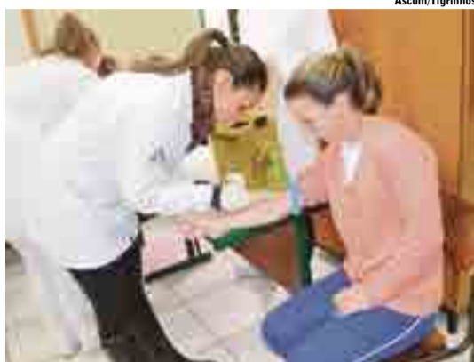
Coletas foram realizadas na Escola de Educação Básica Osvaldo Ferreira de Melo

A coleta também foi um incentivo para as doações de sangue, sendo que a partir dos 16 anos, com peso ideal e com a presença dos pais, já podem se tornar doadores.