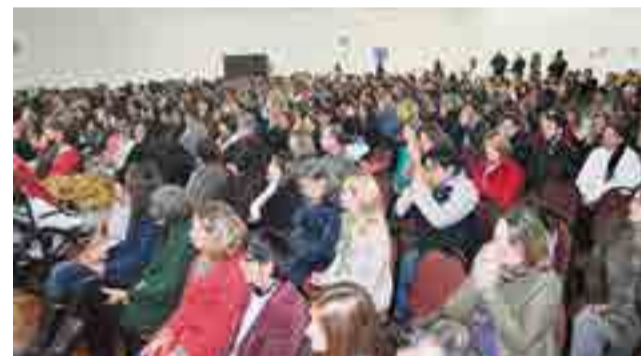
Aproximadamente 500 pessoas prestigiaram o Seminário da Luz