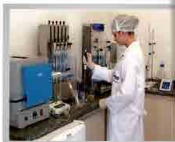
Controle de qualidade