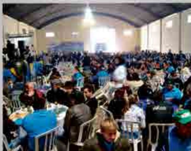
Mais de 1.500 pessoas presentes no evento.