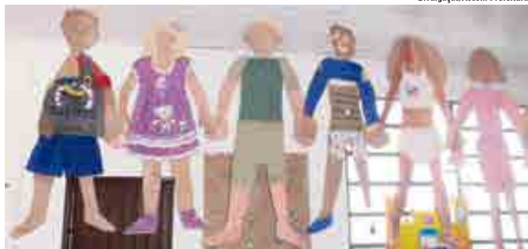
Alunos e famílias do CEI Pequenos Brilhantes se empenharam com criatividade