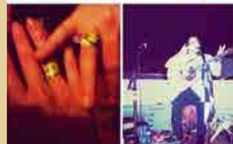
Pedido aconteceu no EREA, em Blumenau, este ano