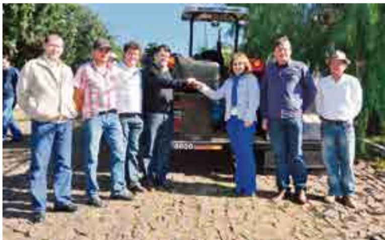
Demonstração da máquina e entrega da chave ao operador foi feita na sexta-feira (30)

da capinadeira foi de R$ 124 mil. "Aos poucos vamos revitalizar todas as ruas de nossa cidade que estão sujas.