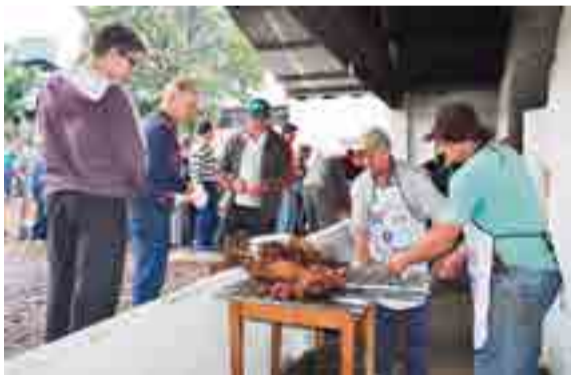
Aproximadamente 700 fichas de carne foram vendidas