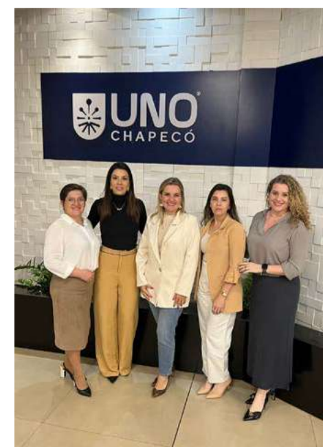
Encontro regional aconteceu em Chapecó/SC