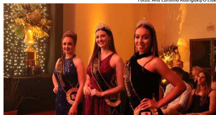
As soberanas de 2022 a 2024 deixaram os cargos com muita gratidão e felizes pelas sucessoras