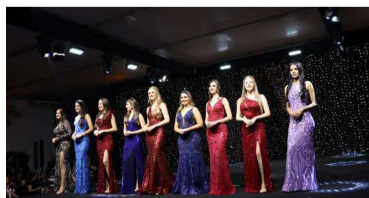
Esta edição do concurso contou com a participação de nove candidatas