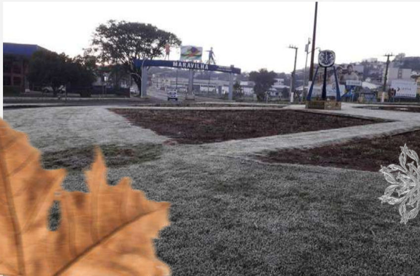
Inverno deve trazer alívio para as temperaturas, que têm se mantido acima da média

Entretanto, dias de muito frio não devem ser o padrão da estação, que terá alternância com alguns períodos de calor. "No fim de agosto e em setembro, começamos a ter chuva mais regular", diz.