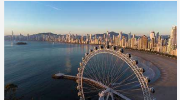
Balneário Camboriú está entre os destinos mais procurados