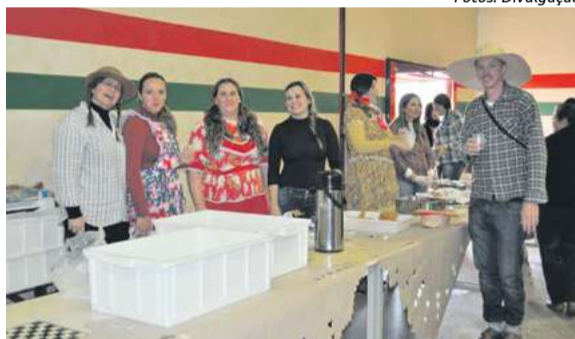
Comidas e bebidas típicas de São João foram comercializadas pelos professores no João XXIII

Neste ano, as organizações das festas mudaram um pouco. Ambas acontecem nessa semana, a do João XXIII nesta sexta-feira (21), para os alunos e equipe escolar. Com direito a comidas típicas, brincadeiras e apresentações, sendo realizada nos dois turnos, matutino e vespertino.