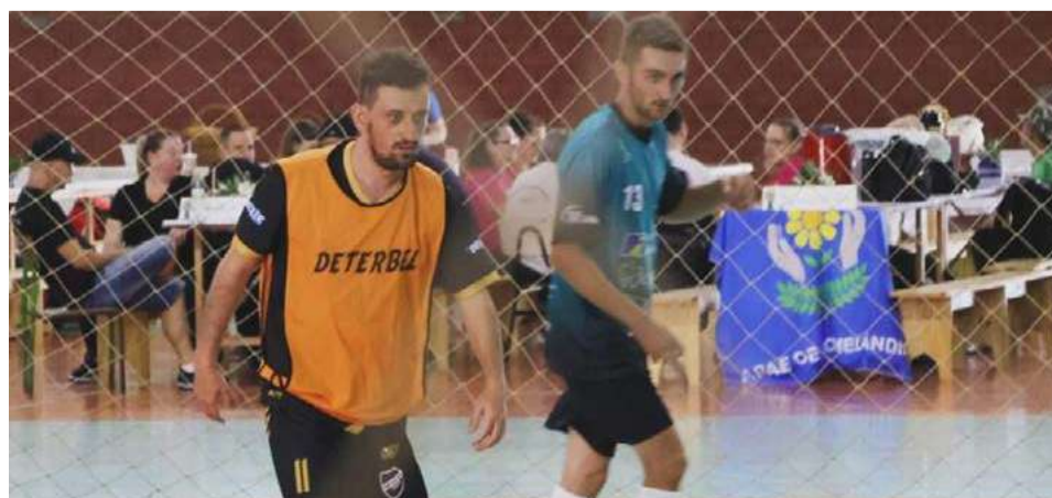
Nove Apaes participaram dos jogos