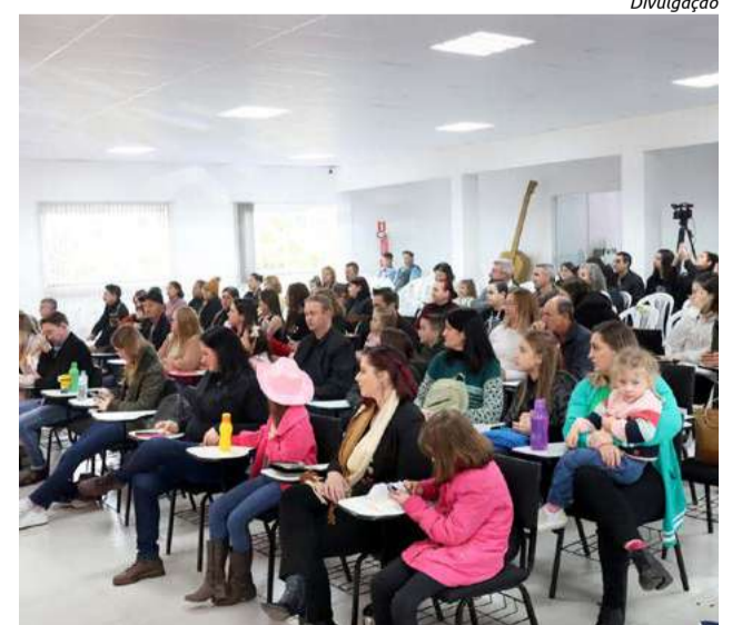
Legenda: Evento será realizado no Centro de Cultura

Os critérios de avaliação serão baseados na afinação, na interpretação e na presença de palco dos participantes. Os vencedores de cada categoria até o terceiro lugar receberão prêmios em dinheiro e troféu, conforme regulamento. Todos os candidatos serão agraciados com uma medalha de reconhecimento.