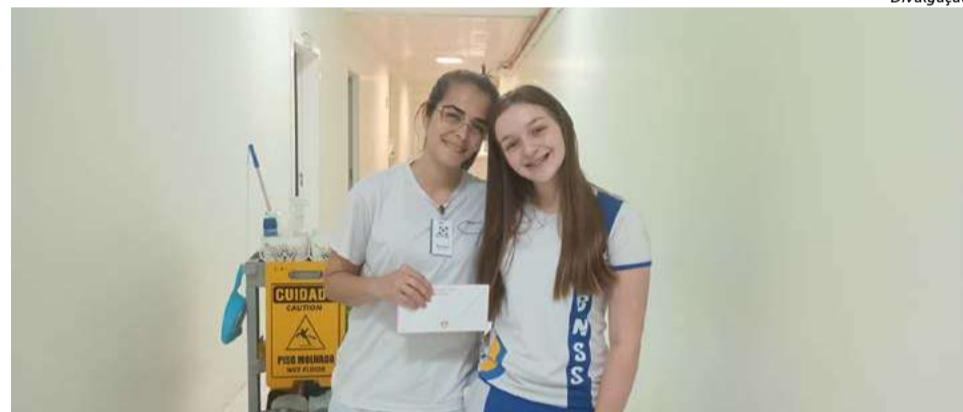
Na ocasião, foi feita a entrega das cartinhas solidárias