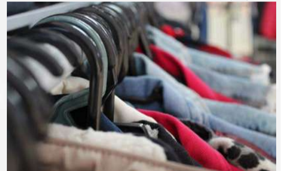
Com a chegada da estação mais fria do ano, expectativa é de aumento das vendas