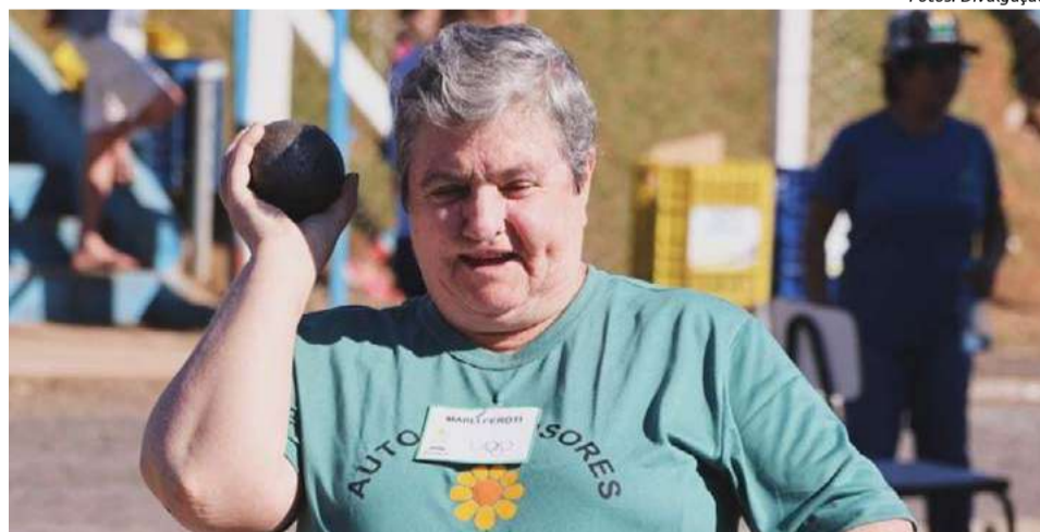
As modalidades foram divididas entre áreas externas e internas