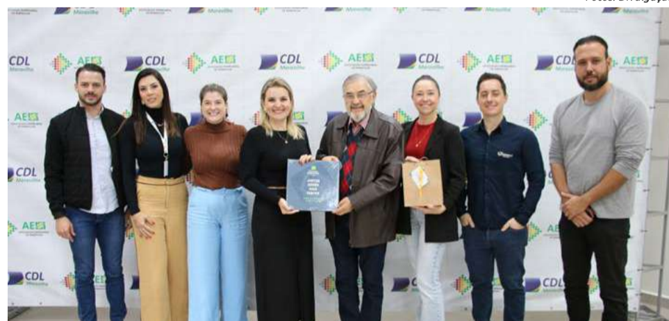
A pauta principal da conversa foi a implantação do PGVE