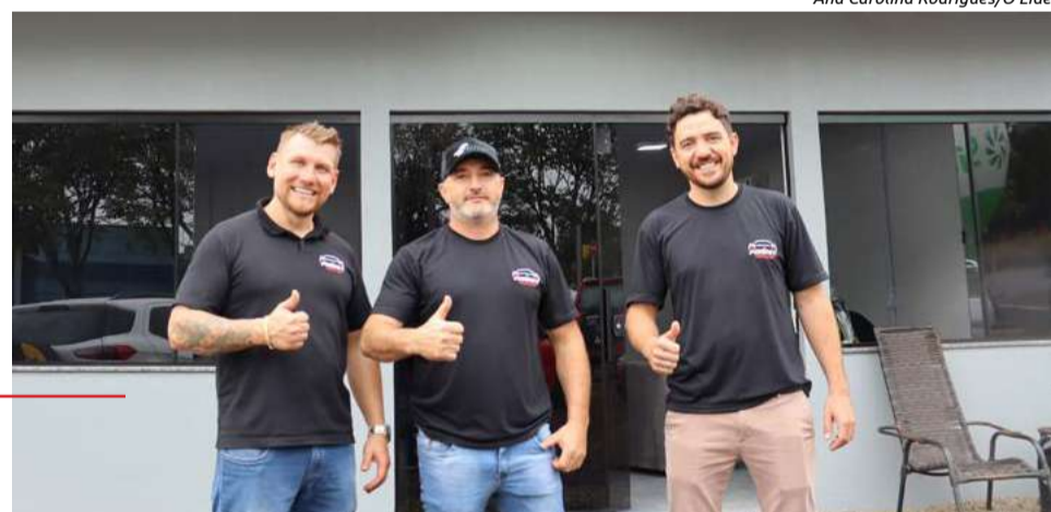
Sócios da Foresti Veículos

A Foresti Veículos fica localizada na Rua Jorge Lacerda, em frente à Capela Mortuária. Com horário de atendimento especial, os sócios vão atender das 7h30 às 12h, e na parte da tarde das 13h30 às 18h30.