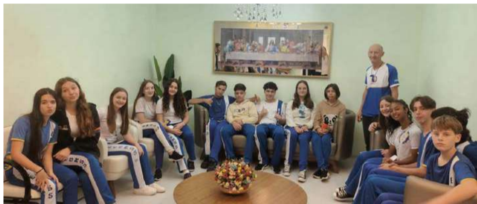
Alunos conheceram a estrutura do hospital

Em sala de aula, os alunos buscam sentir a importância da valorização de pequenas coisas e momentos. “Tudo isso são motivos que nos impulsionam a construir um mundo de coisas boas, de alegrias e da construção da paz”, destacam.