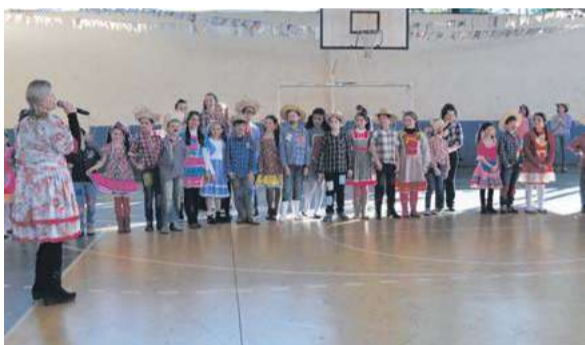
Apresentações culturais marcaram a festa na EEBNSS

A E.E.B. Nossa Senhora da Salete realizou apresentações culturais com os alunos dos anos iniciais, do 1º ao 5º ano, e os alunos