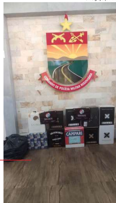
Abordagem foi realizada na rodovia SC-161