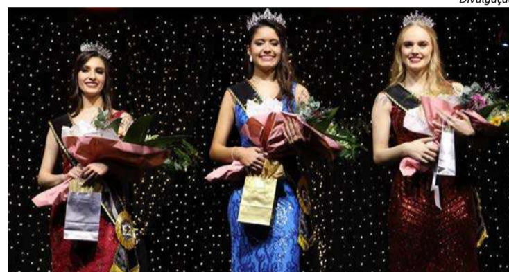
Novas soberanas de Maravilha, de 2024 a 2026