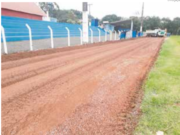
Obras estão em andamento e devem ficar prontas até quarta-feira (3)

Até que os jogos não comecem, os preparativos estão em ritmo acelerados. A pista de atletismo foi construída no Estádio Osvaldo Gomes Werner e vai ter dimensões oficiais e com isso Maravilha vai poder sediar outros eventos da modalidade. A raia interna vai ter 400 metros. Tam-