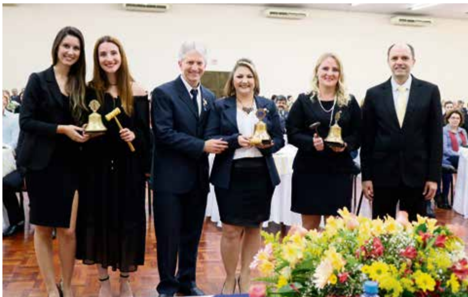
Ex-presidentes repassando o cargo