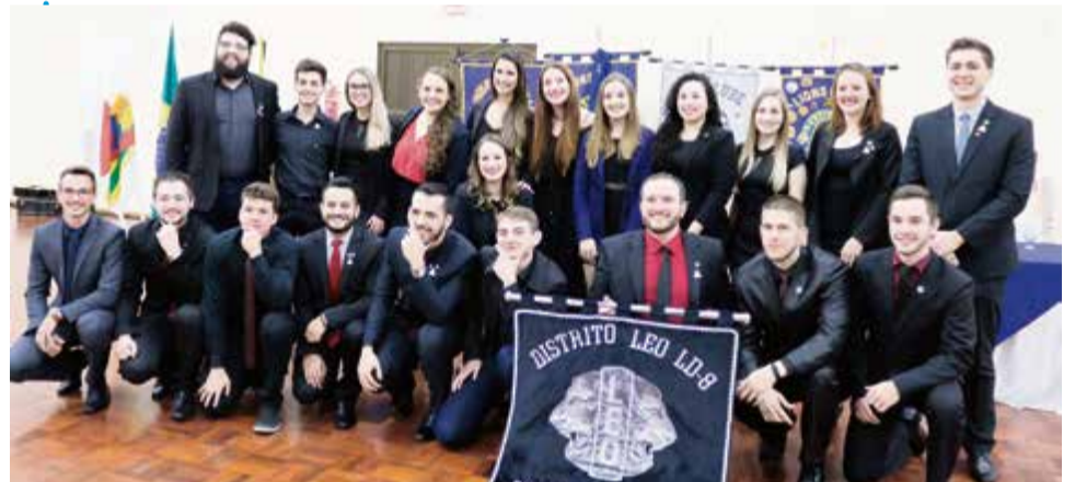
Diretoria do LEO Clube