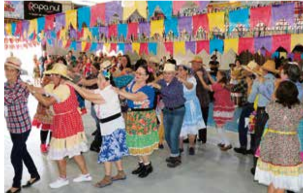
Grupos apresentaram danças típicas

evento é promover a integração dos grupos da terceira idade. A Secretaria de Assistência Social ofereceu gratuitamente comidas e bebidas típicas, além de transporte para os idosos.