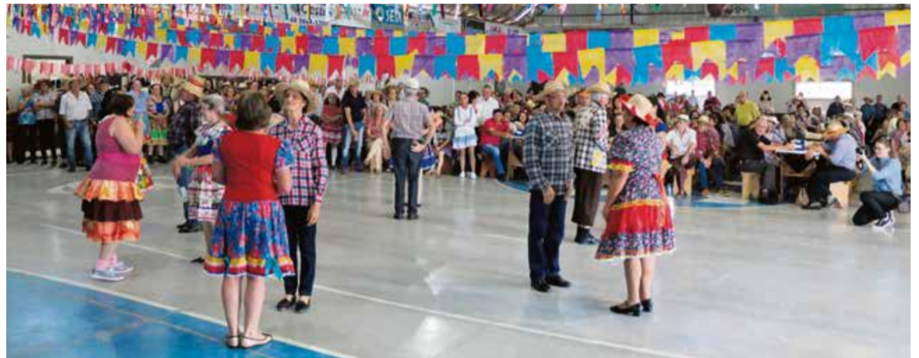
Festa lotou o salão do Bairro Progresso