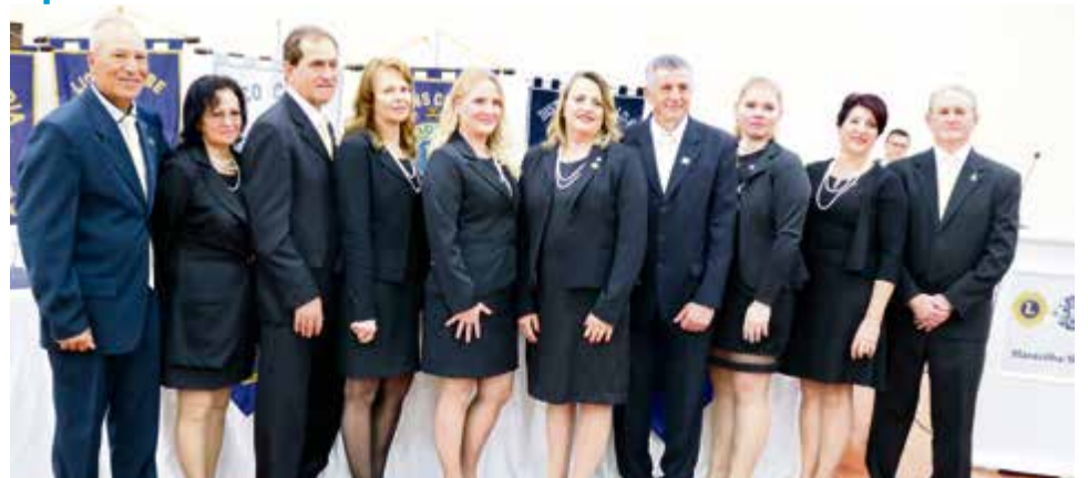
Diretoria do Lions Clube Maravilha