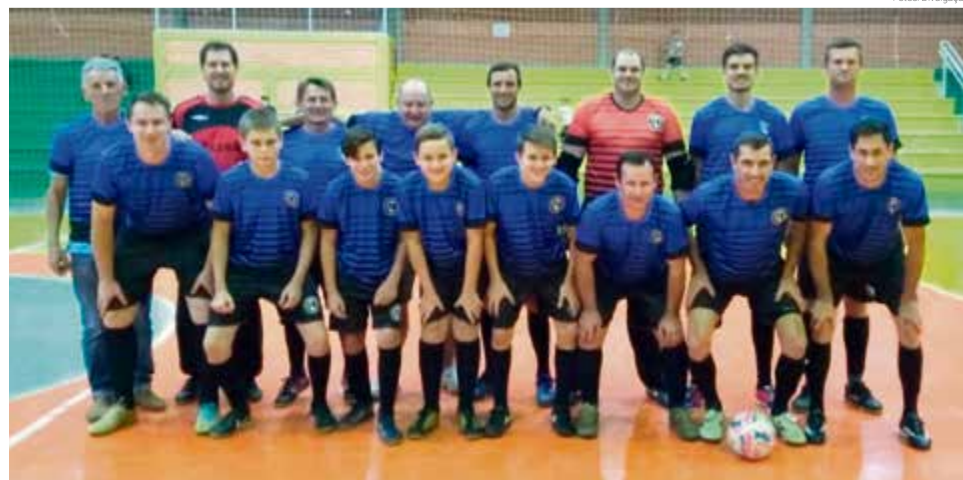
Família Buscapé empatou com o Arsenal em dois gols