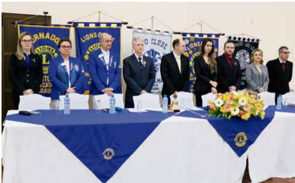
Mesa de honra formada no início da cerimônia com lideranças