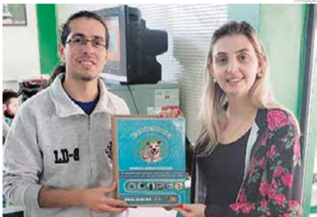
Coletores foram entregues em bares, lojas e restaurantes