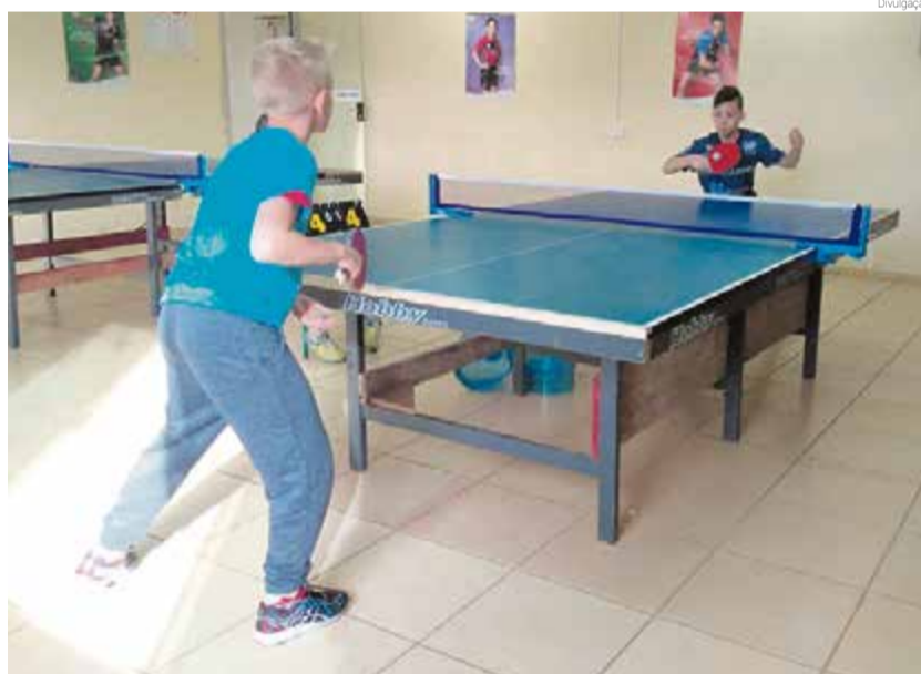
Alunos mostraram destreza em jogadas difíceis em busca do troféu

Hoje (29) um grupo de aproximadamente 20 atletas representa Maravilha na 3ª etapa do Circuito Oeste Crecerto de Tênis de Mesa. A competição será em São Miguel do Oeste.