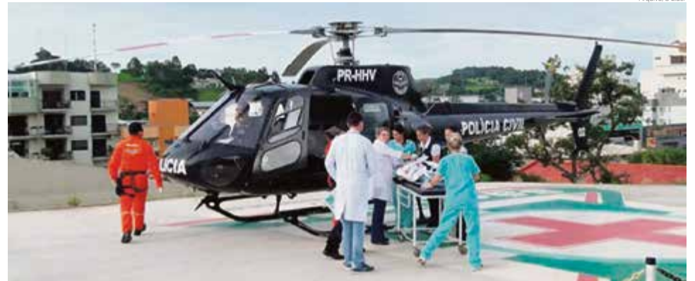
Em Maravilha, heliponto foi construído para receber a aeronave no Hospital São José

Os pilotos e tripulantes passam por diversas capacitações