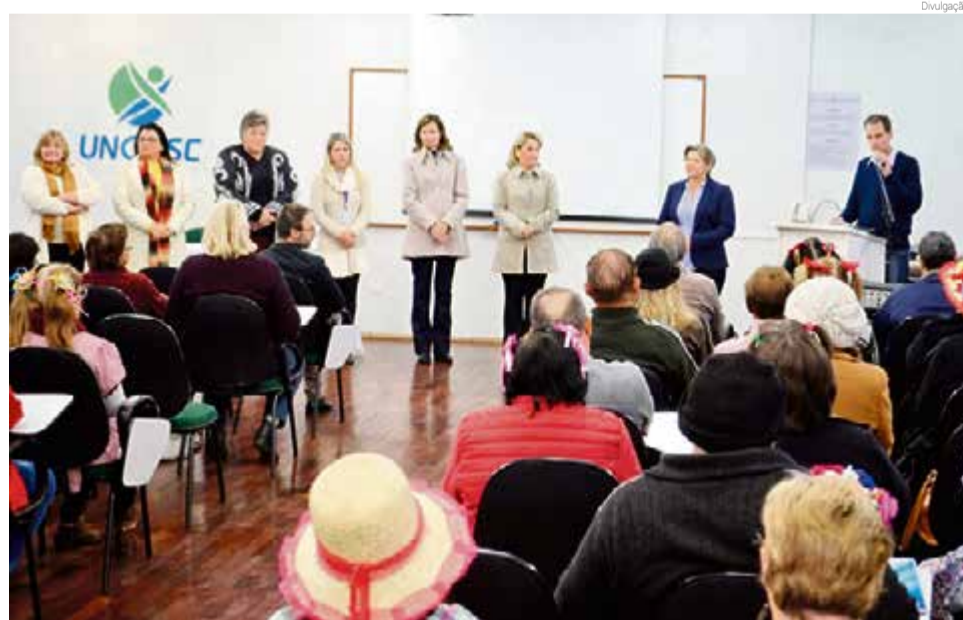
Alunos foram caracterizados e confraternização encerrou as ações no primeiro semestre

De acordo com a coordenadora da Uniti, Izoldi Pinheiro, os mais de 80 alunos desenvolveram diversas atividades ao longo do ano e se divertiram com as ações. Desde 2016, a Unesco procura melho-