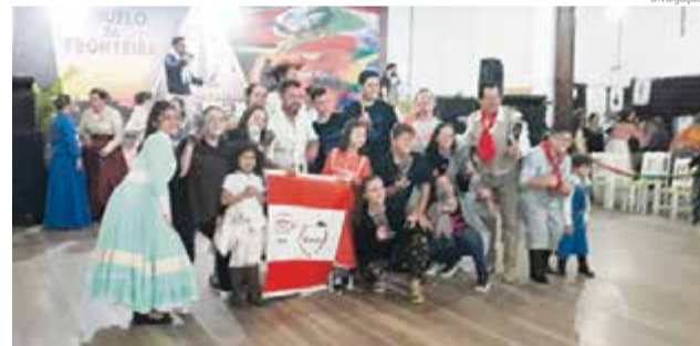
Troféu de campeão geral foi conquistado no 2º Festival Fronteira Oeste

CONFIRA A PREMIAÇÃO DO CTG JUCA RUIVO Troféu de Campeão Geral Grupos de danças