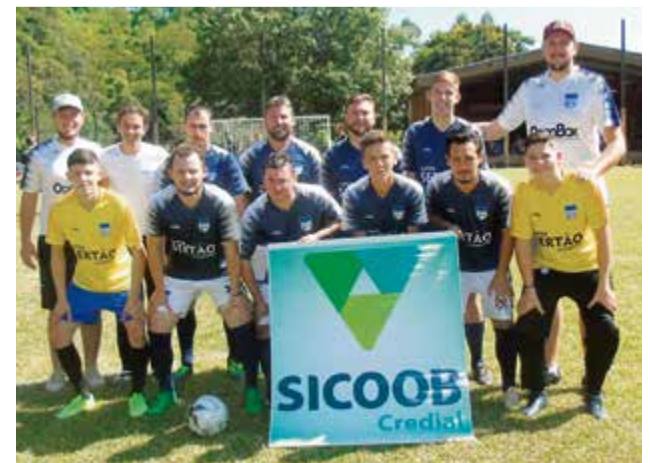
Facc está invicto e com a melhor campanha do campeonato