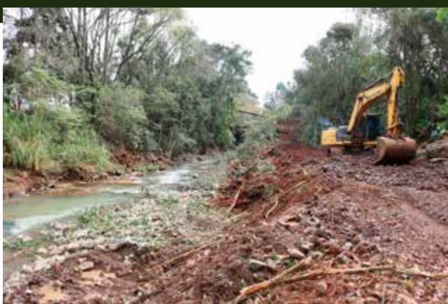
Corte da vegetação foi iniciado nesta semana

Após a execução da obra, o município vai plantar novas mudas de espécies nativas na lateral do rio, em pontos onde as árvores não atrapalhem o escoamento da água. O município também apresentou um plano para o plantio de mais de 19 mil mudas em outras áreas públicas, como forma de compensação pelo corte de vegetação. Serão retirados aproximadamente quatro hectares de vegetação nas proximidades do rio e feito o replantio e preservação de uma área de 16 hectares.