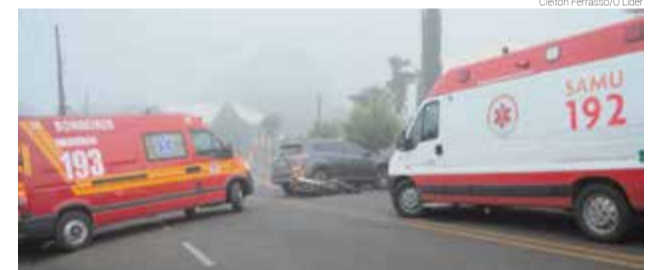
Samu e Corpo de Bombeiros estiveram no local para atendimento

A motocicleta colidiu no veículo, que estava saindo da garagem de uma residência. A moto caiu e deslizou no as-