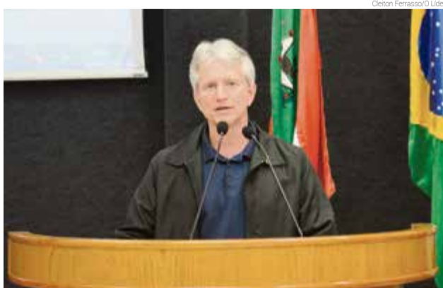
Secretário de Indústria, Comércio e Turismo, Gelson Rosseto

vilha cresceu, aproximadamente, 12% na economia em 2018, alcançando a 39ª colocação no ranking do Estado entre os 295 municípios. “Só podemos para Chapecó aqui na região. Isso é motivo de orgu-