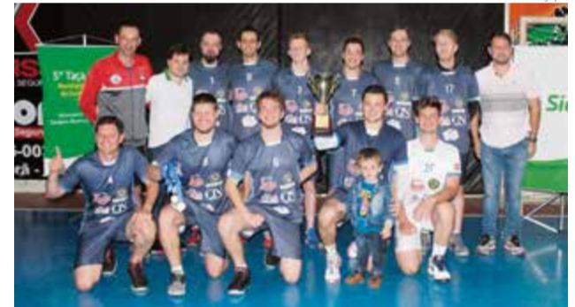
No masculino, Trentino CP ergueu o troféu principal