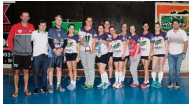
Meninas do Time da Cipó foram as melhores do certame