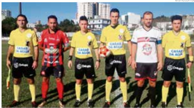
CAMPEONATO CATARINENSE NÃO PROFISSIONAL TAÇA SCHROEDER ESQUADRIAS DE FUTEBOL FASE DESTE EDIÇÃO 2019

No confronto entre Ginástica e Guarani, a equipe de São Miguel do Oeste fez 3 x 1 no time de Riqueza, abrindo boa vantagem para o jogo