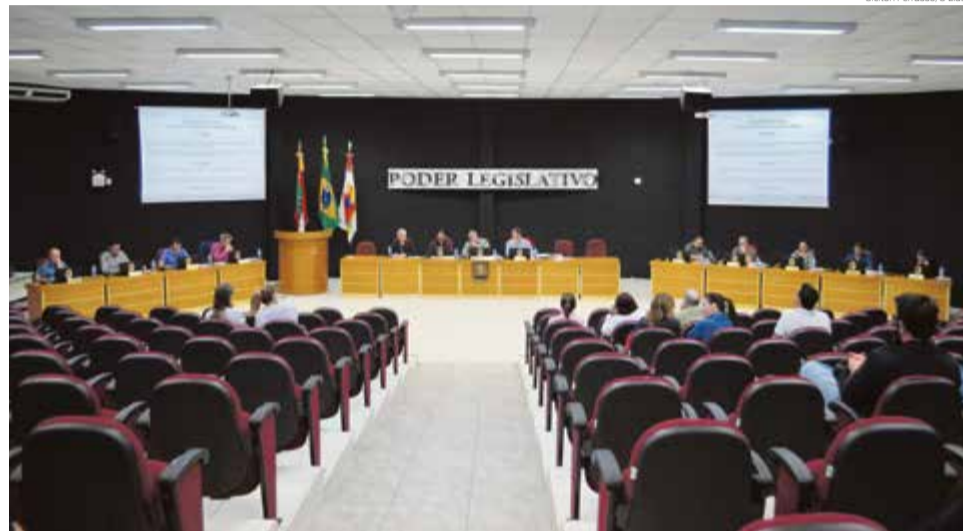
Sessão foi realizada na segunda-feira (24)

aprovadas em votação única. A maioria tratou sobre melhorias nas ruas, entre elas a Rua Avelino Giehl, no Bairro Frei Damião; um quebra-molas nas proximidades do parque situado na Rua Guilherme Ozidio Manfrin, no Bairro Kasper, e outro na Rua Cruz e Souza, esquina com a Rua Romeu Firmino Lago, situadas no Loteamento do Lago. Também foi aprovada a indicação