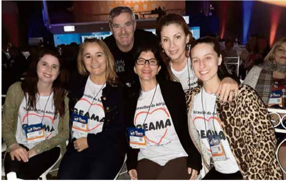
Representantes do Geama estiveram em encontro nacional sobre adoção

O evento teve o intuito de promover o diálogo entre diferentes profissionais e ONGs que estejam envolvidos no processo de adoção. Desde 1996 conta com a presença de psicólogos, juizes, promotores, advogados e assisten-