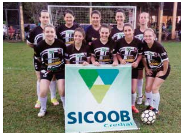
Posto está invicto na competição e tem a melhor defesa