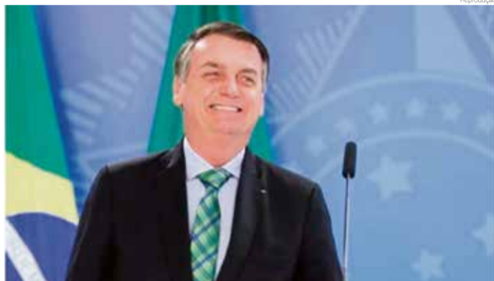
"Se a Previdência sair, voltamos a ter confiança e os investimentos virão", disse Bolsonaro

O presidente, Jair Bolsonaro, disse que dificilmente haverá concursos públicos no Brasil nos "próximos poucos anos". Bolsonaro explicou que o ministro da Economia, Paulo Guedes, decidiu reduzir concursos públicos no Executivo e restringi-los a poucas áreas, entre elas a Polícia Federal e a Polícia Rodoviária Federal. Em março, o presidente já havia endurecido as regras para a realização de concursos, com a publicação de um decreto. Segundo o texto, para pleitear a realização de concurso público, o órgão terá que apresentar ao menos 14 informações ao Ministério da Economia. Péssima notícia aos concurreis. O negócio é disputar vagas no mercado, ou então concluir o curso superior e mostrar sua capacidade na iniciativa privada.