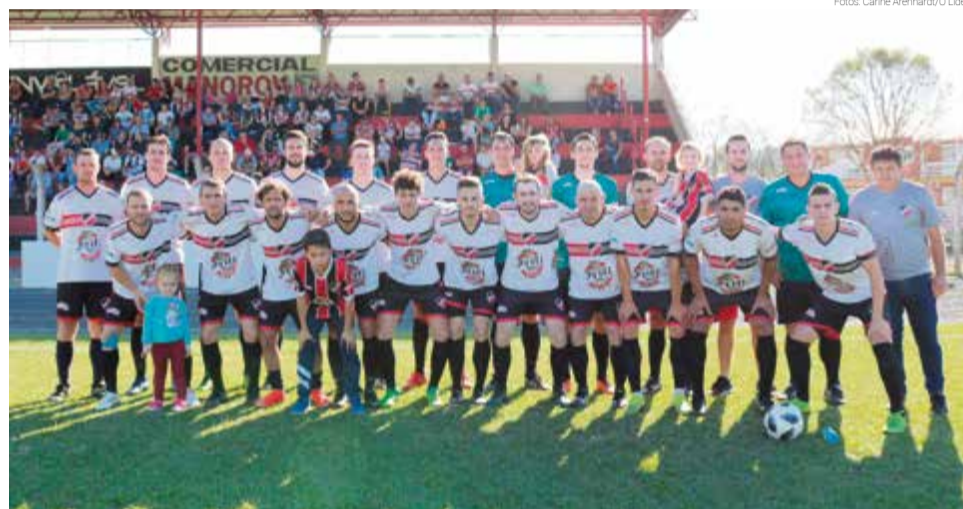
Para o Aliança a situação é a mesma