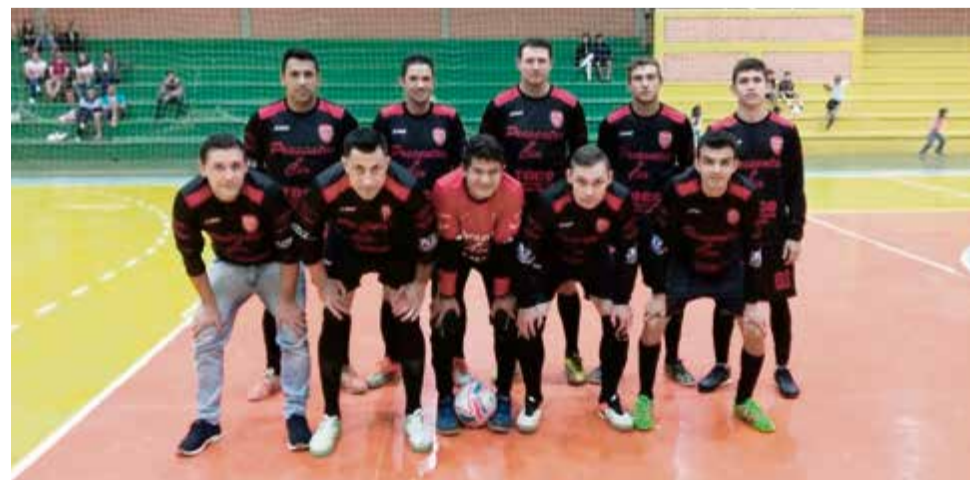
Arsenal encarrou a Família Buscapé na primeira partida da competição

nina da Escola de Educação Básica Oscar Majolo, que vai ser realizada no ginásio onde ocorrem os jogos.