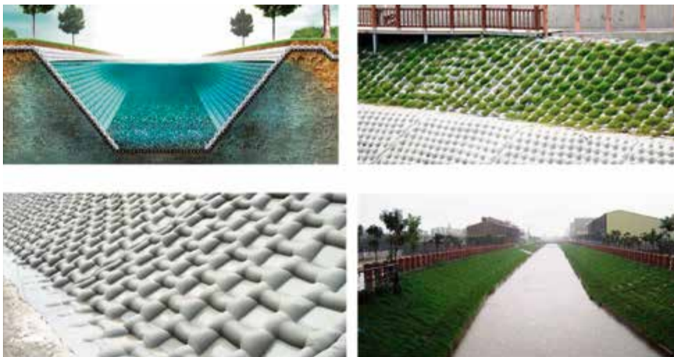
Fotos ilustrativas de como será o canal do Rio Iracema

Haverá a substituição de duas pontes, na Avenida Sul Brasil (proximidades do Iguatemi Alimentos) e Avenida Orlando Valério Zawadski (próximo da Casa Mortuária).