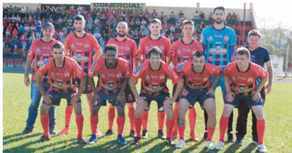
Vitória simples classifica o CRM para a fase semifinal