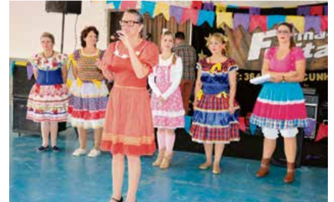
Lideranças fizeram pronunciamentos no início do evento