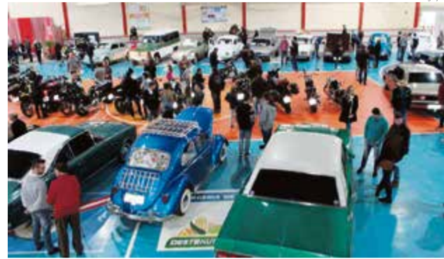
No último ano, evento superou as expectativas e reuniu público expressivo

A entrada no parque será gratuita, sendo cobrado R$ 10 ou um quilo de alimento ao público que quiser prestigiar os shows. O valor arrecadado e os alimentos