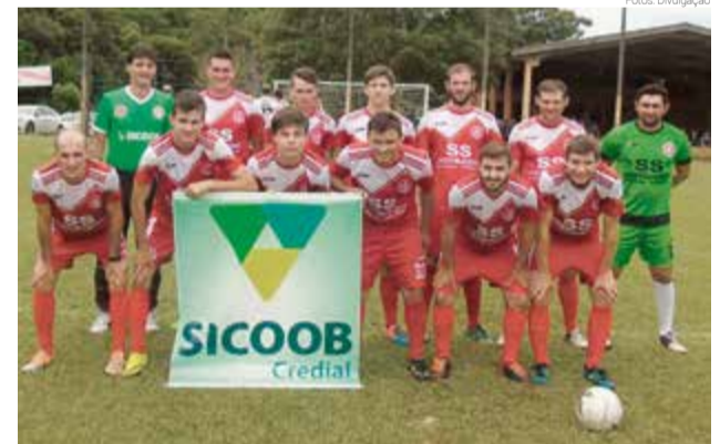
Internacional de Linha Fuzil tem o melhor ataque