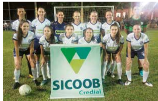
Meninas do América tiveram o melhor ataque da competição

melhor ataque); e às 17h tem a final do naipes masculino entre Facc (equipe invicta e com melhor campanha) x Internacional (equipe com melhor ataque). A premiação será entregue após todos os jogos.