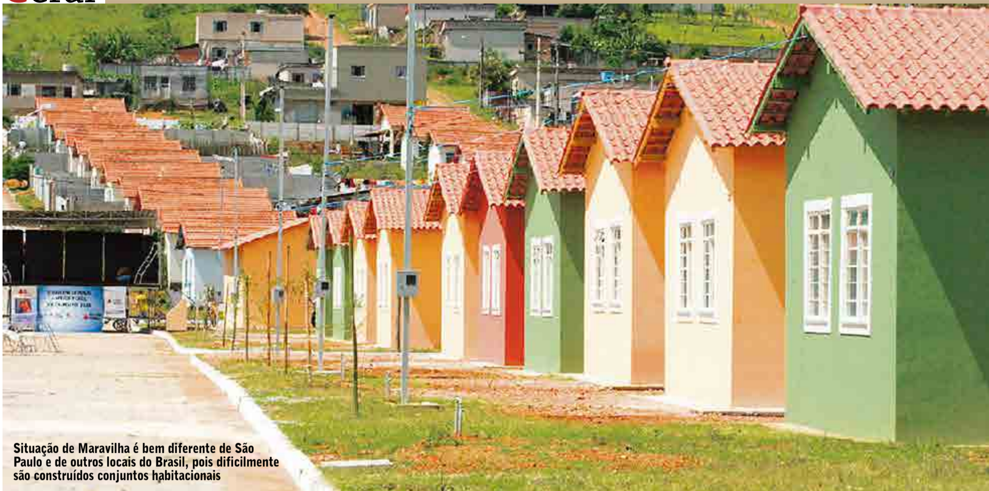
Situação de Maravilha é bem diferente de São Paulo e de outros locais do Brasil, pois dificilmente são construídos conjuntos habitacionais