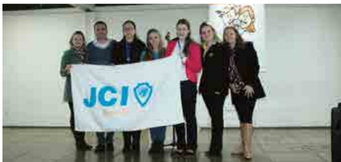
Alunos que representarão o C. E. Mundo Infantil (Caic)