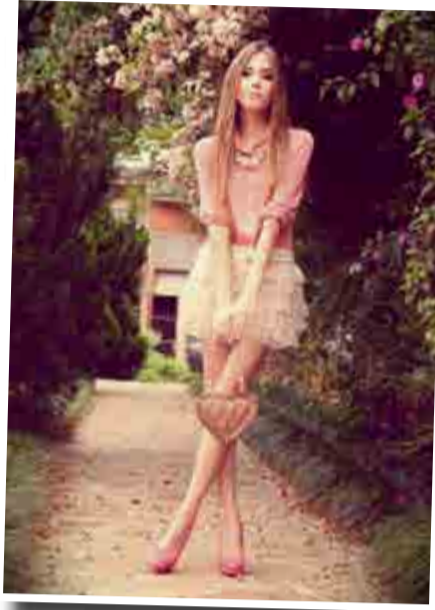
Imagem pessoal combinada com pessoas desempenhadas, este é o segredo. É importante entender aonde se trabalha, para cada ambiente um estilo.

Outro estilo pouco indicado para mulheres empresárias é o total romântico. Ele passa delicadeza e consigo fragilidade em abundância, é o oposto do sensual, mas causa o mesmo efeito, a dúvida sobre a sua capacidade de estar à frente de um cargo importante, à frente de uma equipe ou empresa.