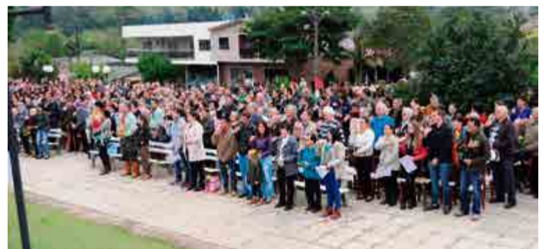
Centenas de pessoas acompanharam