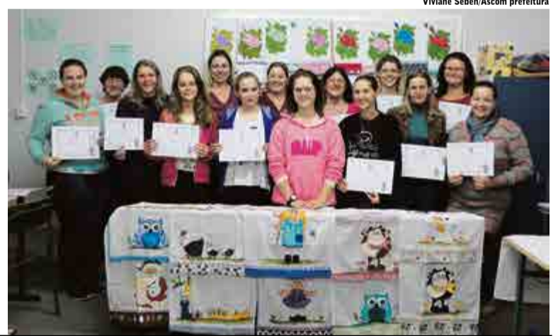
Grupo recebeu certificado do curso de pintura em tecido