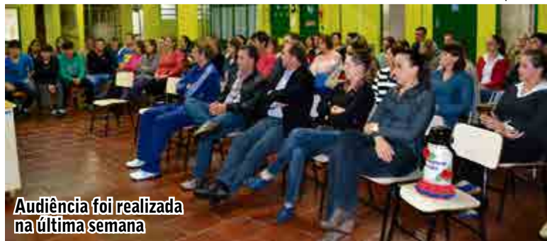
Audiência foi realizada na última semana