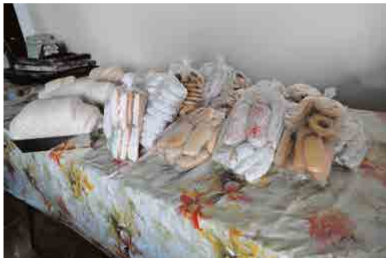
Aos poucos, produção está sendo normalizada

batedeira planetária, que é um pouco maior, pois usamos bastante para bater o merengue das bolachas”, contam.