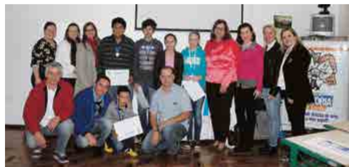
Integrantes da JCI, avaliadores e classificados do C. E. Monteiro Lobato