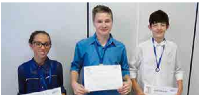
Classificados do C. E. Vereador Raymundo Veit