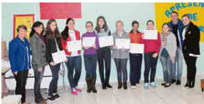
Participantes da E. E. B. Santa Terezinha e integrantes da JCI