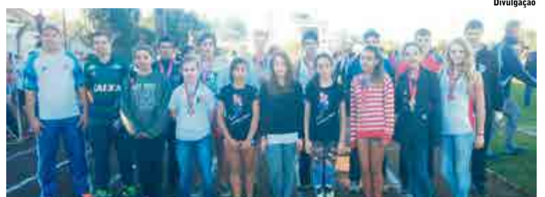
Atletas de Maravilha foram destaque na competição