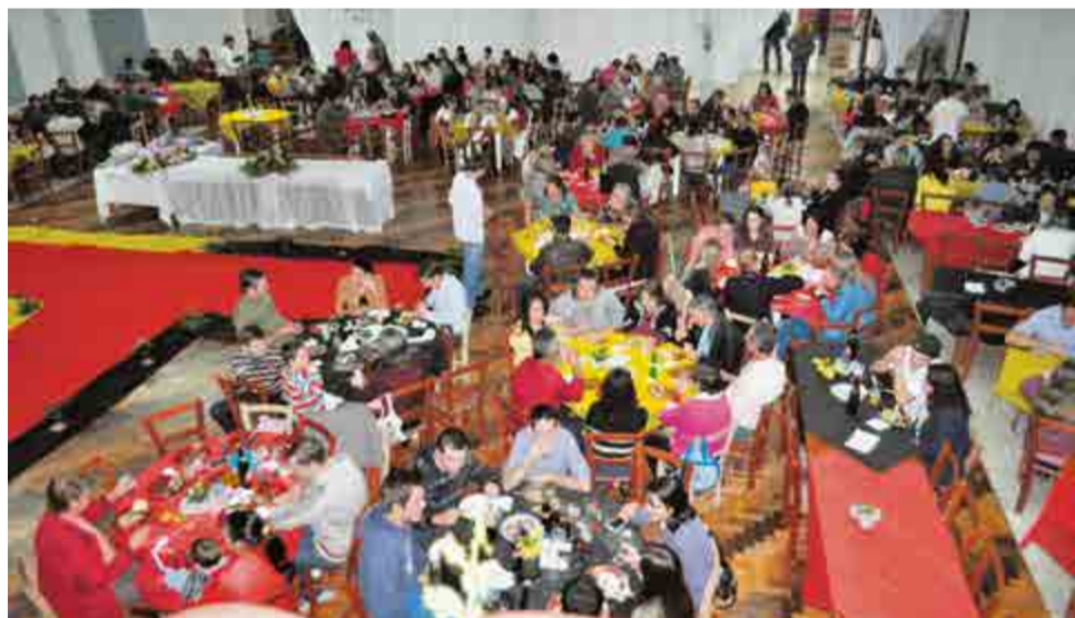
Cerca de 300 jantãs foram servidas no evento