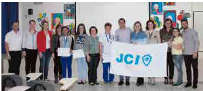
Classificados da E. E. B. Nossa Senhora da Salette