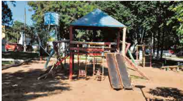
Brinquedos serão retirados na próxima semana