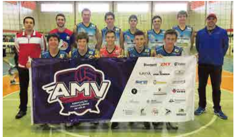
Equipe de Maravilha conquistou o terceiro lugar na competição