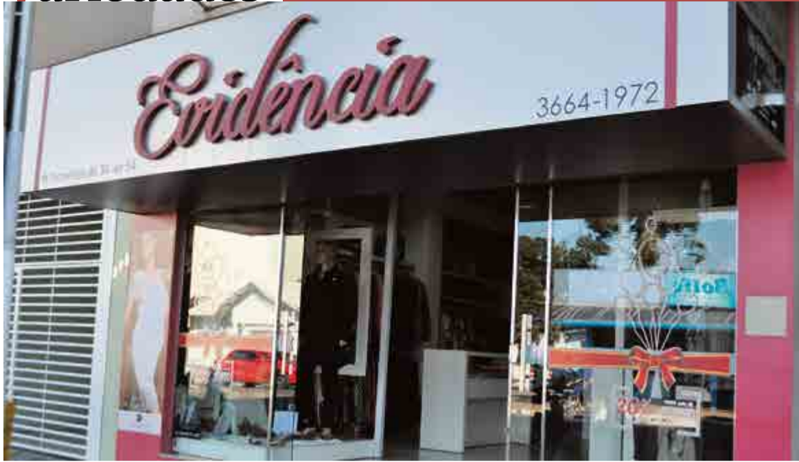
Loja Evidência, Avenida Anita Garibaldi, 340, sala 101, Centro