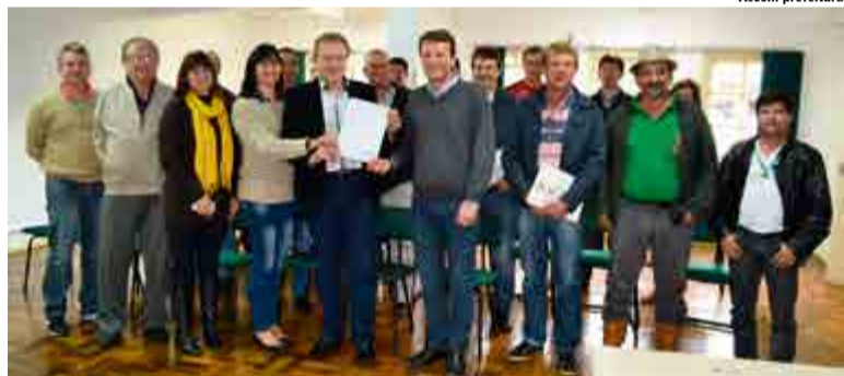
Emenda será investida na aquisição de um caminhão-caçamba traçado