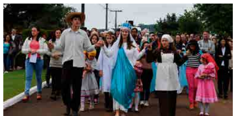
Fiéis seguiram em romaria até o santuário