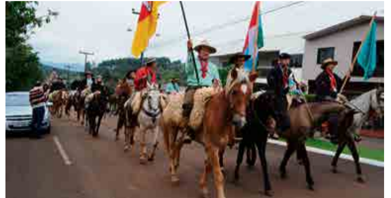
Imagem da Santa foi carregada pelos cavaleiros da 3ª Cavalgada de Nossa Senhora do Caravággio