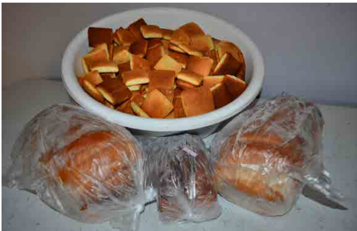
Friedrich: Aos poucos os produtos Friedrich não serão mais encontrados nas feiras