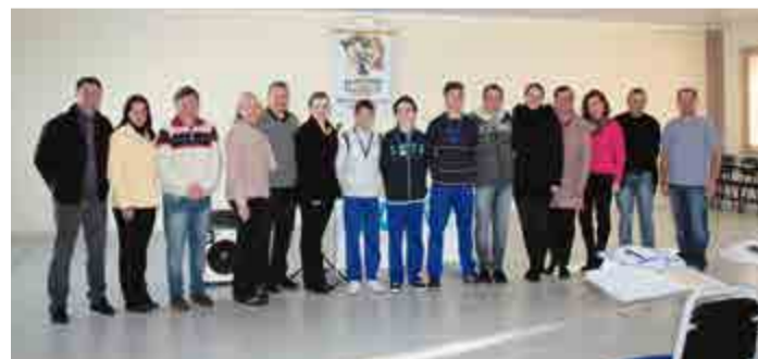
Finalistas do DOM Sistema Educacional