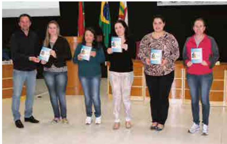
Cartilhas para estudos foram entregues às professoras