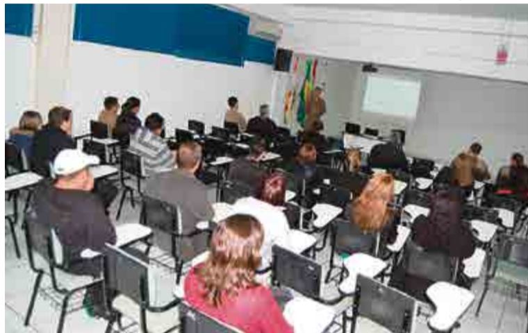
Apresentação do projeto foi realizada na segunda-feira (1º) aos comerciantes

ciada a inúmeras informações que o empresário precisa ter sobre seu ambiente de trabalho e como o infrator pensa e age. O empresário deve adotar alguns cuidados e comportamentos simples, que lhe ajudarão a prevenir furtos em seu comércio, além de reduzir as chances de tornar-se uma vítima. No que tange ao seu ambiente de trabalho, o empresário deve mantê-lo sempre bem vigiado e protegido, de modo a não torná-lo atrativo para o criminoso, que é oportunista por essência”, aponta o tenente.