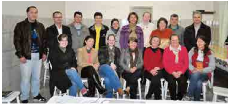
Estela Serpa/WH Comunicações

Na sequência foi realizada a assembleia ordinária, com aprovação do relatório de atividades e contas da Diretoria Executiva com base nos demonstrativos contábeis encerrados em 31 de dezembro de 2014. Também foi comunicado aos presentes que no dia 10 de junho