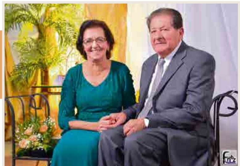
Casal atribui os 50 anos de união à paciência, ao respeito e à fidelidade