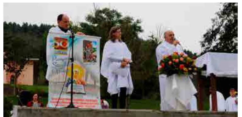
Celebração eucarística na praça central de Flor do Sertão