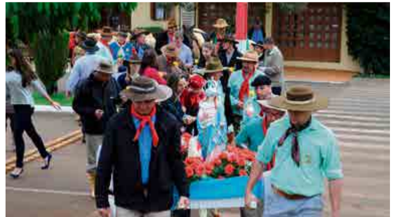
Imagem foi levada ao altar pelos cavaleiros