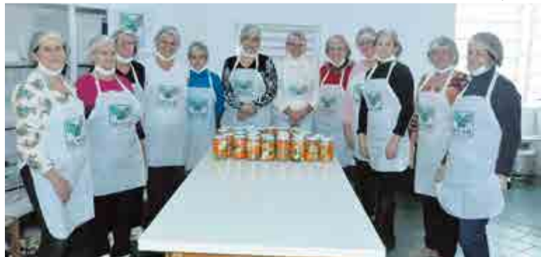
Alimentos em conserva foi o tema do curso