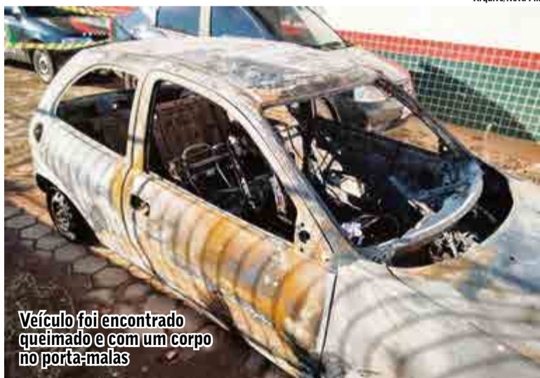
Veículo foi encontrado queimado e com um corpo no porta-malas

A investigação, coordenada pelo delegado de Polícia Walter Figueiredo Loyola, teve início em seguida ao corpo ser encontrado. Os indiciados