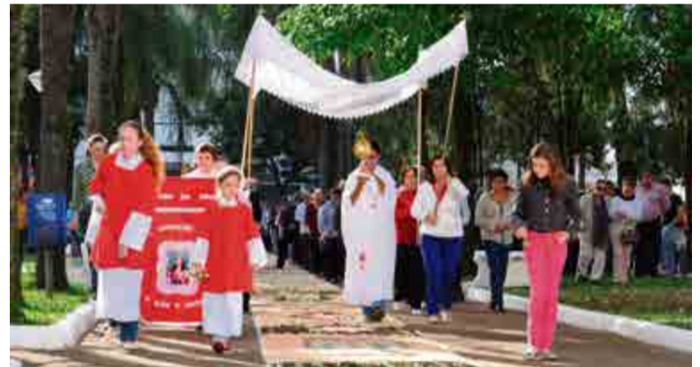
Tapetes foram enfeitados para a passagem da procissão

José Operário de Maravilha teve início em frente ao Hospital São José, com a bênção feita com o Santíssimo Sacramento. Posteriormente seguiu em