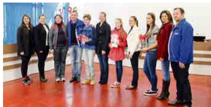
Finalistas da Escola Núcleo Número Um, de Cunha Porã