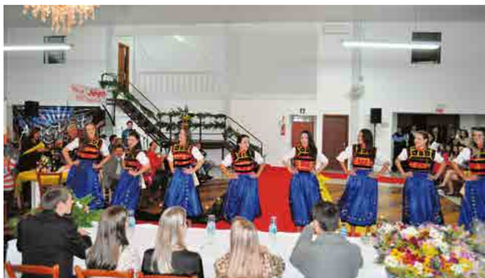
Oito jovens concorreram ao título de rainha, primeira e segunda-princesas