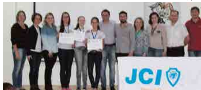
Participantes da E. E. B. João XXIII