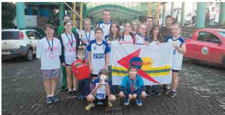
Atletas maravilhenses obtiveram bons resultados na competição