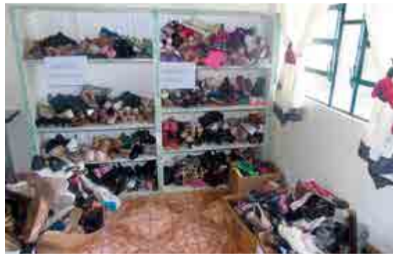
Aproximadamente 250 pares de calçados foram doados