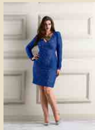
Moda plus size