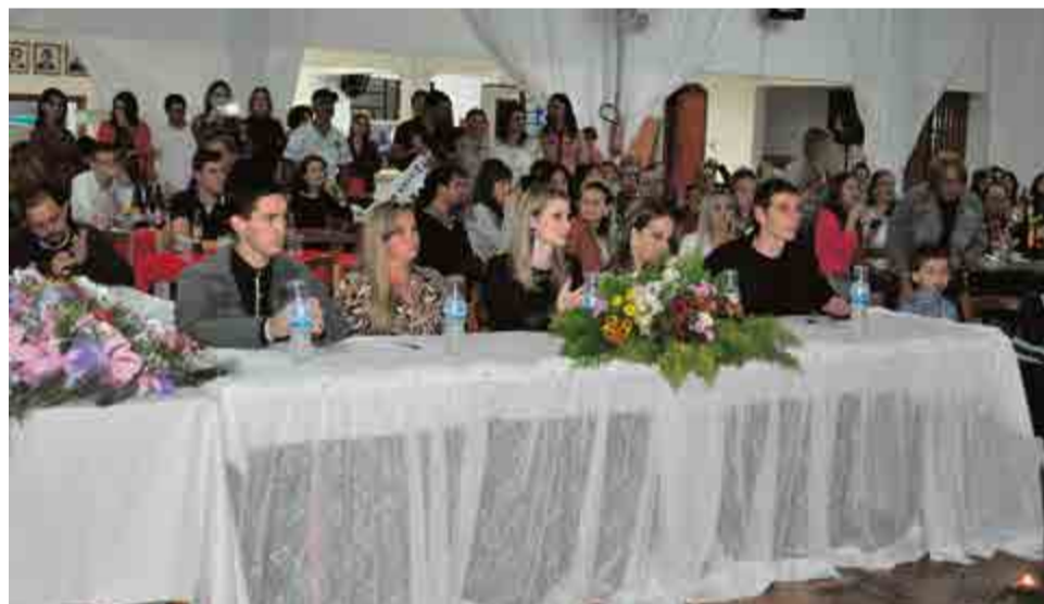
Jurados ligados à área da cultura avaliaram as candidatas