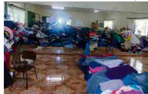
Mais de quatro mil peças de roupas estiveram à disposição para doação