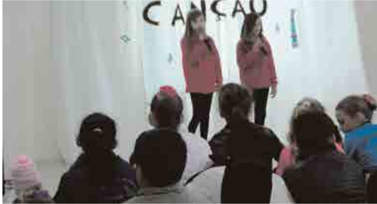
Alunos se apresentaram durante seu respectivo horário estudantil