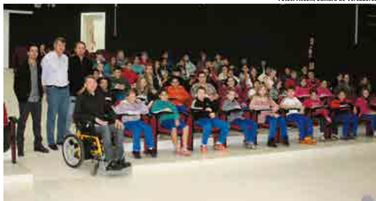
Vereadores participaram do momento

A próxima apresentação será na terça-feira (9), a partir das 13h30.