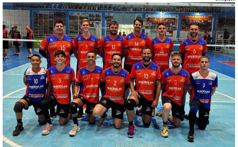
Próximo compromisso será a fase Regional dos Joguinhos Abertos de Santa Catarina

"Gostaria de parabenizar a todos os atletas pelo excelente desempenho e pela garra nas partidas, agradecer a Administração Municipal e Secretaria Municipal de Esportes, Juventude e Lazer. Além dos nossos patrocinadores pelo apoio e condições de treinarmos e competirmos."