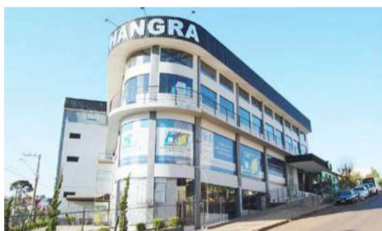
Sede em 2013

Uma das preocupações da entidade era manter o bom atendimento aos associados e nucleados que diariamente precisavam dos serviços da entidade. Outro benefício foi a ampliação das salas, principalmente do espaço utilizado pelo escritório regional da Junta Comercial (Jucesc), que precisava de um ambiente maior para atender a demanda. Além disso, os associados foram convidados para coquetel de inauguração do novo espaço.