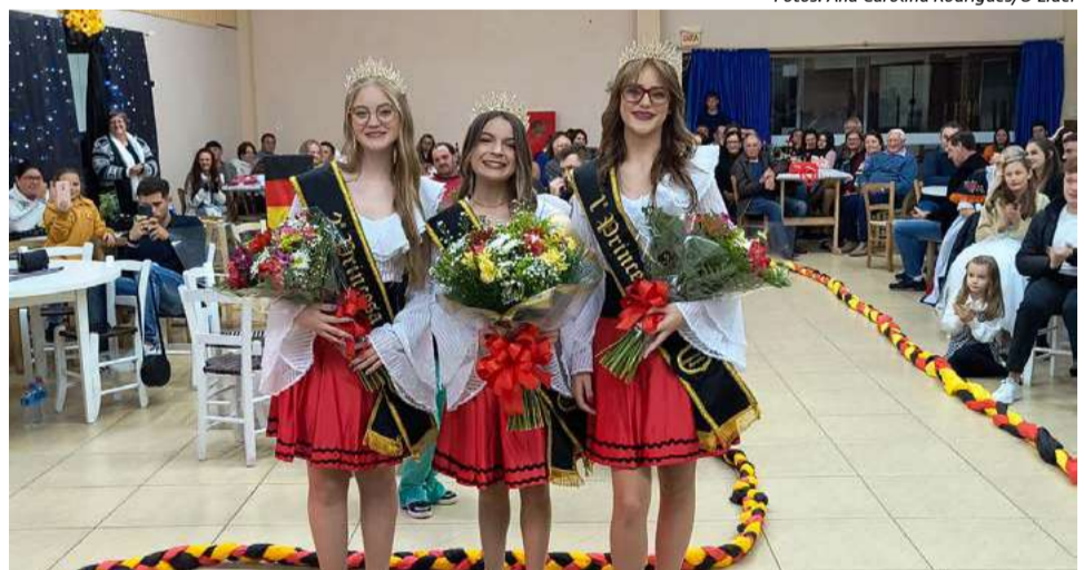
Novas soberanas da Oktoberfest in Maravilha