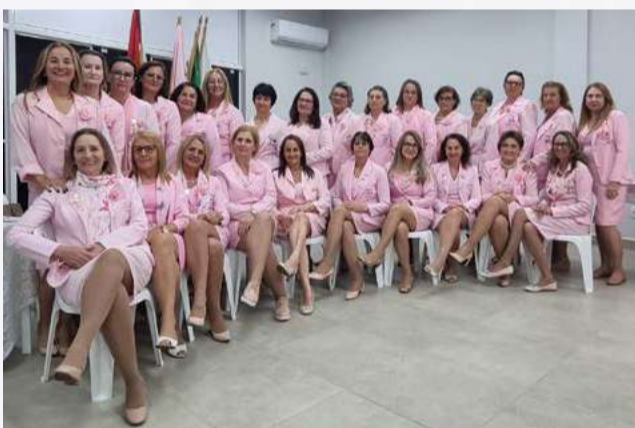
RFCC conta atualmente com 38 voluntárias