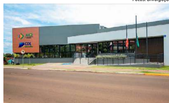
Atual sede da CDL e AE