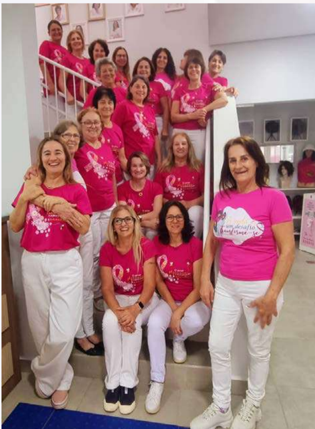
Em mais de duas décadas de história, a entidade foi ampliando a oferta de serviços e projetos