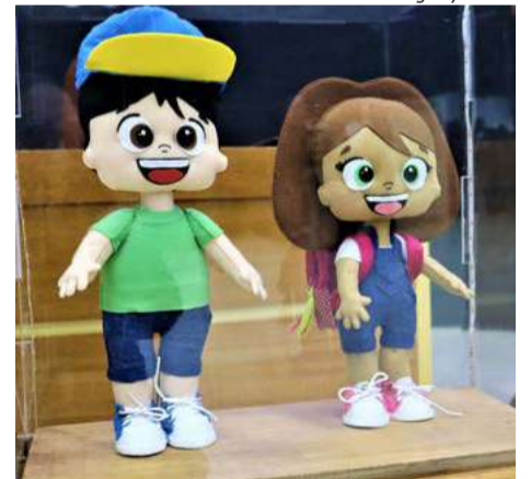
Mascotes da Cidade das Crianças, Fê e a Liz, que significa “Feliz”