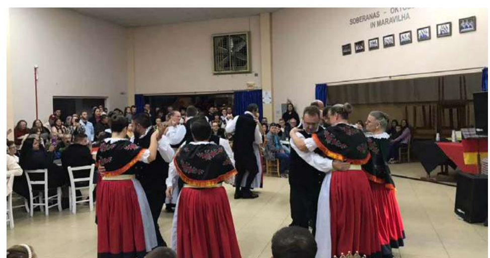
Clube organizou apresentações especiais para deixar a noite ainda melhor