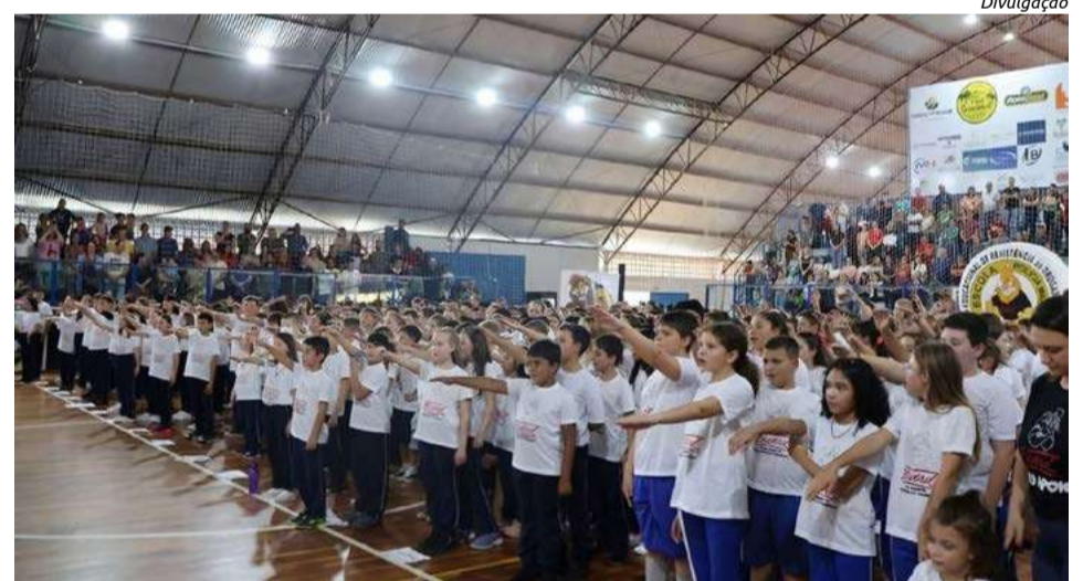
Iniciativa é feita com alunos do 5º ano

Durante a cerimônia foi feita a entrega dos certificados, além de leitura da melhor redação e sorteio de quatro bicicletas. De acordo com a PMSC, o Proerd tem por objetivo capacitar os estudantes com informações e habilidades necessárias para viver de maneira saudável, sem drogas e violência.