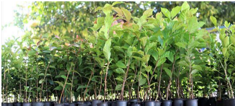
A distribuição de mudas nativas aconteceu no Setor de Meio Ambiente e Bem-Estar Animal

sábado (8) a II Feira de Adoção de Animais Domésticos em parceria com a ONG Ame Bicho, no Eco-ponto, das 8h30 às 16h. O evento tem como objetivo promover a adoção responsável de cães e gatos, enfatizando a importância da tutoria responsável, a ideia de cão comunitário e a convivência.