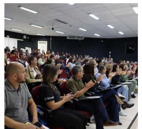
Integrantes do Comtur apresentaram a rota de turismo da cidade