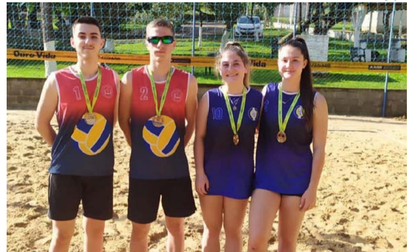
Meninas foram campeãs invictas e conquistaram a vaga para o Estadual

O próximo compromisso é pela Liga Oeste Sub-17 no naipe masculino em Maravilha domingo (03).