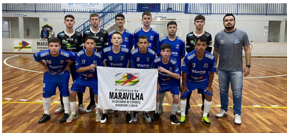
Jogo foi realizado no ginásio municipal de Maravilha