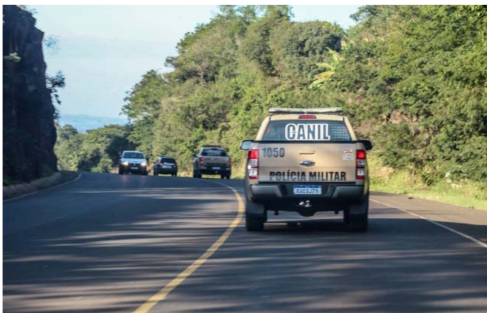
Local já foi alvo de ações em outras oportunidades