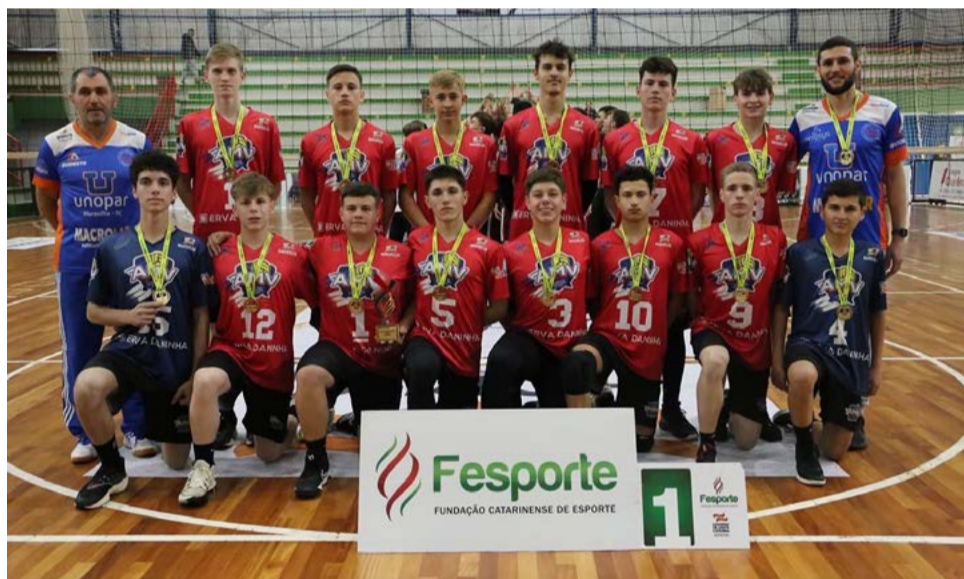
Rapazes de Maravilha conquistaram a vaga para a fase estadual