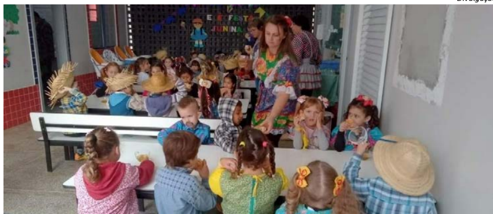
Alunos se divertiram com apresentações e brincadeiras