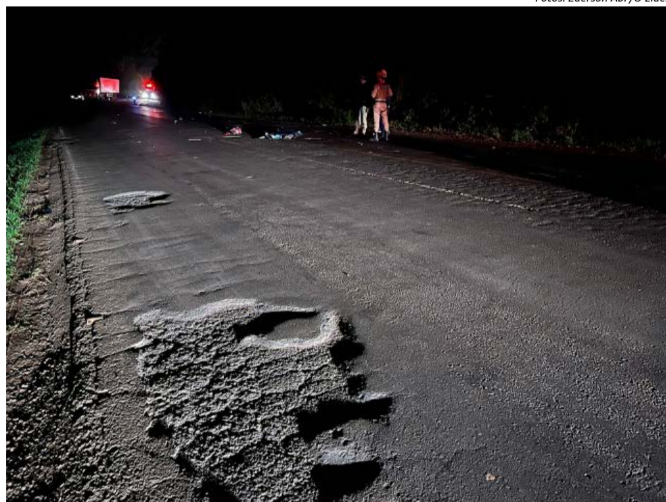
BR-158 apresentava inúmeros buracos no local do acidente