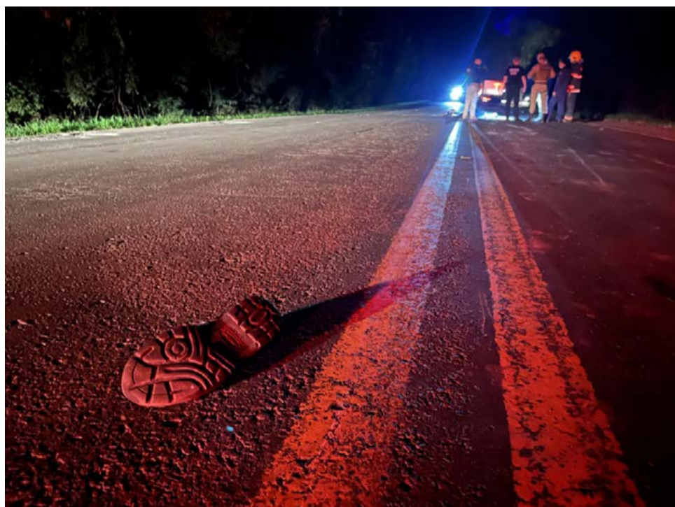
Pista ficou interditada nos dois sentidos por duas horas