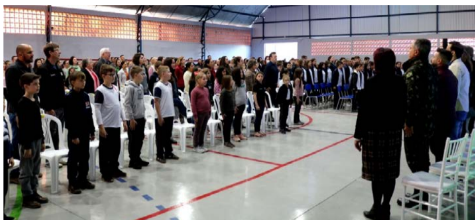
Evento foi realizado com presença de alunos, professores, pais e lideranças