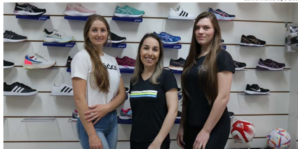
Equipe da Top Sport em Maravilha