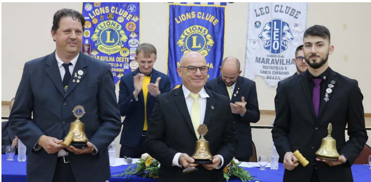
Presidentes eleitos para a gestão 2022/2023