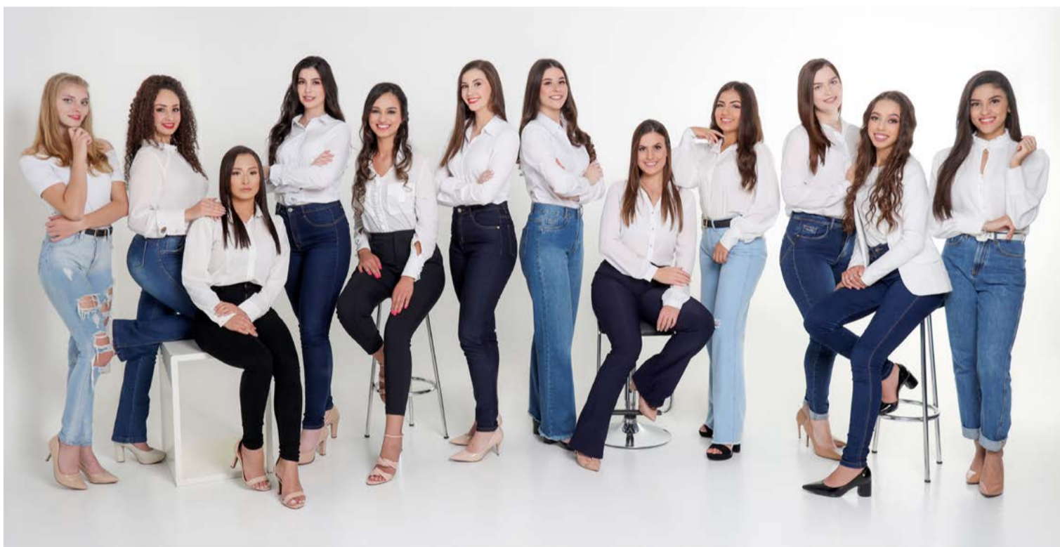
Soberanas já foram apresentadas e se preparam para o evento