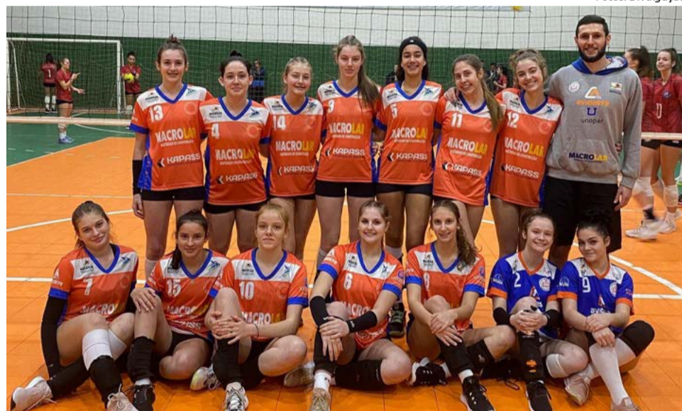
Meninas ficaram em quarto lugar geral