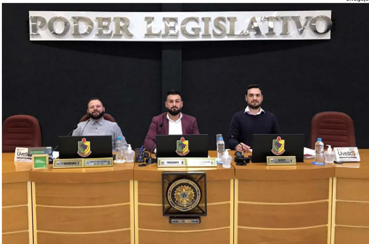
Sessão foi realizada na última segunda-feira