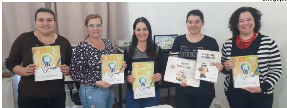
Consultoria foi realizada nesta semana