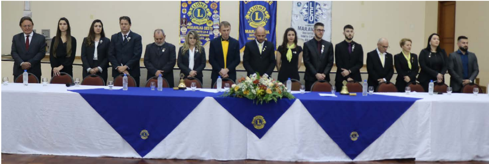
Mesa de autoridades na cerimônia de posse