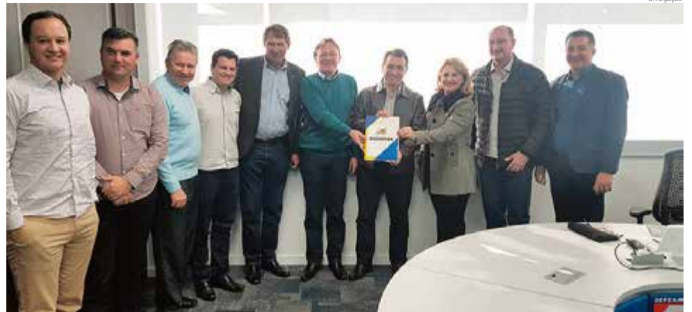
Projeto da obra foi entregue ao governador, Carlos Moisés

O vice-prefeito destaca que a obra deve ter custo médio de