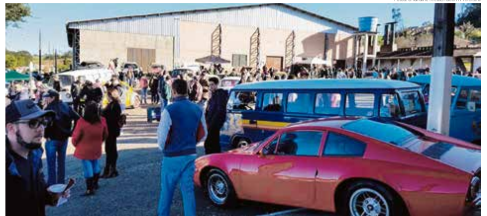
Mesmo com frio intenso, confraternização reuniu centenas de pessoas

Também teve a presença de expositores de artigos para motos e carros, área de cam-