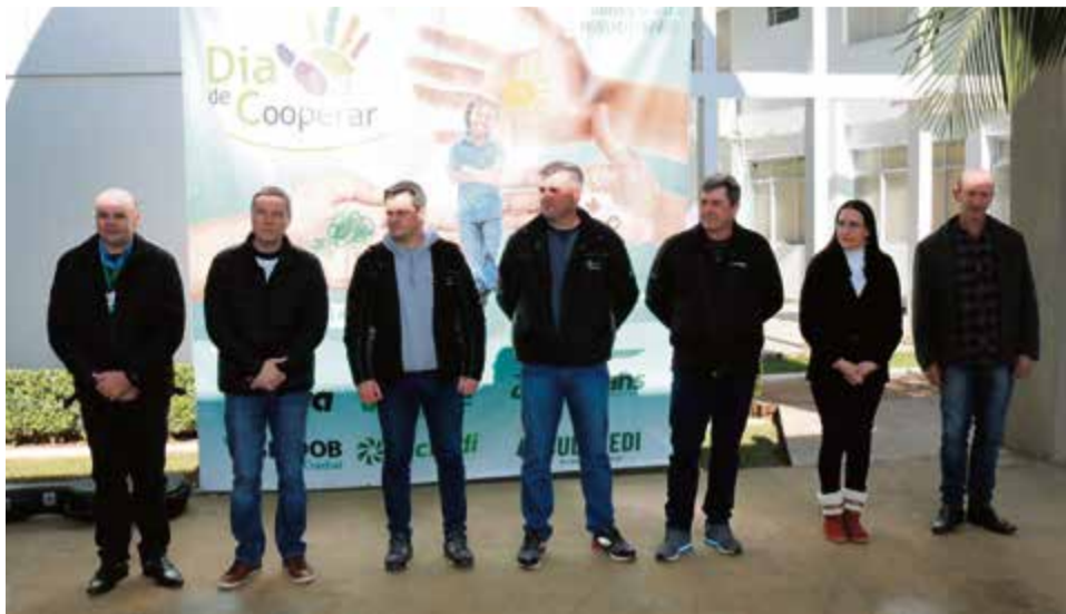
Abertura contou com a presença dos representantes das cooperativas

A iniciativa contou com maquiagem, brinquedos infláveis, pintura facial, brincadeiras, unidade móvel da Unimed, além de algodão-doce e pipoca grátis.