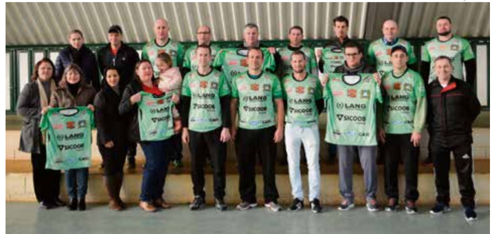
Patrocinadores prestigiaram o ato de entrega

Os professores, estagiário e dirigentes da associa-