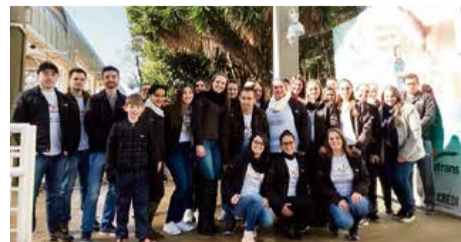
Dia do Cooperativismo em Maravilha