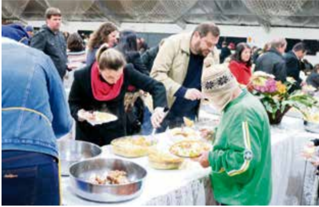
Cardápio agradou os participantes do jantar-dançante

Heller, contabilizou a venda de 625 fichas.