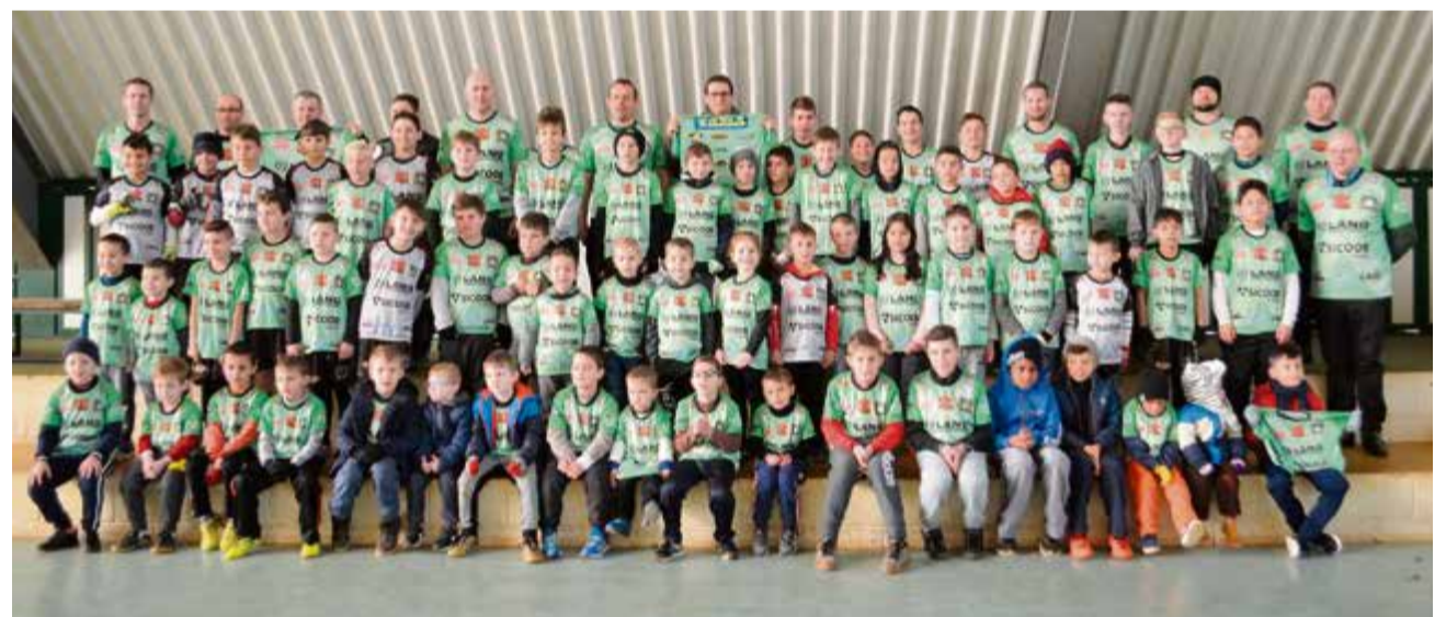
Dezenas de alunos estiveram no local para receber o fardamento