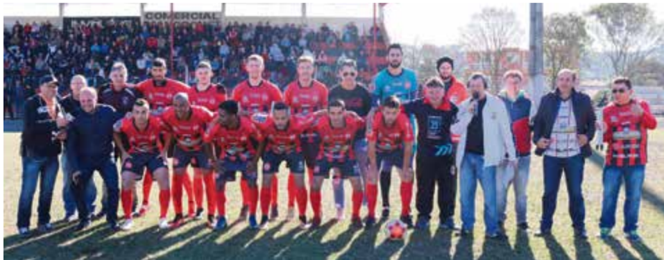
CRM pode perder por dois gols de diferença que assegura a vaga para a final