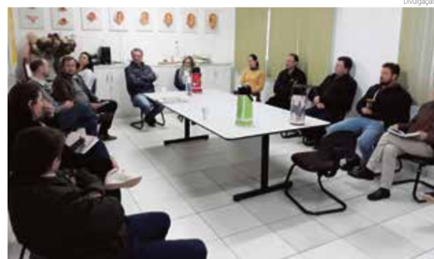
Detalhes foram acertados em reunião promovida no início da semana

Uma reunião foi promovida na segunda-feira (8) entre a administração e os representantes da empresa. A coleta será feita apenas na cidade, a princípio em dois pontos estratégicos, e