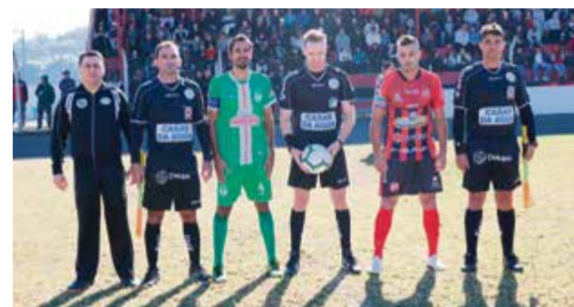
Evandro Tiago Bender fez uma arbitragem exemplar na tarde de domingo

tarde de domingo (7). Agora o time maravilhense pode perder