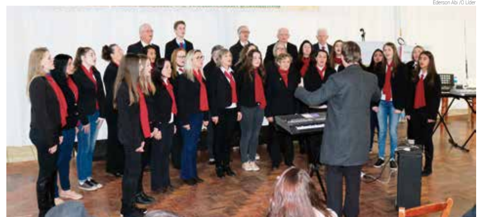
Coral Municipal Adulto de Maravilha

De acordo com a organização, estiveram presentes 13 corais: Alemão Immer Fröhlich, da Acalmar; Fenabb da AABB de Pinhalzinho; Dall'Italia, de Maravilha; Fenabb da AABB de Maravilha; Coral Municipal Infantil de Maravilha; Coral Municipal Adulto de Maravilha; Centro Cultural 25 de Julho de Cunha Porã; Cantar é Viver, do