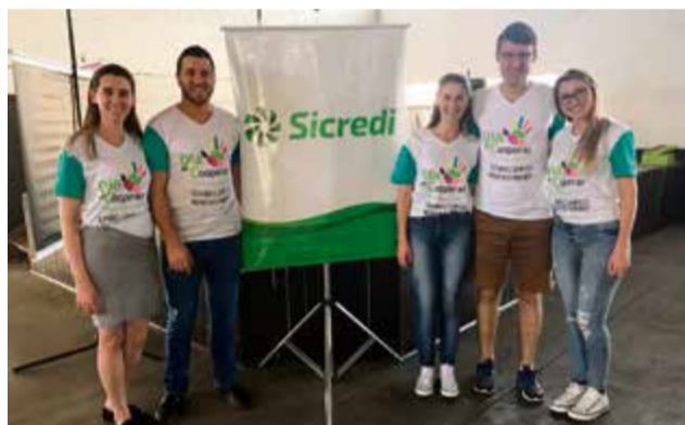
Em Caibi foi realizado almoço beneficente em prol da Apae e Hospital São José. Parceria com Cooper A1 e Sicoob