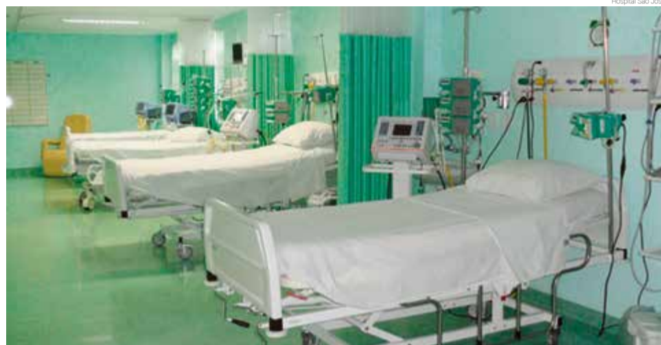
Conforme a direção, a presença da UTI muda o cenário de atendimentos em Maravilha

zado por médicos especialistas, médicos plantonistas e demais profissionais da saúde, abrangendo as diversas especialidades. O hospital dispõe de serviços de radiologia, fisioterapia, assistente social, nutricionista, psicologia, farmacêutica, bioquímicas, técnicos de radiologia, enfermeiros, técnicos de enfermagem, serviço de apoio, setor administrativo e diretoria participante e atuante. Ainda, presta atendimento para convênios: SUS - Sistema Único de Saúde, Particular, Unimed, SC Saúde, Cassi, Caixa Econômica Federal, Agemed e prefeituras.