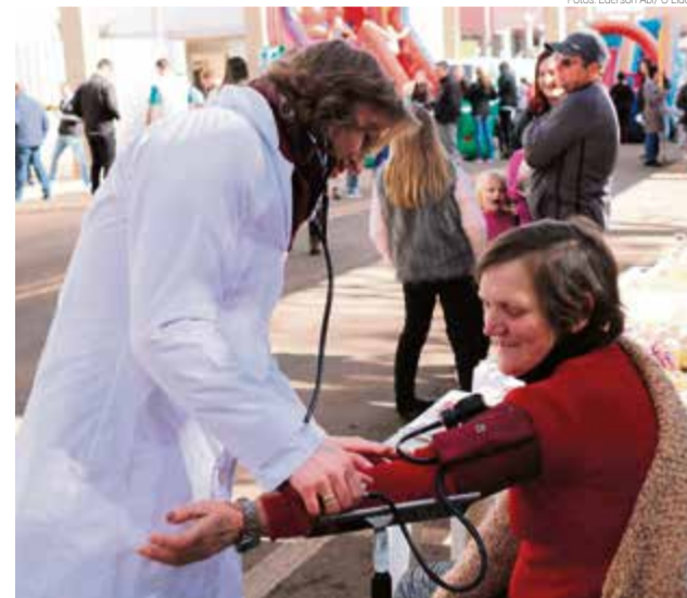
Unidade móvel da Unimed atendeu adultos e crianças no local