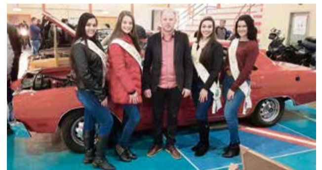
Prefeito e soberanas prestigiaram o evento

ping coberta e com segurança, espaço kids, tatuadores, barbearia, artesanato, food trucks, cerveja artesanal, vinhos e hidromel. Já no domingo (7) ocorreu a premiação aos veículos e grupos destaque. Segundo a coordenação, o evento é beneficente e os valores arrecadados, juntamente com os alimentos, serão doados para instituições da região.