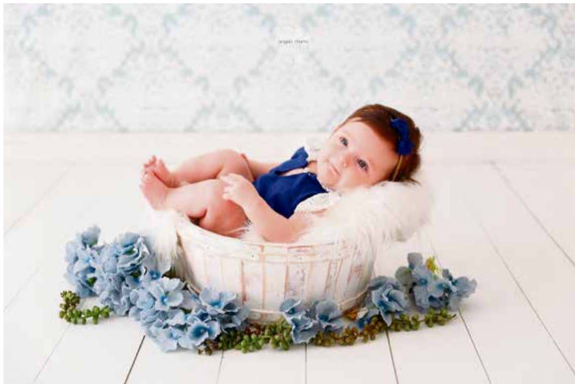
Lindo ensaio da boneca Mariana!