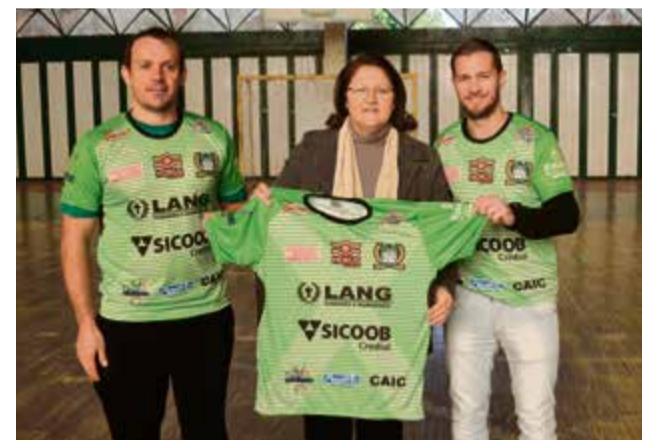
Secretária da Educação marcou presença