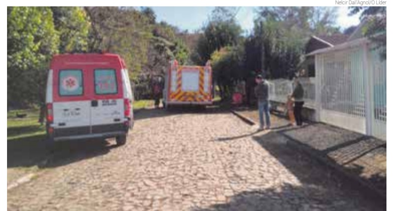
Samu e Corpo de Bombeiros foram deslocados para atender as pessoas e combater o fogo

A casa fica na Travessa Coroadas, próximo ao Posto Diamante 1, na saída para Tigrinhos.