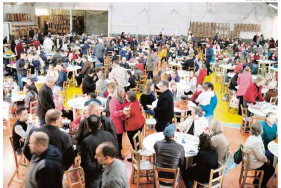
De acordo com a organização, evento reuniu aproximadamente 600 pessoas

Conforme os organizadores, todos os anos o evento conta com expressiva participação da comunidade, reunindo centenas de pessoas, como foi em 2019. Aproximadamente 600 pessoas participaram da edição deste ano. "A prática da gratidão é uma marca do cristão. O Culto de Ação de Graças (Festa da Colheita) foi uma excelente oportunidade para tal. Deus nos