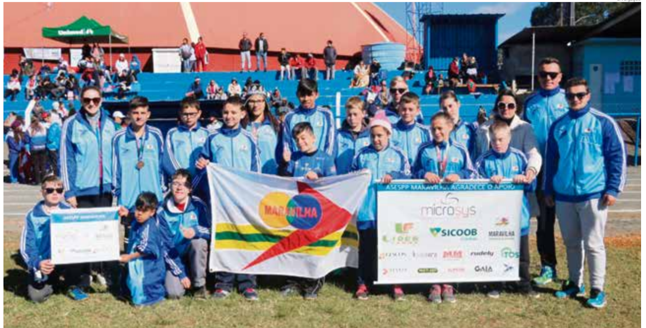
Maravilhenses aguardam a lista da convocação da seleção catarinense

1º lugar nos 75 metros rasos 1º lugar nos 250 metros rasos