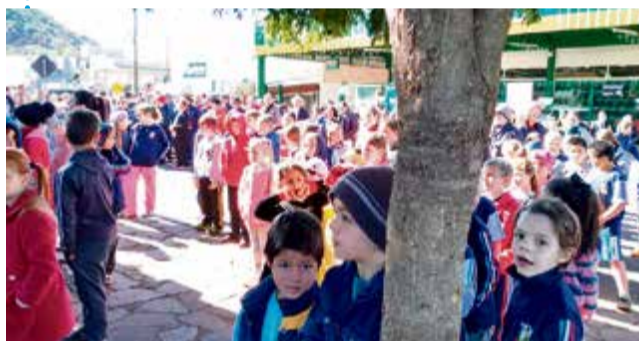
Dia do Cooperativismo em Iraceminha