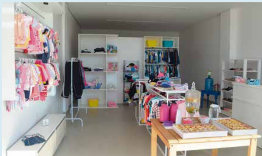
Loja conta com peças de qualidade e preços acessíveis