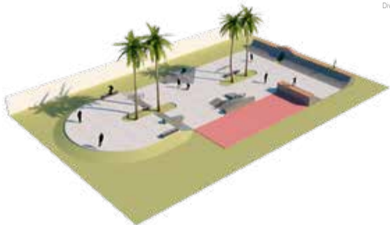
Projeto foi elaborado por empresa especializada em pistas