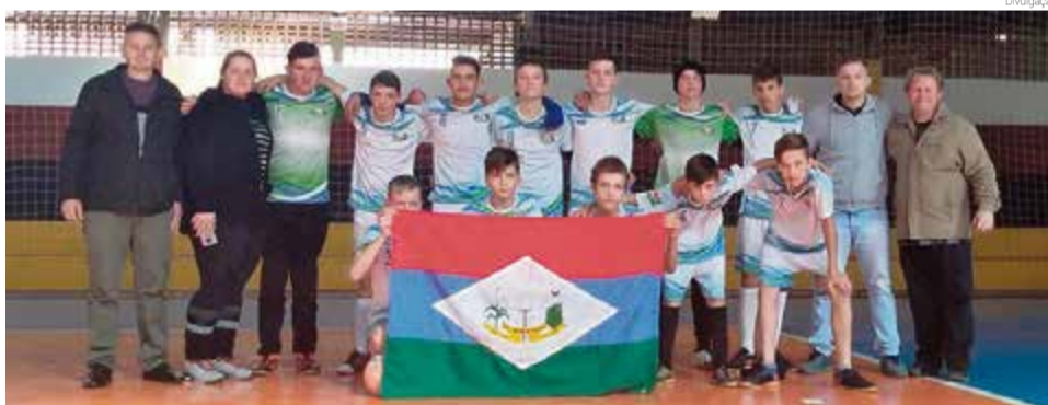
Com uma vitória e uma derrota, alunos garantiram a segunda posição

No primeiro jogo os alunos enfrentaram São Carlos, vencendo pelo marcador de 1 x 0. O segundo jogo, logo