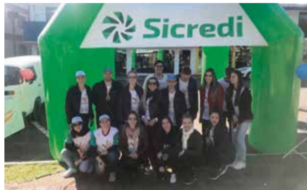
Muitas brincadeiras, histórias, corrida educativa e pintura facial fizeram parte das atividades realizadas em Pinhalzinho. Parceria entre Sicredi, Aurora, Sicoob, Ceraçá, Cooper Itaipu, Sesi/Senai, Asr, Udesc, Rotary, Unoesc, Horus, Turma Alegria e Apae