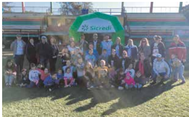
Equipe de Saudades promoveu um dia de brincadeiras e muita diversão para as crianças da educação infantil do município. Com o apoio dos colegas e familiares, a tarde foi de brincadeiras e fortalecimento do cooperativismo