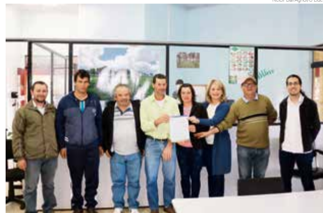
Representantes da associação e conselheiros das comunidades beneficiadas marcaram presença