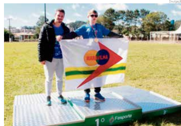
Pódio adaptado foi uma das novidades nos Parajesc

locado como experiência nos Jogos Escolares Paradesportivos de Santa Catarina (Parajesc), que foram disputados em Maravilha, sendo aprovado por dirigentes e atletas.