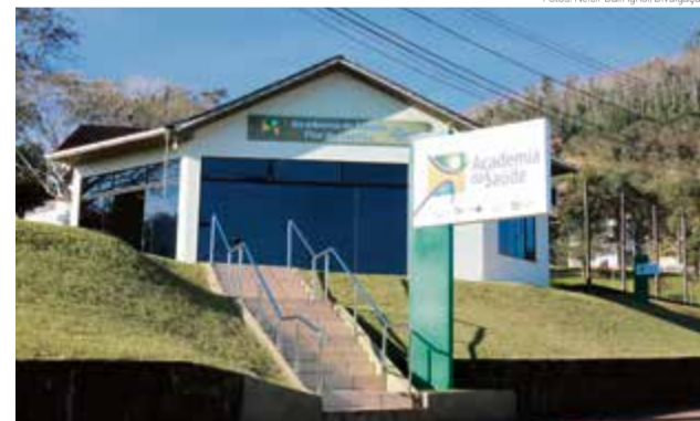
Academia da Saúde completa cinco anos

ram à imprensa como surgiu a Academia da Saúde e as causas que incentivaram o município implantar a academia. Outros assuntos referentes à administração do município também foram abordados, como por exemplo, o programa Juro Zero, que visa incentivar as empresas locais com o pagamento dos juros de empréstimos tomados junto ao Sicoob/Credial e Sulcredi.