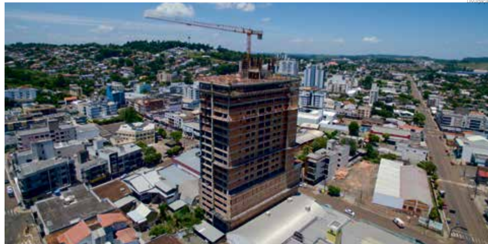
Obra do Edifício Gran Moralle, com mais de 20 pavimentos

Atualmente, o Grupo abrange os setores de construção civil, estruturas pré-moldadas, terraplenagem, pavimentação asfáltica, usina de asfalto, usina de concreto, central de britagem, varejo de materiais de construção, loteamentos, pequenas centrais hidrelétricas (PCHs), venda e incorporação de imóveis. Uma