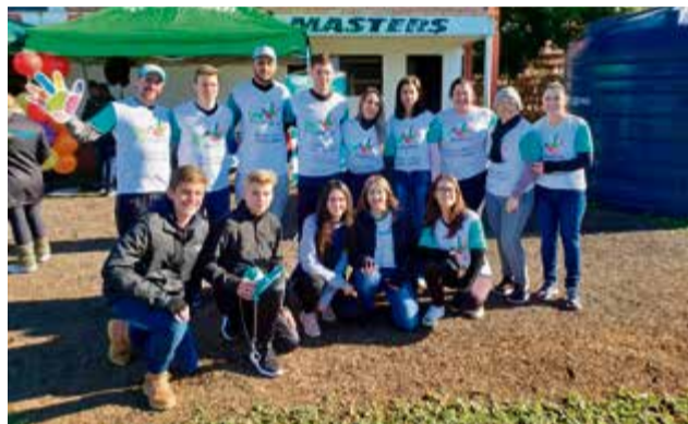
Em Palmitos ocorreu uma caminhada da saúde em parceria com Sicoob, Cooper A1 e Fecoagro