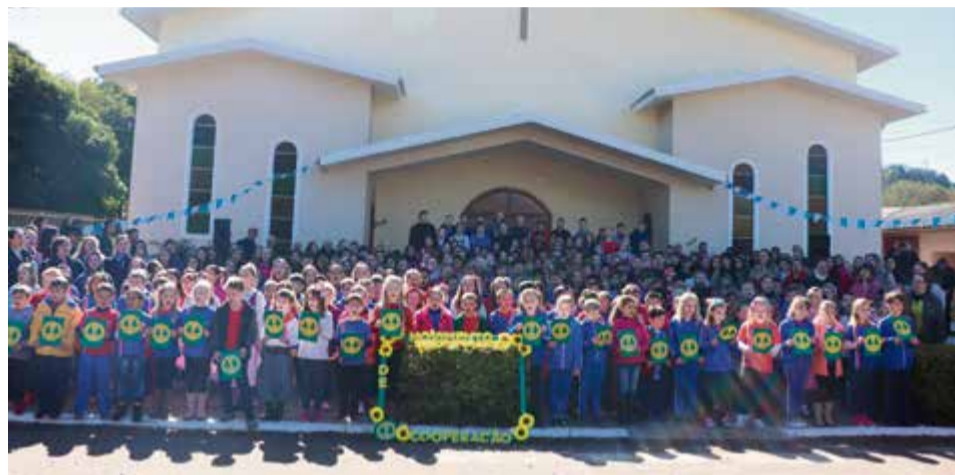
Dia do Cooperativismo em Cunha Porã

Conforme o diretor, "sensibilizar as pessoas, promovendo ações sociais que despertam maior conscientização socioambiental, além da boa convivência, é o objetivo maior desse movimento", finaliza.