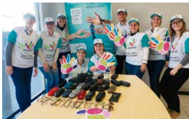
Equipe de São Carlos arrecadou 45 armações de óculos, que serão doadas ao Lions Clube do município