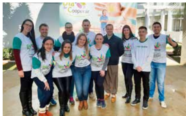
Em evento realizado no Espaço Criança Sorriso, a equipe de Maravilha realizou ação em parceria com as cooperativas Aurora Alimentos, Auriverde, Coccatrans, Sicoob Credial e Sulcredi