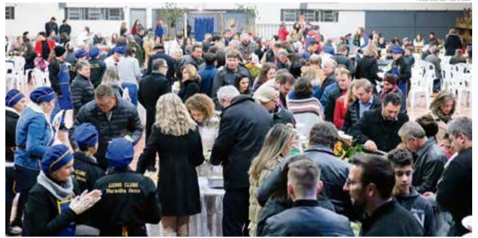
Salão Paroquial reuniu mais de 600 pessoas, apesar da noite fria