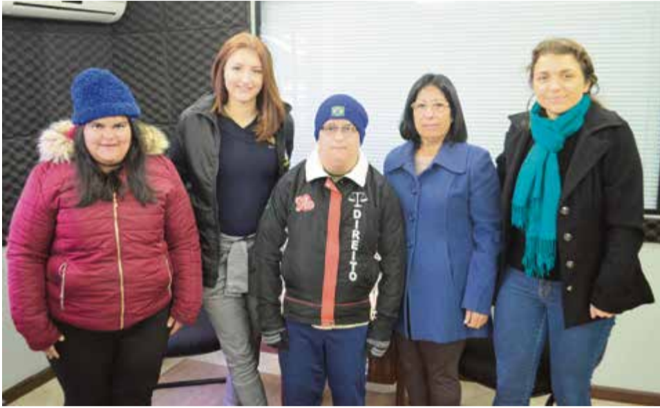
Visita realizada na Rádio Líder FM