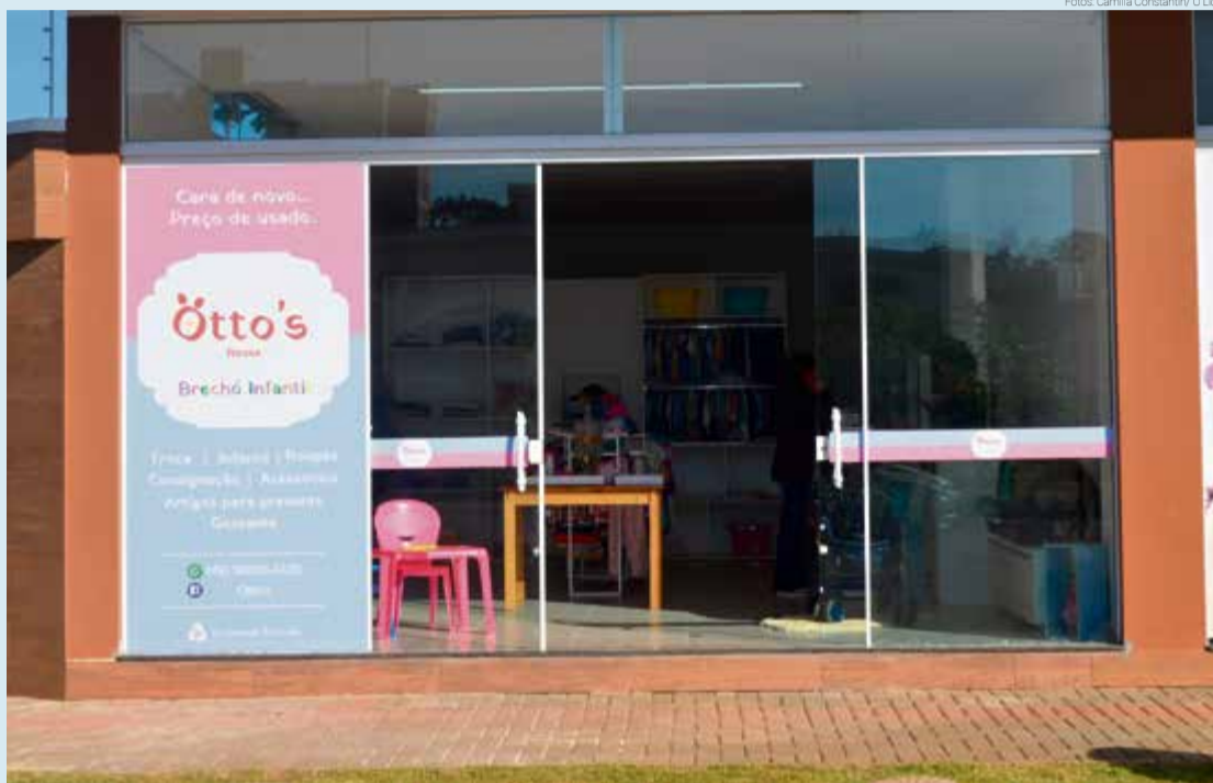
Otto's Reuse fica localizado na Rua Santos Dumont, Centro de Maravilha

duas opções de trabalho: troca e consignado. Na troca, o cliente leva as peças para avaliação e o valor definido irá ficar de crédito para gastar na loja. Já na forma de consignado, as peças ficam expostas com código de fornecedor e uma vez por mês é feito o acer-